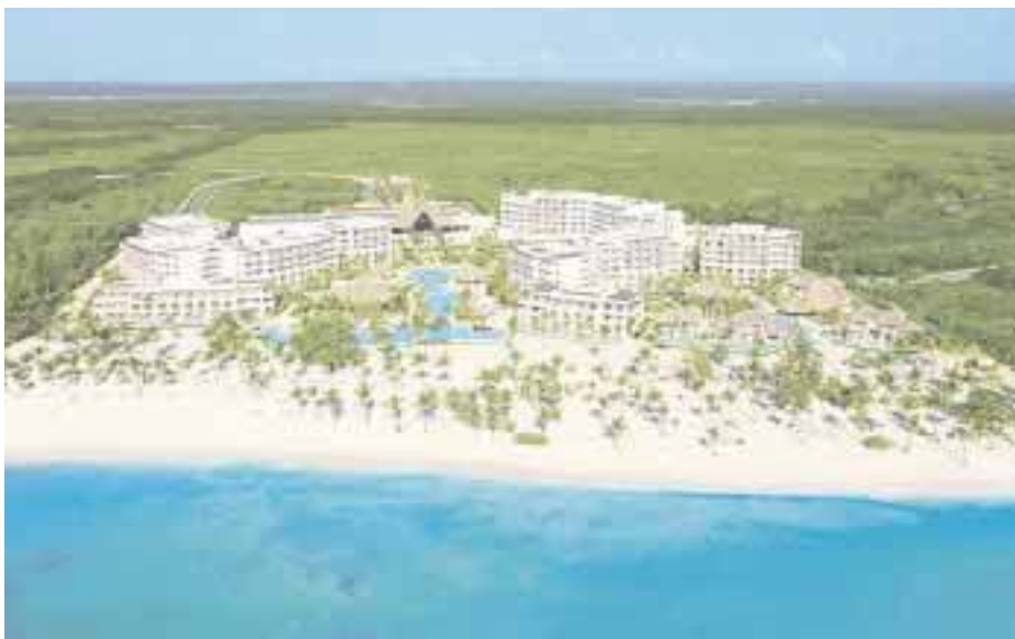
Vista del Secrets Cap Cana Resort & Spa.

Algunos de los torneos más destacados son el Pro-Am, el DR Open Golf, el DR Open