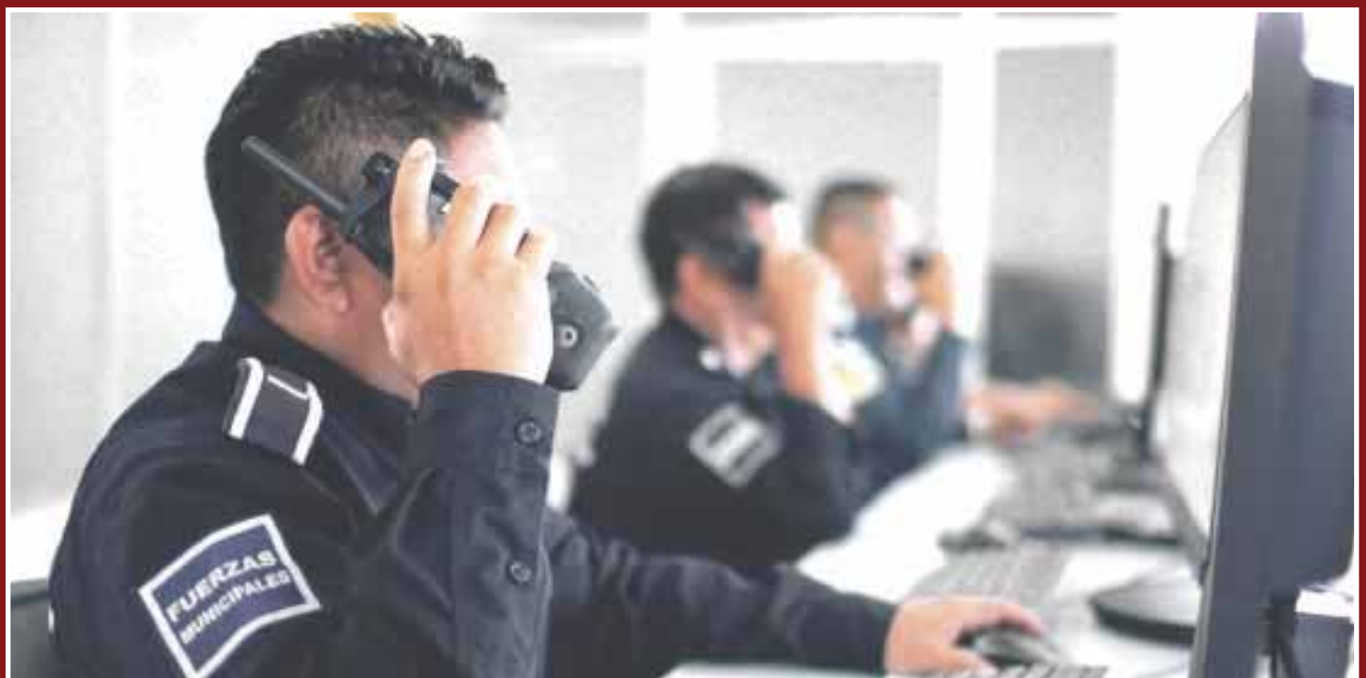
La policía local lamentó que la mayoría de las llamadas al 911 corresponden a reportes falsos, como lo ha detectado el sistema.