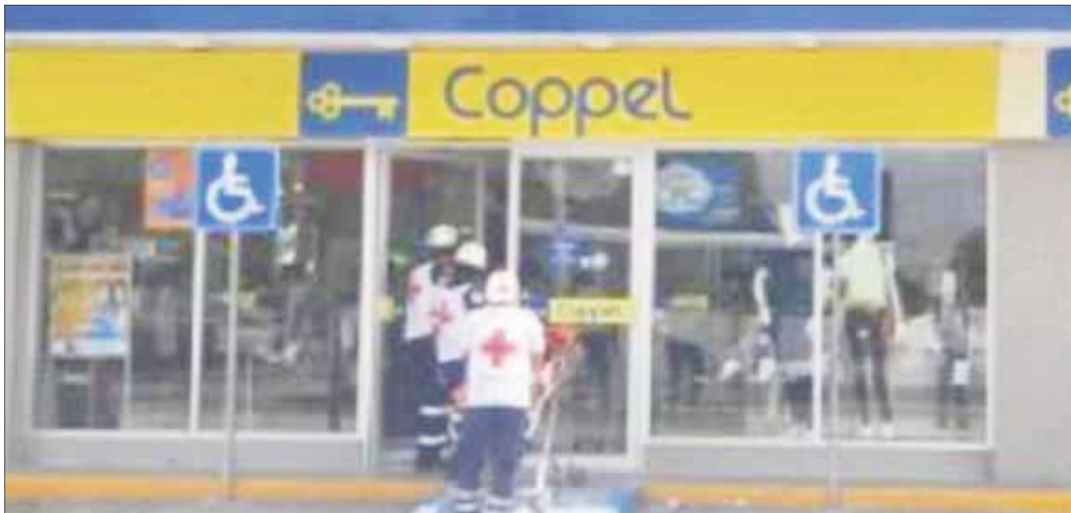
Esta es la tercera vez que sufre un asalto la misma tienda, la primera fue el 17 de marzo, la segunda el 28 de abril y ayer, la tercera.

Los elementos de seguridad iniciaron una búsqueda por los alrededores, sin que hasta el momento se conozca el paradero de los presuntos delincuentes.