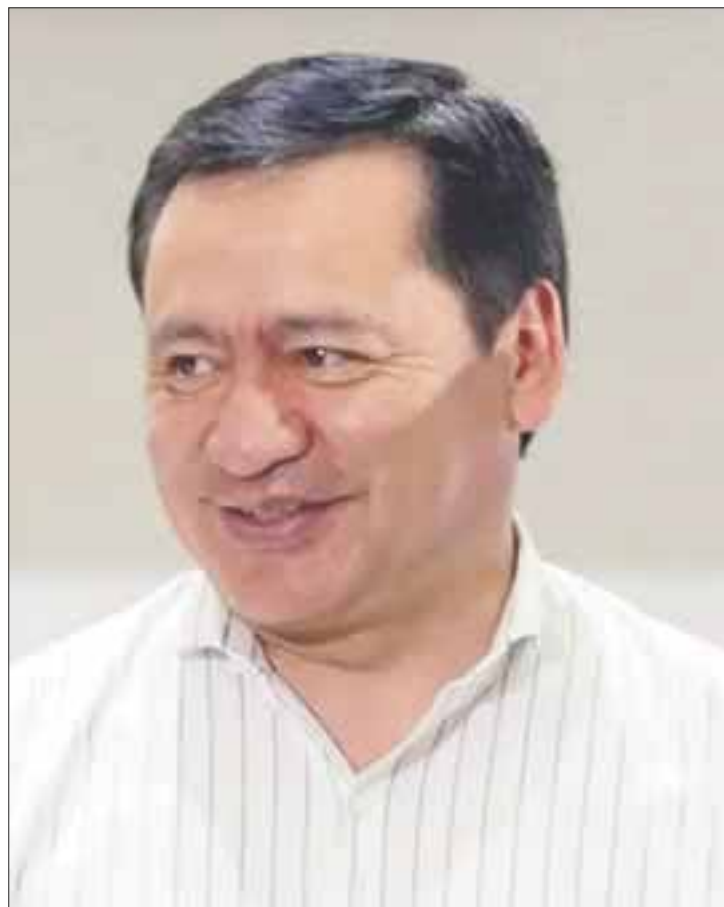
Miguel Ángel Osorio Chong , titular de la Secretaría de Gobernación.

No nos vaya a pasar con el turismo lo que nos ha ocurrido con el petróleo y otros recursos naturales, que los hemos mal-