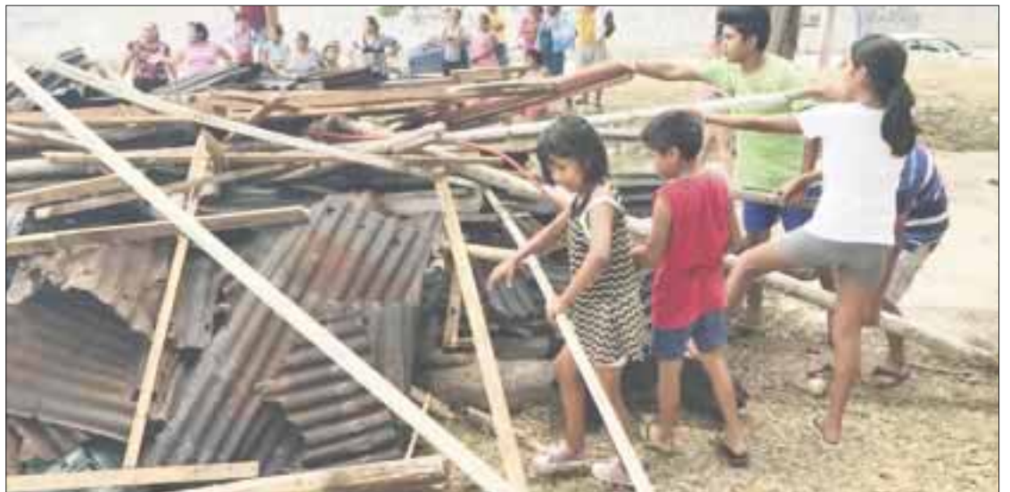
Fieles de la Iglesia católica protestaron frente a Palacio Municipal por la destrucción de su capilla.

En contra de los deslindes hechos por distintas mostraron un dictamen oficial de la Dirección General de Desarrollo Urbano, en la que se decreta a la capilla como ilegal y se concedía un espacio de 10 días para que fuera retirada.