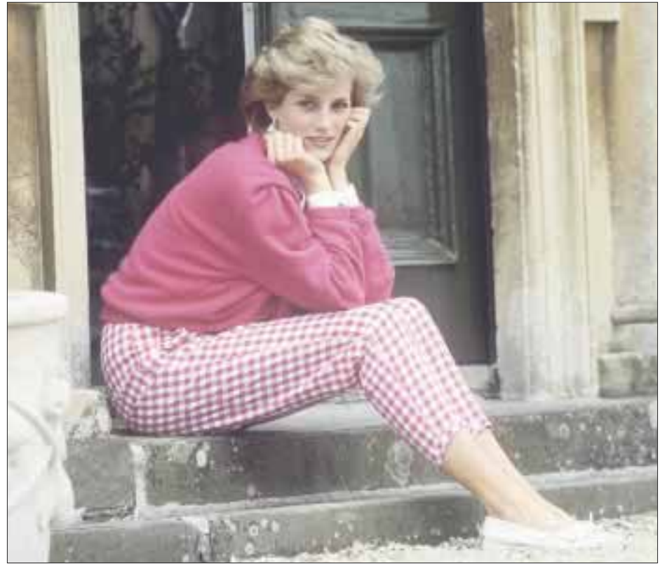
El especial “Lady Di ¿Tragedia o traición?” mostrará a profundidad su vida, los eventos que llevaron a la trágica noche en que falleció.

Presidente Agrupación Críticos y Periodistas de Teatro ACPT gustavogerardo@live.com.mx Twitter: @ACPT_Mex gerardogs Instagram ACPT_Mex