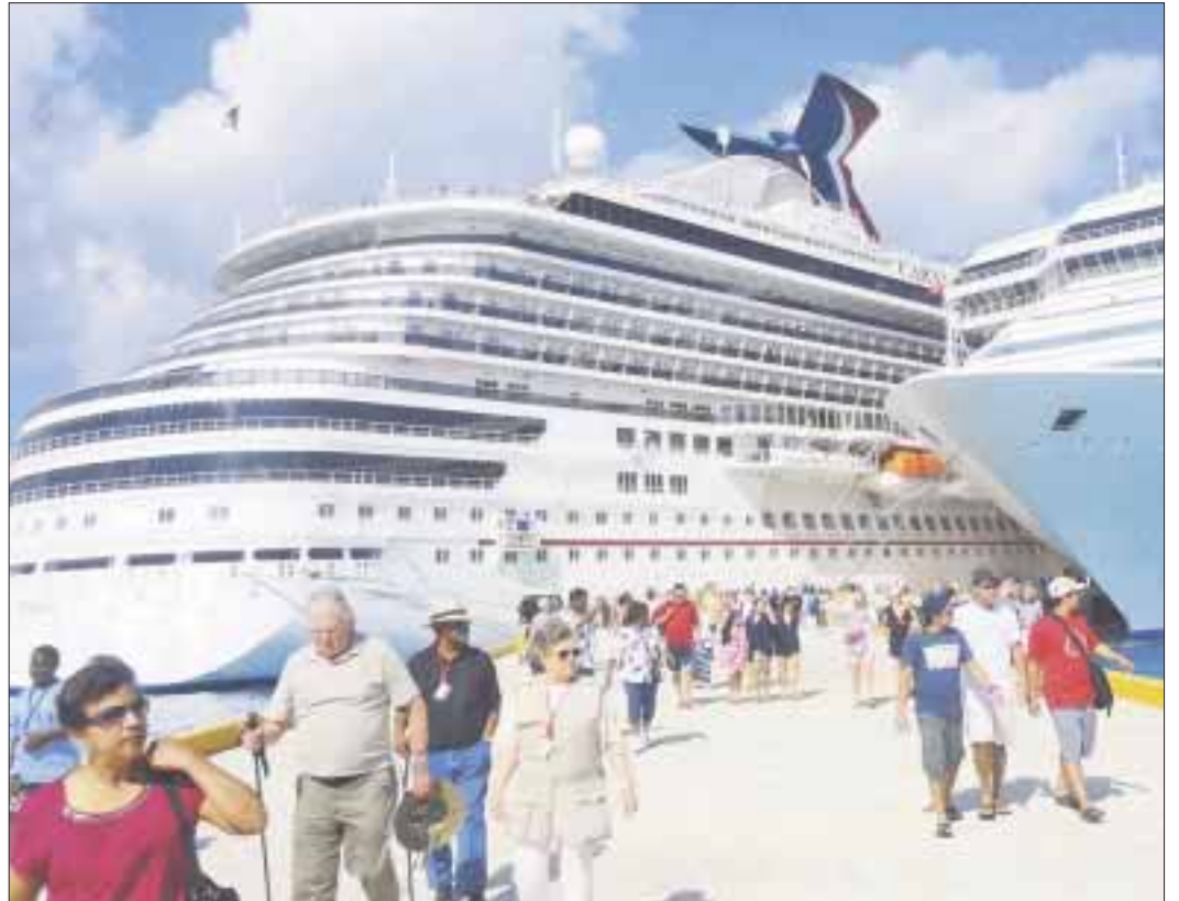
La Isla de Cozumel se coloca a la cabeza de los cinco principales puertos del Caribe.

Dijo que la clasificación para Cozumel se basa en calificaciones dadas por los miembros de Cruise Critic, marca que opera TripAdvisor, en revisiones publicadas por los socios y cuyo último corte fue al 30 de junio 2017.