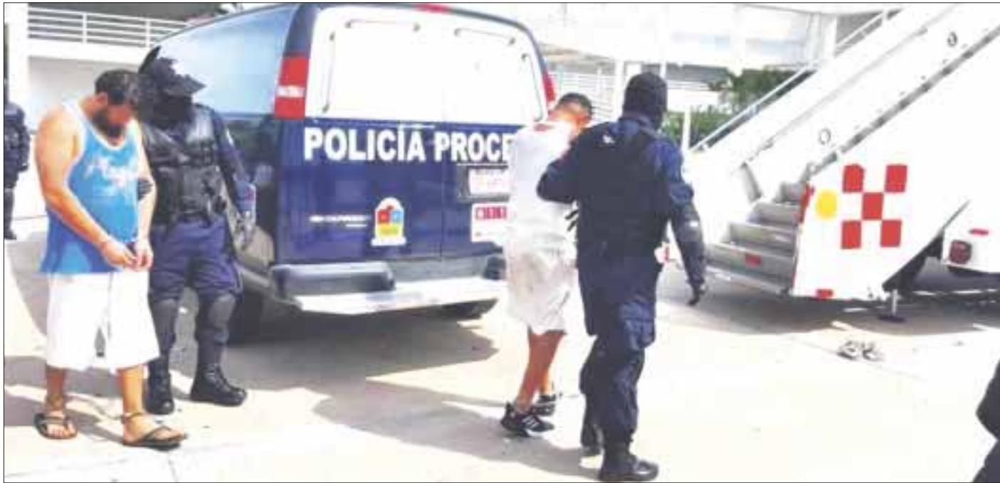
Los procesados fueron trasladados vía terrestre en medio de un fuerte dispositivo de seguridad al Aeropuerto Internacional de Cancún.

Fuerte dispositivo de seguridad en el aeropuerto de Cancún