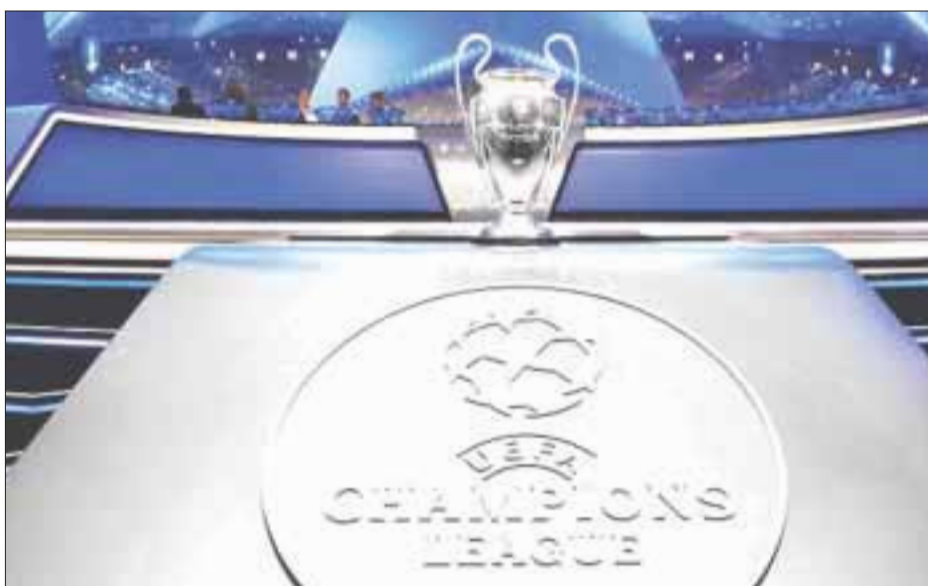
Se llevó a cabo el sorteo de la UEFA (Unión de Federaciones de Fútbol Europeas) para formar los grupos de la Champions League 2017-18.

Chelsea de Inglaterra, Roma de Italia y Atlético de Madrid de España protagonizan el famoso “grupo de la muerte” de la Liga de Campeones de la UEFA, uno de los más complicados y atractivos del certamen.