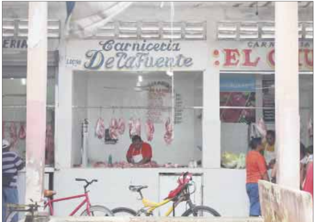
La capital de Quintana Roo quizá sea la única de toda la geografía mexicana que no cuenta con un rastro que controle las matanzas clandestinas.