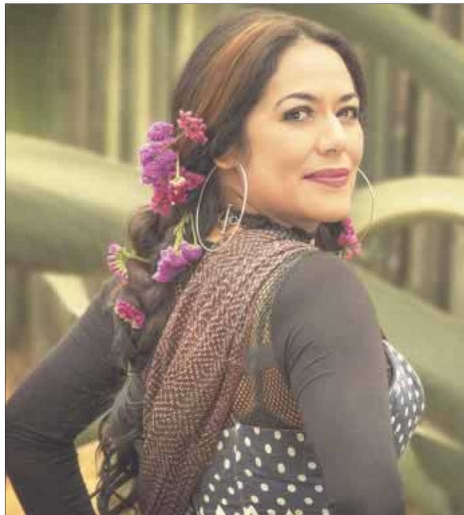
La cantante Lila Downs ofrecerá conciertos en Barcelona y Madrid, los días 21 y 23 de noviembre próximos.

Además, de que en sus canciones y proyectos de activismo social ha expresado sus preocupaciones por temas como la justicia, los derechos civiles, amenazas de los periodistas en el país y más recientemente sobre la situación de los migrantes en Estados Unidos, bajo la administración Trump.