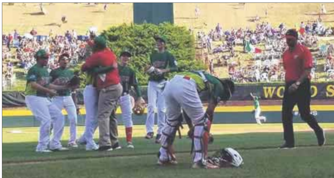
La novena de Reynosa se impuso a Canadá por pizarra de 6-2 y ahora se medirá al representativo de Japón.

Pennsylvania.- México derrotó ayer 6-2 a Canadá y avanzó a la final del Grupo Internacional en la Serie Mundial de Ligas Pequeñas en Williamsport.