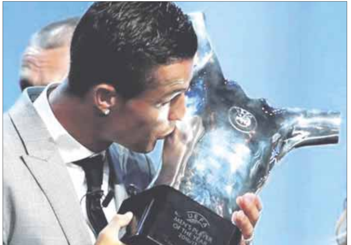
Cristiano Ronaldo fue campeón de España por segunda vez en su carrera y logró levantar la Liga de Campeones por segundo año consecutivo.

Los otros jugadores nominados fueron el delantero argentino Lionel Messi del Barcelona y el portero italiano Gianluigi Buffon de la Juventus, este último pudo llegar hasta la final de la Champions League la temporada pasada