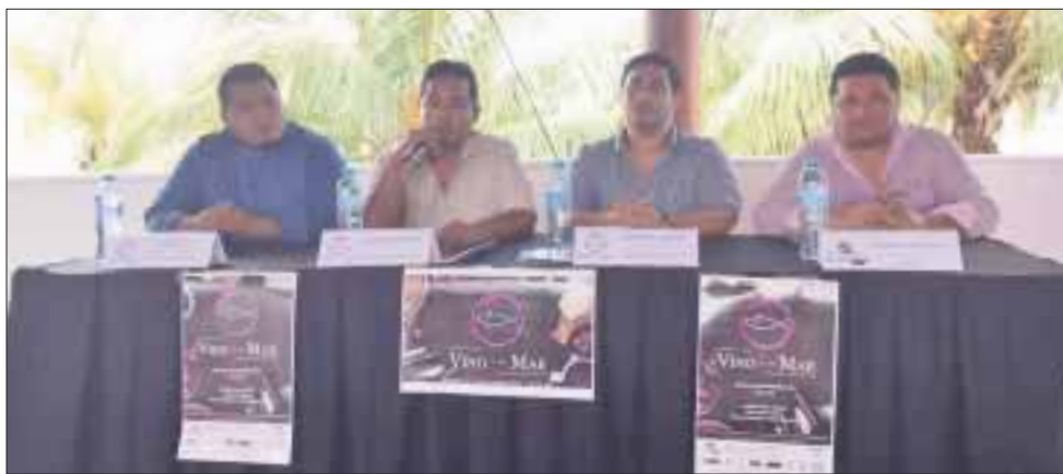
Se tiene prevista la asistencia de 600 personas al Festival Del Vino y el Mar, que se realizará el sábado 2 de septiembre en la Marina Chac Chi.

Cancún.- Con la asistencia de 600 personas, el Festival Del Vino y el Mar se realizará el sábado 2 de septiembre en la Marina Chac Chi, desde las 18:00 horas, en un marco de fiesta y celebración, donde participarán 16 casas vinícolas de México.