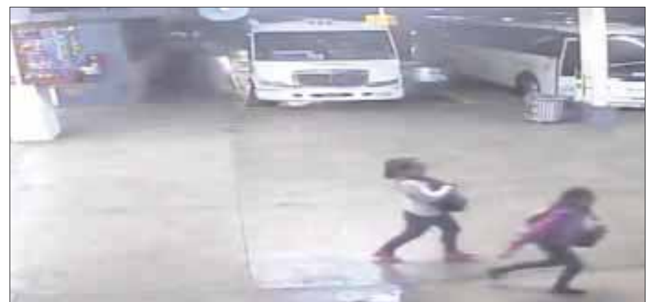
Momento en que las cámaras registran la explosión dentro de un autobús que apenas esperaba que subiera el pasaje.