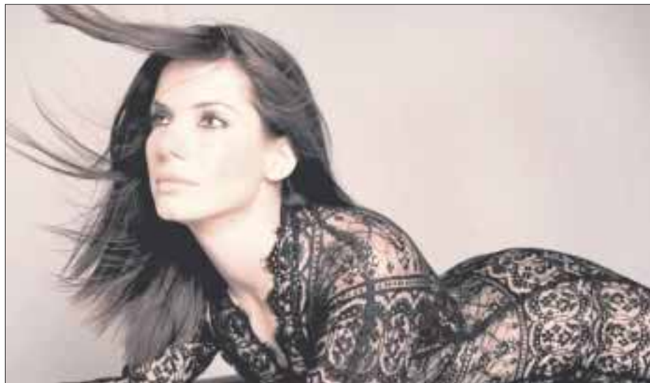
Sandra Bullock donó un millón de dólares a la Cruz Roja de Estados Unidos para ayudar a los damnificados por "Harvey".

Las entradas para las primeras funciones de Inhumans se pueden adquirir a través de cinehoys.cl. La serie, cuya primera temporada dura ocho capítulos, llegará a Latinoamérica a través del canal Sony, en fecha por confirmar.