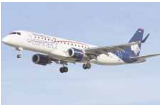
La aerolínea adquirirá otro Embraer E190.