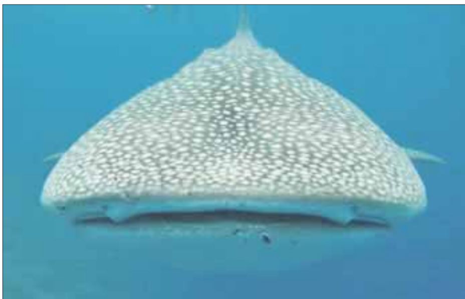
El tiburón ballena, también conocido como pez dama o dominó, llega medir hasta 4.6 metros y se cree que habita el planeta desde hace 60 millones de años.

La Secretaría de Medio Ambiente y Recursos Naturales (Semarnat) llamó a la población a proteger y conservar al tiburón ballena, en este miércoles que se celebra el día internacional de esa especie.