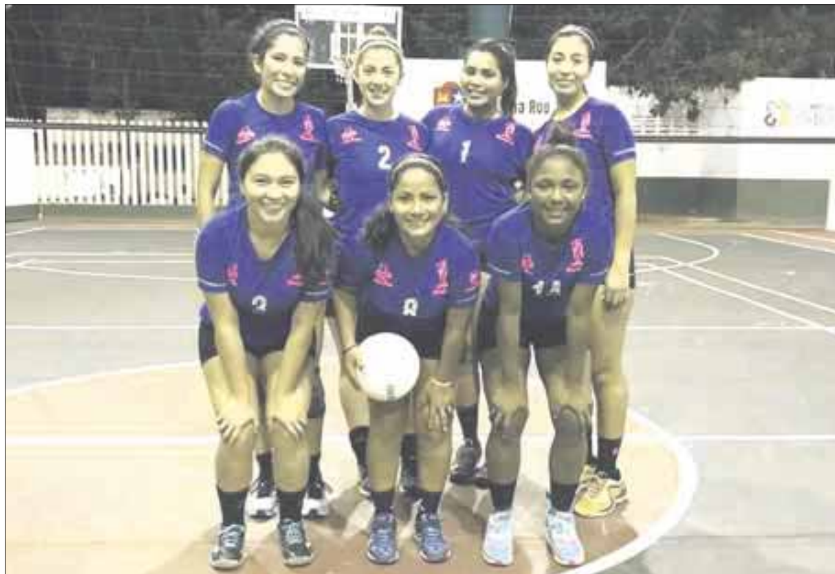
Las Maléficas sorprendieron en la última jornada de voleibol, tras derrotar a Queens.

De vuelta a la categoría de segunda fuerza, Amazonas logró su victoria número 8 a cambio de 4 derrotas tras vencer a Ladies en dos sets 25-19 y 25-10, quienes acomodaron sus números en 4-8. Cabe mencionar que en este partido sólo se presentaron cuatro jugadoras por equipo, mostrando su falta de disciplina y compromiso para dicho torneo.