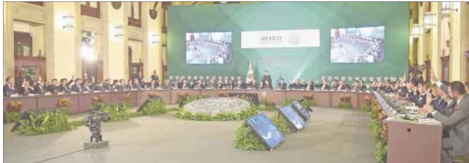
El gobernador Carlos Joaquín asistió a la XLII Sesión del Consejo Nacional de Seguridad Pública que se celebró en Palacio Nacional.

En materia de seguridad, Carlos Joaquín explicó que en Quintana Roo se trabaja a través de una mesa de coor-