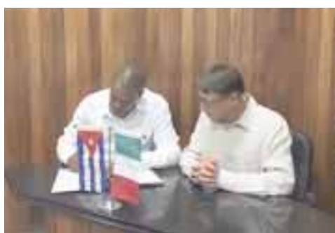
Durante la firma del convenio de lo que será el Meliá Trinidad, Cuba.