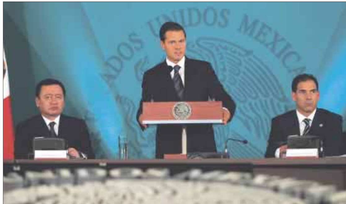
El presidente Enrique Peña Nieto encabezó en Palacio Nacional la XLII Sesión del Consejo Nacional de Seguridad Pública.

“Las entidades federativas en muchos casos no cuentan con cuerpos policíacos suficientemente sólidos y confiables, y en el caso de los municipios, muchos ni siquiera han desarrollado sus propias corporaciones”, dijo en el acto al que