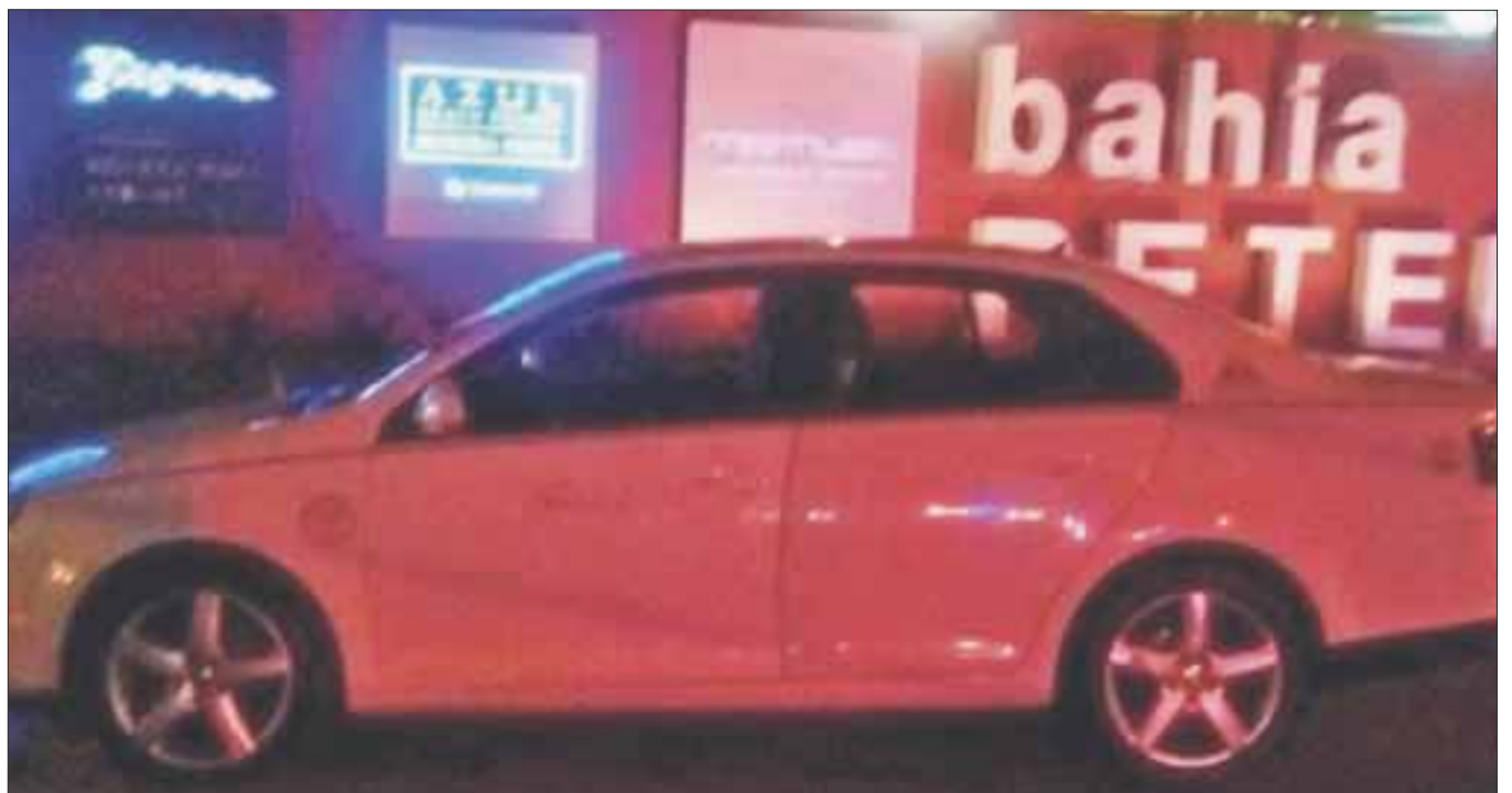
El taxista recibió varios impactos de bala a la entrada del complejo turístico Bahía de Petempich, en Puerto Morelos.

Asimismo, se aseguró dentro del automóvil marca Volkswagen Bora Style con placas de circulación 957TRW color blanco con franjas doradas, con número económico 392 modelo 2009, había un teléfono de la marca LG color morado y una tablet de color negro de la marca Samsung.