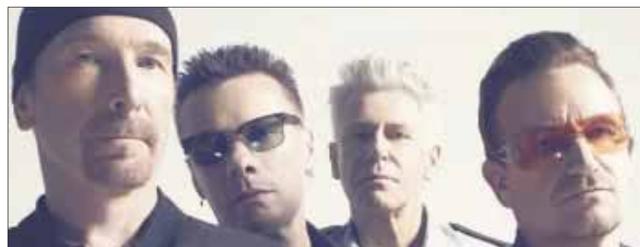
U2 estrenó el tema "The Blackout", que forma parte de su próximo álbum Songs of Experience .

Mediante la campaña Iluminemos el Foro Sol se pretende, mediante las redes sociales y en específico Facebook , que la audiencia haga una reminiscencia de cómo la gente de la última década del siglo 20 participaba en los conciertos, y así la generación millennial se sume y guarde