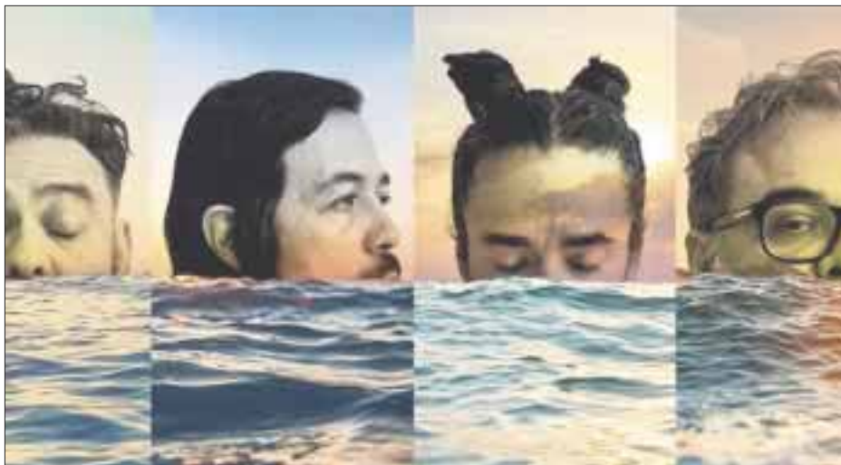
Café Tacvba llegará al autódromo de Cancún el 28 de octubre, para presentar su nueva producción Jeí Beibi .

El certamen de cine latinoamericano del balneario vascofrancés, que todavía no ha anunciado la lista de películas de ficción en competencia, concluirá el primero de octubre luego de la ceremonia de premiación.