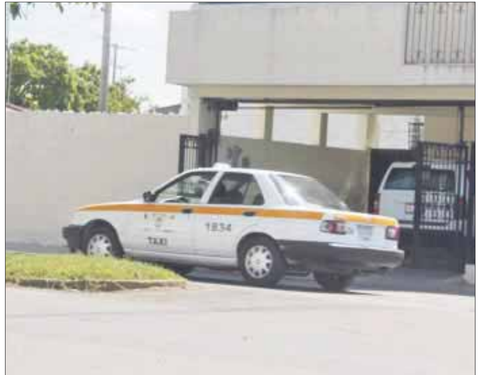
El taxi 1282 fue reportado, y no se tiene el nombre del operador, pero puede ser careado con la afectada.

"Yo le pregunté al taxista ¿pero me llevará a mi primero, tengo que checar a las 9 de la mañana en mi trabajo? Me contestó muy rápidamente. "No te llevaré y si quieres llama un radio taxi o un Uber". Y me chasqueó los dedos y me gritó bájate, la estudiante dijo no hay problema lleve primero a la señora, pues ella es la primera en estar esperando servicio, también otro estudiante al oír cómo me trataba le dijo "no tienes ningún derecho a tratar así a la señora y tú obligación es darle el servicio. Y a esto respondió este sujeto. No llevaré a nadie no me da la gana y bájate".