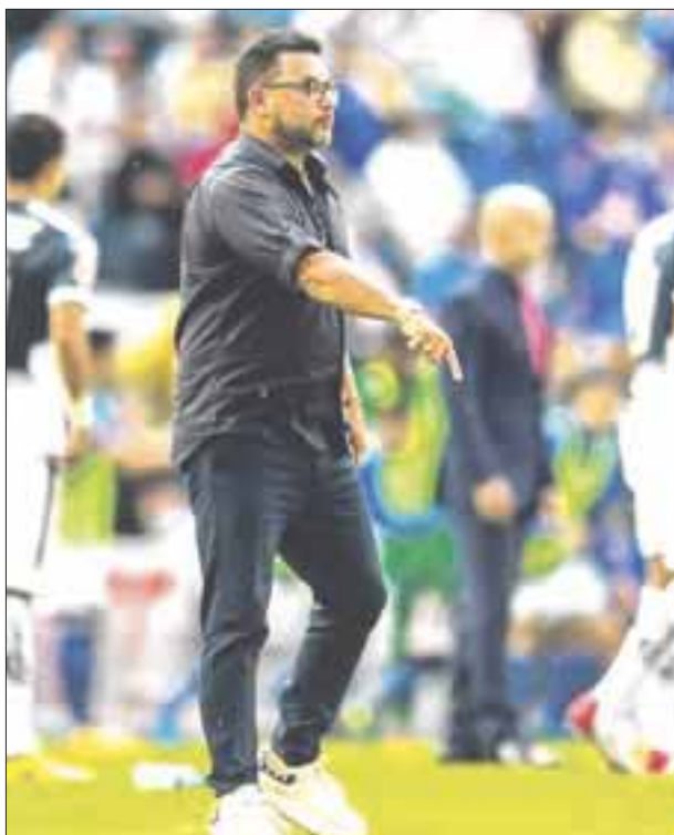
El entrenador del Monterrey, Antonio Mohamed, salió a la defensa de los jugadores mexicanos, tras la opinión de Francisco Jémez.