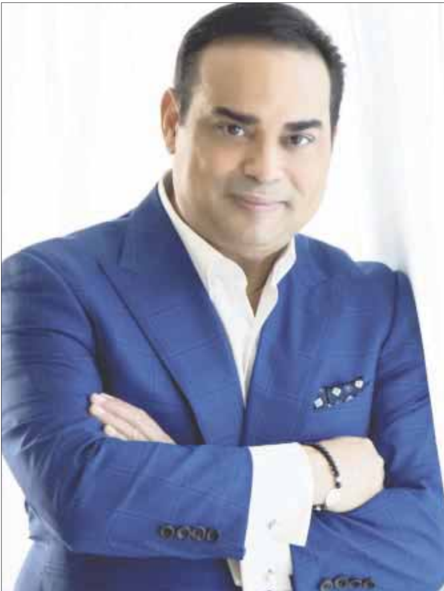
El salsero Gilberto Santa Rosa iniciará en este mes su gira mundial “40... y contando”, en la que recorrerá 19 países.

“Con esto del Internet y las redes sociales ahorita me están hablando de Chile, de Colombia, de El Salvador, de todas partes, que vayamos para allá, nomás que el problema es que nosotros no tenemos promotores por esos rumbos”, externó el artista na-