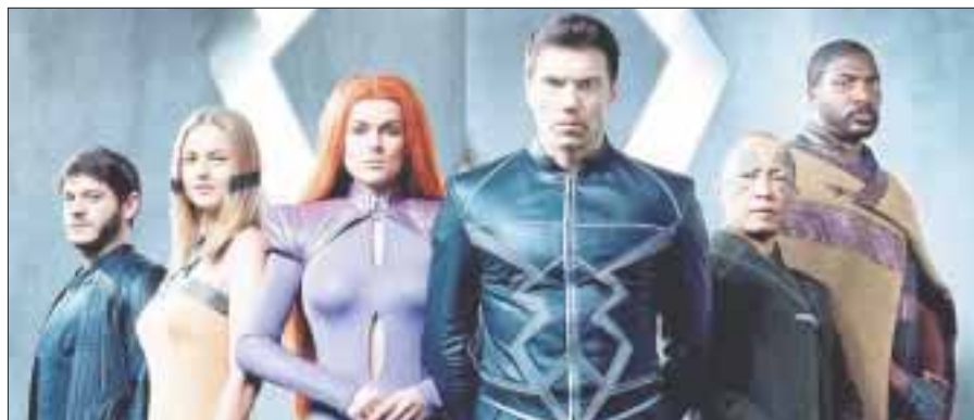
Capítulos de la nueva serie "Inhumans" se proyectarán en varios cines del país.

Además de ofrecerles alojamiento lejos de las inundaciones, ropa seca, cepillos de dientes, jabón y zapatos, McIngvale está pagando duchas portables para que las víctimas puedan bañarse; "esa es su manera de devolverle a la comunidad que ha sido clave para su éxito durante los pasados 36 años", dijo uno de sus empleados.