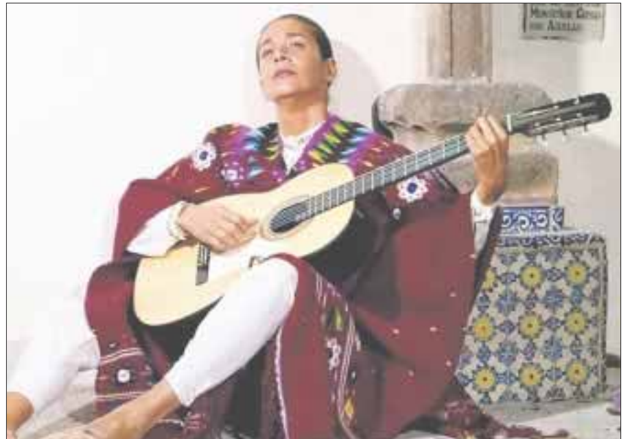
Los documentales "Chavela Vargas" y "Los ojos del mar" fueron seleccionados para competir en el 26 Festival de Biarritz.

"Creo que es un momento de repensar, si la vamos a seguir tocando o si le cambiamos la letra", señaló el cantante Rubén Albarrán.