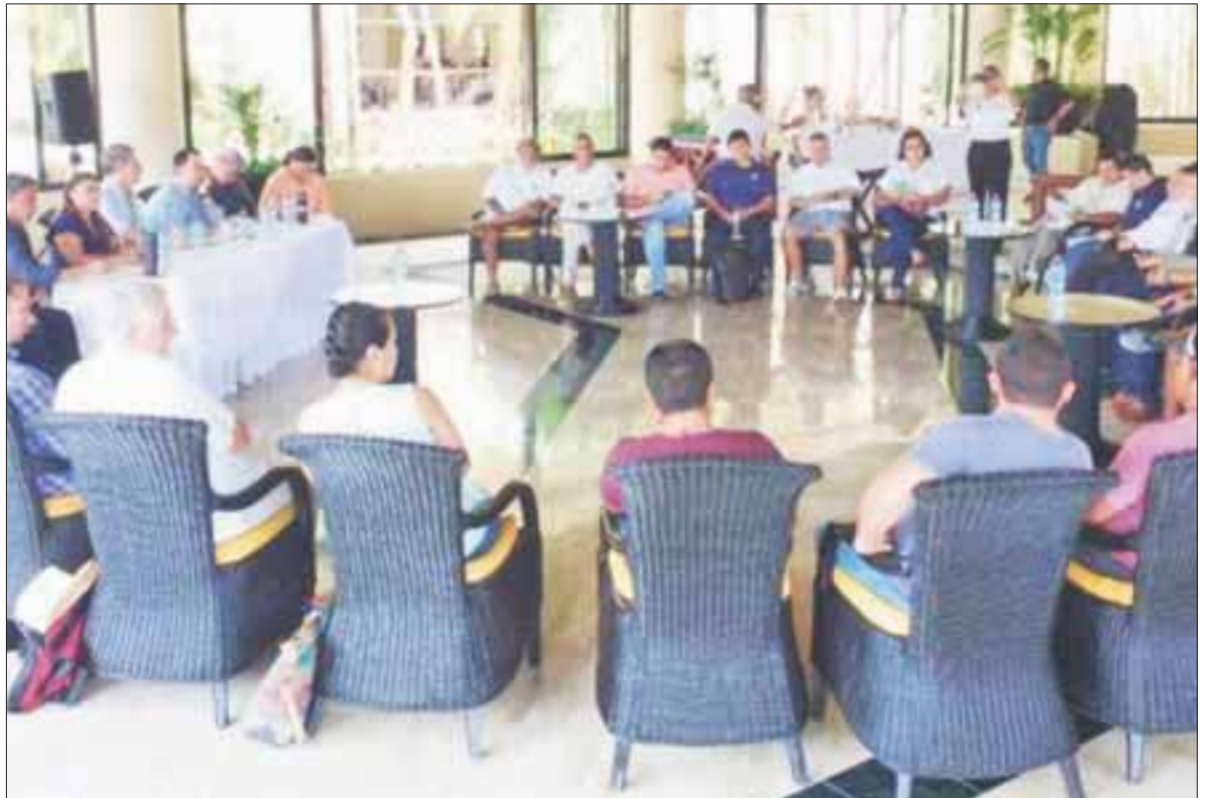
El primer acuerdo fue la formación de un comité de seguimiento para lograr un ordenamiento de los servicios turísticos para la protección ambiental del destino turístico.

Además, participaron otras dependencias: la Procuraduría Federal de Protección al Ambiente, la Secretaría de Medio Ambiente y Recursos Naturales, la Secretaría de Gobierno de Q. Roo, la Secretaría de Turismo, las sociedades cooperativas turísticas, la Asociación de Hoteles de Tulum, el Centro Ecológico Akumal y las empresas privadas de servicios turísticos.