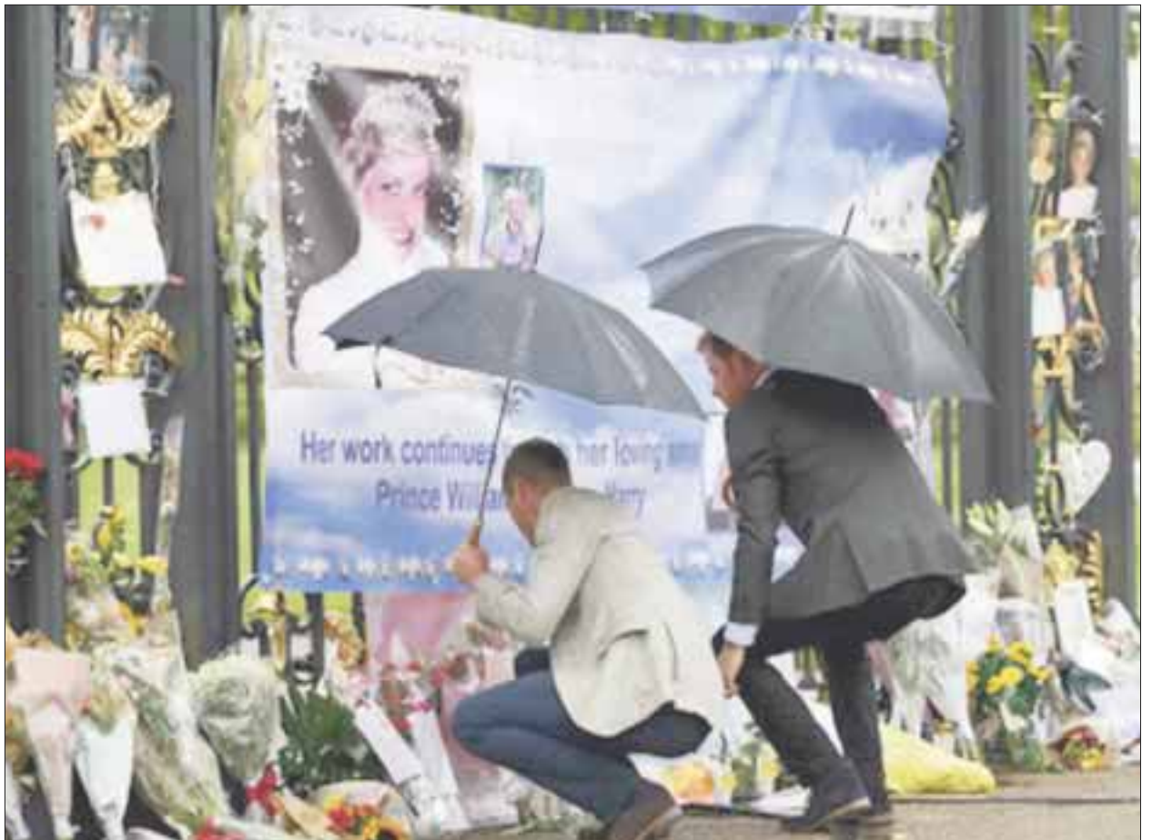
Los hijos de Diana Spencer, los príncipes Harry y William visitaron el jardín blanco efímero creado en su memoria en el palacio de Kensington.

Fue este proceso de legado lo que les empujó a romper años de silencio oficial en torno a su madre para hablar de ella por primera vez a corazón abierto, en un documental emitido en julio en la cadena de televisión británica ITV.