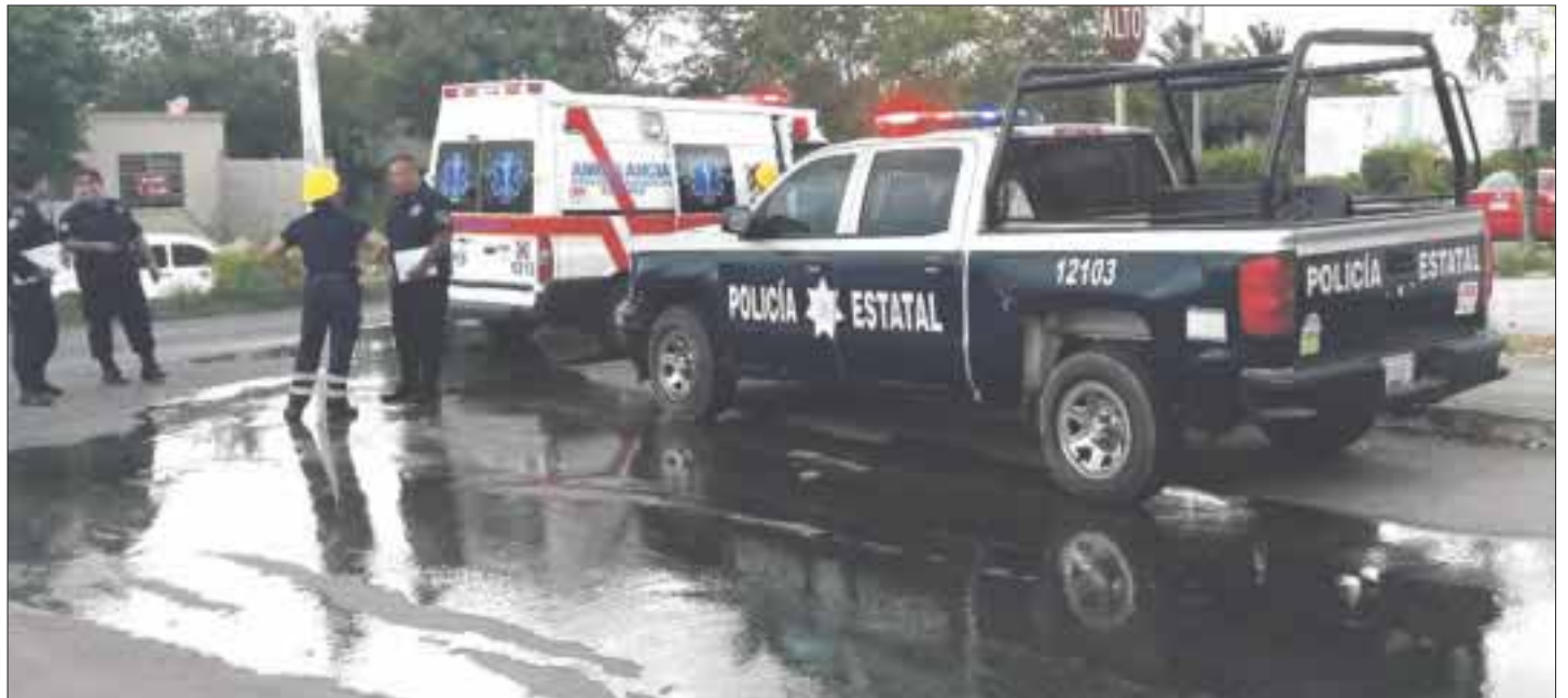
Al fondo se observa el tanque viejo que provocó el pánico entre los vecinos, pero fueron 20 kilos que se escaparon en minutos y controlado con pericia por los vulcanos.

Se le dijo a la familia como realizar sus actividades sin causar riesgos.