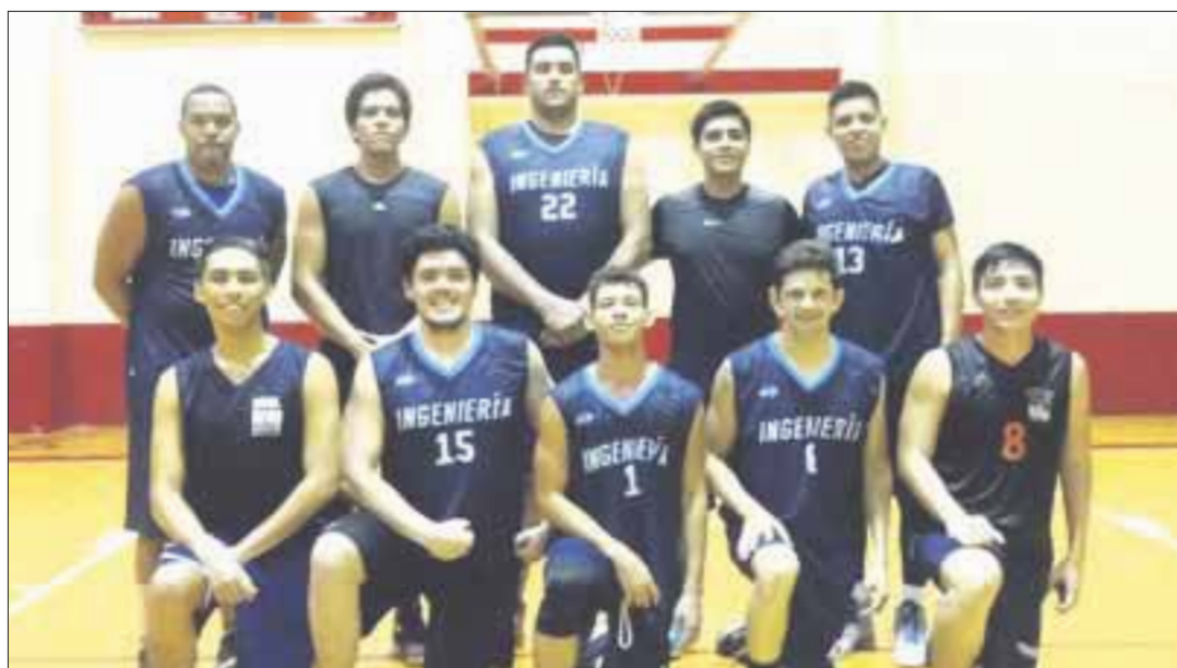
El cuadro de Ingeniería continúa preparándose con miras para hacer un buen papel en la Liga Mayor de Basquetbol, con una base de jugadores jóvenes.

Cancún.- Con la firme intención de llegar preparados al inicio de la Liga Mayor de Basquetbol, que se inaugurará el 23 de septiembre, Ingeniería, equipo que en los últimos torneos locales ha estado en los primeros lugares, se prepara en las instalaciones del Kuchil Baxal, de cara a uno de los torneos más importantes del estado.