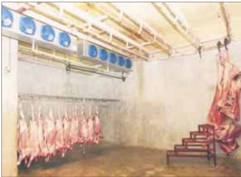
La remodelación y actualización del rastro municipal requieren de 45 millones de pesos.

Diariamente se sacrifican hasta 300 reses