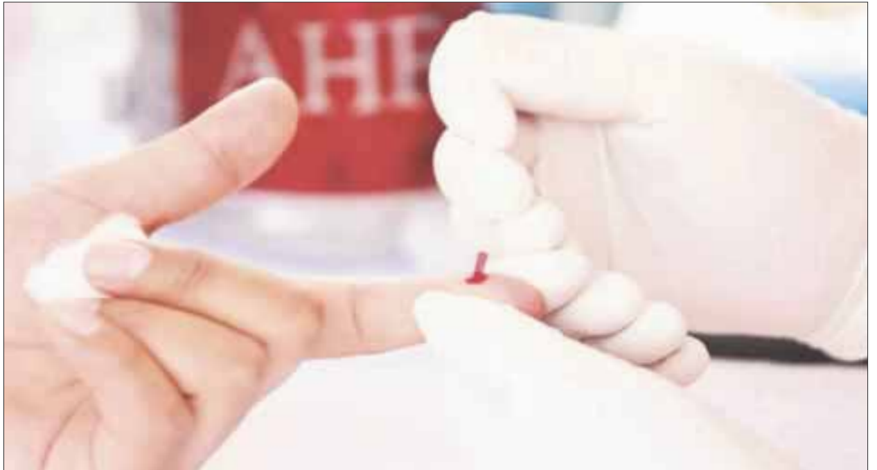
Se realizará la tradicional caminata Contra el VIH-SIDA que partirá desde El Crucero hasta la clínica 3 del Instituto Mexicano del Seguro Social.

Respecto a casos de VIH, la dependencia señala que hasta la semana epidemiológica número 46 del año, se tiene un acumulado de 531 casos, contra los 310 reportados en el 2016.