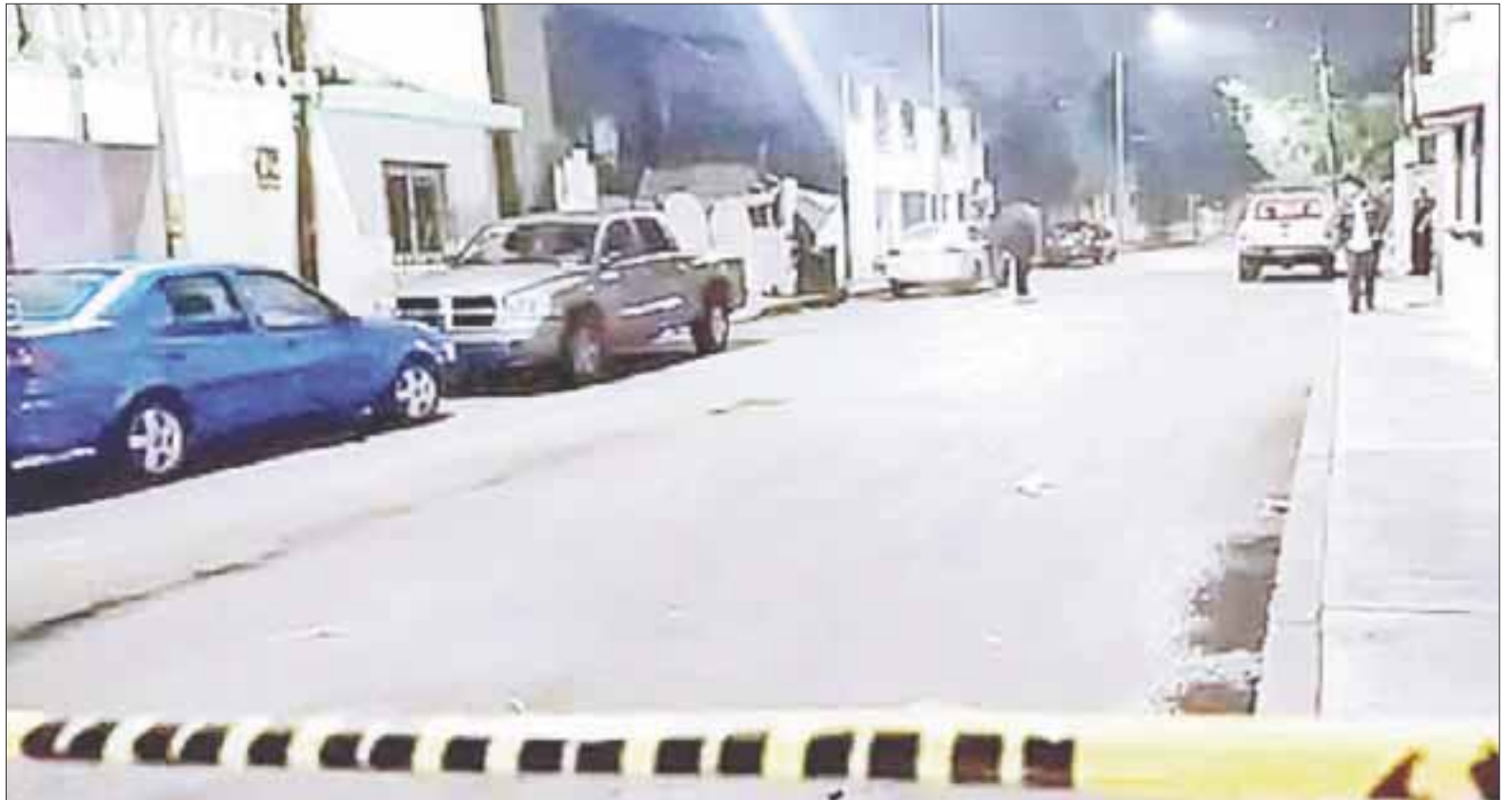
Un familiar del ejecutado confirmó que era agente de seguridad del bar “No le Digas a Mamá”.

Sin embargo, antes de fallecer logró comunicarse con su esposa para pedir auxilio.