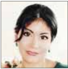
Por Yolanda Montalvo