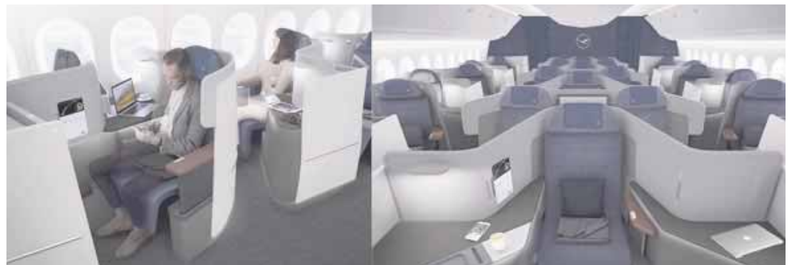
La nueva Business Class de la aerolínea, llegará en 2018.

Los nuevos asientos de Business Class han sido desarrollados por la compañía, con la ayuda de sus clientes. Más de 500 invitados han proporcionado