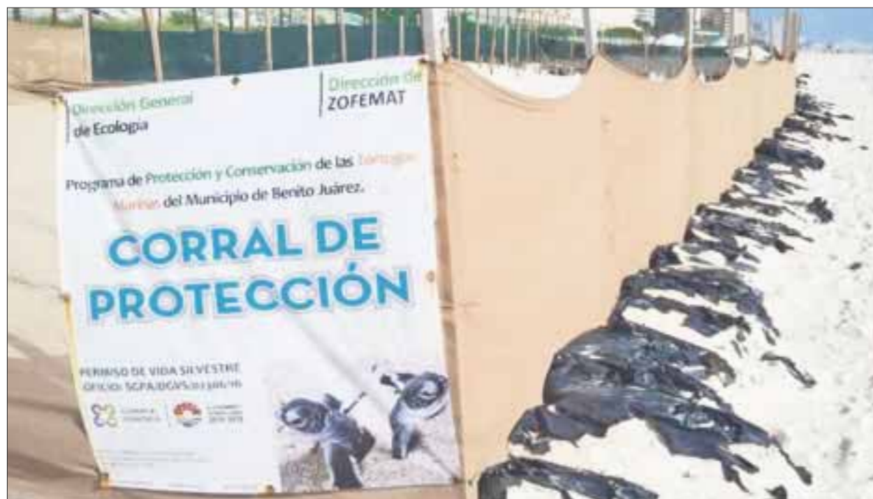
El delito ambiental no exime a las autoridades, que ordenaron la suspensión de las obras del hotel Gran Solaris.