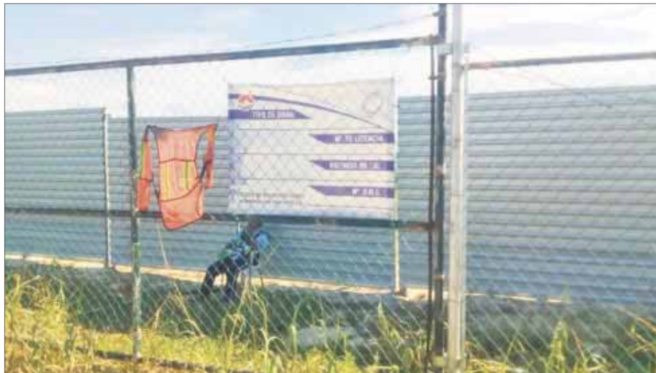
Suspendieron ya las obras en el hotel Gran Solaris de Cancún, ubicado en Playa Delfines, por un recurso de revisión, que no es clausura definitiva.

Dijo que se revisa la legalidad del permiso de construcción y de los actos de la autoridad municipal para al final este recurso dar legalidad a la inversión del Gran Solaris, si existen irregularidades se procedería.