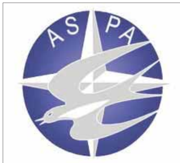
ASPA ofrece disculpas.