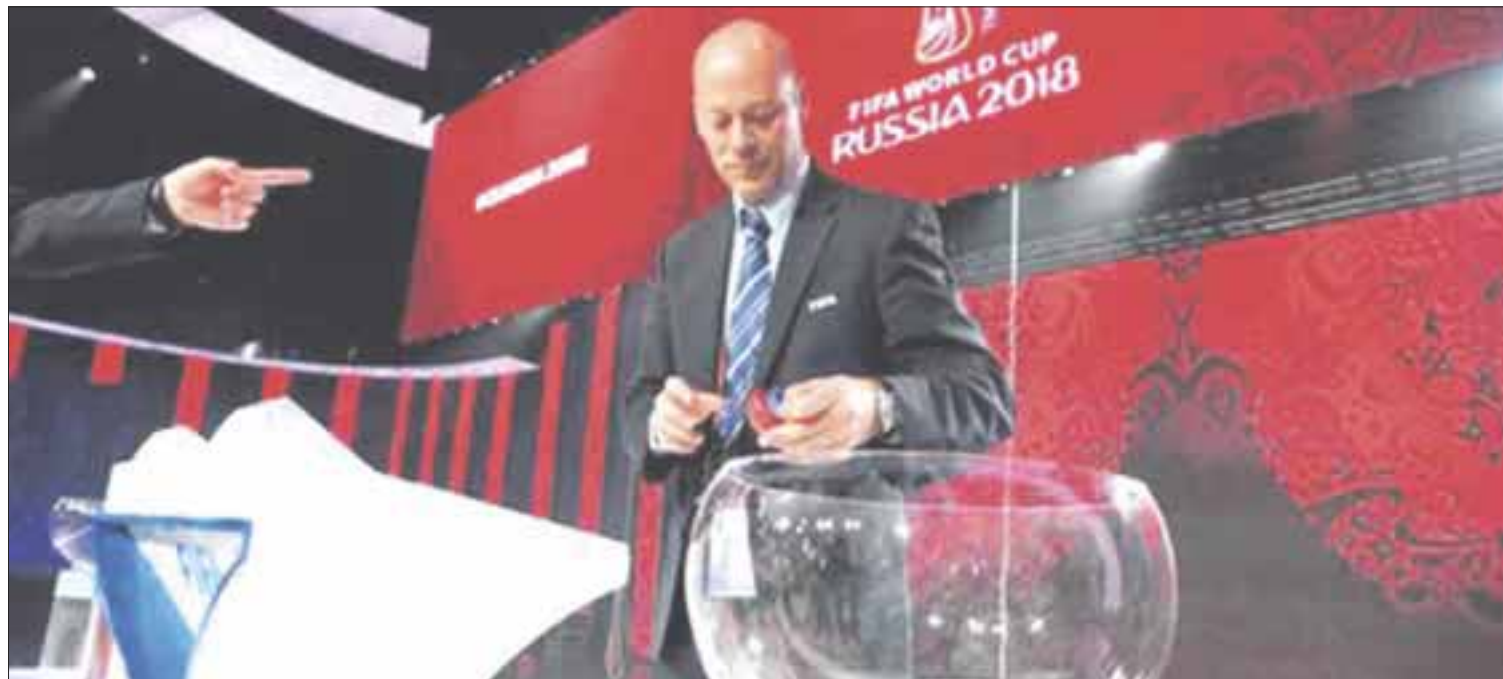
Este viernes se realizará el sorteo para definir a los ocho grupos y el camino que deberá seguir cada equipo rumbo al título en la Copa Mundial 2018

Dinamarca, Islandia, Costa Rica, Suecia, Túnez, Egipto, Senegal e Irán comparten el tercero; en el "Bombo 4" se ubican las selecciones de Serbia, Nigeria, Australia, Japón, Marruecos, Panamá, Corea del Sur y Arabia Saudí.