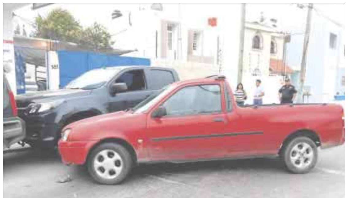
La falta de señalización adecuada en Chetumal y falta de precaución ocasionaron otros dos accidentes vehiculares.

Al impacto salieron los vecinos y propietarios de las otras camionetas, quienes pretendieron agredir al conductor pensando que estaba ebrio, pero al ver que llevaba a sus hijos a la escuela y escuchar la razón por la cual colisionó a sus vehículos, aceptaron que pagara los daños.