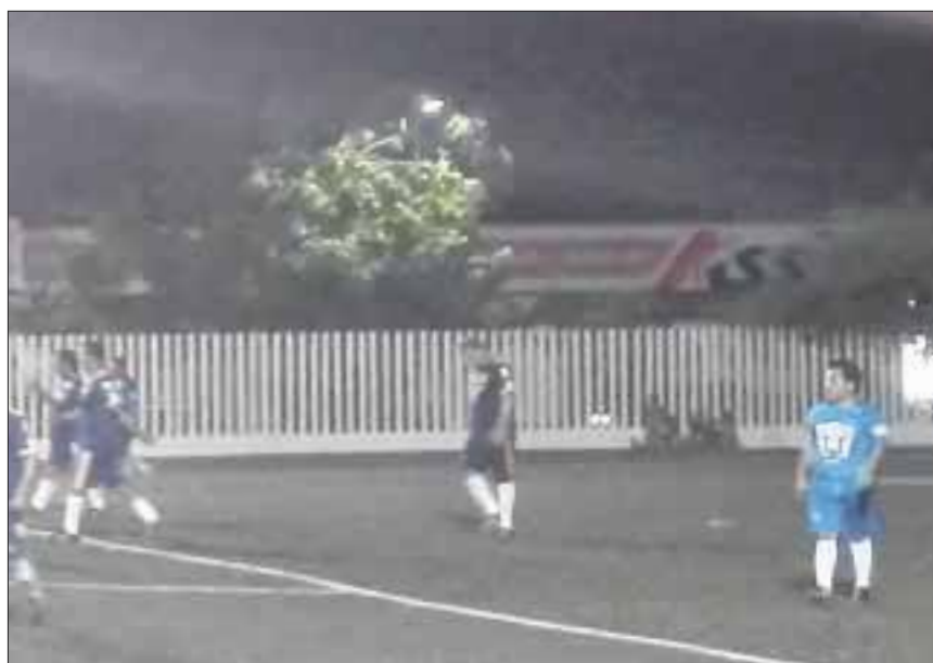
El equipo del Congreso estuvo a punto de perder el invicto, tras empatar en tiempo de compensación contra los Comunicadores.

Chetumal.- En la liga municipal de futbol categoría Master (mayores de 40 años) el equipo del Congreso, a punto estuvo de perder el invicto al empatar en tiempo de compensación contra los Comunicadores.