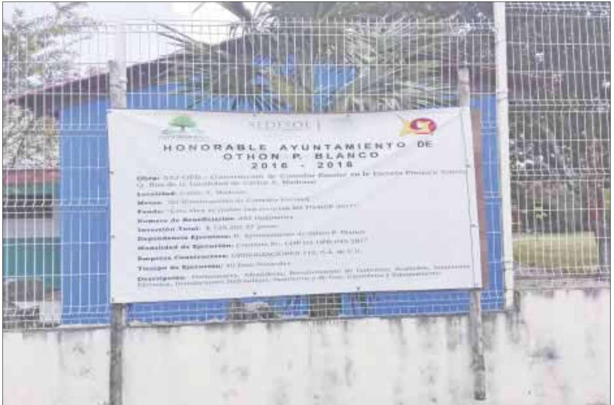
Entregarán nueve comedores en beneficio de más de 2 mil 700 alumnos en la primera semana de diciembre.

Como ejemplo, en la primaria Andrés Quintana Roo ubicada en la colonia Fovissste Tercera Etapa, el comedor escolar ya cuenta con instalación de gas estacionario, mobiliario y la estructura pintada, pero tiene detalles que le hacen falta como los protectores, el piso de alrededor y las canalatas de agua para que no se humedezcan las paredes.