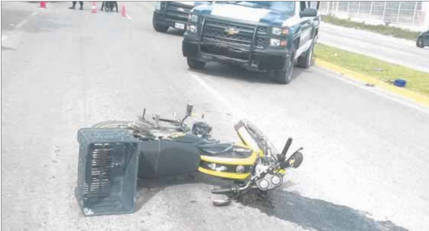
Una mujer que conducía a exceso de velocidad su moto Italika, arrolló a una sexagenaria que cruzaba la carretera.