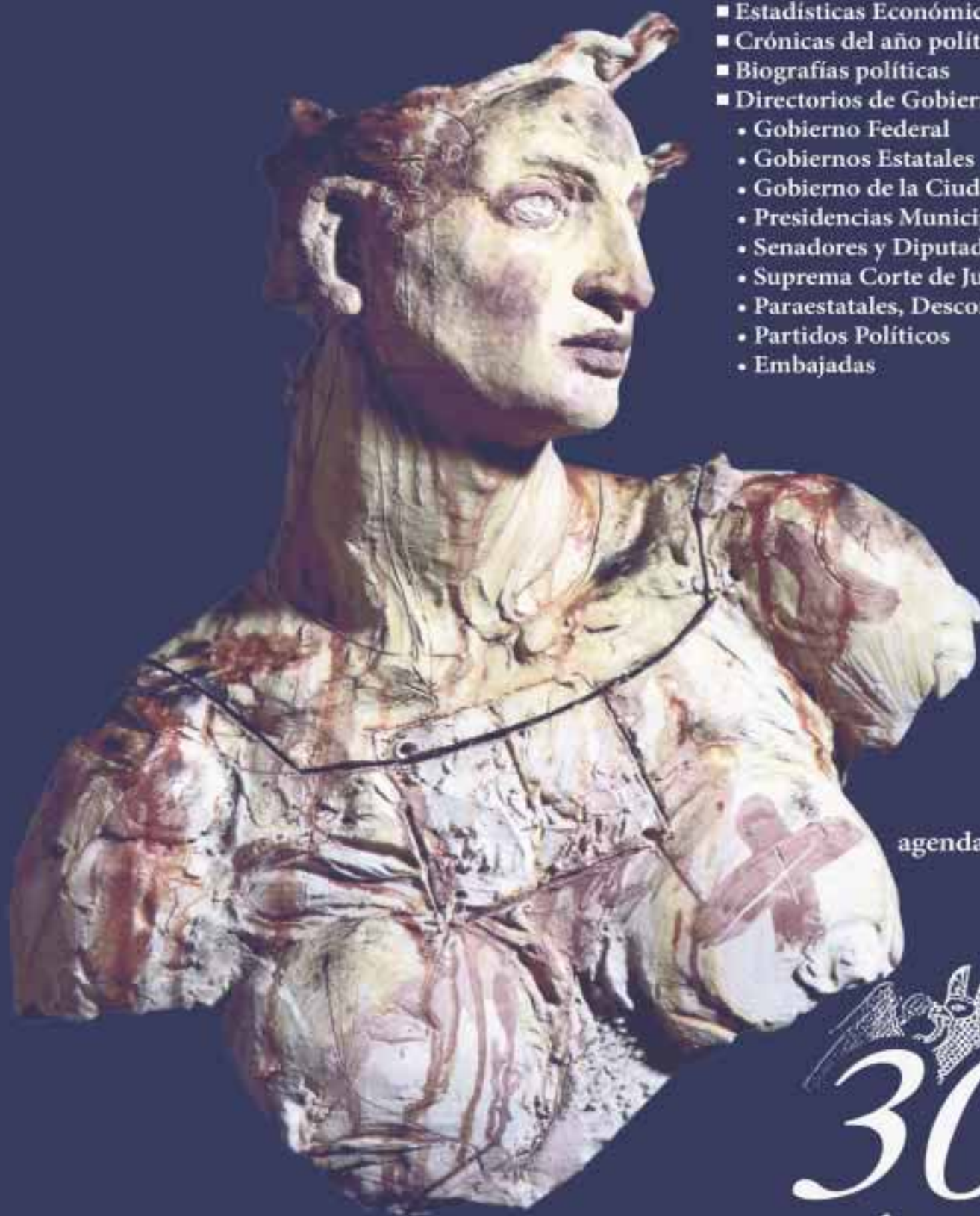
D.R. New Mexican Arts / Fragmento de la obra : Sueño redondo (Round Dream) / Javier Marín, 1994

☎ (01-81) 8344 0540 (01-81) 8344 1180 agenda_politica@hotmail.com