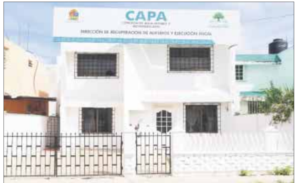
Usuarios exigen a la Comisión de Agua Potable y Alcantarillado elevar la calidad del agua potable.

El gerente operativo de la paraestatal afirmó que el agua potable bacteriológicamente es buena, pero reconoció que al salir del subsuelo contiene muchos finos, cargada de sólidos de yeso, es decir, sarro