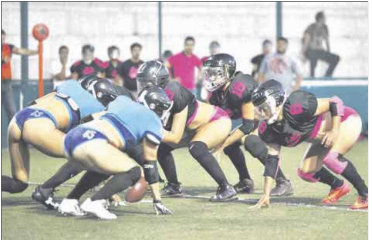
La ofensiva de Lipsticks Cancún tendrá una una prueba cuando enfrente a la defensiva de Barracudas de Playa del Carmen.

En esta fecha le tocó descansar a Patriotas.