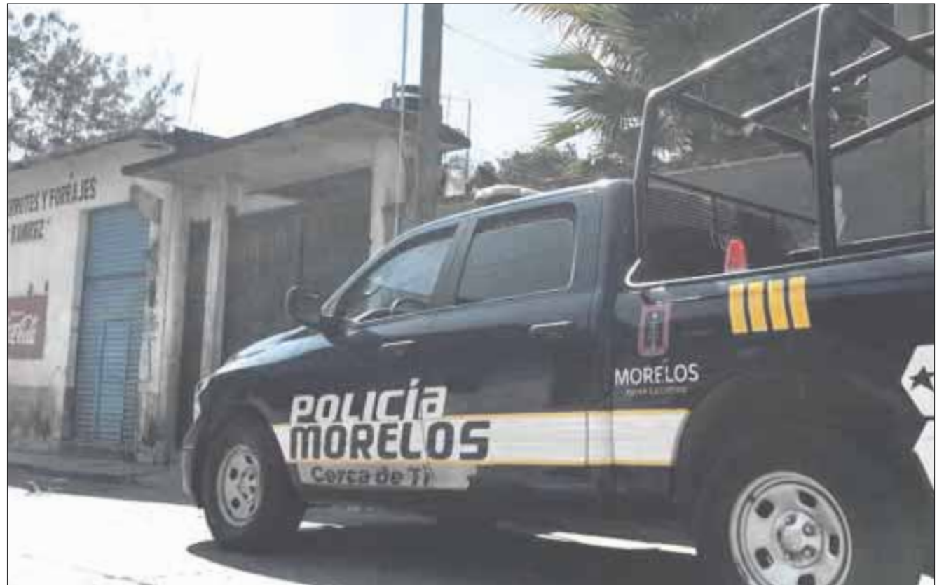
Al interior del domicilio se localizaron los cuerpos sin vida de cuatro mujeres, un adolescente y un niño de un año de edad, en Temixco, Morelos.

Integrantes de la Policía de Investigación Criminal de la Fiscalía Morelense recaban las evidencias de la escena del crimen para tratar de determinar lo que ocurrió ayer por la madrugada.