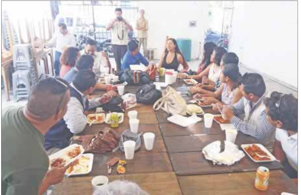
El dirigente de los tianguistas habló de los permisos globales que se extienden a las expoferias, lo que les permite evadir impuestos a quienes comercian con el mito de que son especializadas.

Por último, Ortega García manifestó harán limpieza, reorganización y depuración de vendedores en el parque de Las Palapas, porque hay muchas quejas de comerciantes establecidos en contra de los ambulantes y viceversa”.