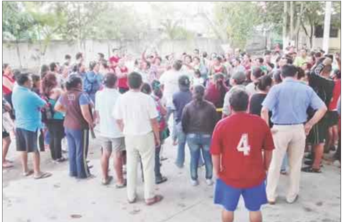
Un problema laboral privó a 500 alumnos de sus clases, que suspendieron los docentes.

De acuerdo algunas de las inconformidades son por hacer guardias durante el receso, no ausentarse los profesores del salón y que eviten el uso excesivo del teléfono celular, ya que restando con ello la atención educativa hacia los estudiantes.