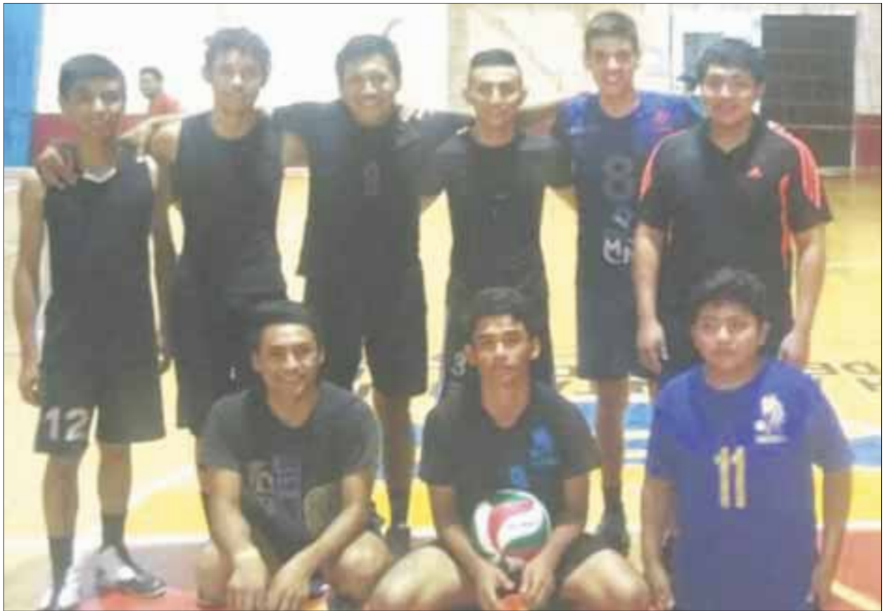
La LEVB de los equipos juveniles les sirve de fogueo para un mayor rendimiento en las etapas regionales.