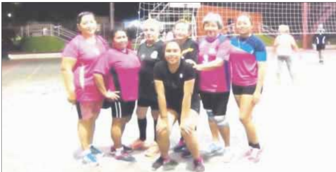
Estrellas y las del Deportivo Payo Obispo se impusieron en la jornada 5 de la liga "Jóvenes y Jóvenes de Corazón".

Chetumal.- En dos partidos, las chicas de Estrellas y las del Deportivo Payo Obispo, se impusieron en la jornada 5 de la liga "Jóvenes y Jóvenes de Corazón", que coordina Samuel Avilez.