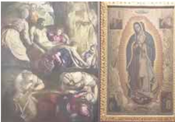
La deposición de Cristo , Jacopo Robusti, Tintoretto, Italia. Virgen de Guadalupe , segunda mitad del siglo XVIII, Cristóbal de Villalpando, México.