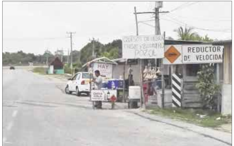
A lo largo de la carretera entre Chetumal y la frontera con Belice, hay 75 comerciantes semifijos que venden alimentos.

El censo sirvió para tener un estimado del número de personas que laboran en estos lugares y lo efectuó la dirección de Salud Municipal