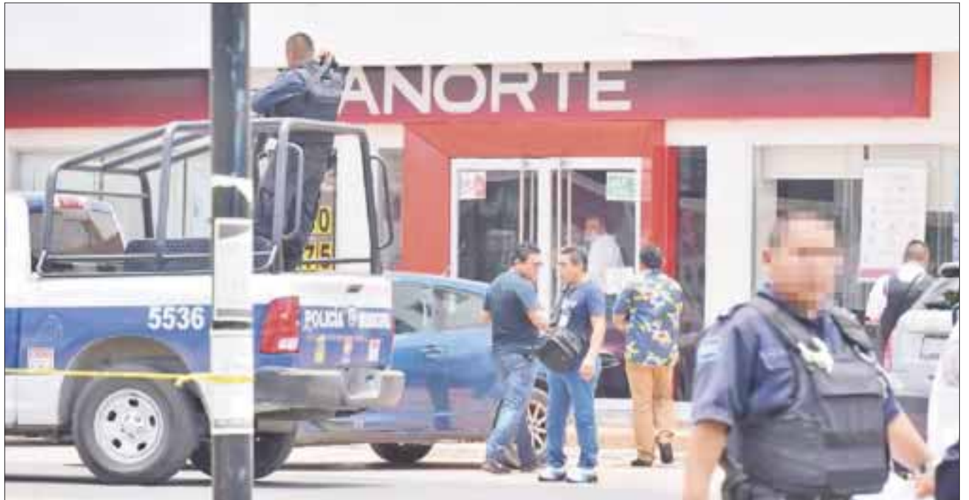
El servicio de “Acompañamiento Bancario” será gratuito y confidencial, por lo que el policía no tendrá que saber el monto de la operación.

El programa estará vigente a partir de este día hasta la primera quincena de enero del 2018 y que el acompañamiento bancario se realizará únicamente en horario de 9:00 a 15:00 horas.