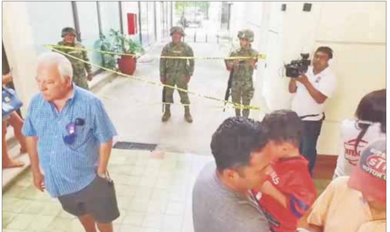
Elementos de la Subprocuraduría Especializada en Investigación de Delincuencia Organizada (SEIDO), se burlaron de los usuarios de las cajas de seguridad en Cancún, al “vaciar” las instalaciones de la empresa First National Security.

Al cuestionar a los uniformados por qué cubren la zona, en respuesta les dijeron simplemente que no debieron de haber pasado.