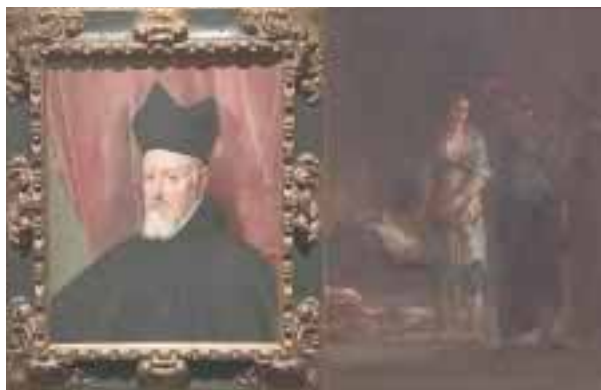
Retrato del arzobispo Fernando de Valdés , Diego Velázquez, España. Mujeres de Argel en interior , Eugène Delacroix, Francia.