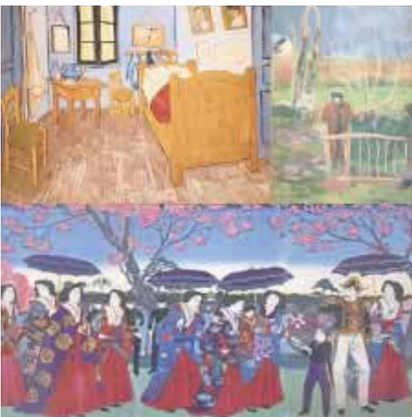
La recámara de Van Gogh en Arlés , Vincent van Gogh, Países Bajos. Buenos días señor Gauguin , Paul Gauguin, Francia. Vista de Benteen en Nakanashima en la laguna de Shinabazu, parque de Uena , Utagawa Hiroshige III.