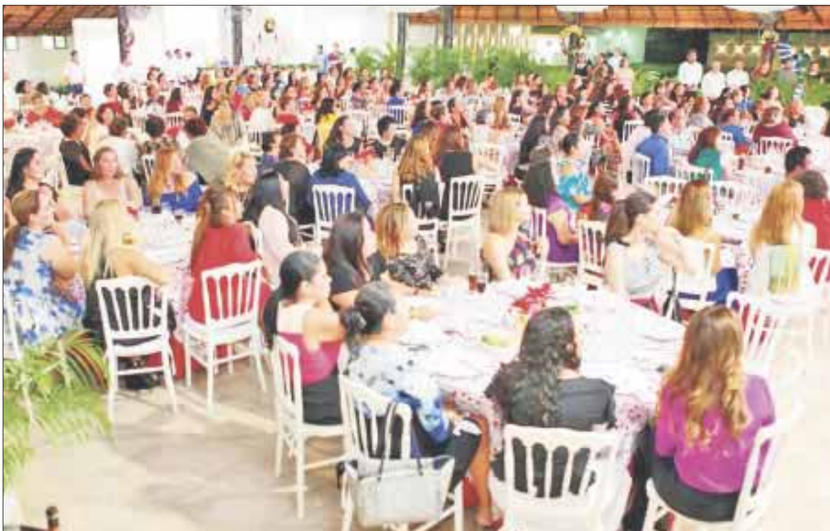
Voluntarios del DIF convivieron en una cena con la presidenta estatal de la institución.

Chetumal.- “Con nuestras acciones reafirmamos el compromiso de trabajar por un Quintana Roo más incluyente y asistencial, para que la población tenga más y mejores oportunidades” afirmó la presidenta del Sistema Estatal DIF Quintana Roo, Gaby Rejón, en una cena preparada para agradecer y reconocer la labor de las y los voluntarios que trabajan de la mano con la institución en beneficio de los sectores vulnerables.