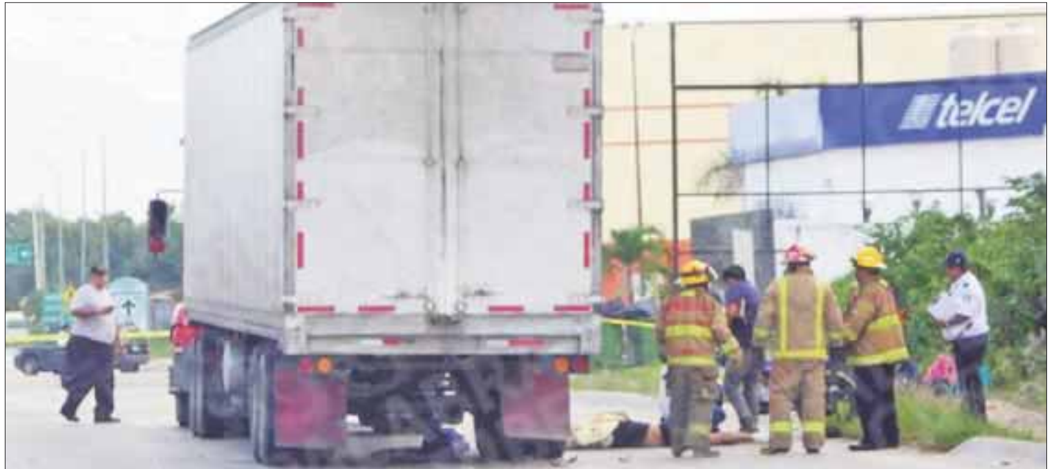
El chofer del tráiler quedó en calidad de detenido, en tanto que autoridades realizan el deslinde de responsabilidades.

El hombre que conducía la moto perdió la vida instantáneamente por el golpe, en tanto que a la mujer quedó mal herida con una de sus piernas destrozada.