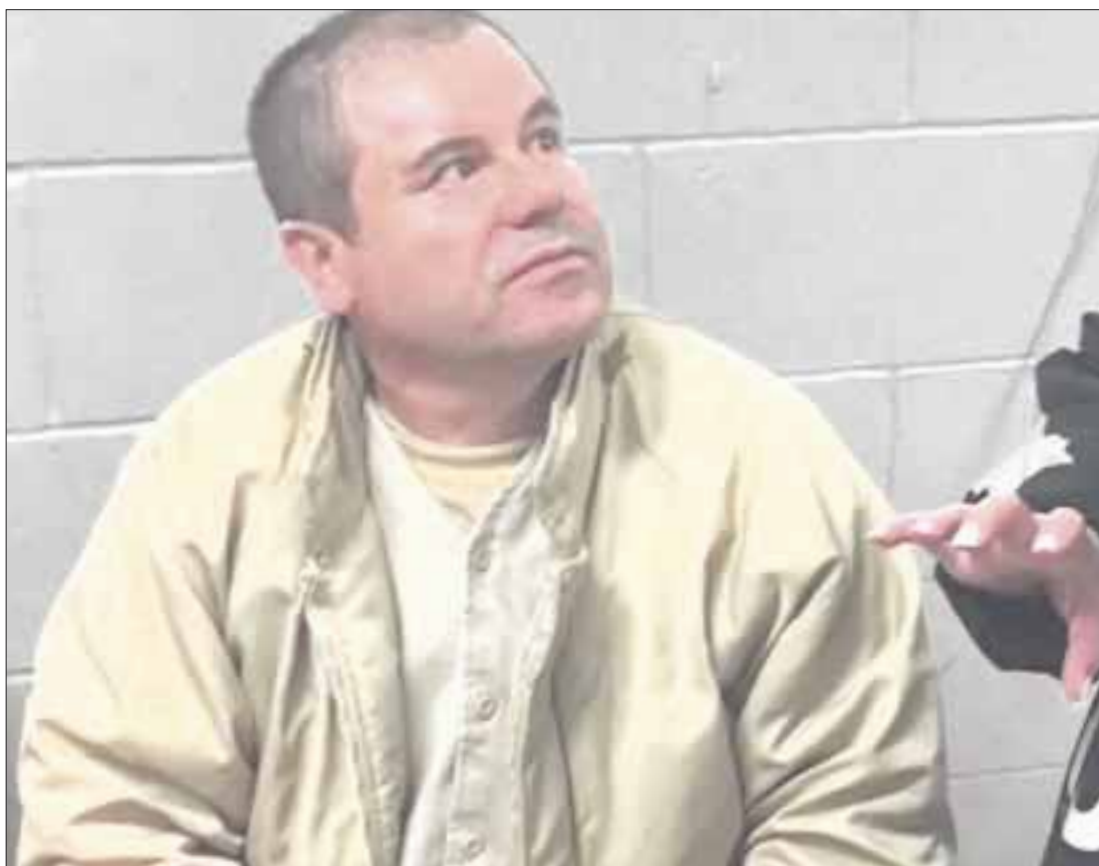
El juicio contra Joaquín Guzmán iniciará el próximo 16 de abril, con un total de 17 cargos en contra.

El juicio contra el capo iniciará el próximo 16 de abril