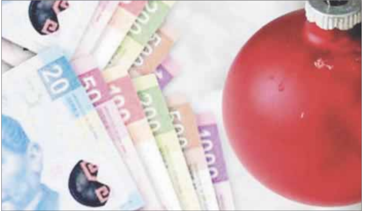
Multas que van desde los 4 mil hasta los 400 mil pesos se harán acreedores los patrones que no paguen en tiempo y forma los aguinaldos.