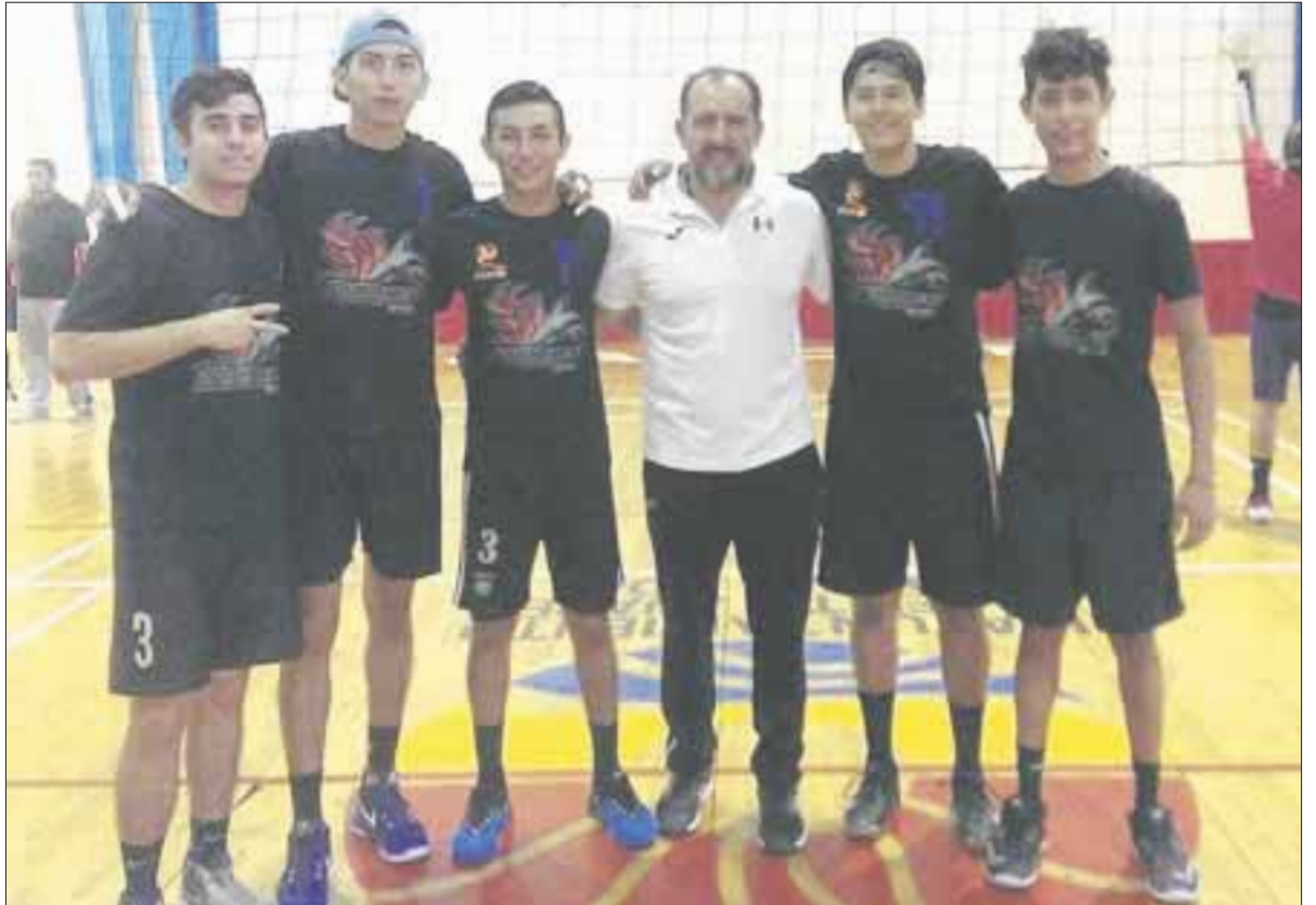
Tiburones, el equipo que terminó de líder en todo el rol regular, tendrá un rival difícil en la final de la Liga LEVB al enfrentar a Spartanos.

Ya en semifinales Tiburones continuó con el pie derecho venciendo a Zorros en dos sets 25-23 y 25-19. Mientras que Spartanos ganaría a Magisterio por el mismo marcador ambos sets, 25-23 y 25-23. Así pues la mesa está servida para la final el próximo domingo 17 de Diciembre, con hora aún por confirmar para la gran final entre Tiburones vs Spartanos qué sin lugar a dudas será de pronósticos reservados, con grandes jugadas y mates sobre la red, antes se medirán Magisterio vs Zorros por el tercer puesto.