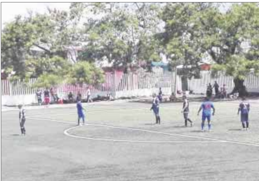
Los Guerreros de Seguridad Pública se fueron con todo para empatar y de manera increíble fallaron 6 jugadas claras de gol.

Chetumal.- Pese a dar una buena exhibición, Guerreros de Seguridad Pública perdieron ante Ferretería Aztlán por 4-1, ya que se cansaron de llegar hasta el área enemiga y fallar.