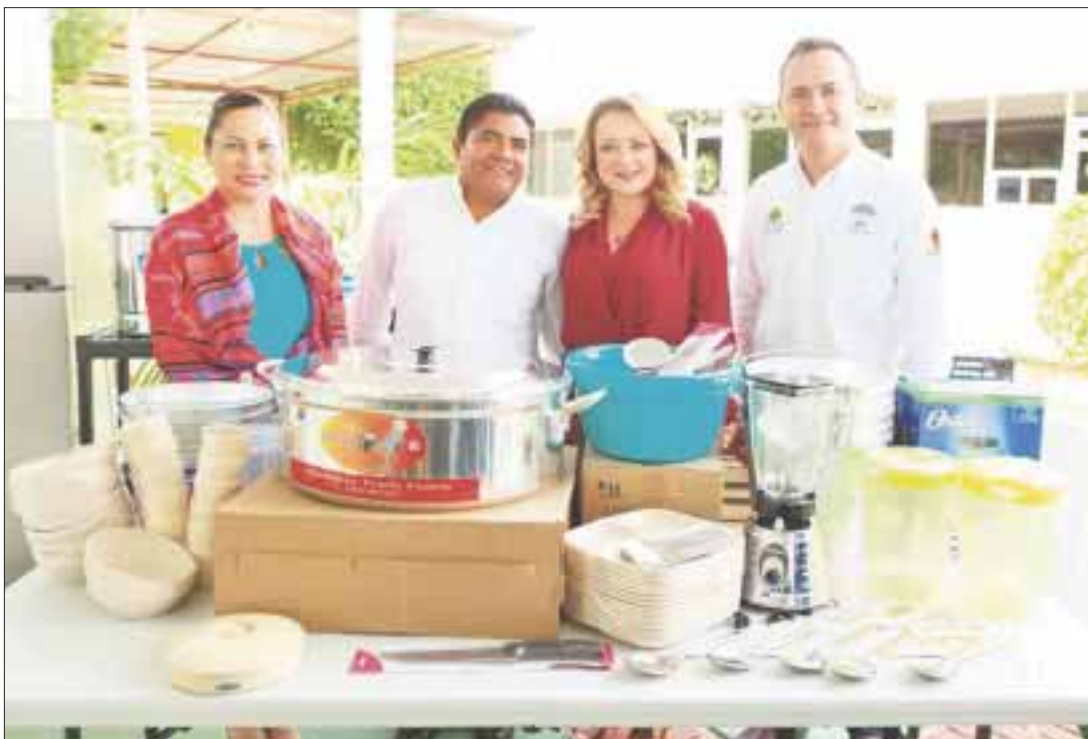
La presidenta honoraria del DIF, Gabriela Rejón y autoridades estatales pusieron en marcha la unidad móvil y equipamiento de los desayunadores.

Chetumal.- Contribuir a la seguridad alimentaria de la población escolar en situación de vulnerabilidad y combatir la desigualdad es un compromiso, afirmó la presidenta del Sistema Estatal DIF Quintana Roo, Gaby Rejón, en la entrega y el banderazo de salida del camión con mobiliario y equipo para desayunadores escolares del Subprograma de Infraestructura, Rehabilitación y/o Equipamiento de Espacios Alimentarios, en beneficio de 2 mil 300 niños de la entidad.