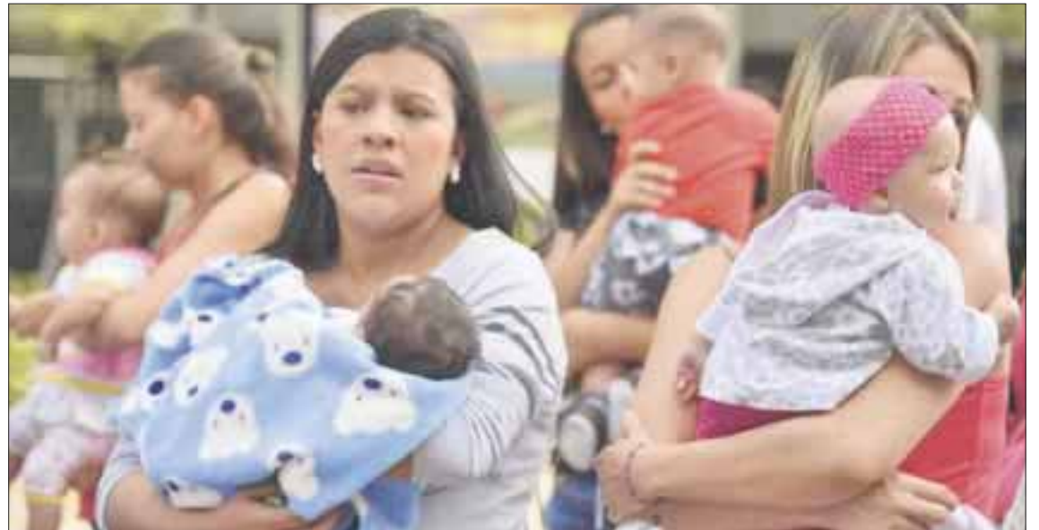
Las madres solteras enfrentan más riesgos de adicciones, ya que 4 de cada 10 ganan peso o tienen más peligro de caer en el alcohol.

Los psicólogos explican que el esfuerzo que la mujer realiza en la actualidad es de jornadas de 72 horas, ya que en su empleo cumple 40 horas, como los hombres, pero al llegar a casa debe atender otros quehaceres.