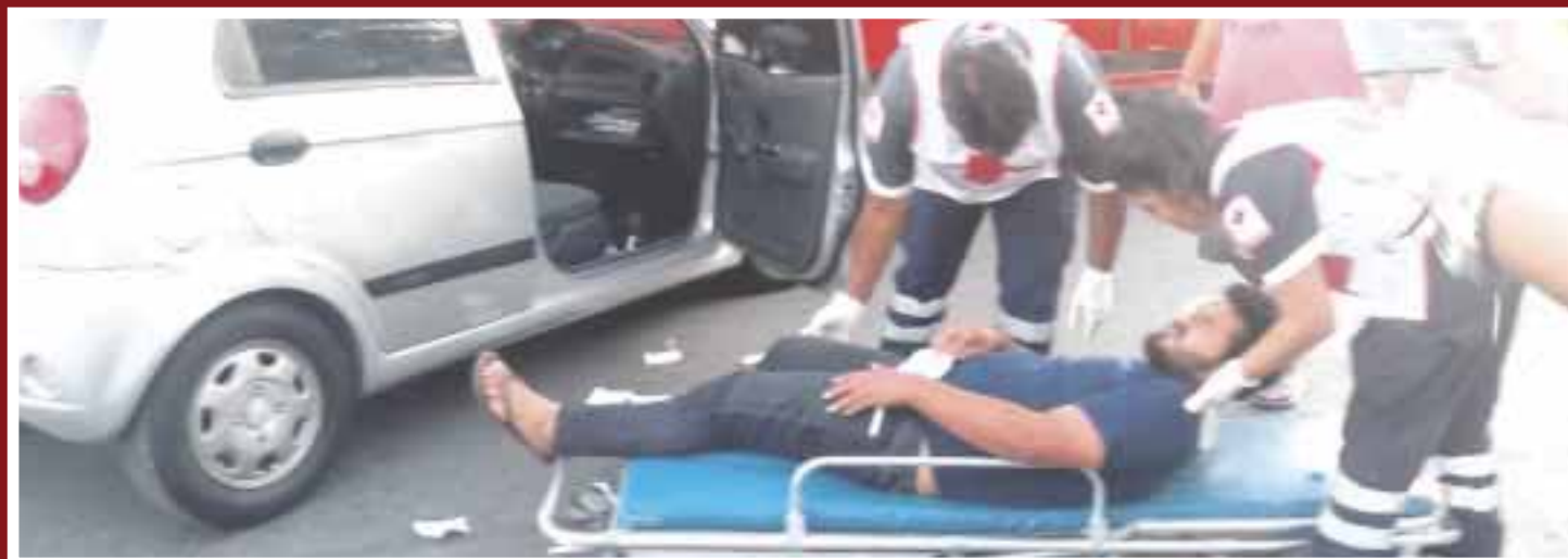
El chofer del camión no respetó la preferencia de un Atos y lo impactó, provocando serias heridas en el conductor y su acompañante.

Chetumal.- Un camión de la empresa Coca-Cola se vuela alto cuando circulaba sobre la avenida San Salvador y al cruzar por la Andrés Quintana Roo no respetó la preferencia de un Atos y lo impactó, provocando serias heridas en el conductor y su acompañante.