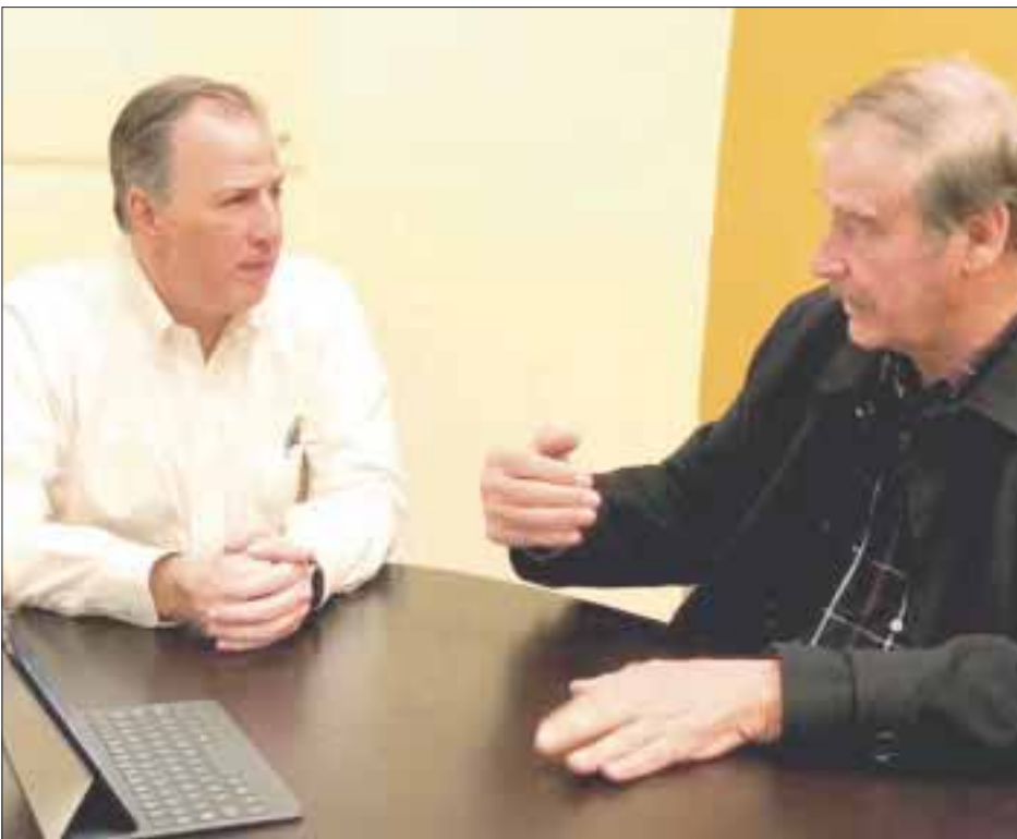
El precandidato del PRI a la Presidencia de la República, José Antonio Meade Kuribreña, sostuvo ayer un encuentro con el ex presidente Vicente Fox Quesada.

José Antonio Meade Kuribreña, precandidato del PRI a la Presidencia de la República consideró sorprendente que en 20 años Andrés Manuel López Obrador no haya encontrado una sola causa a la cual pueda aportar su voz y su capital político.