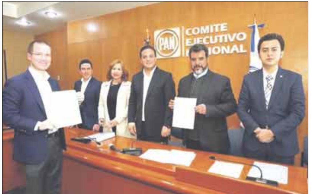
Ricardo Anaya ya es precandidato a la Presidencia de la República.

Durante el registro estuvieron presentes el dirigente nacional del PAN, Damián Zepeda Vidales, y los integrantes de la Comisión Organizadora Electoral del Comité Ejecutivo Nacional.