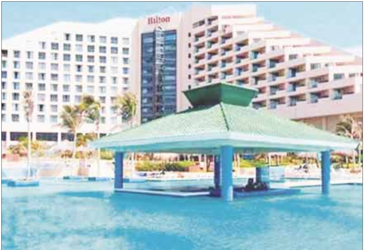
La cadena Hilton abrirá en Cancún dos hoteles e incorporará el lujoso Waldorf Astoria Cancún y el resort de servicio all-inclusive Hilton Cancún a su cartera en México.

La hotelera busca otras oportunidades de crecimiento en Latinoamérica y actualmente posee más de 70 hoteles en desarrollo, entre ellos casi 30 hoteles en México.