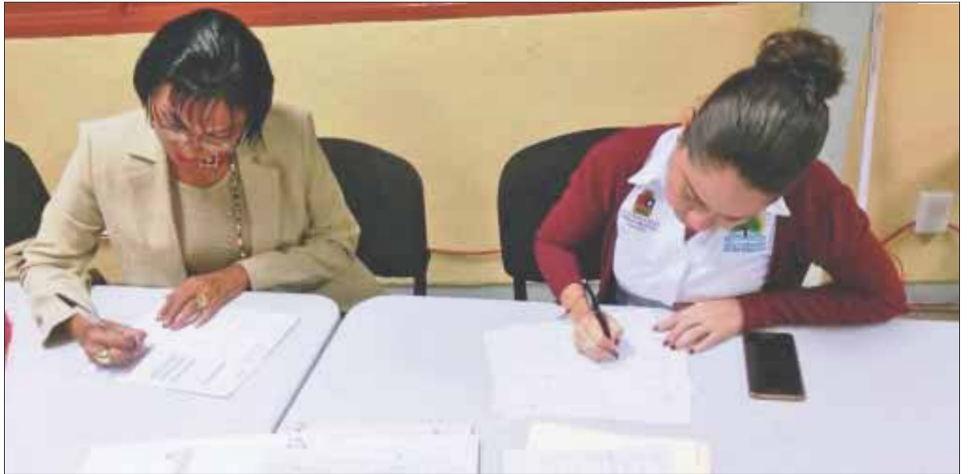
Se realizarán durante el mes de diciembre visitas de seguimiento por parte de personal adscrito a la Subsecretaría de Educación Básica y padres de familia.

Las reglas de operación a las cuales se encuentran sujetos estos programas, estipulan que los responsables operativos de los mismos, deben fomentar la conformación de estos Comités.