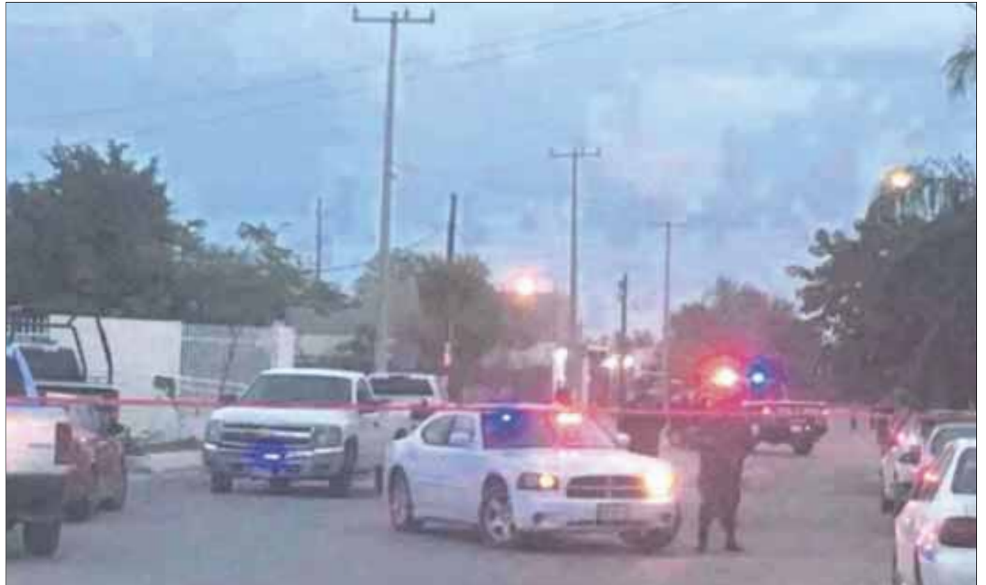
Una movilización policiaca se desplegó en Cadereyta por el reporte de la muerte de un menor por un disparo de arma en una primaria.

Los hechos se registraron en el plantel educativo localizado al sur de Monterrey.