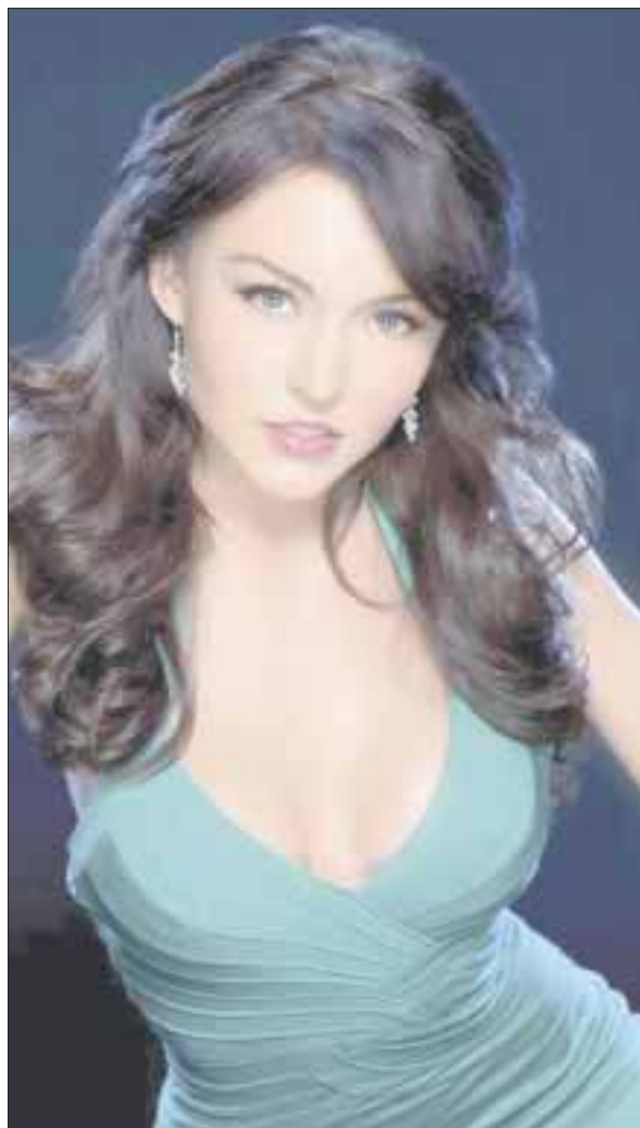
Angelique Boyer reveló que se pondrá a trabajar en la caracterización: “Me voy a poner a trabajar en todo eso, para que antes de que me llamen ya estar lista”.