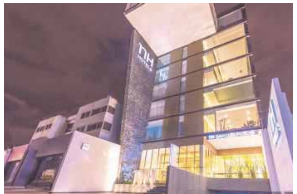
El nuevo hotel en San Luis Potosí.

Actualmente en México, el grupo opera 15 hoteles. Siete bajo la marca Collection : tres en Ciudad de México, dos en