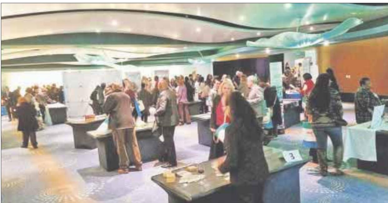
El nuevo Centro de Convenciones consta de 436 metros cuadrados de construcción.

Solidaridad.- Inaugura su nuevo Centro de Convenciones, Paradisus Playa del Carmen, La Perla y La Esmeralda que consta de 436 metros cuadrados de construcción, cuenta con equipo audiovisual para la realización de video blending con el que amplía sus espacios destinados a la celebración de eventos y congresos.