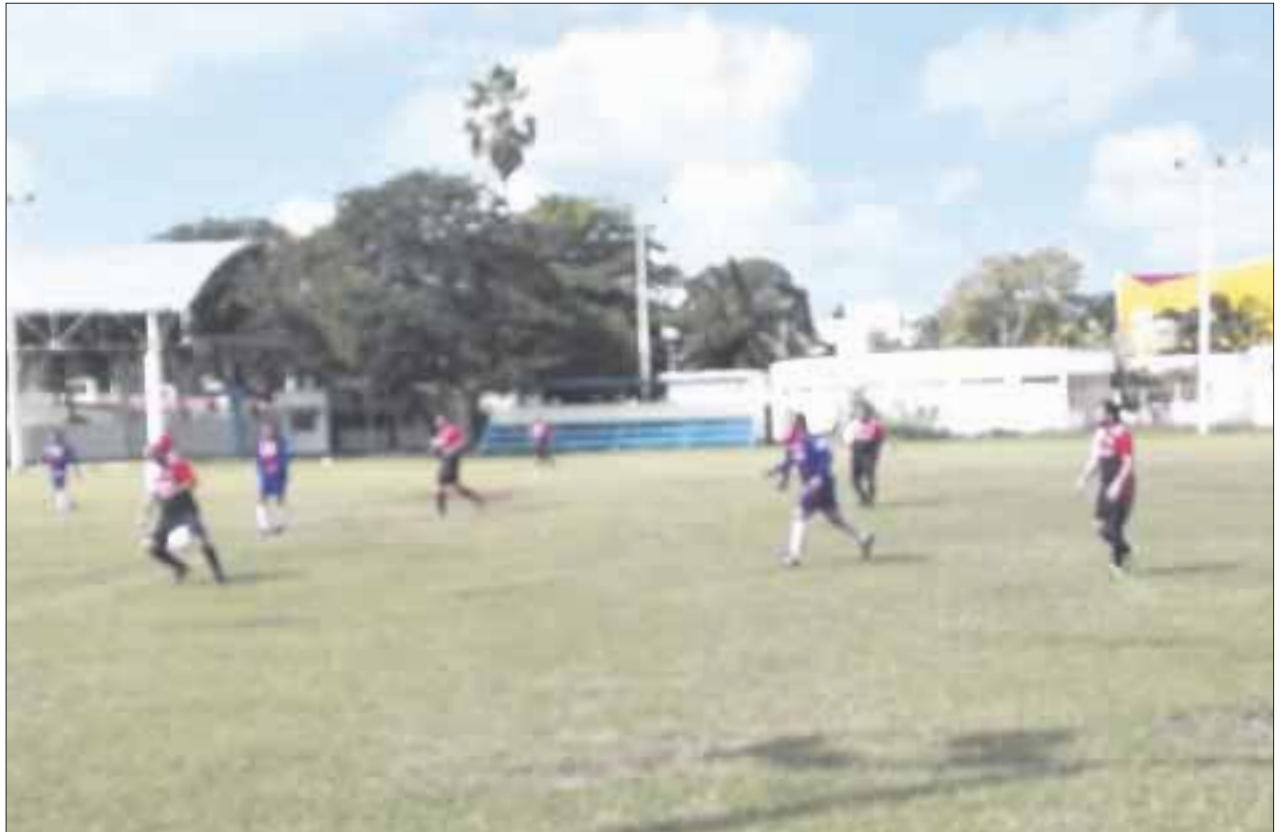
La Liga de Veteranos sigue siendo un espectáculo , no sólo para quienes juegan en su seno, sino para quienes aman el futbol, por la calidad de juego que tienen los veteranos.