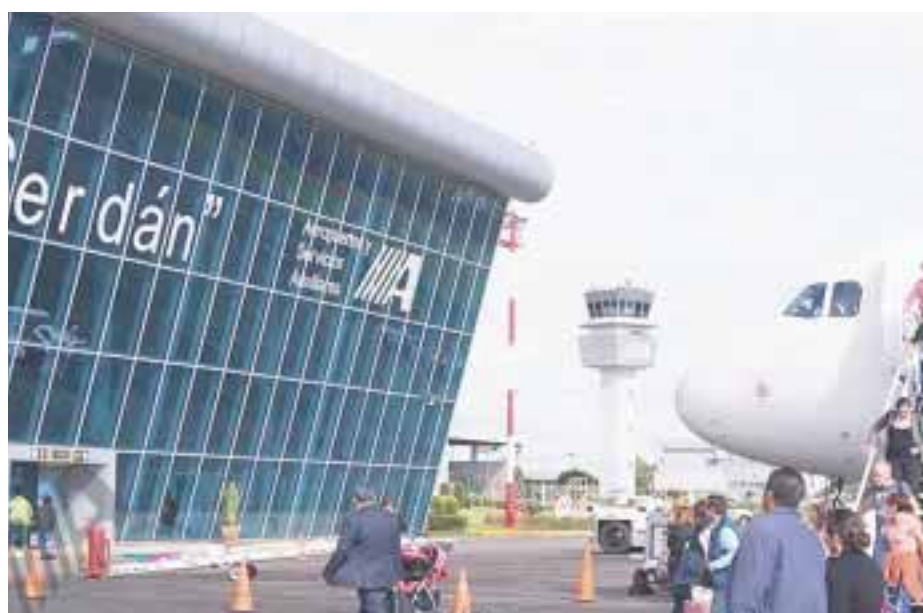
El aeropuerto, en Puebla.