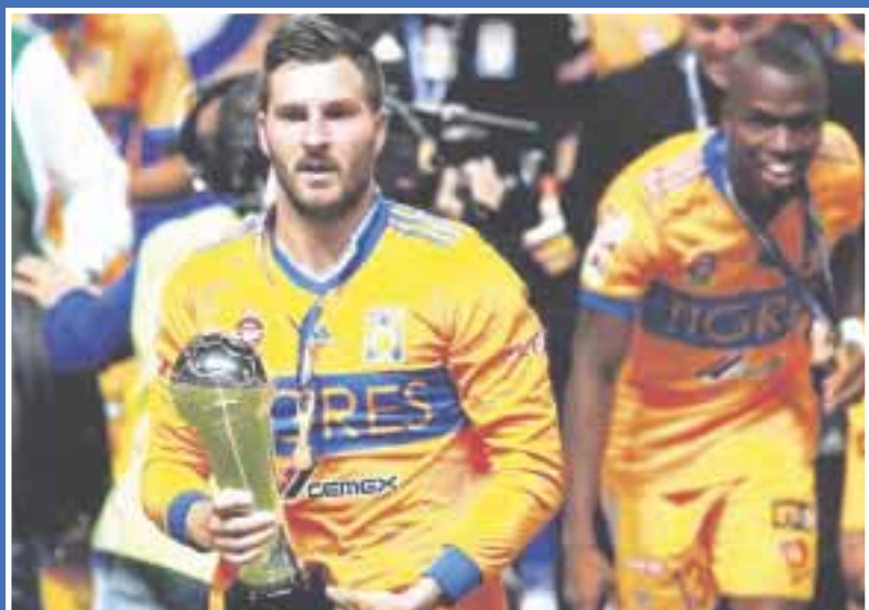
El campeón Tigres estrenará su corona en el arranque del Clausura 2018 ante el Puebla.

El Torneo Clausura 2018 de la Liga MX de futbol dará inicio el viernes 5 de enero y llegará a su fin en la fase regular el domingo 29 de abril, para que la liguilla arranque el miércoles 2 de mayo, en tanto el partido de vuelta de la final se disputará el 20 de mayo.