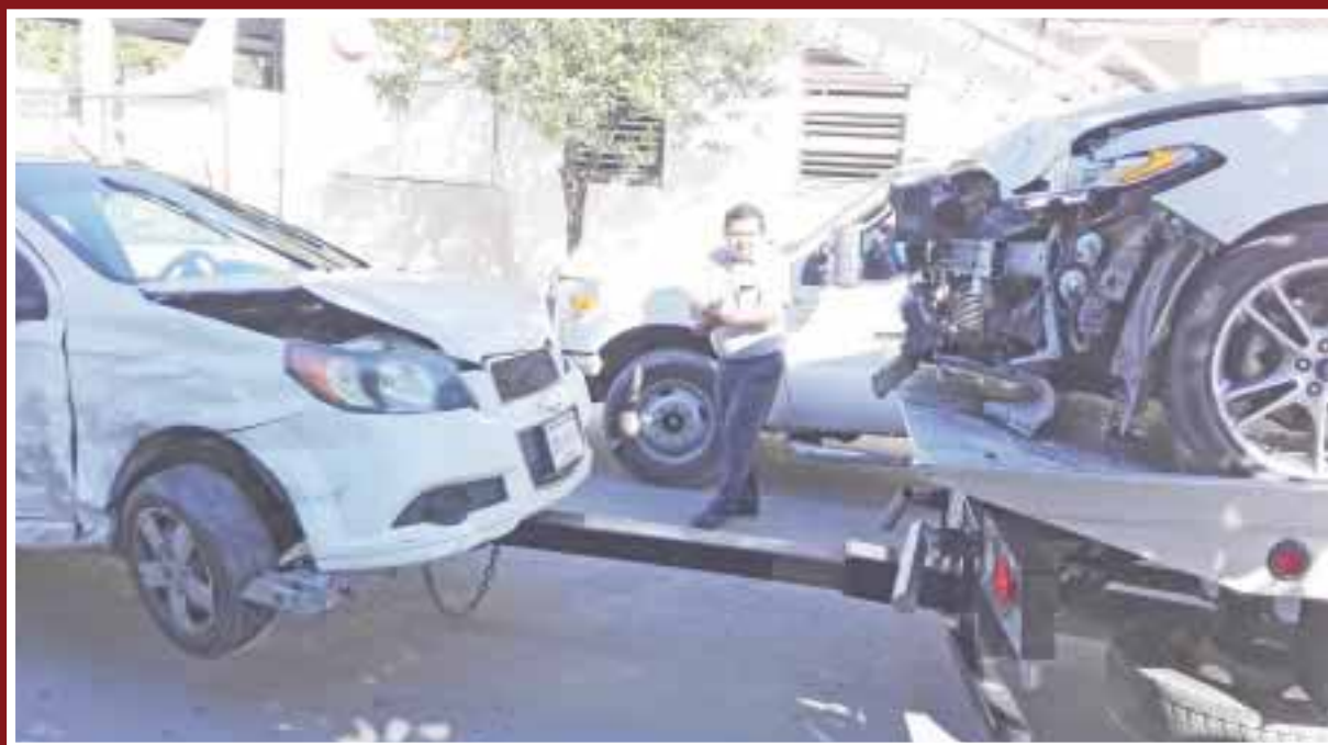
Luego de chocar, el hombre se dio a la fuga, pues sabe que sus vecinos lo conocen y con posterioridad lo atraparán.

Chetumal.- Un individuo de que conducía a exceso de velocidad su automóvil Ford Fusión sobre las calles de la colonia Proterritorio VII Etapa, al incursionar en la calle Crescencio Rejón de oriente a poniente no respetó su alto obligatorio y terminó estrellado un Aveo, con saldo de una persona lesionada.