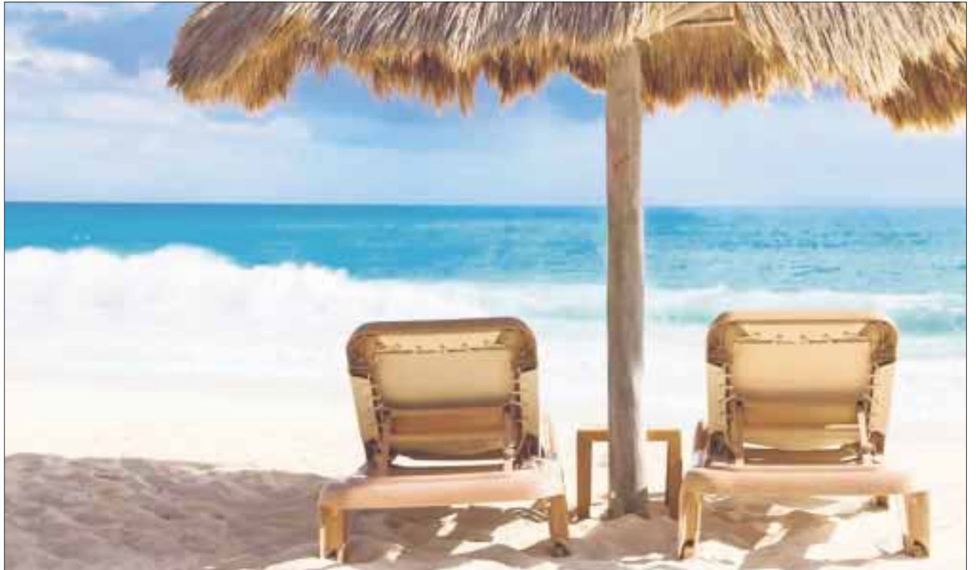
Se realizó una exhibición comercial, a fin de reafirmar al Caribe mexicano como el destino internacional, con la presencia de 140 agentes de viajes de Estados Unidos.

Con el apoyo de Delta Vacations se rifaron 15 espacios para un viaje de familiarización, durante el cual los ganadores conocerán personalmente las bellezas naturales y oferta turística de primer nivel de los destinos de Quintana Roo.