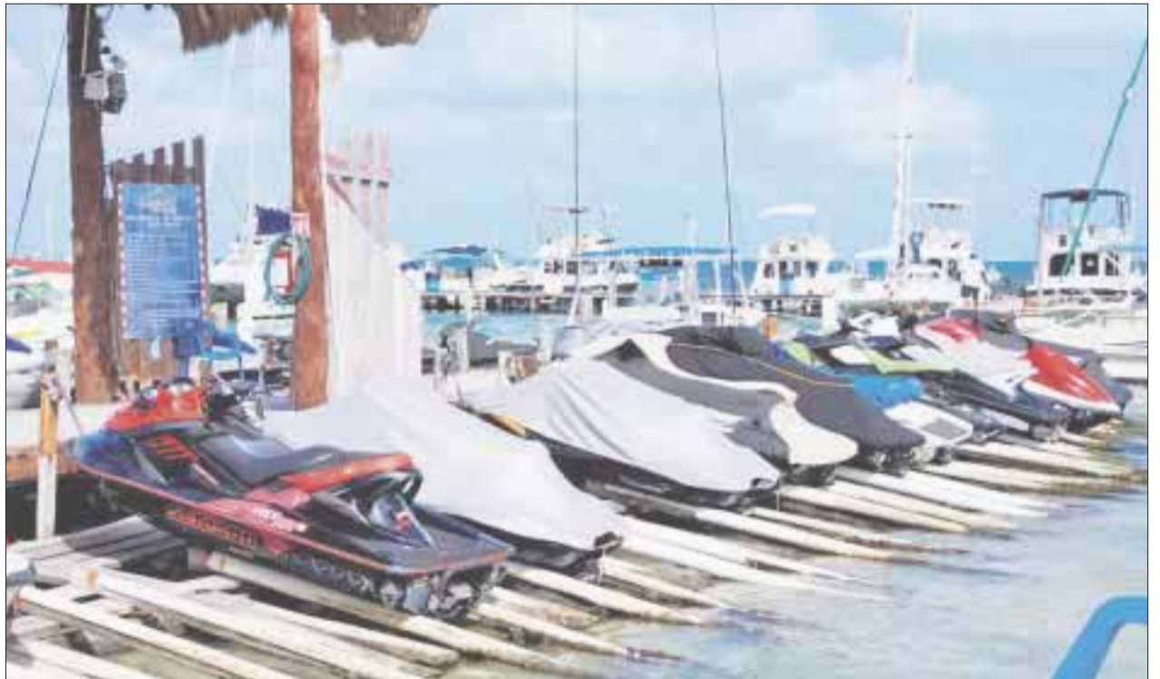
En los últimos días, el sector náutico ha perdido más de 600 mil dólares, a pesar de que mantiene un 85 por ciento de operación.