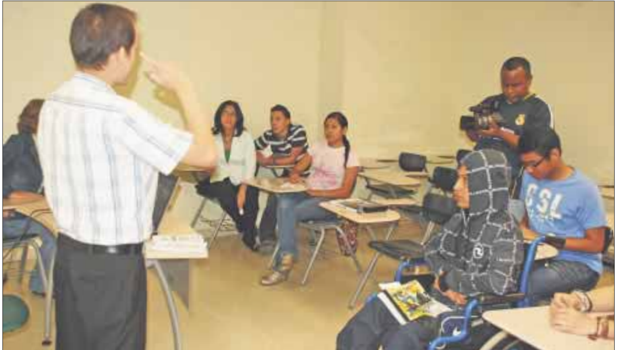
Las ONG's en Quintana Roo exigieron un trato justo a los menores con capacidades diferentes.

Integrantes de la Fundación Pro Síndrome de Down Cancún, precisaron que buscan beneficios, soluciones, inclusión, respeto a sus derechos humanos, temas básicos que sólo se pueden lograr con el apoyo de la SEyC, al entender la importancia de lograr un desarrollo sano y profesional para dicho sector.