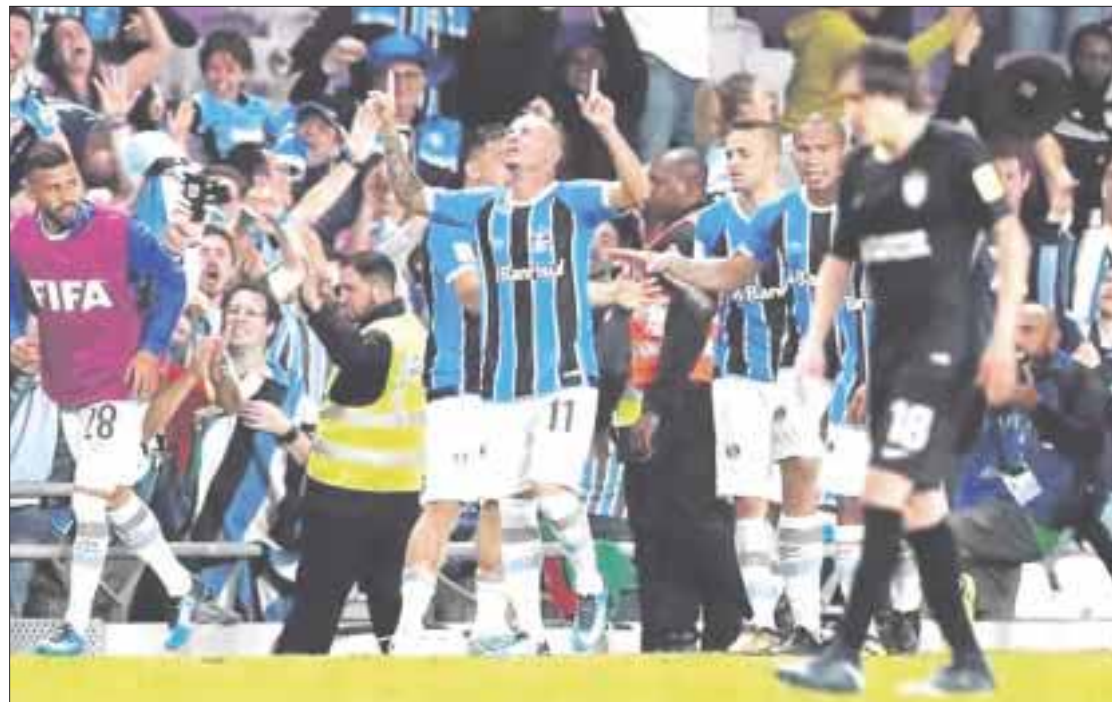
La única anotación del partido del Pachuca contra Gremio de Porto Alegre, fue obra de Everton al minuto 94.

Ambos equipos se neutralizaron durante los primeros 45 minutos en los que se enfrascaron en una lucha férrea en mediocampo, con poca claridad al frente. De hecho, la acción