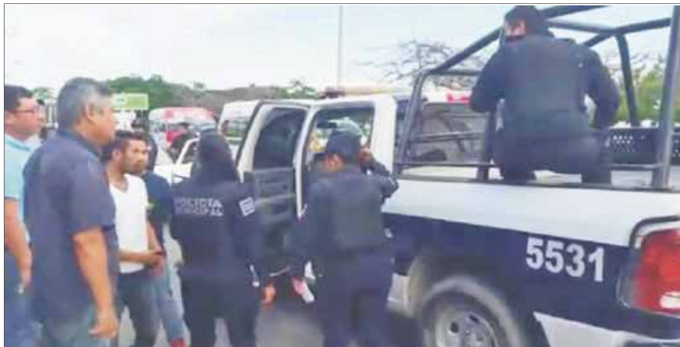
Gracias a la cooperación ciudadana y a los choferes del transporte público, la policía local por fin atrapó a uno de los delincuentes.

Los asaltantes abandonaron el Tsuru en el que se transportaban. Sin embargo, dos de los malandros lograron escapar y uno fue detenido por la policía de Cancún.