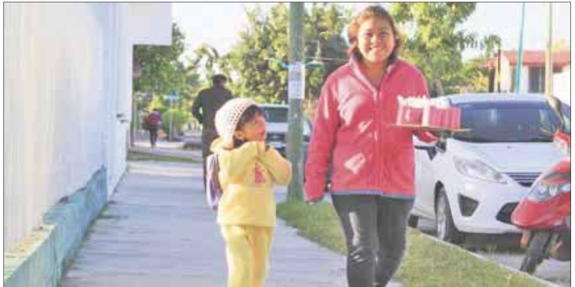
El frío se mantendrá en Quintana Roo por la masa de aire polar continental que provocó el pasado lunes la temperatura más baja del año.

Las condiciones climatológicas se mantendrán por 48 horas, antes de gradualmente perder fuerza, con lo que las temperaturas se recuperarán paulatinamente, hasta lograr el estado el clima que lo caracteriza en la presente temporada invernal.