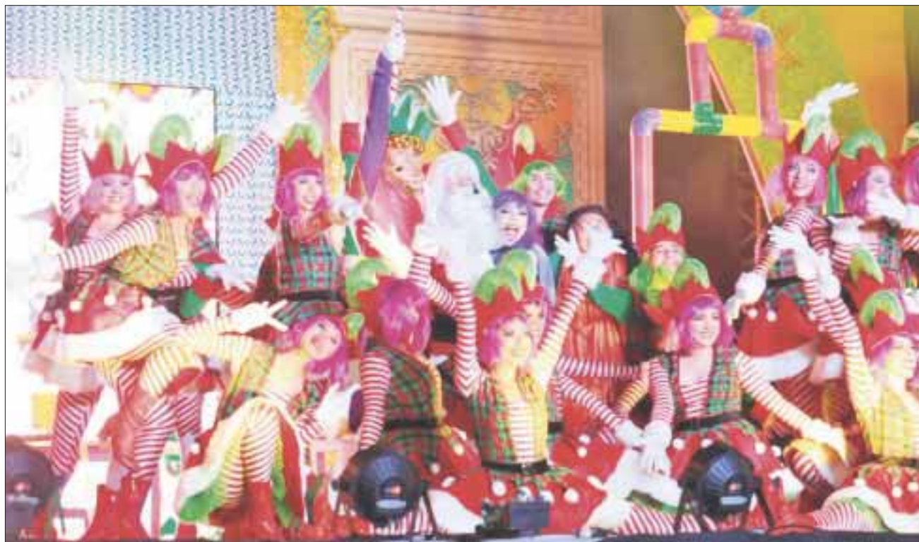
“La princesa de hielo” se presentó el pasado sábado y domingo en Puerto Aventuras y Playa del Carmen.

Chetumal.- “Para el gobernador, Carlos Joaquín y para mí es un compromiso fomentar espacios para la convivencia y unión familiar”, destacó la presidenta del Sistema Estatal DIF Quintana Roo, Gaby Rejón, al invitar a toda la población de Chetumal para que asista a disfrutar del espectáculo “La princesa de hielo” los días 15, 16 y 17 de diciembre en la plaza cívica del Palacio de Gobierno, en funciones de 6 de la tarde y 8:30 de la noche.