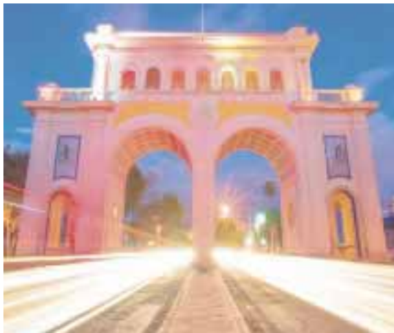
Guadalajara, sede del Corona Capital.

victoriagprado@gmail.com Twitter: @victoriagprado