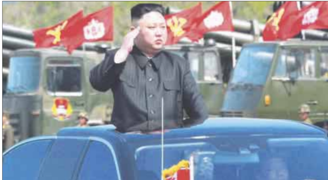
Kim Jong-un prometió convertir a Corea del Norte en la potencia nuclear más poderosa del mundo.

En su discurso para finalizar los días de trabajo de la 8ª Conferencia de la Industria de Municiones, celebrada en Pyongyang, Kim subrayó que el objetivo de su programa nacional de defensa es avanzar y convertir a Corea del Norte en “la potencia nuclear y militar más