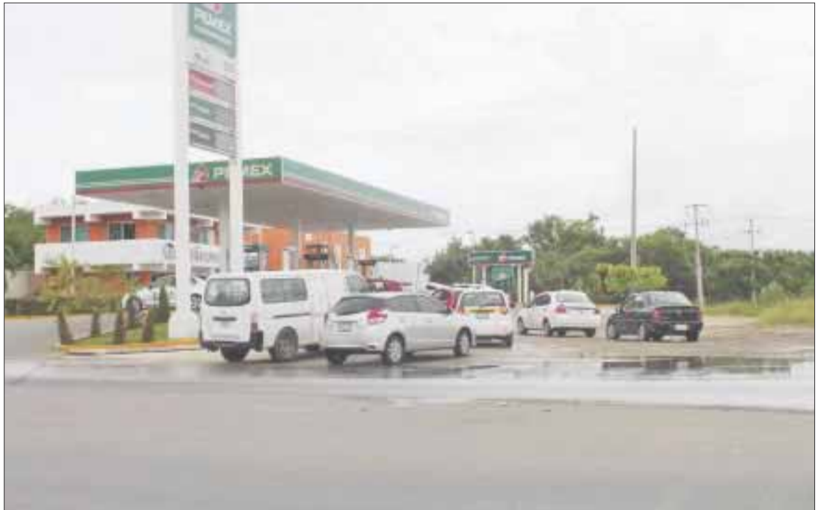
Los expendios de gasolina han informado que en algún momento comenzará a bajar, pero la burbuja no se ha detenido.

La flexibilización es un engaño al bolsillo de los consumidores y en perjuicio de la economía familiar, ya que a la fecha ninguna gasolinera vende más barato el combustible, la variación entre ellas es de de 1 a 3 centavos.