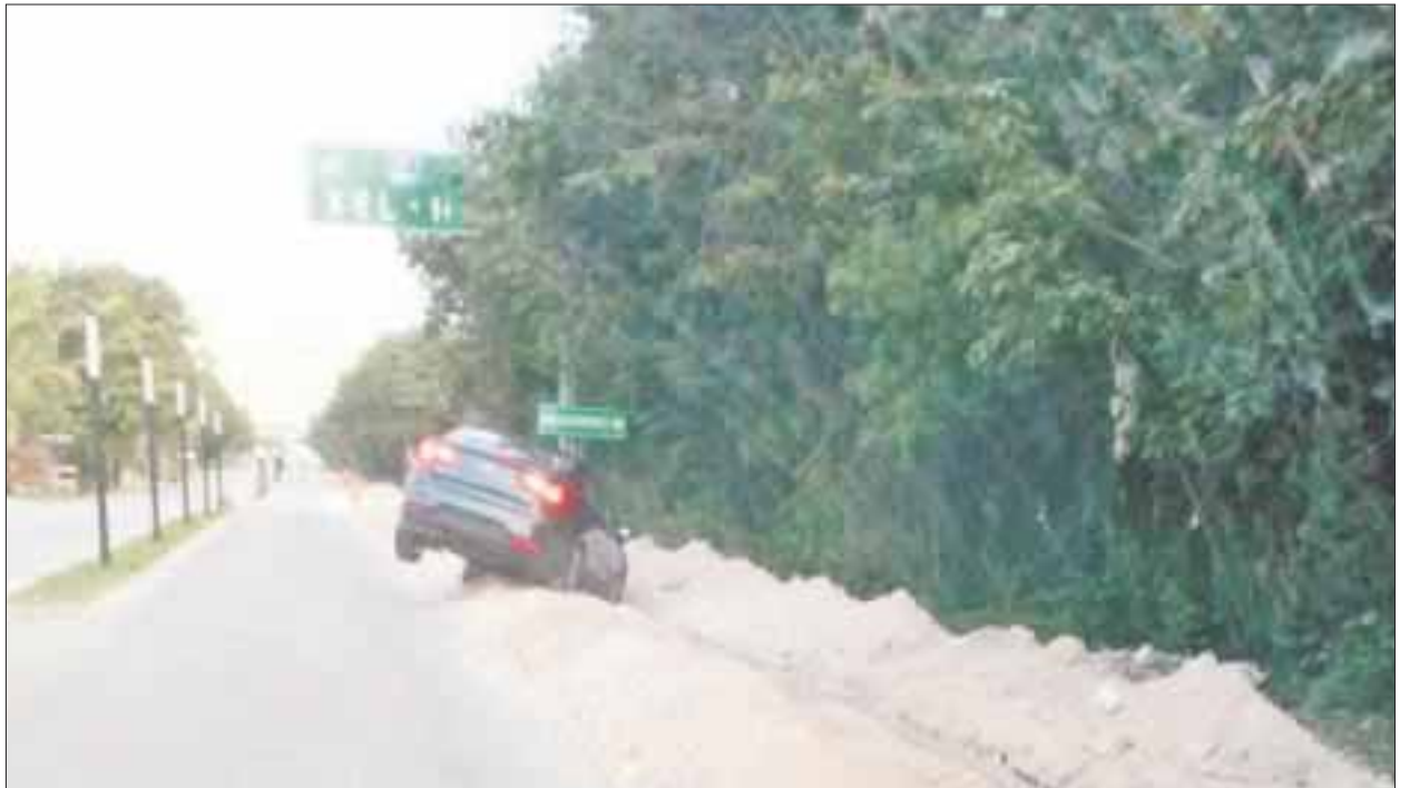
Este automóvil se salió del asfalto por lo resbaloso que se pone la carretera por la tierra que sacan de las zanjas.

Asimismo, lamenta que no les han hecho caso, “porque no los podemos obligar”, dijo el funcionario, quien señaló que ya dio aviso de esta situación a la Dirección de Obras Públicas para que tome cartas en el asunto.