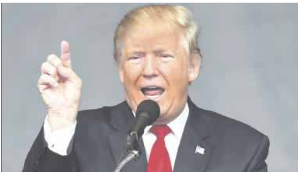
El diario USA Today vilipendia a Donald Trump, luego de su respuesta a las acusaciones de acoso en su contra.

Un importante diario estadounidense devastó ayer al presidente Donald Trump con un editorial fulminante, afirmando que no sirve ni para “limpiar los baños” de la biblioteca presidencial de Barack Obama o sacar el brillo a los zapatos de George W. Bush.