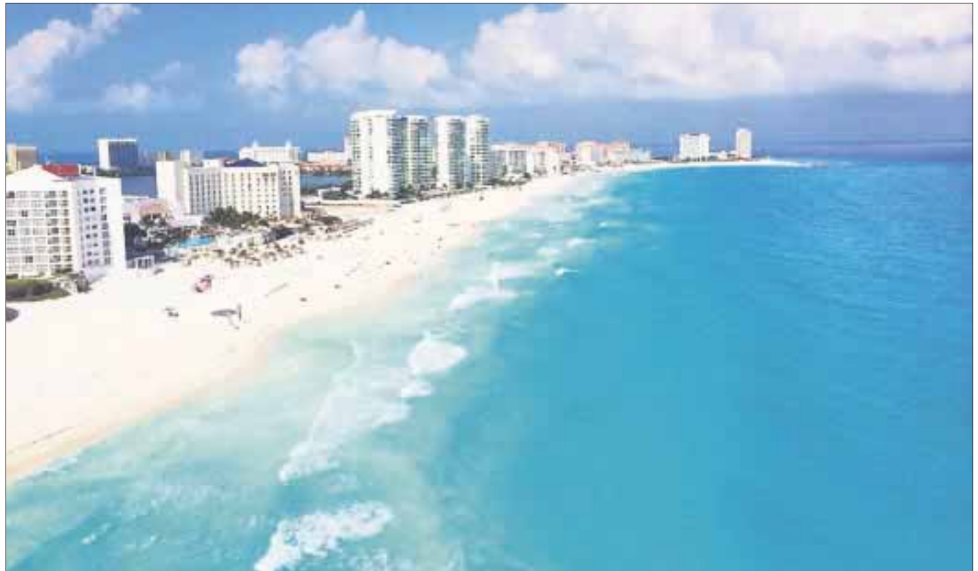
El próximo domingo 17 se llevará a cabo el lanzamiento oficial de la temporada vacacional decembrina en Quintana Roo.

En enero de 2018, la oferta de asientos aéreos a Cancún será de 909 mil 145, lo que representa un incremento de 7.53%, respecto al mismo mes de 2016. Lo anterior permitirá que más visitantes disfruten la gama de destinos turísticos del norte, centro y sur de Quintana Roo y generar derrama económica para pobladores.