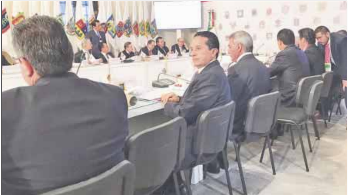
Durante la conferencia, los miembros de la Conago firmaron la Alianza Estratégica para Replicar Políticas Públicas.

Al término de la reunión, el gobernador Carlos Joaquín destacó la importancia de impulsar plataformas digitales que permitan la modernización de los órganos administrativos e impulsar el intercambio de casos de éxito entre los estados que forman parte de la Conferencia Nacional de Gobernadores; lo que se traducirá en combatir la corrupción al lograr simplificar trámites y agilizar gestiones en beneficio de la sociedad.