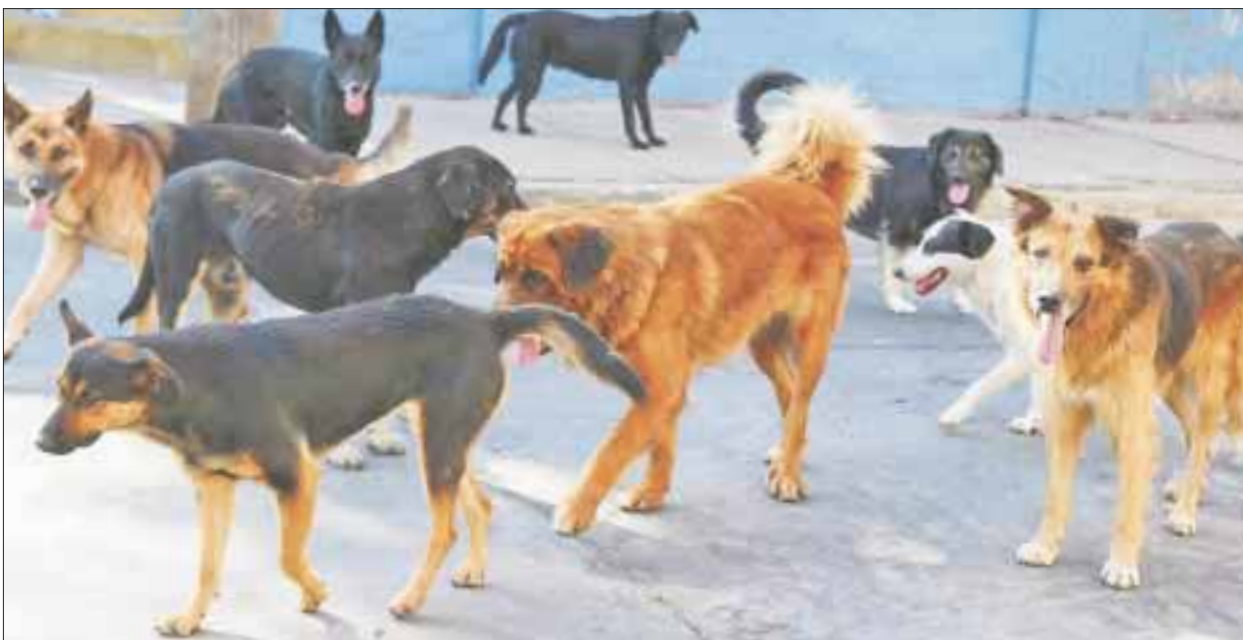
La esterilización de mascotas es urgente en Quintana Roo.

Cancún.- La esterilización de mascotas es un problema urgente en Quintana Roo al no ser una alternativa, al menos para el 50 por ciento de los animales domésticos, ya que sus dueños omiten hacerlo a pesar de que ello garantiza frenar la población callejera.