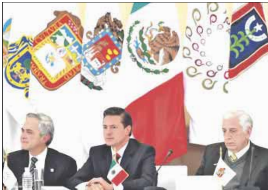
Enrique Peña Nieto ofreció el apoyo del gobierno federal para dialogar y sumar, con pleno respeto a la ley, para hacer de los comicios ocasión de diálogo y de respeto.

Enrique Peña Nieto aprovechó para hacer un resumen sobre el año que culmina y advirtió que, contrario a los pronósticos más adversos sobre la economía "a México le está yendo bien"