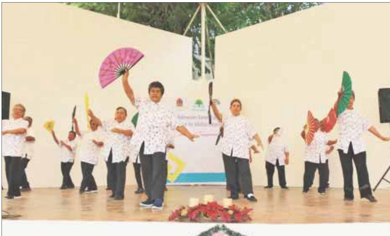
Integrantes de la Estancia de Día del Adulto Mayor y al Club de la Tercera Edad, presentaron un programa artístico de canto, baile y actividad física.

Chetumal.- Se llevó a cabo la clausura de talleres que se imparten a través de la Subdirección de Atención a los Adultos Mayores, lo que es parte del compromiso de la Presidenta del Sistema Estatal DIF Quintana Roo, Gaby Rejón de ofrecer a las abuelitas y abuelitos espacios recreativos, deportivos y culturales donde puedan desarrollar sus aptitudes.