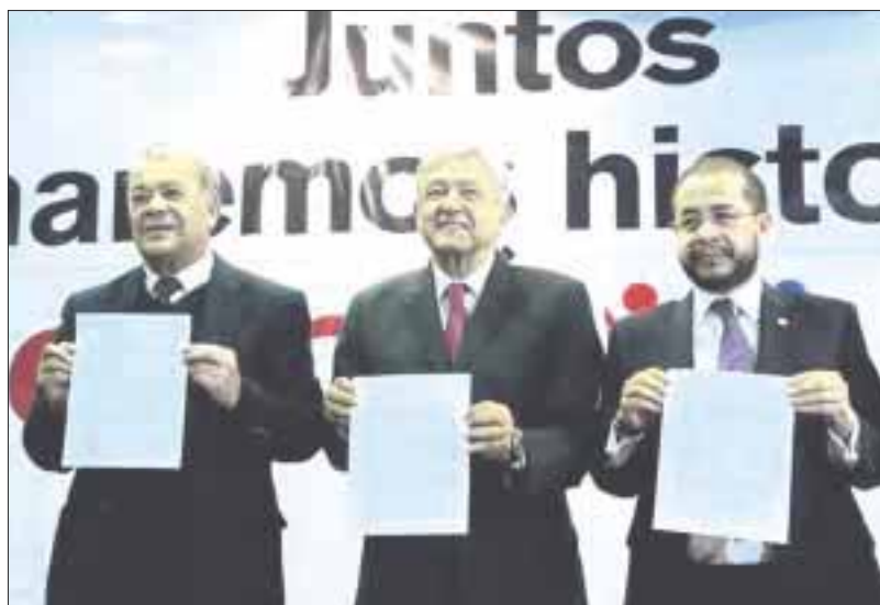
Los presidentes del PT, Morena y PES, Alberto Anaya, Andrés Manuel López Obrador y Hugo Eric Flores, respectivamente, firmaron el convenio de coalición.

El Movimiento de Regeneración Nacional (Morena) y los partidos del Trabajo (PT) y Encuentro Social (PES) formalizaron ir en coalición a las elecciones del próximo año.