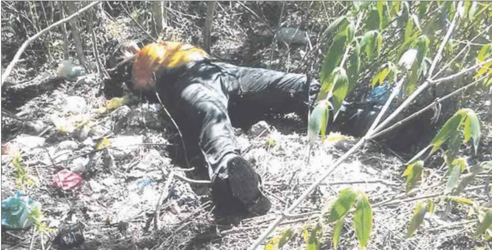
El cuerpo corresponde a un sujeto de aproximadamente 35 años, que ya estaba en estado de putrefacción.

En el lugar hallaron cinta canela y algunas cuerdas