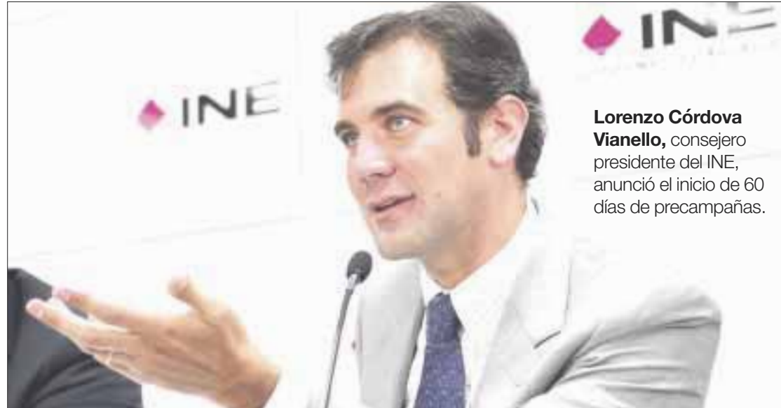
Lorenzo Córdova Vianello , consejero presidente del INE, anunció el inicio de 60 días de precampañas.

toral estarán en juego a nivel federal la Presidencia de la República, los 128 integrantes del Senado y 500 diputados.