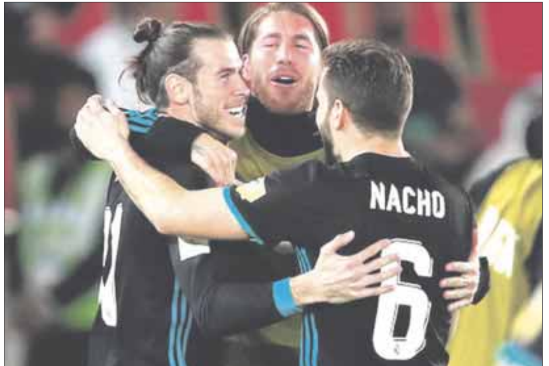
El Real Madrid vino de atrás para vencer 2-1 al equipo Al Jazira y acceder a la Final del Mundial de Clubes.

El portugués se convirtió en el máximo anotador en la historia del Mundial de Clubes con 6 tantos superando a Lionel Messi, Luis Suárez y César 'Chelito' Delgado, que registran 5