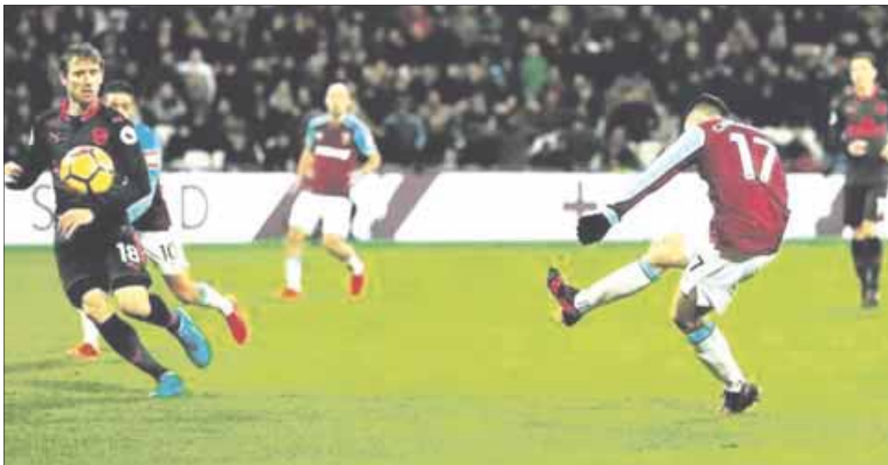
Luego de cinco semanas de ausencia, Javier "Chicharito" Hernández casi logra el gol del triunfo sobre Arsenal.

Javier "Chicharito" Hernández regresó a las canchas con el West Ham United, luego de cinco semanas de ausencia, y casi logra el gol del triunfo sobre el Arsenal.