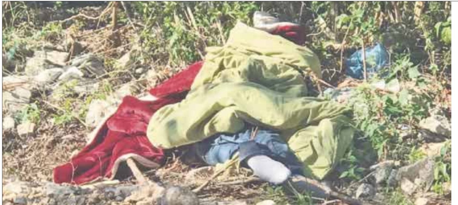
El occiso ensabanado mide 1.75, era de tez morena clara y usaba barba.

En el lugar del hallazgo se observó a simple vista en la orilla de la carretera, un cuerpo envuelto con dos colchas una de color rojo y la otra de color verde, el cadáver es del sexo masculino ya que se observa que está vestido con un pantalón de mezclilla y calcetines con líquido en el rostro.