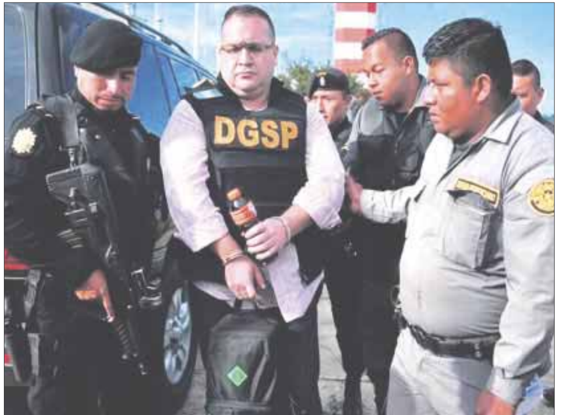
El ex gobernador, Javier Duarte de Ochoa, continuará preso en el Reclusorio Norte, luego que un tribunal federal le negó el amparo.

Pese a la acusación, en enero Duarte de Ochoa se presentará en una audiencia intermedia en la que rebatirá las pruebas de la PGR y la acusación y las cantidades probablemente sean ajustadas.