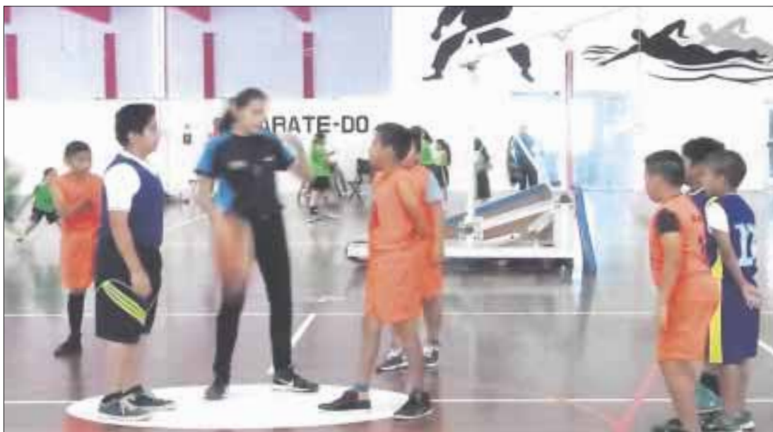
El Torneo Escolar de Basquetbol se llevó a cabo en las canchas del gimnasio Nohoch Sukun.

Chetumal.- Solidaridad se impone 14-10 a Ford 109 en la rama varonil del Torneo Escolar de Basquetbol, celebrado en las canchas del gimnasio Nohoch Sukun, mientras que la Aquiles Serdán le gana a la Belisario.