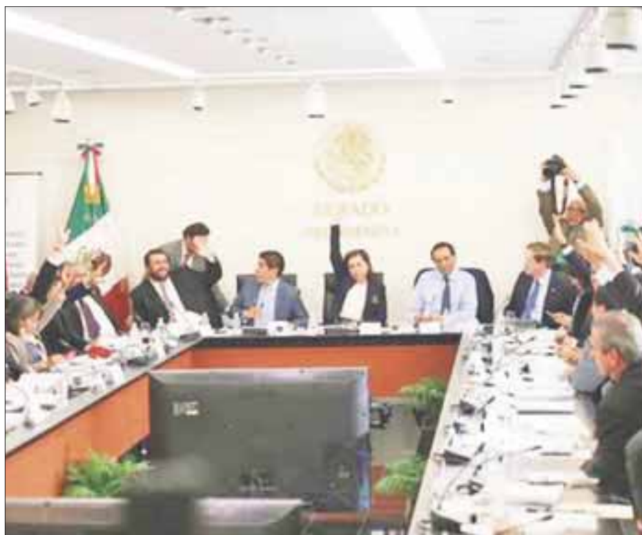
Las comisiones unidas de Gobernación; Defensa Nacional; Marina y Estudios Legislativos Segunda del Senado aprobaron en lo general la Ley de Seguridad Interior.

Tras cinco horas de debate y con los votos del PRI, PVEM y algunos panistas las comisiones unidas de Gobernación; Defensa Nacional; Marina, y Estudios Legislativos Segunda del Senado aprobaron en lo general por mayoría y con cambios. Se avaló el nuevo marco legal que establece las circunstancias, tiempos y protocolos para que fuerzas armadas, es decir Ejército, Marina o Policía Federal, puedan desplazarse en estados y municipios en apoyo a labores de seguridad pública cuando sean rebasados o insuficientes ante el crimen organizado.