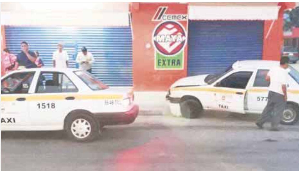
Dos taxistas terminaron su loca carrera en la avenida Constituyentes del 74, entre las avenidas Erick Paolo Martínez y Maxuchac.

Chetumal.- Nuevamente la imprudencia, la falta de precaución y el exceso de velocidad se hizo presente en la avenida Constituyentes del 74 entre las avenidas Erick Paolo Martínez y Maxuchac, cuando dos taxistas terminaron su loca carrera chocando sus unidades.