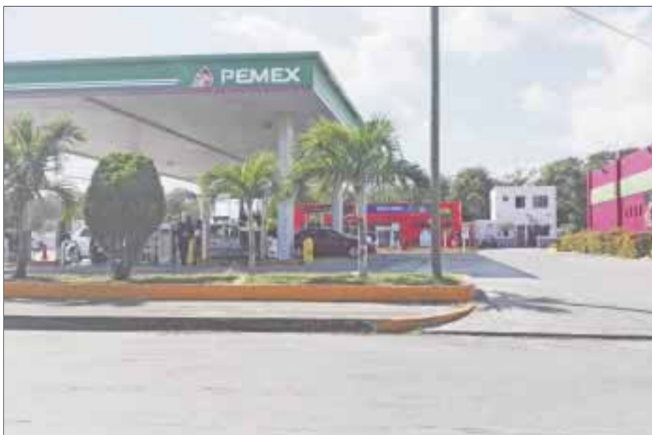
El aumento de las gasolinas diariamente ha causado indignación entre los automovilistas de la capital.

Chetumal.- Encono social y protestas airadas contra el gobierno federal ha causado que la gasolina Premium amaneciera a 17.98 pesos por litro, subiendo 9 centavos para situarse a escasos dos centavos de ofrecerse en 18 pesos, mientras que la gasolina menor a 92 octanos subió 28 centavos.