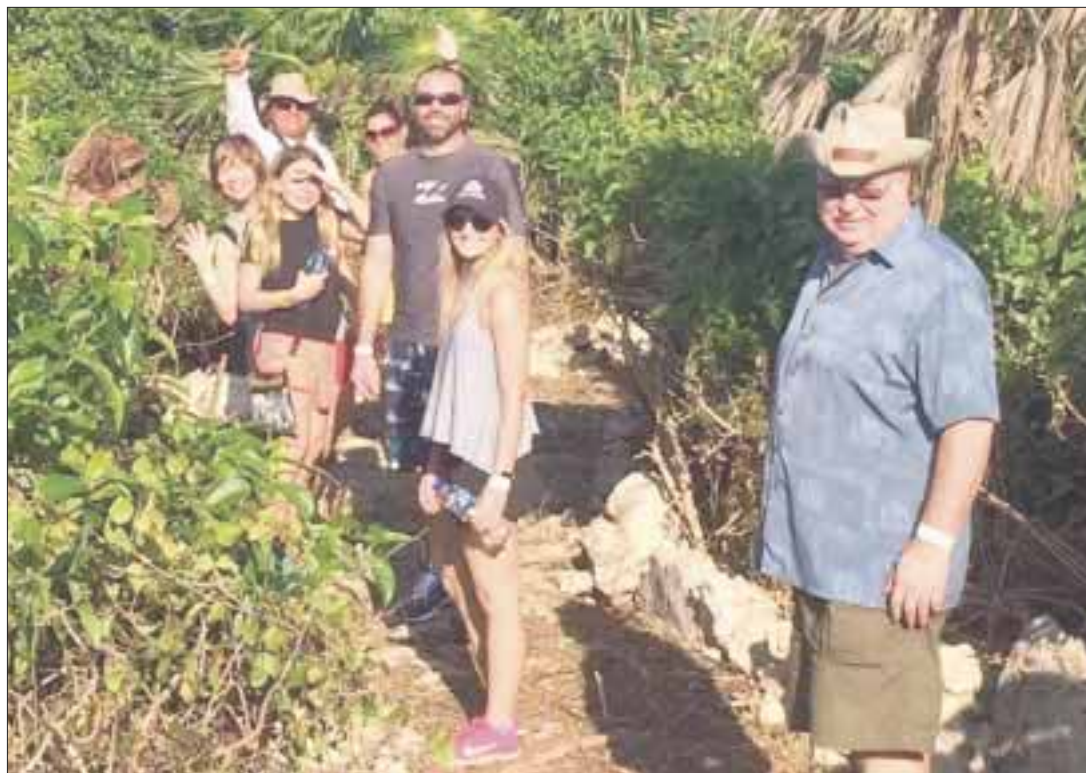
El recorrido incluye conocer las especies selváticas y ofrece una vista del mar en Cozumel.

Cozumel.- A fin de diversificar la oferta turística del Parque Eco-turístico Punta Sur, la Fundación de Parques y Museos Cozumel abrió al público el Sendero de Interpretación Ambiental para brindar más opciones ecoturísticas y ampliar los atractivos para los visitantes.