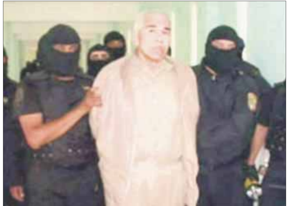
El narcotraficante Rafael Caro Quintero, quien busca no ser extraditado a EU.

El capo logró que la Sala no discutiera el proyecto de Arturo Zaldívar Lelo de Larrea que proponía negarle el amparo y que estaba contemplado discutirse en diciembre de 2016