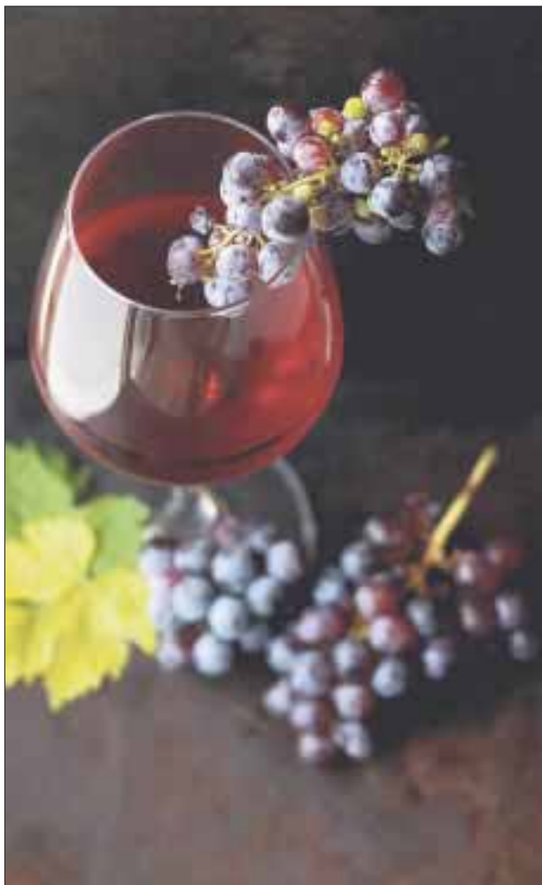
Comer 12 uvas al sonido de las campanadas de medianoche es una de las tradiciones más arraigadas en América Latina durante la celebración del Año Nuevo.