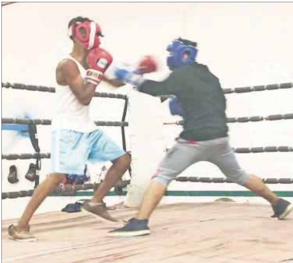
Los pocos gimnasios que existen carecen de apoyo y sólo son parte de la estadística.

Los pocos gimnasios sólo son parte de las estadísticas