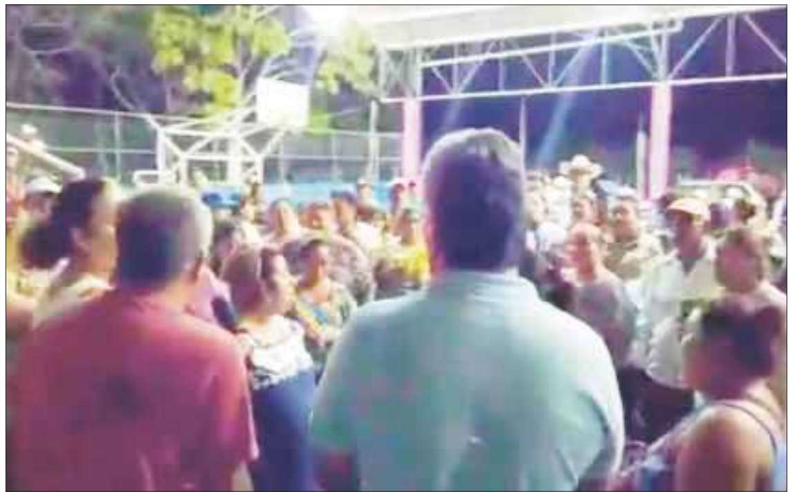
Usuarios amenaza con tomar las instalaciones de CAPA, ubicadas en el Kilómetro 19 de la carretera federal Chetumal-Bacalar.

Madres de familia dieron un ultimátum a CAPA, por lo que se tuvo que presentar el personal operativo de la misma una hora después de haberse iniciado el plantón en el domo de Xul-Ha, y con quienes llegaron al acuerdo de que se les surtirán a partir de este jueves 4 pipas diarias y restablecer el servicio en un tiempo breve (sin fijar exactamente un plazo, pese al malestar general de la gente.