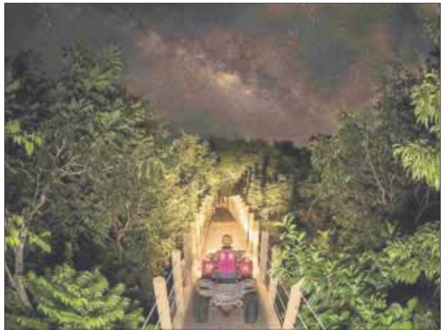
Emotions Jungle Night de Alltournative, es un concepto aliado con la naturaleza

¡Aprovecha esta exquisita costumbre y prepara tus doce uvas para recibir el 2018!