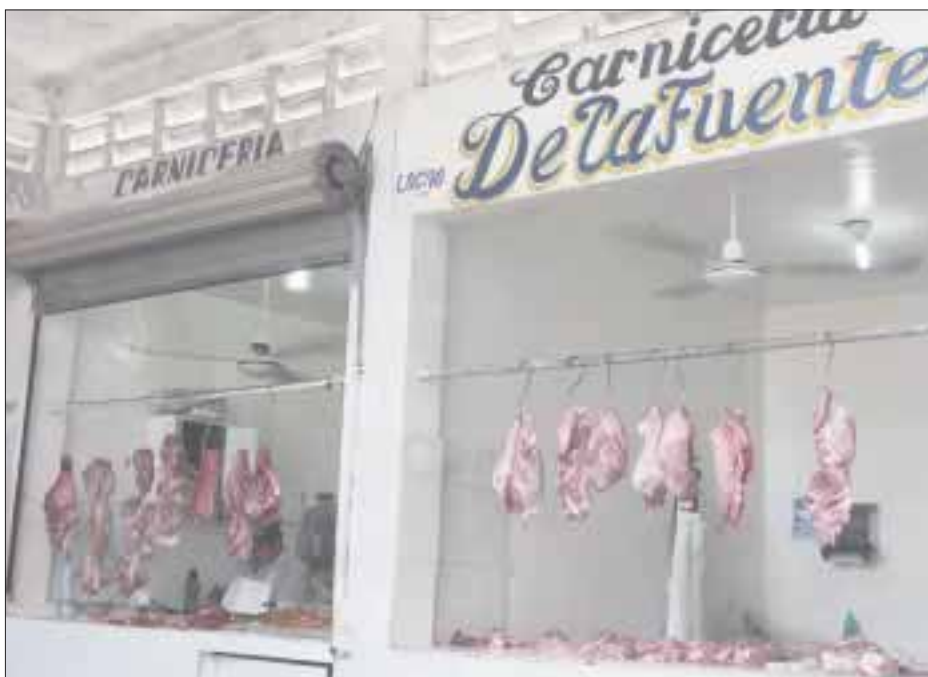
El actual Rastro Municipal deberá dejar de operar, ya que constituye un grave riesgo para la salud el manejo de la carne que se vende en la capital.

Chetumal.- El Ayuntamiento de Othón P Blanco cerrará este 2017 haciendo caso omiso a las recomendaciones hechas por la Dirección Estatal de Protección Contra Riesgos Sanitarios, al no poderse iniciar la construcción de la segunda etapa del Rastro Municipal para hacerlo tipo TIF y no destrabar las negociaciones para el funcionamiento del Rastro de Aves.