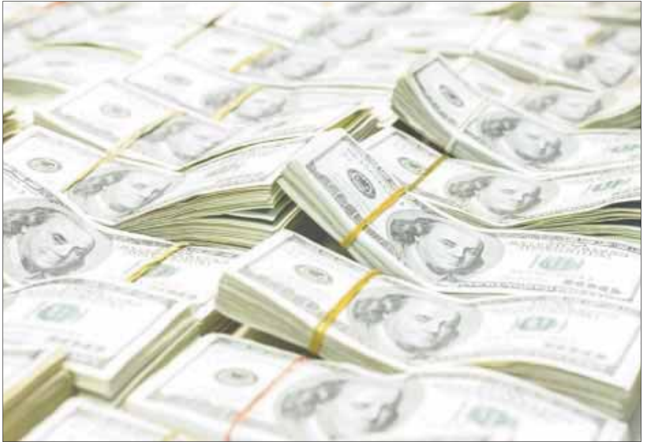
Las reservas internacionales acumulan una disminución de cuatro mil 77 millones de dólares.

En el boletín semanal sobre su estado de cuenta, Banxico apuntó que las reservas internacionales acumulan una disminución de cuatro mil 77 millones de dólares respecto al cierre de 2016