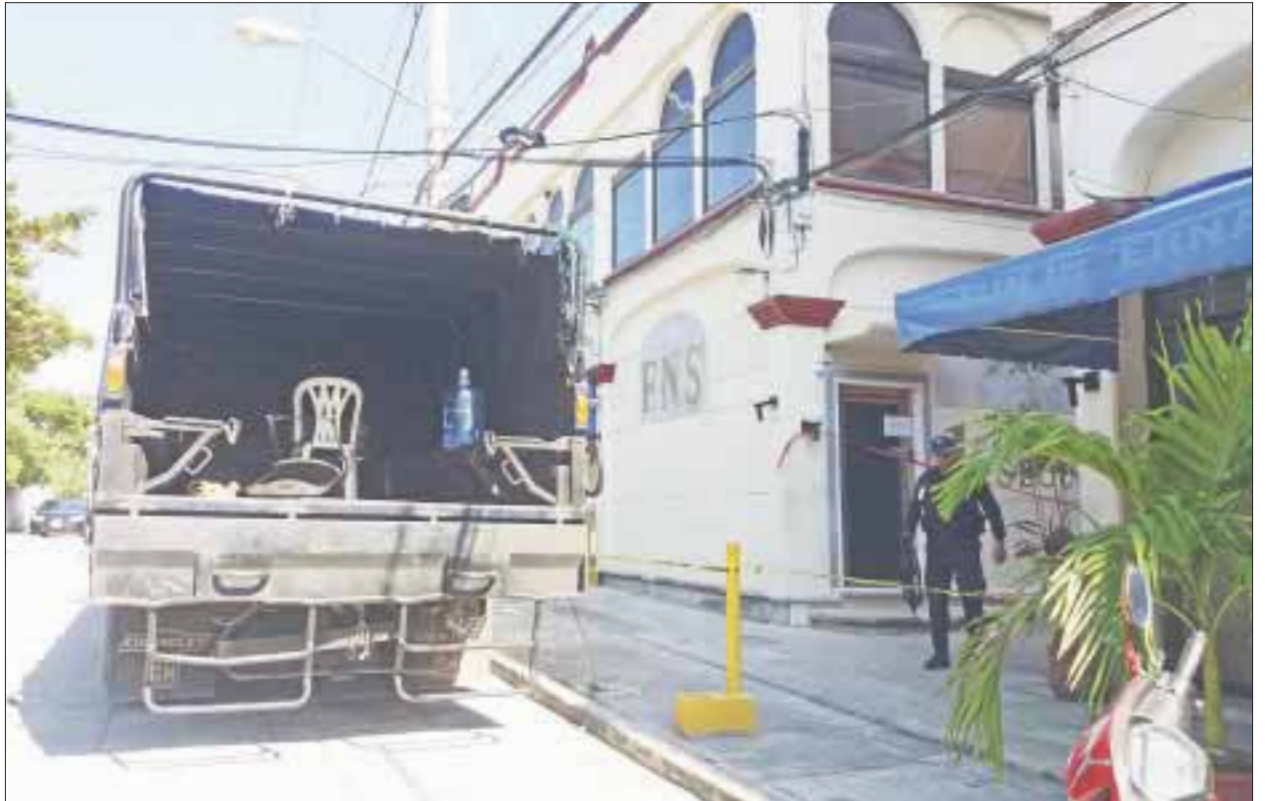
El personal armado de la PGR causa psicosis entre los contados transeúntes que se atreven a caminar por los alrededores de Plaza América.

Se guardan papeles de titularidad de las propiedades que tienen en este polo turístico, tienen que ver con la delincuencia organizada, inclusive se rumora que hay hijos y nietos de gente poderosa de Cancún ex funcionarios que también tienen ahí su "guardadito, estimado en millones de pesos y dólares.