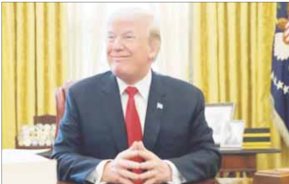
El presidente Donald Trump presumió en Twitter de haber dejado al autodenominado Estado Islámico (EI).

Donald Trump presumió en Twitter de haber dejado al autodenominado Estado Islámico (EI) al borde de la desaparición en Siria e Irak en sus primeros 11 meses al frente de la Casa Blanca.