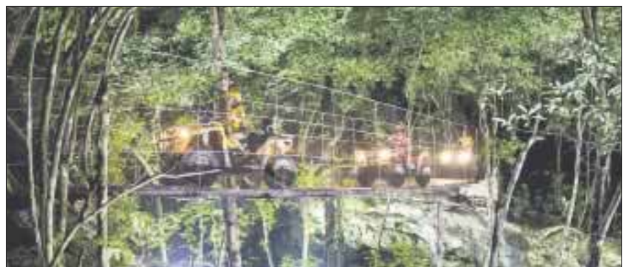
Se podrá realizar una combinación de actividades culturales para acercarse al legado maya y también de aventura