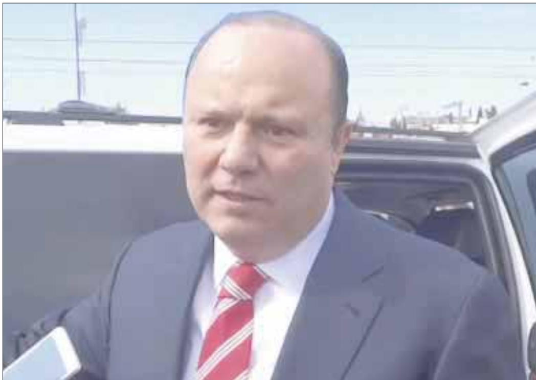
Al ex gobernador César Duarte le han acreditado mil 200 millones de pesos desviados durante su administración.

Autoridades de Chihuahua han acreditado mil 200 millones de pesos desviados durante la Administración del ex Gobernador César Duarte.