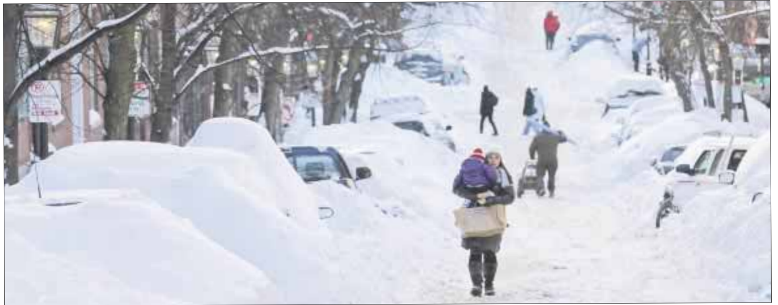
Los meteorólogos advirtieron que nunca han conocido fríos que se instalen durante tanto tiempo en una extensión tan grande.

Según Parent, en este país no se trata tanto de las temperaturas y del enfriamiento cau-