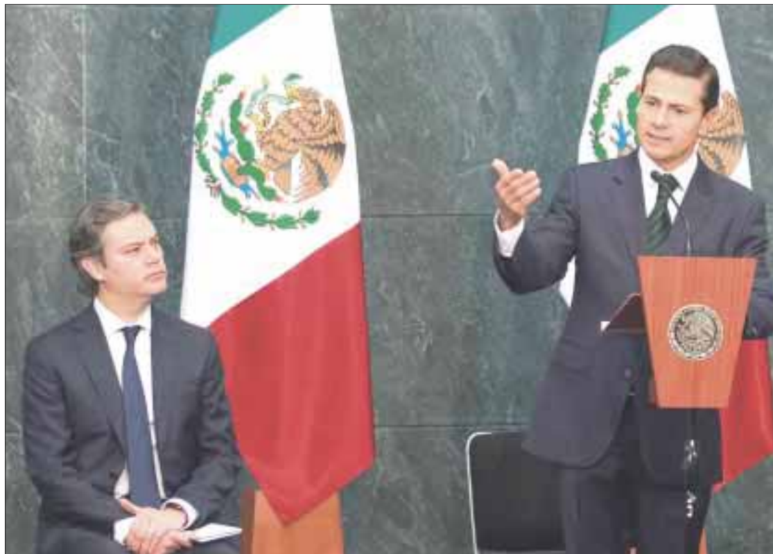
El presidente Enrique Peña Nieto dio instrucciones para reforzar las medidas y protocolos para la revisión de mochilas en todas las escuelas del país.

El modelo se basa en la revisión de títulos obtenidos en el extranjero, para que se revaliden de manera casi auto-