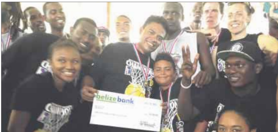
Chetumaleños no fueron profetas en su tierra y cayeron con la frente en alto ante Tiger Sharks de Belice.

Cancún.- Los Tiger Sharks de San Pedro Belice realizaron una verdadera carnicería con la Selección de la Liga Mayor de Baloncesto Varonil de Quintana Roo, a quien derrotaron por score final de 92-72 en la edición 2017 del “Juego de Estrellas” celebrado sobre la duela del Gimnasio de Usos Múltiples “Nohoch Suku’n” de Chetumal.