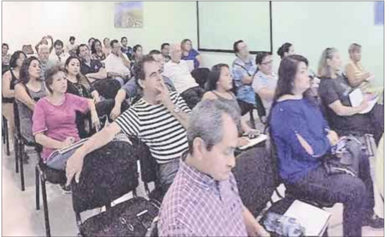
A los dos programas de Nacional Financiera han entrado empresarios de Puerto Morelos, además de emprendedores de otras partes del estado.

Puntualizó que otro producto que oferta Nafin, es el de Ven a Comer, que se da para el sector restaurantero o el dedicado a la realización de banquetes.