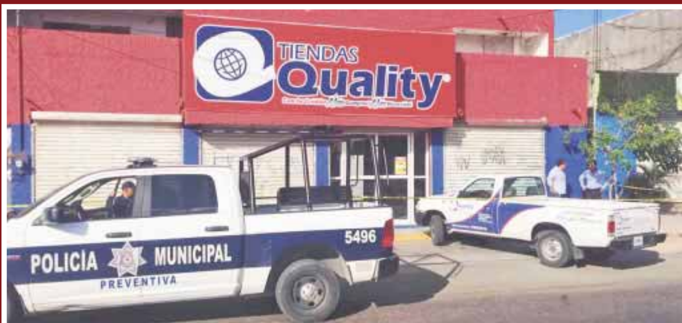
Fue atracada ayer a una tienda de artículos electrónicos en el centro de la ciudad.

Cancún.- Tres sujetos que portaban armas de fuego atracaron ayer a una tienda de artículos electrónicos, donde además maniataron a los empleados.