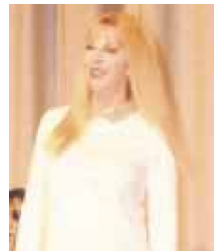
Cada una de las vedettes será entrevistada por la periodista Shanik Berman.

La periodista Shanik Berman declaró: "esto que pasó aquí, el pleito, no va a ser parte de la obra, deben entender que cada una es una estrella, de modo que es difícil tener a cuatro en el mismo escenario. No importa si nos queremos o no, sino que tenemos trabajo y vamos a cobrar, pero