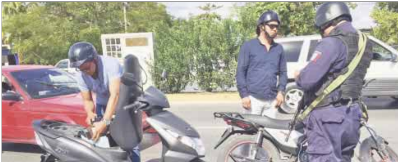
Se mantienen los operativos de vigilancia y revisión de vehículos sospechosos.

Finalmente, refirió que en el caso el incidente reportado en cuanto a una manta, fue atendido de manera oportuna y se realizan las investigaciones pertinentes.