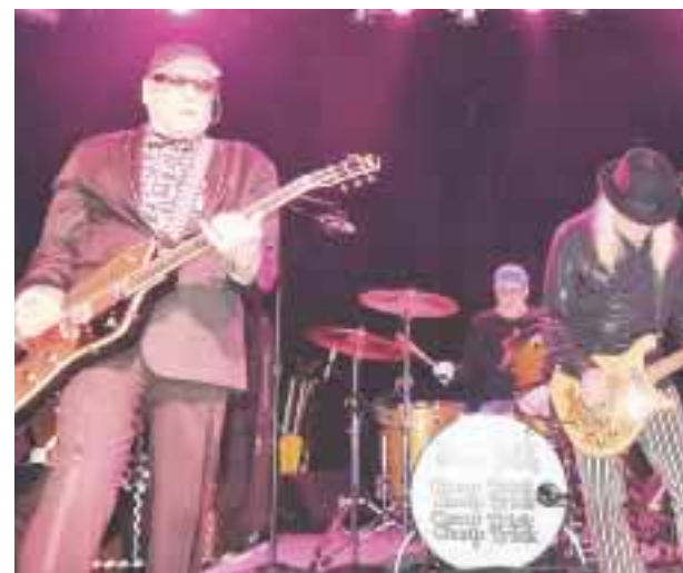
Cheap Trick es un grupo estadounidense de rock banda de Rockford, Illinois, formada en el año 1973.

recientemente Duran Duran, Kool & The Gang, Gloria Gaynor, Chicago, Gloria GaKansas, Foreigner y Toto, así como la cuarta edición anual del Cancun-Riviera Maya Wine & Food Festival’s Tasting Village y otras presentaciones dignas de mención.