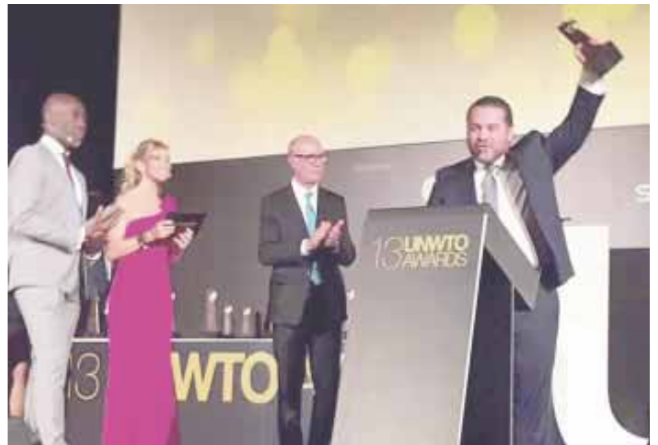
Premio a "Innovación en Políticas Públicas y Gobierno", otorgado por la OMT.