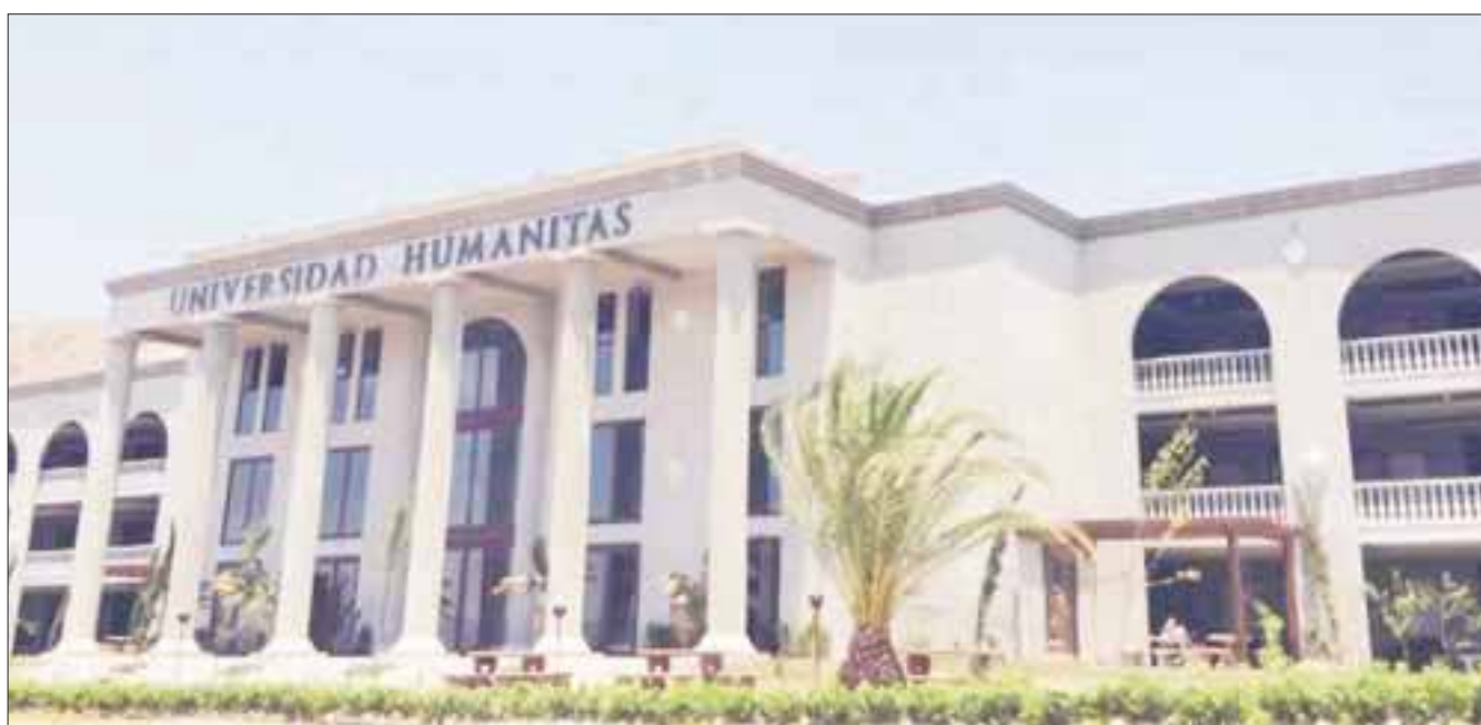
La Universidad Humanitas de esta ciudad puede ser clausurada por falta de reconocimiento de validez de estudios.

Cancún.- Una sanción económica federal e incluso la clausura podría recibir la Universidad Humanitas de esta ciudad, luego de quejas en agravio de los alumnos al sólo contar con la documentación para operar como una casa de estudios en línea y no presencial.