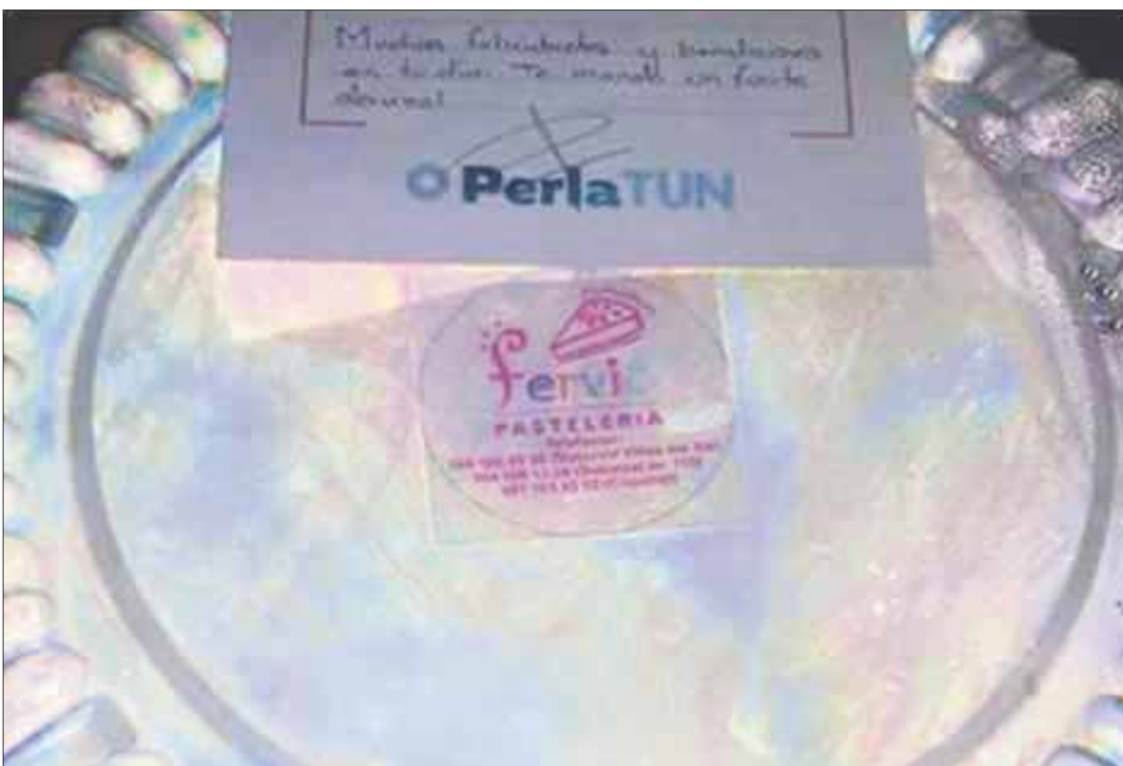
La alcaldesa Perla Tun Pech fue criticada en redes sociales por regalar pasteles a sus amigos por su cumpleaños.