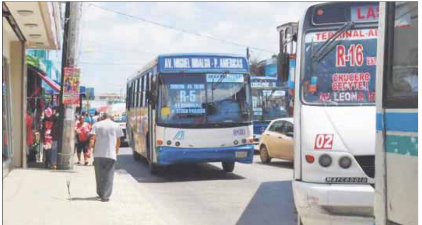
Una sanción de 50 hasta o 100 salarios mínimos y 14 infracciones se aplicó a las empresas del transporte urbano.

Los operativos aleatorios se realizan desde las seis de la mañana, hasta las 12 de la noche en las vialidades en diferentes horarios, en las avenidas Tulum, López Portillo, Ruta 5, Bonampak y zona hotelera, entre otros puntos, donde prestan su servicio las concesionarias Autocar, Turicún, Maya Caribe y Bonfil.