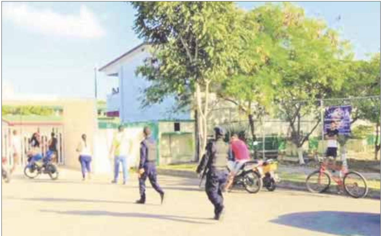
Fueron los vecinos los que alertaron a los padres de familia sobre una narcomanta y que no mencionaba ningún ataque a la propia escuela.

Al lugar llegaron decenas de padres de familia asustados por la información que rápido circuló en redes sociales y comenzó a llevarse a sus hijos a sus casas.