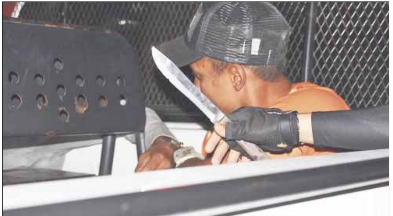
El menor, al momento de ser detenido, portaba un afilado cuchillo con el que presuntamente amagaba a sus víctimas.

Ayer fue trasladado a Chetumal, en tanto se continúan recabando información y datos de prueba para poder fincarle responsabilidad, y que pueda pagar por sus fechorías.