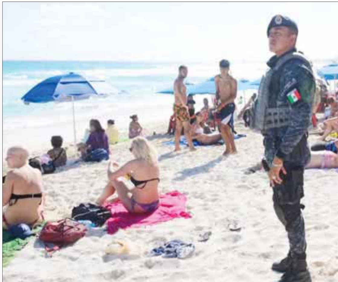
La Secretaría de Seguridad Pública de Quintana Roo ha reforzado la vigilancia en la entidad para resguardar el orden y la tranquilidad,

Por su parte, la Secretaría de Seguridad Pública de Quintana Roo ha reforzado la vigilancia en la entidad para resguardar el orden y la tranquilidad, por lo que se han activado filtros de seguridad y patrullajes en Cancún,