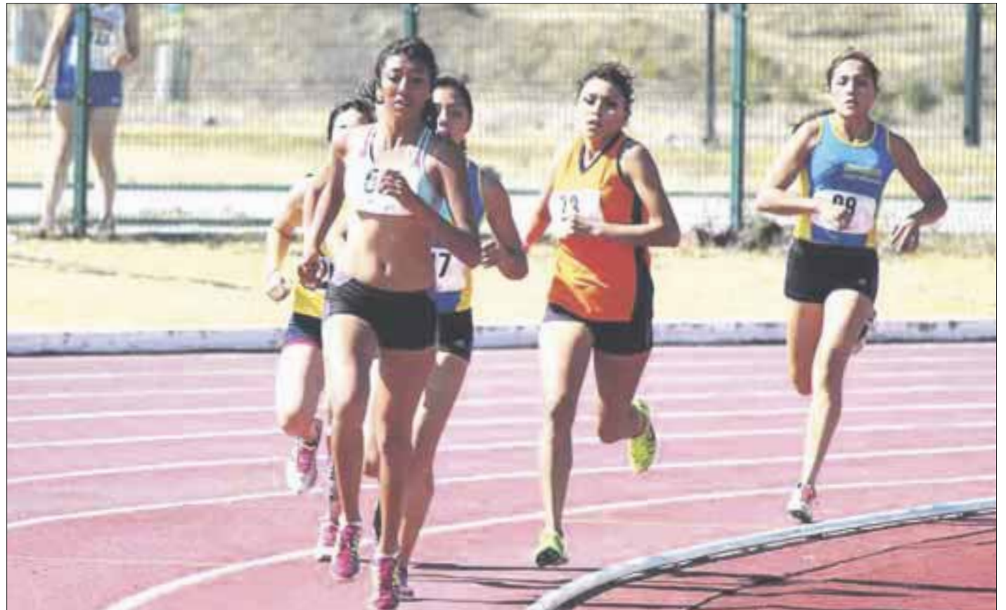
Los deportistas que se quedaron fuera de la Olimpiada Nacional, podrán participar en un cotejo alterno del que todavía se analiza la sede y las reglas.

La propuesta se seguirá estudiando en las próximas horas, sin embargo, para Quintana Roo el impacto inmediato afectaría a cerca de 300 atletas, que a lo largo del año pasado se prepararon con el principal objetivo de llegar a la Olimpiada Nacional, pero con estas modificaciones sus sueños se ven truncados.