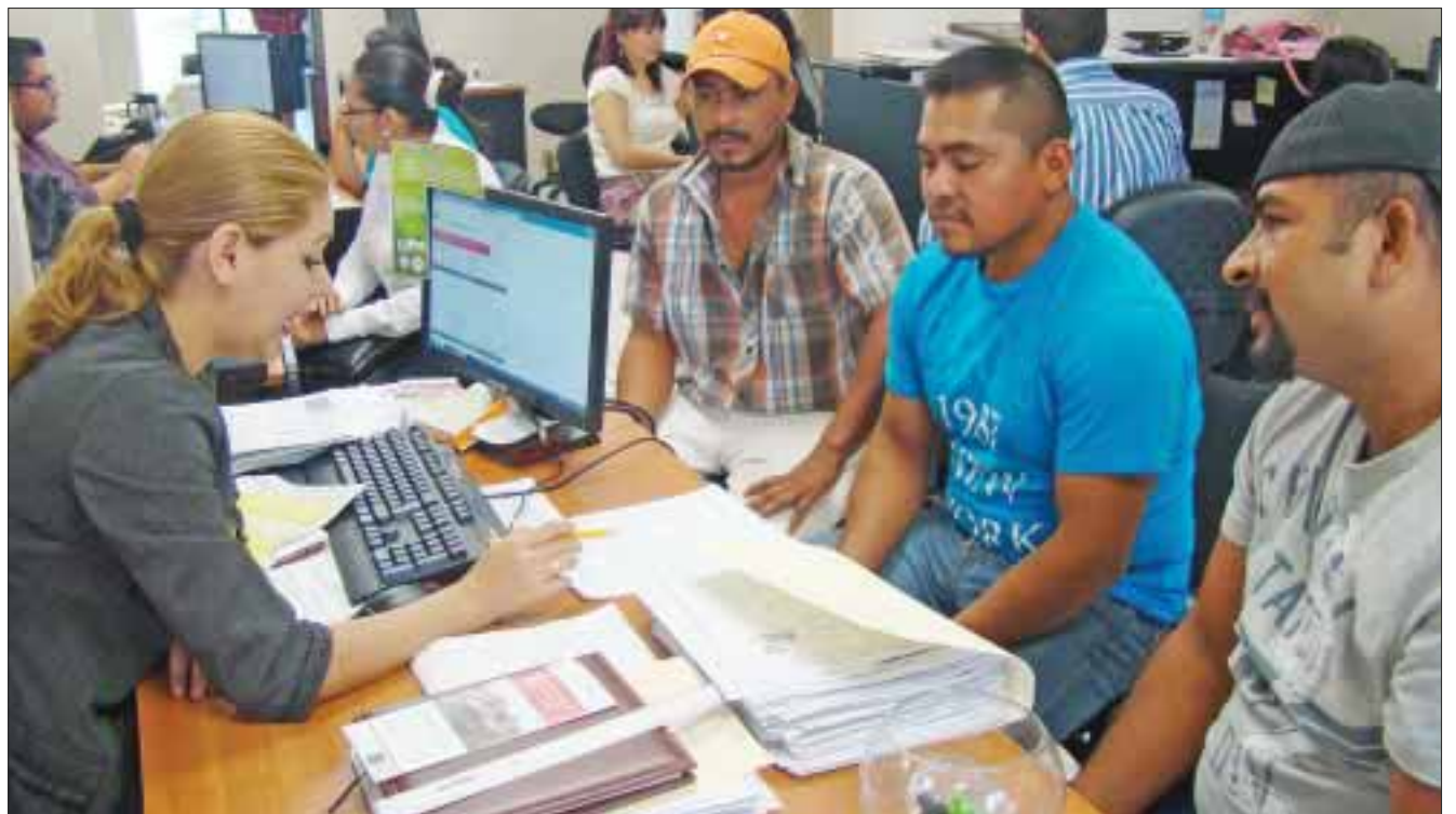
Quintana Roo mantendrá su crecimiento laboral de 30 mil empleos o más, como líder en generación de plazas.

Precisó que se llevaron a cabo ocho días por el empleo, en la que una empresa o más con 50 vacantes promueven esa oferta de empleo dentro de las oficinas estatales en cualquiera de sus sedes, llámese Cancún, Playa del Carmen o Chetumal lo que indica que el inicio del año es favorable.