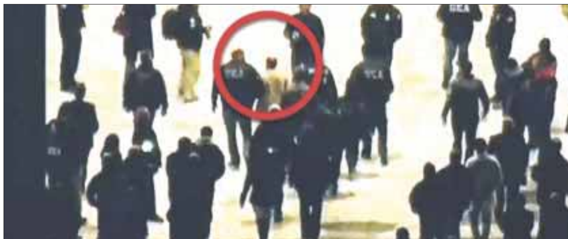
Momentos en que Joaquín Guzmán es recibido por agentes de la DEA en Nueva York.

En estos centros, el delincuente es recluido en una celda solo, en la que pasa al menos 22 horas del día encerrado, sin tener contacto con nadie y en la que es monitoreado y videograbado todo el tiempo y castigado cuando hace algo fuera de lo permitido