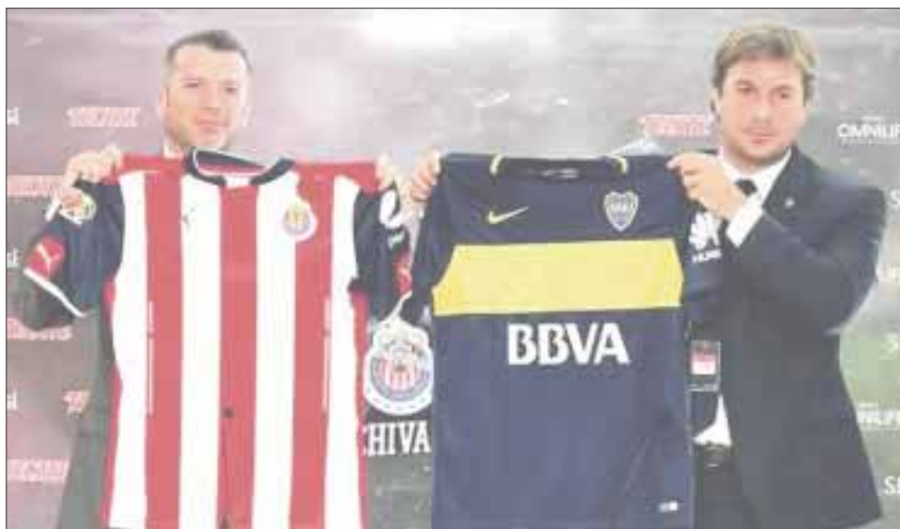
Las Chivas se enfrentará a Boca Juniors el 2 de febrero en la casa del Guadalajara.