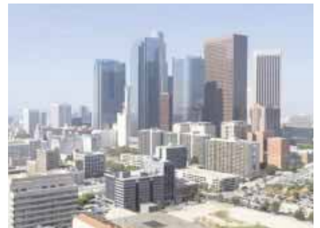
Los Ángeles rompe récord de visitantes.