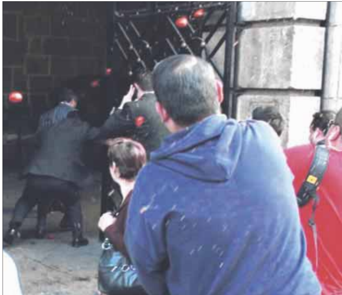
La sociedad mexicana se encuentra indignada y muestra su inconformidad de formas variadas y una de ellas es repudiando a la clase política.