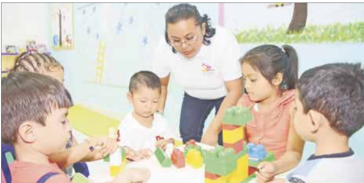
La Secretaría de Educación y Cultura se declaró lista para enfrentar alguna crisis en las escuelas, luego de los rumores en las redes sociales.

Cancún.- La Secretaría de Educación y Cultura se declaró en alerta para enfrentar cualquier crisis en las escuelas, luego de los rumores en las redes sociales por “narcomantas” en escuelas, al asegurar que tanto padres de familia como autoridades están en comunicación constante.