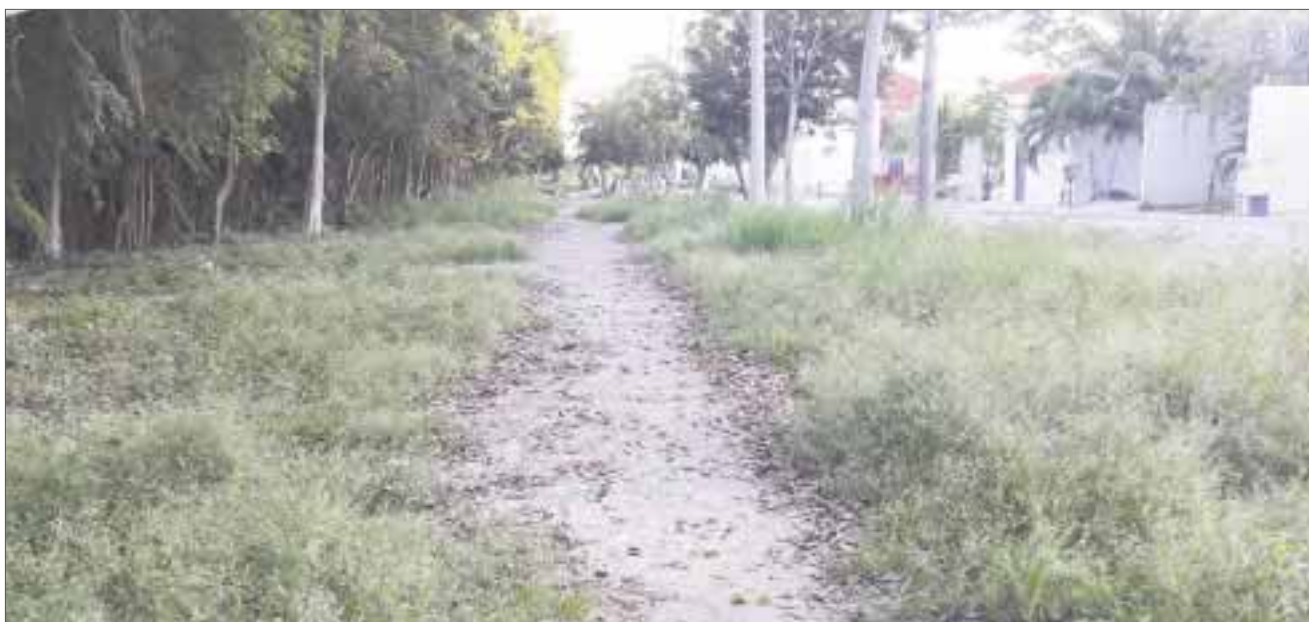
Esta área verde que tiene una longitud de 500 metros, es una guarida de maleantes y rateros, que son una pesadilla para vecinos de la zona.

Cancún.- Habitantes de la supermanzana 529, fraccionamiento Galaxias Itzales, reportaron un área verde que se ha convertido en su pesadilla en los últimos meses.