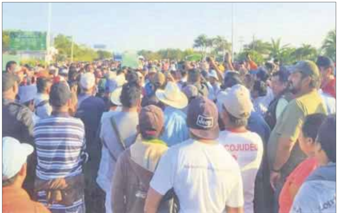
Los campesinos fueron alentados por políticos que pretenden crear problemas al gobierno del estado, pues no tramitaron el seguro de daños.

“En Quintana Roo avanzamos con determinación para estimular el desarrollo de todos con igualdad de oportunidades. No cederemos a chantajes que no tienen un fundamento y que buscan solo desestabilizar la tranquilidad que hemos logrado entre todos los quintanarroenses”, dice el comunicado.