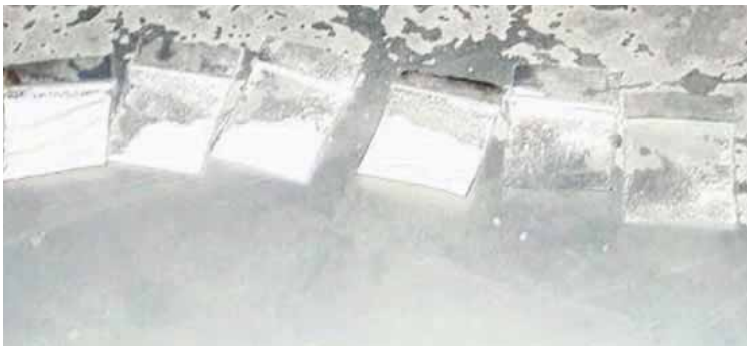
Los dos individuos serán investigados acerca de las redes de distribución de la droga.