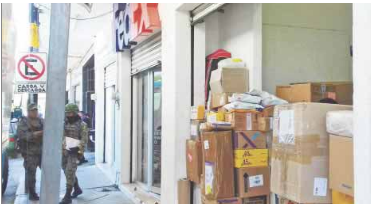
Los agentes decomisaron cuatro cajas gigantes de paquetería que recién descargaban en la oficina de "FedEx" en Chetumal.

Durante el operativo en las empresas de paquetería, trascendieron muchísimas versiones, entre las que destaca que "llegaron paquetes con droga", para repartir entre la población chetumaleña. Sin embargo, no se ha podido comprobar ninguno de esos señalamientos.