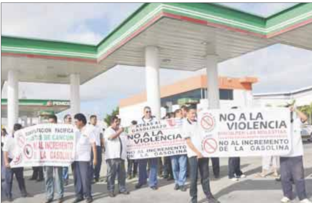
En el caso del Sindicato de Taxistas presentaron 93 amparos para operadores y 33 para socios, debidamente admitidos por la autoridad.

Cancún. - En total fueron 250 vehículos de alquiler del servicio público colectivo y de taxi, más 300 operadores, colaboradores y voluntarios del sindicato de Taxistas “Andrés Quintana Roo” que diariamente participaron durante la estratégica campaña de protesta pacífica: “Atrás al Gasolinazo”.