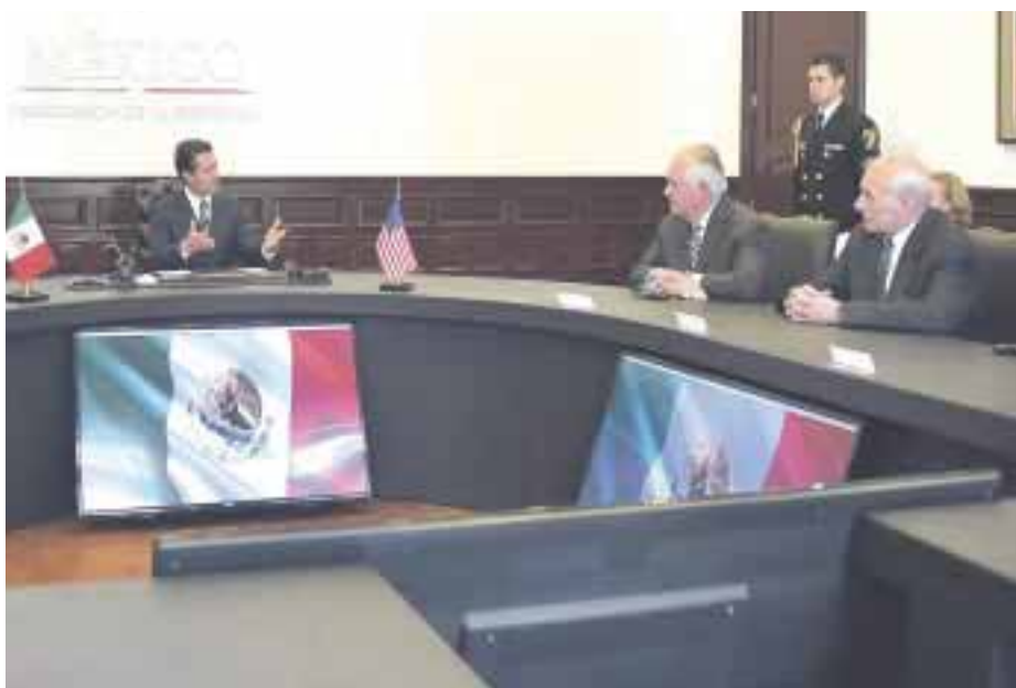
Enrique Peña Nieto hizo énfasis en el valor de la relación bilateral y la importancia de privilegiar el diálogo.

El presidente Enrique Peña Nieto dejó claro a los secretarios estadounidenses de Estado, Rex Tillerson, y de Seguridad Interna, John Kelly, que México siempre negociará de manera integral con un posicionamiento firme y en favor de los intereses del país.