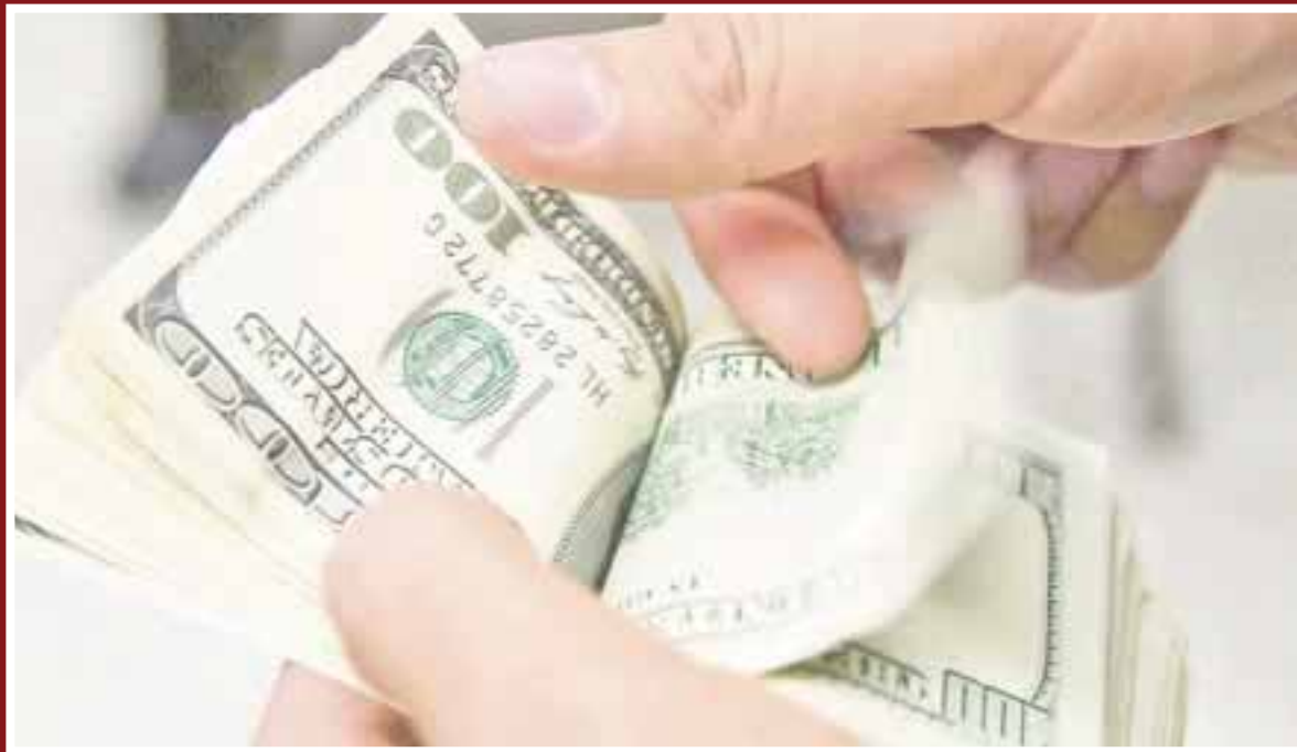
El pasajero llevaba una chequera y un fajo de 114 billetes de 100 dólares falsos.

La Policía Federal detuvo en el Aeropuerto Internacional de Cancún, Quintana Roo, a un pasajero con pasaporte emitido en los Estados Unidos, que en su equipaje llevaba una chequera y un fajo de 114 billetes de 100 dólares falsos.