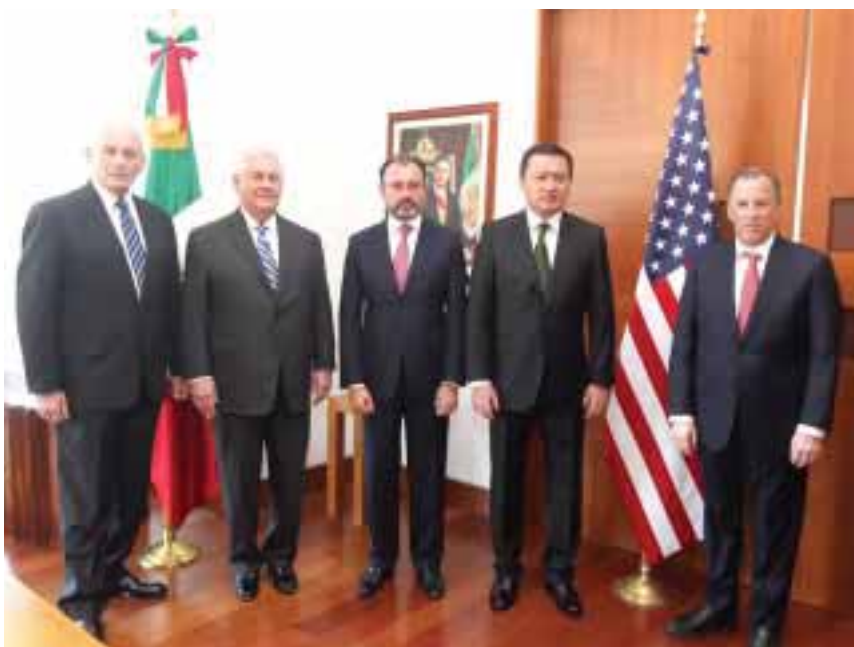
El secretario de Gobernación, Miguel Ángel Osorio Chong, afirmó que México requiere de Estados Unidos y Estados Unidos de México.

Para que sea posible la cooperación entre México y Estados Unidos, es necesario construir condiciones de entendimiento y diálogo entre las dos naciones, afirmó el secretario de Gobernación Miguel Ángel Osorio Chong.