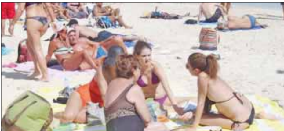
El flujo de turismo en la próxima temporada vacacional en Solidaridad podría estar en riesgo por factores como inseguridad y alza de combustibles.

Solidaridad.- El flujo de turismo en la próxima temporada vacacional en Solidaridad está en riesgo con factores determinantes como inseguridad y alza del combustible, que serán fundamentales a la hora de la toma de decisiones respecto a dónde vacacionar.