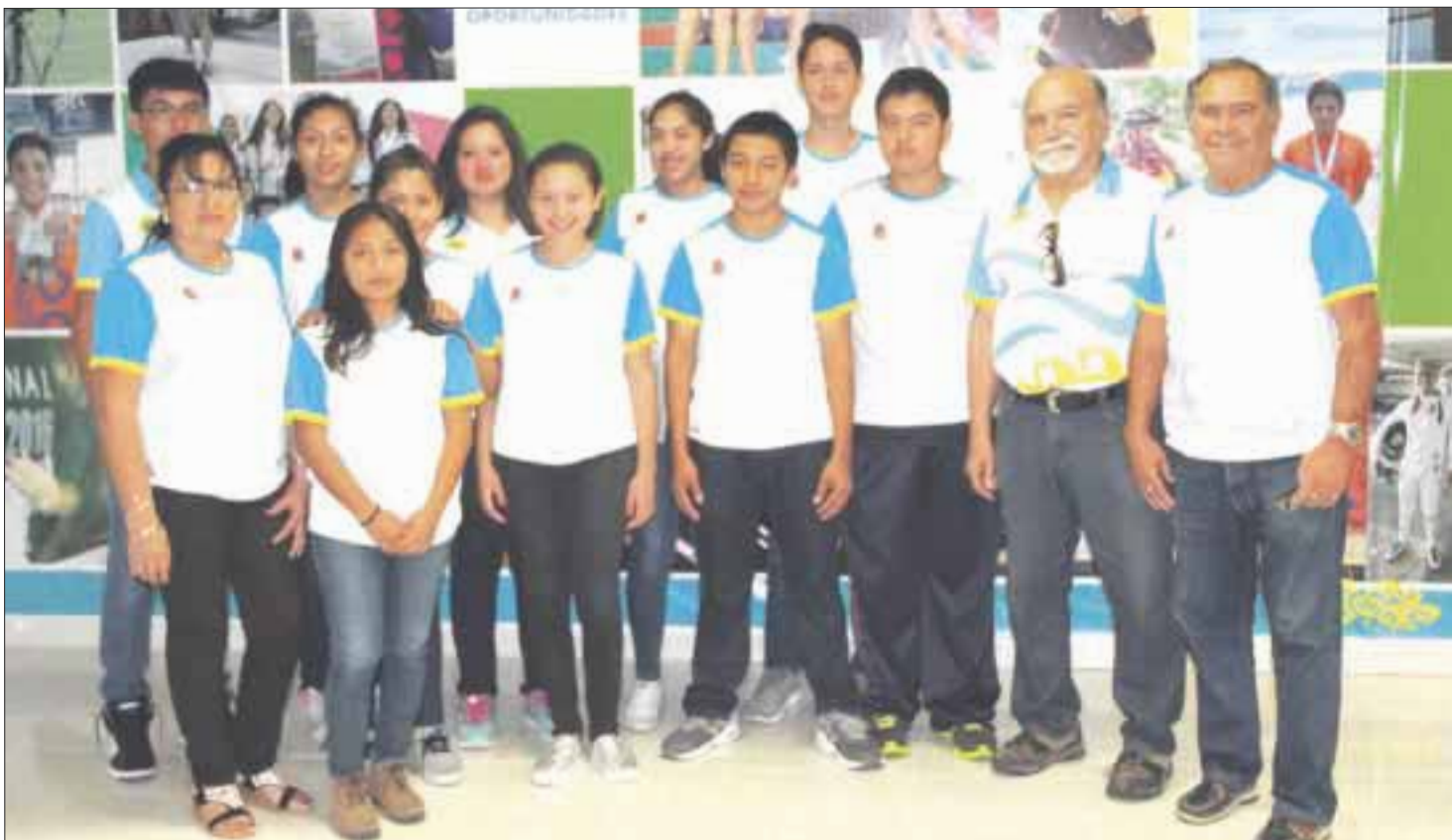
Con la mirada puesta en las Olimpiadas Nacionales, 57 deportistas fueron despedidos por un comisionado de COJUDEQ, quien los instó a poner su mejor esfuerzo.

Los deportistas fueron despedidos por un representante de la Comisión para la Juventud y el Deporte (COJUDEQ).