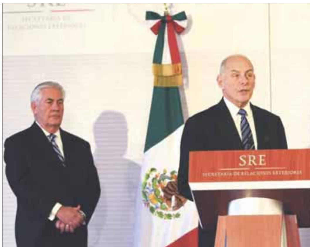
El secretario de Seguridad Nacional, John Kelly y el de Estado, Rex Tillerson, ofrecieron una conferencia luego de reunirse con Miguel Ángel Osorio y Luis Videgaray.

El secretario de Estado, Rex Tillerson, subrayó el compromiso de su país para fortalecer los mecanismos institucionales y el intercambio productivo en materia de seguridad y prosperidad para México y su país. Reiteró que en todas las deportaciones se actuará conforme al marco legal