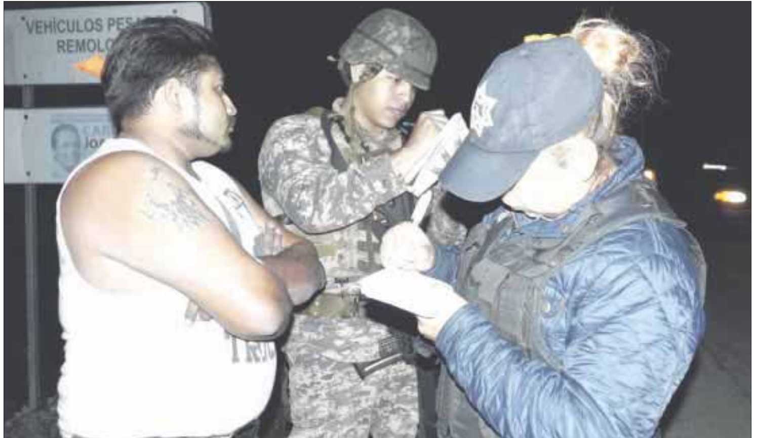
Con el objetivo de prevenir accidentes y salvaguardar la integridad de un trailerero, ayer fue asegurado y puesto a disposición del Ministerio Público, ya que al parecer estaba drogado.

Por este motivo, se procedió al aseguramiento de la unidad, propiedad de la empresa "Roca", la cual transportaba cemento en doble remolque.