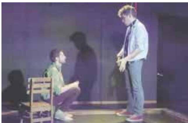
Cada vez somos menos , nominada como Comedia del Año.

gustavogerardo@live.com.mx @ACPT_Mex @gerardogs