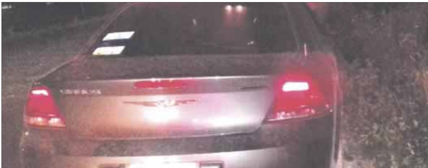
El auto Cirrus con reporte de robo, fue reportado por vecinos de una región del suroeste de la ciudad.

Cancún.- Un auto Cirrus con reporte de robo, fue encontrado ayer por la región suroeste de la ciudad.