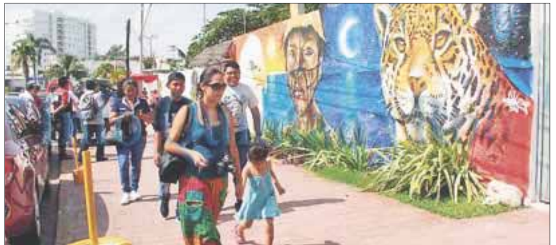
El Programa Corazón de Pescador dará a Puerto Juárez color y vida con la pinta de las columnas deterioradas, donde la gente va en busca de los embarcaderos.

La pinta de espacios se cerrará con un festival gastronómico, en donde participarán locatarios de Puerto Juárez, para convivir con la comunidad, ya que la fundación lo que pretende es apoyar proyectos que den un sentido de imagen y pertenencia.