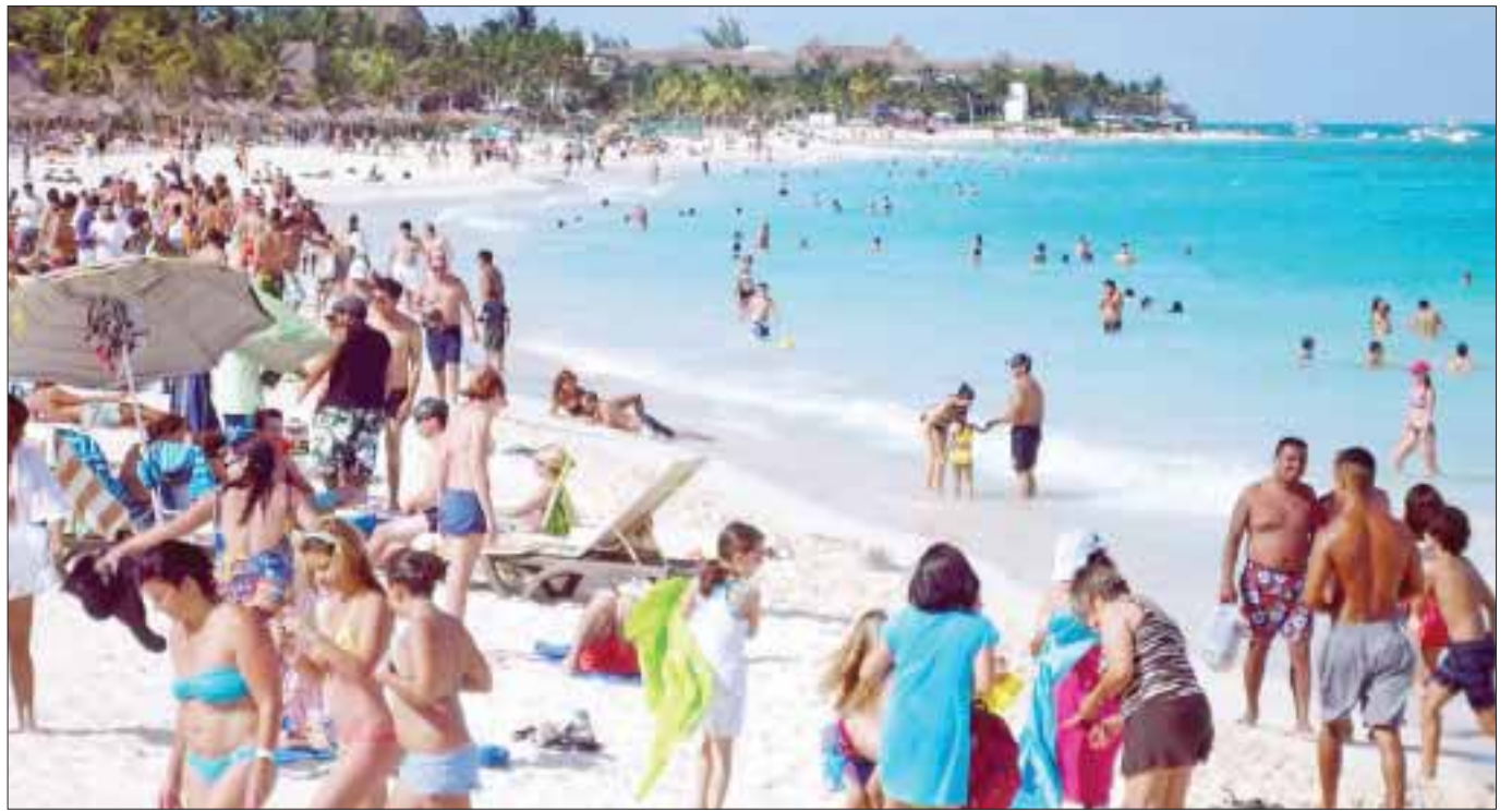
En el panel “Destinos Saturados, el límite de la Promoción” analizaron los casos de Cancún y la Riviera Maya.

Manifestó que no puede haber un descanso promocional porque la presencia del destino en la mente de los viajeros se puede perder, sobre todo cuando hay mucha competitividad, rescatando el enfoque correcto para cada uno de los destinos que ofrece el estado.