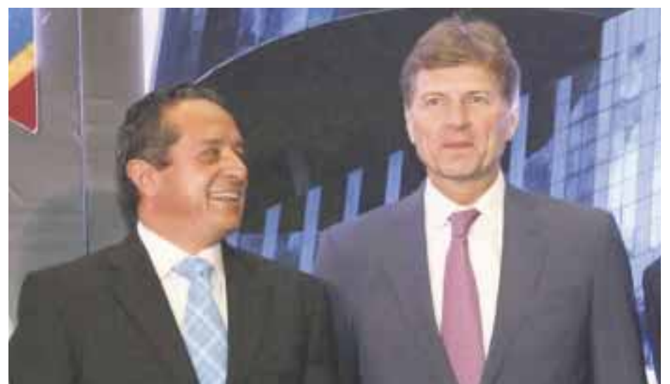
Carlos Joaquín González y Enrique de la Madrid.