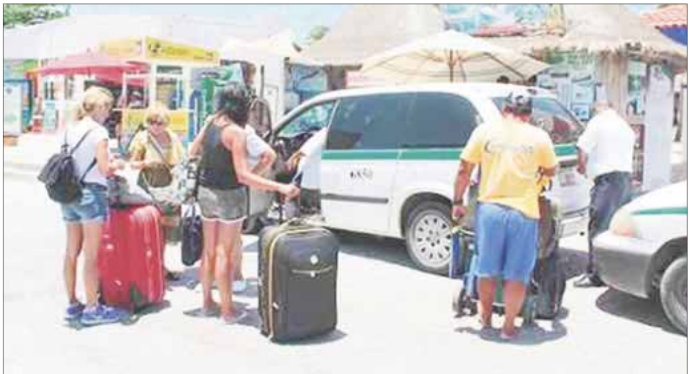
Ante el descenso en el costo de los combustibles, no se aprobó el incremento en la tarifa del taxis en el estado y de aplicarse un alza de manera irregular los infractores estarán sujetos a sanciones.

Los inspectores harán sus operativos de manera habitual, en beneficio de la población para evitar que sean timados por choferes que sin motivo apliquen una nueva cuota, sin exhibirse en los tarifarios aprobados por la autoridad.