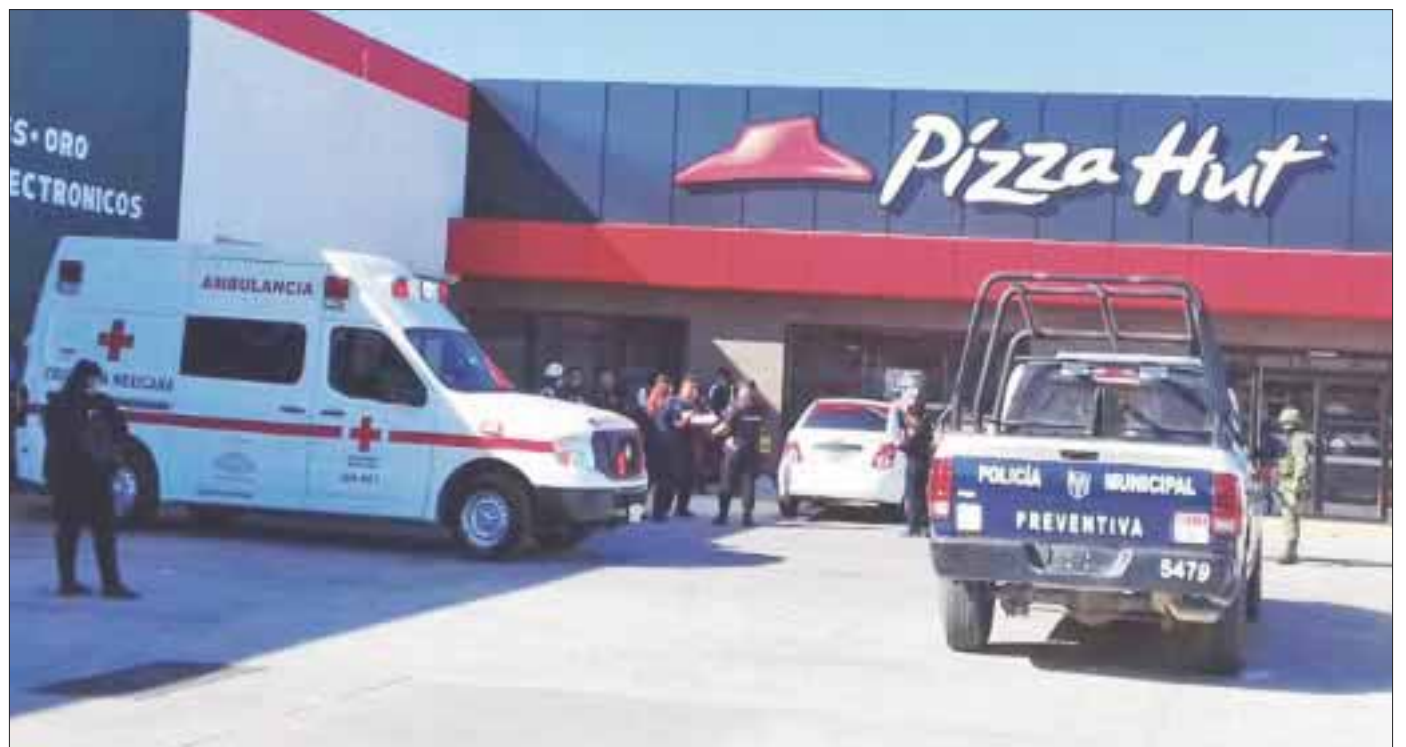
Los rufianes llegaron a hasta este negocio, donde sometieron a los empleados con una escopeta.

Cabe mencionar que por ser un negocio de recién apertura, los gerentes no han instalado el servicio de videograbación, por lo que la policía no cuenta con imágenes que puedan ayudar a la localización de los maleantes.