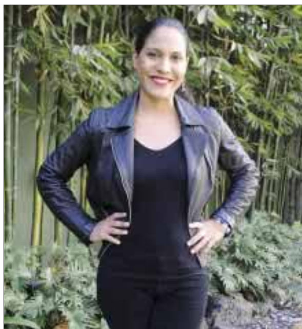
Haydée Milanés, hija del reconocido cantautor Pablo Milanés, promociona en México su sencillo "Para vivir", que se desprende de disco "Amor, Haydée Milanés a dúo con Pablo Milanés".

En tanto del show adelantó que "traemos un repertorio con temas del disco, pero también canciones muy queridas por los mexicanos, voy a empezar yo sola, luego a dúo y tendrá su momento a solas, él con la guitarra, que es algo que está retomando y que me tiene muy contenta. Finalmente, vamos a cantar de nueva cuenta a dúo porque es de lo que trata el disco y es el plato fuerte del concierto".