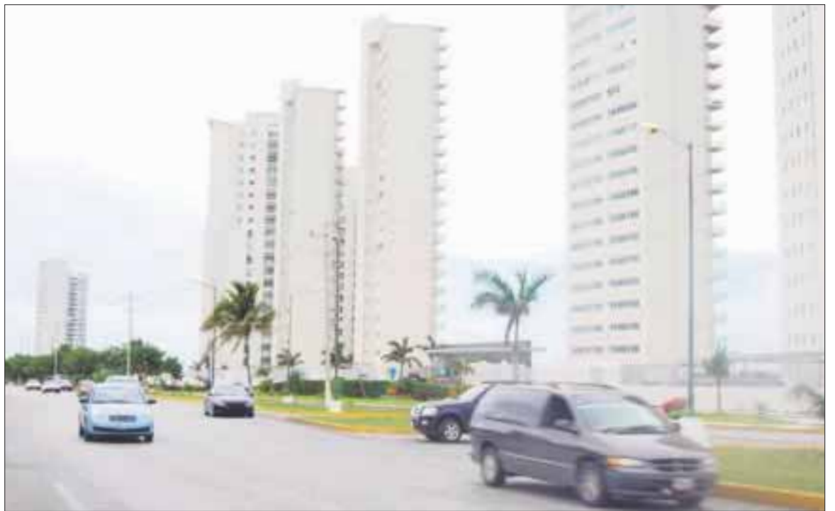
En 2017 se espera que las transacciones inmobiliarias se mantengan en la entidad y se superen las 21 mil valuaciones registradas el año pasado.

El dirigente de los valuadores colegiados indicó que la economía de Quintana Roo basada en el turismo no se ha resentido hasta el momento, como sucede en otras entidades del país, factores externos como la depreciación del peso el aumento de los combustibles ni el efecto Trump lo que permite proyectar para este 2017 un crecimiento similar al del año pasado, con las reservas respectivas.