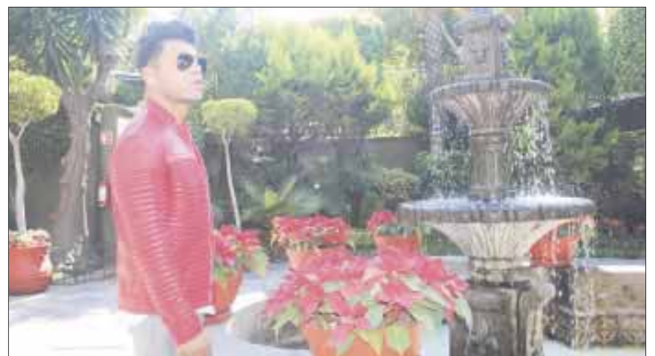
"Te juro" será el primer sencillo que se desprenda de su disco "Eterno", que Samo canta a dúo con Alejandra Guzmán.

la canción y puedan hacerlo bien. Las canciones que escribo para mí son de manera natural, lo sé desde que estoy componiéndolas". Reconoció también que "me gustaría que alguna de mis canciones la llegara a grabar Alejandro Fernández, se me hace una de las mejores voces y es uno de los mejores intérpretes de México". El disco "Eterno" de Samo será lanzado el 5 de mayo, mientras que su presentación en el Lunario es el 25 del mismo mes. Las redes sociales del cantante son SamoAllStar y SamoOficial.