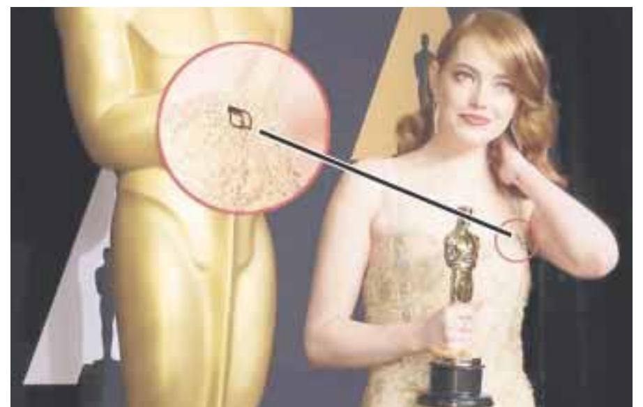
La protagonista de "La La Land" llevó un pin cerca de su corazón con las iniciales PP, en protesta a una política de Donald Trump.

de Givenchy. Pero la pequeña insignia no venía incluida en el vestido. El discreto detalle, con dos "P" doradas, es el logo de la asociación estadounidense Planned Parenthood, uno de los principales organismos de planificación familiar en Estados Unidos. El grupo milita en favor de la educación sexual y del acceso a los cuidados reproductivos, y además defiende el derecho de las mujeres a controlar y a elegir sus embarazos, está a favor del aborto.