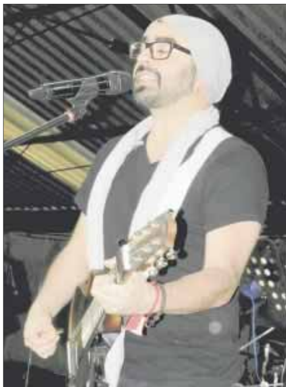
Con su disco 7/11 , Sandoval refleja el romanticismo y la balada.

Acompañado de mujeres músicos para conformar la nueva alineación de su banda (An-