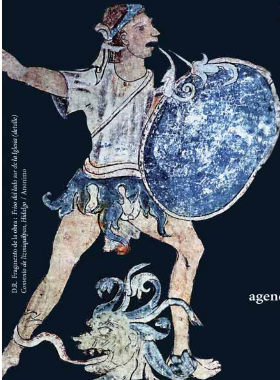
D.R. Fragmento de la obra : Friso del lado sur de la Iglesia (detalle) Convento de Ixmiquilpan, Hidalgo / Anónimo