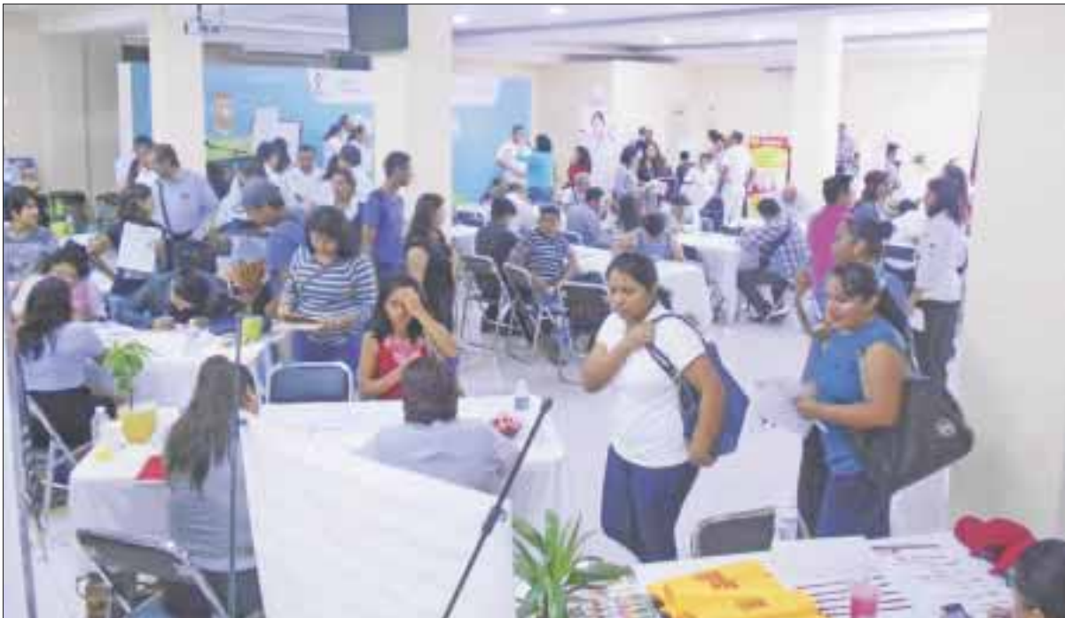
La Bolsa de Trabajo de la Universidad del Sur tuvo una singular modalidad: ofrecer empleos para estudiantes que cursan sus carreras, para ser opción de contratarlos en cuanto se titulen.

La funcionaria señaló que también están ofreciendo vacantes para personas de la tercera edad y para gente con alguna discapacidad, en el evento que comenzó a las nueve de la mañana hasta las dos de la tarde y la siguiente feria va a ser a través del gobierno del estado en el Centro de Convenciones, el 14 de marzo.