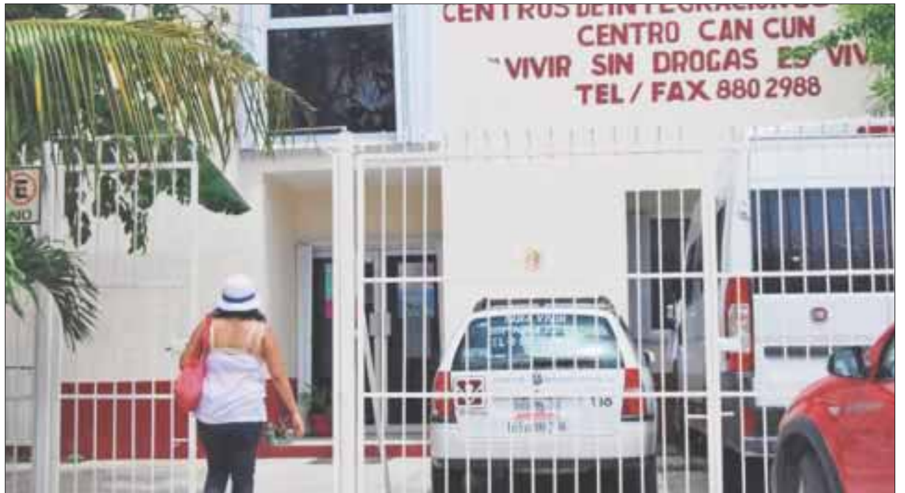
En el Centro de Integración Juvenil crece el número de atención a casos de menores “de primera vez” en edades de 13 y 14 años, que cursan en su mayoría quinto y sexto grado de primaria.

Con las campañas que se realizan desde el año pasado, el Centro de Integración Juvenil en Cancún pretende revertir los resultados de las estadísticas, que les indican no bajar la guardia al bajar en las escuelas y trabajar en las primarias, secundarias y prepa, pero sobre todo en quinto y sexto año de primaria.