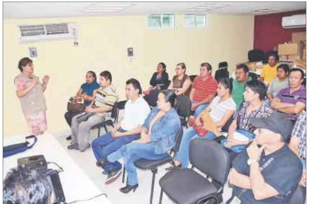
La capacitación se da con miras a la Cuaresma, donde el consumo de pescados y mariscos se incrementa.

Además de la capacitación y fomento sanitario también se han intensificado las acciones de vigilancia para evitar que se presenten enfermedades transmitidas por la ingesta de productos que no cumplan con la normatividad sanitaria