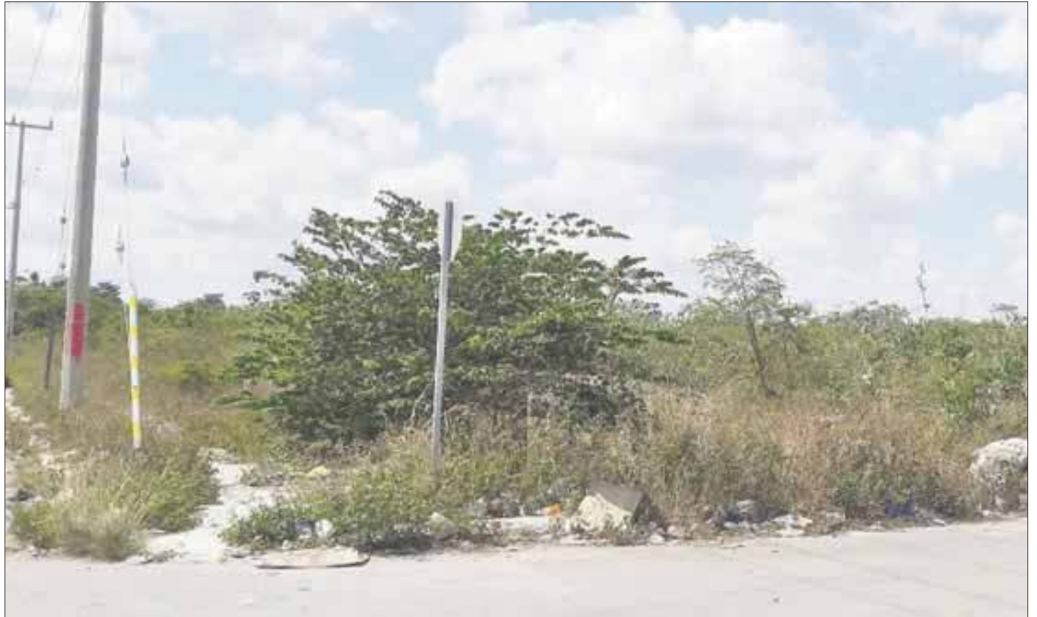
Esta es una de las áreas verdes del fraccionamiento Las Palmas, donde aparentemente son usados para inhumaciones clandestinas.

“Estos terrenos no están habitados y algunos no tienen casa, por lo menos el gobierno debería mandar a limpiarlos” reprochó el carnicero entrevistado.