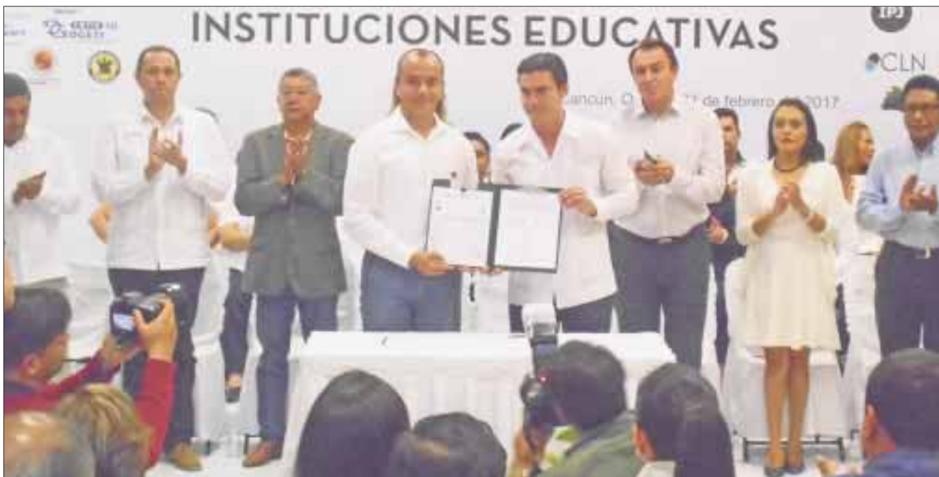
La Universidad Tecnológica de Cancún llevará a cabo el mes próximo un congreso que discutirá sobre turismo y las necesidades que afrontan los nuevos viajeros, al que concurrirá el secretario Enrique de la Madrid.