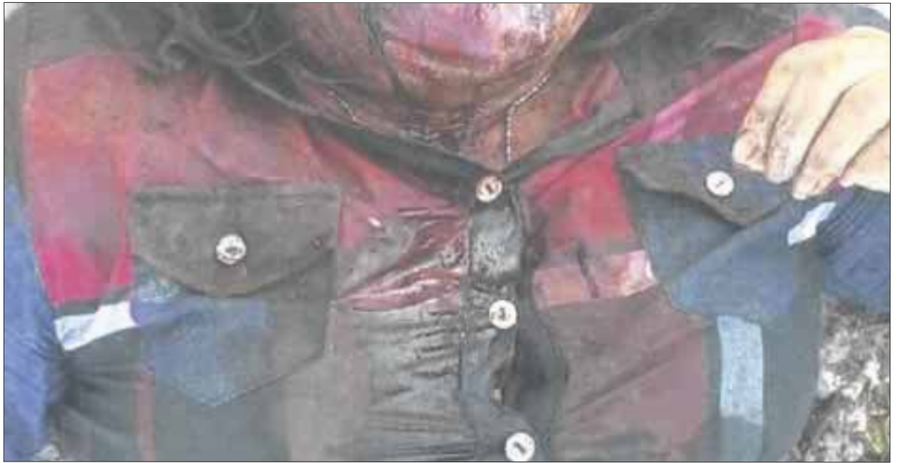
La menor de edad quedó prácticamente con el rostro destrozado por su atacante, que al parecer la creyó muerta y la abandonó en la sascabera.

El reporte preliminar señala que la adolescente fue trasladada al Hospital General con graves lesiones en cráneo y cara, fractura de nariz, fractura en mandíbula, desprendimiento de cuero cabelludo, entre otras heridas.