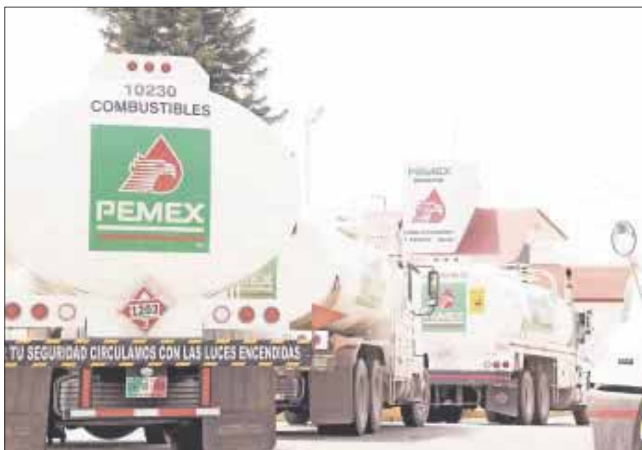
Petróleos Mexicanos reportó pérdidas por 296 mil millones de pesos, 58.5 por ciento menos que en 2015.

El año pasado Petróleos Mexicanos (Pemex) reportó pérdidas por 296 mil millones de pesos, 58.5 por ciento menos que en 2015, según publicó en su informe del último trimestre de 2016.