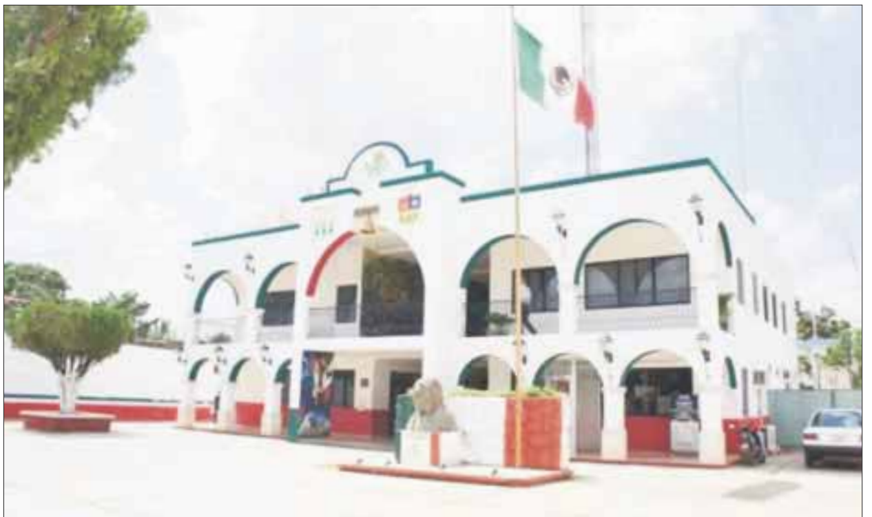
Se identificará al personal que no cuente con la preparatoria para que en próximos meses inicien las asesorías.

Dijo que personal del IEEA participará de manera activa en el reforzamiento de las asesorías en las plazas comunitarias y formará círculos de estudio, para atender de manera eficaz a los trabajadores, que recibirán este apoyo de manera gratuita.