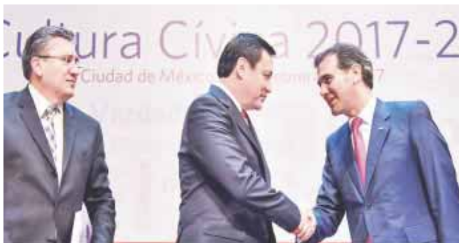
Miguel Ángel Osorio Chong dijo que ante los retos que enfrenta el país se requiere apostar por la política que suma y construye.

Ante los retos que enfrenta el país se requiere apostar por la buena política, la que crea, suma y construye, “la que apuesta por la unión y no por la división”, afirmó el secretario de Gobernación, Miguel Ángel Osorio Chong.