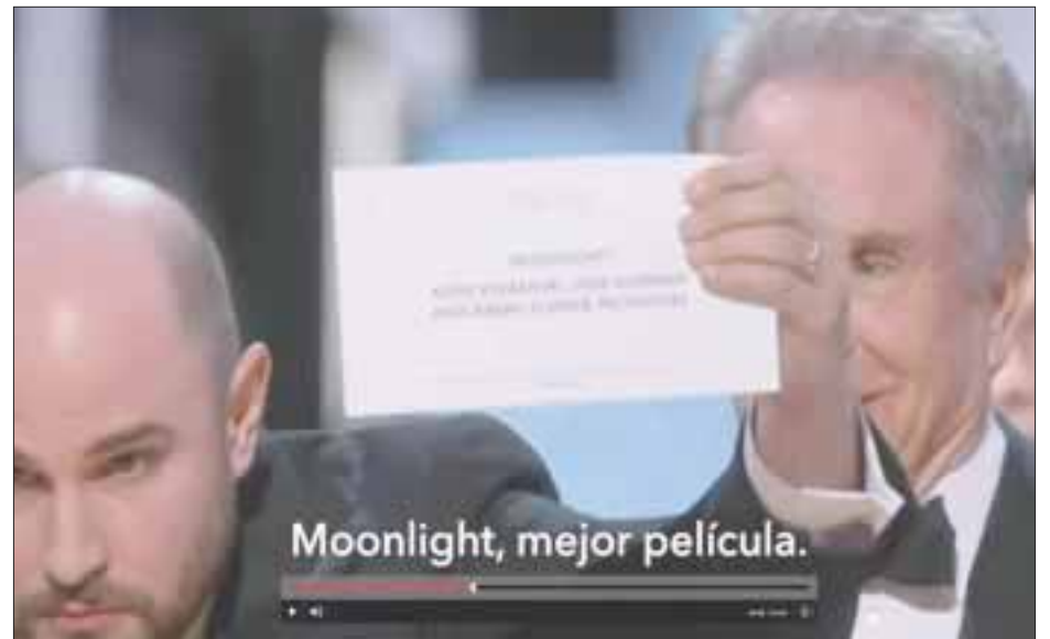
"Estaban tan concentrados en política que al final no resolvieron todo el evento", señala Trump.

"Creo que estaban tan concentrados en política que al final no resolvieron todo el evento",