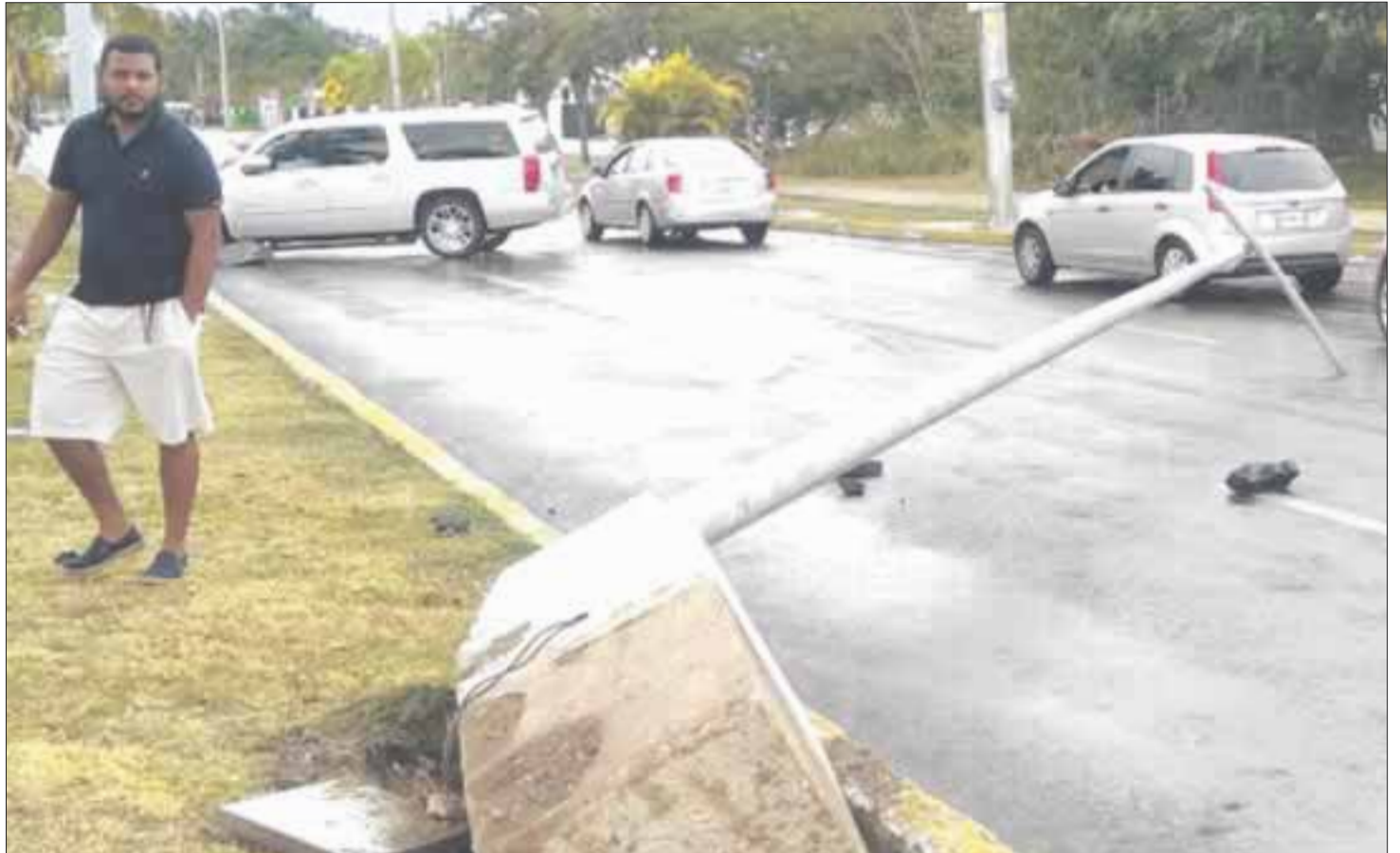
Un texto al teléfono le costará 50 mil pesos al conductor de esta unidad, propiedad de una empresa de renta de autos.

Los daños entre el poste de alumbrado propiedad del ayuntamiento y los de la camioneta, se calcularon en 50 mil pesos.