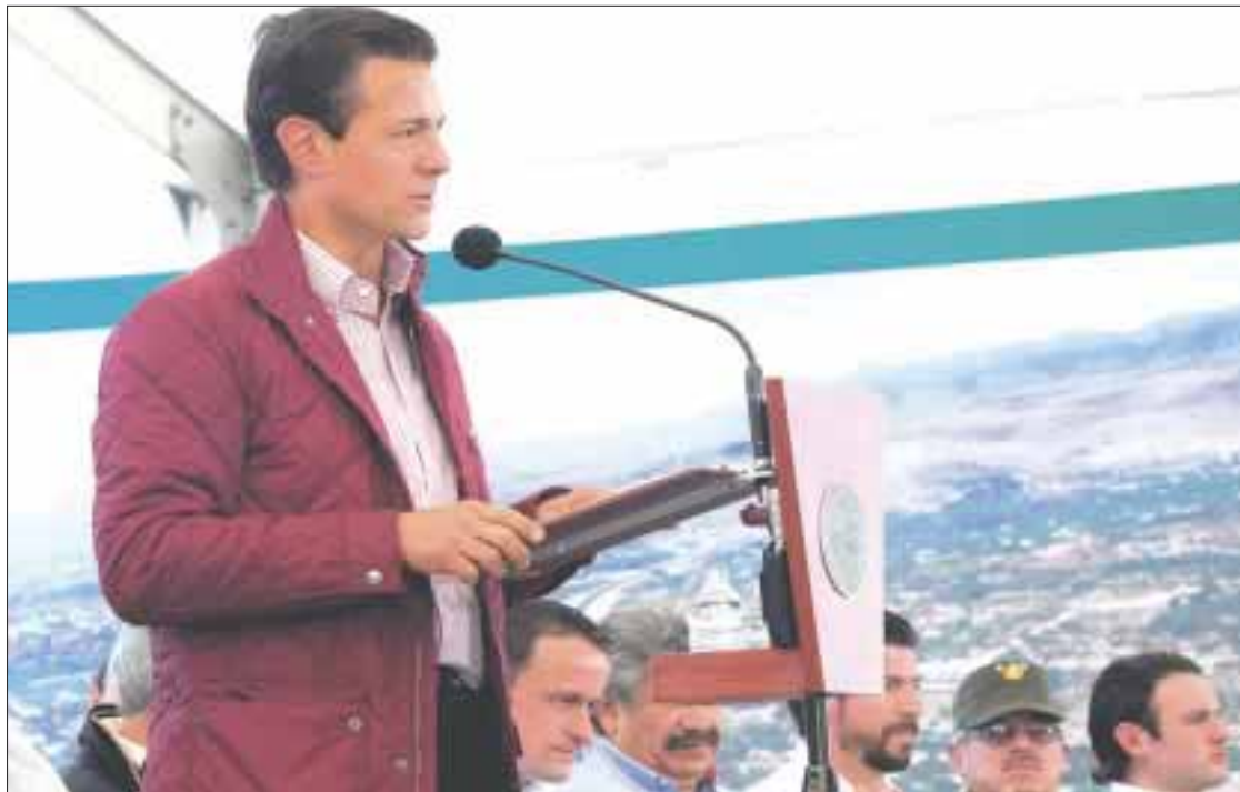
El presidente Enrique Peña Nieto entregó el Libramiento Poniente de San Luis Potosí.

“Pareciera que estas obras sólo benefician a quienes tienen oportunidad de circularlas”, pero la construcción de más infraestructura para la comunica-