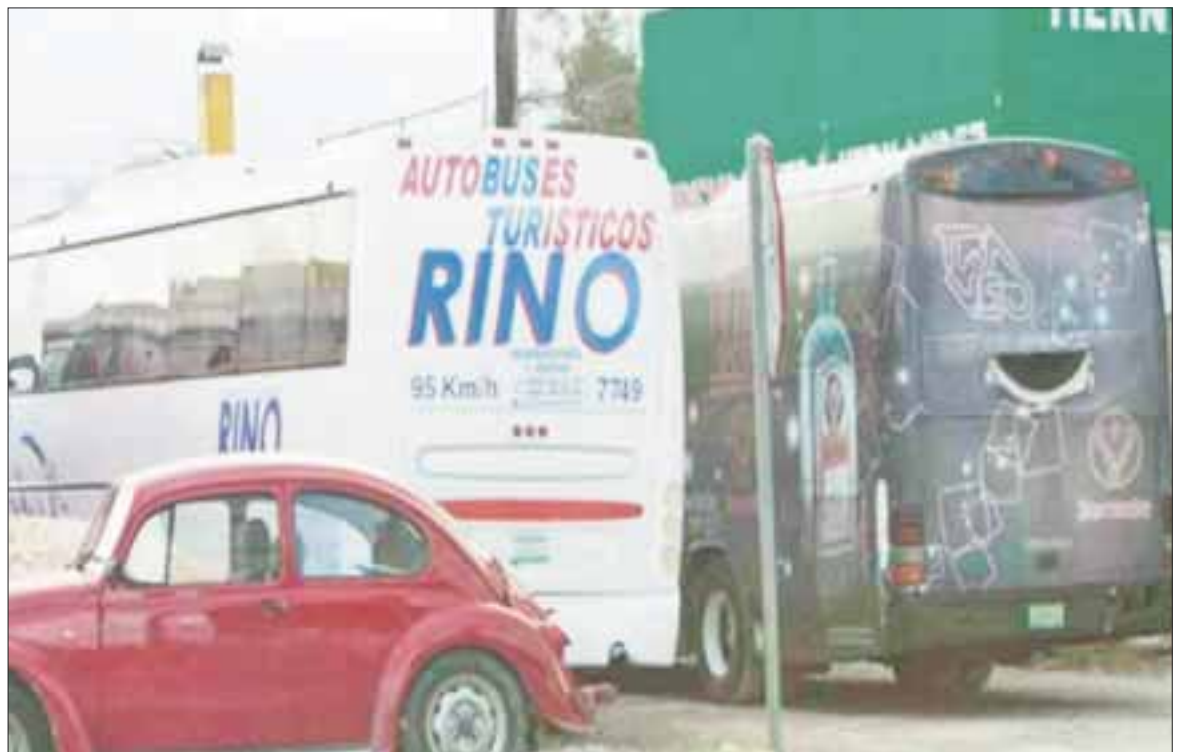
Más de 100 millones de dólares se “echan a la bolsa” los transportistas pirata foráneos, al movilizar 5 millones de turistas en más de 800 unidades.

Plantearon la necesidad del gobierno del estado, de crear normas que les den prioridad y derecho de piso a quienes sí pagan impuestos, generan empleo e invierten en Quintana Roo, ya que si bien algunas transportadoras tienen placas federales, al carecer de arraigo, concluye la temporada alta y se van.