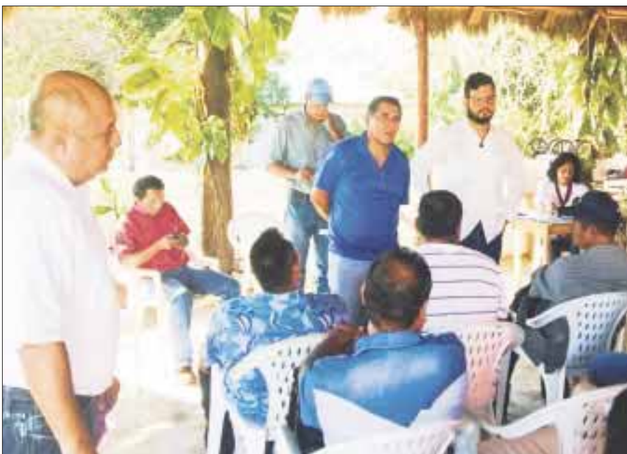
Los beneficiados aportarán poco más de 12 mil pesos para que se construya su vivienda.