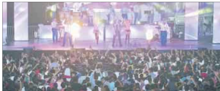
El 1 de marzo se realizará la quema de Juan Carnaval como representación del final de estas fiestas, acto que se llevará a cabo en la Plaza Cívica “28 de Julio”.

Con este proyecto, el compositor y cantante Sandoval se consolida una gran carrera, llena de logros y que ha venido sembrando desde hace más de siete años.