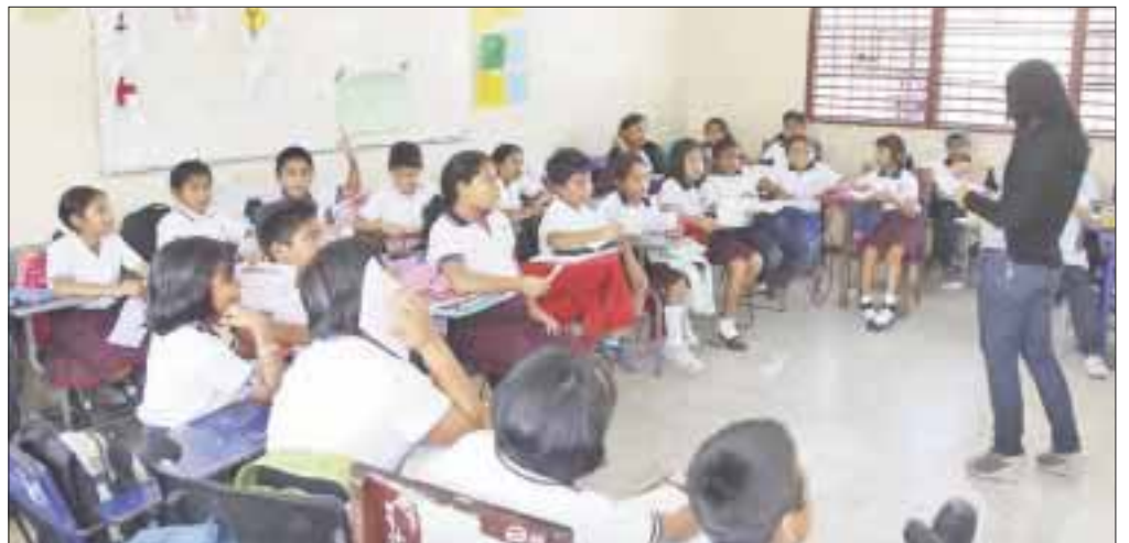
Los docentes de las escuelas de niños migrantes atienden a 64 alumnos en tres primarias y un jardín de niños, ubicadas en el municipio de Othón P. Blanco.

Esto significa que, a partir de ahora, se sistematizará el trabajo que se lleva a cabo en esas escuelas a través de la Ruta de Mejora para atender la problemática de los niños migrantes, acción que se enmarca en el interés de la secretaria de Educación y Cultura, por brindarles una educación integral de calidad e inclusiva.