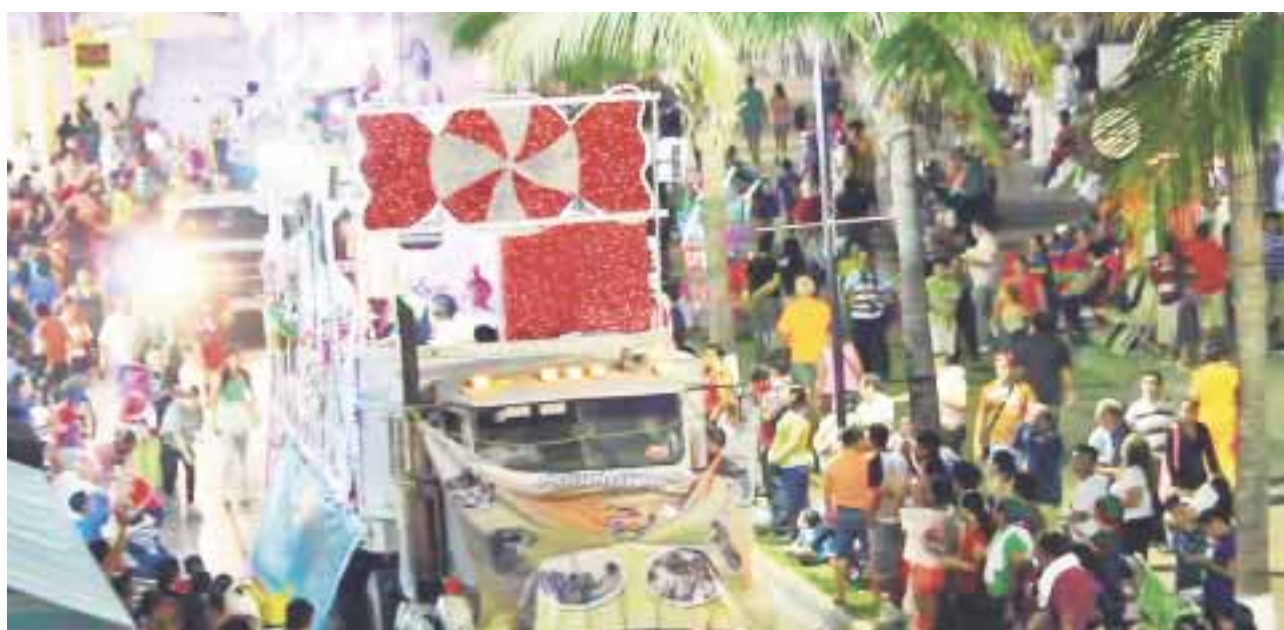
Empresas y particulares están pagando 500 pesos por participar con carros alegóricos; empero, la situación ha provocado una molestia ciudadana.

Cozumel.- La comparsa “Sabor latino” y su carro alegórico fueron sacados del segundo desfile del carnaval, por no haber pagado los 500 pesos que el gobierno local está cobrando por participar.