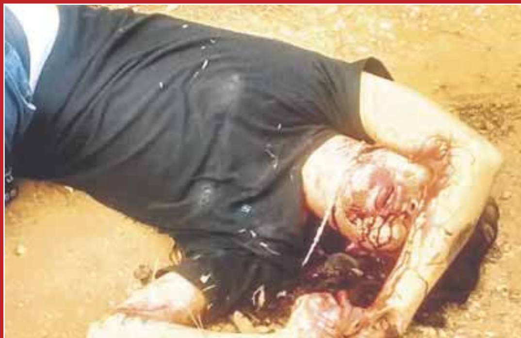
Fue encontrado el cuerpo de un hombre de entre 20 y 25 años en un camino desierto, que conduce al rancho Las Quintas.