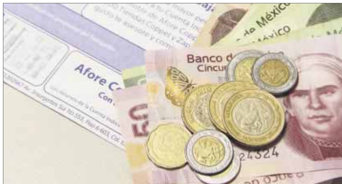
En los primeros 20 años del Sistema de Ahorro para el Retiro se han abierto 58 millones de cuentas.

Así, ejemplificó, un trabajador que inició cotizaciones el 1 de julio de 1997 con ingresos por cinco salarios mínimos tiene hoy en su cuenta 262 mil 284 pesos, de los cuales 119 mil 933 son rendimientos netos de comisiones. El ahorro de los trabajadores ha propiciado un círculo virtuoso para el crecimiento y desarrollo del país, pues un monto creciente de esos recursos se canaliza a actividades productivas, manifestó la Consar en el reporte.