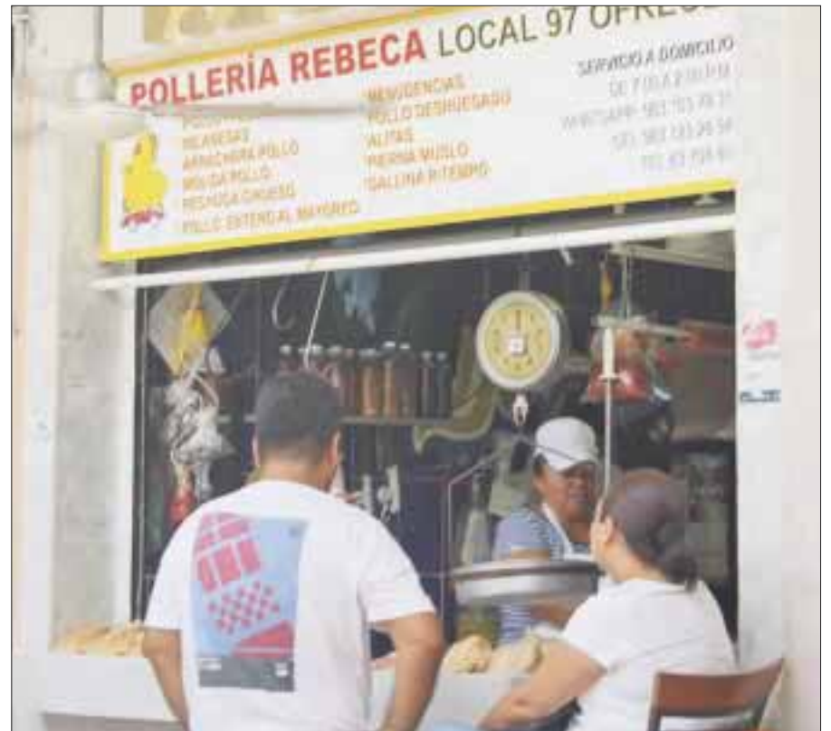
Más de 3 mil 500 aves son sacrificadas diariamente para el abastecimiento del mercado de Chetumal, sin las medidas sanitarias certificadas.