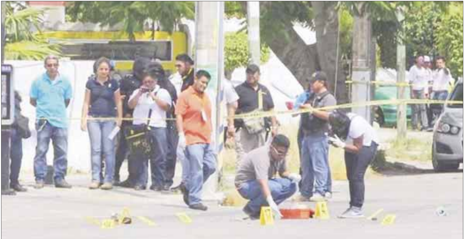
Como seña particular el occiso de 43 años de edad presenta un tatuaje en el brazo izquierdo con un Cristo y la herida cortante en el cuello.

Las señas particulares del occiso son complexión delgada, tez morena, cabello ondulado largo, frente amplia, cejas pobladas, ojos cafés oscuros, nariz recta con base ancha, bigotes abundantes, boca chica con labios delgados y mentón oval.