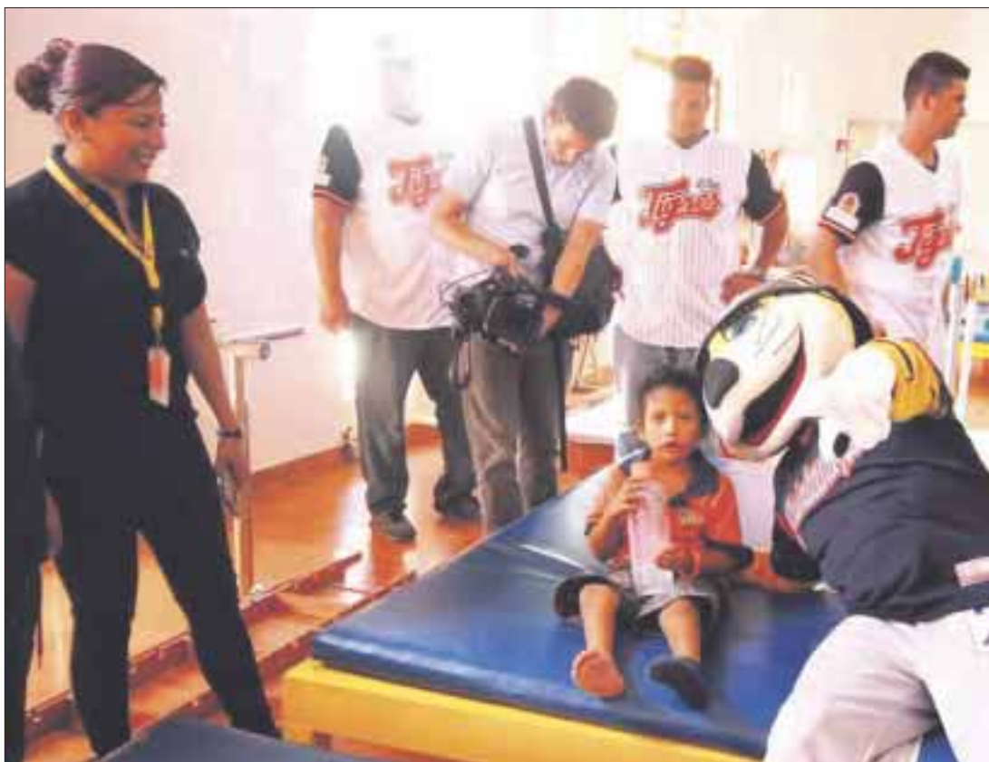
“Chacho” se robó el día, pues todos los niños querían una foto con la mascota de los Tigres.

Como parte de la visita de los Tigres, que en este año celebra una década de haber llegado a Quintana Roo, se procedió a la foto del recuerdo, en donde los niños tomaron de las manos a jugadores y rodearon a “Chacho”. Desde su llegada a Quintana Roo, el CRIT ha atendido a más de 3 mil niños y en la actualidad reciben terapia casi mil infantes y jóvenes.