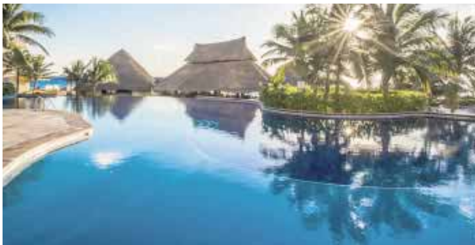
El área de la alberca del renovado hotel en Cancún.

☆☆☆☆ Hace unos días fueron entregados los dos primeros Boeing 737 MAX 8 la aerolínea Norwegian que se convierte así en la primera compañía aérea europea en recibir ese avión que utilizará en vuelos transatlánticos entre ciudades del