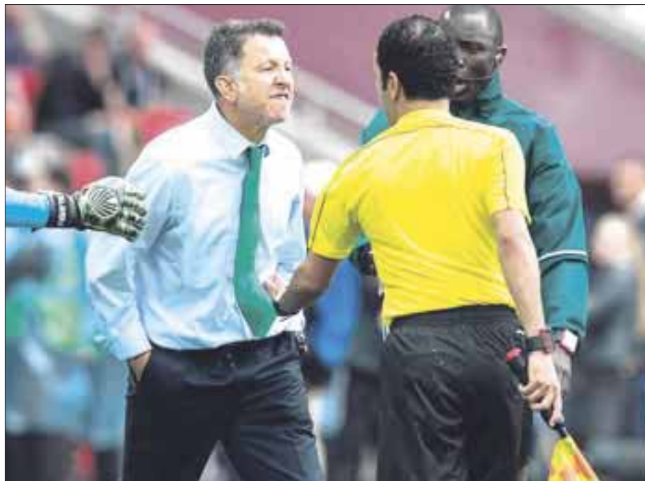
La nota la dio el técnico colombiano Juan Carlos Osorio, quien perdió los estribos por segunda ocasión y fue expulsado.

La Selección Nacional de México fue incapaz de despedirse de manera digna de la Copa Confederaciones Rusia 2017, al caer en tiempo extra en el partido por el tercer lugar frente a su similar de Portugal por 1-2.