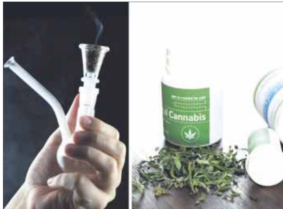
Un comercio ilegal de la mariguana para uso medicina hará de esta veta un lucrativo negocio, señala la Iglesia católica.

La Arquidiócesis, encabezada por el cardenal Norberto Rivera, aseguró que las políticas de prevención en el consumo de drogas “demuestran un fallo” y argumentó que el problema ha proliferado por la falta de valores