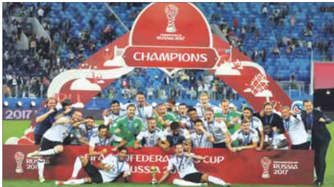
Alemania conquistó ayer domingo la Copa Confederaciones Rusia 2017, al vencer 1-0 a su similar de Chile.

Malo el trabajo del silbante serbio Milorad Mazic y su equipo del VAR, y por Chile amonestó a Arturo Vidal, Gonzalo Jara, Eduardo Vargas y Claudio Bravo, mientras que por Alemania, hizo lo propio con Joshua Kimmich, Emre Can y Sebastian Rudy.