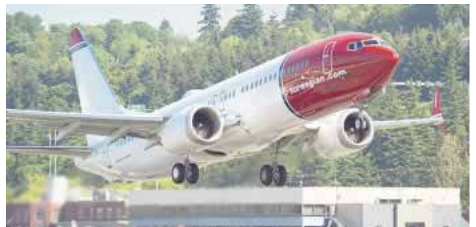
Recibe la aerolínea los dos primeros Boeing 737 MAX .