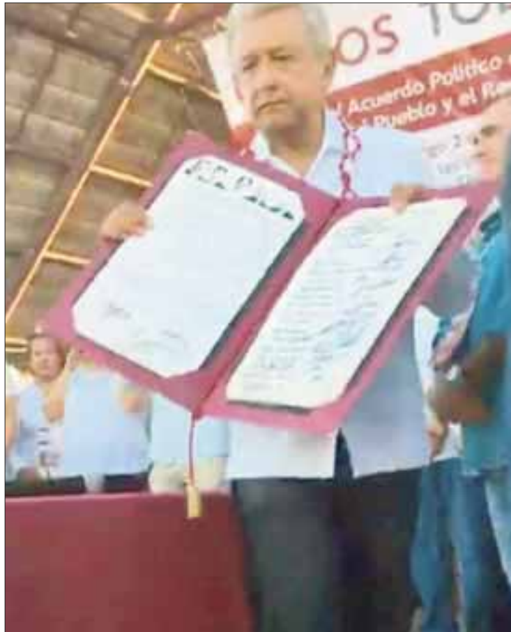
El dirigente nacional de Morena, Andrés Manuel López Obrador, firmó en Cancún el “Acuerdo por la Prosperidad y Renacimiento de México”.