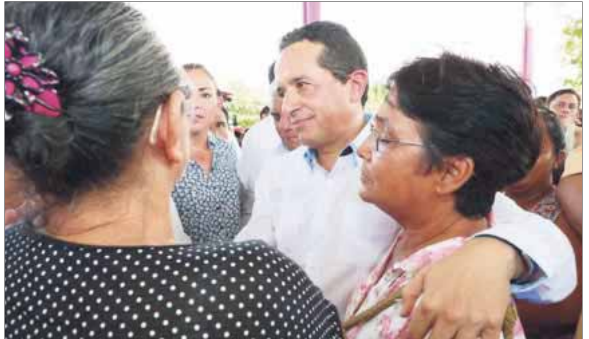
El gobierno del estado buscará que la industria turística ofrezca productos diversos para no depender sólo de las temporadas vacacionales.

“Será una oportunidad única para dirigir las acciones hacia el combate a las desigualdades, la disminución de la pobreza, con más salud y desarrollo humano, para que las personas de Quintana Roo tengan más y mejores oportunidades de vivir mejor”.