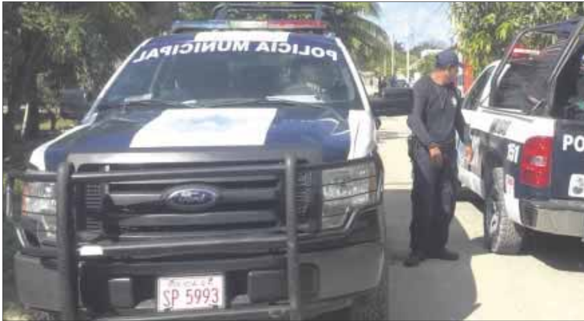
La Policía Municipal y el DIF lograron rescatar a dos infantes de 9 y 3 años que sufrían malttrato por parte de su madre.

Los dejaba solos desde las 21:00 hasta las 06:00 horas del otro día