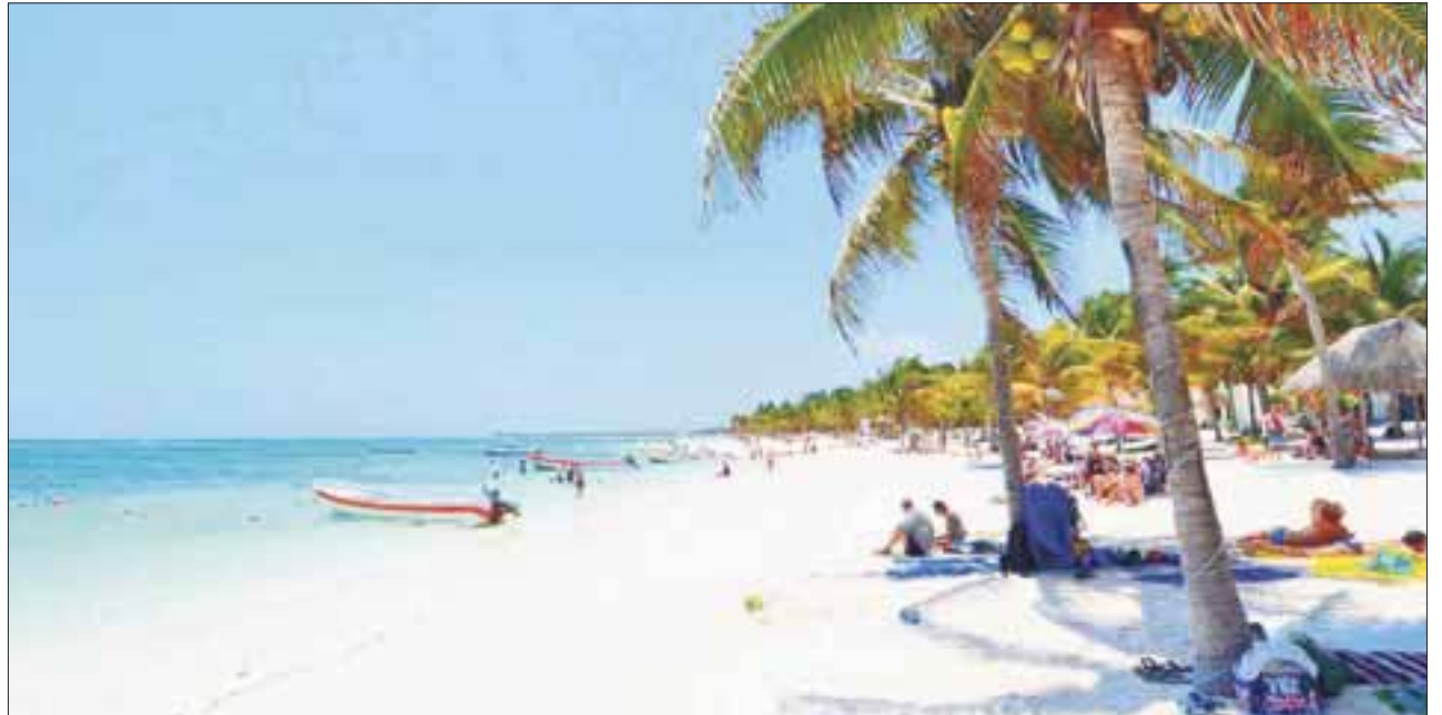
Con el tema de sustentabilidad y una audiencia de 6.009,560 llegó a su fin la Tercera Twitter Party #DisfrutoCaribeMX en Snorkel Native Park.