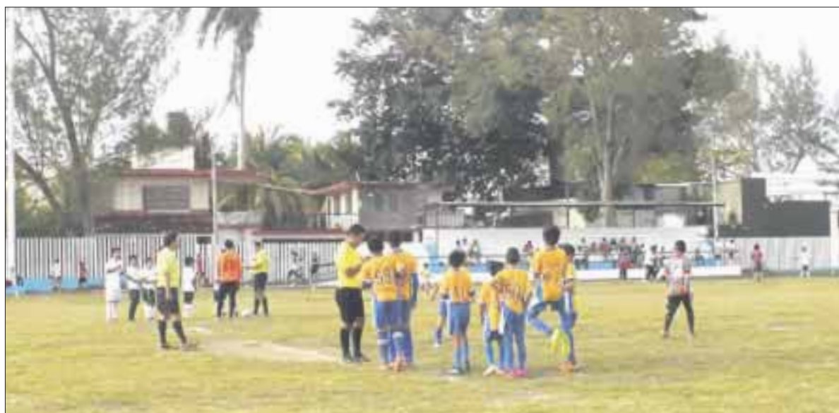
Los Jaguares de Chetumal lograron colarse a las semifinales de la Liga Pompeyense en octavo lugar, en un partido emotivo, que llegó a los penales.