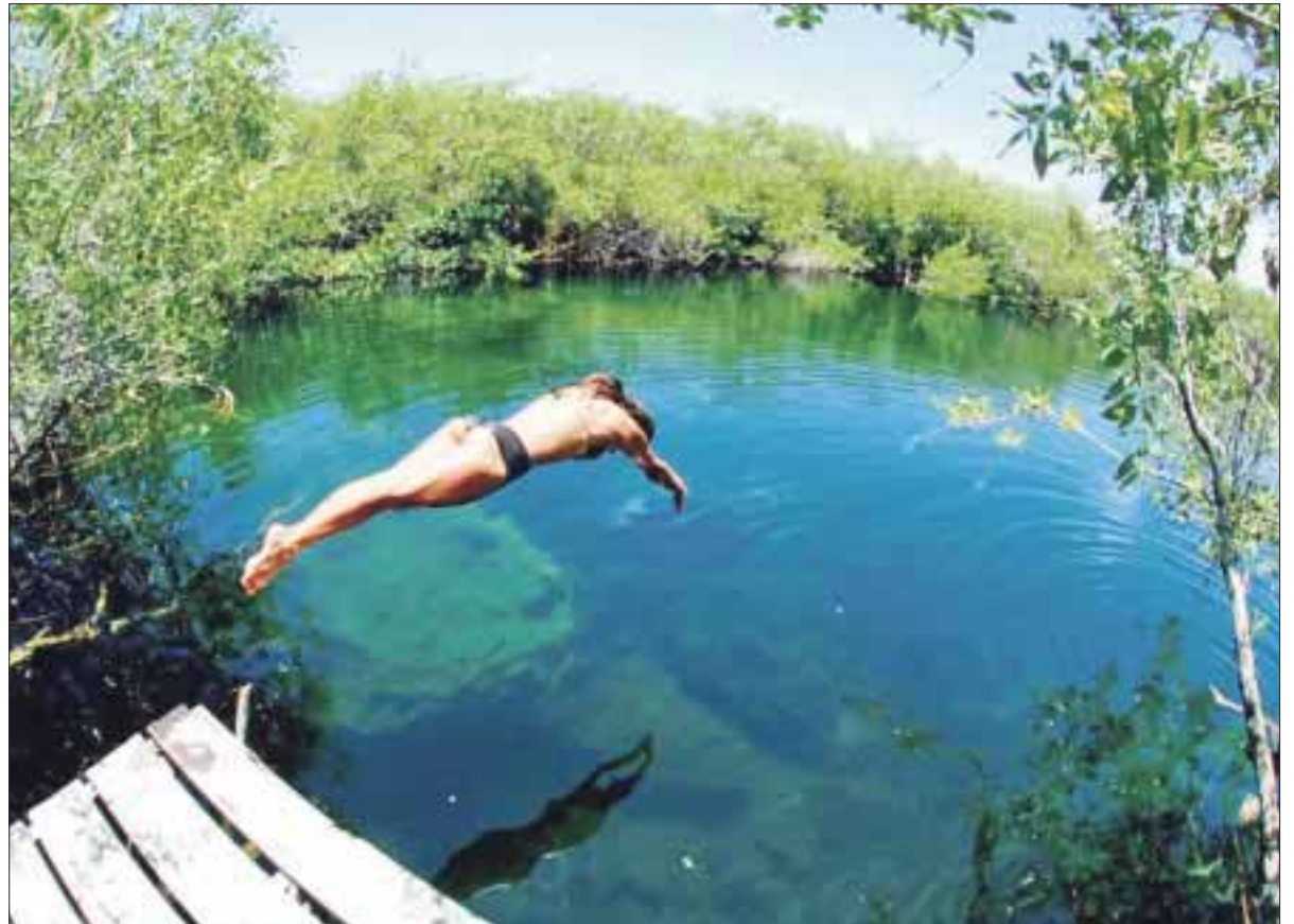
Se consolida Quintana Roo en 2017 como el primer destino turístico del país por sus bellezas naturales.

El desarrollo de Quintana Roo se refleja en el primer trimestre de este año, que registró su máximo histórico en generación de empleos con un incremento del 10.10 por ciento, de acuerdo con cifras del Instituto Mexicano del Seguro Social, lo que proporciona más y mejores oportunidades para la gente, a diferencia de gobiernos anteriores que lucraron con el poder.