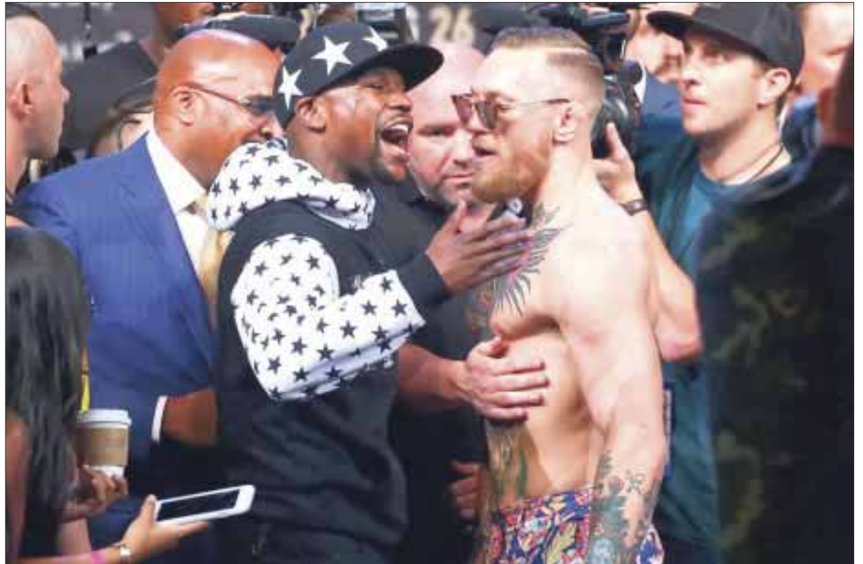
El combate entre Floyd Mayweather Jr. y Conor McGregor podrá disfrutarse en complejos de Estados Unidos.

A coger palomitas porque nadie se querrá perder esto”, sentenció el campeón. Además, ya se puede ver el trailer de ‘Conor McGregor: Notorious’, el documental de Universal Studios acerca de la vida del dos veces campeón irlandés de la UFC.