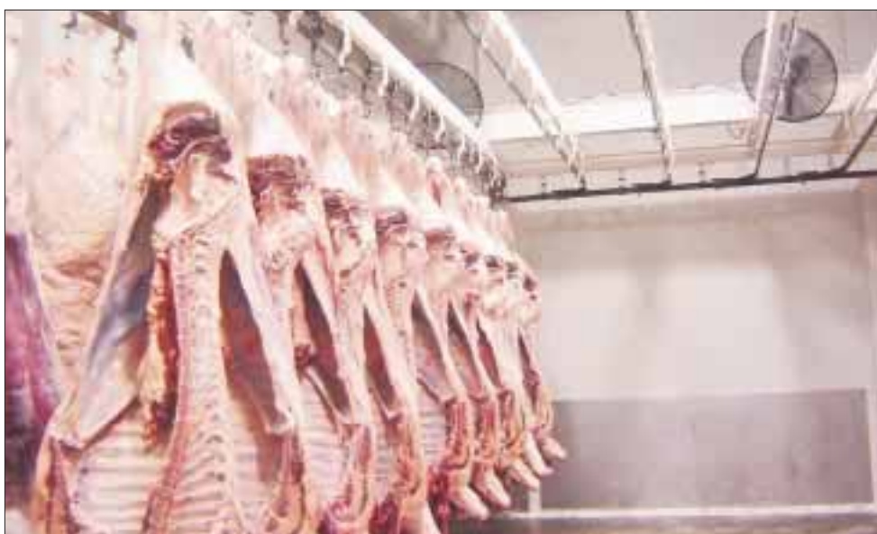
Cofepris verifica limpieza del lugar y manejo adecuado de la basura, los utensilios y superficies de trabajo y tarjeta de salud del personal.