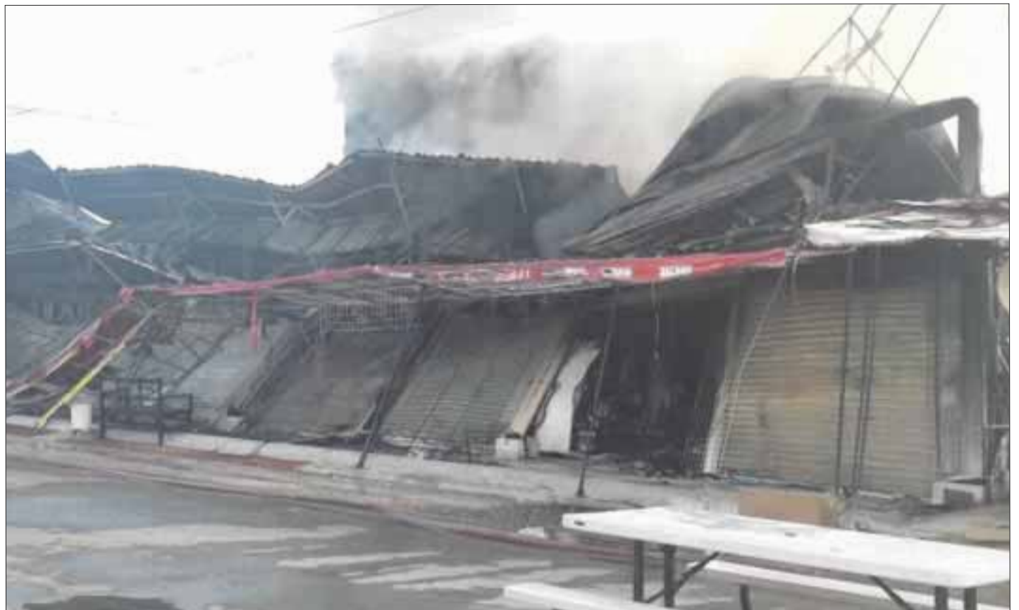
Lo que fuera la Zona Libre de Belice, famosa por concentrar mercancía de 180 países, quedó en cenizas.

“La Plaza Menandros” pertenece a un comerciante de Quintana Roo. Fue fundada en 1999 con la reapertura de la Zona Libre de Belice