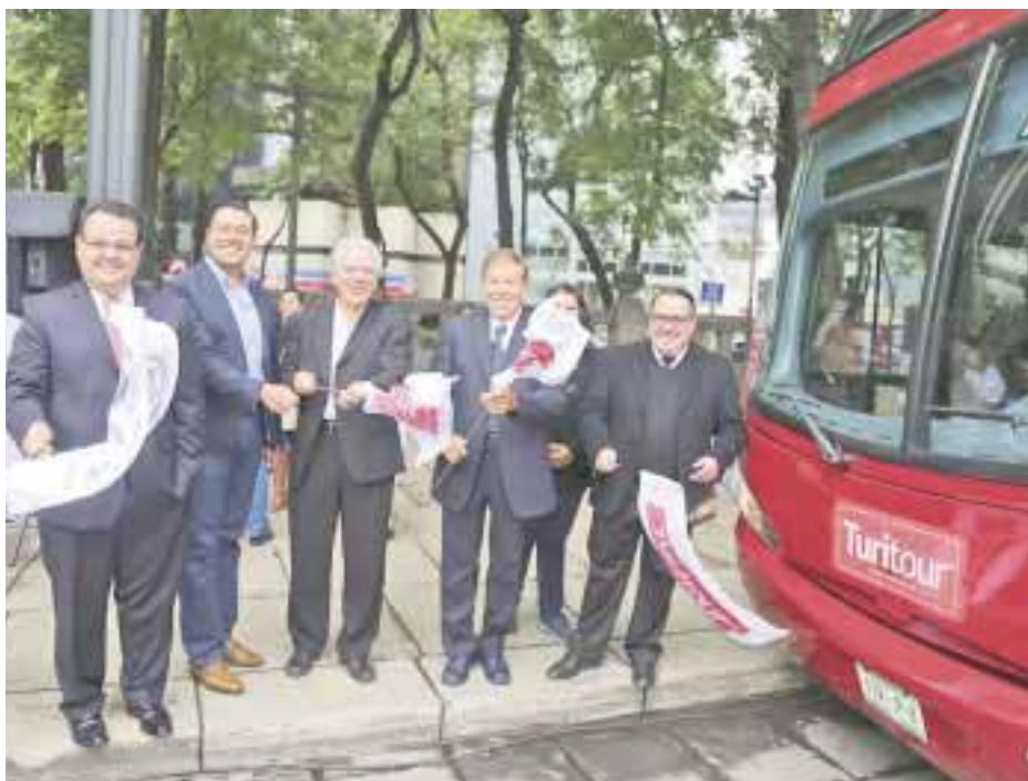
Inauguran nueva ruta del Turitour.

Por tal razón, la región de Xalapa forma parte de la oferta gastronómica, cultural e histórica