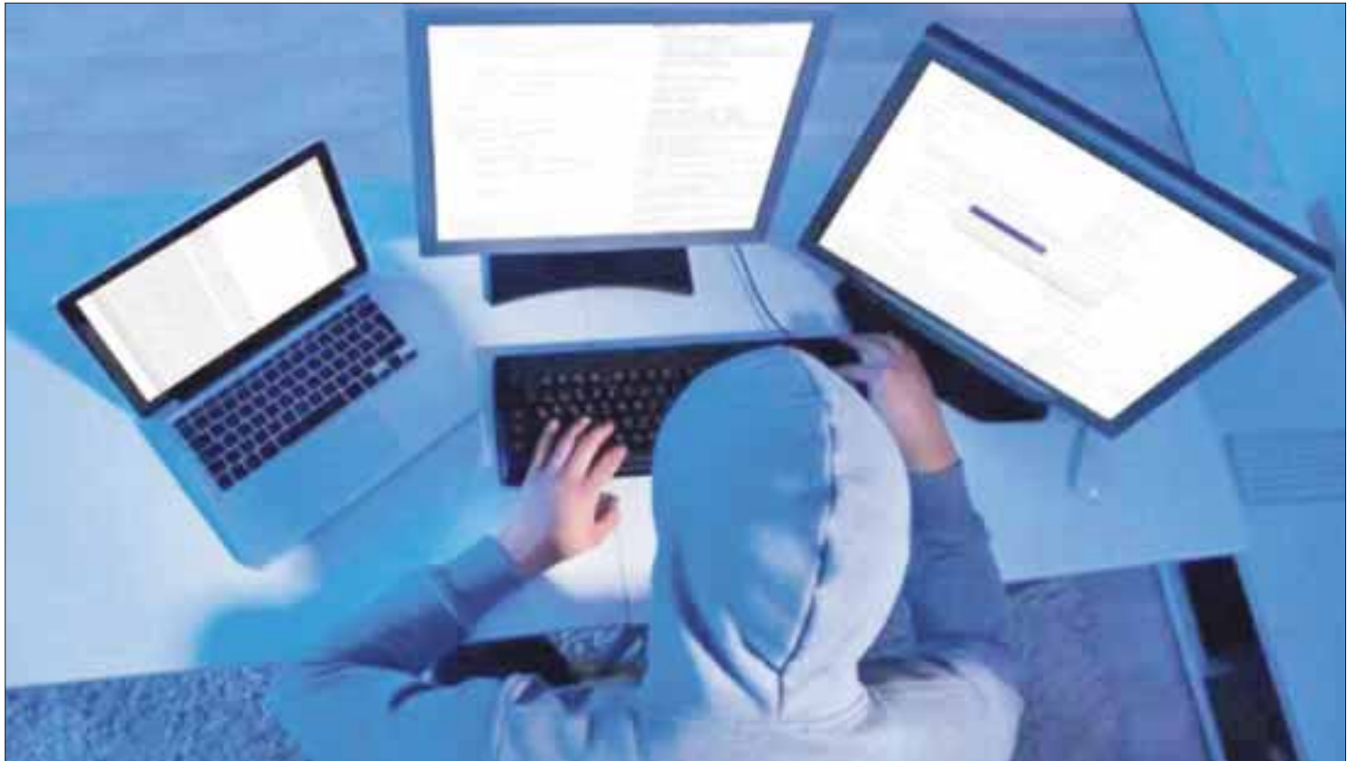
Van 240 casos de fraude cibernético en Chetumal y Cancún, a través de ligas electrónicas para obtener descuentos en adeudos.

Se recomendó a la población cuidar su dinero y acudir a realizar sus pagos a las empresas y cajeros autorizados, además de ignorar ofertas y propuestas mágicas, que son sólo ligas de fraude en la web.