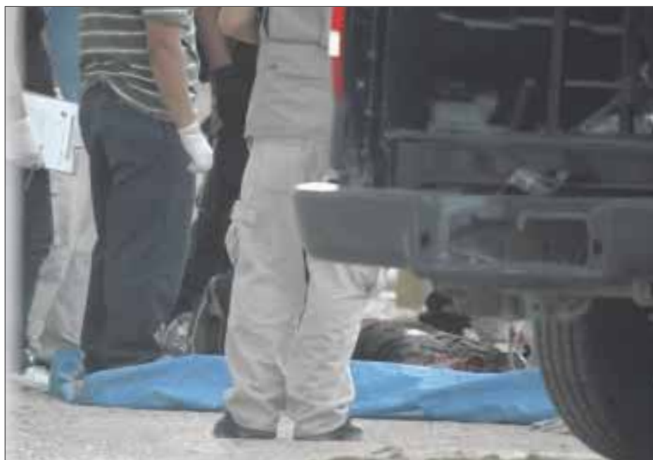
La Ciudad de México registró mil 276 homicidios, el 18.1 por ciento más que los mil 80 de 2015, y la cifra más alta desde 2007.

El año pasado hubo 23 mil 953 homicidios en México, la cifra más alta de ese delito en este sexenio, reportó el Instituto Nacional de Estadística y Geografía (Inegi).