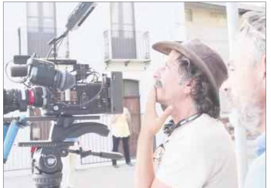
La cámara de Lorenzo Hagerman siguió de cerca a hombres y mujeres mayores de 90 años de seis países en tres continentes, cuyo denominador común es la plenitud con la que disfrutaban su existencia.