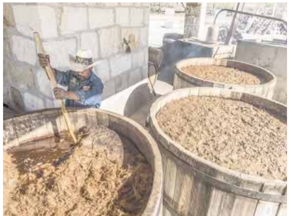
En Oaxaca fue el Festival del Mezcal.