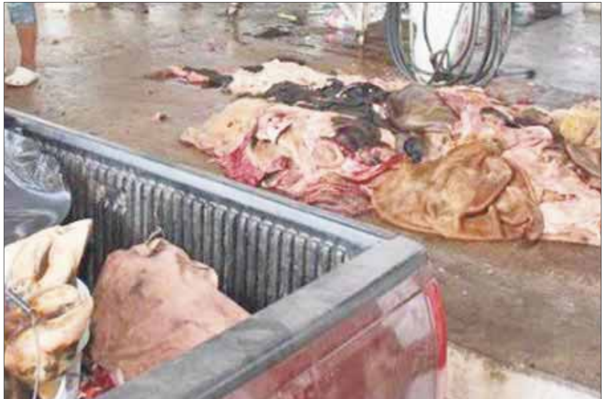
Detecta la Cofepris en Quintana Roo seis mataderos clandestinos operando fuera de la ley y fincará responsabilidades penales.

En relación a los 18 centros de abasto de carne y rastros que se detectaron con la bacteria Salmonella, durante 10 días estuvieron cerrados. En la zona norte en total se ubicaron seis, dos en Cancún, y el resto en Lázaro Cárdenas y Puerto Morelos, donde al igual que en el sur, se destruyó por completo la carne contaminada. Hubo cuatro denuncias por personas contaminadas con salmonella , al consumir la carne que vendían en dichos centros que fueron clausurados, lo que motivó una alerta y revisión exhaustiva en todo el estado