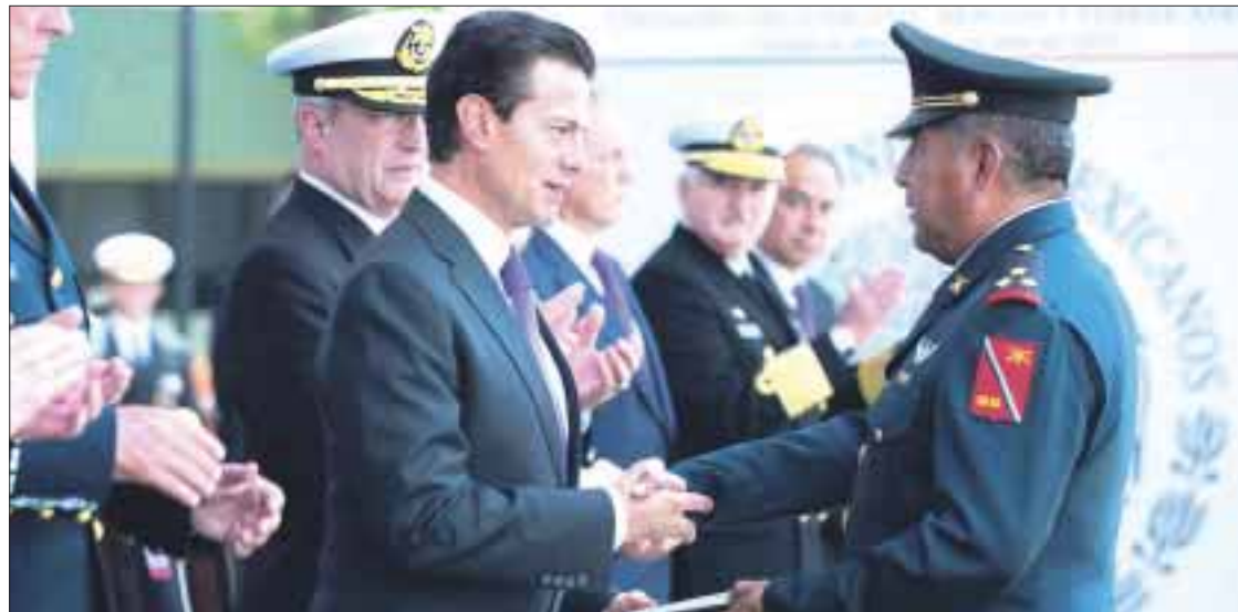
Enrique Peña Nieto encabezó la ceremonia de Entrega de Menciones Honoríficas a Unidades del Ejército y Fuerza Aérea Mexicana.

Al hacer un reconocimiento a los galardonados, en su calidad de comandante supremo de las fuerzas armadas, afirmó que los institutos castrenses desempeñan un papel decisivo para ga-