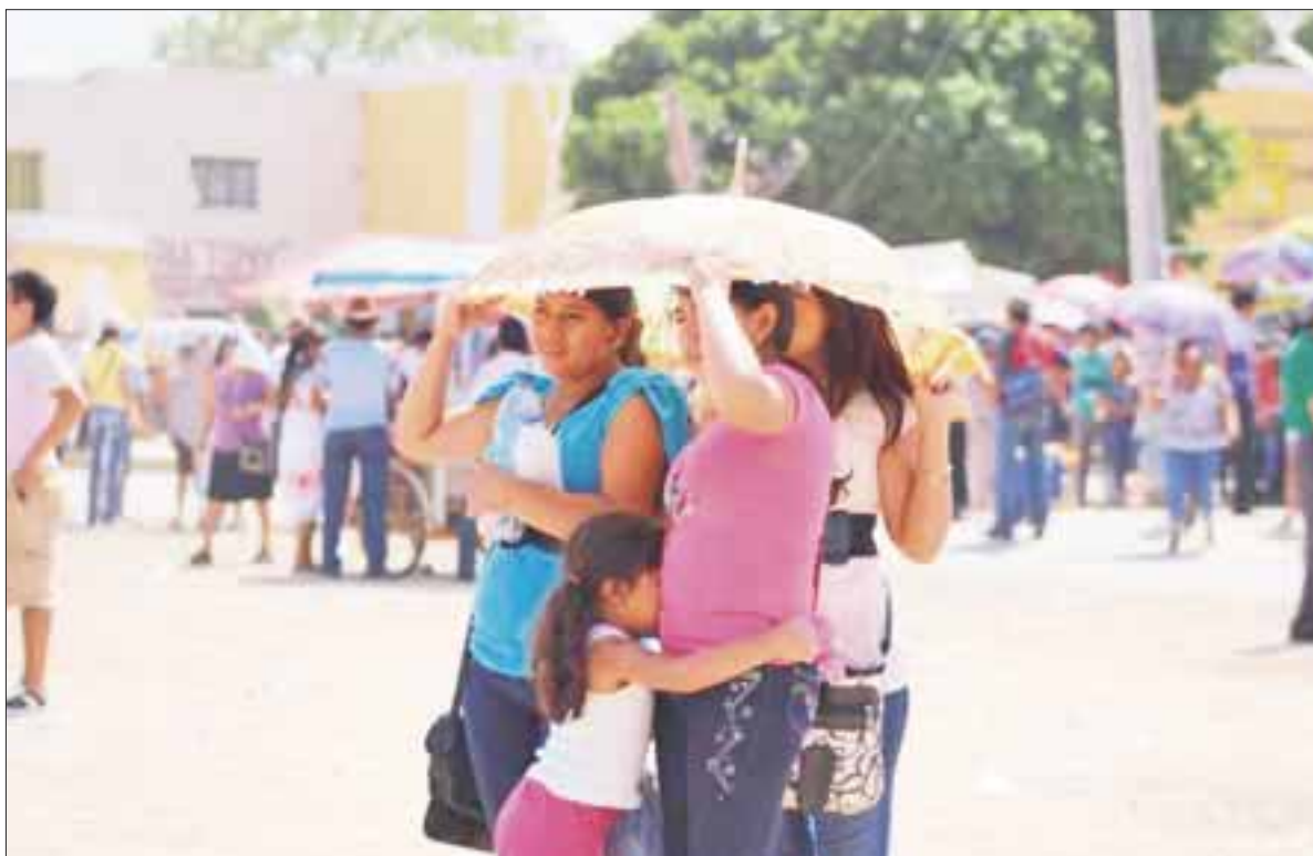
La prevención será siempre la mejor estrategia para evitar los “golpes de calor” en esta época.

Chetumal.- Un adulto mayor falleció recientemente por “golpe de calor” y hubo un segundo, el cual evolucionó favorablemente.