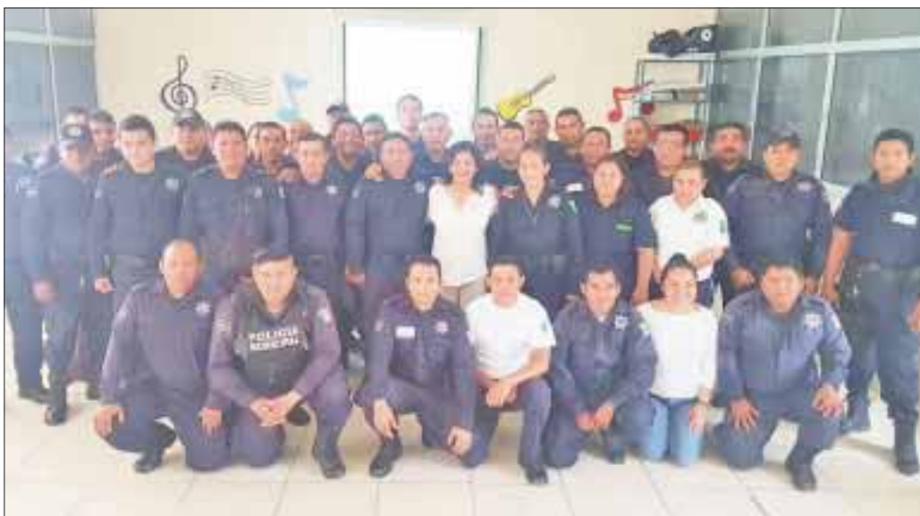
Los ponentes abordaron temas de explotación sexual, equidad de género y violencia contra las mujeres.