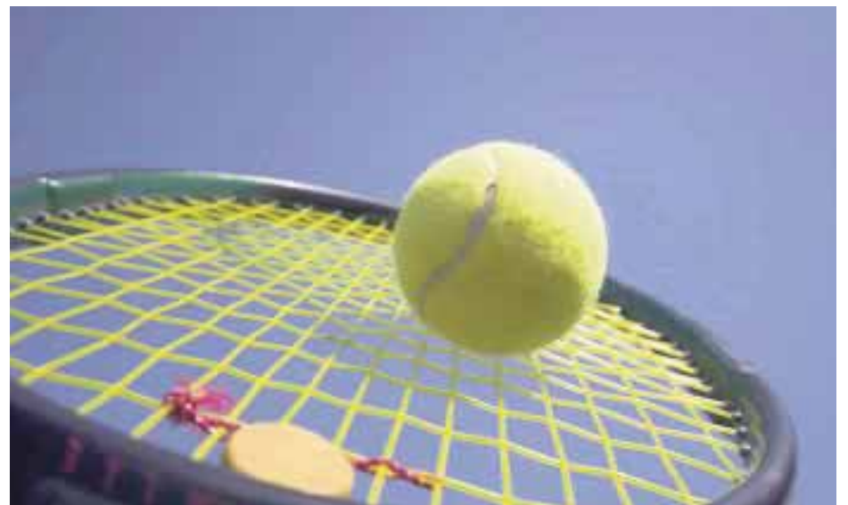
En agosto, el Torneo de Tenis en Los Cabos.