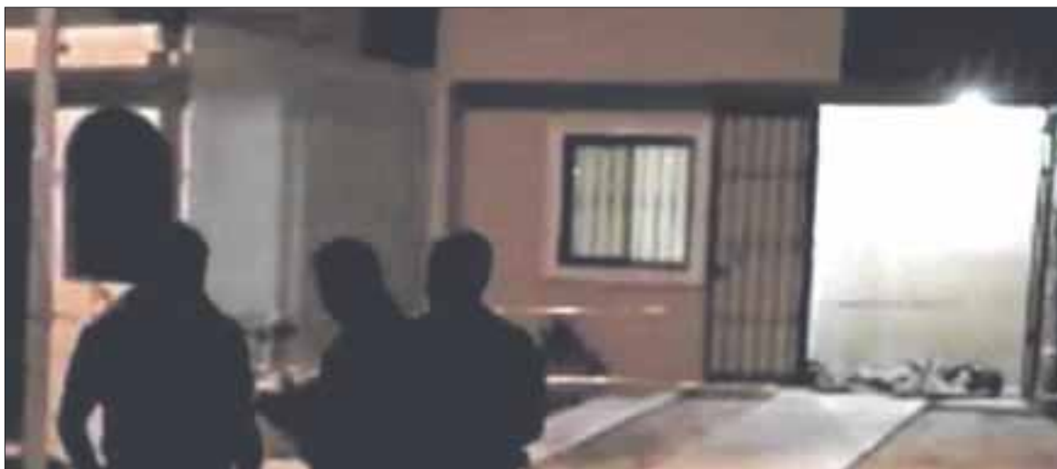
Padre e hijo protagonizaron una discusión en una colonia de la ciudad de Saltillo, Coahuila, con resultados trágicos.

Saltillo.- La tragedia alcanzó a una familia, luego de que un joven asesinara a su padre a golpes, esto tras protagonizar una discusión en una colonia de la ciudad de Saltillo, Coahuila.