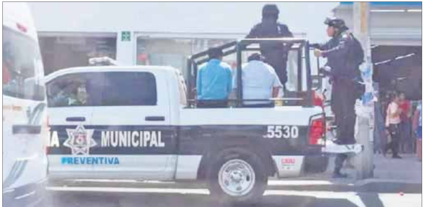
De acuerdo la Policía Municipal de Cancún, la participación de los elementos de la corporación en el operativo en “El Crucero” sólo fue de apoyo.

Reiteraron que el actuar de la policía fue con abuso de autoridad y de fuerza excesiva, ya que le arrebató la mercancía y los detuvieron con violencia.