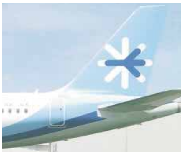
A Toronto, desde Ciudad de México y Cancún.