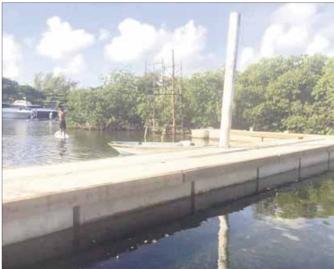
La construcción de un muelle impide el paso del canal natural de navegación en la Laguna Nichupté, en Cancún.

Que hoy estará en Quintana Roo, proveniente desde el CEN del PRI, Christopher James Barousse, quien presentará en el estado la Agenda 2030, bajo el tema “Combate a la corrupción”, miraaaaa, “el burro hablando de orejas”, pues desde el