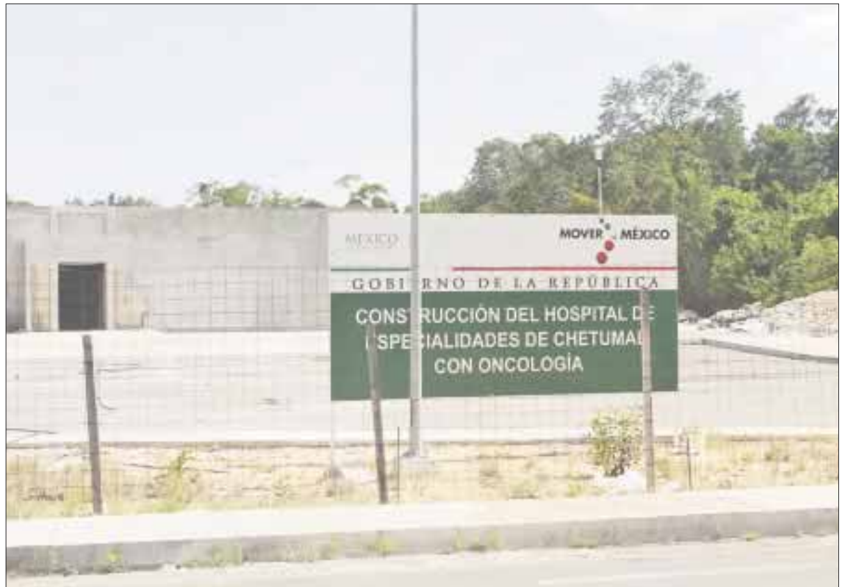
Siguen paradas las obras del Hospital de Oncología para Quintana Roo, hasta que concluya una auditoría.

Es decir, primero la auditoría y luego la salud de cientos de enfermos que padecen algún tipo de cáncer y que hasta la fecha no pueden ser tratados en Chetumal.