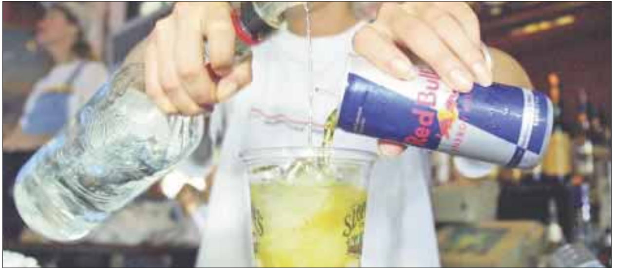
Están claramente prohibidas las bebidas energéticas combinadas con alcohol en centros nocturnos, bares y cantinas, al representar un riesgo para la salud.

En lo que va del año en la dirección, no se tiene ninguna queja o denuncia por personas que hayan tenido alguna afectación a su salud por el consumo de bebidas alcohólicas adulteradas.