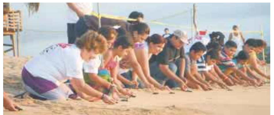
En Riviera Nayarit también se liberan tortugas.

En Riviera Nayarit podrás encontrar los mejores paisajes desde la primera hora del día hasta el anochecer, auténticos para disfrutar en compañía o en solitario, son escenarios casi perfectos en los que podrás relajarte y buscar actividades que no requieran de esfuerzo físico, pero