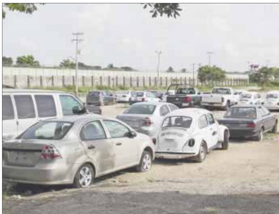
La subasta de vehículos resultó un fracaso, pues ni quienes la organizaron ni quienes adquirieron los vehículos los habían revisado y éstos habían sido "deshuados".