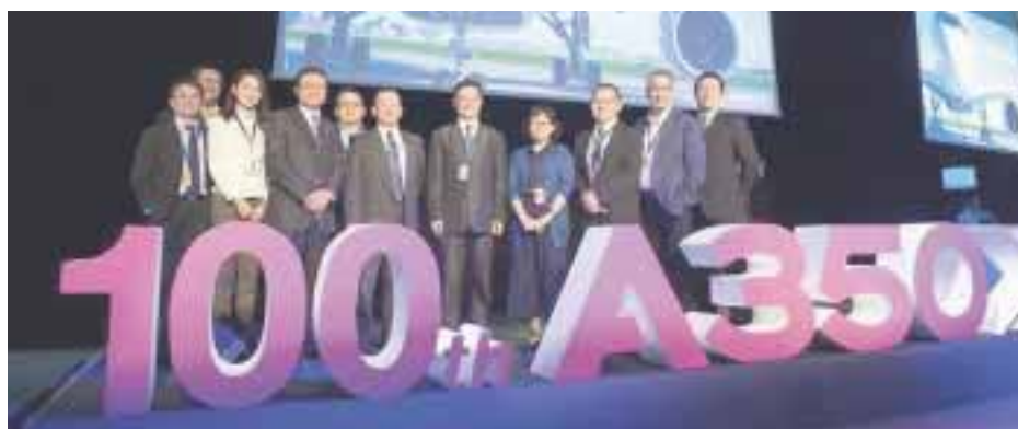
Airbus entrega el nuevo avión a China Airlines.