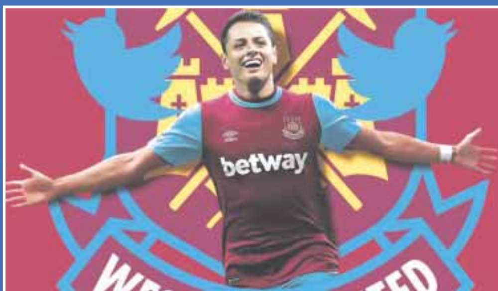
Javier Hernández se integró al entrenamiento de “los martillos” para encarar este viernes al Werder Bremen de la liga alemana.

El delantero mexicano Javier “Chicharito” Hernández se reportó con su nuevo equipo el West Ham United en Alemania para comenzar con su entrenamiento previo al inicio de la temporada 2017-18.