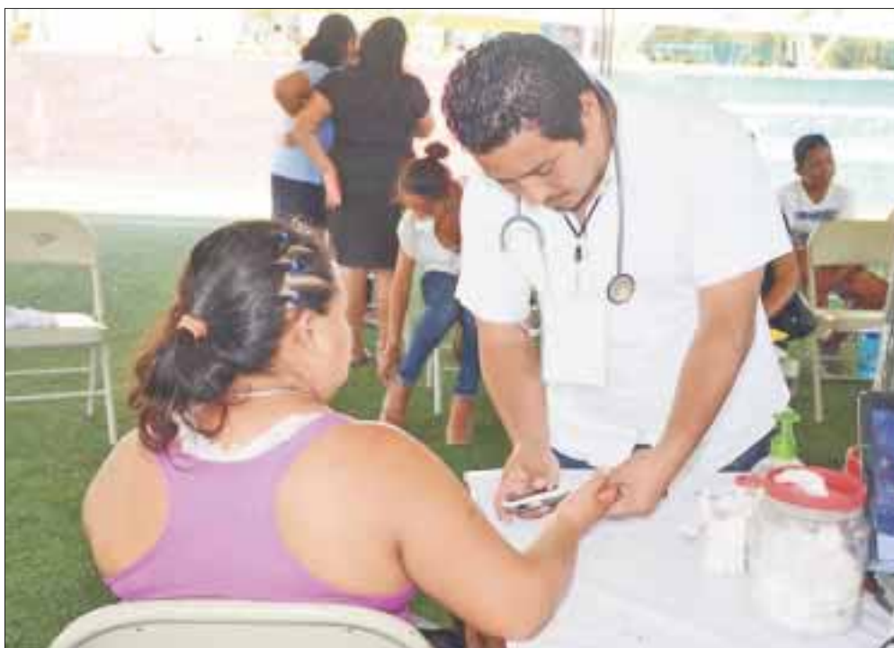
Durante la audiencia pública, Sesa participó con el programa “Médico en tu casa”.