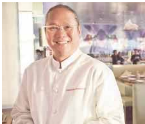
El Iron chef, Masaharu Morimoto.