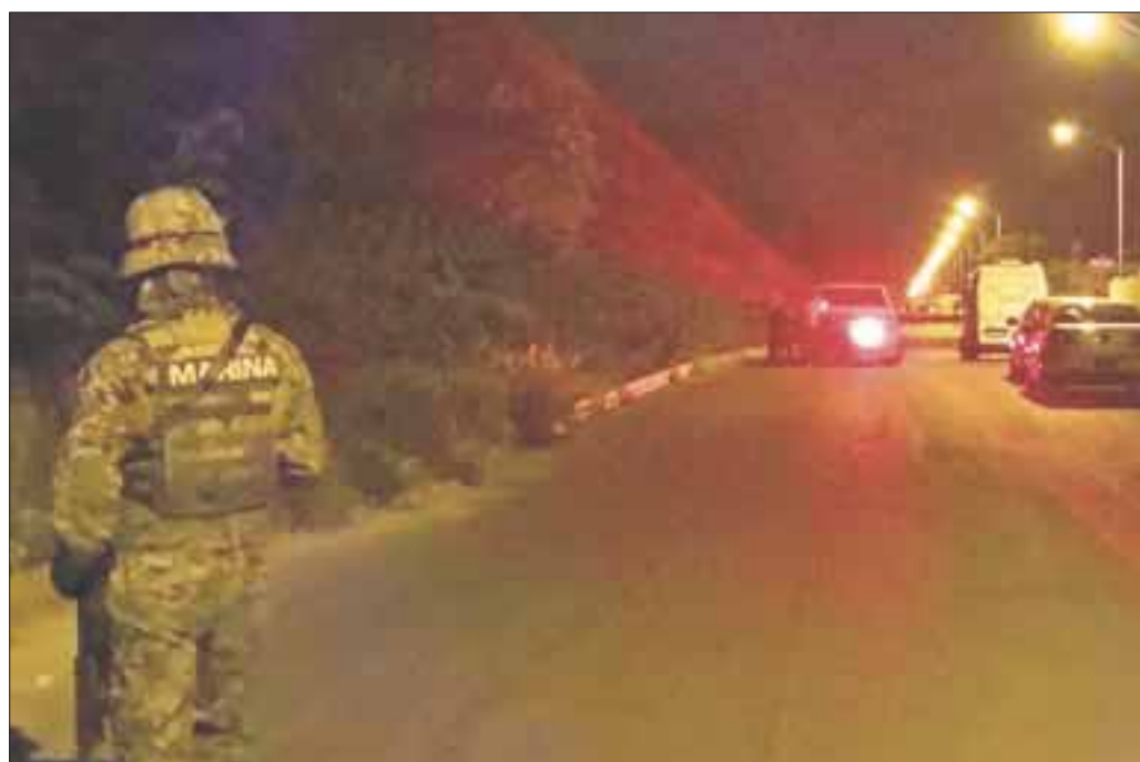
El cuerpo fue trasladado al Servicio Médico Forense para la necropsia de ley y está en calidad de desconocido.

También se le apreciaron lesiones, en el surco en el cuello, lesión contusa en parietal derecho, lesión corto-contusa arriba de la ceja derecha, escoriación en hombro derecho, escoriación en hombro izquierdo, por lo que se determinó que pudo haber muerto por asfixia