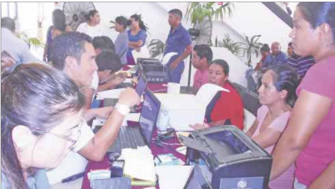
El cónsul general de Guatemala en Tabasco trasladó su oficina provisionalmente a Cancún, a petición de los guatemaltecos que radican y trabajan en este destino vacacional.

Cancún.-En el lobby del Palacio Municipal se colocó un consulado móvil de Guatemala, en el que durante este fin de semana, hasta el domingo, atenderán a ciudadanos de ese país, que requieren algún documento oficial como pasaportes, constancias de identidad, inscripciones consulares y otro tipo de asesorías