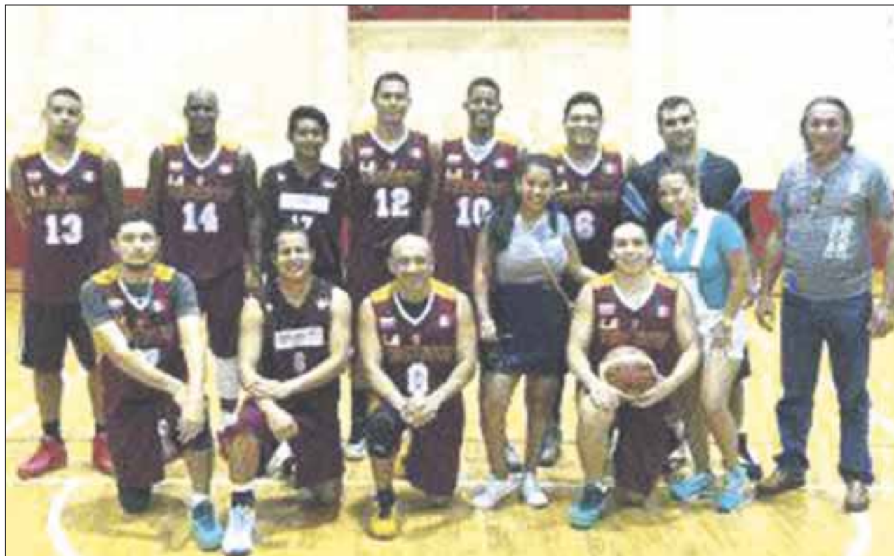
La Vinotinto sigue sorprendiendo a propios y extraños, al sumar una victoria más y mantenerse como líder invicto del Torneo de Basquetbol de Primera Fuerza en Cancún.

En otros resultados, Ingeniería pasó sobre Panteras 78-62, para llegar así a nueve victorias con una derrota y una diferencia a favor de +146, mientras que Panteras se quedó aún sin conocer la victoria, con marca ahora de 0-7, con una diferencia de -163 puntos, ubicándose en el fondo de la tabla