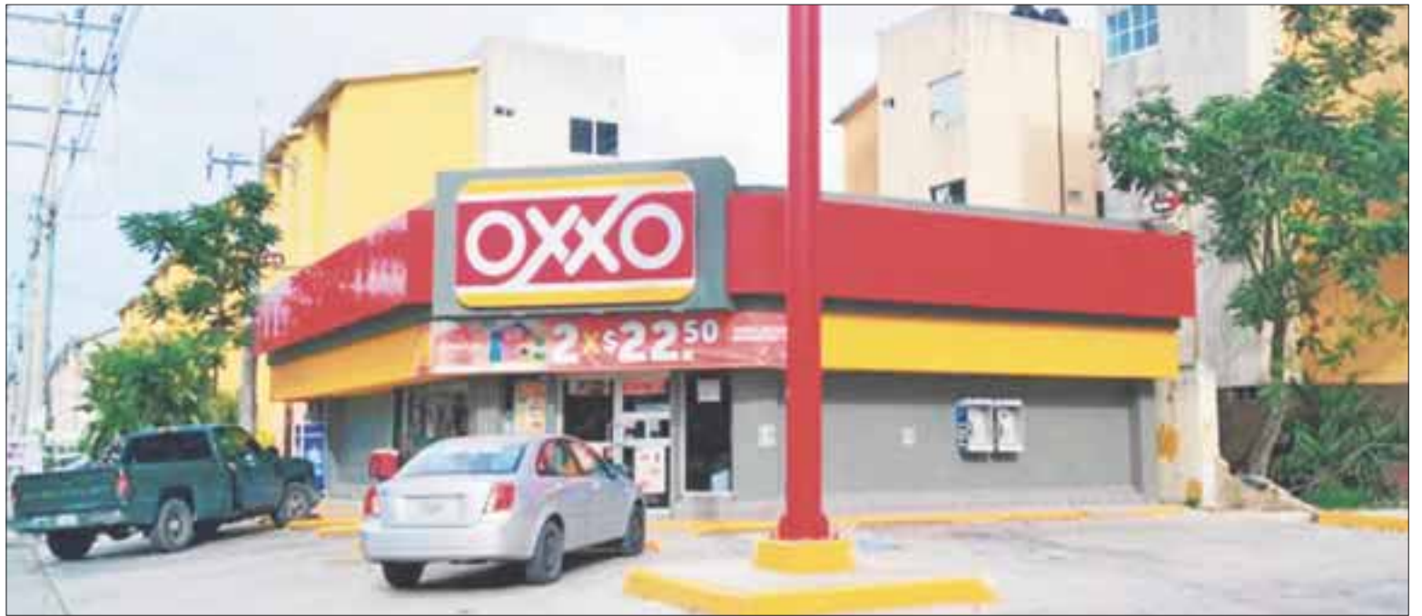
Como ya es costumbre, los presuntos asaltantes huyeron como Pedro por su casa, sin que ninguna autoridad los detuviera.