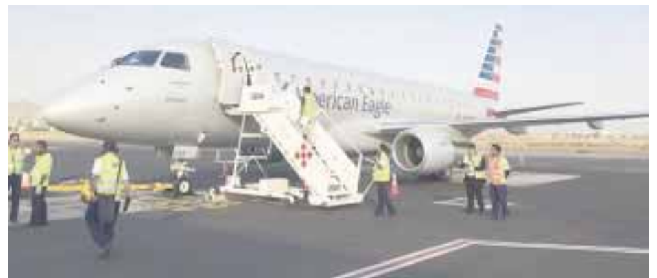
La aerolínea estrena aviones en tres rutas del país.