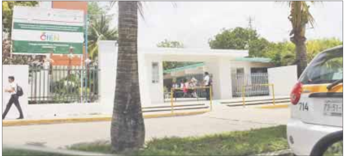
Persisten viejos vicios educativos en el Colegio de Bachilleres Plantel 1, de Chetumal, denuncian alumnos.