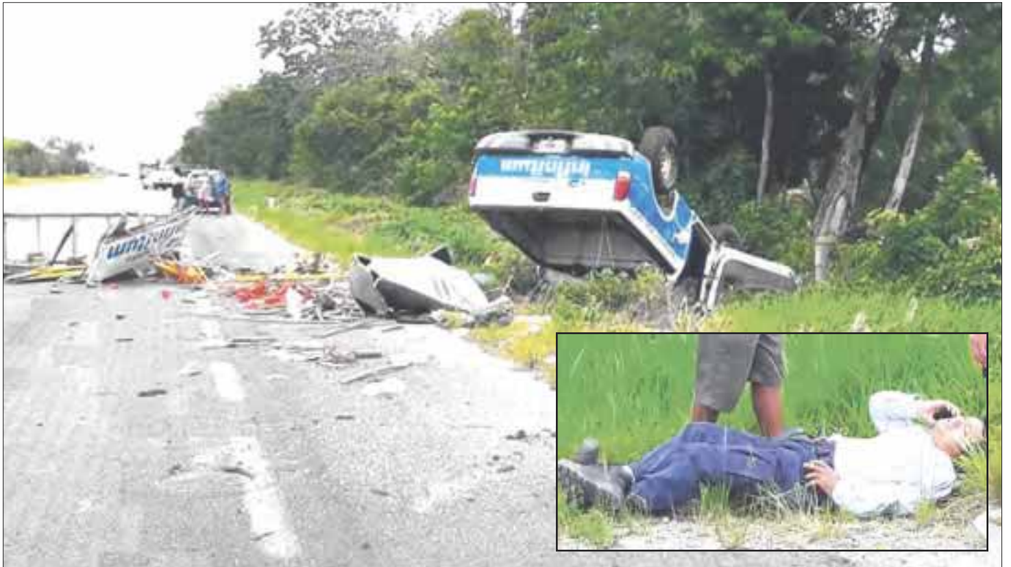
El chofer de esta camioneta tenía prisa por llegar a Chetumal y subió la velocidad. Las pérdidas ascienden a 200 mil pesos.

La unidad fue trasladada al Corralón de Chetumal, en tanto que las pérdidas cuantificadas en casi 200 mil pesos.