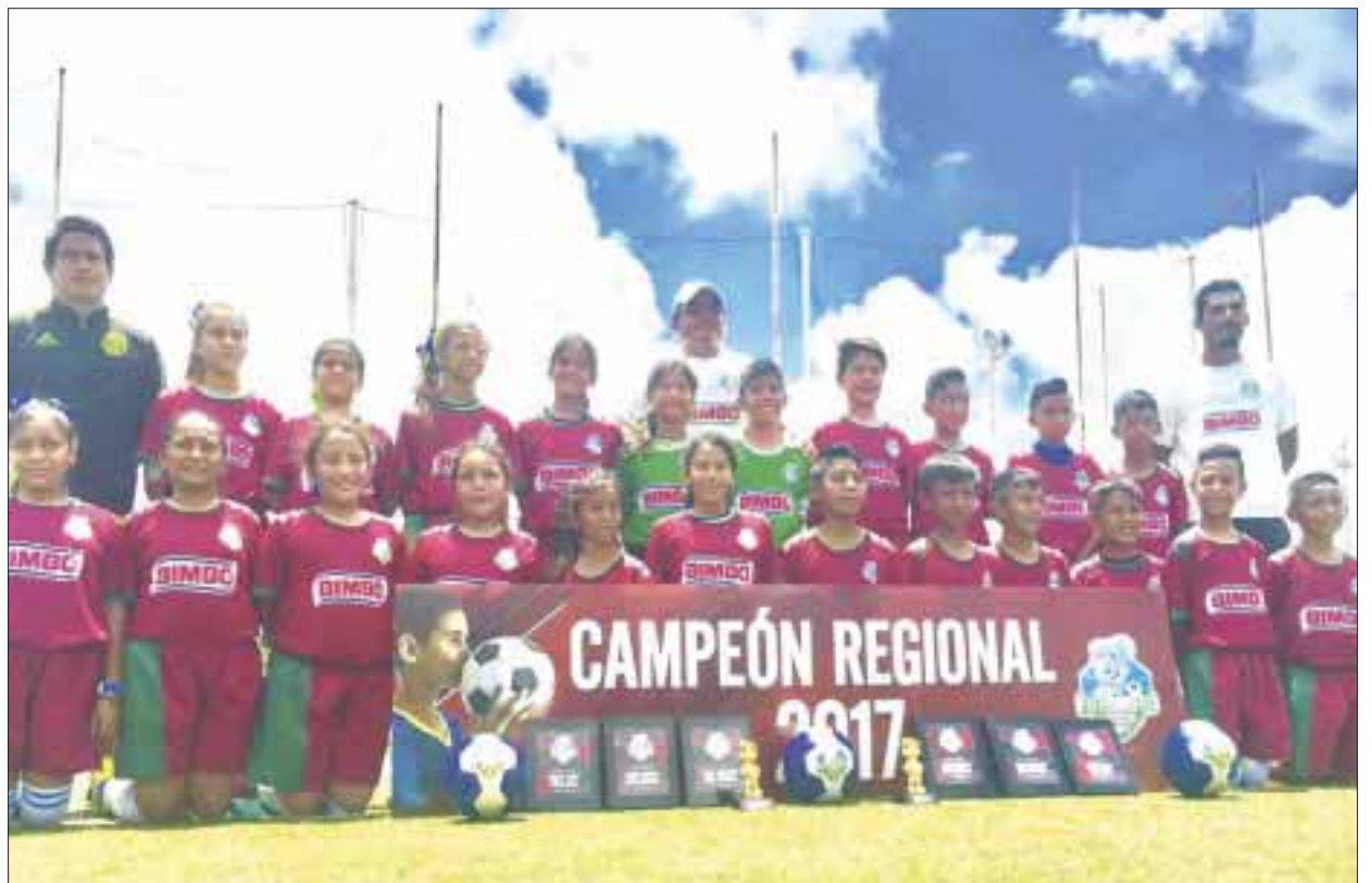
Leones Negros del Colegio Valladolid nuevamente se consagran en la etapa regional, al obtener los dos campeonatos, tanto en varonil como en femenino, en el Torneo Futbolito Bimbo 2017.