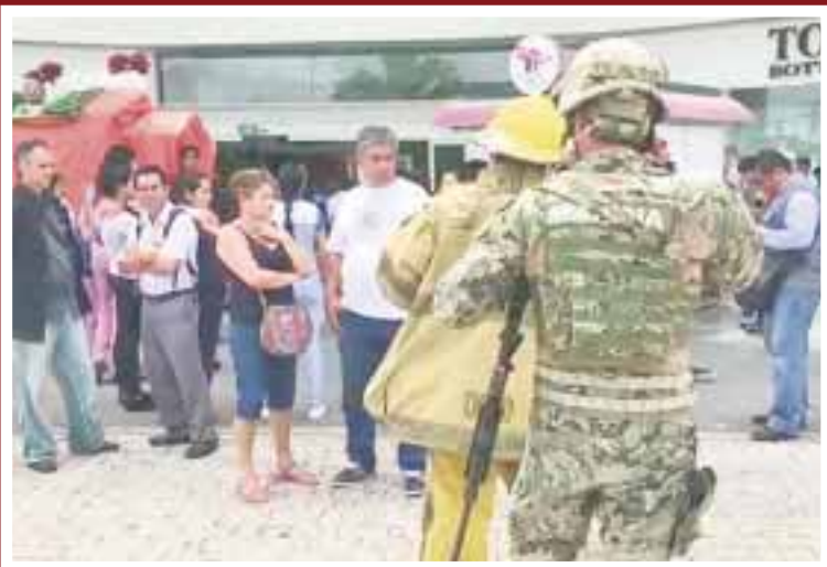
Cientos de personas se concentraron a las afueras de la Plaza Las Américas, custodiada por elementos de la policía local, federal y el Ejército Mexicano.

Llama la atención que la Fiscalía General del estado sólo ha logrado la detención de dos presuntos responsables que fueron trasladados a la cárcel de Cancún. Dos detenidos tras 62 ejecutados.