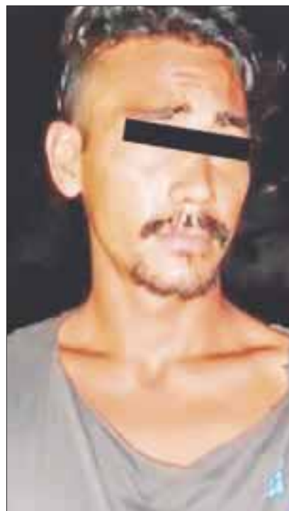
Las cuatro personas, quienes dijeron llamarse, José N., Juan N., Lea N., y el menor F.S.G., de 17 años, fueron trasladadas a la Secretaría Municipal de Seguridad Pública.

Cancún. -Tres sujetos y un menor de edad asaltaron a un transeúnte para despojarlo de su celular, una cadena de oro y 2 mil 800 pesos en efectivo.