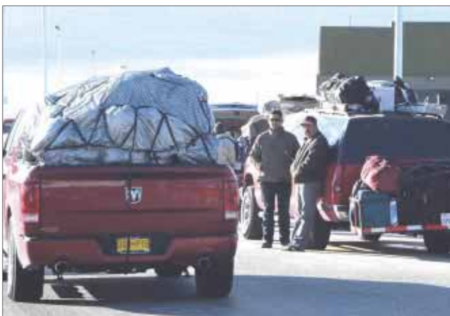
El Operativo de Verano 2017 del Programa Paisano apoyará en su ingreso, tránsito y salida del país a cerca de 4 millones de connacionales.

El Instituto Nacional de Migración (INM) puso en marcha ayer lunes, el Operativo de Verano 2017 del Programa Paisano, a fin de apoyar en su ingreso, tránsito y salida del país a cerca de 4 millones de connacionales residentes en Estados Unidos y Canadá, que se prevé arriben al país durante este periodo vacacional.