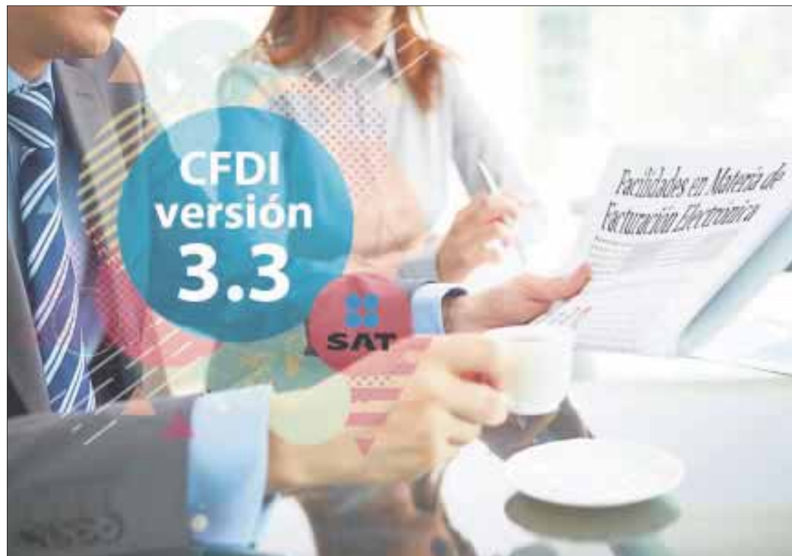
Desde el 1 de diciembre de este año será obligatorio emitir facturas electrónicas en la nueva versión 3.3, anuncia el SAT.

Exhortó a los contribuyentes obligados a emitir facturas a estar listos para que estos cambios sean incorporados por sus Proveedores Autorizados de Certificación (PAC), los cuales cuentan con la autorización del SAT para procesar los comprobantes fiscales de sus clientes.