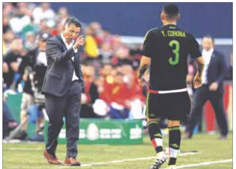
El técnico Juan Carlos Osorio ya encontró la fórmula para hacer del “Tri” un equipo ganador, dice el ex portero de la selección nacional, Jorge Campos.

“Creo que en ese aspecto hay problema, me llena de orgullo de que tenemos buenos porteros, ya he estado ahí y los que cubren ese puesto lo han hecho muy bien. El problema es fortalecer el medio campo hacia arriba, pues la portería está muy bien cuidada”, concluyó.