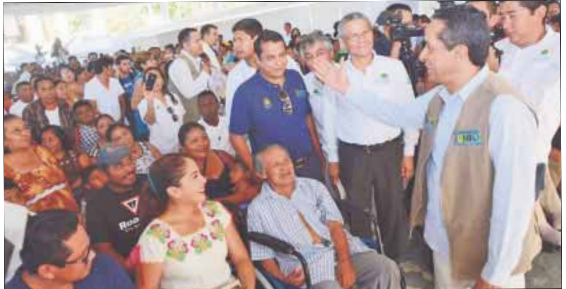
El gobernador Carlos Joaquín encabezó el programa "Caravana Juntos, Por Más y Mejores Oportunidades" en la comunidad Ignacio Zaragoza.

El gobernador recaló a poco más de un año la gente decidió cambiar el rumbo del estado, harta de las formas más perversas de exclusión y desigualdad generada por un grupo en el poder que evidenció su corrupción al privilegiar a unos cuantos. "Llegamos a ofrecer un cambio y trabajar con la gente, y si queremos trabajar con la gente hay que estar donde están los problemas y donde us-