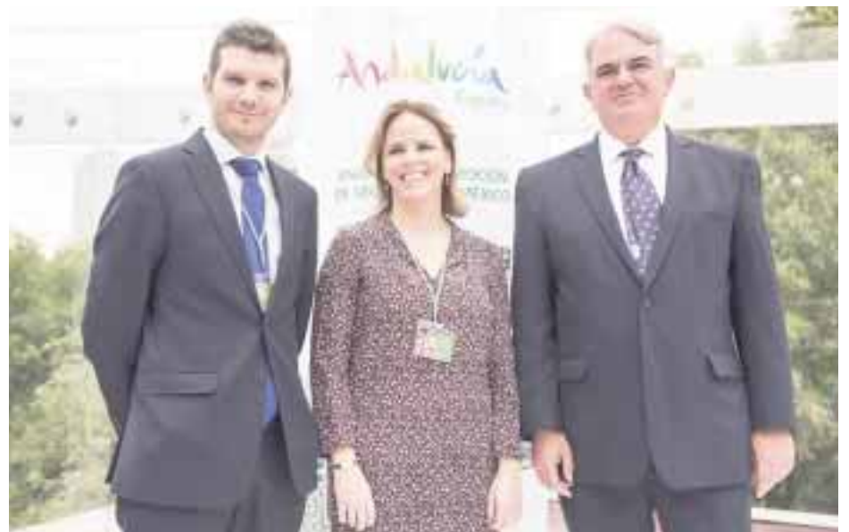
En la inauguración de la 2ª Muestra de Productos Gourmet Andaluces.