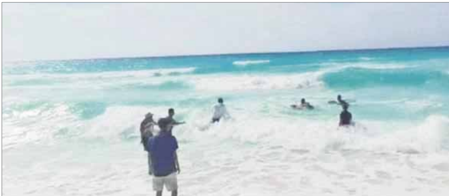
Las condiciones climatológicas en época de huracanes mantienen al mar con alto grado de peligrosidad, pero algunos turistas no respetan las indicaciones.

Paramédicos y policías municipales de Cancún atendieron a la turista en el lugar de los hechos, quien fue trasladada a un hospital privado de la ciudad para su revisión médica