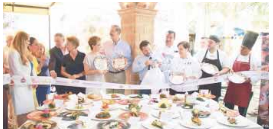
En el "Festival de los Chiles Rellenos".