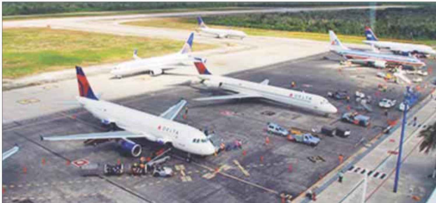
El Aeropuerto Internacional de Cozumel es uno de los mejores recintos aeroportuarios en todo el país, destaca ASUR.

García Luna dijo que a pesar de estar a cargo de la operación comercial del aeropuerto, coadyuva con la coman-