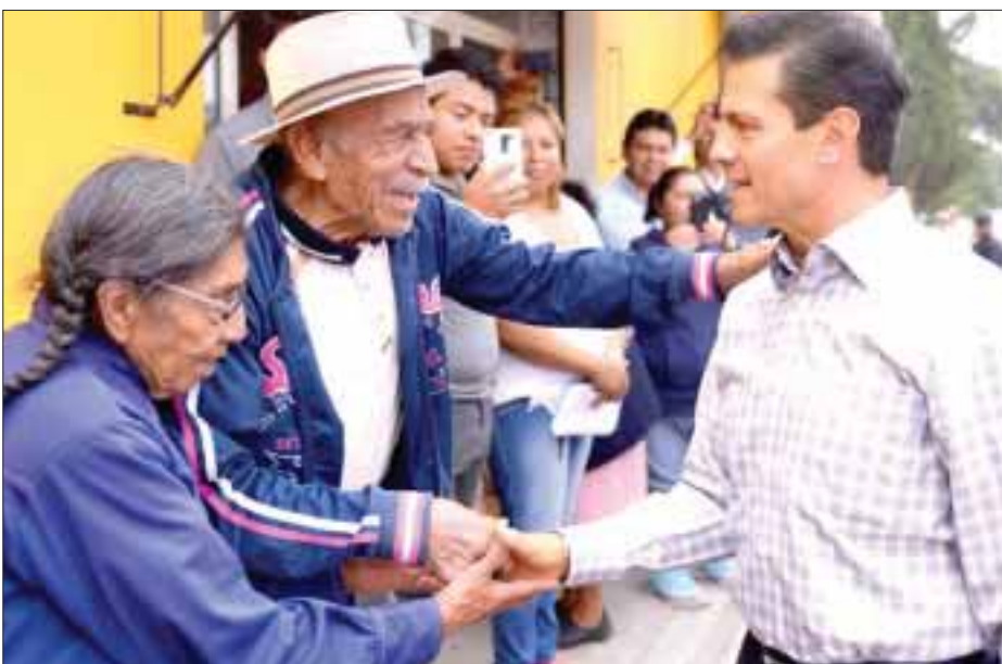
El presidente Enrique Peña Nieto estuvo ayer en Aguascalientes, donde graba uno más de sus promocionales de cara a su Quinto Informe.

El presidente Enrique Peña Nieto destacó que el Programa Puntos México Conectado (PMC) que fue galardonado en Ginebra, Suiza, cierra la brecha digital y democratiza el acceso a las Tecnologías de la Información y la Comunicación (TIC).