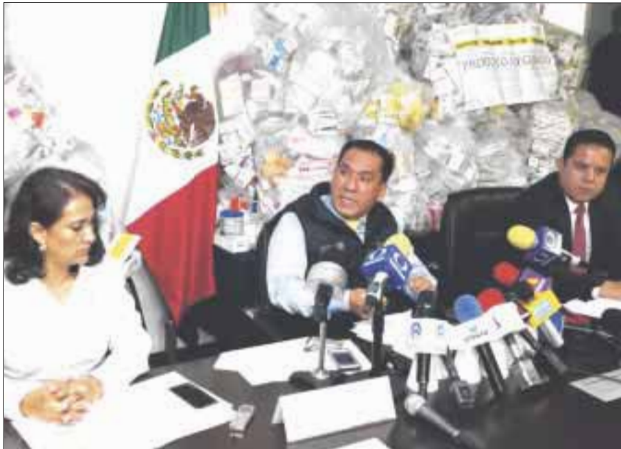
Cofepris confiscó 205 mil 542 piezas de medicamentos irregulares en la colonia El Santuario, en Guadalajara, Jalisco.

En la colonia El Santuario, en la ciudad de Guadalajara