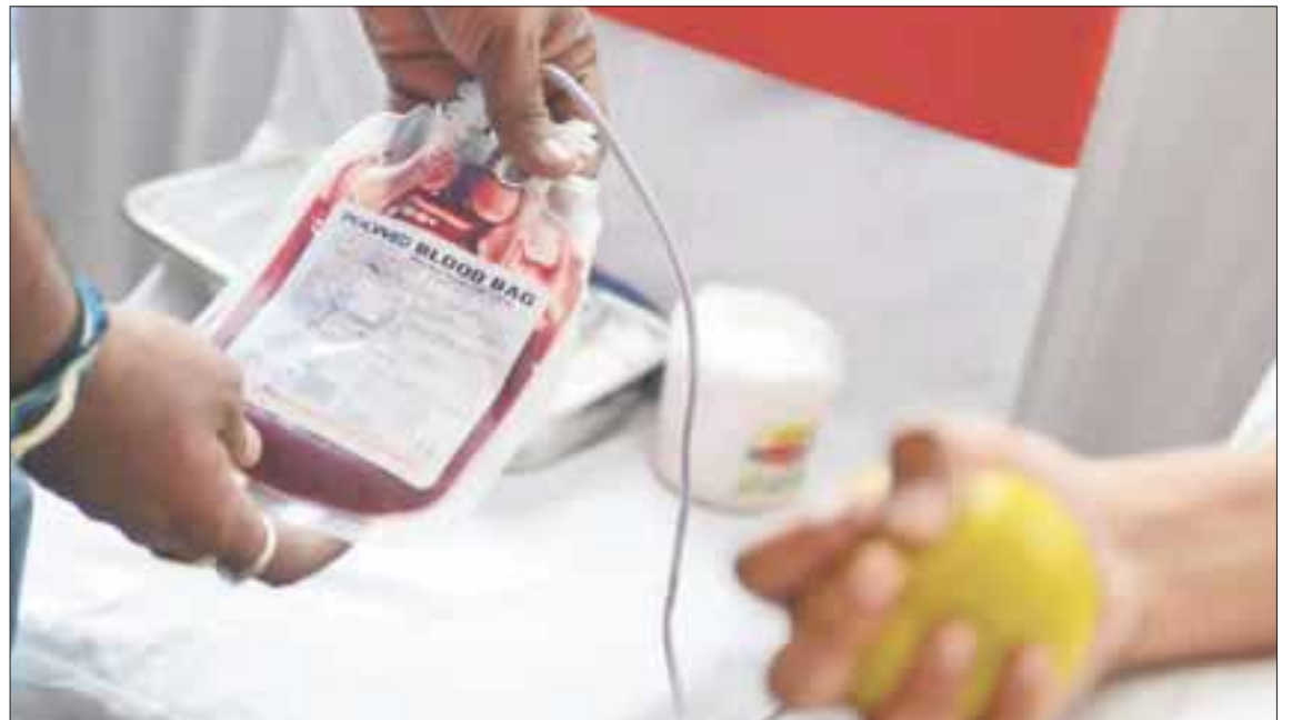
En Quintana Roo, las nuevas generaciones, al igual que los adultos, cada vez acuden menos por su propia voluntad y la mayoría lo hace por alguna emergencia médica o familiar.

De crecer la cultura de donación, se logrará obtener desde glóbulos rojos, plasmas y plaquetas, se extrae de una unidad de sangre que beneficia a quien lo necesita y cumplir el objetivo de hacer conciencia que promueve la Organización Mundial de la Salud.