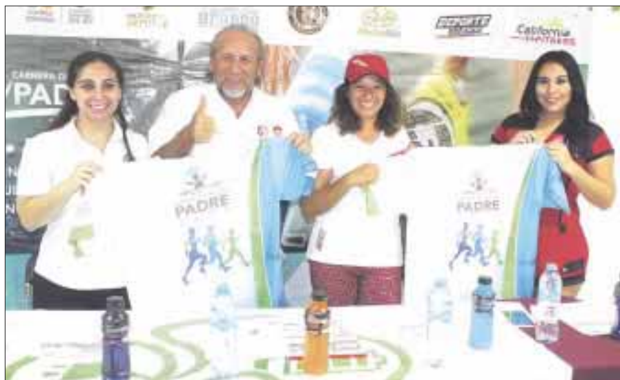
A partir de las 7:00 horas arrancará la más tradicional de las competencias, con las familias esperando en la meta.

Cancún.- A fin de celebrar el Día del Padre, se anunció la realización de la vigésima edición de la "Carrera del Día del Padre 2017", que se correrá este domingo 18, a partir de las 7:00 horas sobre la avenida Bonampak.