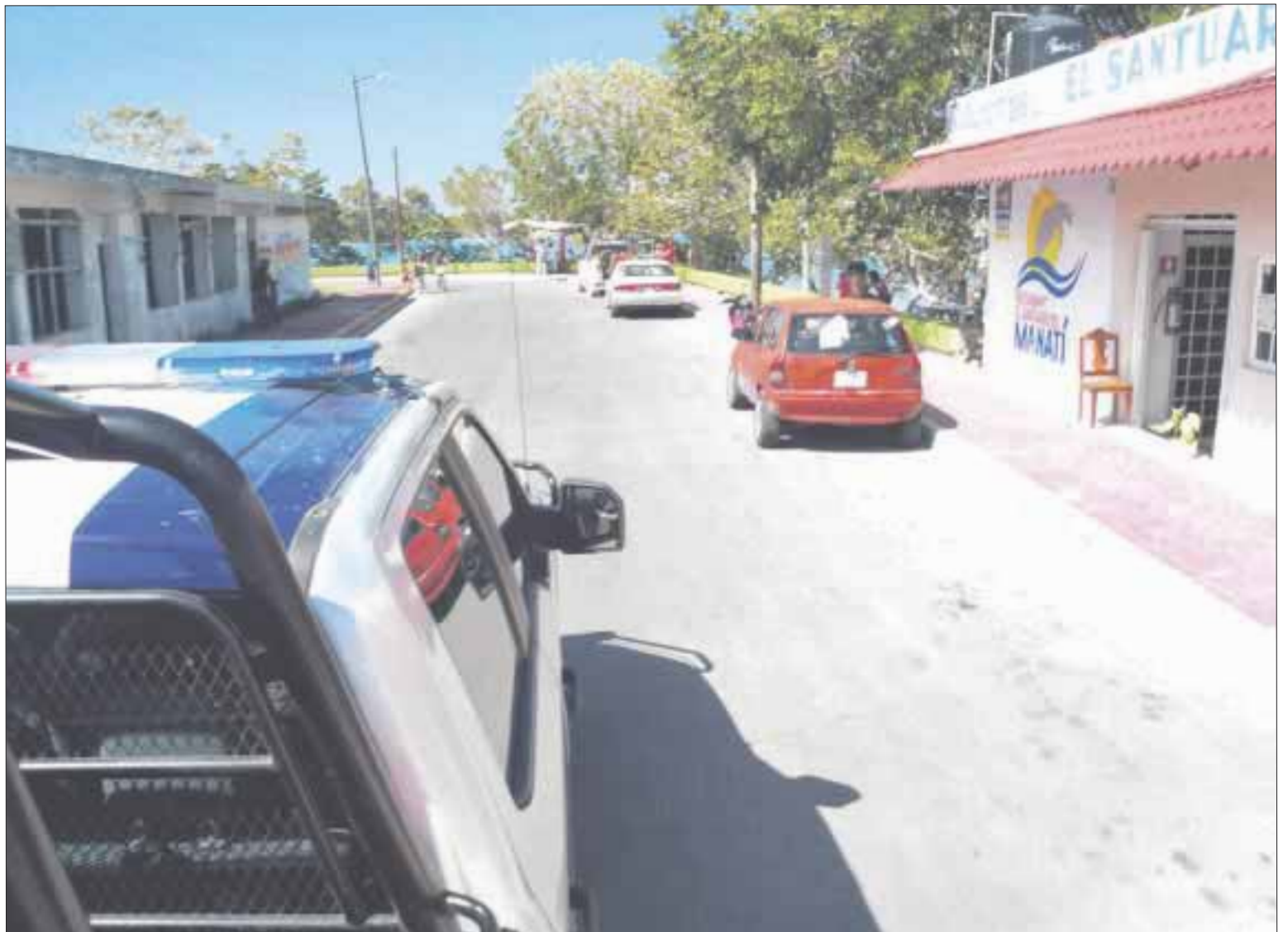
Un empleado de una empresa dedicada al reparto de pollo y huevo, fue seguido por dos hampones que encapuchados lo esperaron y luego de quitarle su "caja móvil", huyeron en motocicleta.

Sólo explicó que huyeron en una motocicleta tipo Italika sin placas de circulación rumbo a Xul-Há. Los elementos de la PEP no ubicaron a nadie con las características señaladas por el presunto afectado.