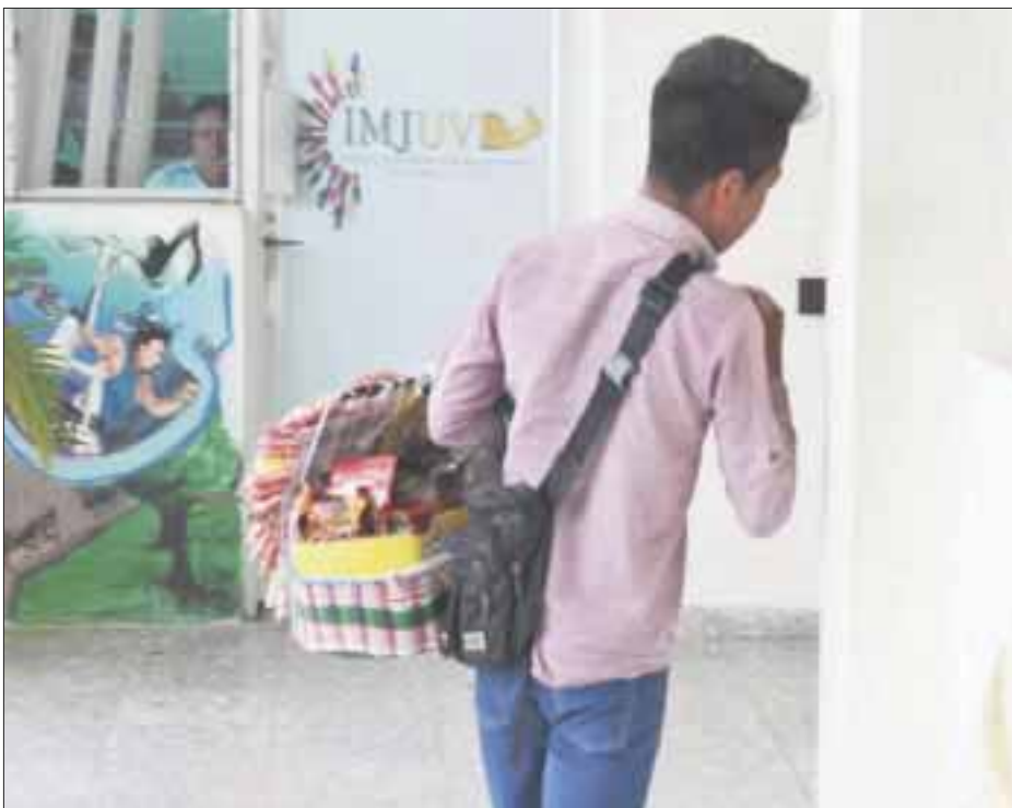
Fiscalización del ayuntamiento va por el clásico “moche” y no pone orden entre los vendedores ambulantes y diversos artistas callejeros.

Chetumal.- La Dirección de Fiscalización del ayuntamiento va por el clásico “moche”, sin poner orden en vendedores ambulantes, voceadores, limpia parabrisas y diversos artistas que se ganan la vida frente a los semáforos en las esquinas de las principales avenidas de la ciudad.