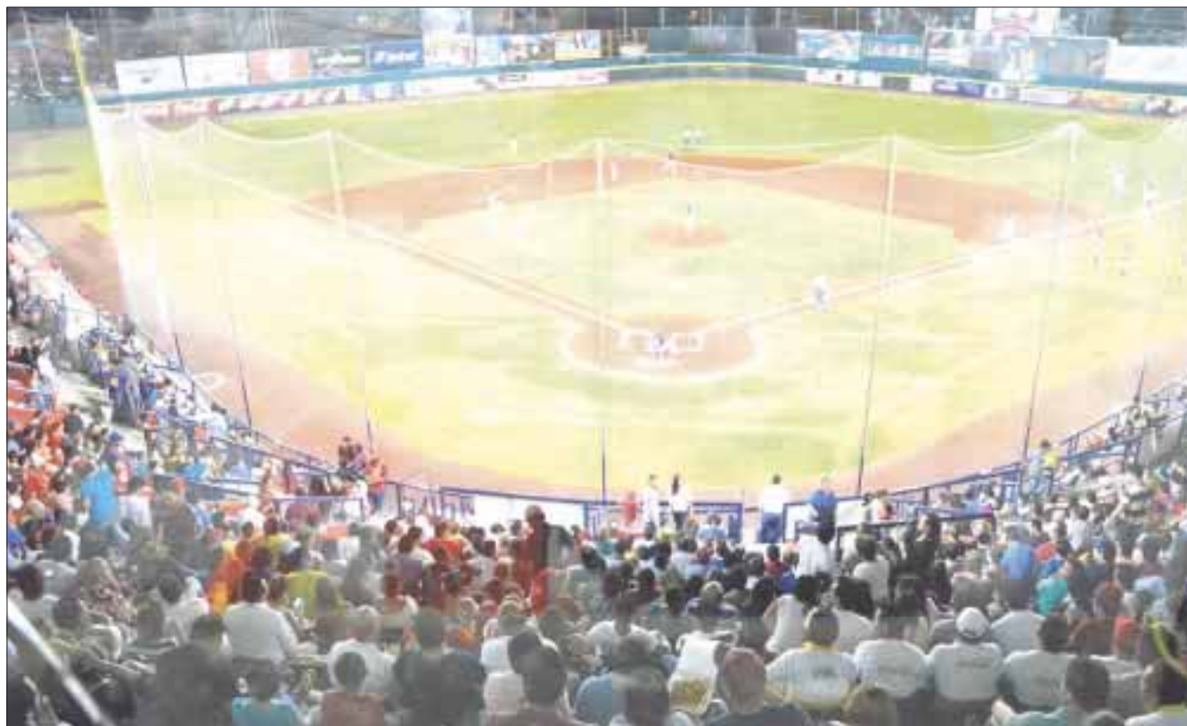
A partir de este 16 de junio la ciudad de Campeche recibirá por tercera vez en su historia el Juego de las Estrellas de la Liga Mexicana de Beisbol.

A partir de esa temporada, la zona norte comenzó una hegemonía sobre los equipos del sur en la fiesta de medio calendario derrotándolos en cinco años consecutivos, misma situación en la que se encontraban los sureños hasta la temporada pasada cuando vieron cortada su seguidilla en Monterrey, Nuevo León.