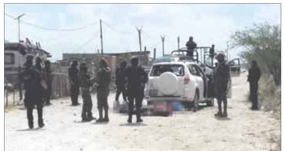
Los cuerpos quedaron a un costado de una camioneta Toyota RAV 4 color blanca.