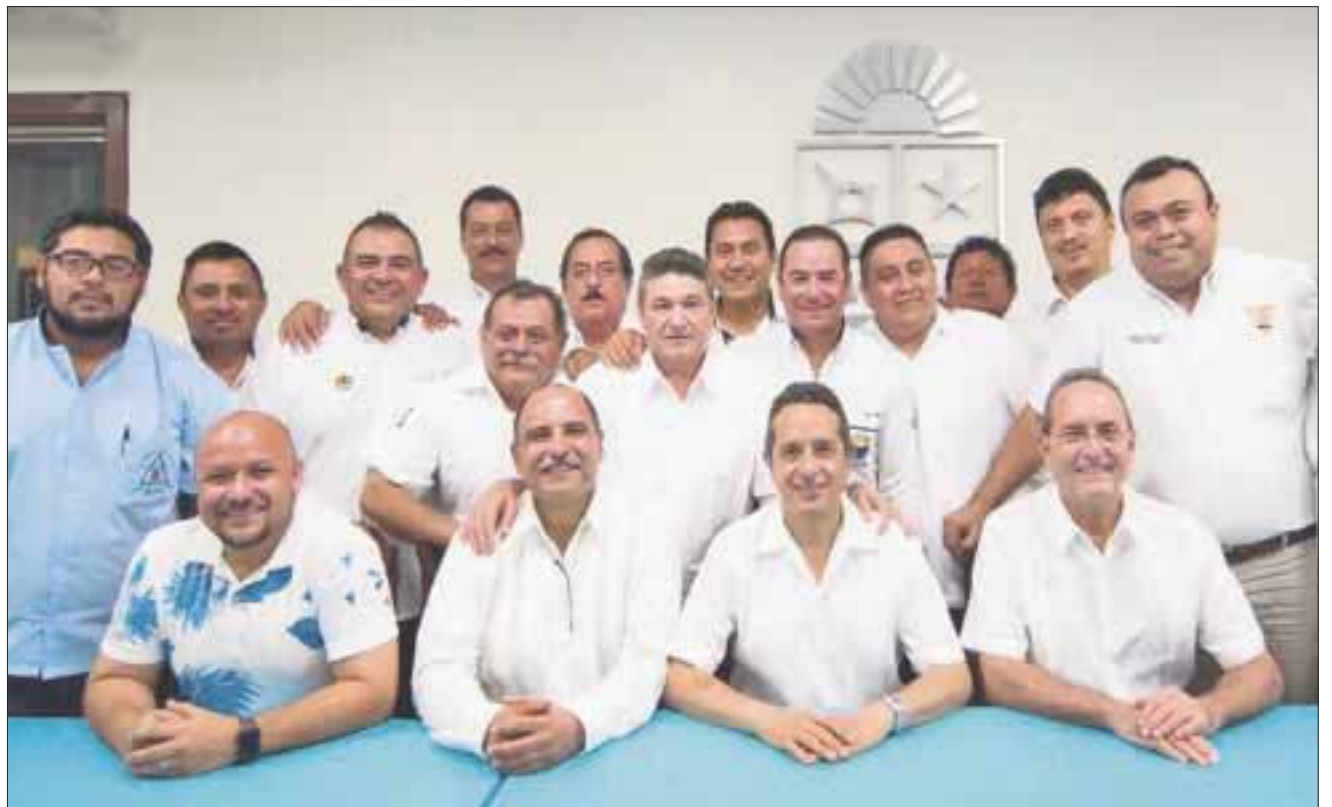
Líderes de los 17 sindicatos de taxistas se reunieron con el gobernador del estado, Carlos Joaquín.

A pesar del retiro de las unidades, el pasado mes de mayo, la empresa Uber advirtió que, pese a la “violencia y agresión” que sufren, mantendrán el servicio y crecerán de 2 mil 200 socios conductores a 10 mil al cierre de 2017.