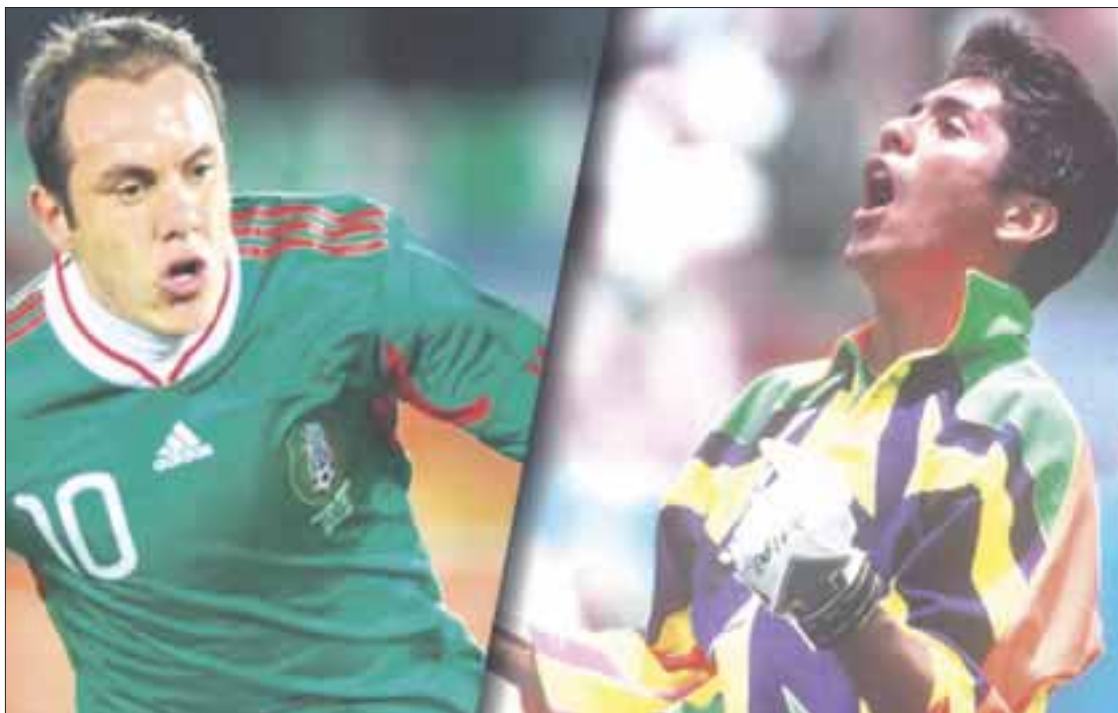
Los futbolistas Cuauhtémoc Blanco y Jorge Campos estarán en el partido amistoso entre leyendas de México y Alemania.

Rememorarán los partidos en los mundiales de 1986 y 1998