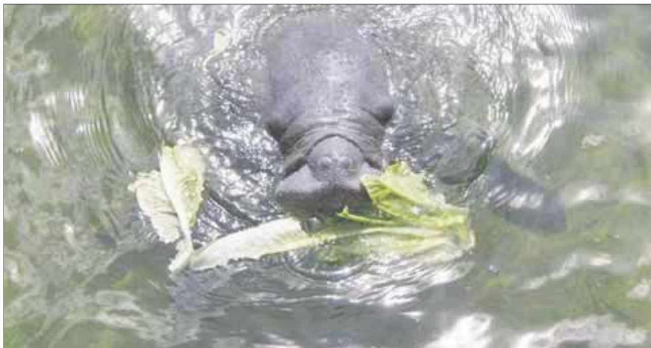
Hasta hace 10 años se tenía conocimiento de la existencia de 150 manatíes en la bahía de Chetumal.

Chetumal.- Actualmente se desconoce el número de manatíes y sus condiciones en la bahía de Chetumal.