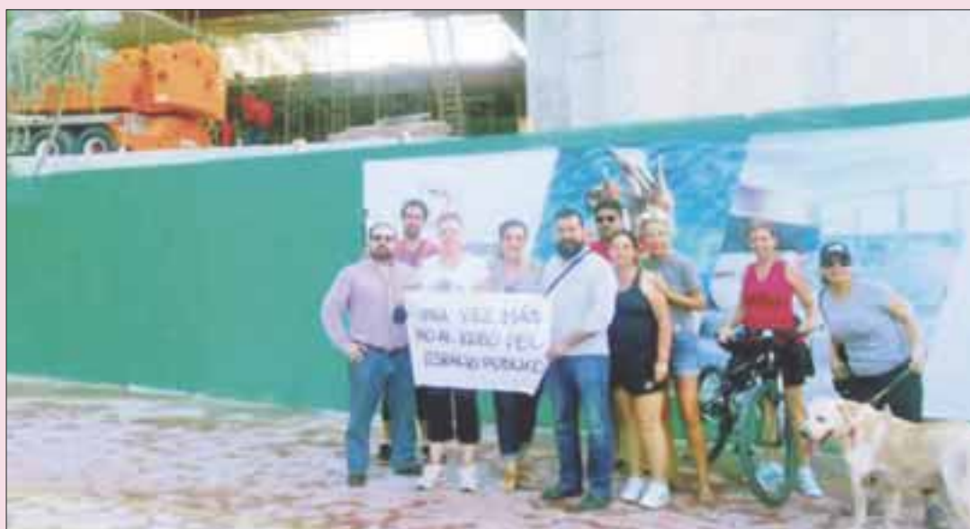
Pese a las protestas ciudadanas, el hotel Temptation se adueñó de espacio público para ampliar su fachada.

Cancún.- Con miras a frenar la corrupción y despojo en torno al caso de la ciclovía en la Zona Hotelera, se promovió su ampliación ante la Procuraduría de Justicia del Estado, al adueñarse el hotel Temptation de cuatro metros de ancho y 25 metros lineales para mejorar su fachada.