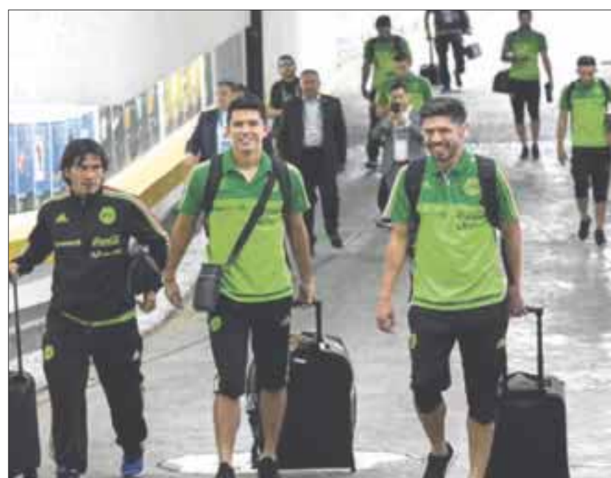
Consideran que el cambio de horario puede ser adverso para la selección mexicana en la Copa Confederaciones Rusia 2017.

Manifestó luego de dos o tres semanas en el continente americano deben “acoplarse al horario en el que estaban, quizá no les cuesta menos trabajo, pero tienen mayor periodo de adaptación porque están más tiempo en ese huso-horario, pero es evidente que sí les pega porque ya estaban acostumbrados al horario de México”.