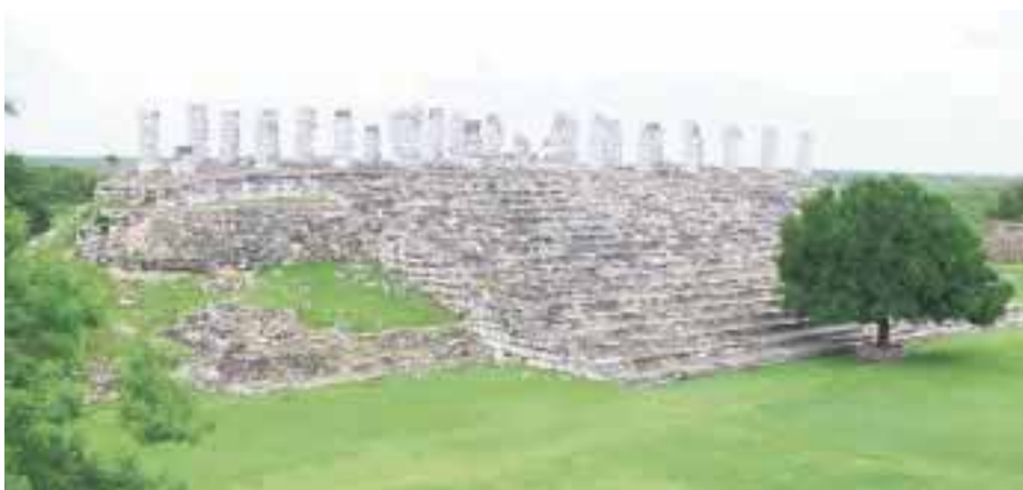
Aquí será el Hokol Vuh.

En su mensaje, Olivera Rocha agradeció al presidente del Centro Fox, Vicente Fox Quesada y a la presidenta de la Fundación Vamos México, Marta Sahagún de Fox , por su participación en las actividades de la 'Cumbre Internacional de la Gastronomía: Mestizaje de Cultura y Sabor'. En este sentido, Olivera Rocha hizo entrega del Plato de la Cumbre como reconocimiento al impulso de la gastronomía.