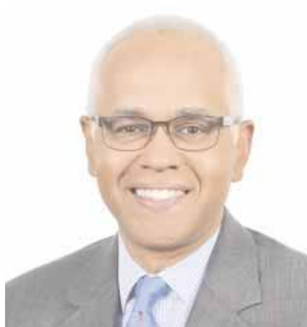
Dionisio D'Aguilar, nuevo ministro de Turismo de Bahamas.