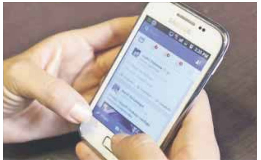
Una de las causas cada vez más comunes de divorcio en esta región es por el uso de redes sociales.

Lo peor en muchos de los casos, es que al descubrir una infidelidad, muchas de las parejas agraviadas hacen público el "descubrimiento" en sus propias redes sociales