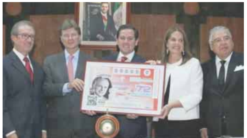
En la presentación del billete de lotería conmemorativo.

El Premio Mayor de 25 millones de pesos lo ganó el billete