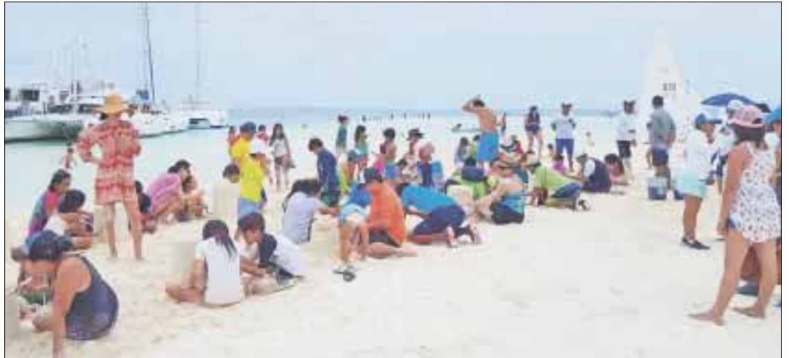
Con la participación de más de 3 mil personas cerró actividades la 5ª. Edición del Festival de los Océanos.

Se inauguró la exposición de la Vaquita Marina en el acuario interactivo unas semanas después reunirse con especialistas de cinco países para terminar de definir el plan que se presentó, días antes de que Leonardo DiCaprio y Carlos Slim se sumaran a la causa, ya que "es una señal de que los temas del festival son vigentes e importantes", ex-