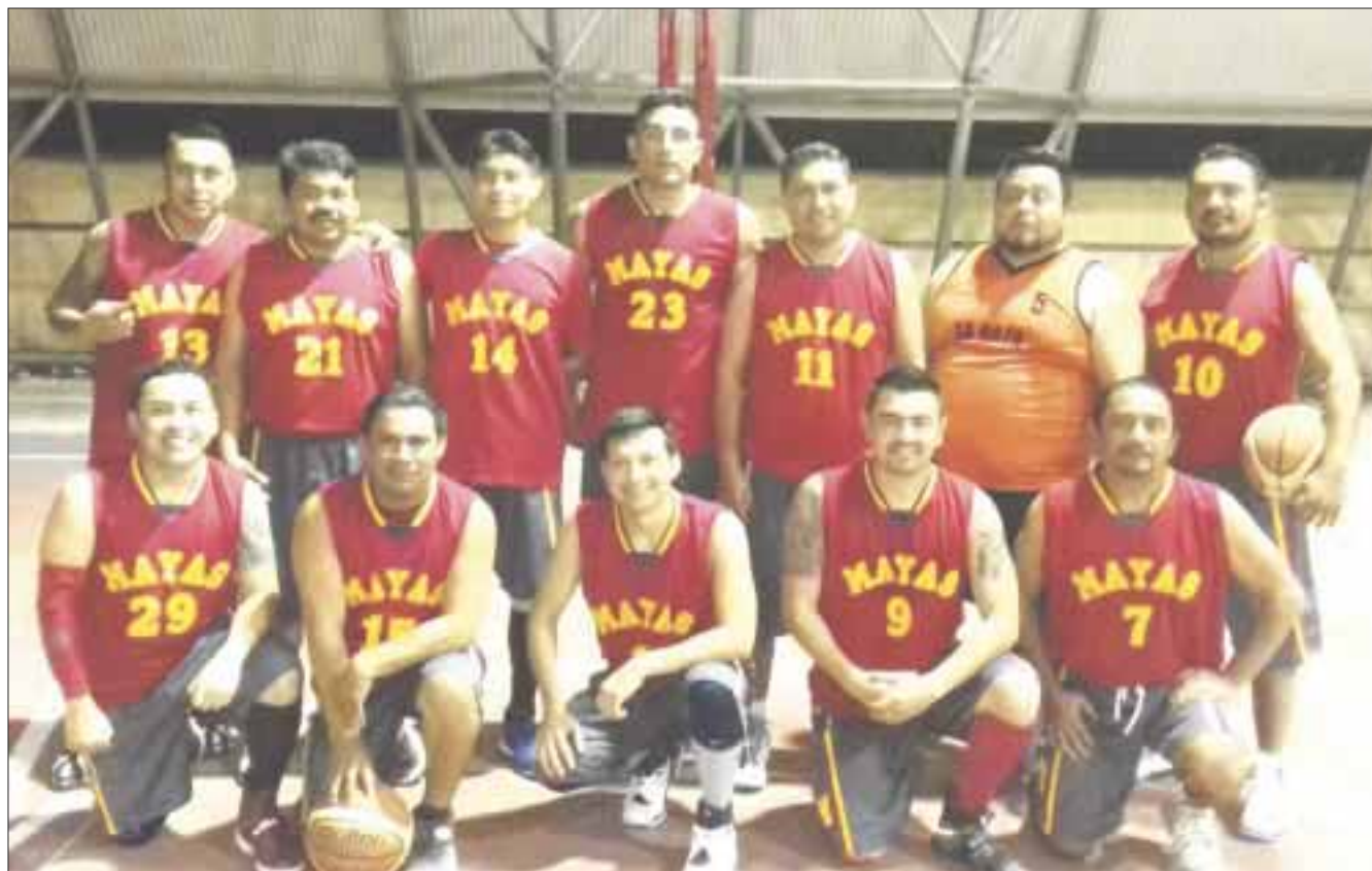
Mayas se mantiene en el tercer lugar de la tabla de la Liga de Basquetbol Popular de la región 103.

Halcones logró propinar tremenda paliza a Hornets 52-22, para borrarlo completamente de la cancha, con una diferencia de 30 puntos.