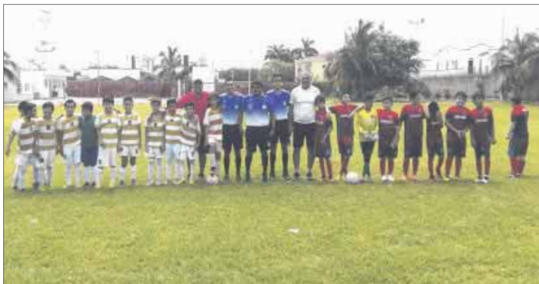
Pasaron a semifinales los equipos de Dorados 2007 y América en la liguilla de la categoría "Pony Niños Héroes" de la Cantera Pompeyense.

Chetumal.- En emocionantes duelos y apoyados por las porras de muchos familiares que se dieron cita en el campo del Tribunal de Justicia se realizó la primera fase de la liguilla de la categoría "Pony Niños Héroes" de la Cantera Pompeyense, pasaron a semifinales los equipos de Dorados 2007 y América.