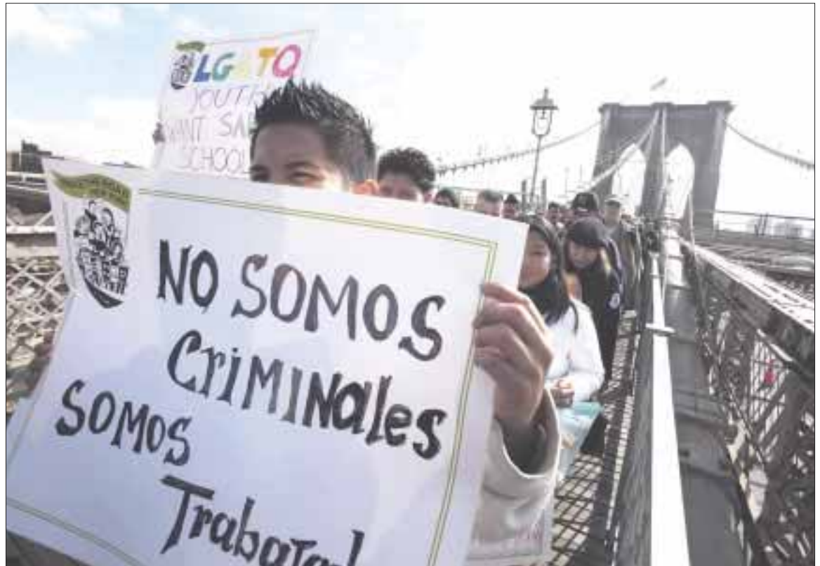
La mayoría de los casos de deportación están radicados en cortes de California, con 37 mil 787; Texas, con 26 mil 814 e Illinois, con 10 mil 658.

Los casos de mexicanos representan la mayoría de los 598 mil 943 casos de migración que se encuentran actualmente en espera de una decisión de parte de un tribunal migratorio en Estados Unidos