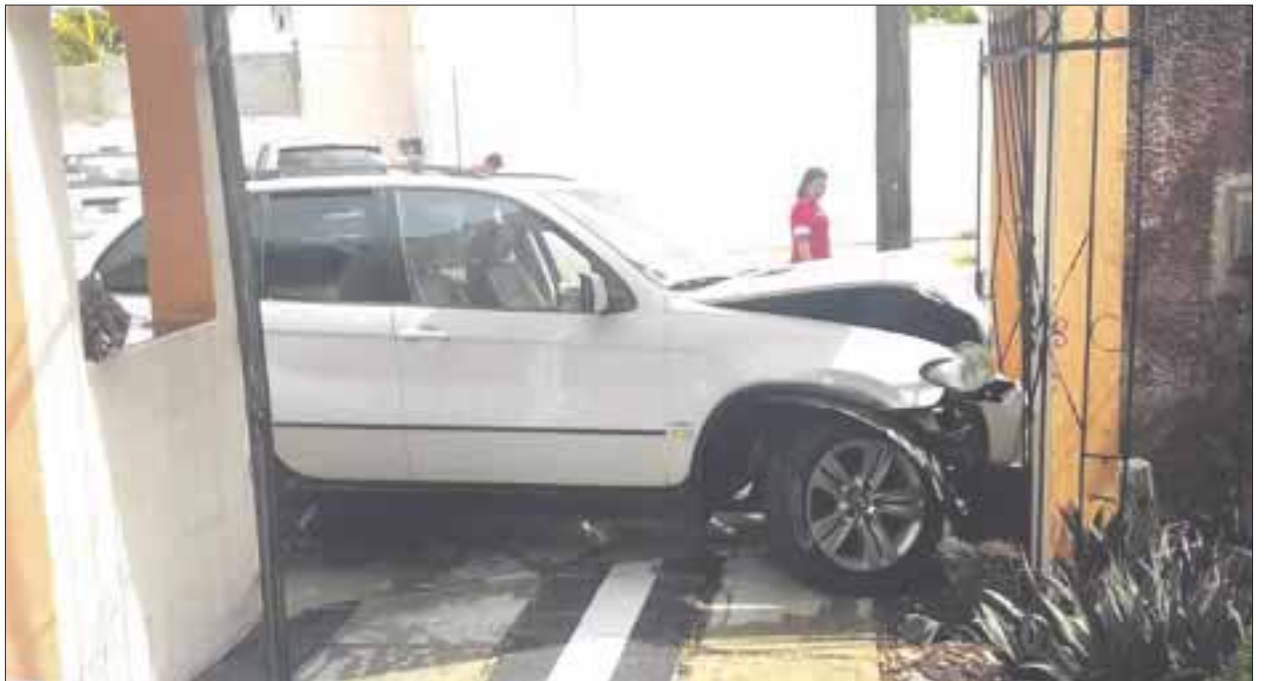
Las malas condiciones del camino y la pertinaz lluvia que se ha dejado sentir, además de la imprudencia al manejar provocaron varios accidentes.

El cuarto de los accidentes, ocurrió en la Unidad Morelos, cuando el vehículo marca BMW tipo X5, color blanco tampoco tomó en cuenta lo mojado del pavimento, y se fue a estrellar en la reja de un predio particular, sin que se registraran lesionados.