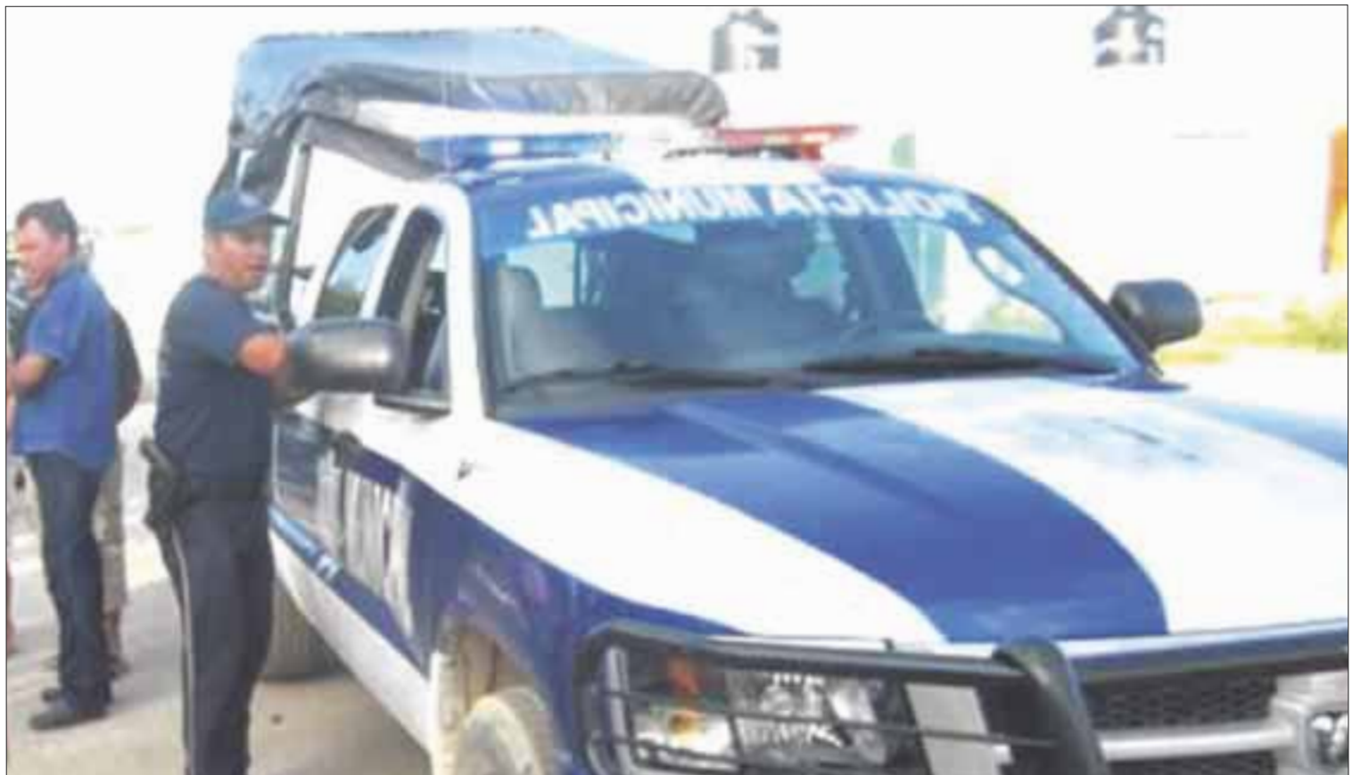
Los vecinos persiguieron al ladrón hasta las instalaciones de la Policía Municipal, ubicadas en la avenida Centenario.