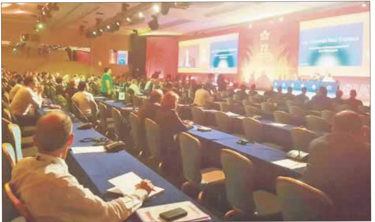
Cancún se consolida como líder en México en la organización de eventos mundiales.

Datos de la Oficina de Visitantes y Convenciones (OVC) Cancún, consideran que entre 20% y 25% de los turistas que anualmente recibe este polo turístico, lo hacen motivados por el turismo de congresos, convenciones, incentivos y bodas.