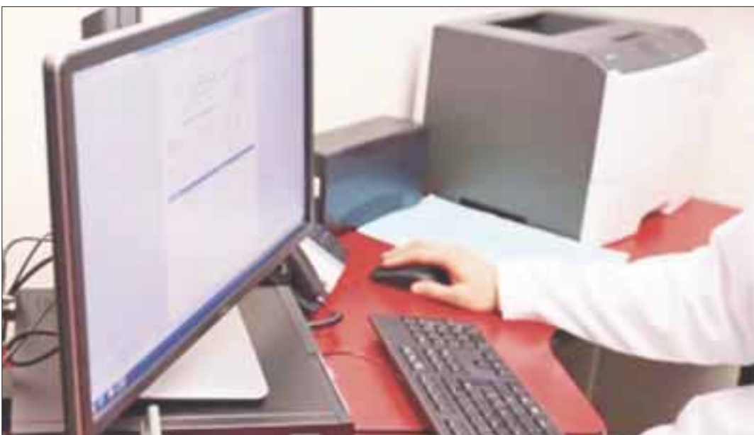
Según el sistema Declaranetplus, de 197 mil 439 funcionarios, 195 mil 483 cumplieron con su declaración patrimonial.

Durante mayo, 99.01 por ciento de los servidores públicos obligados cumplieron con presentar su declaración de modificación patrimonial, lo que representa un incremento en relación con años anteriores, destacó la Secretaría de la Función Pública (SFP).