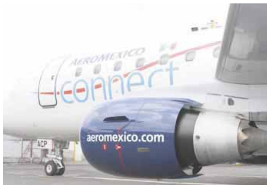
El Embraer 170 operará de Monterrey a Puerto Vallarta.

☆☆☆☆☆ El nuevo ministro de Turismo y Aviación de Las Bahamas, Dionisio D'Aguilar , anunció que su objetivo inmediato es aumentar el número de visitantes a Las Bahamas, y mejorar la experiencia global. D'Aguilar tomó el puesto el 15 de mayo y de inmediato comenzó a reunirse con los empleados del ministerio y funcionarios de la industria.