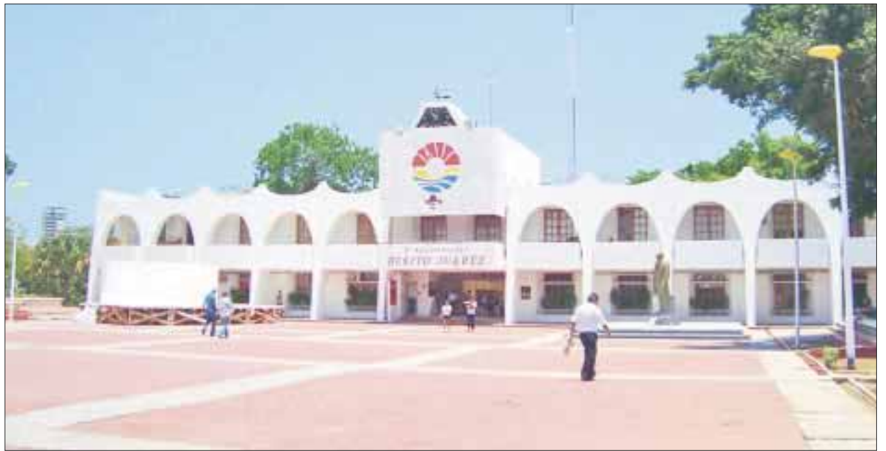
La Mejora Regulatoria es un viacrucis para medianas y pequeñas empresas a la hora de tramitar cualquier licencia o permiso

Las buenas intenciones, contrastan con los avances que son pocos, situación que generó un encuentro con las autoridades locales pero a través de mesas de trabajo para analizar trabas que existen en cada dirección y hacer propuestas que las hagan más ágiles, sin espacio para la corrupción.