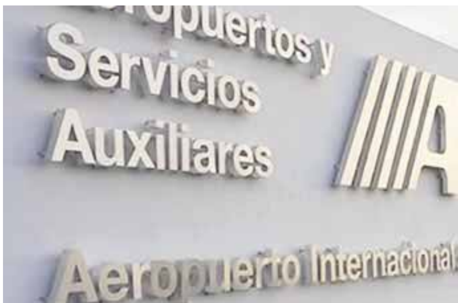
Movilizó un millón 73 mil 941 pasajeros de enero a mayo.

En materia de operaciones, durante los primeros cinco meses del 2017 se realizaron un total de 55 mil 957 movimientos, donde el mayor índice de crecimiento porcentual se registra en los aeropuertos de Toluca (41.2%); Chetumal (28.5%); Tehuacán (21.4%); Puerto Escondido (18.1%); Guaymas