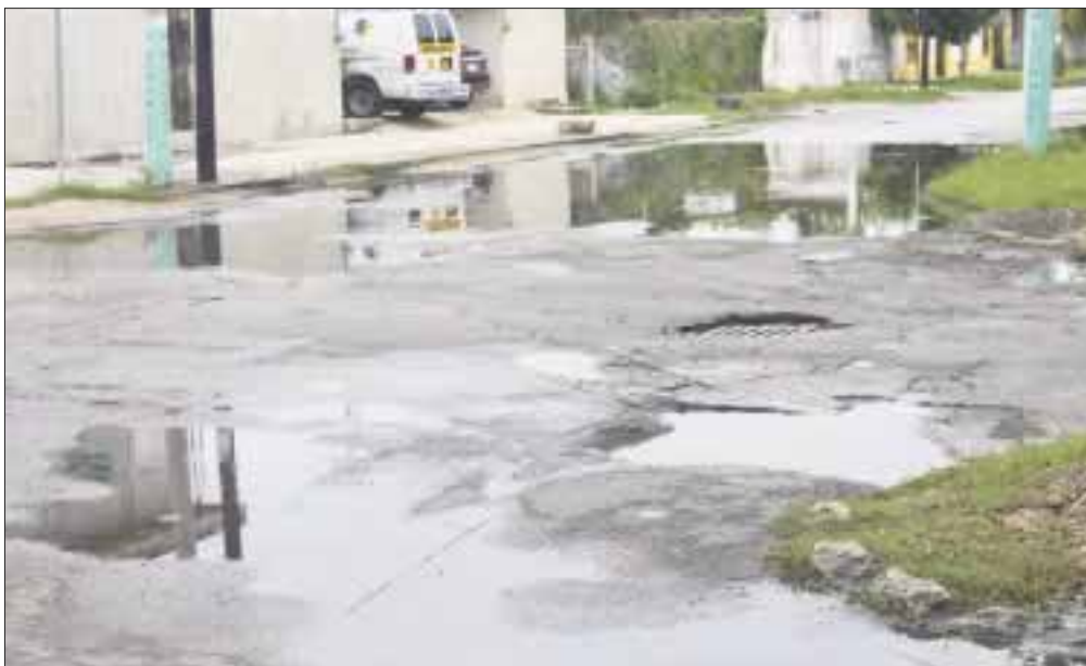
Los baches en Chetumal están convertidos en verdaderas lagunas.

Chetumal.- La mala planeación y la ausencia de un cabildo fuerte y organizado, provocó que los trabajos de repavimentación y bacheo de calles iniciaran a principios de mayo en Chetumal y que ahora por las lluvias están detenidos en perjuicio de la ciudadanía.