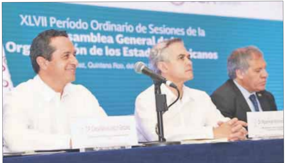
La Declaración de Intención fue signada por el jefe de gobierno de la CDMX y presidente de la Conago, Miguel Ángel Mancera, y el secretario general de la OEA, Luis Leonardo Almagro.

Como testigos honor, de la firma del documento, estuvieron el gobernador Carlos Joaquín, la gobernadora de Sonora y presidenta de la Comisión de Asuntos Internacionales de la Conago Claudia Pavlovich Arellano, y el secretario de Relaciones Exteriores, Luis Videgaray Caso.