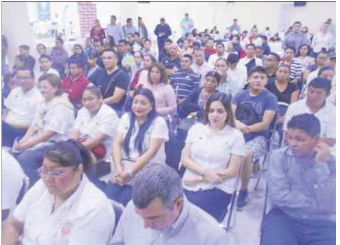
La Universidad del Sur fue la anfitriona de la Feria del Empleo del Verano, donde los estudiantes armaron un complejo con todas las instituciones vinculadas al mundo del trabajo.

La secretaria del Trabajo, Catalina Portillo Navarro, dijo que con las dos ferias que han hecho, han colocado un promedio de cuatro mil personas en todo el estado y hay casos como los de Tulum, donde participaron 30 empresas