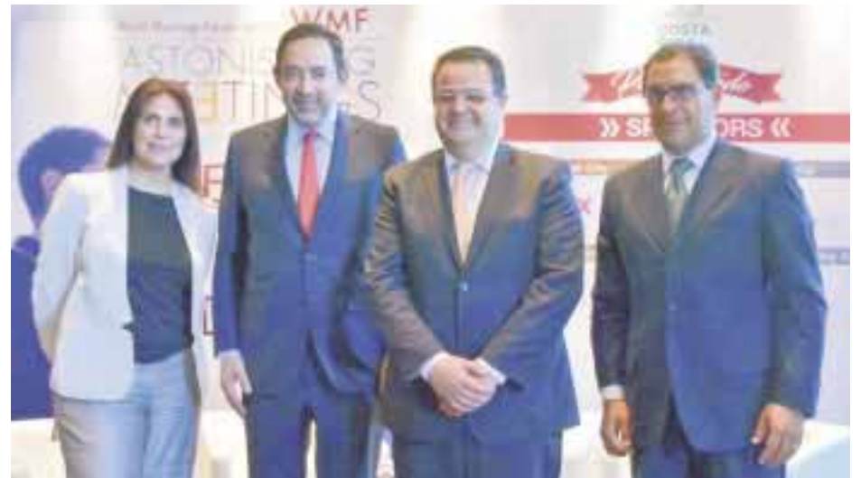
Durante la presentación del World Meetings Forum 2017.

También se abordaron las seis ventajas que esta práctica aporta al cierre de negocios como son compromiso, tono de voz, palabras empleadas, movimientos conscientes, expresiones faciales y lenguaje corporal inconsciente. De acuerdo con Comscore el cierre de ventas de forma directa alcanza el 79% de efectividad versus el 21% vía online .