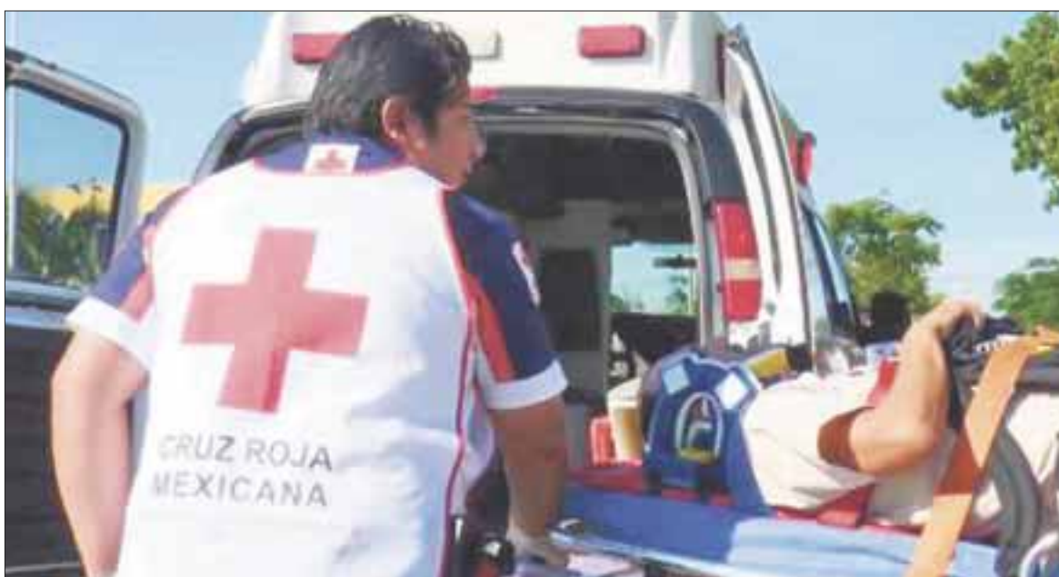
Las malas condiciones climatológicas y la falta de precaución, así como escasez del material necesario para su seguridad, provocó el accidente.

El motín se prolongó hasta las 07:00 horas porque los internos continuaban inconformes, debido a que no se cumplieron sus peticiones.