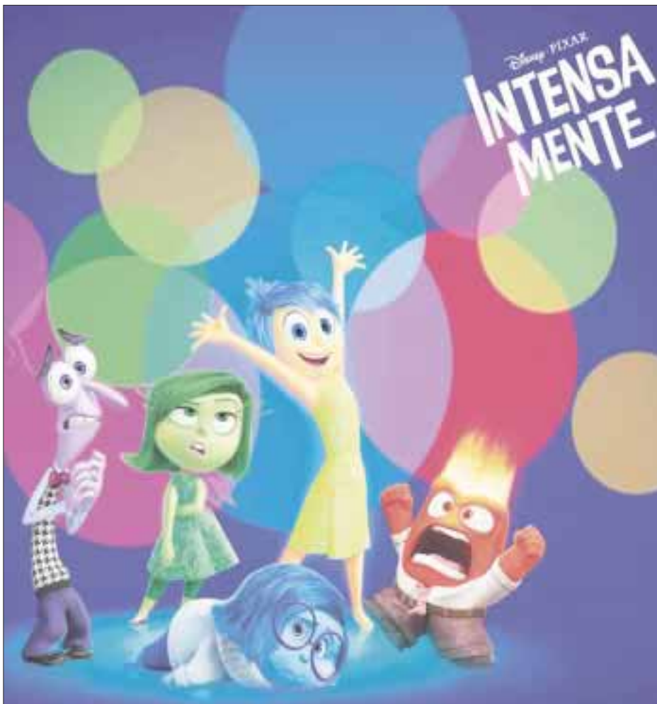
“Intensamente” recaudó más de 850 millones de dólares desde su estreno en junio de 2015.

Finalmente, el disco culmina con un medley de sus más grandes éxitos como “Que te pasa”, “El apagón” y “Hombres al borde de un ataque de celos”, que redondean este magnífico álbum que sin duda dejara contentos a fans y no tan fans. “Yuri: Primera Fila” estará disponible a la venta tanto en formato físico como en plataformas digitales, este 23 de junio.