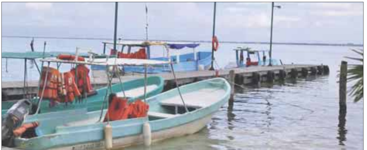
En la zona norte, más de 2 mil embarcaciones permanecen varadas a consecuencia de la onda tropical que frenó la operación de prestadores de servicios turísticos, náuticos y pescadores.

Habló que la situación hoy día para los hombres de mar, no es fácil ya que tanto náuticos como prestadores de servicios requieren de una onerosa inversión para operar y generar ganancias, que se ve truncada con el cierre de puertos, que en temporada de lluvias suele ser más constante.