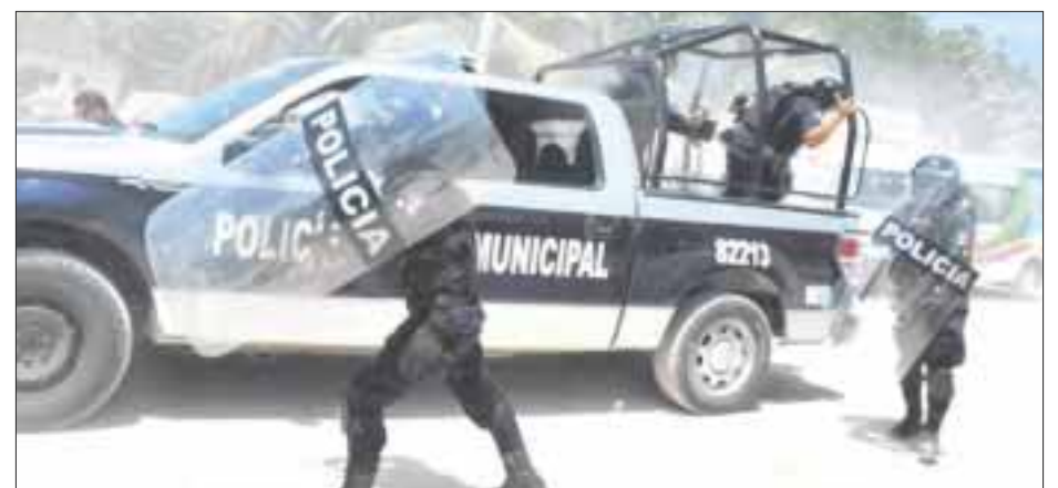
La Policía Municipal Preventiva de Bacalar es la que presenta el estado de fuerza más débil.