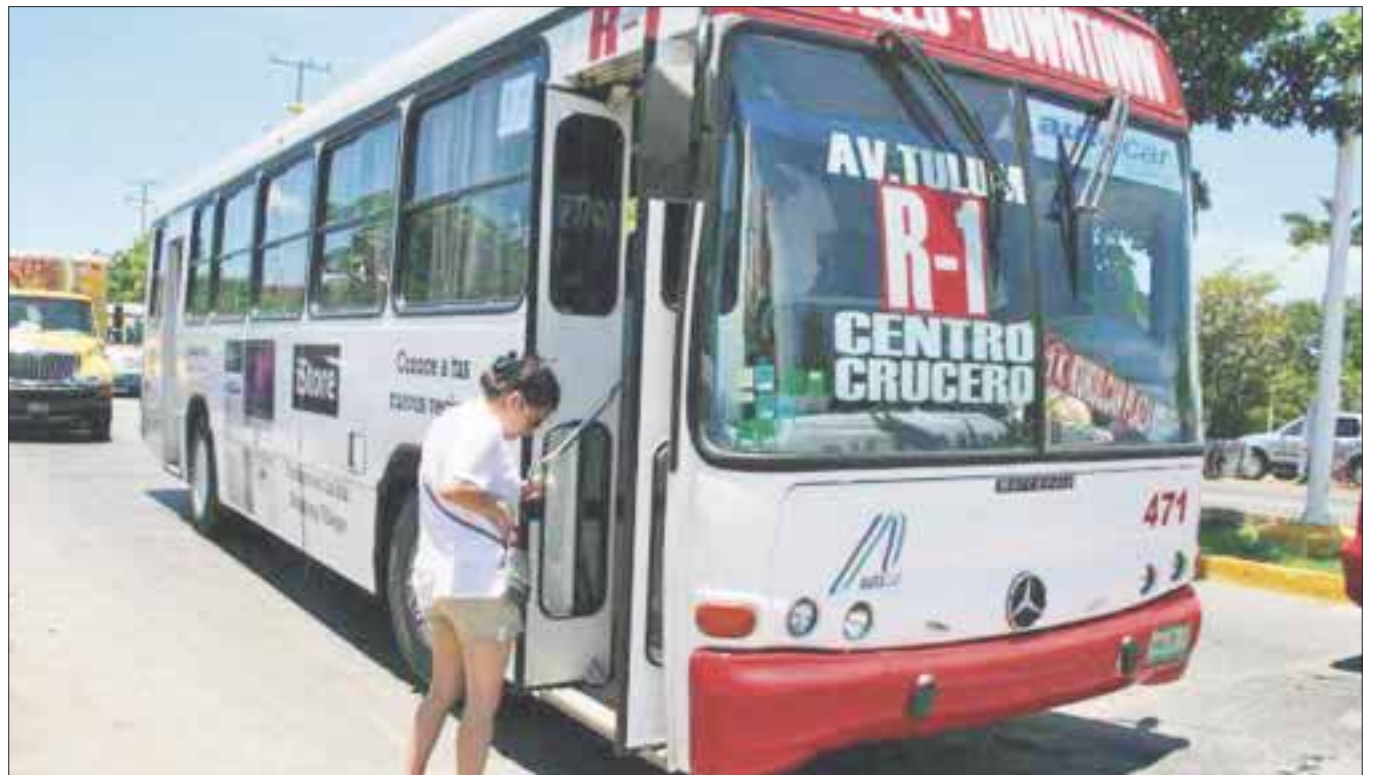
En beneficio de más de mil trabajadores de Turicun y Autocar, representantes de la CTC exigieron acuerdos de la Junta de Conciliación y Arbitraje.

Ante tal situación confían que la Junta de Conciliación y Arbitraje tome en cuenta el ausentismo de los trabajadores en las asambleas de la CTM en donde se puede palpar la inconformidad porque simplemente no asiste la mayoría de los trabajadores.