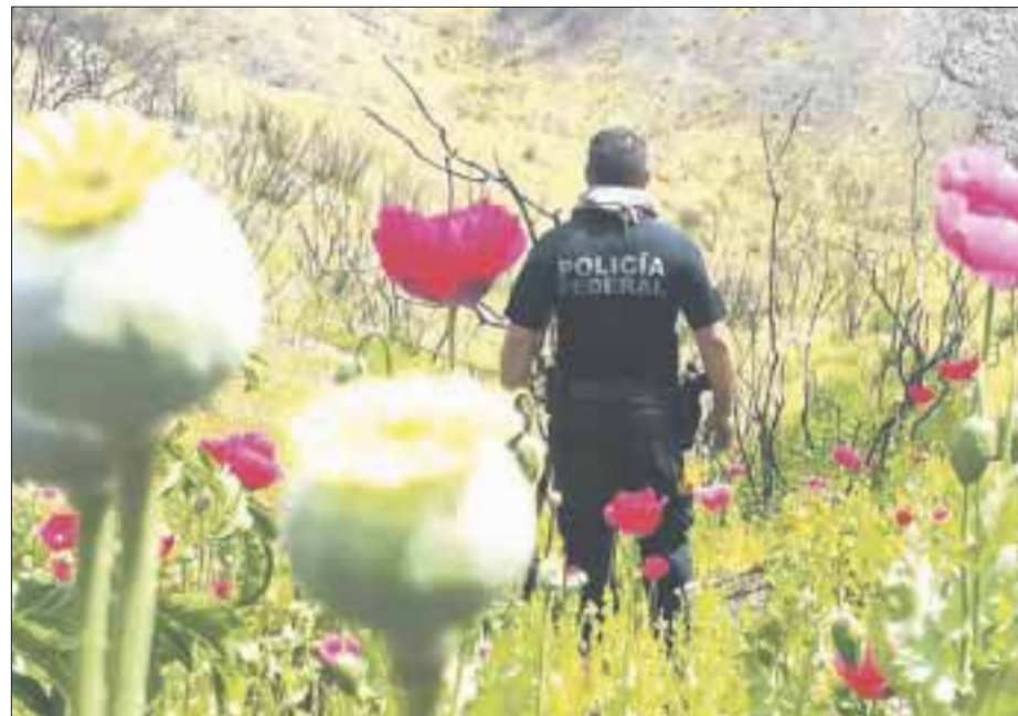
México es el primer productor de amapola en América, y el tercero en el mundo, afirma la Conadic.

La batalla está ganada, ahora vamos a reglamentar y a normar en la Secretaría de Salud la manera en cómo se siembra y se obtiene la planta, desde el punto de vista curativo, dijo el funcionario