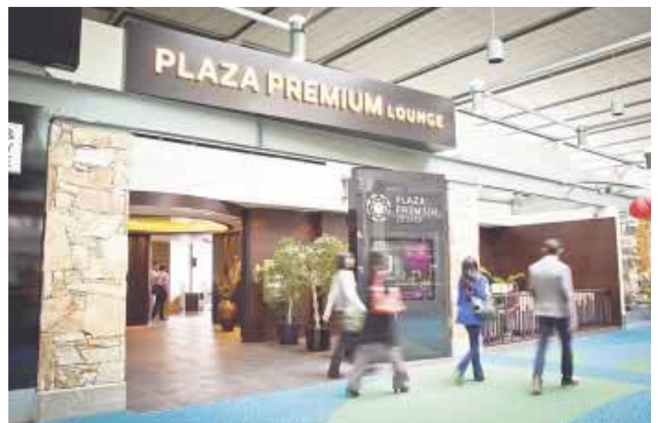
A finales de año abrirá el Lounge en Vancouver.