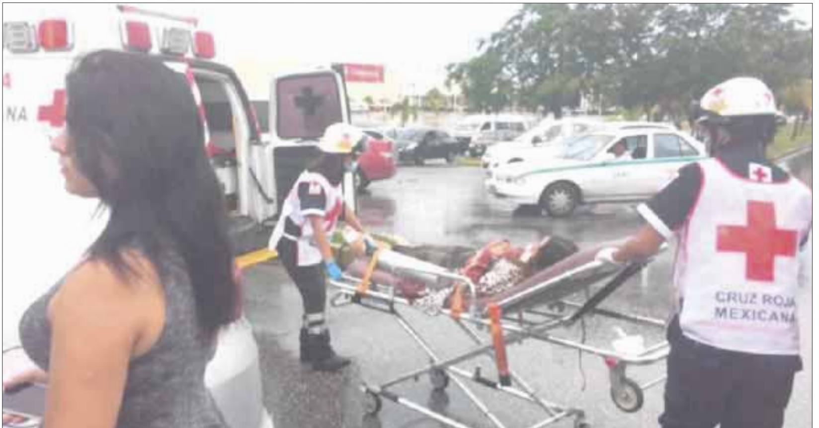
Para auxiliar a los heridos llegaron elementos del Cuerpo de Bomberos y Cruz Roja, que acordonaron el área.

La unidad policiaca presuntamente acudía a un llamado de auxilio, circulando con la torreta prendida, pero los autos particulares salieron con la luz verde del semáforo, resultando una carambola de tres vehículos.