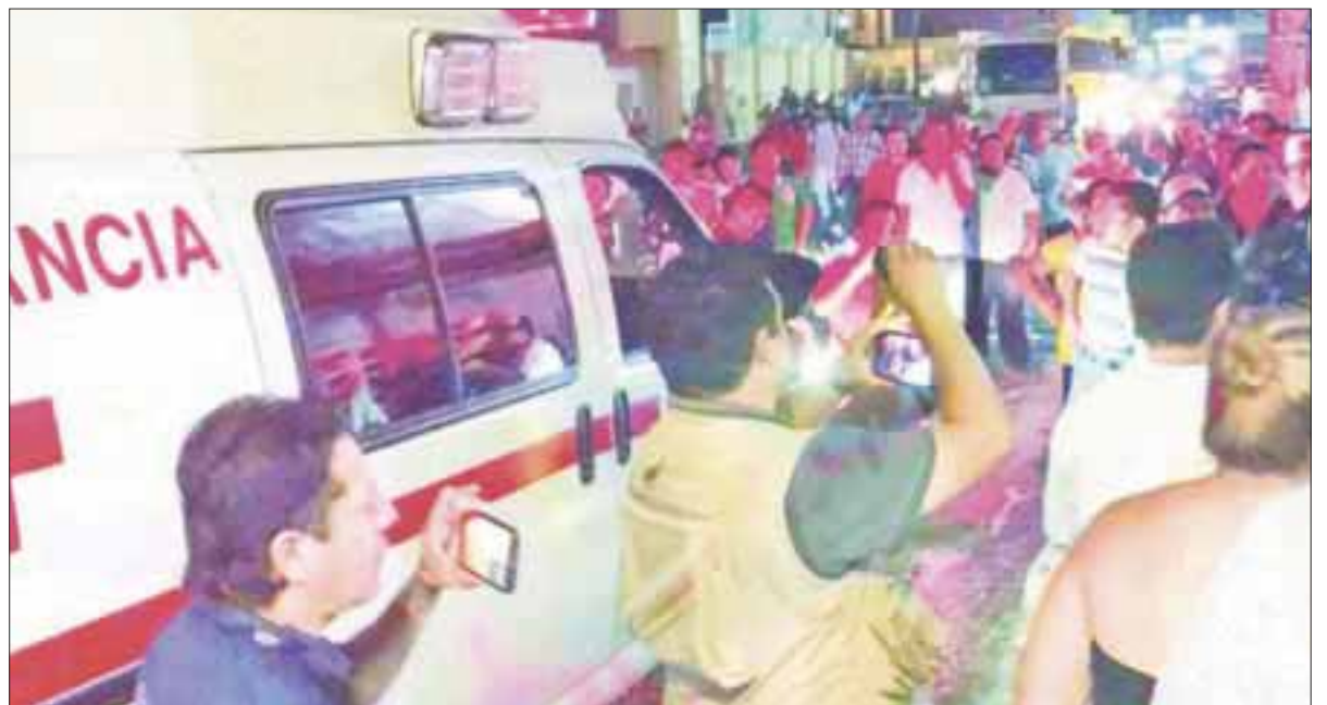
Las regiones de la ciudad se han convertido en tierra de nadie, en donde delincuentes hacen de las suyas, sin que autoridad alguna intervenga.

De la brutal golpiza que le propinaron los vecinos de la 237, uno los presuntos pandilleros se encuentran grave en el hospital general de Cancún y se teme por su vida, ante la gran cantidad de golpes que recibió.