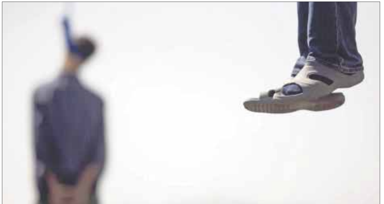
Seguimos en los primeros lugares en suicidios, al mantenerse alto el índice de decesos por dicha causa.

El año pasado en Cancún se registraron 63 decesos por esta causa, de acuerdo a estadísticas de suicidios en Benito Juárez, número que posicionó a Quintana Roo en el sexto lugar en la estadística nacional con mayor tasa de suicidios por cada 100 mil habitantes, según la estadística de mortalidad del Instituto Nacional de Estadística y Geografía (Inegi).