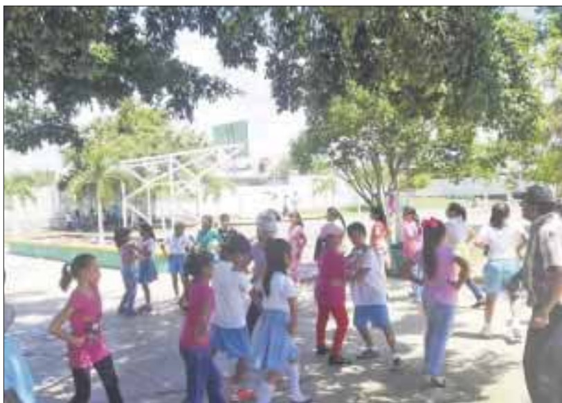
En todos los planteles escolares agotaron los planes y programas de estudios y se dedican a preparar la ceremonia de fin de cursos.

Chetumal.- Por error de la Secretaría de Educación y Cultura (SEyC) no se podrá cumplir a docentes y alumnos con el calendario escolar estatal de 200 días del ciclo 2016-2017 en el nivel básico, otorgando anticipadamente 4 días hábiles de descanso.