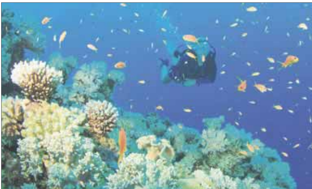
Sembrarán alrededor de 250 mil corales en el Arrecife Mesoamericano, afectado por el paso de huracanes.

Cozumel.- La Fundación de Parques y Museos de este destino turístico se comprometió, en el marco del Cozumel Scuba Fest 2017 que concluyó ayer domingo, a sembrar alrededor de 250 mil corales en el Arrecife Mesoamericano afectado por el paso de huracanes.