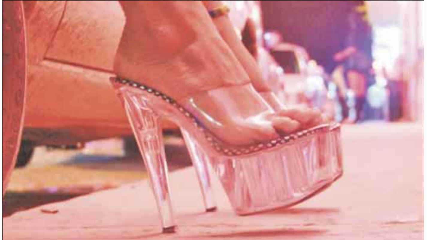
En la Yaxchilán, Puerto Juárez y el Centro se realiza la prostitución a plena vista de la autoridad, a pesar de “blindar” el corazón de Cancún de ese flagelo.

La población siempre se queja del pésimo servicio de vigilancia policiaca ya que las faltas a la moral en plena vía pública están a la orden del día, sin que hagan nada, ya que al no lograr “enganchar clientes” se tornan más atrevidas para llamar la atención