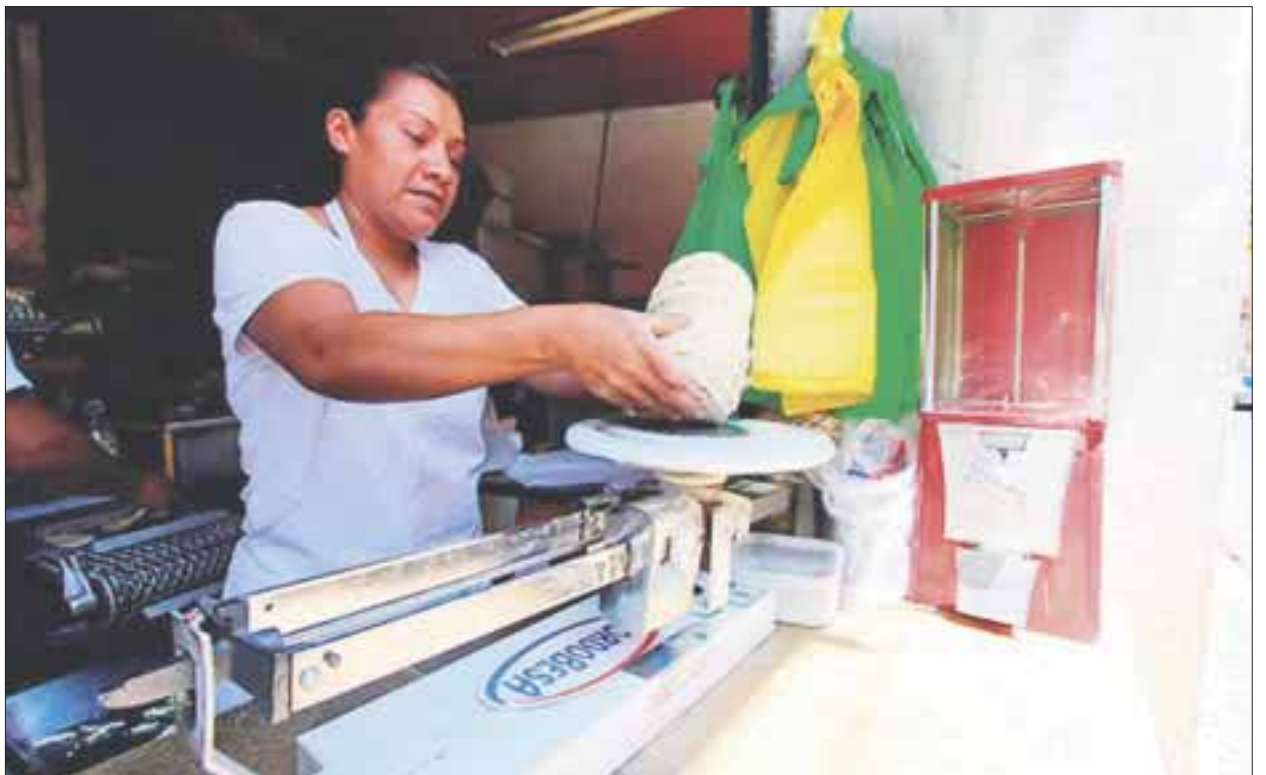
En la ciudad, los tortilleros son una competencia desleal para los establecimientos que sólo les deja un 20 por ciento de ganancia.

Los tortilleros se quejaron de la falta de regulación de la autoridad a dicha venta irregular en las calles, obliga a quienes están en regla a sumarse a dicha actividad, ya que las pérdidas son mayúsculas al no sólo tener que competir con los vendedores ambulantes, sino también con las tiendas de conveniencia.