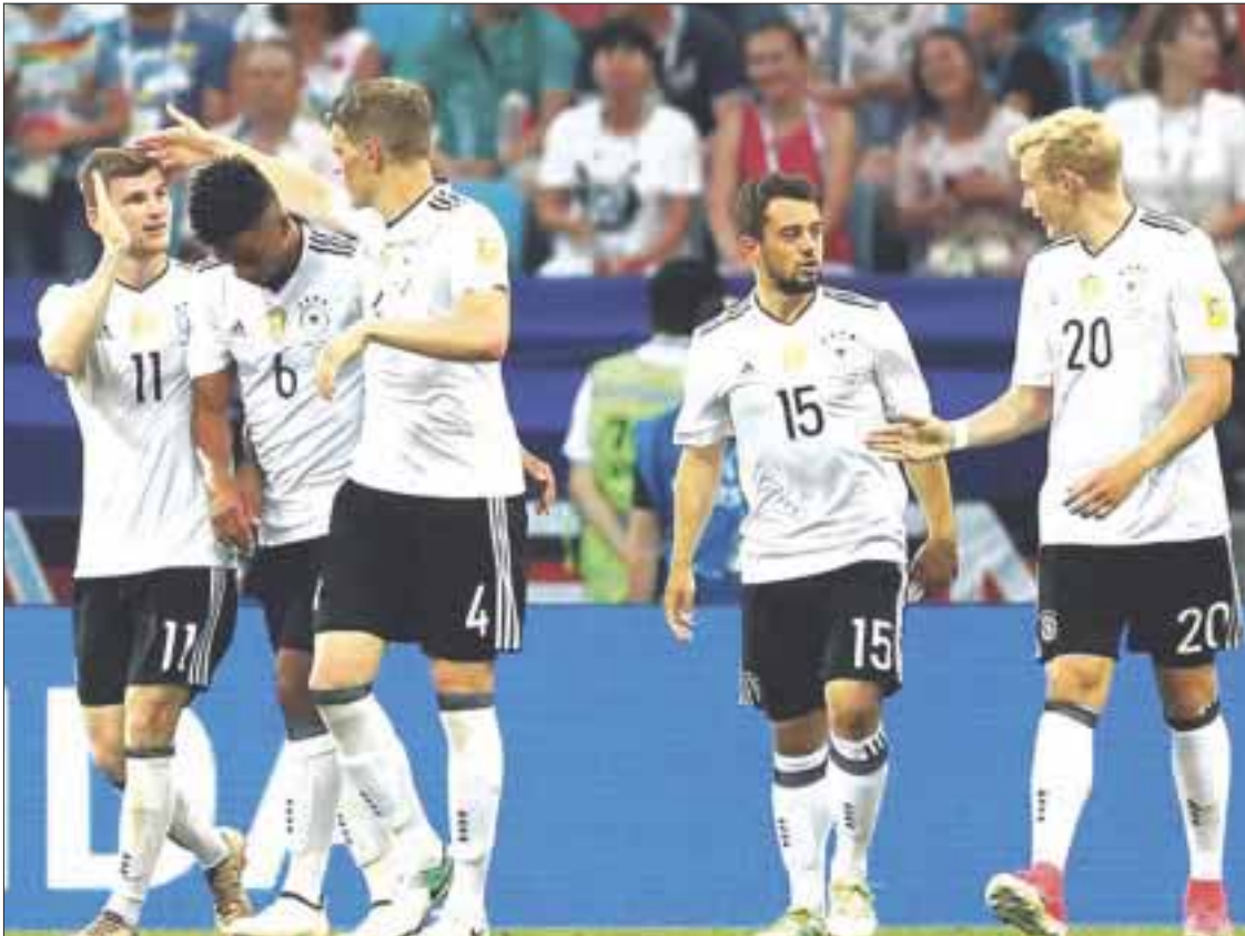
La selección campeona del mundo enfrentará a México en las semifinales de la Copa Confederaciones el próximo jueves.

Alemania es líder del sector B con siete unidades y el jueves en ese mismo estadio se medirá al Tricolor, rival contra el que ya disputó un tercer lugar de Confederaciones en 2005 con triunfo teutón