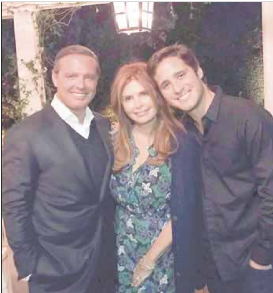
El actor Diego Boneta, quien inició su carrera en el show Código FAMA, será el encargado de personificar a “El Sol” en la nueva producción original de Netflix, en colaboración con Gato Grande y MGM.

El casting se llevará a cabo el 1 y 2 de julio de 2017 en el hotel María Isabel Sheraton, ubicado en Reforma 325, colonia Cuauhtémoc en la Ciudad de México, será realizado por dos de las empresas productoras involucradas y contará con la presencia del actor mexicano Diego Boneta. El horario es de 9:00 a 17:00 horas.