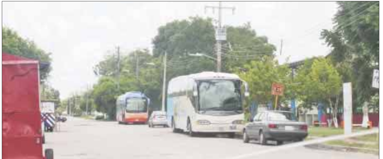
Las poblaciones fronterizas de Subteniente López y Santa Elena registraron un desplome de sus ventas y sus propietarios lo atribuyen a un acoso fiscal de ambas administraciones: Belice y México.

En un breve recorrido realizado por DIARIOIMAGEN por diversos comercios de la Zona Libre, en la frontera sureste México-Belice, los dueños (en su mayoría árabes, chinos, filipinos y algunos mexicanos) precisan que las decisiones en la economía de México han perjudicado a ambos países, principalmente a los más de 2 mil trabajadores que ahí laboran, que en su mayoría dependen de la comisión que reciban por las ventas.