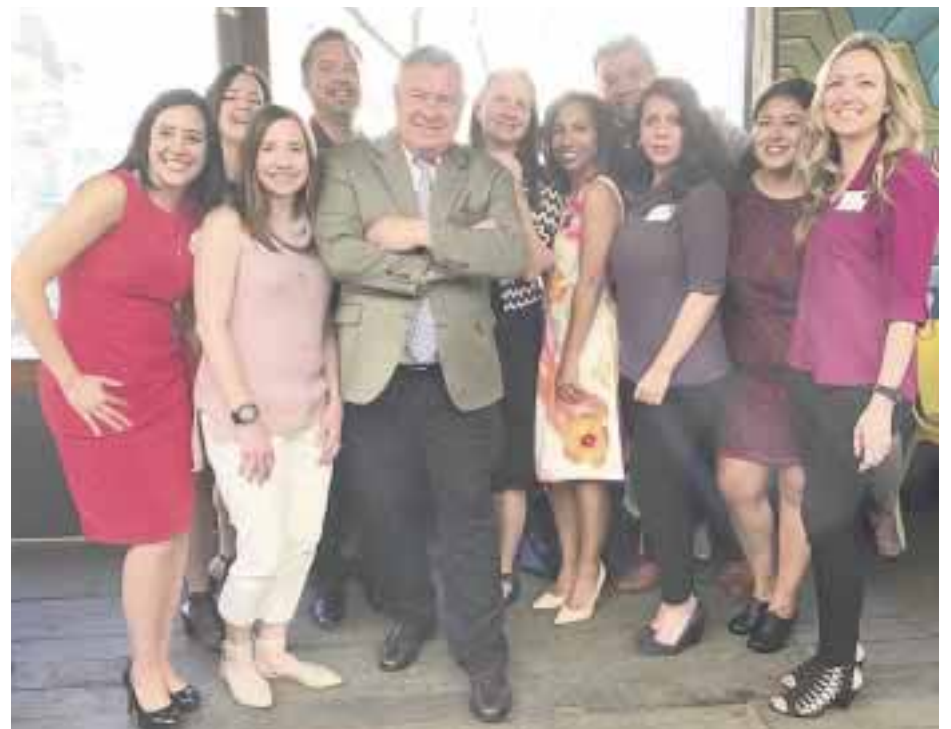
Los representantes de Arizona en ese estado y en México.

El área central de Arizona es el corazón urbano del desierto de Sonora. Aquí se encuentra ubicada la capital, Phoenix, y otras ciudades de ambiente cosmopolita como Scottsdale, Tempe, Chandler y Glendale, en donde hay una mezcla única de tiendas, restaurantes y opciones culturales y deportivas.