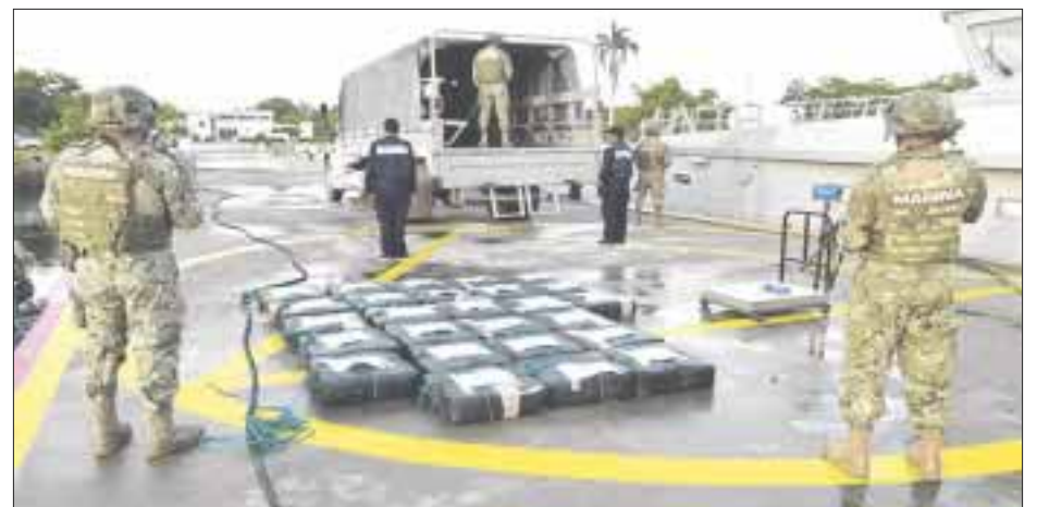
La semana pasada, la Marina decomisó más de 2 mil 600 kilos de cocaína en altamar, en las aproximaciones de Puerto Chiapas.

Los bultos se encontraban señalizados electrónicamente para indicar su ubicación, flotando en el mar.