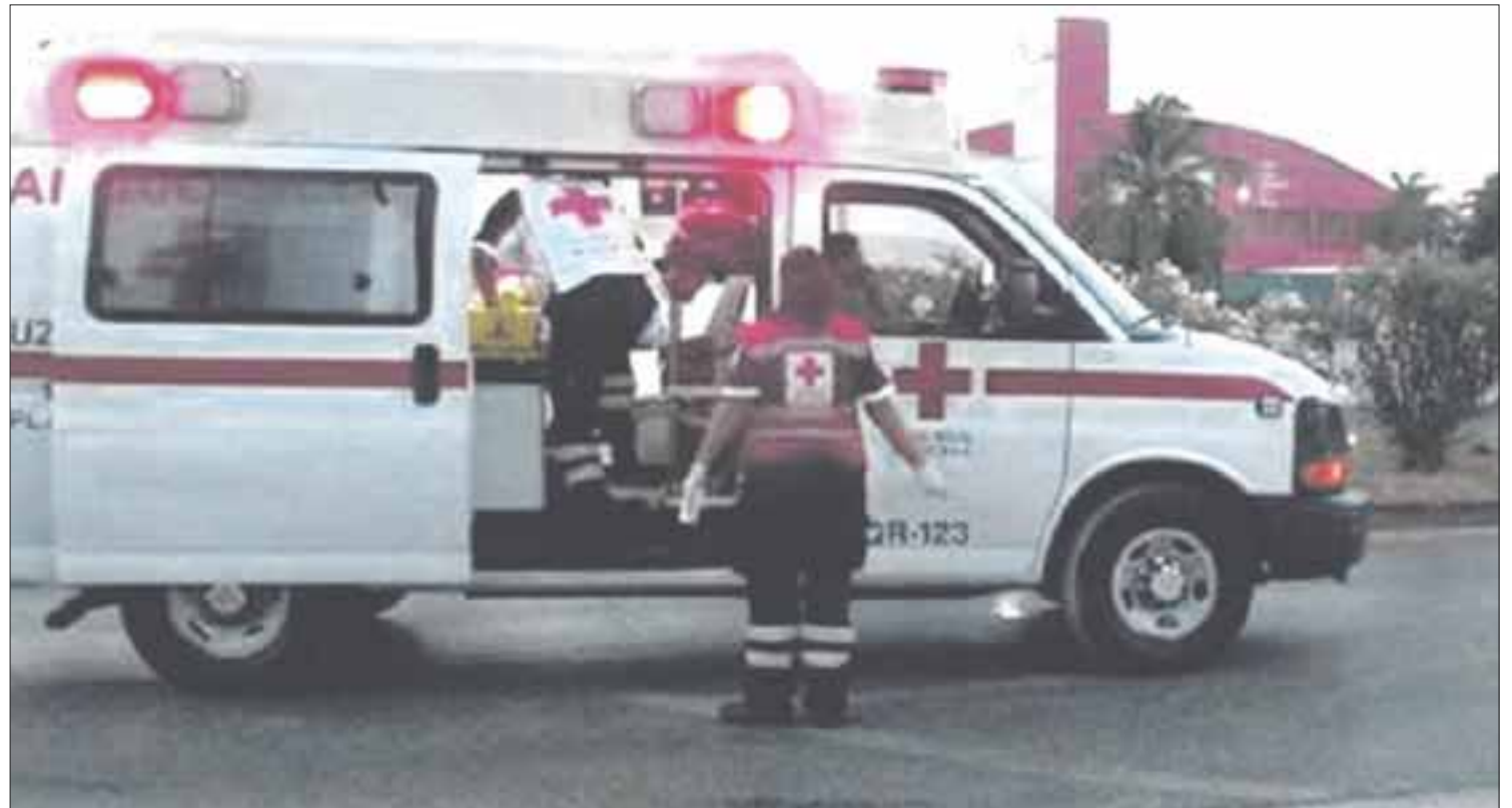
Policías detuvieron al presunto responsable, que es señalado de haber golpeado con un tubo al joven de 19 años, con quien tenía una relación sentimental.