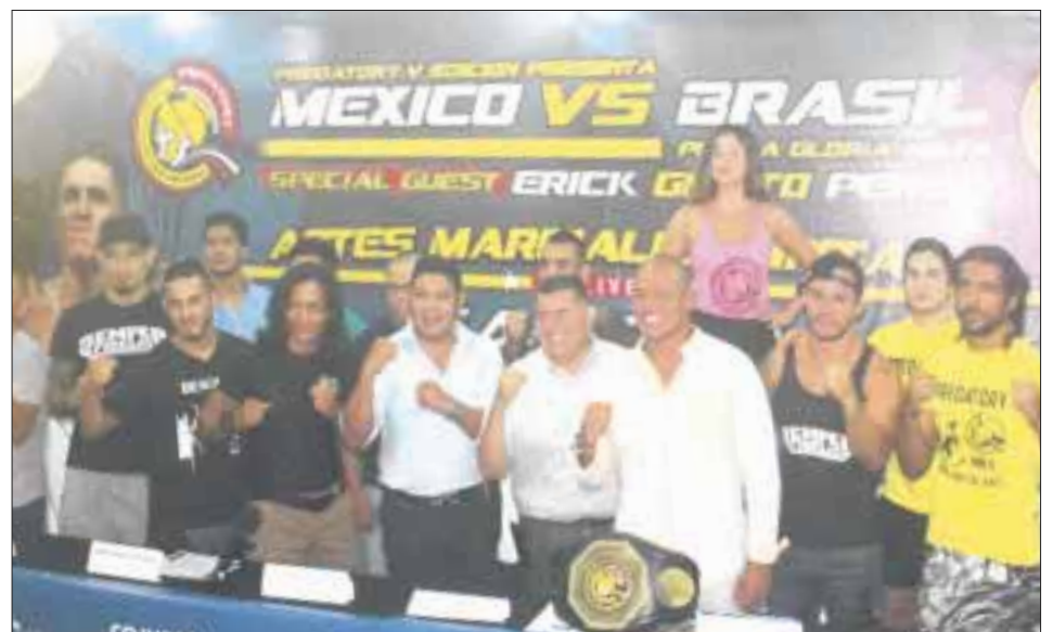
La siguiente cita con los peleadores será el próximo 14 de julio, un día antes de la gala, con la ceremonia del pesaje de los 16 gladiadores.

Como parte de su interés por desarrollar una nueva oferta de entretenimiento BCM BestChoice México trabaja en conjunto con 50 puntos de venta de diferentes agencias de viajes y 5 hoteles para buscar atraer al espectador amante de la adrenalina pura.