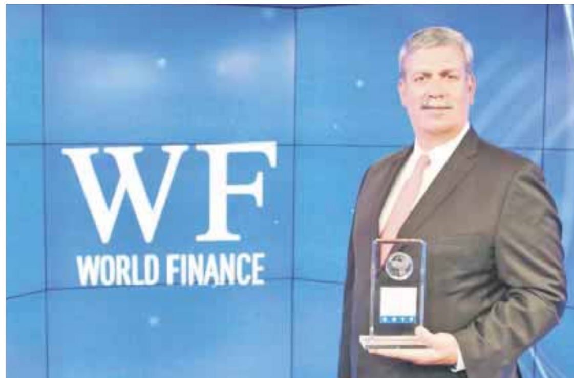
Banco Nacional de Comercio Exterior (Bancomext) fue reconocido con el premio "Deal of the Year" que otorga la revista World Finance .

Ahora bien, si usted opera en el ramo de la construcción y específicamente requiere capital fresco en el renglón de las casa habitación, le informo que la Corporación Interamericana de Inversiones (CII), brazo para el sector privado del Grupo BID, suscribió un préstamo revolvente de mil 396 millones de pesos con la participación del Fideicomiso Hipotecario (FHipo) para ofrecer un nuevo instrumento de inversión en portafolios hipotecarios en el mercado de capitales mexicano. El proyecto beneficiará a familias que buscan acceso a financia-