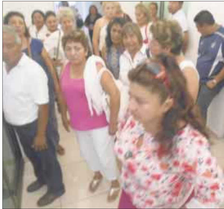
Priistas, cansadas de las imposiciones, le gritan sus verdades a su líder estatal, Raymundo King de la Rosa.

Benito Juárez, Solidaridad y Puerto Morelos son los municipios que el fiscal señaló como los que tienen mayor demanda por las drogas, al ser estos puntos los que mayor cantidad de turistas recibe, don-