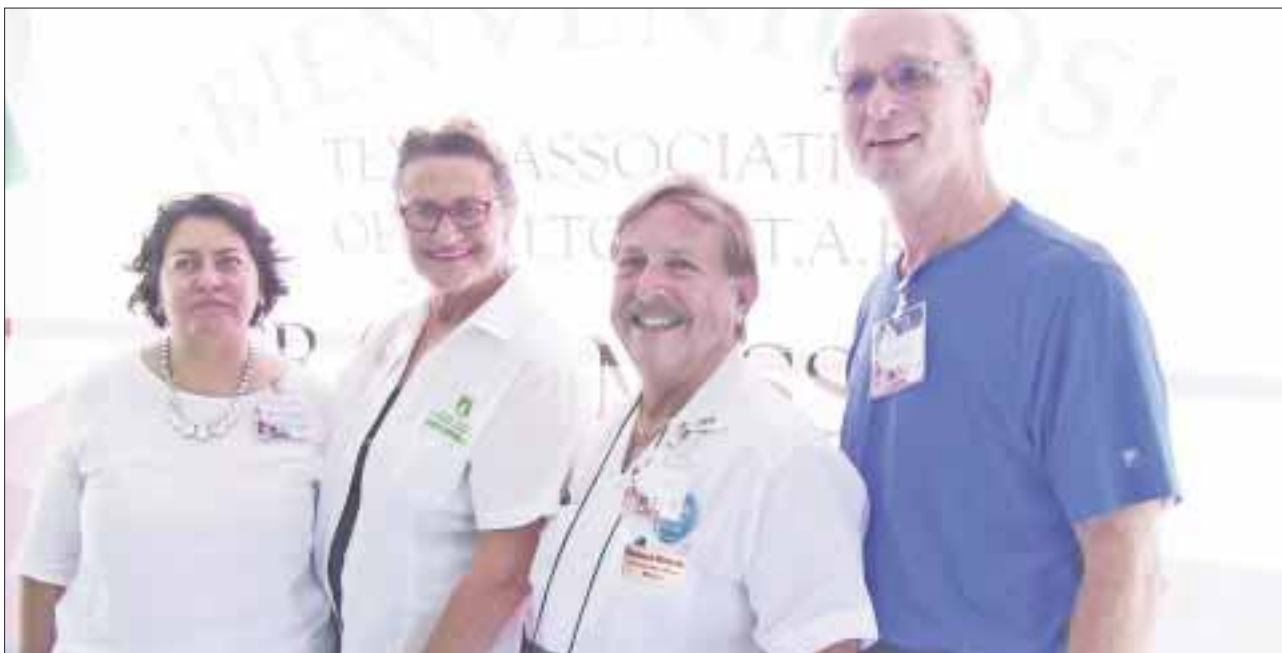
Agentes de bienes raíces texanos participaron en un encuentro que organizó la Asociación de Mexicana de Profesionales Inmobiliarios.

Cozumel.- Llegan a la isla 80 agentes de bienes raíces procedentes de Texas para participar en un encuentro que organizó la Asociación de Mexicana de Profesionales Inmobiliarios de Playa del Carmen y Cozumel (AMPI).