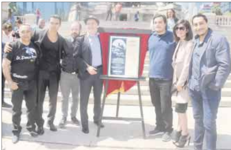
Más de 500 personas respondieron a la convocatoria lanzada en redes sociales para participar en la develación, en la explanada del Ángel de la Independencia, de la placa alusiva a los 23 años de representaciones ininterrumpidas de la puesta en escena La dama de negro .

Luego de ganarse el corazón de los televidentes y el respeto de los críticos, esta aclamada serie regresa con más risas y drama que nunca.