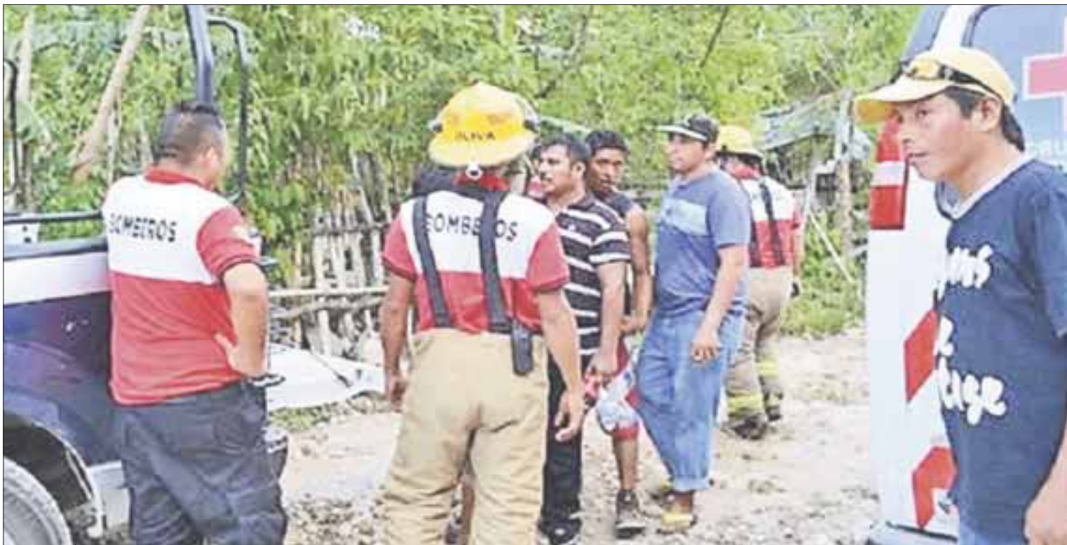
Testigos pidieron la intervención del DIF municipal para hacerse cargo de la menor en caso de que logre salvar la vida.

Testigos aseguran que se trató de una irresponsabilidad de los padres de la menor que por estar discutiendo, perdieron de vista a la menor, que al alejarse de sus progenitores no se percató del hoyo y cayó.