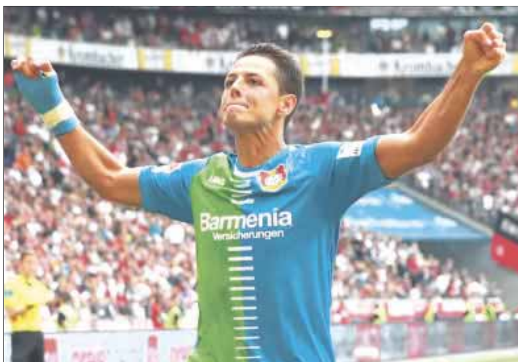
Javier “Chicharito” Hernández fue elegido por los aficionados como el futbolista más destacado de febrero en la Bundesliga.

La carrera constará de pruebas que van desde los 200 a 400 metros en la categoría infantil, 2 kilómetros en caminata recreativa, así como 5 y 10 kilómetros en prueba pedestre