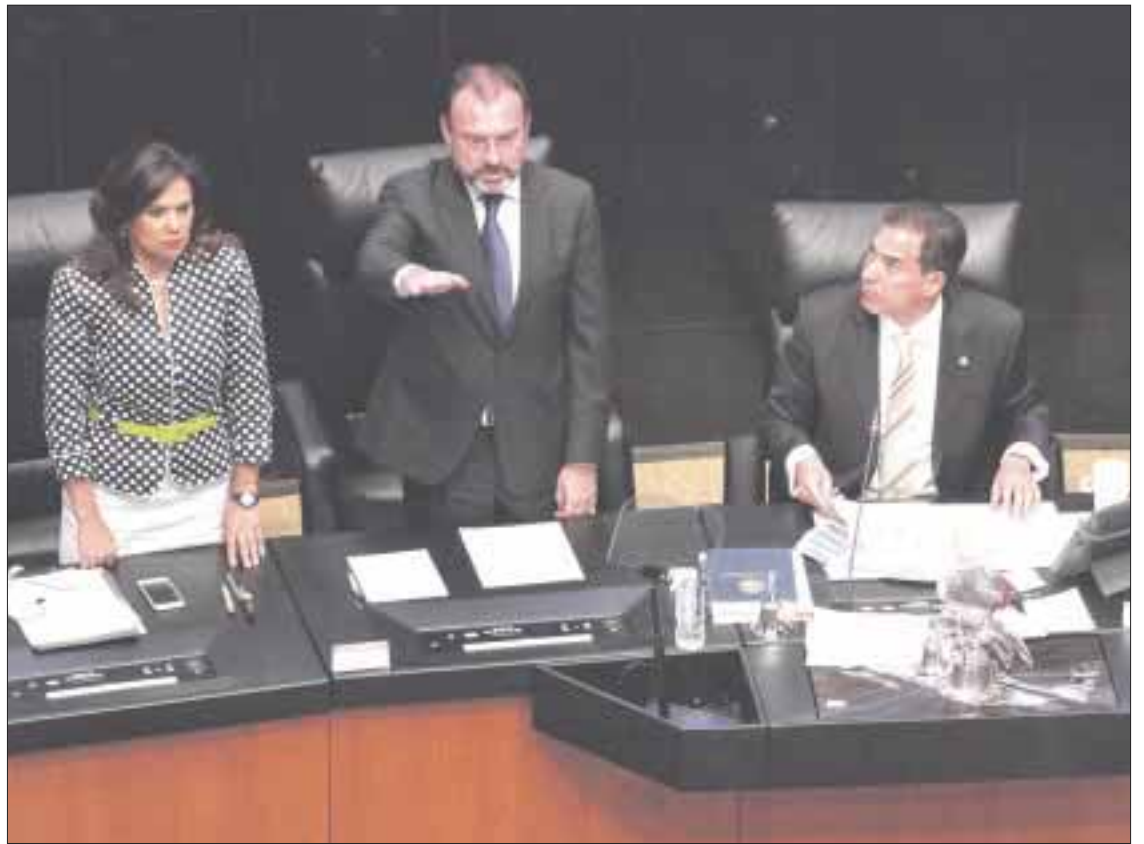
El canciller Luis Videgaray Caso compareció ante el pleno del Senado de la República.

Consideró que relación de México y el mundo con Estados Unidos es un "reto inédito", sobre todo porque el vecino país del norte fue un promotor del libre comercio y esas políticas han cambiado, por lo que si bien México respeta el mandato electoral del pueblo estadounidense, ello no debe traducirse en agresiones a países amigos.