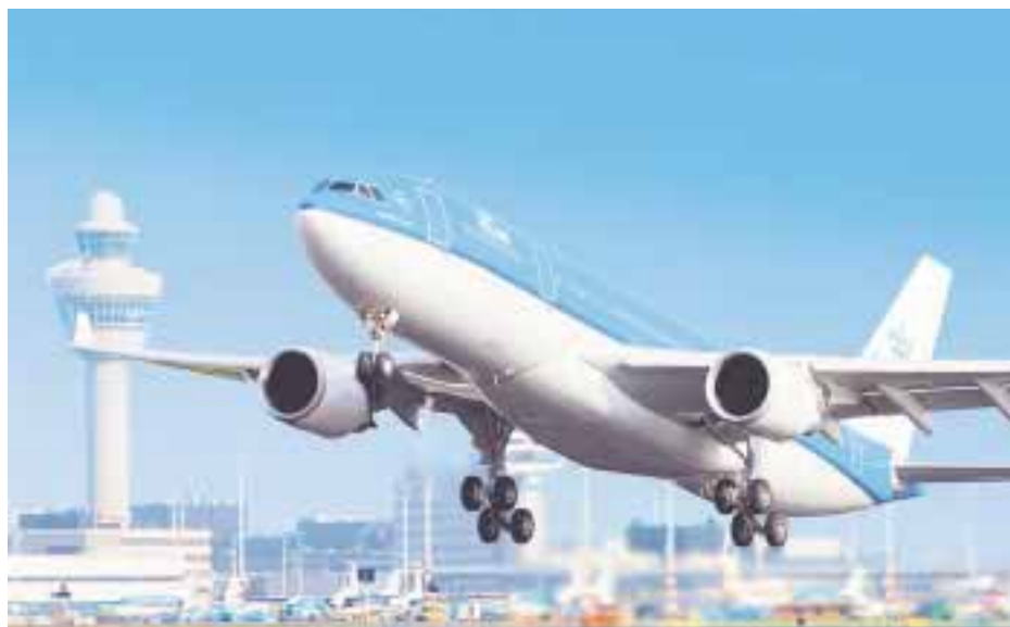
La aerolínea conectará con ocho nuevos destinos desde Ámsterdam.