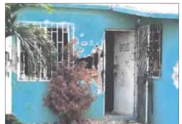
Al menos dos personas murieron, luego de un enfrentamiento entre hombres fuertemente armados y fuerzas federales en el puerto.