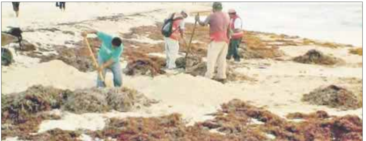
Urgen la reactivación del Fideicomiso de Recuperación y Mantenimiento de las Playas, ante el recale del sargazo.

Recordó que el sargazo no sólo representa un problema de imagen, de contaminación, que se tiene que manejar con sumo cuidado para no dañar el medio ambiente, ya que captar el alga se hace en base a un procedimiento específico en los arenales donde tiene presencia.