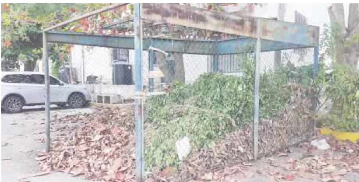
De esta forma es como los vecinos de la 15, han buscado una solución a la gran cantidad de hojas de almendro criollo.

Cancún.- Ante la falta de mantenimiento y limpieza de sus calles por parte de Servicios Públicos, los habitantes de la supermanzana 15 calle Lava, optaron por encerrar, literalmente a la basura en un viejo cajón de estacionamiento.