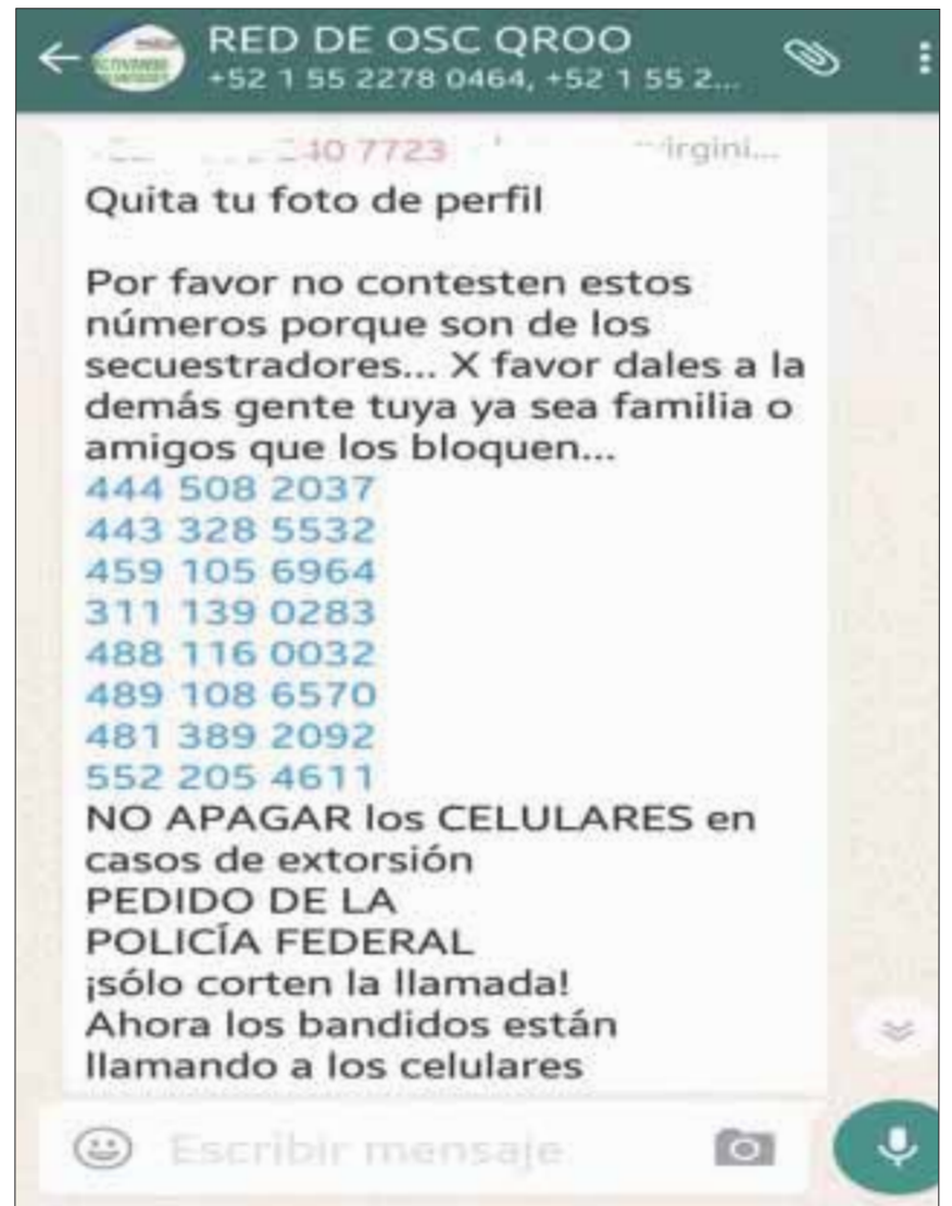
Ciudadanos se autoprotegen, mandando por redes sociales una serie de números, que supuestamente son de secuestradores y gente sospechosa.

Es de esta forma como el clima de psicosis se hace más grande en la ciudad, aunado a una serie de atracos violentos y robos por doquier.