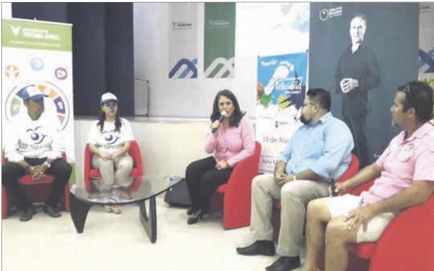
La segunda edición de la Carrera por la Felicidad tendrá una distancia de 5 y 10 kilómetros sobre el circuito Bonampak.

Los organizadores señalaron que se contará con el staff de la Fundación del Doctor-Sonrisas, y que los juguetes que se pretenden recaudar, es justamente para llevarlos a las pabellones infantiles de hospitales, para regalarlos a los niños.