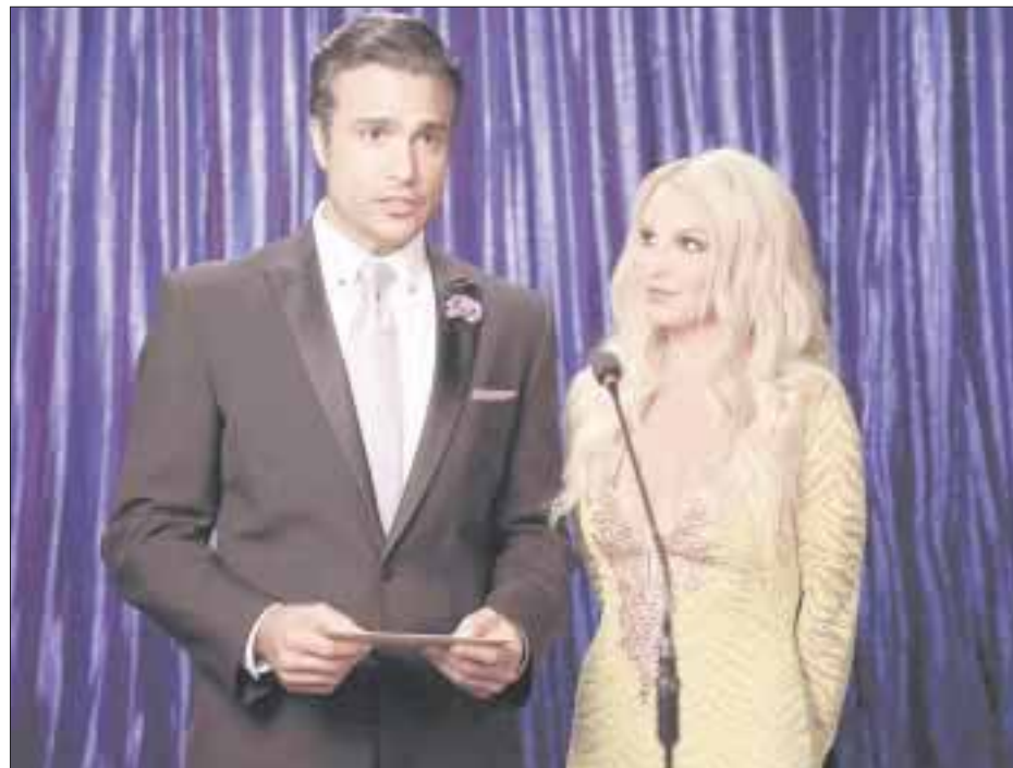
En el capítulo 27: Rogelio (Jaime Camil) se entera de que su enemiga, Britney Spears, se encuentra en el Hotel Marbella y está decidido a confrontarla respecto a su pasado común.

La dama de negro se presentaba en el Teatro Arlequín, pero se ha visto ahora en la necesidad de mudarse, ya que este inmueble será demolido para su remodelación. En tanto, sus funciones continuarán en el Teatro Ofelia de Polanco los viernes a las 20:45, sábados 18:00 y 20:40 y los domingos 18:00 horas.