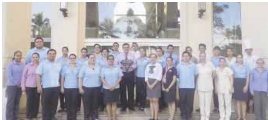
Un premio para los que trabajan en el inmueble en Manzanillo.

☆☆☆☆☆ Por octava ocasión y de manera gratuita, EcoFest ofrece a los habitantes de la Ciudad de México la oportunidad de mejorar su calidad de vida a través de las compras verdes. Este año, en colaboración con la delegación Cuauhtémoc, el evento se llevará a cabo el 25 y 26 de marzo de 2017 en el Co-