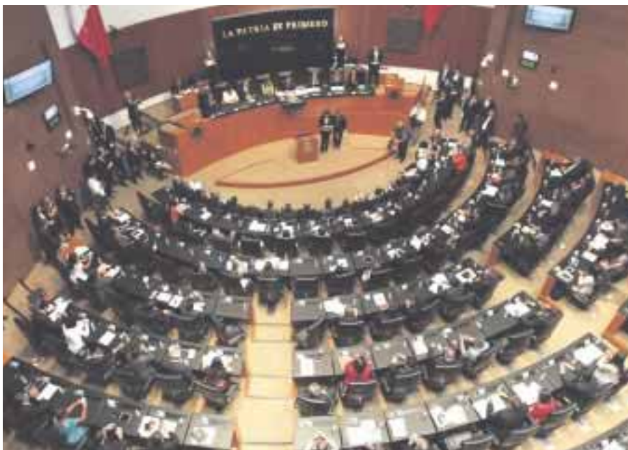
Senadores aprobaron las reformas a la Ley General de Educación, que permitirá a los "dreamers" deportados incorporarse al sistema educativo nacional.

El pleno del Senado de la República aprobó la reforma a la Ley General de Educación, que contempla la revalidación de estudios de mexicanos que sean deportados de Estados Unidos.