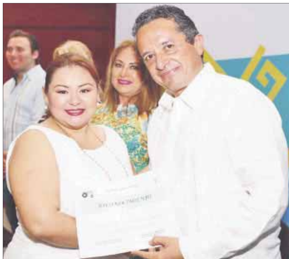
El gobernador Carlos Joaquín asistió al informe de actividades de la presidenta de El Barzón en la entidad, Carmen Patricia Palma Olvera.

Por su parte, el presidente nacional de esta organización, Alfonso Ramírez Cuéllar, expresó su reconocimiento a la labor que realiza el gobierno del estado en el combate a la impunidad y la corrupción que durante las pasadas administraciones dañó a la población.