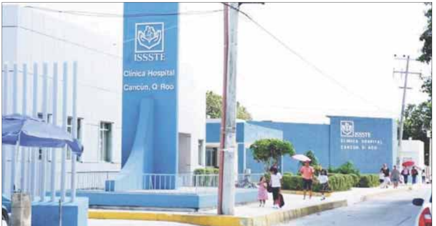
Exhiben desvío de 53 millones de pesos por retenciones por diversos conceptos, como despensas y previsión social en agravio de 480 trabajadores en Quintana Roo.

Luego de recibir la instrucción legal, se informó que de forma gradual se revelarán los avances al respecto para que cada uno continúe con su vida normal.