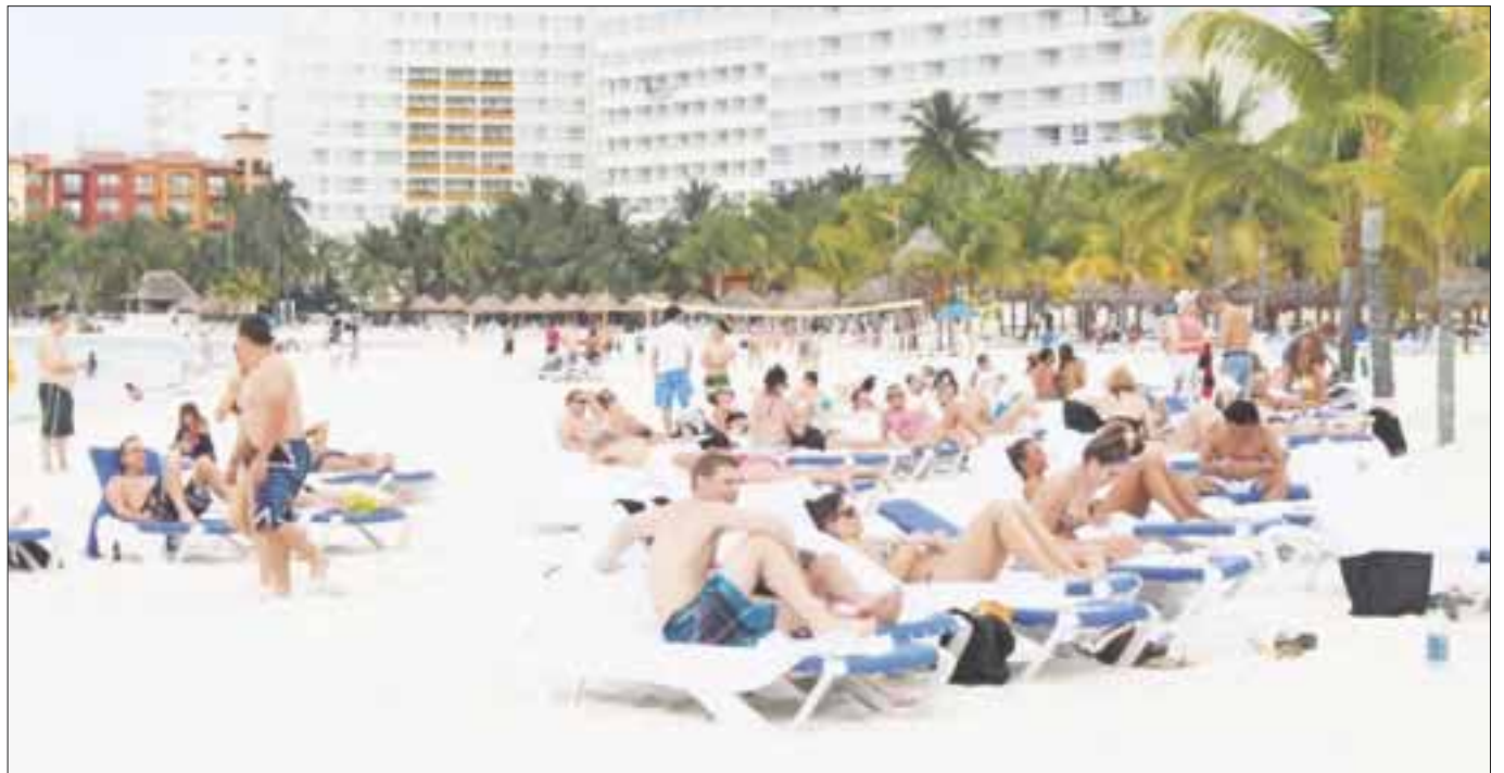
Ante la inestabilidad del peso y el alza de los insumos en el país, se ofrecerán paquetes integrales con hospedaje y transportación al turismo nacional.

Precisó, que las expectativas son buenas, y confían que desde el primer minuto de la Semana Santa el arribo del turismo se podrá palpar incluso en la zona centro, en donde segmentos religiosos hacen acto de presencia cada año.