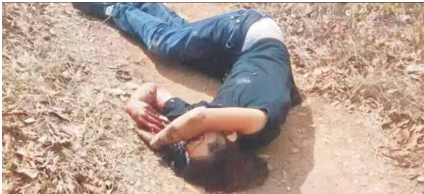
La policía sigue siete líneas de investigación para esclarecer este crimen que enardeció a toda la región.

Cancún.- Luego de identificar como J.L.R.M., de 24 años, electricista de oficio, familiares reclamaron el cuerpo del joven que fue asesinado a quemarropa en la delegación Leona Vicario, perteneciente al municipio de Puerto Morelos.