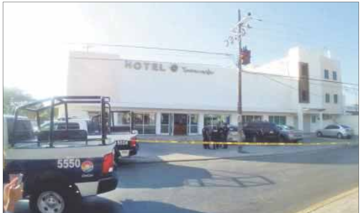
Un gerente de hotel es herido en un intento de secuestro, mientras que en otro hecho un abogado es asesinado cuando salía de su casa en la región 507.

De acuerdo con testigos, el abogado se desplazaba en un auto Fiat, cuando de forma sorpresiva fue alcanzado por dos sujetos que traían cascos de motociclistas, los cuales le dispararon a quemarropa. Los peritos recolectaron cuatro casquillos 9mm sobre el pavimento, mientras que los paramédicos que acudieron al lugar de los hechos, trasladaron al lesionado a la clínica de especialidades del IMSS, donde falleció.