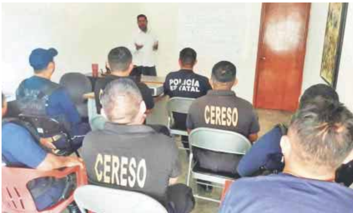
El objetivo es lograr un mayor beneficio para la reinserción social.

Chetumal.- Un sistema penitenciario moderno, eficiente y apegado al respeto a los derechos humanos, es el enfoque para mejorar los centros de reinserción social en la entidad, afirmó el secretario de Seguridad Pública de Quintana Roo, Rodolfo del Ángel Campos.