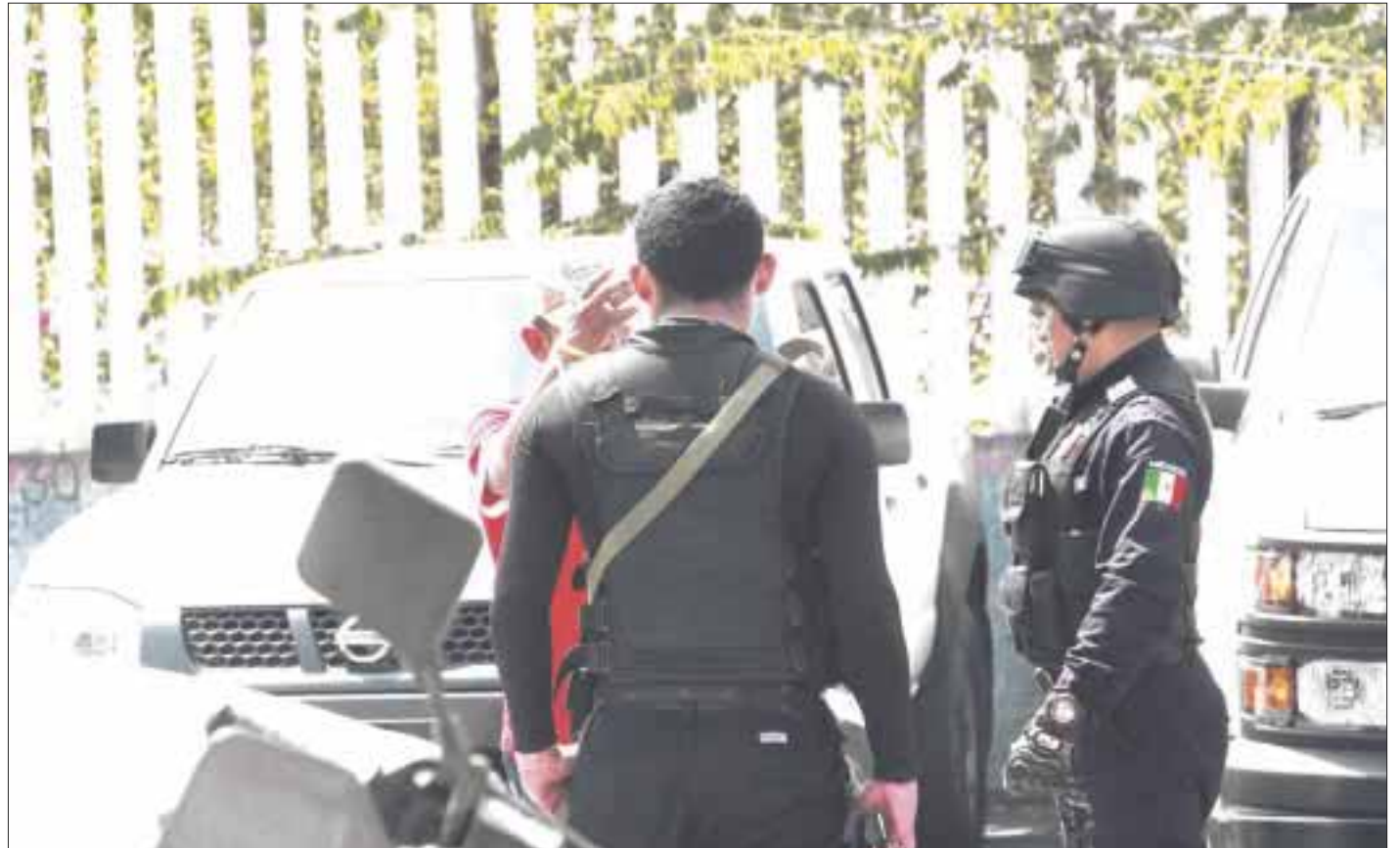
Los agentes policiacos pusieron a disposición del Ministerio Público al taxista, mientras que la fémmina se limitó a reclamar el cuerpo del occiso.

El taxista, por su parte, aceptó su culpabilidad, y ahora se encuentra a disposición del Ministerio Público.