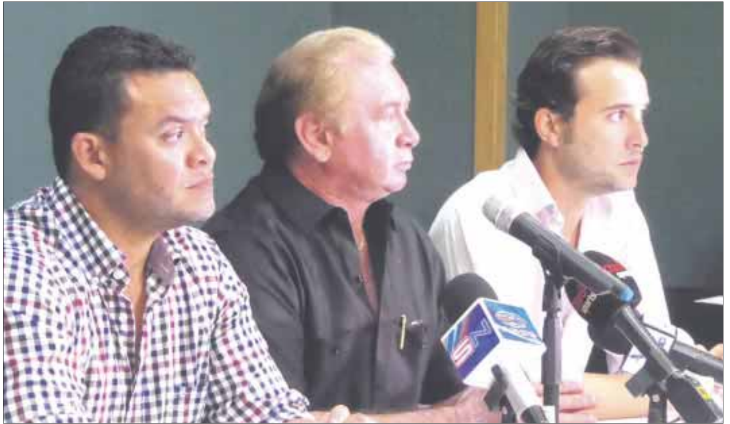
Ayer, en punto de las 9:00 horas, en el estadio Beto Ávila inició oficialmente el Spring Training 2017 de los Tigres de Quintana Roo.