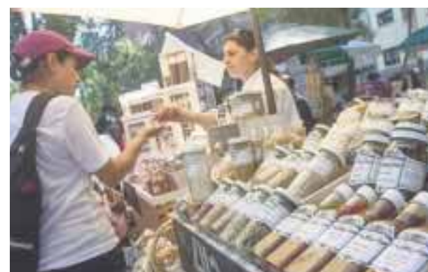
Ecofest tendrá lugar los días 25 y 26 de marzo.