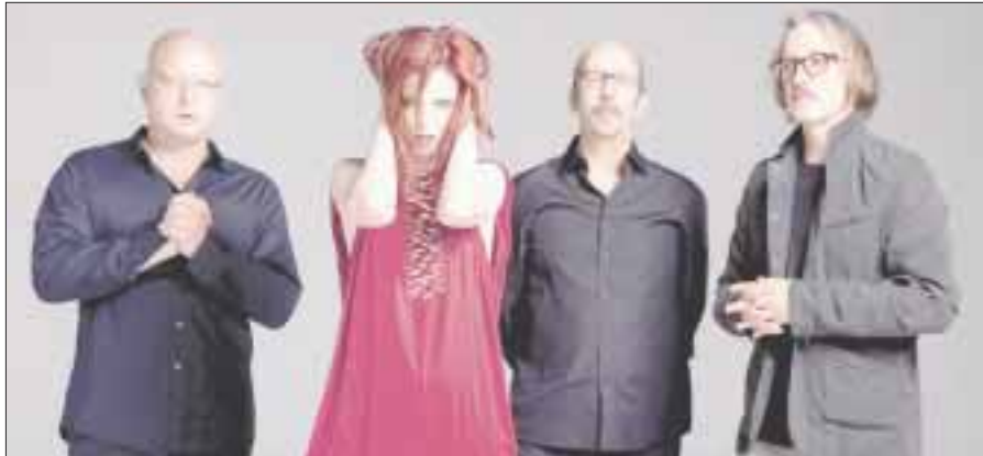
Garbage lanzará un libro autobiográfico "This Is the Noise That Keeps Me Awake".

*** Preventa Citibanamex: 13 y 14 de marzo, venta general: 15 de marzo