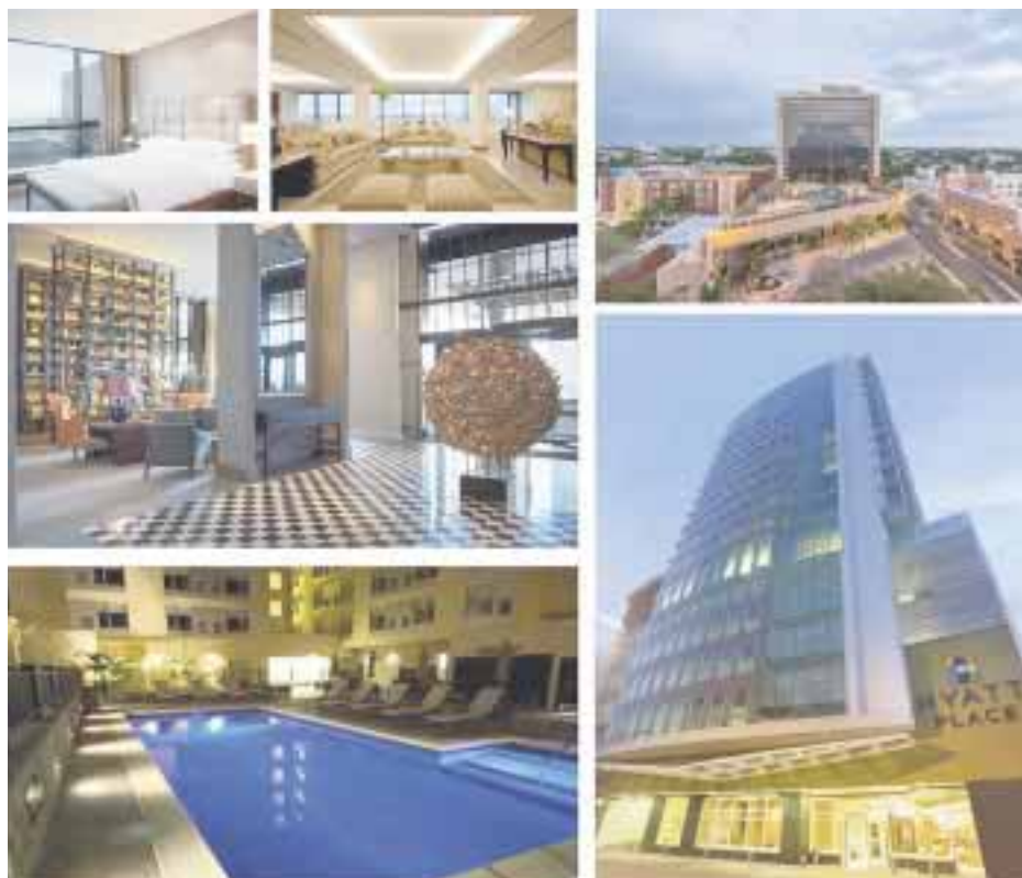
Destinos para disfrutar la temporada.

Solsticio Dzibilchaltún - A tan sólo 20 kilómetros de Mérida, se encuentra Dzibilchaltún,