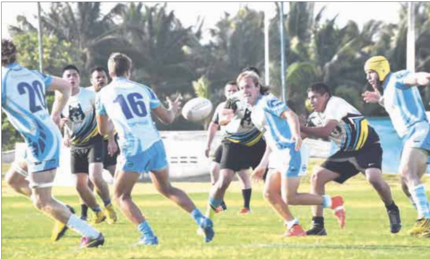
Con un claro triunfo de 31 a 18, "Hammerheads" se impusieron a Tasmania RFC, y ya piensan en el partido del sábado como locales, que les abriría el pase a semifinales.

La diferencia del marcador llegó en el segundo tiempo, cuando el equipo salió con todo a definir el partido, aunque las buenas intenciones no fueron suficientes, pues los cabezas de martillo dejaron las cosas con el marcador 31 a 18.