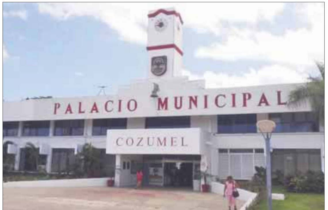
Los pagos del fondo se detuvieron debido a los cambios administrativos y recién volvieron a realizarse en enero pasado, pero hoy están suspendidos.

El municipio de Cozumel presenta un cumplimiento parcial en algunas de las obligaciones, como lo relacionado con las métricas financieras establecidas en el contrato de crédito original que durante 2015 estuvieron por arriba de lo pactado