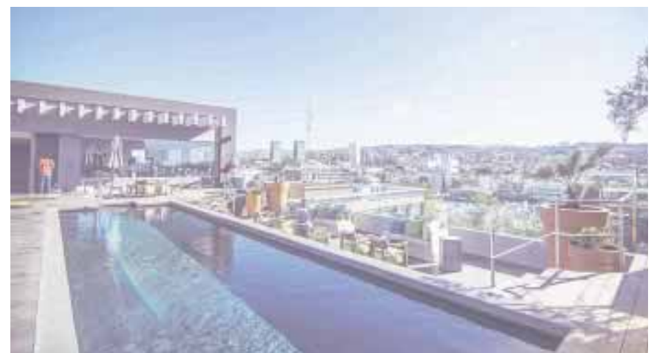
El nuevo hotel, en Tijuana, Baja California.