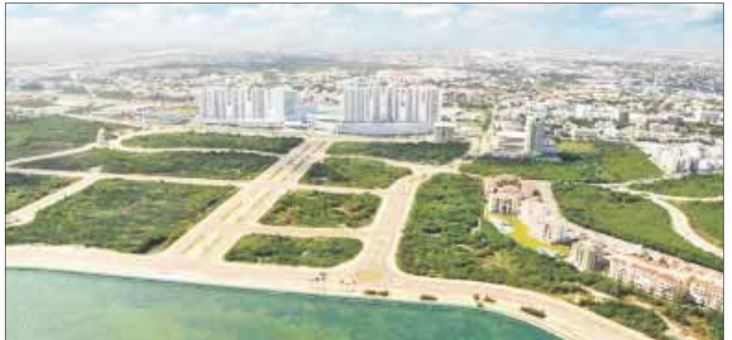
Ambientalistas promoverán amparos a favor de la protección del medio ambiente y contra de cualquier obra.

Se quejó una vez más, de que empresarios y “autoridades” inventen permisos en agravio del medio ambiente, ya que sólo se exhiben “la corrupción que existe en las instituciones”, en abierto reclamo a la Secretaría de Medio Ambiente por no realizar su función.