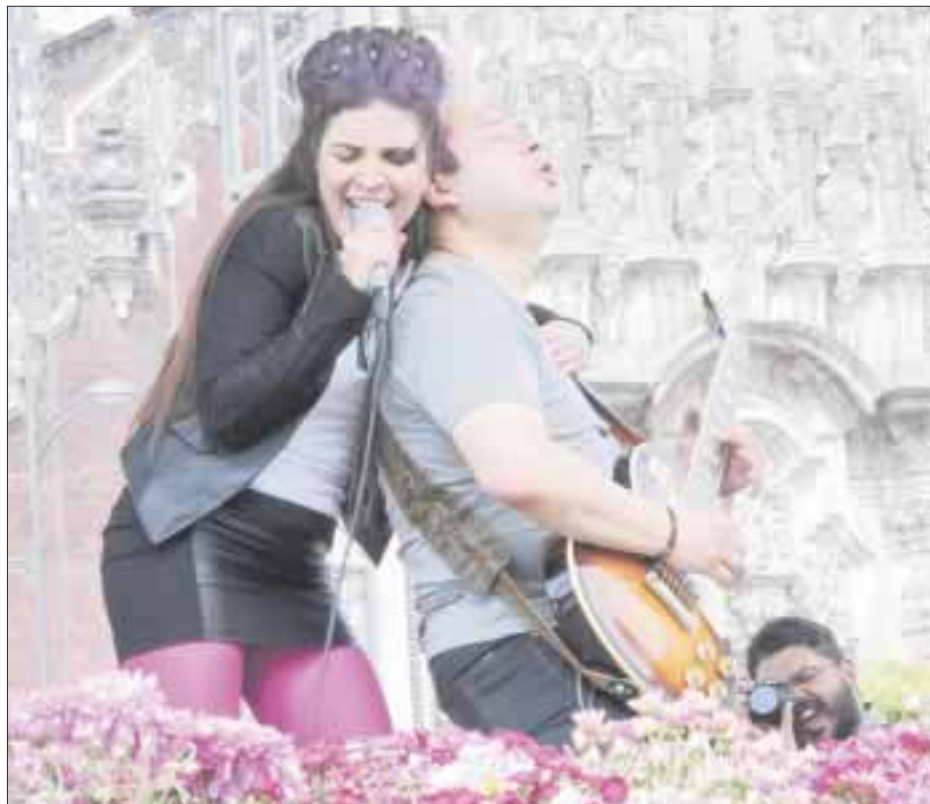
Con el carácter, talento y presencia que les caracteriza, Hilo Negro se apoderó del escenario.