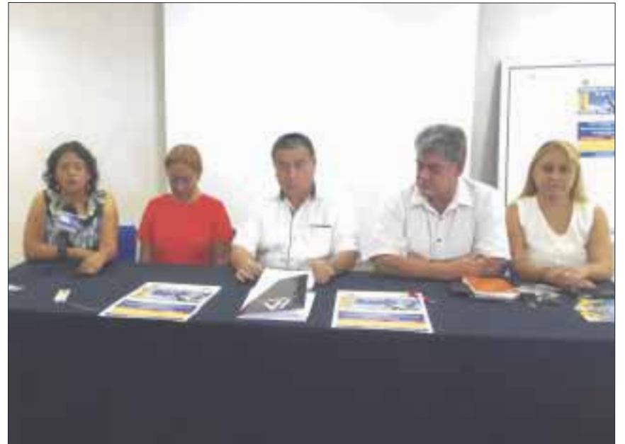
El presidente de la Barra de Abogados, Luis Armando Esquiél Orozco, precisó que hay que eficientar las evaluaciones de policías.

Como propuestas, el presidente de la Barra de Abogados, precisó que hay que eficientar las evaluaciones de policías, ya que más de la mitad no pasan los exámenes de confianza, pues son graves los casos de corrupción o falta de cumplimiento de sus funciones