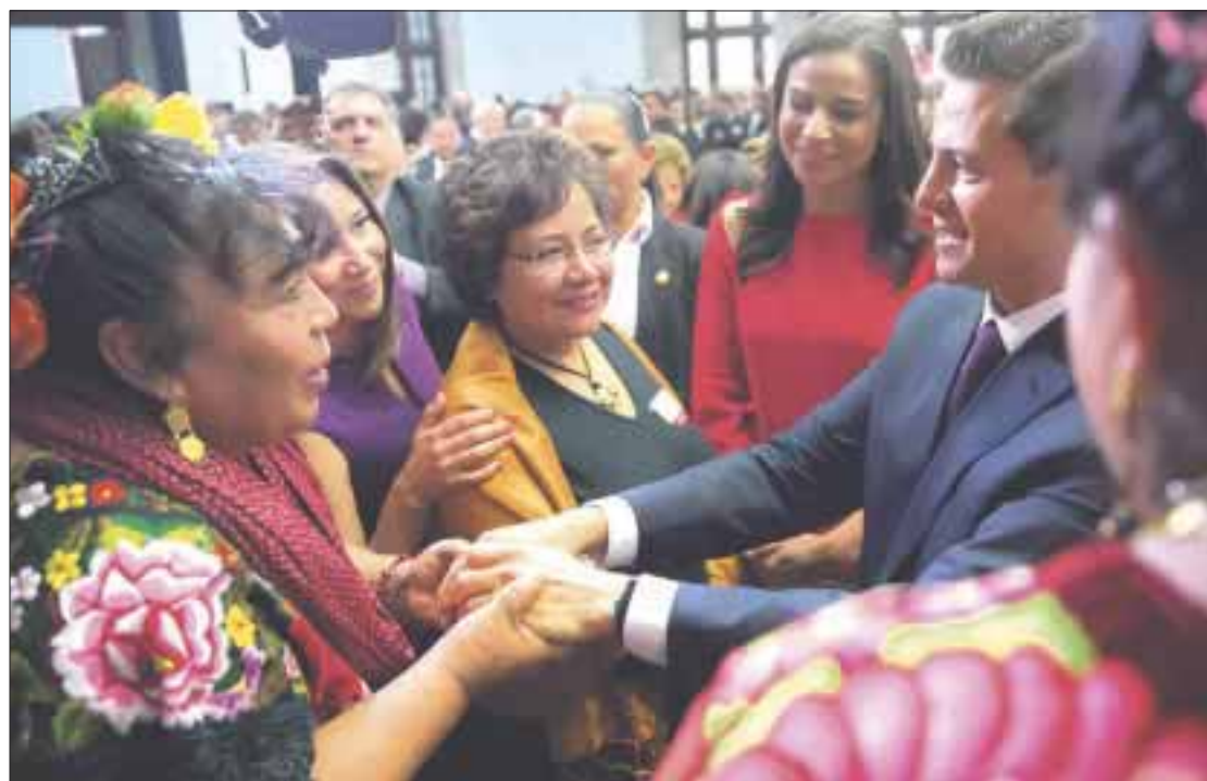
Enrique Peña Nieto encabezó la ceremonia conmemorativa del Día Internacional de la Mujer, en Los Pinos.

No obstante, confió en que en la lucha contra toda clase de violencia contra