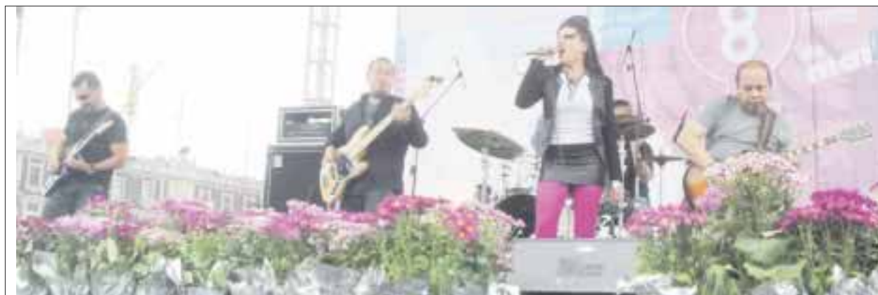
Durante el evento, Hilo Negro presentó el primer sencillo que se desprende de su nueva producción discográfica "Celos".

El nuevo disco de Hilo Negro estará siendo lanzado al mercado próximamente, mientras que el estreno oficial del sencillo "Celos" fue en el marco de su presentación en el Zócalo, y se pretende que en breve esté disponible en plataformas digitales.