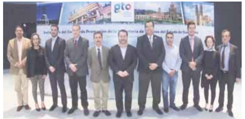
Durante la toma de protesta.

que Comité de Promoción Turística del estado de Guanajuato fue creado en esta Administración con el objetivo de integrar la participación ciudadana en la toma de decisiones en materia de Turismo.