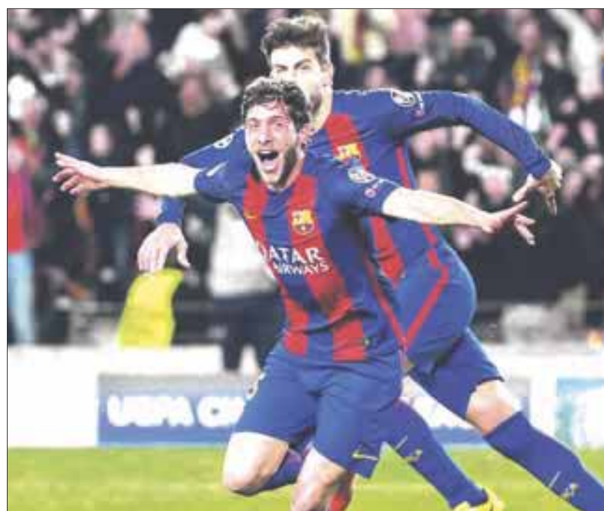
El Barcelona hizo tres tantos en los últimos 8 minutos del partido contra el PSG francés.

Aunque el partido comenzó con dudas por los claros efectos de la altura, el capitán Diego Hidalgo asentó el primer try, tras lo cual, un drop de Agustín Sánchez dejó el marcador 8 a 0 en apenas cinco minutos de juego