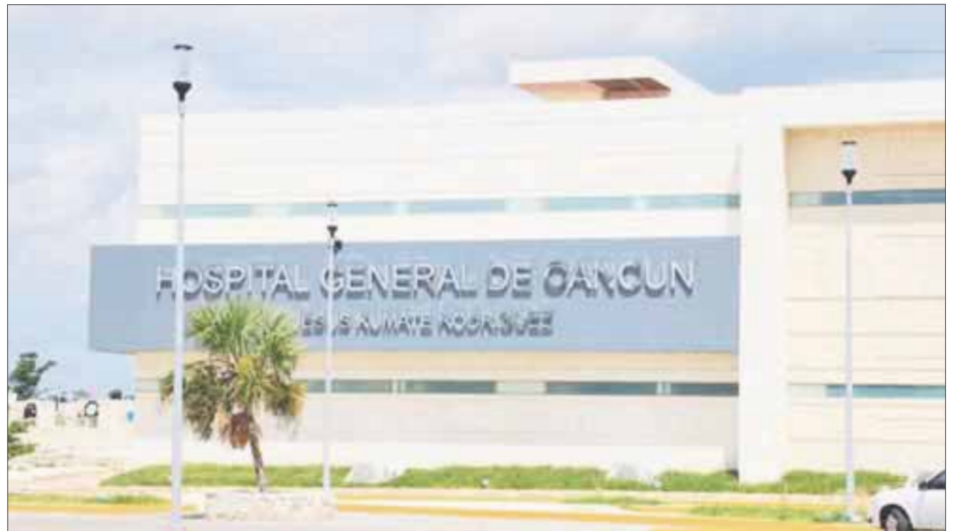
Las nuevas instalaciones del Hospital General de Cancún, Jesús Kumate Rodríguez se inaugurarán este viernes.

Al estar cercano el día de mudanza la petición al personal es mayor vigilancia policiaca y seguridad en la zona, además de más limpieza de áreas verdes y señalización en la zona para evitar accidentes.