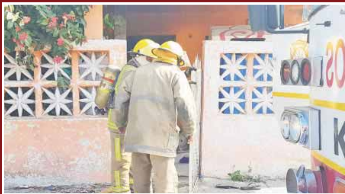
El domicilio de la explosión, al parecer era utilizado como bodega de juegos pirotécnicos.

Chetumal.- La explosión en una vivienda causó pánico entre habitantes de la colonia Primera Magistratura, lugar hasta el que llegaron los bomberos y de la policía para combatir el fuego y acordonar la zona y con ello evitar una mayor desgracia, pues se temía que el fuego llegara a otras casas y a una tienda de muebles ubicada a espaldas del lugar de los hechos y muy cerca del Sistema Quintanarroense de Comunicación Social.