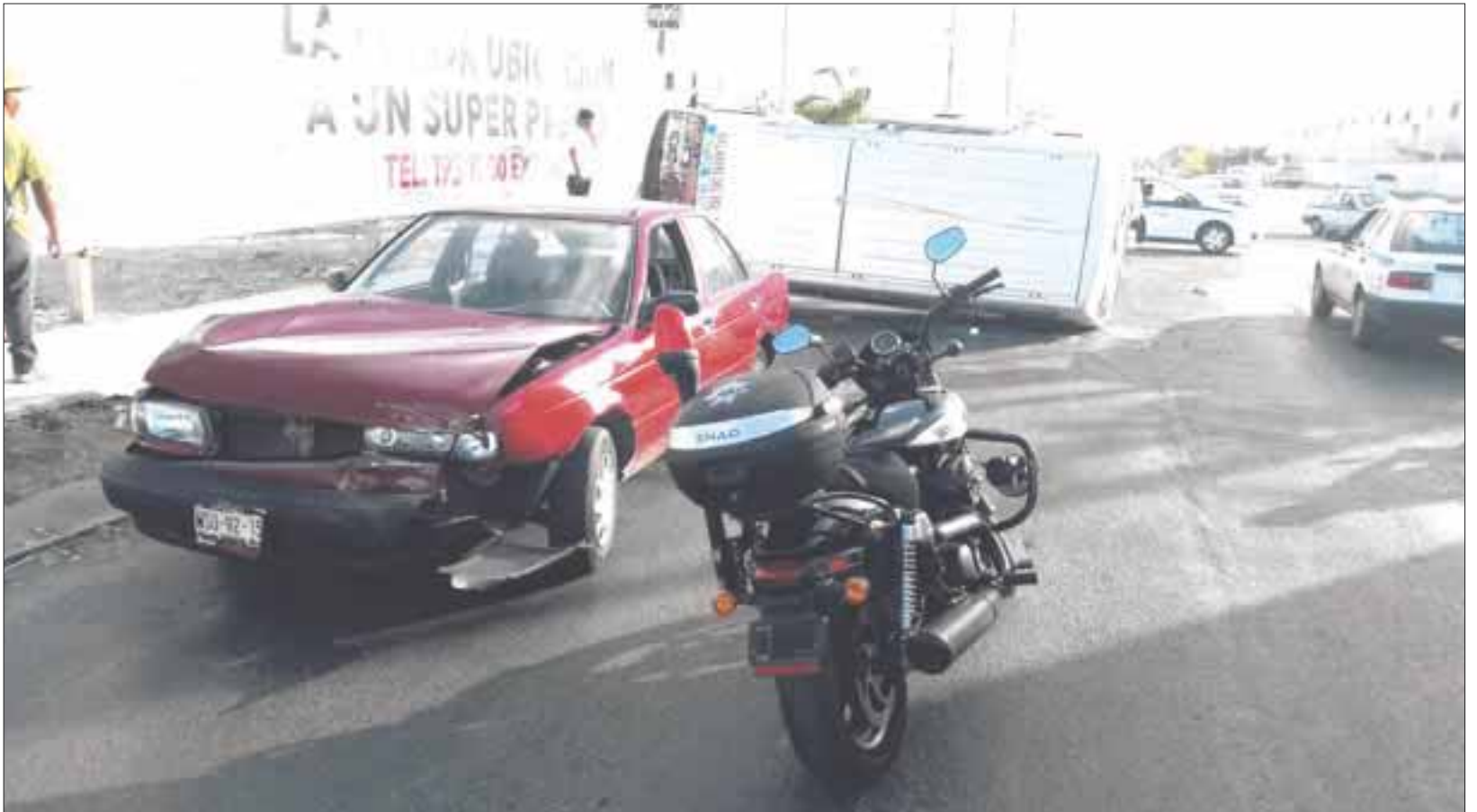
Así quedaron los dos vehículos después del impacto; todo por culpa del conductor de la Urvan que se pasó una luz roja en la avenida Chac Mool.

Los daños en este accidente se calcularon en 25 mil pesos, más las multas correspondientes para ambos conductores, principalmente al chofer de la Urvan.