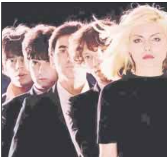
Esta noticia llega justo después del anuncio del nuevo álbum de Blondie "Pollinator", que saldrá a la venta el próximo 5 de mayo.

La carta completa de talento artístico presente en la FIC se puede consultar en la página de internet y redes sociales, lo mismo que el costo de los boletos y sedes.