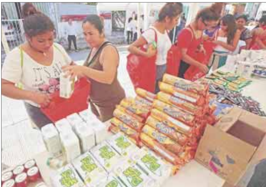
Denuncian malos manejos en los programas Reciclando Basura por Alimentos y Brigadas del Bienestar .