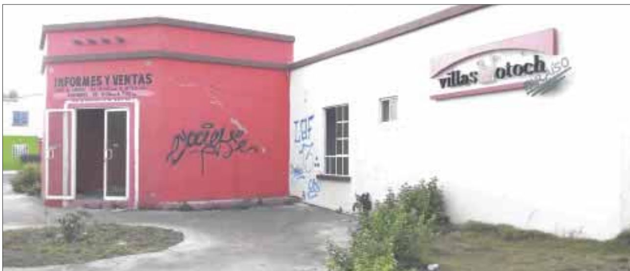
De esta manera se encuentra la oficina de ventas del Villas Otoch Paraíso en la región 247.

Cancún.- Habitantes del fraccionamiento Villas Otoch Paraíso, ubicado en la región 247, denunciaron que las antiguas oficinas de venta, son ahora la casa y el territorio de malvivientes.