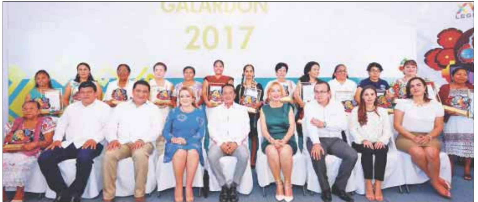
El gobernador Carlos Joaquín entregó el galardón “Mujer Quintanarroense Destacada” a 14 mujeres que se han distinguido por su trayectoria.

El gobierno del cambio ha realizado acciones para disminuir las desigualdades entre hombres y mujeres a través del empoderamiento de éstas y por ello ha destinado 6 millones de pesos en créditos a la palabra, más de 13 millones para el programa Mujer Emprende, más de 11 millones de pesos para el programa “Por un Quintana Roo Solidario en la Construcción de una Cultura de Paz”.