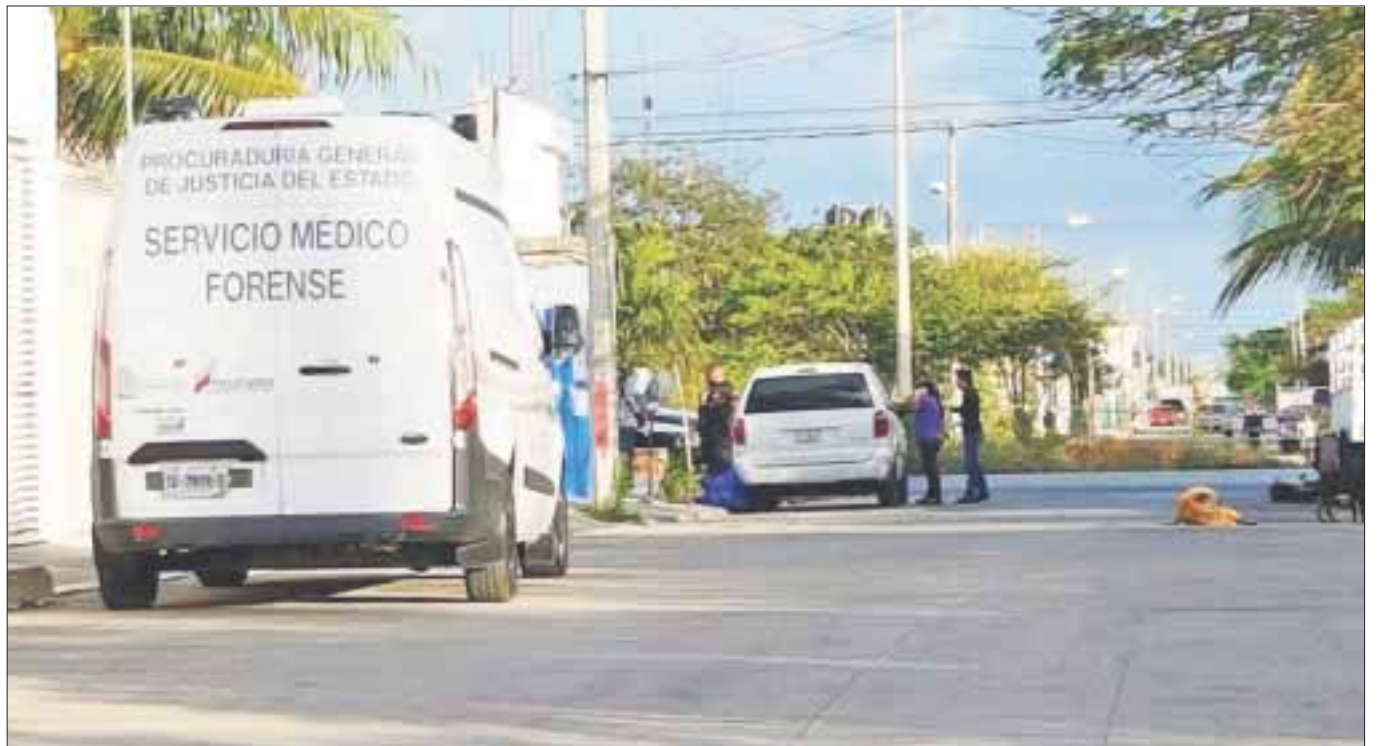
El policía ejecutado fue emboscado por motociclistas que ya lo esperaban en la esquina de su casa.

Un punto que vale la pena mencionar es que, a menos de dos horas del homicidio, la vocería de Puerto Morelos negó que el asesinado estuviera comisionado a ese municipio; sin embargo, la Secretaría de Seguridad Pública en Cancún, no solo confirmó que efectivamente el elemento estaba de comisión, sino que dio detalles.