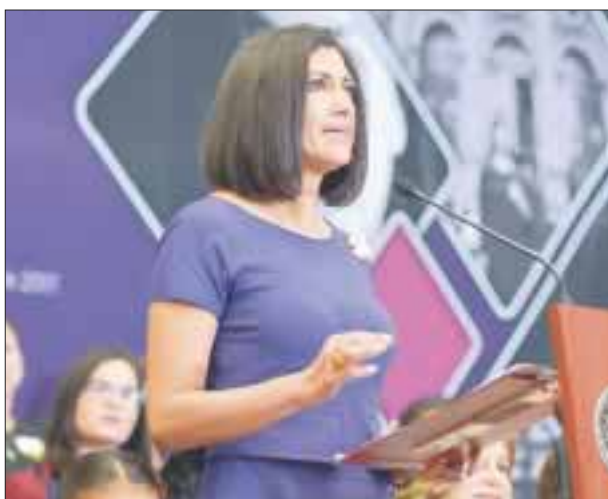
Lorena Cruz Sánchez subrayó que México necesita más mujeres involucradas en la vida pública.

La presidenta del Instituto Nacional de las Mujeres (Inmujeres), Lorena Cruz Sánchez, subrayó que México necesita más mujeres involucradas en la vida pública, más mujeres diseñando el rumbo del país y más mujeres haciendo historia.