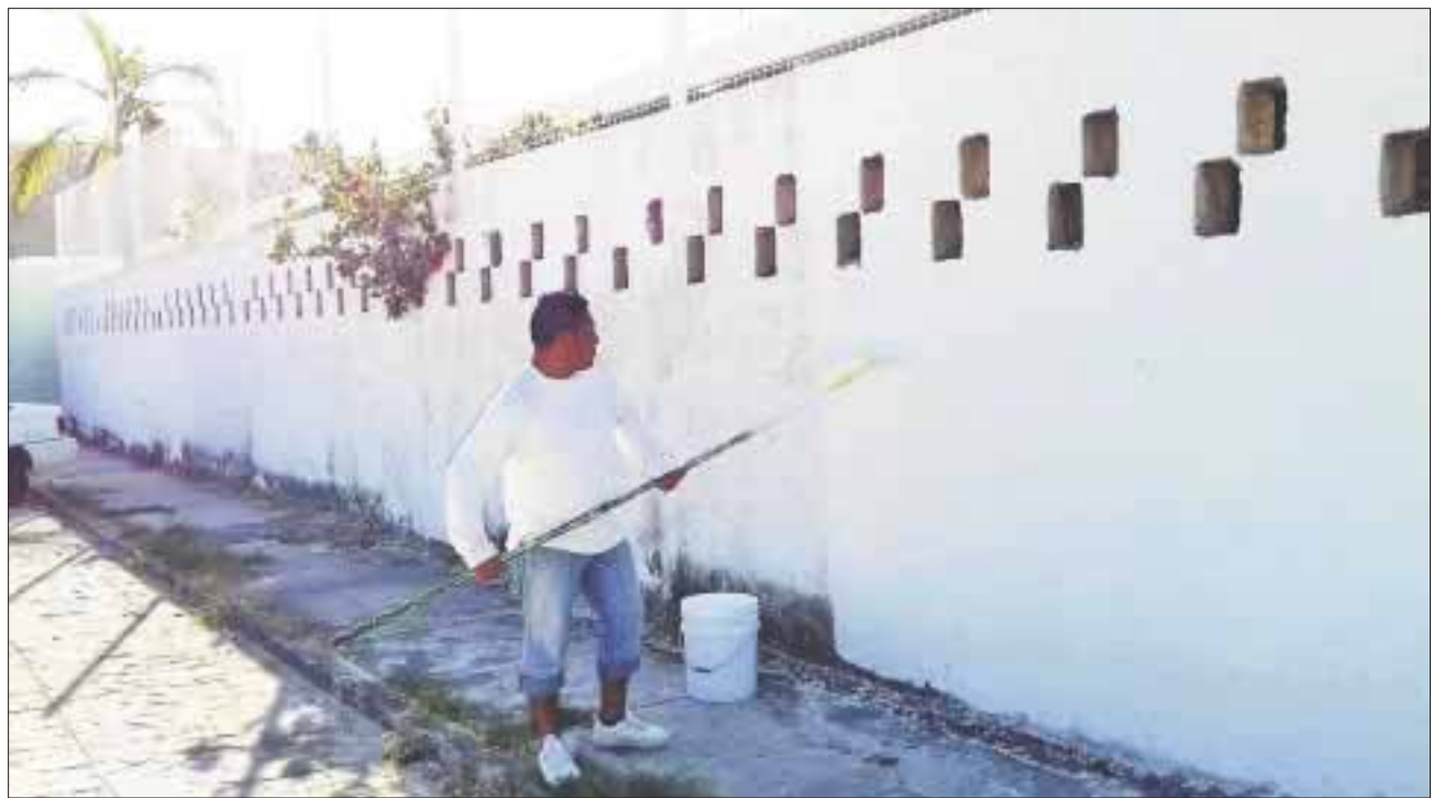
La SEyC cuenta con dos brigadas, una que realiza trabajos de limpieza y pintura y otra que lleva a cabo mantenimiento de plomería y electricidad.

En las nueve escuelas atendidas por la brigada, se limpiaron áreas verdes, se podaron árboles, rastrillaron las zonas trabajadas y se recogió la basura.