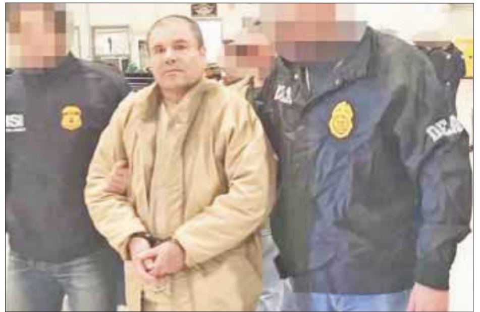
Un directivo de Amnistía Internacional pide acceso al área de alta seguridad de la prisión en Nueva York, donde está recluso Joaquín "El Chapo" Guzmán.

Antes, la unidad ha recluso a presos prominentes de alto riesgo como el jefe de la familia delictiva Gambino, John Gotti, y varios ex colaboradores del terrorista Osama Bin Laden