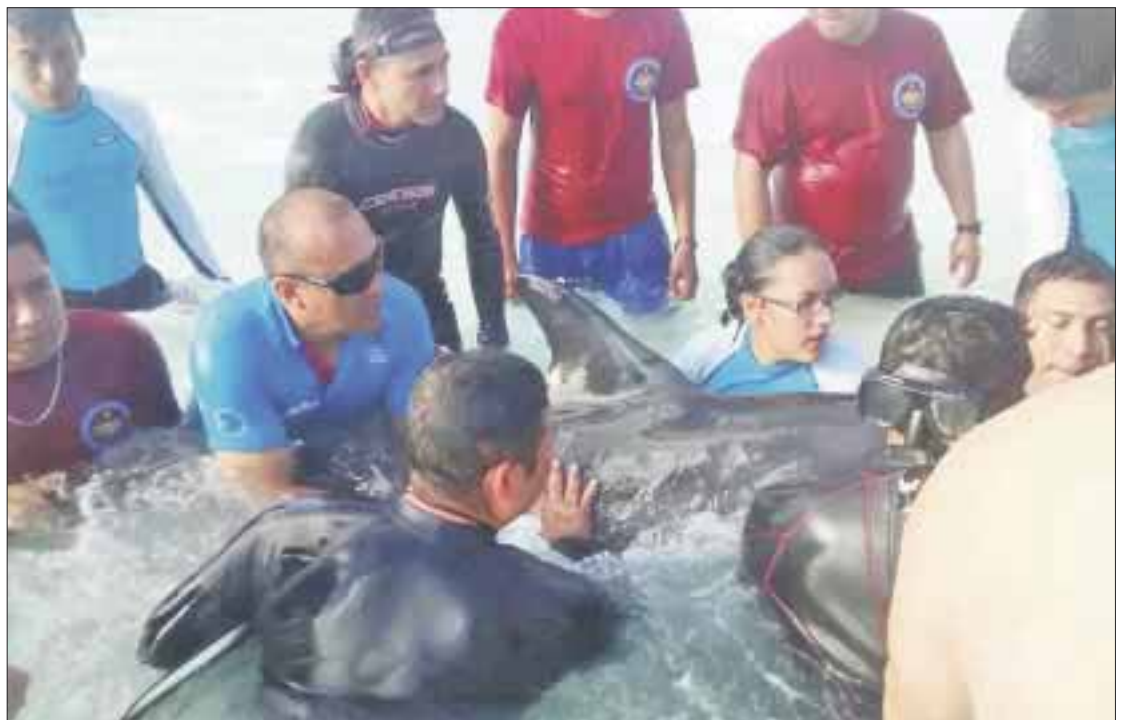
El pasado 23 de diciembre de 2016, Dolphinaris particip  en la asistencia m dica de un "delf n de dientes rugosos" en las playas de la Zona Hotelera.

La sesi n ordinaria de este a o se llev  a cabo a finales de febrero en las instalaciones de la Universidad de Quintana Roo Campus Chetumal. Con el fin de tener una mayor preparaci n y prevenci n, se estableci  entre los miembros del comit , un programa de reuniones de trabajo y capacitaci n en el transcurso del presente a o, en donde Dolphinaris participar  en la impartici n de un curso sobre atenci n b sica de mam feros marinos varados a n con vida.