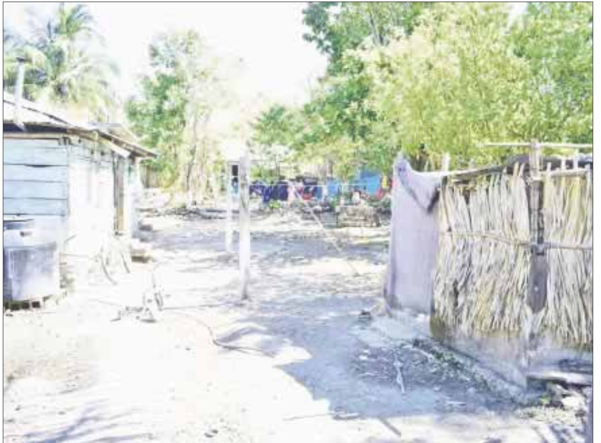
Un órgano integrado por investigadores de centros de educación superior evaluará los programas sociales de combate a la pobreza.

Finalmente, destacó que la instalación de la Comisión de Evaluación se llevará a cabo en el marco de la primera reunión ordinaria de la Comisión Estatal para el Desarrollo Social, con presencia de los 11 presidentes municipales de la entidad, el Sistema Integral para la Familia, los titulares de la Secretaría de la Gestión Pública y de la Secretaría de Finanzas y Planeación, así como de representantes de dependencias federales y estatales del sector social, universidades y organizaciones no gubernamentales.