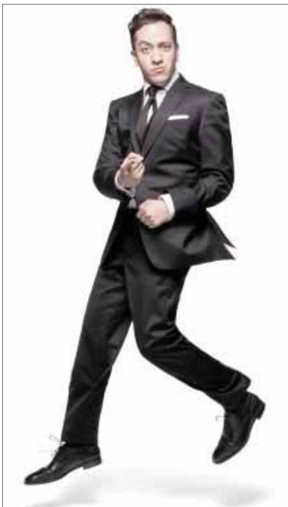
Chumel Torres estrenará en breve “¿Qué hubieran hecho ustedes?”, espectáculo en vivo.

Akasha ha recibido premios y reconocimientos nacionales e internacionales, por ejemplo, ganadores dos veces del Premio 40 Principales España como mejor artista de Costa Rica y ganadores 2 veces del premio ACAM como Grupo Costarricense con Mayor Proyección Internacional, e incluso han sido seleccionados en los últimos años para compartir tarima con artistas internacionales como Aerosmith, Evanescence, Korn y P.O.D. Su más reciente disco ya esta disponible para descarga en plataformas digitales.