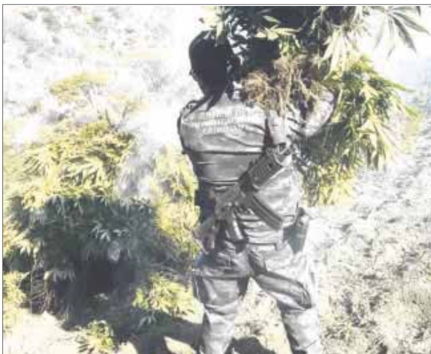
Los mil kilos mariguana fueron incinerados por los elementos de la Fuerza Única Regional.

Guadalajara.- La Fiscalía General de Jalisco reportó que elementos de la Fuerza Única Regional localizaron y destruyeron dos secaderos de vegetal verde, al parecer mariguana, esto en el municipio de Etzatlán.