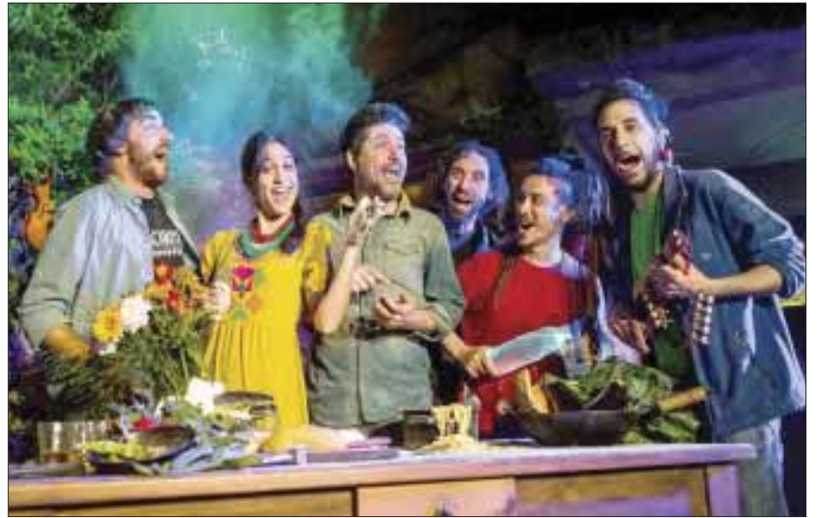
Churupaca se presentará el 1 de abril en el Festival Guacamaya en Cholula, Puebla.

Cada programa posee un estilo diferente pensando en diversión y entretenimiento. Motivados por la música y la experiencia, Bandamax, es líder en transmisión de videos a nivel internacional, y el canal de música regional mexicana más importante de América. Bandamax se consolida como una de las señales mejor posicionadas de Televisa Networks en el mercado de televisión de paga. Cuenta con más de 19 producciones propias, más de 10 millones de seguidores en redes sociales y su señal es vista en más de 30 países de América y Europa.