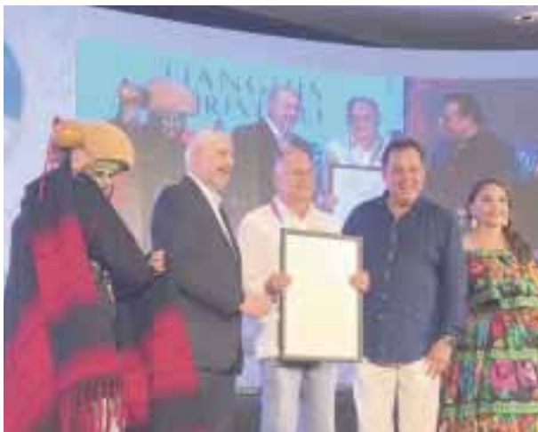
Entrega de los premios Excelencias, aquí, el titular de Turismo de Chiapas.

“Hemos trabajado de manera transversal en fortalecer aspectos