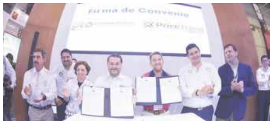
En la firma de la Alianza Guanajuato-Price Travel.