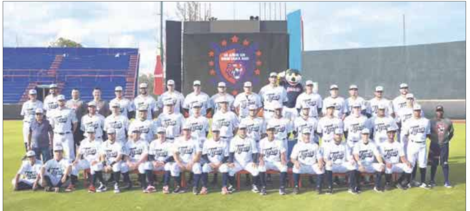
Para los Tigres de Quintana Roo, su serie inaugural será ante Leones de Yucatán en el estadio Kukulcán de Mérida.