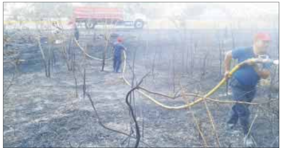
Los incendios forestales se multiplicarán, debido a la sequía generada por el calentamiento global.

peran “30 huracanes: 17 en el Pacífico, 13 en el Atlántico, a nosotros nos tocarían 13, siete son tormentas tropicales, cuatro de intensidad uno y dos y dos de intensidad, tres, cuatro y cinco”, por lo que desde ahora la ciudadanía debe prevenir cualquier situación relacionada con el cambio climático. A esas declaraciones se sumó el gerente de la Comisión Nacional Forestal, Rafael León Negrete, quien recomendó no dejar fogatas encendidas, tampoco tirar colillas de cigarro en el monte y evitar cualquier situación de riesgo de incendios, durante esta temporada vacacional.