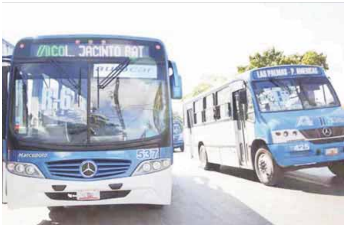
Los transportistas de Autocar, Turicun, Bonfil y Maya Caribe amagan con parar el servicio de no aprobar el cabildo un incremento de cuatro pesos o un “ajuste” en la tarifa.

Con un crédito bancario podrían garantizar combustible para los próximos meses, porque con el alza del diésel la situación se torna insostenible, y si bien baja eventualmente la gasolina, el diésel difícilmente sufre algún ajuste en su costo.