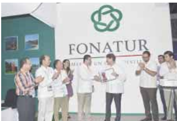
En la celebración del 43 aniversario de Fonatur