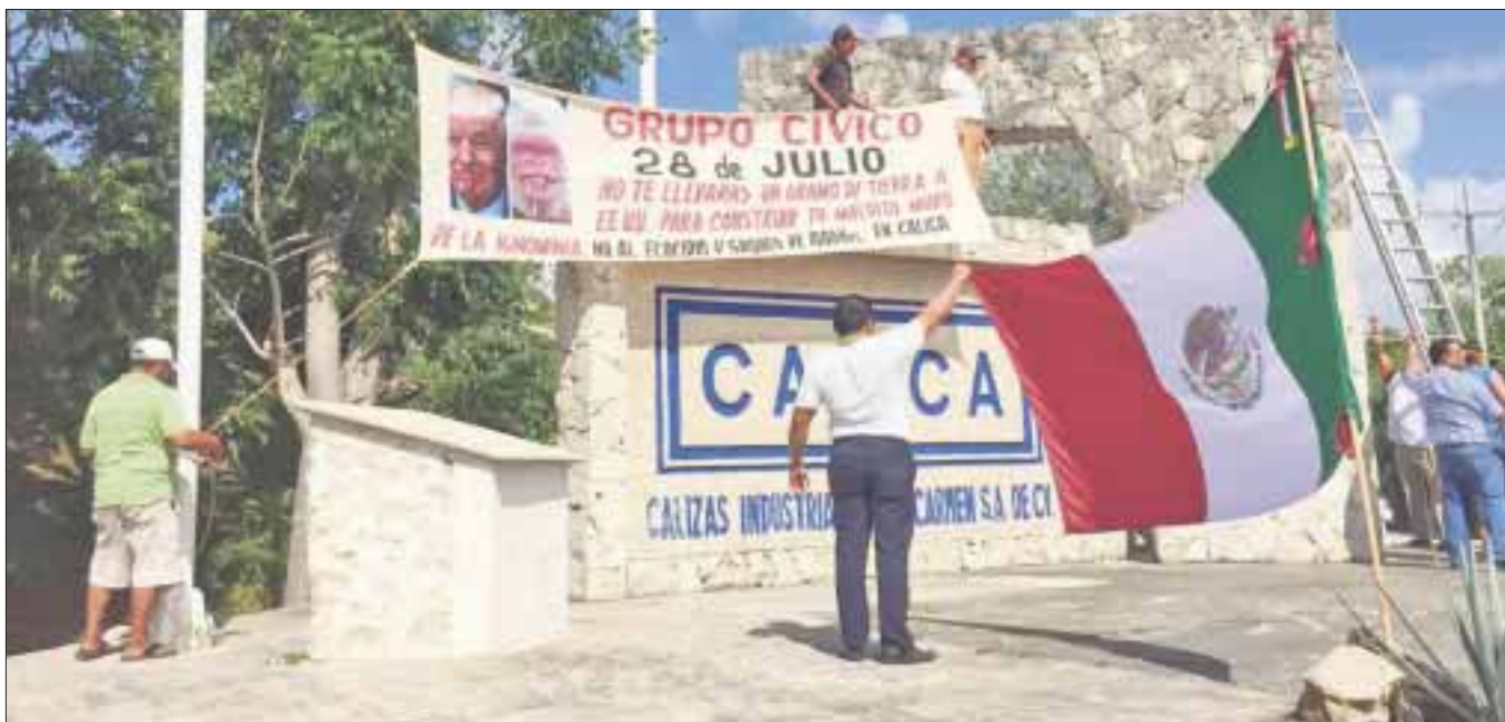
El inter s de los solidarenses de preservar el medio ambiente, su flora y la fauna, es superior por sobre un inter s particular en este caso de Calica.

Chetumal.- Ingresan por Oficial a de Partes del Congreso del estado un exhorto al ayuntamiento de Solidaridad y al Comit  del Programa de Ordenamiento Ecol gico local para que no modifiquen el Programa de Ordenamiento Ecol gico local con el que se pretende modificar las  reas de conservaci n y autorizar el cambio de uso de suelo para que la empresa Calica realice actividades de explotaci n minera.