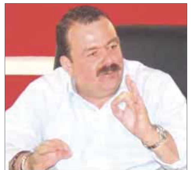
Permanecerá encarcelado en San Diego el ex fiscal general del estado de Nayarit, Édgar Veytia.

D.C. a las acusaciones de que su cártel contrabandó cocaína y metanfetamina a Estados Unidos en una operación de miles de millones de dólares.