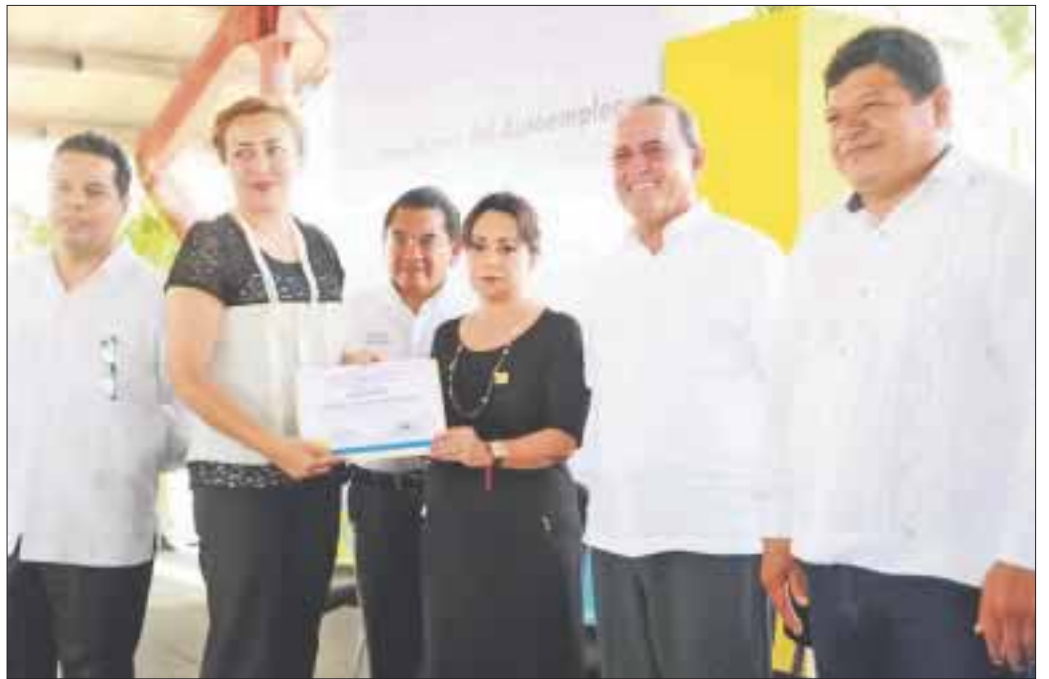
125 personas del subprograma Bécate, que concluyeron su capacitación en repostería, comida regional, bisutería, mantenimiento de aires acondicionados y formación de instructores, recibieron 2 mil pesos

Los funcionarios también entregaron apoyos a 125 personas del subprograma Bécate por la cantidad de 2 mil pesos a cada uno luego de concluir con su capacitación en repostería, comida regional, bisutería, mantenimiento de aires acondicionados y formación de instructores