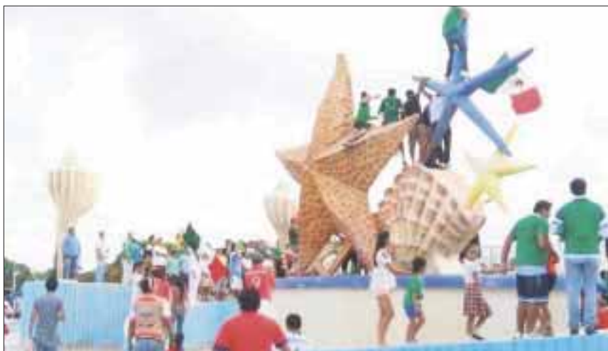
Proponen pintura mineral para embellecer la emblemática fuente de “El Cebiche”, en Cancún.

Cancún. - Pintura mineral, ideal para estructuras históricas como la Minerva en Guadalajara, que fue protegida en su momento con impermeabilizante de azoteas, lo cual dañó gravemente su estructura, será propuesta para la emblemática fuente de “El Cebiche” en Cancún.