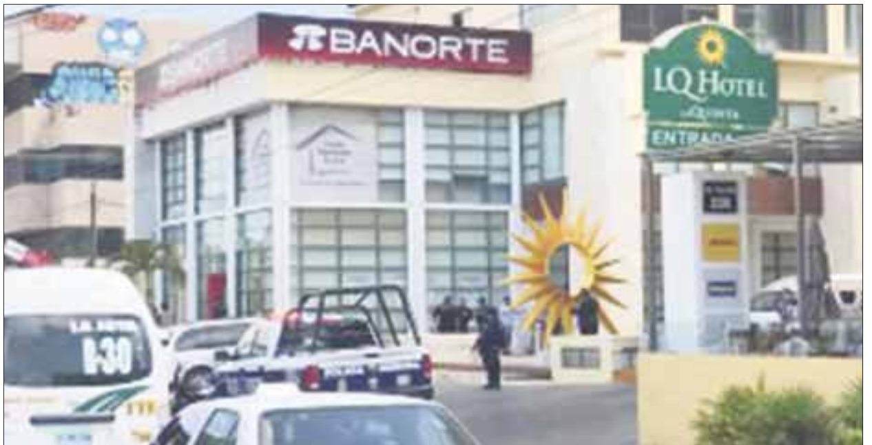
El militar hacia trámites en Banorte , ubicado en la supermanzana 4, manzana 14, Av. Tulum, cuando al lugar llegaron los amantes de lo ajeno, con el fin de atracar a un cuentahabiente; sin embargo, no contaban que alguien les echara a perder el día.

Por otra parte, las autoridades dieron a conocer que en relación a la tentativa de robo a Banorte también estaba involucrado un vehículo March color gris de vidrios polarizados y una motocicleta, cuyo conductor portaba una chamarra negra