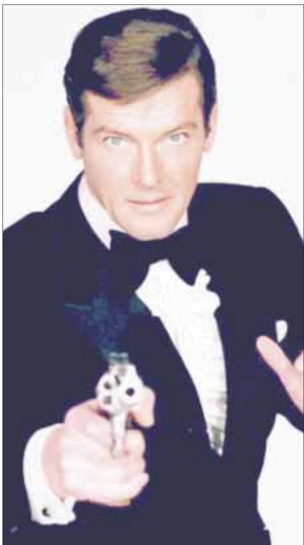
El actor británico, Roger Moore, reconocido por interpretar el papel del espía James Bond, murió el 23 de mayo a los 89 años en Suiza, informó su familia.

Confiesa que fue un proyecto bastante exigente "nos íbamos a grabar a las 5 de la mañana y estaba de regreso en mi casa a las 10 de la noche, todos los días, era un nivel demandante, emocionalmente siempre había estrés, pero logramos un gran equipo", concluyó.