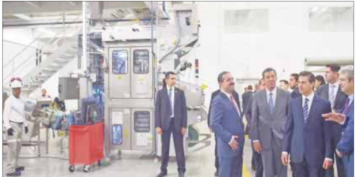
Enrique Peña Nieto señala que nuestra economía es fuerte y que el mundo confía cada vez más en México.

micas que se publicaron en el trimestre se pueden ver reflejadas en el Producto Interno Bruto, que mide la producción y el consumo en el país.