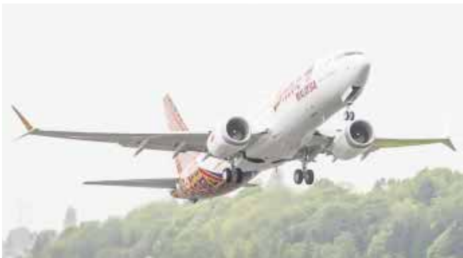
Boeing entrega el primer 737MAX.