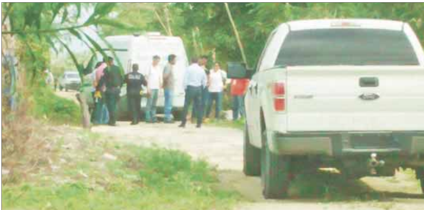
La víctima era una persona del sexo femenino, de entre 30 a 35 años de edad, complexión robusta y tez morena.

Cancún.- En la agencia del Ministerio Público se inició la indagatoria 129/2017 por homicidio en agravio de una persona del sexo femenino que fue recogida en calidad de desconocida, al ser encontrada el día 22 de mayo embolsada en la Sm. 216, en contra quién o quiénes resulten responsables.