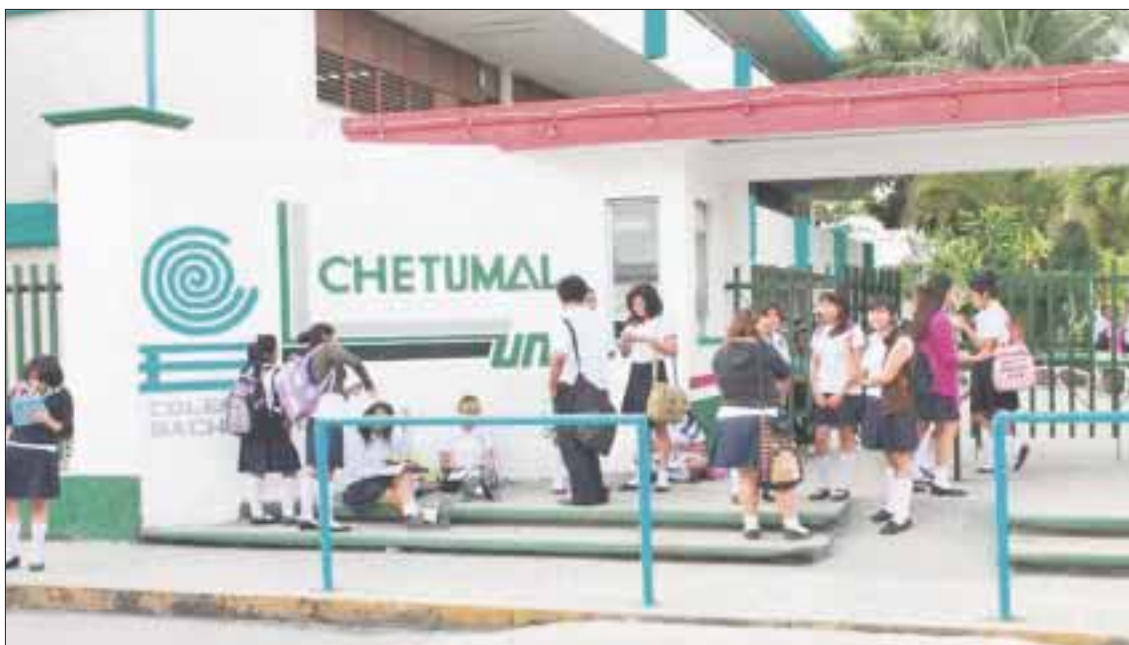
Por los cortes momentáneos de energía eléctrica en Chetumal, los alumnos pretendían "matar clases", pero las reanudaron al filo del mediodía.

Chetumal.- Según la Comisión Federal de Electricidad (CFE), el apagón de ayer se debió a una falla registrada a las 11:00 horas en el complejo hidroeléctrico "Grijalva", el cual abastece a las entidades de Chiapas, Tabasco, Campeche, Yucatán y Quintana Roo, lo que afectó a un millón 700 mil usuarios que se quedaron sin energía eléctrica.