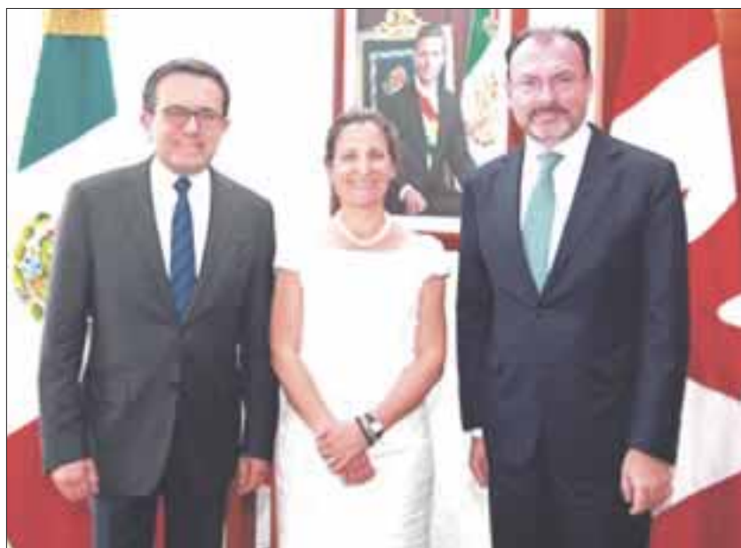
Ildelfonso Guajardo Villarreal, y el canciller Luis Videgaray, en conferencia de prensa conjunta con la ministra de Asuntos Exteriores y de Cooperación de Canadá, Chrystia Freeland.

Es conveniente que el proceso de negociación comercial en la modernización del Tratado de Libre Comercio de América del Norte (TLCAN) se resuelva pronto para dar certidumbre a los inversionistas, a quienes contratan personal y para los mercados financieros, aseguró el canciller, Luis Videgaray Caso.