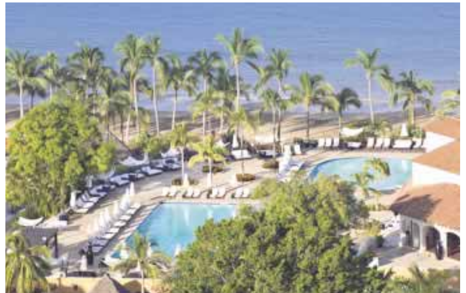
El Club, en Ixtapa.

La familia 737 MAX está diseñada para proporcionar la ma-