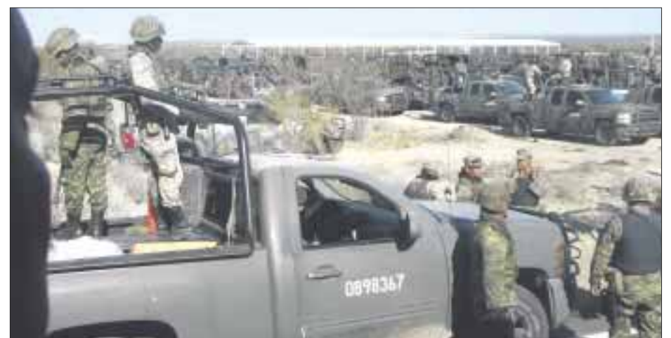
Soldados dispararon contra presunto ladrón de combustible, que iba a bordo de una camioneta en Tepeaca, Puebla.