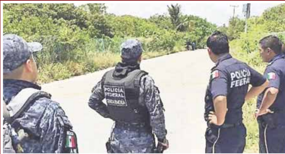
En la zona de Punta Sam se han encontrado por lo menos tres cuerpos de personas que han sido abandonadas.

Cancún.- Para no variar, hallan un cuerpo decapitado y mutilado la madrugada de ayer martes en la carretera costera Puerto Juárez-Punta Sam, por la entrada del restaurante Kukulcán.