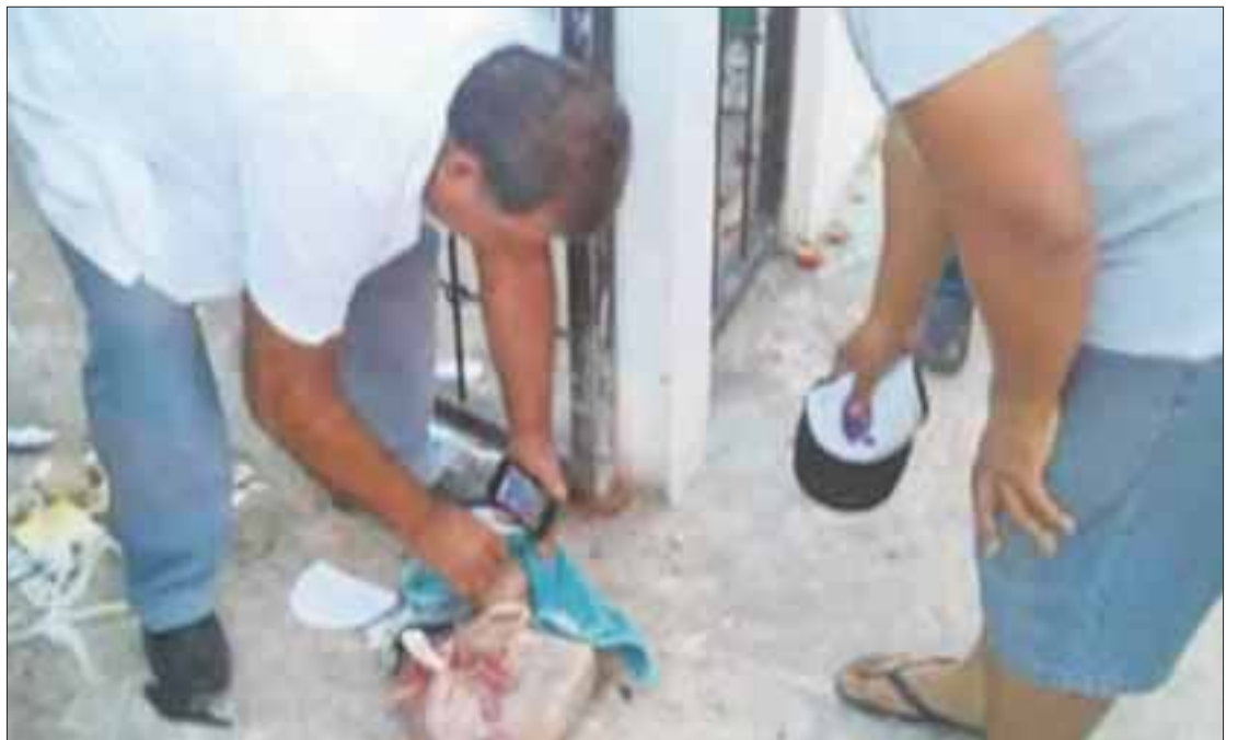
La recién nacida que fue abandonada en un basurero en Ciudad Natura estaba envuelta en una bolsa de plástico.

Los especialistas luego de valorar las condiciones en las que se encuentra, peso y tamaño, se le otorgaron antibióticos y otros medicamentos que son necesarios para un recién nacido, ante el latente riesgo de infección.