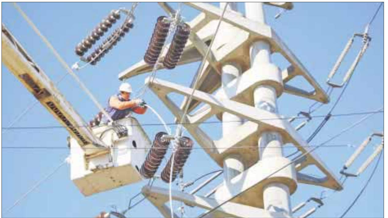
Apagón en algunas partes fue de una hora y media y en otras de cuatro horas y afectó a Cancún, Playa del Carmen, Tulum, Mérida, Valladolid y Tizimín.

Si bien Quintana Roo, es uno de los estados afectados por el apagón, no todos los municipios padecieron la falla eléctrica, ya que Felipe Carrillo Puerto, Chetumal y José María Morelos no sufrieron una afectación total del servicio, sino parcial.