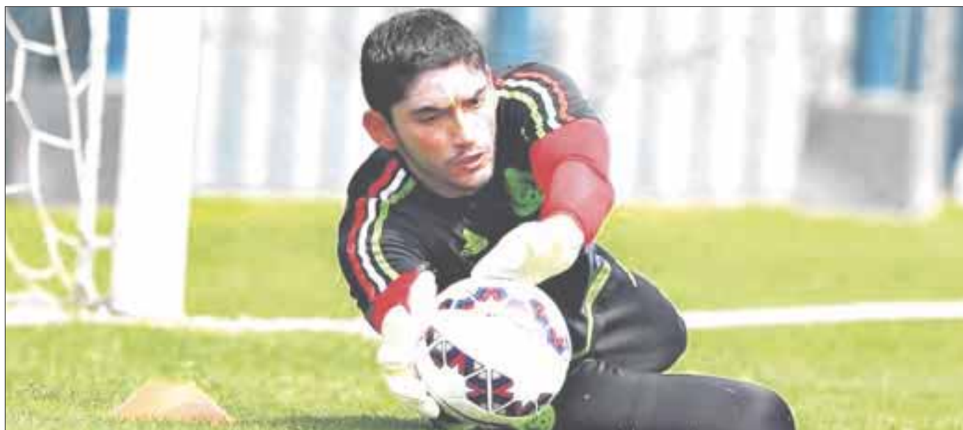
El guardameta José de Jesús Corona causó baja de la Selección Mexicana de Fútbol debido a una lesión en la rodilla.

El portero José de Jesús Corona causó baja de la Selección Mexicana de Fútbol, debido a una molestia en la rodilla izquierda, de cara a los partidos amistosos frente a Croacia e Irlanda.