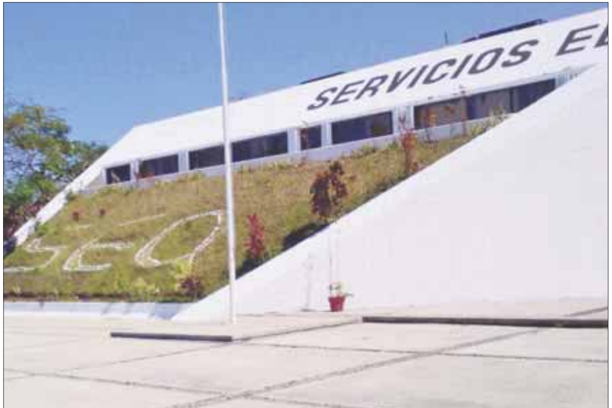
Se manifestaron organizaciones civiles por la destitución de la titular de la SEyC en Quintana Roo, Marisol Alamilla.

Dejaron entre ver que pueden ser flexibles, tal como lo expresaron de manera oficial la semana pasada en el escrito que entregaron en Chetumal, siempre y cuando se refleje un interés real y mejoras de educación para el sector que permanece muy castigado, sobre todo en el nivel básico.