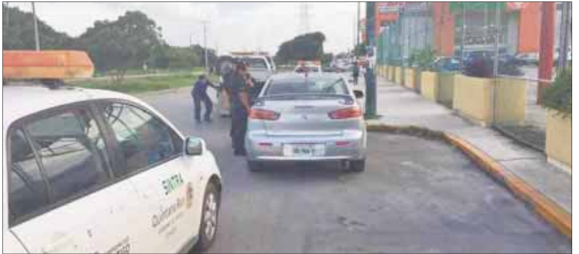
La Secretaría de Infraestructura y Transportes (Sintra), reitera que no hay complicidad con algún sindicato contra Uber; fortalecerán estrategias de operación para evitar conflictos entre transportistas.

Dicha estrategia de parte de los inspectores de Sintra con los infractores de la norma de transporte, explicó es para evitar que los responsabilicen a ellos de acciones en las que nada tuvieron que ver.