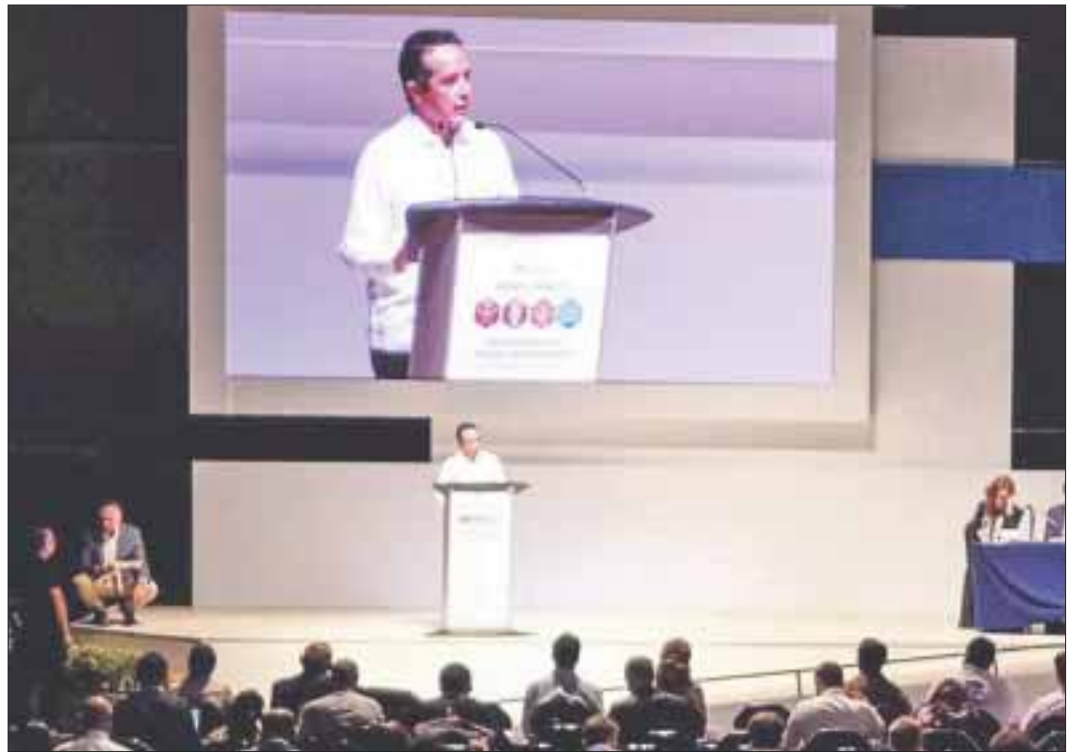
El gobernador Carlos Joaquín destacó que los quintanarroenses han desarrollado una cultura de protección de las personas.

El gobernador detalló que en este foro mundial se buscará fortalecer la preparación de la población ante desastres para elevar la capacidad de reacción; dar seguimiento a las actividades del Consejo Estatal de Protección Civil; realizar protocolo de atención al turista; realizar a través del Sistema de Alerta Temprana el monitoreo de fenómenos hidrometeorológicos, entre otros.