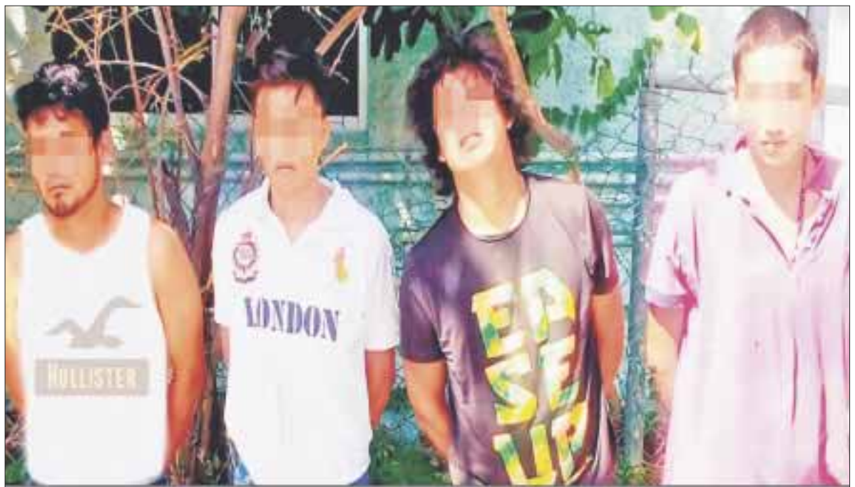
Los cuatro sujetos fueron enviados a las instalaciones de la Secretaría Municipal de Seguridad Pública para certificarlos médicamente y ponerlos a disposición de la autoridad.