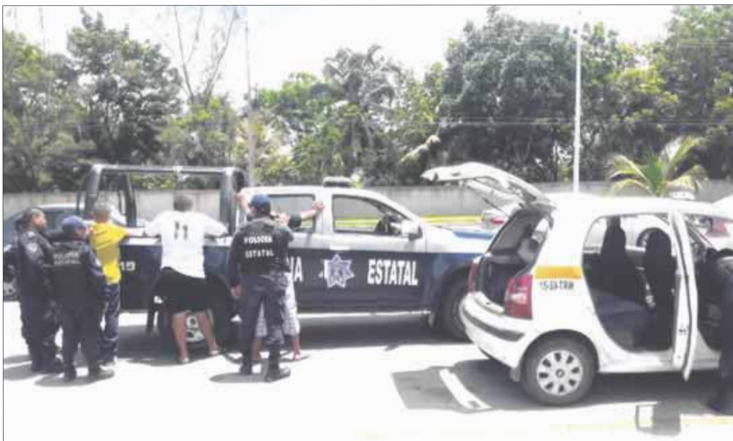
En Chetumal, la modalidad de asaltar a trabajadores del volante comienza a generalizarse.