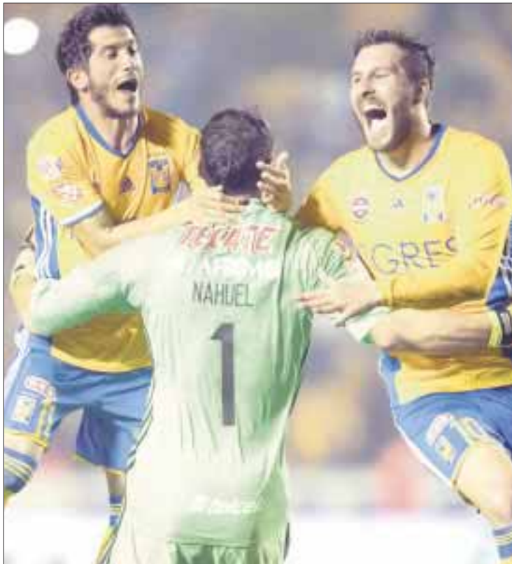
Tigres de la UANL cumplieron y están a las puertas de su cuarta corona en seis años, pero tendrán que eliminar a las Chivas.

Para la mayoría, los dirigidos por el 'Pelado' no están catalogados como favoritos, pues en la liguilla sólo lograron hacer tres anotaciones; sin embargo, fue el único de los cuatro 'equipos grandes' en calificar a la fiesta grande.