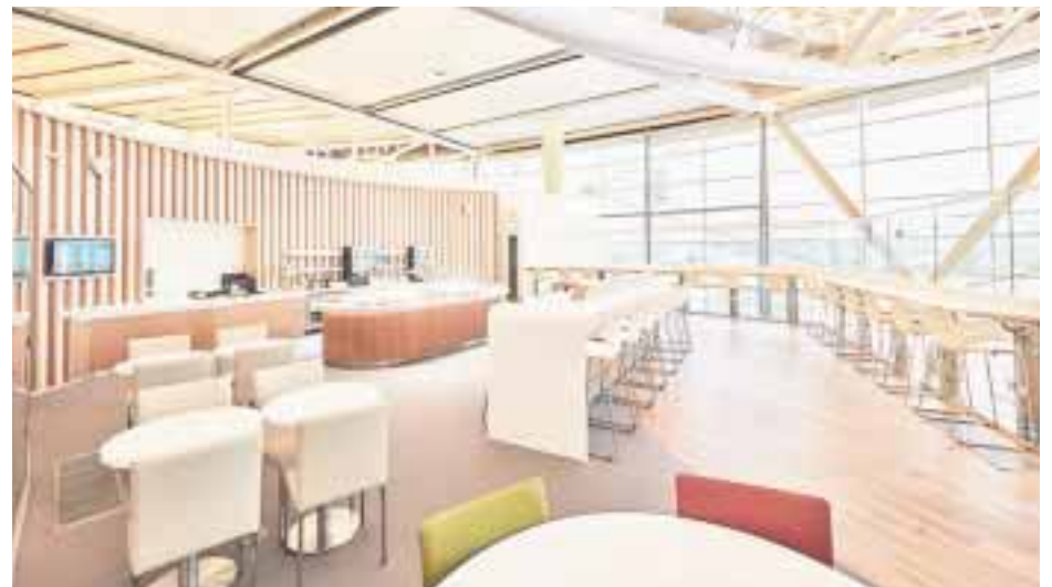
La nueva sala SkyTeam, en el Aeropuerto de Vancouver.

De los 14 días de vacaciones al año a los que tienen derecho los mexicanos utilizan 12 en promedio. Y cuando les preguntaron