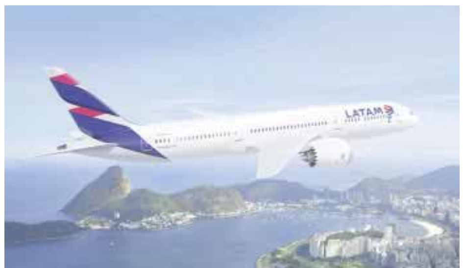
Espera autorización para volar a Israel.