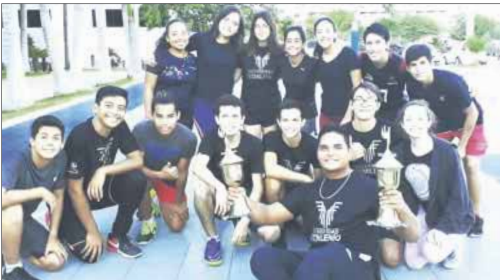
Tec Milenio se coronó en ambas ramas en la Copa de Voleibol Tec Milenio 2017, mostrando así su buen nivel en este deporte.

Cancún.- Dio por finalizada la Copa Tec Milenio 2017, donde el equipo de casa, Tec Milenio, se alzó con el campeonato de la categoría de preparatorias en ambas ramas.