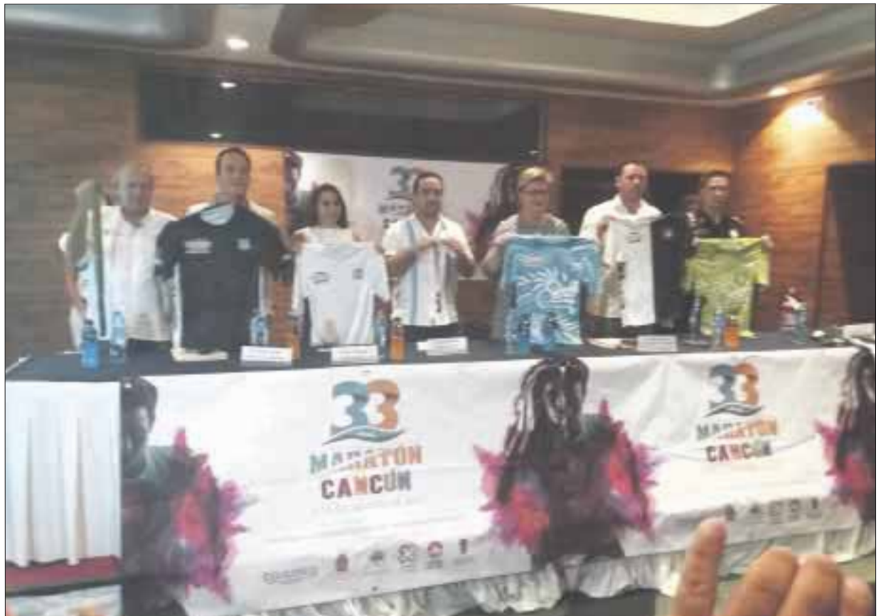
Todo está listo para la 33 edición del Maratón Internacional de Cancún, que se llevará a cabo este sábado.

Todavía quedan 400 lugares para quienes estén interesados en correr; el costo de inscripción es de 750 pesos, el cierre será minutos antes de que comience la competencia, en la que se espera una derrama económica de 6 mil pesos diarios por corredor y sus 15 mil acompañantes, que ya llenaron varios hoteles.