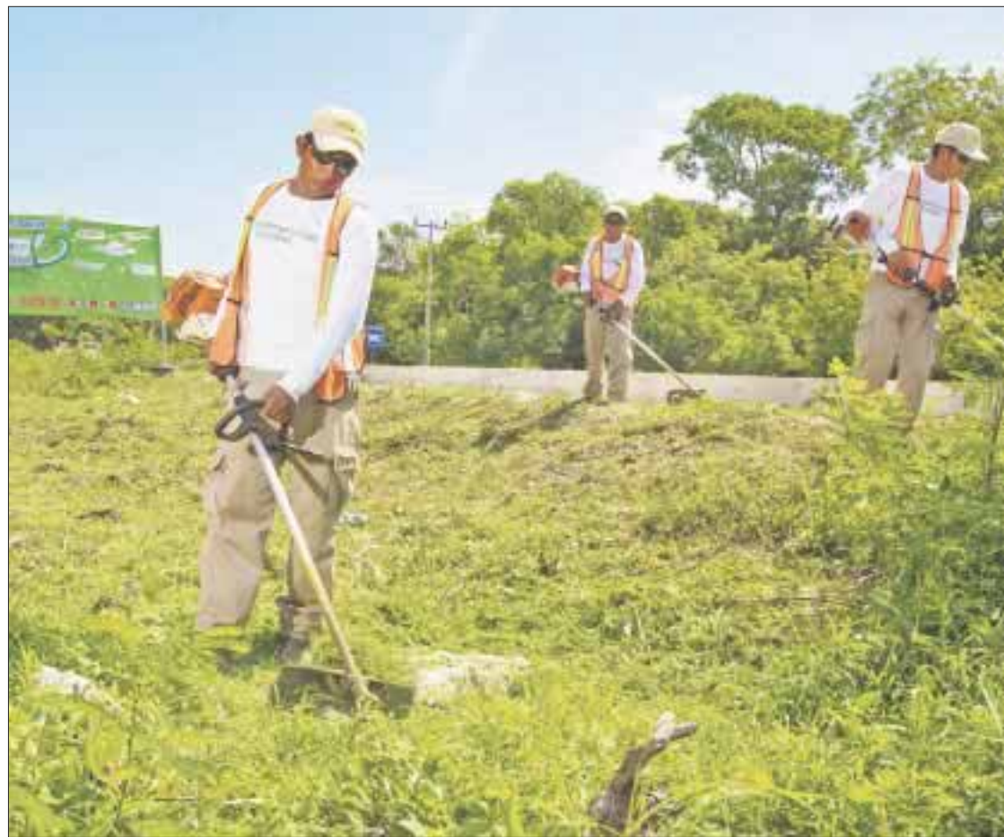
La iniciativa “Reforestando Nuestro Hogar” fue ideada para reforzar la imagen urbana y turística del camellón central de la carretera federal Cancún-Tulum.

Durante todo el 2017, la Asociación Nacional de Pequeños Comerciantes (ANPEC) ha sido insistente en su demanda a las autoridades para aumentar el salario mínimo en al menos a 8 dólares diarios, monto equivalente a la tarifa más baja por hora de trabajo en