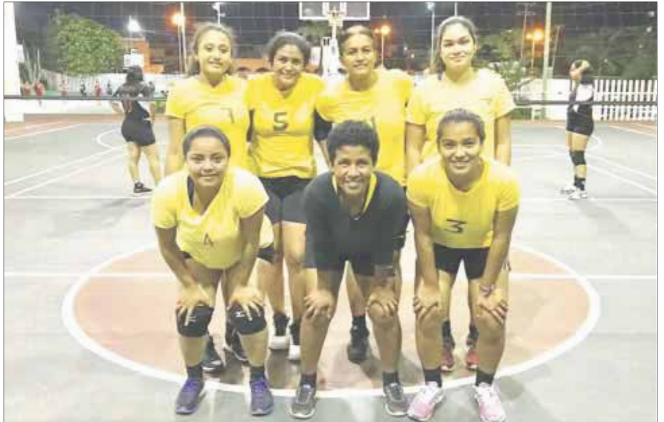
Cali salió con toda la actitud, al salir bien librada en sus dos encuentros disputados, sumando un par de victorias sobre Ladies y Niupi.