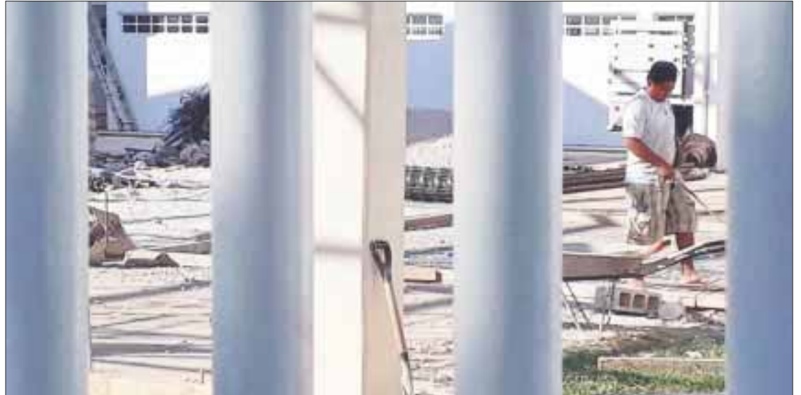
La llegada de mexicanos de distintas entidades es uno de los factores que abonan en favor de que se dispare la inseguridad entre la población, según la Fiscalía General de Justicia.

Según los organismos defensores de derechos humanos y los reportes diarios, más del 50 por ciento de los delitos de robo a casa habitación no son denunciados, pues para sustentar toda demanda se exigen facturas de los artículos que son robados o acreditar la procedencia de los mismos, más si se trata de joyas, dinero en efectivo, tanques de gas, computadoras, impresoras, celulares, tabletas electrónicas, pantallas, televisores, etc.