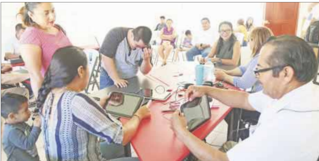
Se desbloquearon 400 tabletas, a través de la Megajornada, con sedes en Cancún, Chetumal y Felipe Carrillo Puerto.

Cancún.- Con 400 desbloques de tabletas se realizó a través de la Megajornada con sedes en Cancún, Chetumal y Felipe Carrillo Puerto, en donde los padres de familia se concentraron para el desbloqueo de su equipo que se realizará hasta el día de hoy 29 de noviembre.