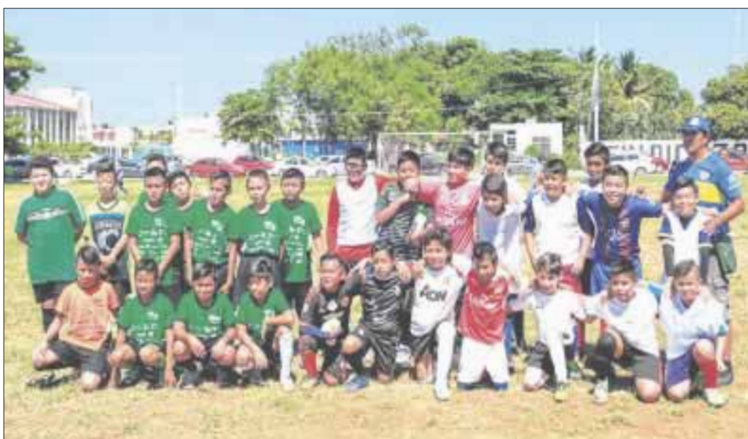
El equipo de la primaria 8 de Octubre se ha colocado en la cima de la clasificación general.

Chetumal.- La primaria 8 de Octubre con su equipo de fútbol se ha colocado en la cima de la clasificación general con 12 unidades, al ganar sus primeros cuatro partidos disputados en el torneo de Fútbol Escolar 2017-2018.