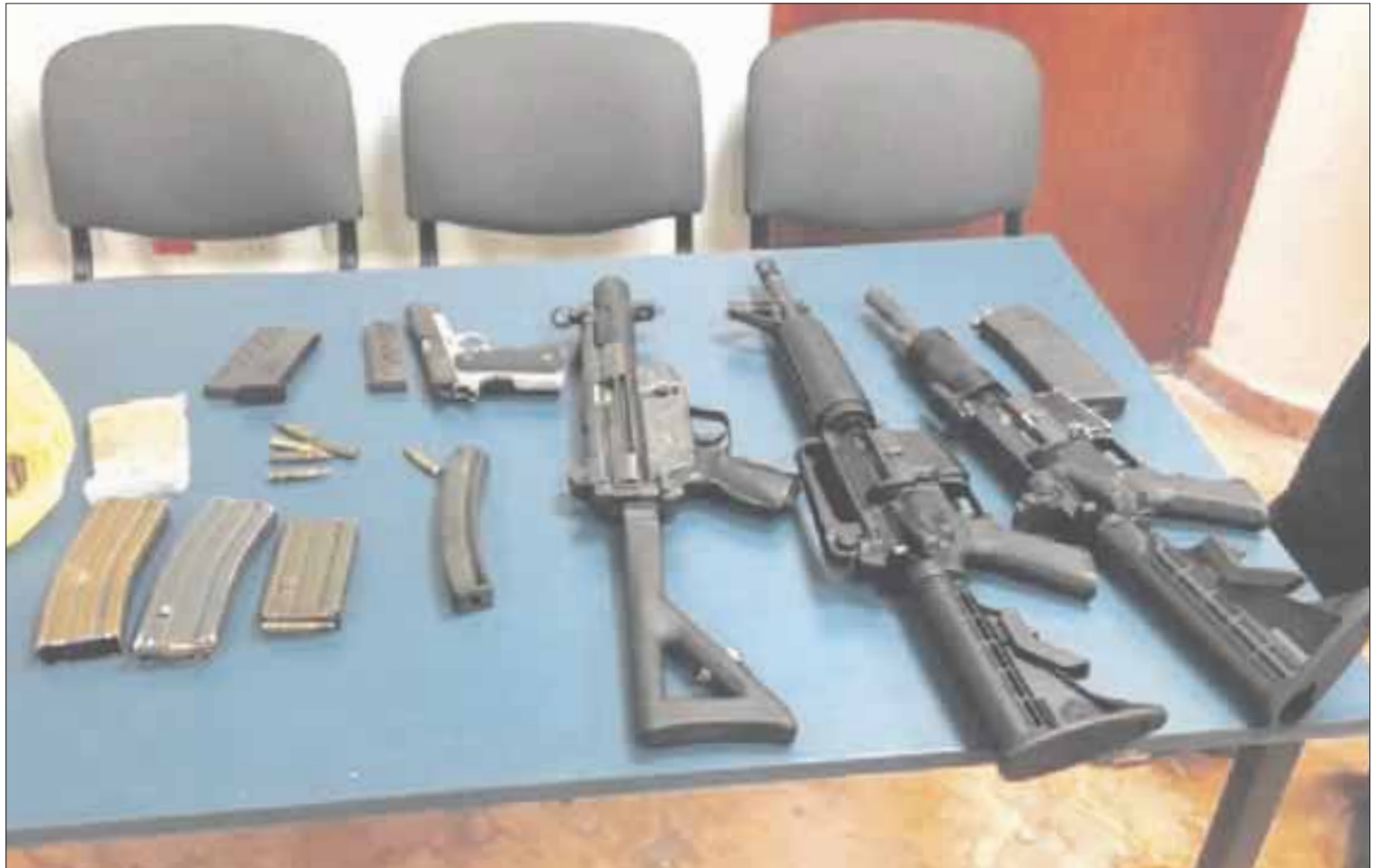
Los presuntos delincuentes podrían salir libres, ya que el delito de portación de armas de fuego no está tipificado como grave.