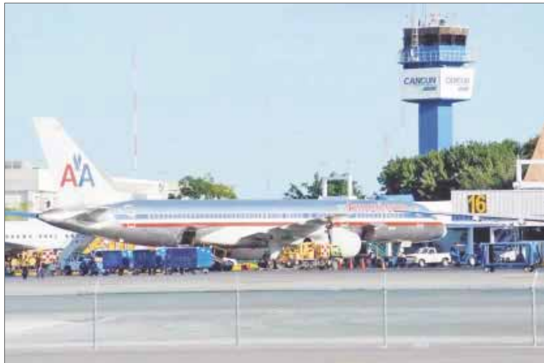
La falla en el servicio fue de las 21:03 hasta las 23:40 horas del sábado, pero hasta ayer se notificó oficialmente.

El sobrecalentamiento del murete que recibe la acometida de la Comisión Federal de Electricidad (CFE) dejó sin luz durante más de dos horas la recién estrenada terminal 4 del aeropuerto de Cancún, informó Aeropuertos del Sureste (ASUR).