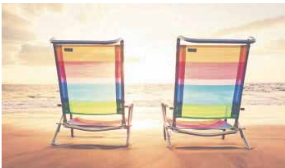
A los mexicanos les fascina viajar para relajarse.

También luchan por mantener un equilibrio entre su vida corporativa y personal. “Independientemente de tu trabajo, disfrutar de unas vacaciones es fundamental. Sabemos que tomarnos unos días para descubrir nuevos lugares y pasar tiempo con la familia y amigos