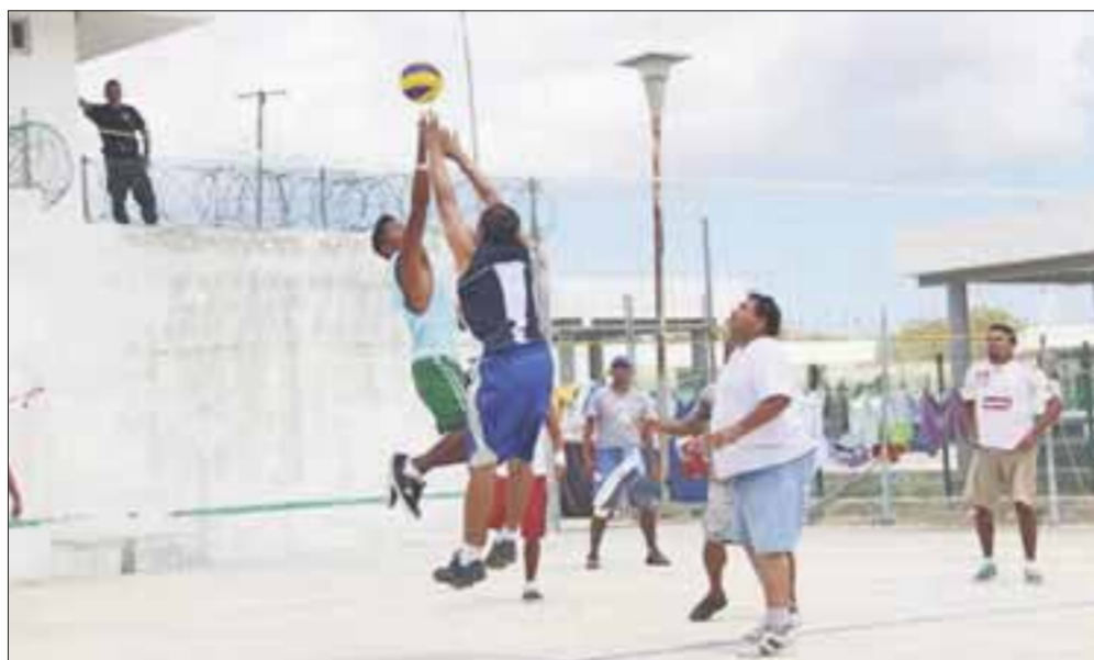
El proyecto de ampliación contempla la construcción de 50 celdas para 120 internos.

Según las estadísticas de la Fiscalía General de Justicia, estos casos se refieren solo a los que son denunciados, investigados y que tienen una carpeta de averiguación debidamente integrada, quedando pendientes las resoluciones