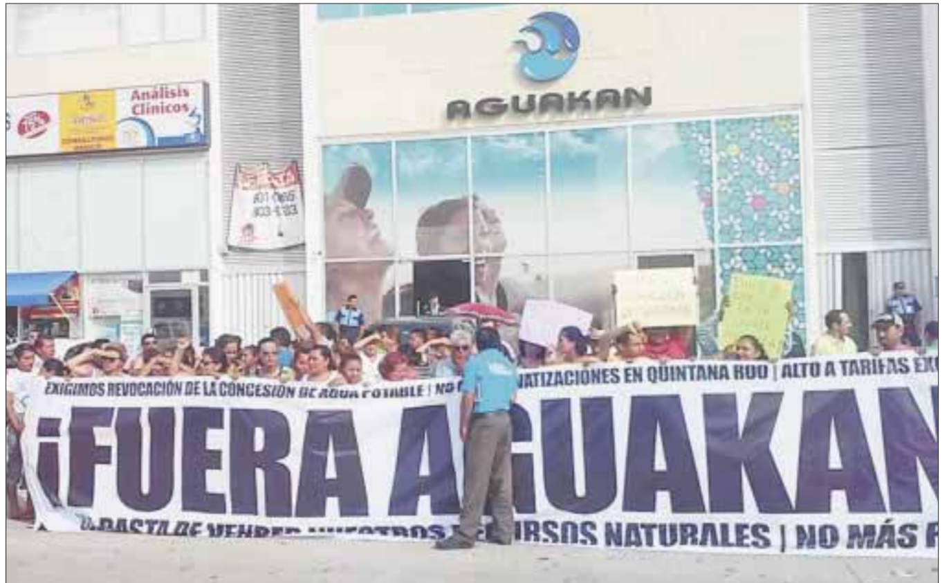
La empresa Aguakan enfrenta un alud de amparos por supuestos abusos en cobro del servicio.

Un 80 por ciento de los clientes de uso doméstico en los cuatro municipios (Isla Mujeres, Benito Juárez, Puerto Morelos y Solidaridad) concesionados a Aguakan pagan 143 pesos por recibir hasta 10 mil litros de agua (10 metros cúbicos), incluyendo el servicio de alcantarillado y saneamiento, de acuerdo a las tarifas estipuladas por la CAPA y que aplican por igual para todo el estado de Quintana Roo.