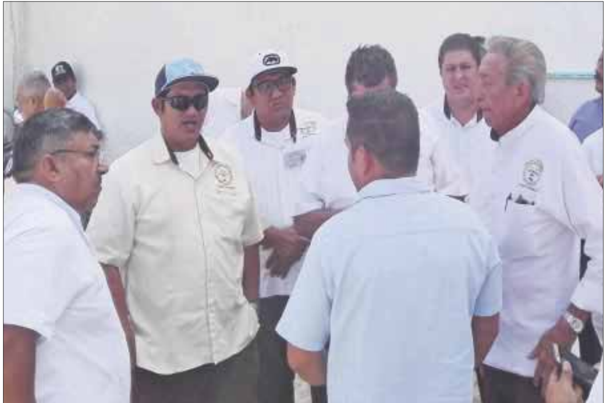
Los dirigentes de taxistas de 11 municipios del estado se reunieron con los diputados locales para realizar una serie de observaciones a la iniciativa de Ley de Movilidad de la entidad.

También solicitaron que en esta nueva Ley de Movilidad se incluya poner en orden a los hoteles que han contratado a los taxis y Vans de aeropuertos con placas federales para brindar el servicio de transporte de los turistas en carreteras y vialidades estatales, ya que eso también es considerado como pirataje.