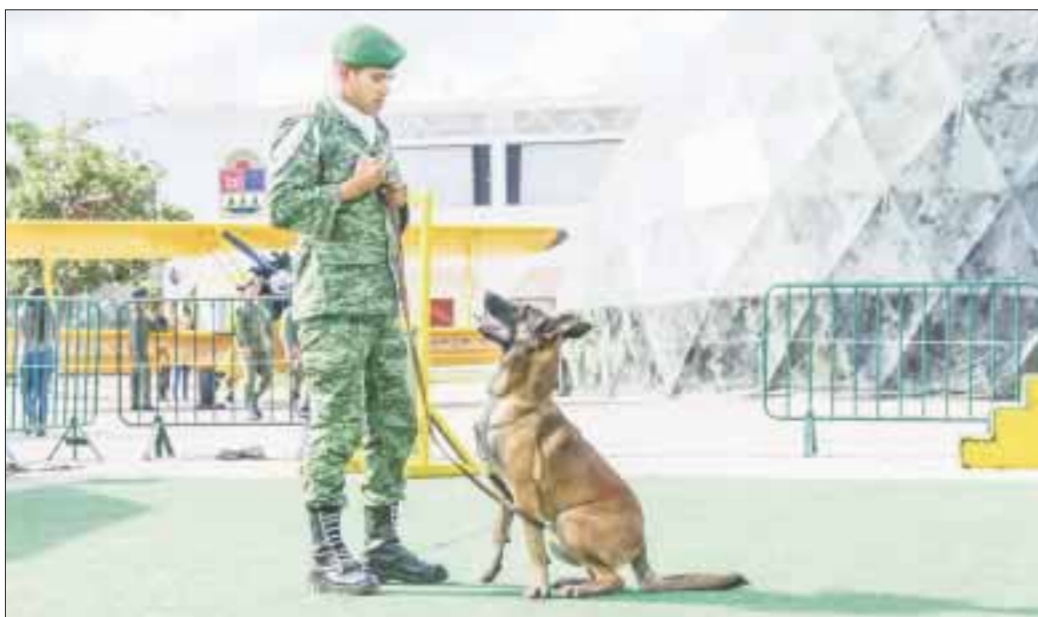
Los binomios caninos galardonados en el mundo, son parte de la muestra “Fuerzas Armadas... Pasión por Servir a México”, montada en Playa del Carmen.

Playa del Carmen.- La exhibición de los binomios caninos del Centro de Producción Canina del Ejército y la Fuerza Aérea Mexicana, es uno de los atractivos más visitados por los quintanarroenses que acuden a la exposición “Fuerzas Armadas... Pasión por Servir a México”, que se lleva a cabo en Playa del Carmen, hasta el 17 de diciembre.