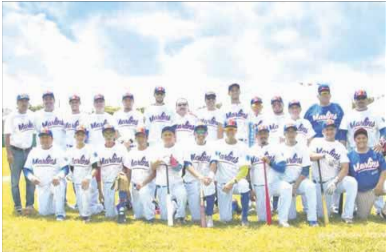
Marlins de Cozumel alcanzaron el liderato, tras conseguir la victoria frente a Ejidatarios de Bonfil y de paso lograr un triple empate en la cima de la tabla de posiciones.

En otros resultados, en duelo de benjamines, Guerreros de Playa del Carmen sumó su primer triunfo de la temporada al vencer 2-1 a Arrecifes de Puerto Morelos, propinándole su cuarta derrota. Rockies de Cancún sigue sin encontrar la brújula al caer en casa ante Cockteleros de Isla Mujeres 1-0, mientras tanto, Lázaro Cárdenas sumó su cuarta victoria al vencer a Pescadores de Isla Mujeres 6-0.