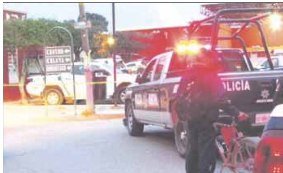
Sicarios balearon unidades de la policía municipal, de Protección Civil y de los bomberos de Apaseo el Grande, Guanajuato.

Casi de forma simultánea hubo detonaciones al aire en el municipio de Yuriria.