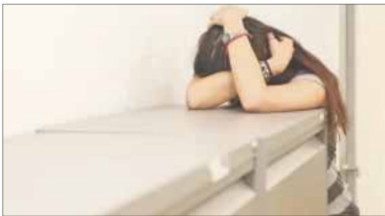
El ISSSTE otorga capacitación y medidas de prevención para detectar pacientes con problemas de salud mental y adicciones.

Cancún.- En Quintana Roo el ISSSTE otorga capacitación y medidas de prevención para detectar pacientes con problemas de salud mental y adicciones, por ser de los estados con más casos.