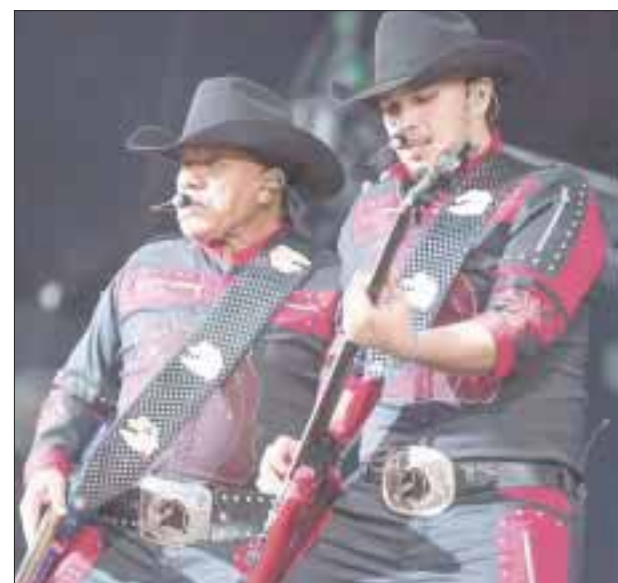
Bronco arrancó con “Que no quede huella”, “Oro”, “Nunca voy a olvidarte”, “Sergio el bailaror”, entre otros grandes éxitos.

des éxitos. Que si bien lo tuvo que hacer en medio de una sutil lluvia, no se mermó el ánimo y enloqueció a sus fans que pedían a gritos “Vuelta, vuelta” para deleitarse la pupila. Entre tanto Rivera incitó a la gente a donar a través de Love Army México, campaña a la que representa al igual que otros artistas que se presentaron en el concierto.