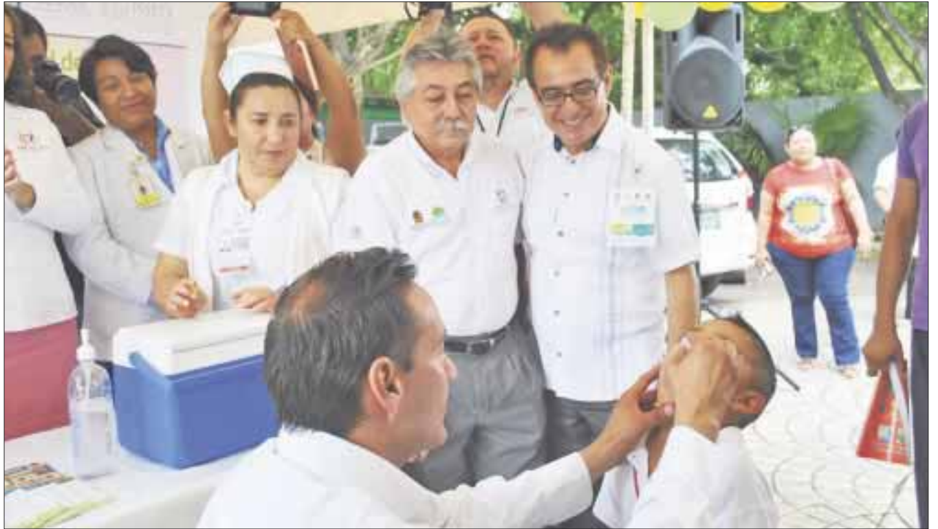
Inició la Tercera Semana Binacional de Salud, donde se aplicarán más de 66 mil vacunas.

Se distribuirán 6 mil 35 sobres de "Vida Suero Oral" para menores de cinco años, así como la distribución de 5 mil 786 dosis de vitamina "A", y 16 mil 149 tabletas de albendazol a la población de 2 a 14 años de edad, en tanto la mega dosis de vitamina "A" será para los menores de 6 meses a 4 años de edad.