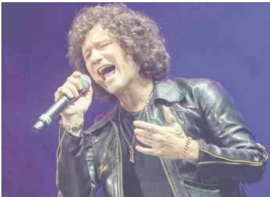
Enrique Bunbury arribó para decir que había preparado “algo único, especial e irrepetible” y así fue, pues se hizo acompañar de un mariachi para cantar “Aunque no sea conmigo”, “Infinito” y “El Hijo del pueblo”.

Aquí fue el turno para Sin Bandera, integrantes que invitaron a todos a no perder la fe y el romanticismo, cantando “En esta no”, “Que lloro” y otros de sus éxitos, con los que le bajaron un poco los decibeles a esta ya noche de música. Posteriormente Carla Morrison salió para poner en el escenario uno de los comentarios más intensos de la noche “Mucha fuerza México, hay que seguir ayudando porque nos falta mucho trabajo. Hay que votar por mejores gobernantes. México despertó y no se va a volver a dormir. Este concierto es una pisa para agarrar pila y