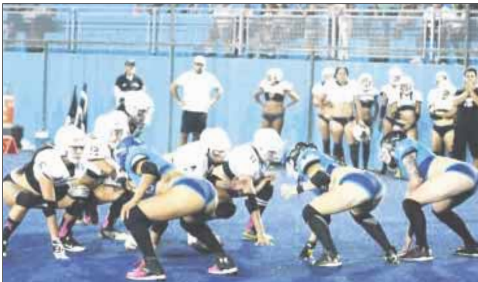
Nereidas de Cozumel y Barracudas de Playa del Carmen se enfrascaron en uno de los mejores duelos de la jornada dos de la liga Bikini Football.

Cozumel.- Las chicas de Nereidas de Cozumel no lograron aprovechar su condición de locales al caer por dos anotaciones ante unas Barracudas de Playa del Carmen, que llegaron a enfrentar este juego demasiado inspiradas, ya que van con todo por el campeonato que se les negó la temporada pasada, al caer en la final ante Bucaneras de Cancún.