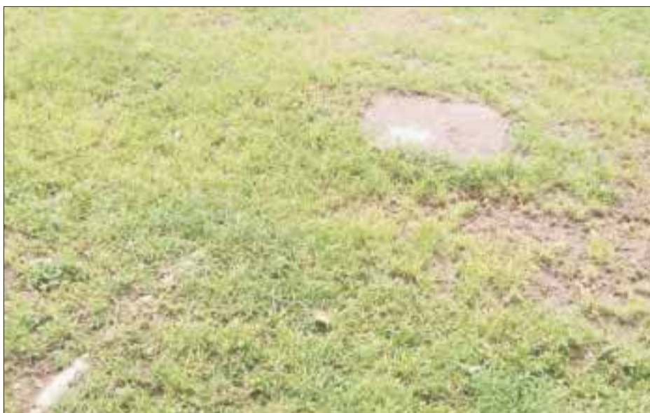
Los prefectos del plantel taparon con tierra el respiradero del drenaje, pero con las lluvias volvió a lanzar los olores fétidos.

Chetumal.- Lluvia de quejas de los alumnos que ocupan el edificio H del plantel del Colegio Nacional de Educación Profesional Técnica "Jesús Martínez Ross", por los olores fétidos que despiden del drenaje, problema que no ha sido solucionado.