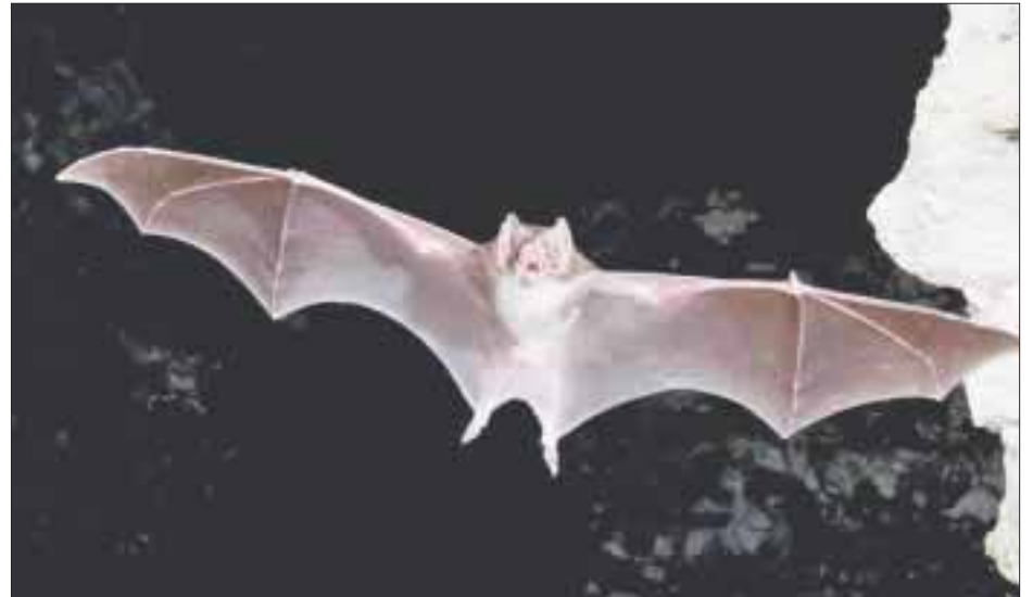
Los murciélagos fungen como indicadores y como proveedores de servicios ambientales en el control de plagas.

La Dirección General de Vida Silvestre colocará las redes que permitirán capturar a los murciélagos e iniciar su identificación y estudio, a pesar de ser un animal estigmatizado, considerado una plaga