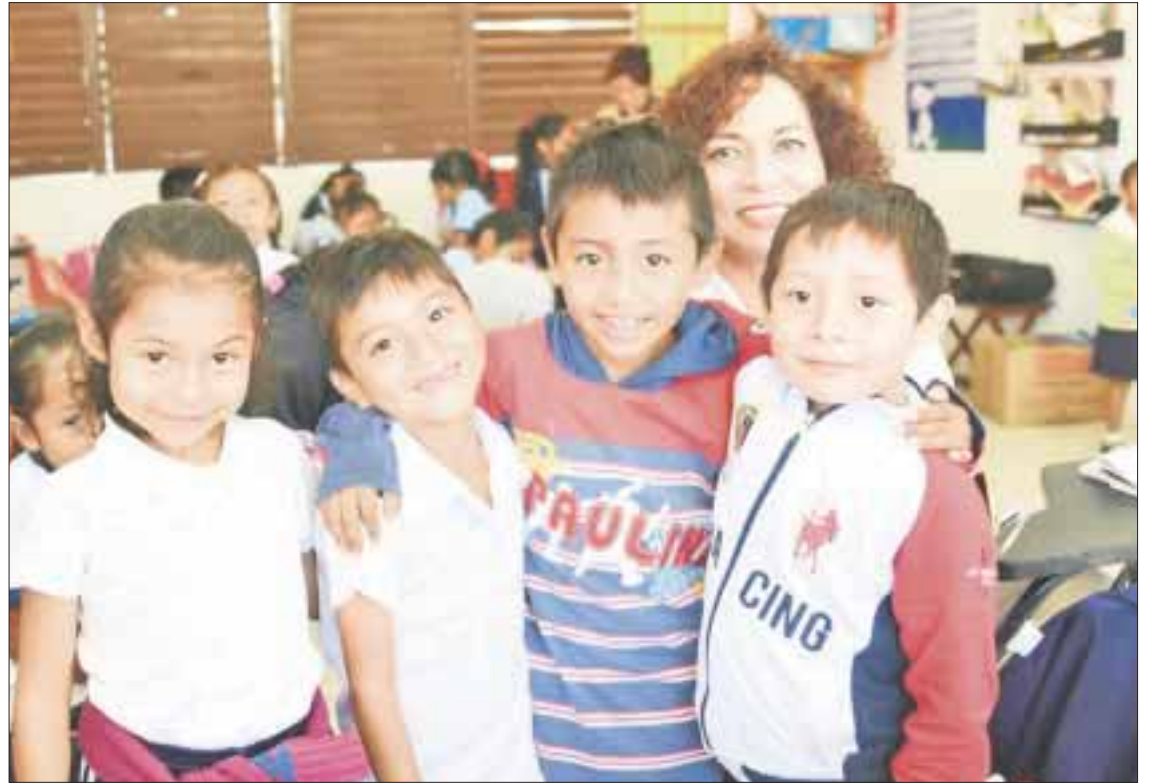
En Quintana Roo, el Programa de Escuelas de Tiempo Completo brinda servicio comunitario de alimentos en 127 planteles.