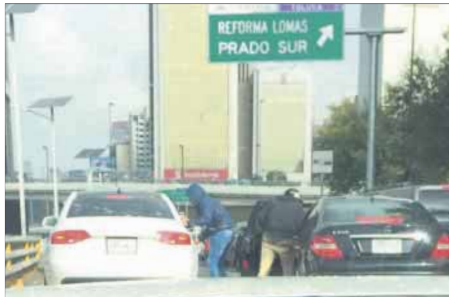
En 2016, el robo, en los cuatro rubros en que es medido, es el delito que prevaleció en el país, Según la Encuesta Nacional de Victimización y Percepción de la Seguridad (Envipe) del INEGI.

El espacio donde la población se siente más insegura son los cajeros automáticos en la vía pública, el banco, transporte público, la calle, la carretera, el mercado, el parque o centro recreativo, el centro comercial, el automóvil, la escuela, trabajo y en su casa.