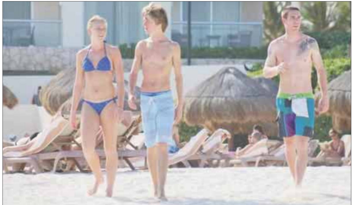
El estado se mantiene en la preferencia del turismo alemán, ante la promoción y la apertura de vuelos.

La cifra aumenta hasta tres mil o más por los que vienen de vacaciones, que se quedan estancias prolongadas de hasta varios meses o bien entran y salen de la entidad con relativa frecuencia.