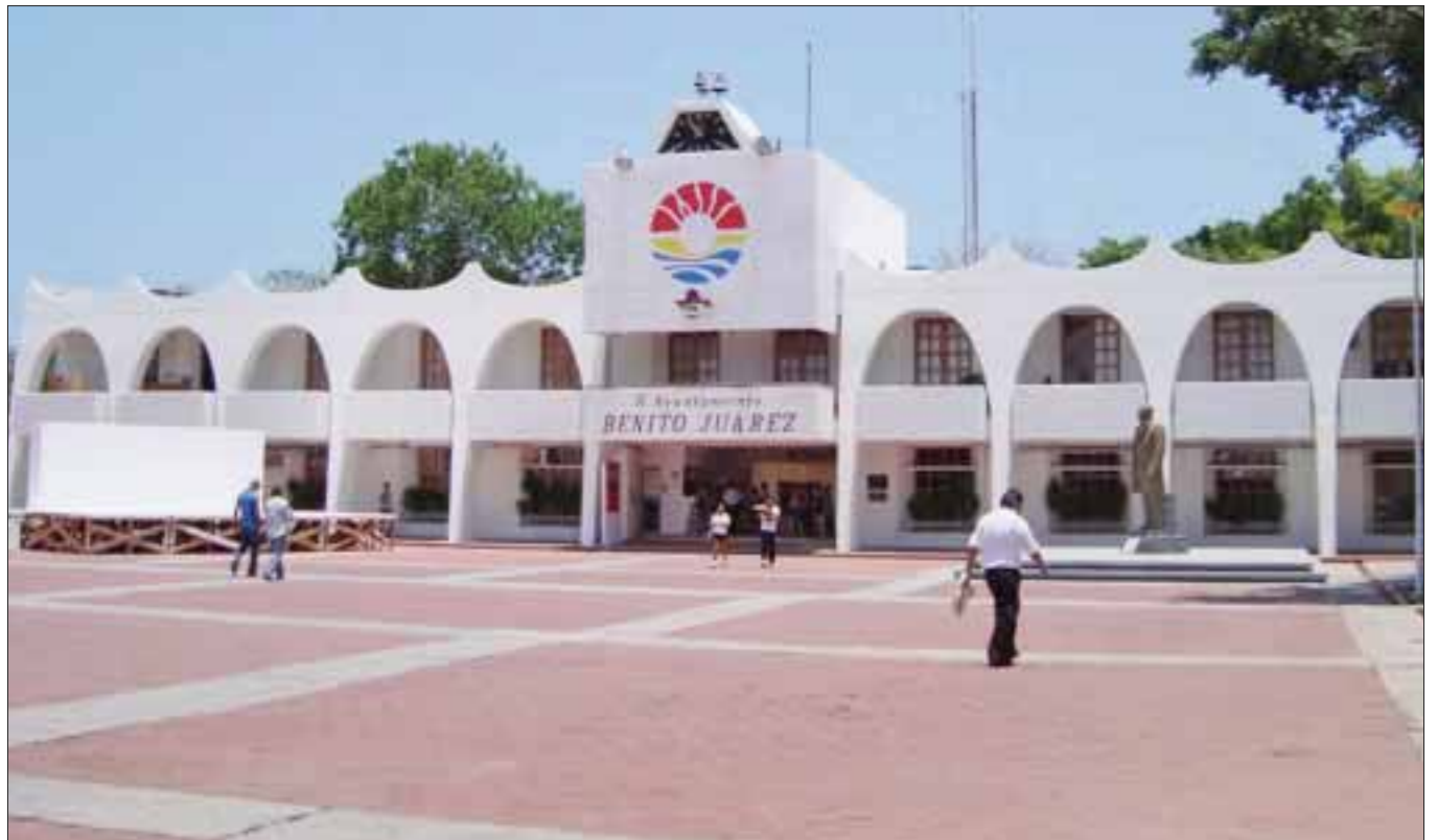
El Observatorio Ciudadano Municipal evaluará el trabajo de la administración local, con la creación de comisiones en donde se analizarán siete temas.

Uno de los objetivos de las comisiones, es dar seguimiento a las peticiones sobre el estado que guarda la administración para emitir una serie de recomendaciones derivadas del sentir de la población ya que tan sólo en Obras Públicas, se desconocen los detalles de la licitación de obras por 110 millones de pesos realizada por el ayuntamiento que forma parte de un paquete de recursos adicionales del orden de 620 millones de pesos.