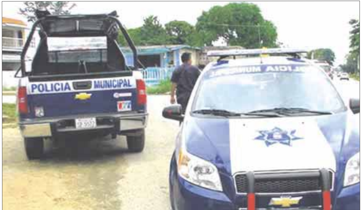
La Policía Ministerial cumplimentó una orden de aprehensión en Chetumal, sólo que lo hizo con exceso de fuerza, lo que propició que demandara a sus captores por tráfico de influencias.

Este asunto generó polémica, porque el promovente de la demanda es un funcionario cercano al fiscal del estado, Miguel Ángel Pech Cen, identificado como J.E.S.M., quien era pareja de la detenida. La menor fue trasladada a la Fiscalía General del Estado (FGE) para recibir terapia.