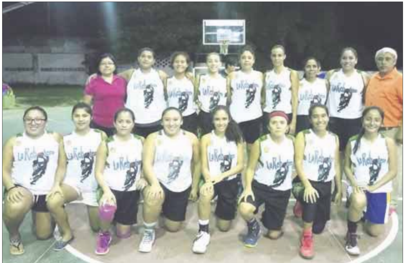
Las chicas de La Rebotera empataron sus números a 1-1, tras ganar al Fénix, de Chetumal, consiguiendo su primer triunfo de la temporada de la Liga Estatal de Basquetbol.