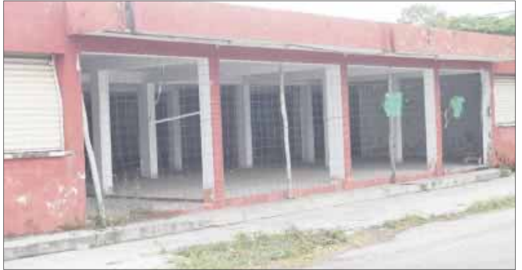
Este es el mercado, creado para que los productores locales llegaran a este sitio a ofrecer sus productos, sin intermediarios.

Actualmente, unas cuantas personas ofrecen alimentos y refrescos, ya que prefieren pagar el derecho de banqueta a los inspectores fiscales del municipio, para ofertar y vender sus productos.