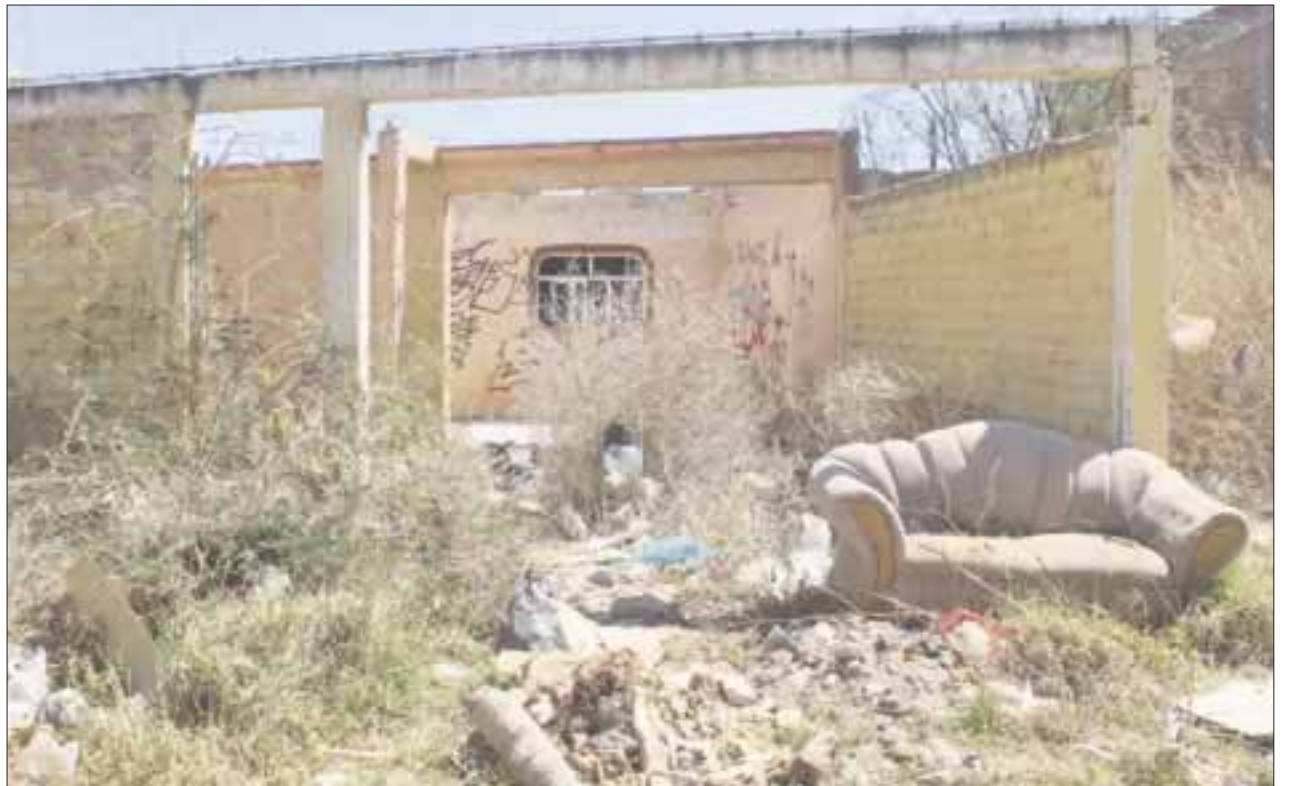
Los lotes baldíos representan un riesgo para la población, al ser punto de reunión de vándalos que acosan o roban sus pertenencias a la población.

Por dicha situación, pidieron a la autoridad ejercer su poder para exigir a los dueños que los limpien para que no representen un riesgo para la población que radica en las zonas aledañas.