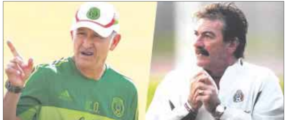
El ex entrenador de la Selección Nacional, Ricardo La Volpe, criticó el trabajo de Juan Carlos Osorio y manifestó que era una obligación lograr el boleto a Rusia 2018.

El argentino consideró que esta falta de seriedad inicia con los dirigentes, pasa por el banquillo y termina con los jugadores, sin dar nombres se refirió al delantero Javier Hernández