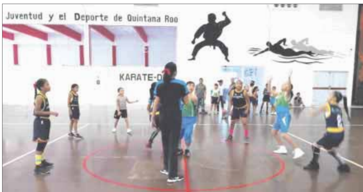
Los alumnos de primaria dejaron todo en la duela del Nohoch Sukun, en Chetumal.

Chetumal.- Las primarias Solidaridad, Aquiles Serdán y la Ford 109 se impusieron en el basquetbol femenino y varonil de la Liga Escolar de Othón P. Blanco, donde los padres de familia echaban las porras a sus hijos que dejaban todo en la duela del Nohoch Sukun.