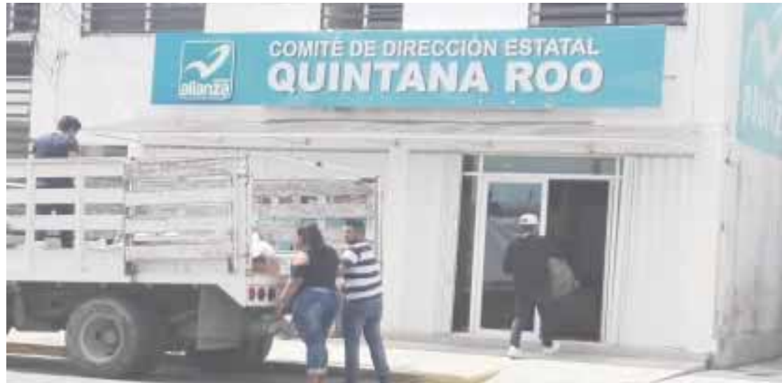
Llegaron las despensas a las oficinas del PANAL.

chetumaleños, pues el ex secretario en ese año inició en el cargo el 29 de septiembre, por lo que obtuvo 375 mil pesos, monto de por sí excesivo, pero lejos de lo que sus cuentas bancarias recibieron en realidad.