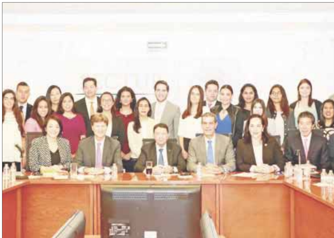
Enrique de la Madrid, secretario de Turismo, subrayó que el turismo en México registra uno de los crecimientos más importantes de su historia.

pueda tener un control completo y eficaz de la forma en que se conducen los asuntos públicos.