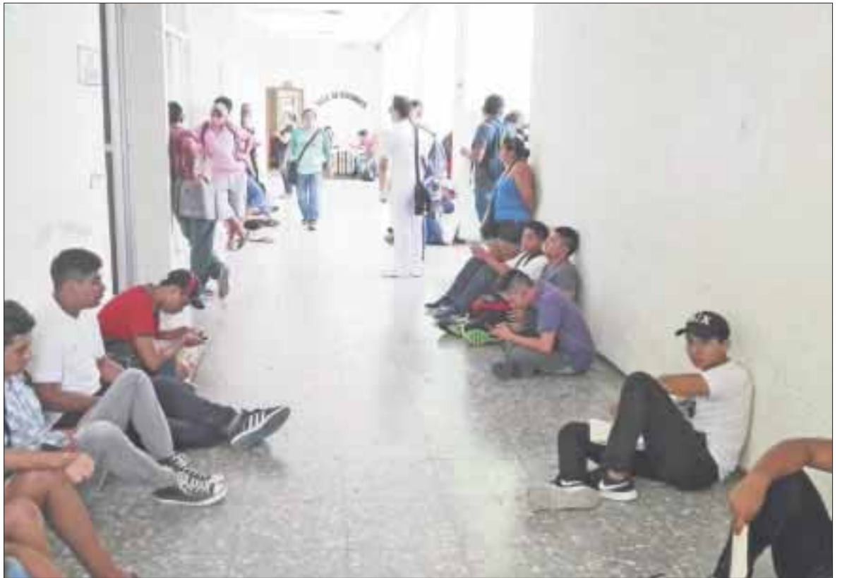
Por más que los jóvenes en edad de marchar se fueron a formar toda la noche, hubo 35 que no alcanzaron formatos y deberán considerarse remisos.