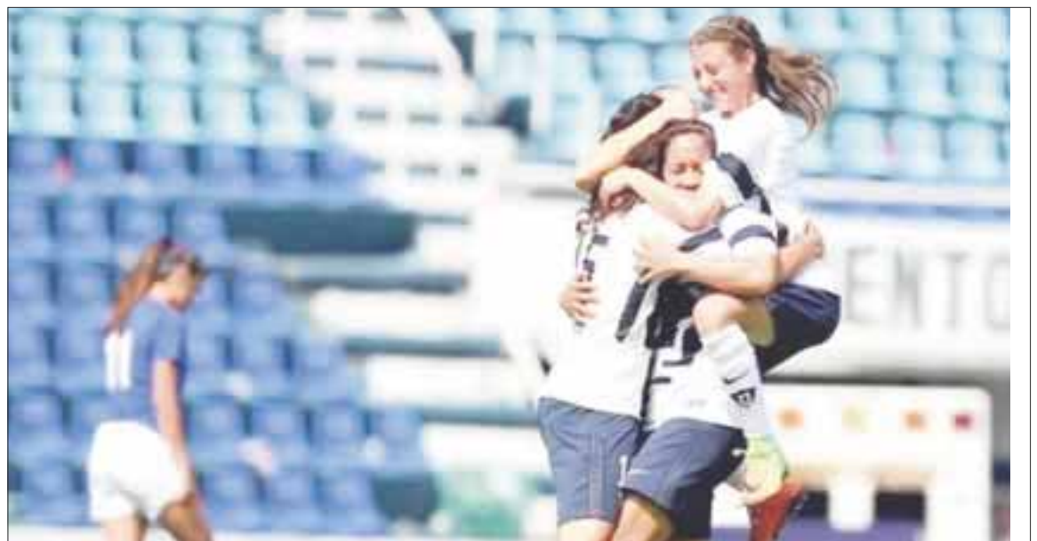
El equipo femenil de los Pumas le repitió la dosis a Cruz Azul, al ganarle en el estadio Azul 4 goles a 1.

La Máquina se estancó en el penúltimo lugar del sector con siete puntos y la mente puesta en el siguiente torneo dado que en este ya no tiene opciones de Liguilla.