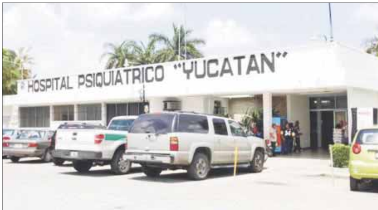
Cada año, el número de personas con problemas mentales se incrementa en Quintana Roo.

Cancún.- Cada año, el número de habitantes con problemas mentales se incrementa en Quintana Roo y a pesar de la demanda del servicio especializado se tiene un raquítico número de psiquiatras para atender a los pacientes, situación que obliga al traslado de los pacientes y casos al vecino estado de Yucatán.