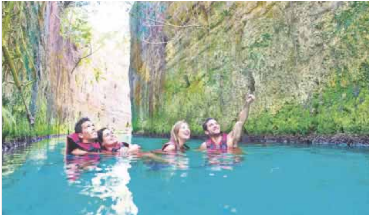
El ecoturismo en Quintana Roo mantendrá sus tarifas, al menos en las empresas que hicieron convenios por todo un año.

Si bien cada año los gastos de operación se “disparan” por múltiples factores, las agencias sobre llevan dicha situación con el alza del dólar que garantiza mayor presencia del turismo norteamericano a quien se le cobra en dólares.