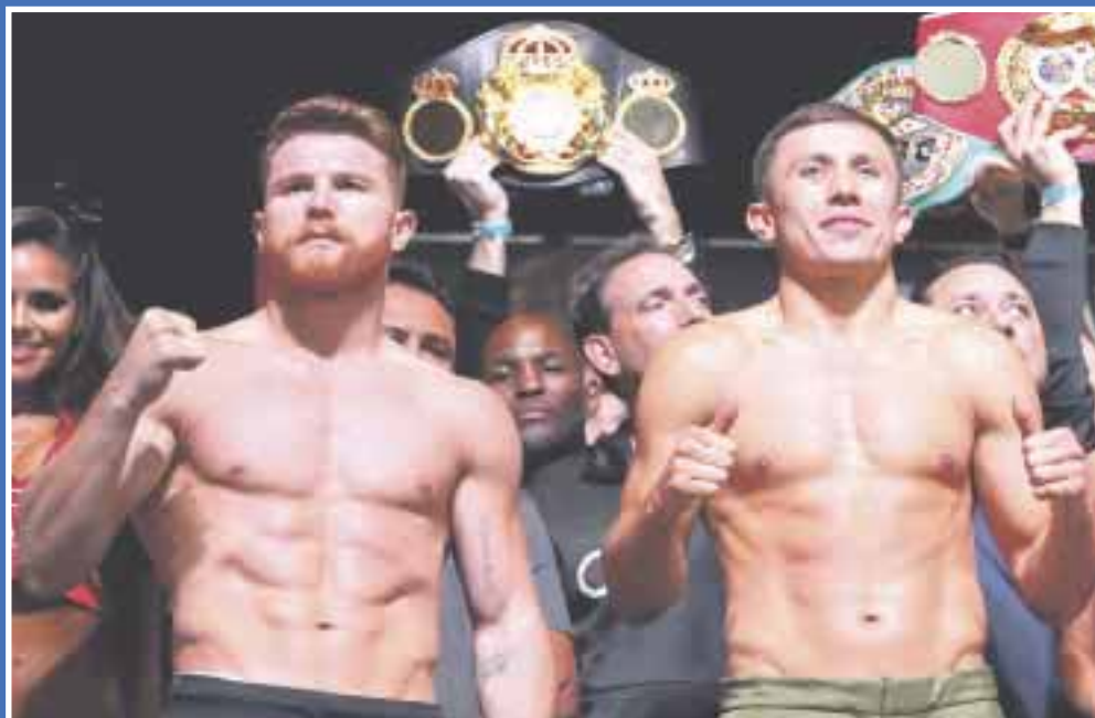
Saúl "Canelo" Álvarez le contestó el kazajo Gennady Golovkin, tras un video ue circuló en redes sociales: "sé que me extrañas y que no puedes vivir sin mí".

El kazajo publicó ayer un video en redes sociales llamado "No draw" (No empates), donde su entrenador, Abel Sánchez, come un jugoso corte de carne, referencia al clenbuterol que salió en los exámenes de antidopaje del Canelo , y por lo que el mexicano tuvo que bajarse del combate programado para el 5 de mayo.