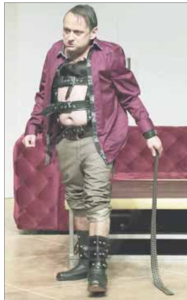
Lalo España, actualmente actúa en “La señora presidenta”, “El privilegio de mandar” y está por grabar la quinta temporada de la serie “Vecinos”.

Así con la quinta temporada de “Vecinos” en puerta, Lalo España continuará ofreciendo funciones con “La señora presidenta”, que además de presentarse de viernes a domingo en el Teatro Aldama, también comenzarán a girar por el interior de la República, visitando Guadalajara, Monterrey, Querétaro, Villahermosa, Mérida, San Luis, Tijuana y Morelia. A la par, el comediante pone un video nuevo cada semana en su canal de YouTube “Garnacha Channel” en el personaje de “Doña Mágina Francisca”, mientras que también es parte del elenco de la puesta en escena “El privilegio de mandar”, los jueves.