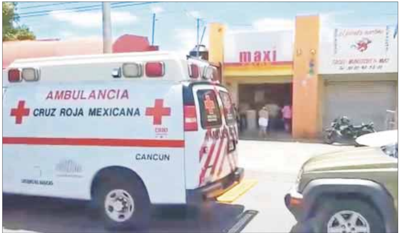
La Fiscalía General del Estado revisará las cámaras de seguridad que existen cerca del lugar donde se cometió el atraco, para saberr la identidad de los asaltantes.

Uno de ellos vestía playera azul, y uno más con canisa amarilla, ambos con pantalón de mezclilla. El tercero vestía de negro. Aunque los testigos no dieron más datos, coincidieron en que era un Tsuru con 4 personas a bordo.