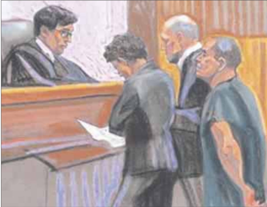
La defensa de Joaquín “El Chapo” Guzmán se ha quejado continuamente de la dureza del régimen de aislamiento en el que se encuentra éste desde que fue extraditado.