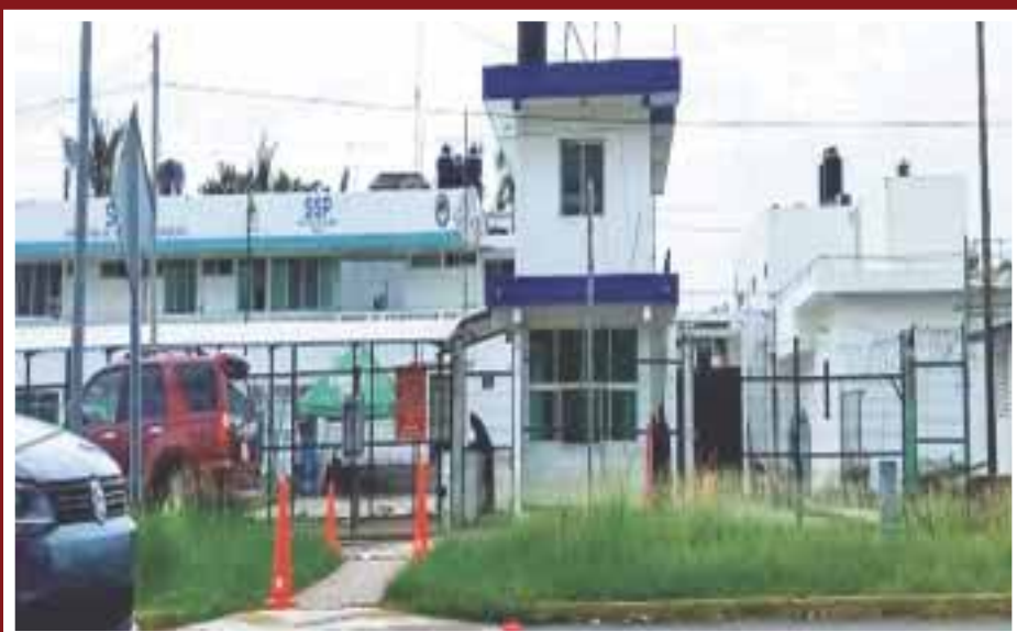
Los internos de la galera 6 organizaron una fiesta de cumpleaños con “chirrinchi” de por medio y al calor de la bebida pelearon.

Chetumal.- Nuevamente, ante un pésimo sistema penitenciario y la falta de vigilancia por parte de las autoridades, sumado al autogobierno que ahí prevalece, propiciaron una riña entre dos internos, que terminó con un herido, que fue trasladado al Hospital General para su atención médica.