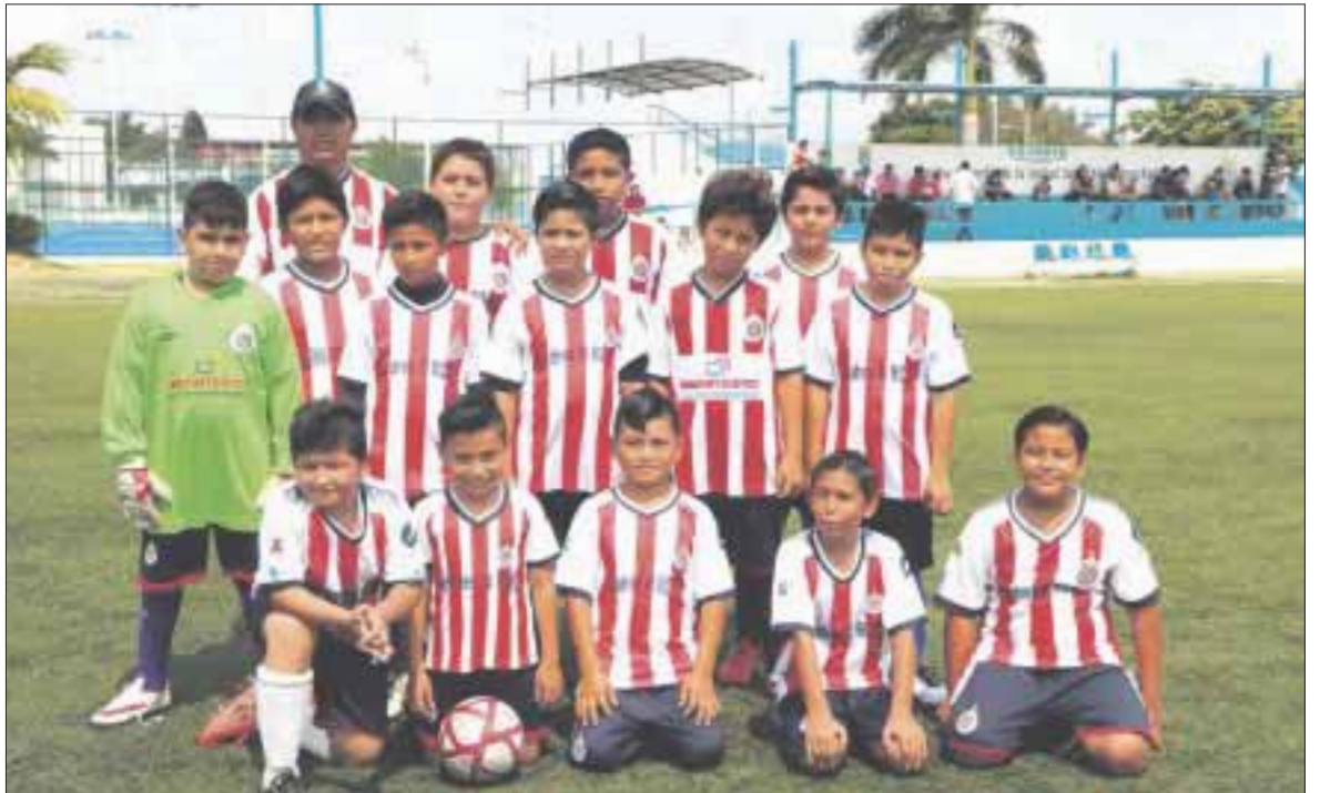
En el segundo tiempo los dos equipos escuadras tuvieron oportunidades de anotar, pero la buena intervención de los porteros hicieron la diferencia.

En otros encuentros, la primaria Subteniente López le ganó por goliza a la escuadra de Solidaridad por marcador de 11 goles a 3, mientras que la Álvaro Obregón y la Othón P. Blanco empataron a un gol y en penales se impusieron los othonenses por 3 goles a 1, ganando el punto extra.