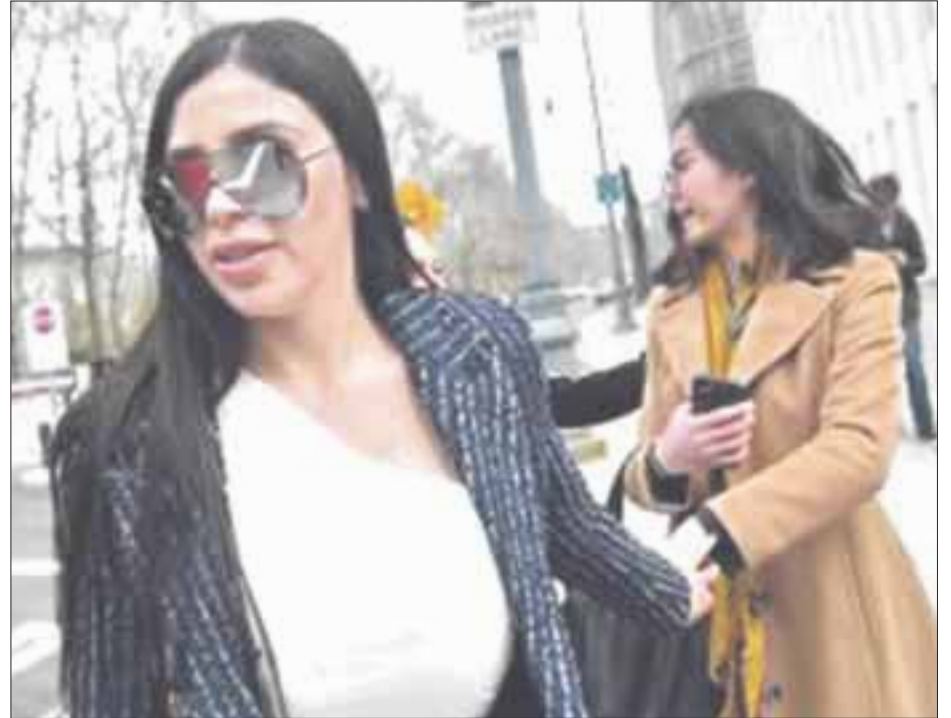
Emma Coronel dijo que lleva 15 meses sin hablar con su esposo, Joaquín Guzmán Loera, y que está preocupada por su salud.