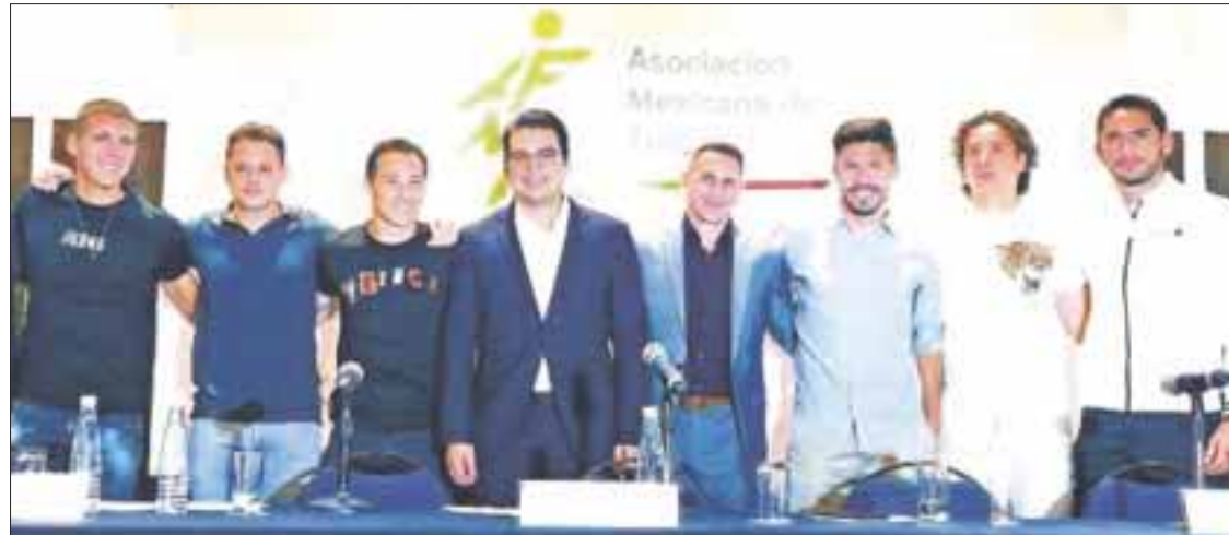
La Asociación Mexicana de Futbolistas Profesionales carece de atribuciones para hacer una huelga en la Liga MX.

do tácito entre los dueños de los equipos para impedir la libre contratación de jugar, pese a que estos últimos hayan terminado su relación contractual.