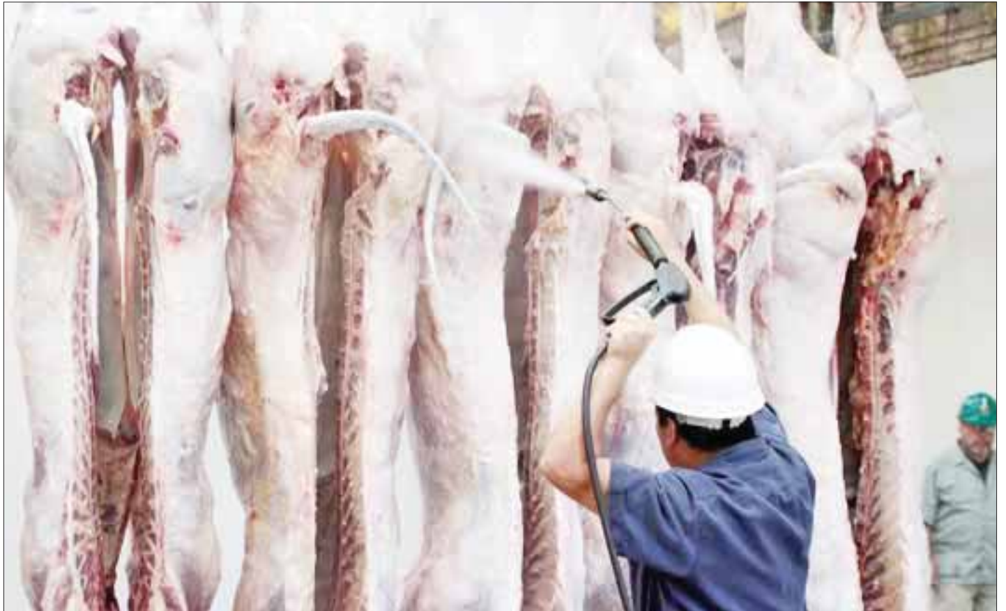
Sanciones económicas de hasta mil salarios mínimos se aplicaron a 27 carnicerías.

Se recomendó a la población no poner en riesgo su salud y verificar que la carne que compren se venda en negocios establecidos con sus permisos vigentes, para garantizar que comerán un producto libre de bacterias y salmonella.