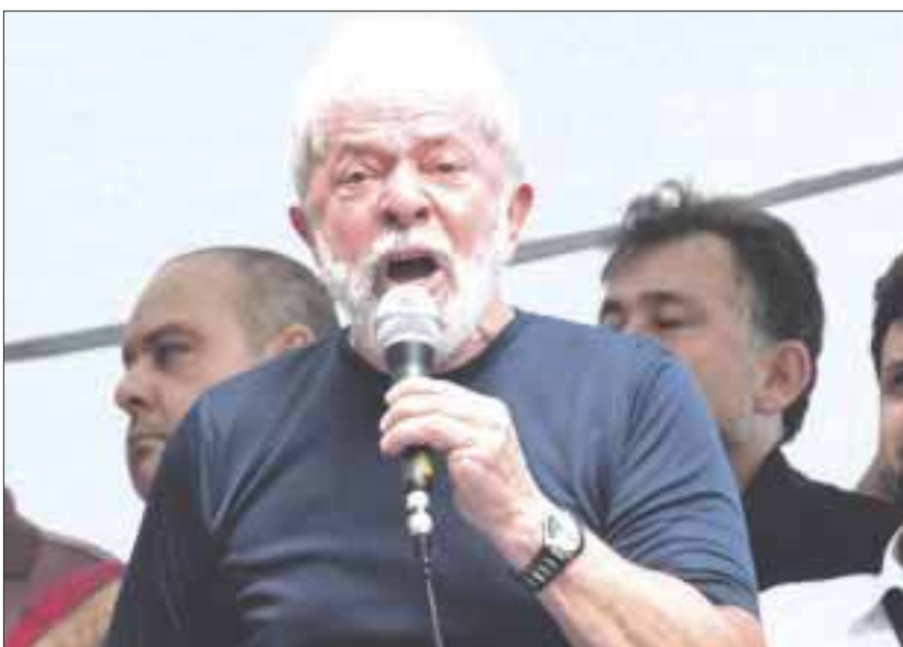
Un tribunal de Porto Alegre rechazó el último recurso en segunda instancia, presentado por los abogados del ex presidente Luiz Inácio Lula da Silva.

Un tribunal de Porto Alegre negó el último recurso en segunda instancia presentado por los abogados del ex presidente de Brasil, Luiz Inácio Lula da Silva, condenado a 12 años y un mes de cárcel por corrupción pasiva y lavado de dinero.