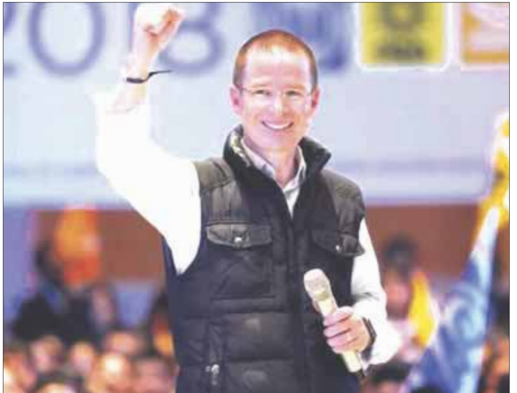
El panista Ricardo Anaya Cortés afirma que él es el único que puede vencer a Andrés Manuel López Obrador en las preferencias electorales.

En rueda de prensa en Tijuana, Baja California, recordó que en todos los procesos electorales, en la etapa final se da el voto útil, es decir, la gente identifica quién es el que tiene posibilidades reales de ganar