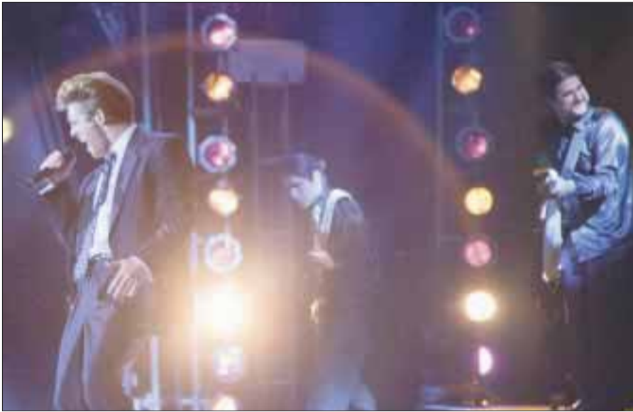
Diego Boneta reconoce que le costó mucho trabajo dejar el papel de Luis Miguel, por la intensidad en que lo abordó.