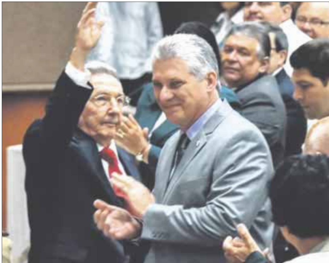
Miguel Díaz-Canel fue propuesto para ocupar la presidencia de Cuba en sustitución de Raúl Castro.

Según la agenda difundida por los medios oficiales de la isla, será este jueves cuando se darán a conocer los resultados definitivos de la votación.