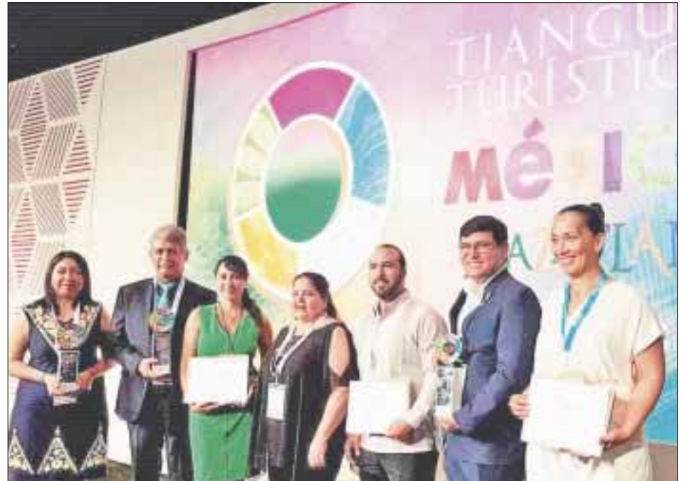
La Secretaría de Turismo federal y el Consejo de Promoción Turística de México entregan reconocimientos durante el Tianguis Turístico México 2018.

Quintana Roo mantiene su liderazgo entre 80 proyectos de gobiernos estatales, asociaciones civiles e iniciativa privada, que participaron en 12 categorías, de acuerdo con datos de la Secretaría de Turismo federal