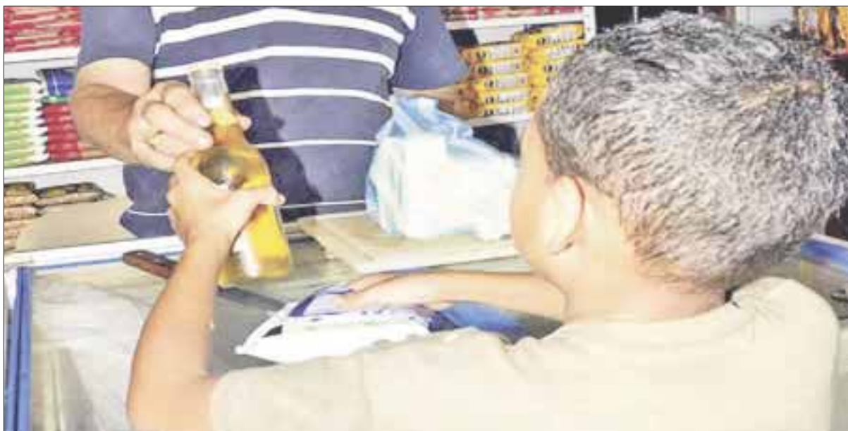
Amaga Cofepris con quitar la patente a 3 mil negocios de venta y consumo de alcohol expedida por Sefiplan.

Cancún.- Amaga Cofepris con quitar la concesión a 3 mil negocios de venta y consumo de alcohol expedidas por Sefiplan, de caer en prácticas dolosas en agravio de menores, al facilitarles la compra de sus productos o venderlos adulterados en los diferentes municipios del estado.