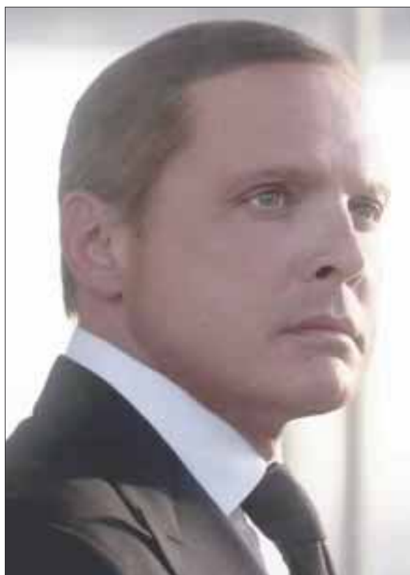
“Luis Miguel: El hombre detrás del sol”, llega a Netflix este domingo a las 22:00 horas.