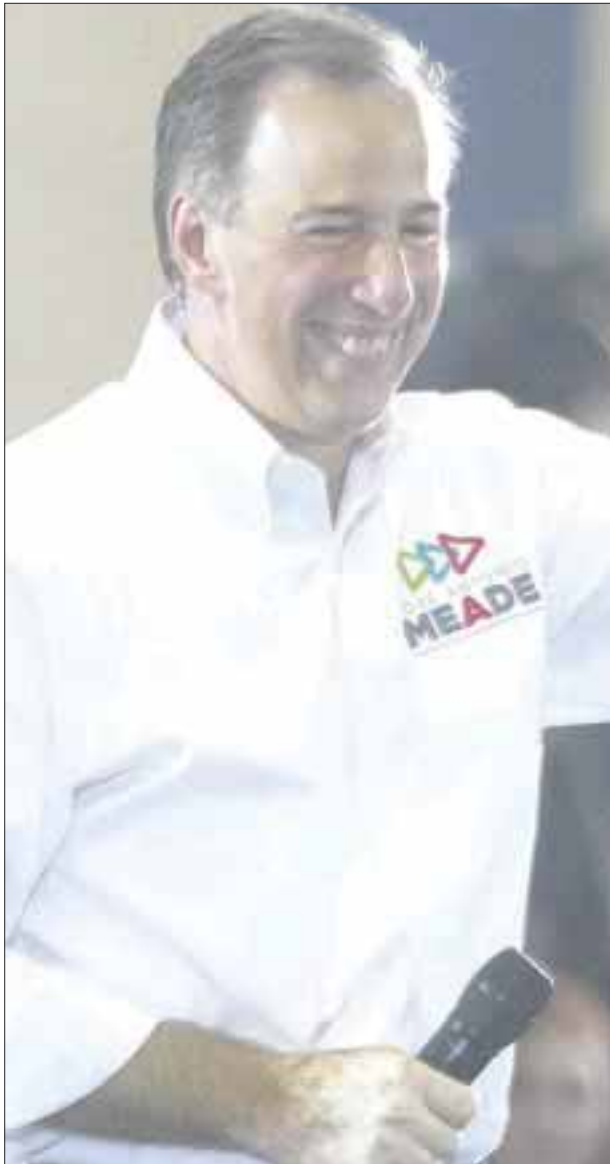
José Antonio Meade , de gira por Monterrey, afirmó que quien fomenta la violencia no merece gobernar el país.