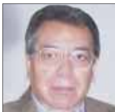
Por Roberto Vizcaino

Edgar Romo , presidente de la Cámara de Diputados, advirtió ayer que los ciudadanos ya no creen en sus autoridades y políticos, y menos aún en los diputados, quienes hoy presentan los niveles más bajos de credibilidad y de confianza dentro de la sociedad.