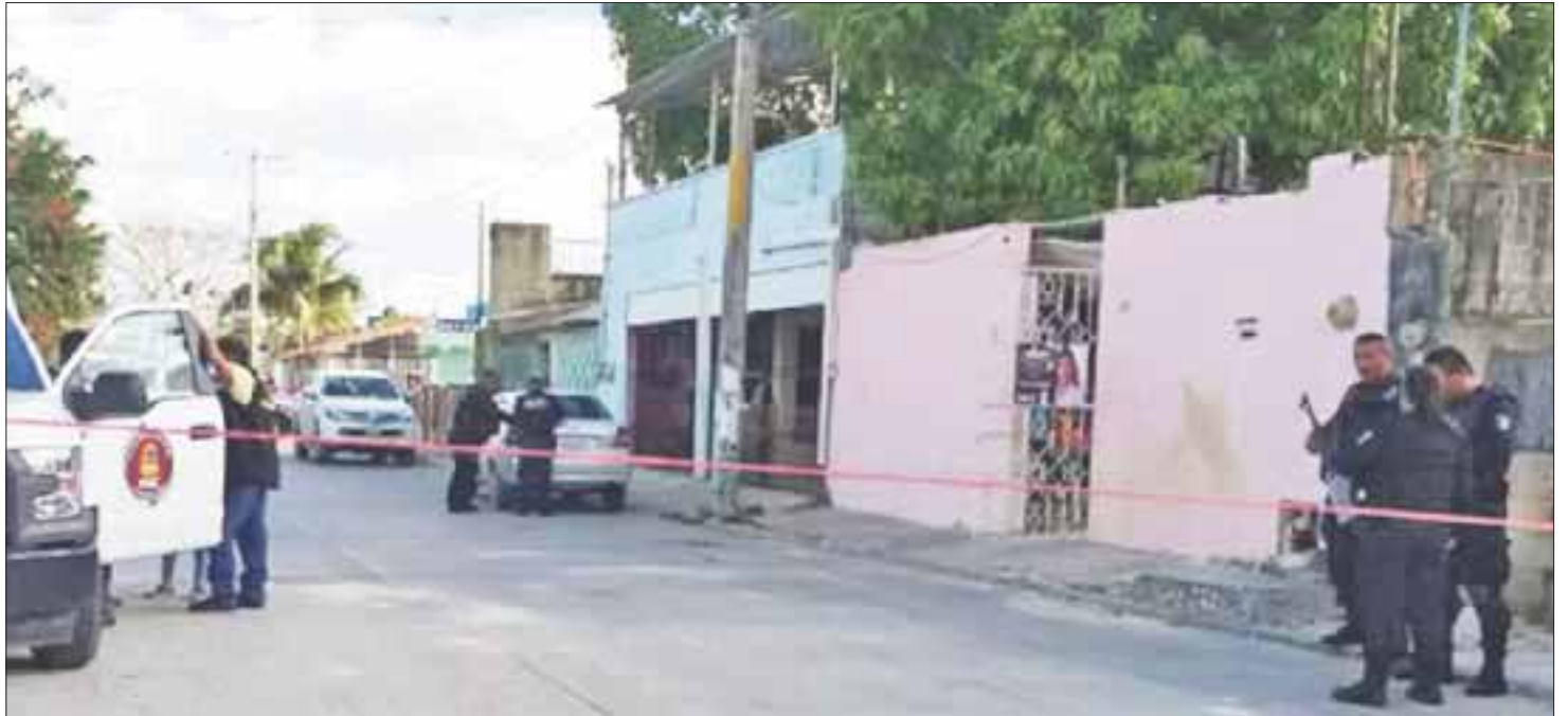
El segundo hecho sangriento tuvo lugar dentro de una vivienda, que fue acordonada, y hasta donde llegaron agentes ministeriales para hacer las investigaciones.

Más tarde, se reportó otro ataque a balazos en la Región 96, en la calle 131, donde 2 personas perdieron la vida, un hombre y una mujer.