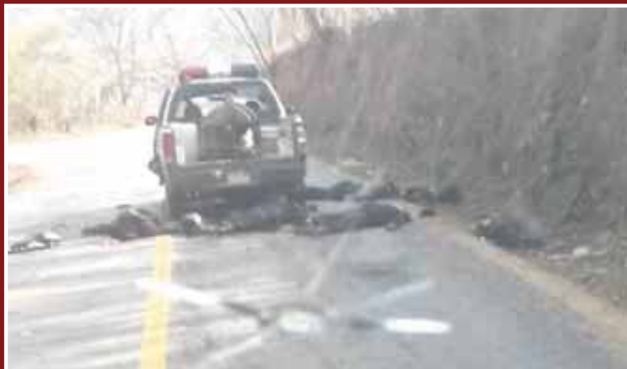
En la emboscada registrada en Las Mesillas fallecieron seis agentes de la Policía Estatal.

Los seis policías estatales que fueron emboscados la noche del martes en la comunidad de Tondonicua, en Petatlán, municipio que colinda con Zihuatanejo, Costa Grande de Guerrero, recibieron un tiro de gracia después de ser atacados.