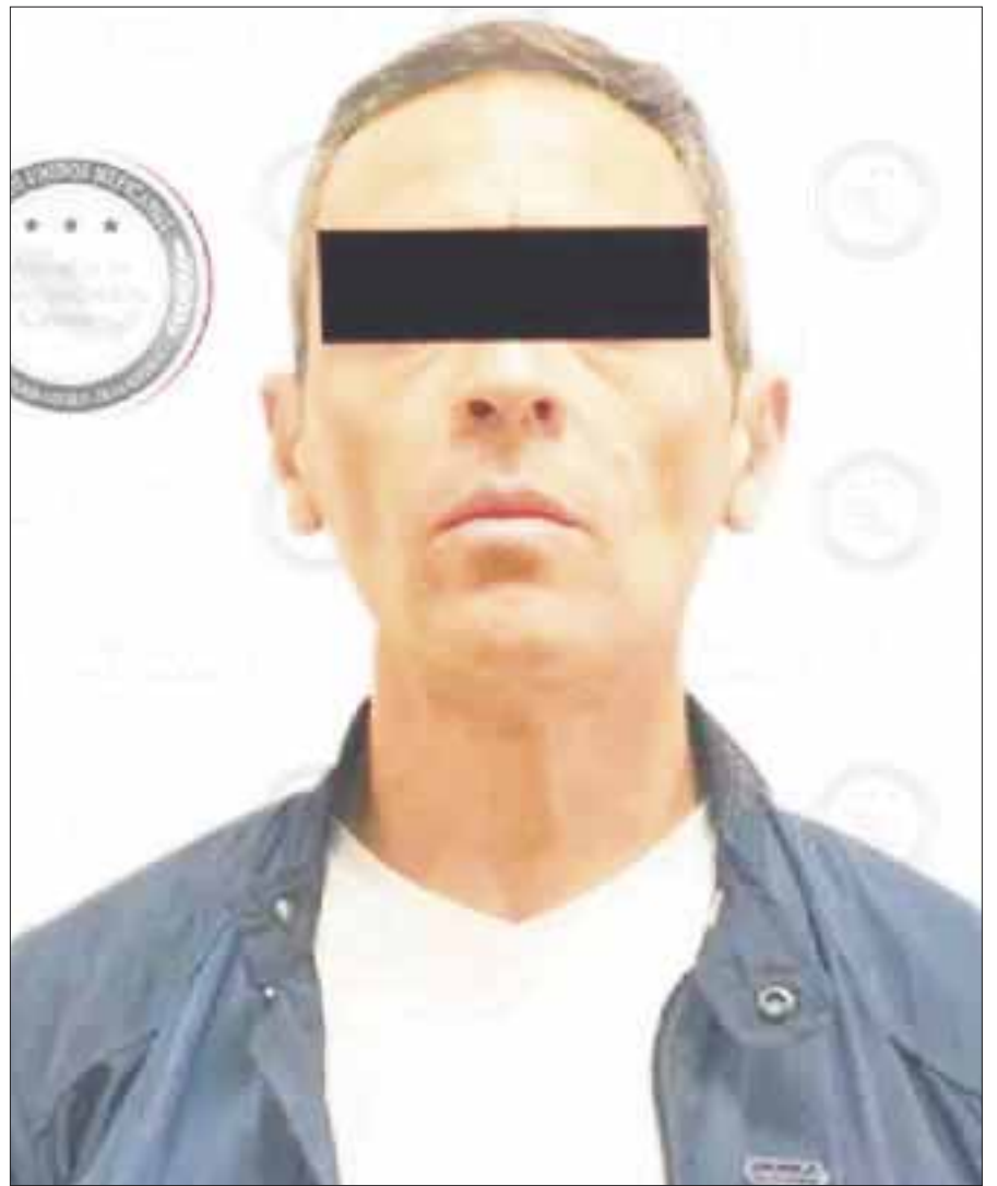
Erick "N" cuenta con una orden de aprehensión librada por el Juzgado Décimo Segundo Penal de la Ciudad de México.

En un comunicado conjunto de la Secretaría de Gobernación, del INM y de la Procuraduría General de la República, se informó que la persona contaba con una notificación roja, solicitada por la AIC a la Oficina Central de Interpol, con sede en Lyon, Francia, por lo que era buscado en más de 190 países.