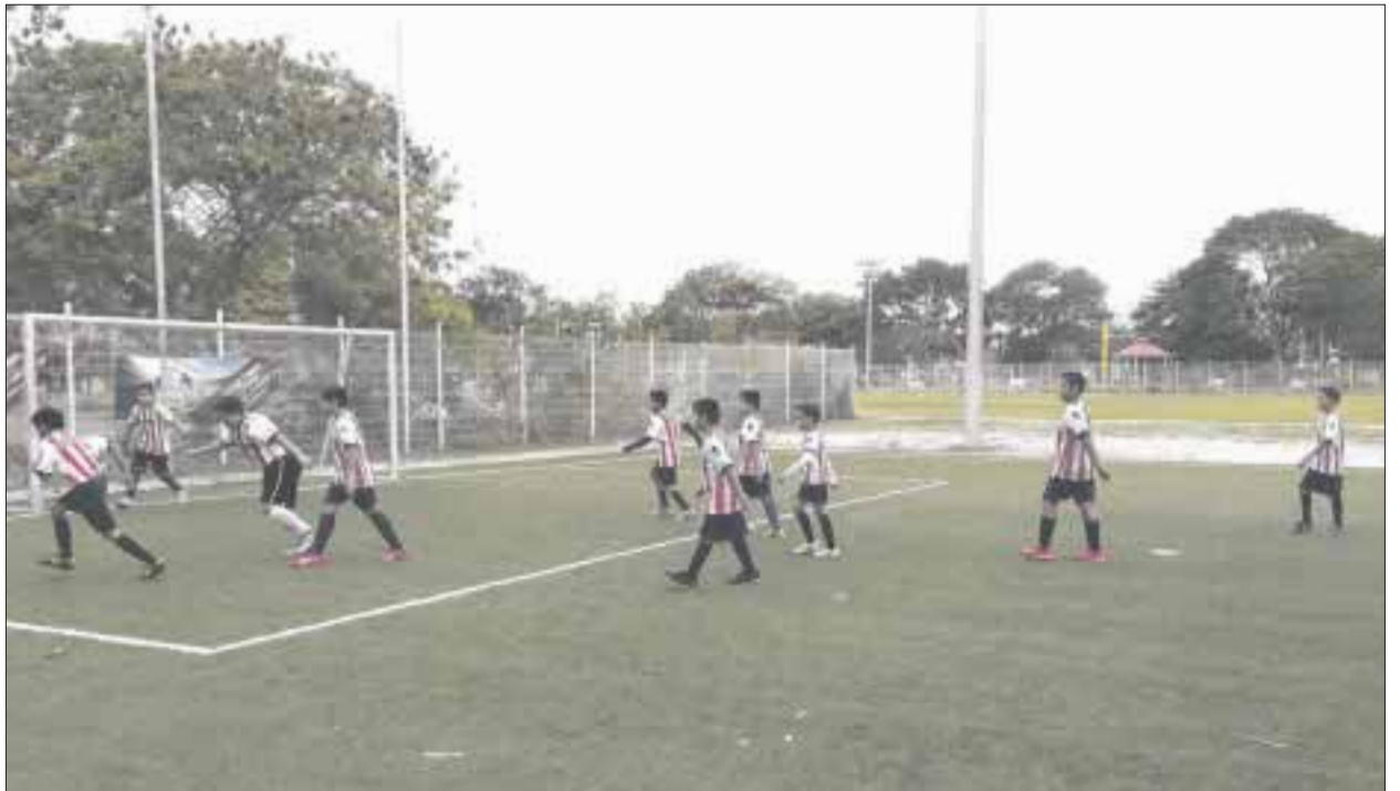
Representantes de las primarias Centenario de la Revolución Mexicana y Andrés Quintana Roo Chivas 2, lograron sus tres primeros puntos en el grupo 5.

Posteriormente, la primaria Aarón Merino se enfrentará a las niñas de la Fidel Velázquez, y para cerrar la jornada femenil a las 11:00 horas las chicas de la Cetina Salazar jugarán contra las de la Konhunlich TM.