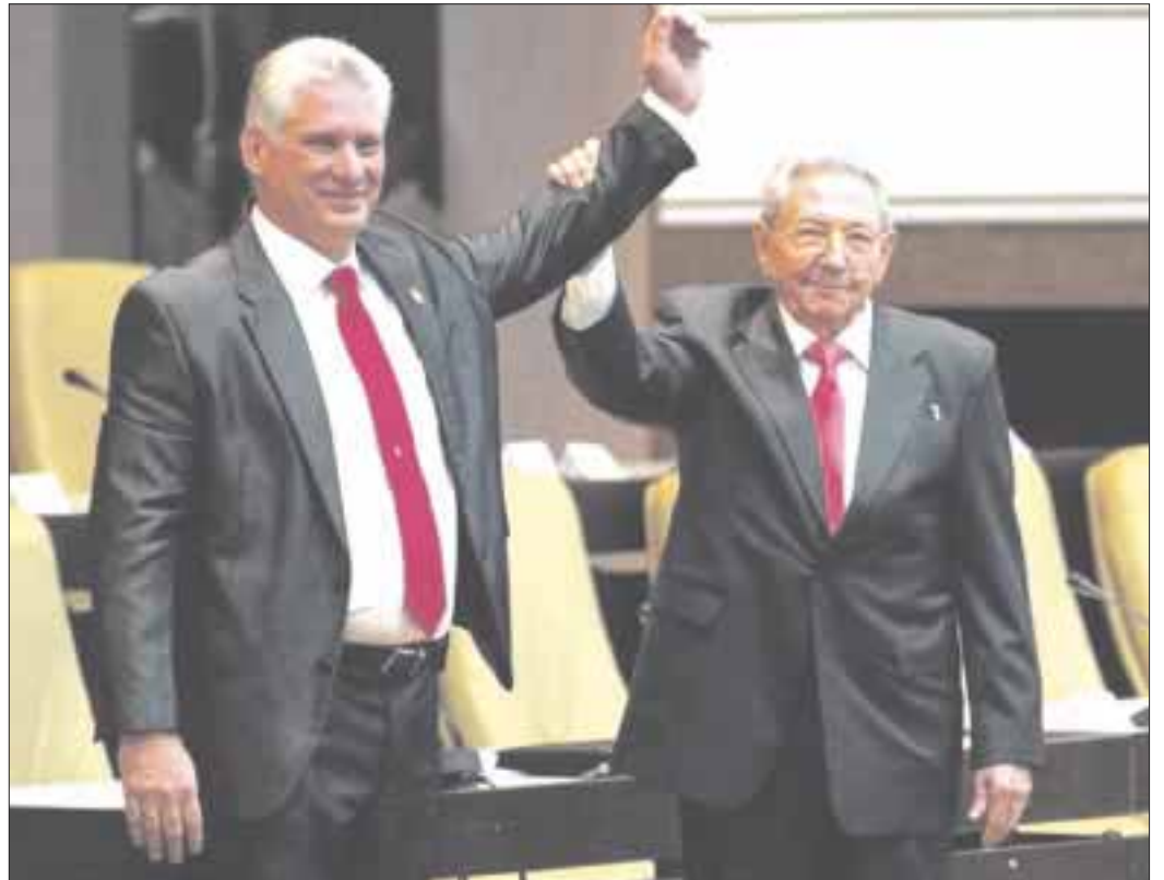
Miguel Díaz-Canel sustituyó ayer jueves a Raúl Castro, quien dejó el cargo tras dos mandatos de cinco años.

Pidió el apoyo de todos los que ocupan responsabilidades de dirección a diferentes niveles en la nación, pero sobre todo del pueblo. “Tendremos que ejercer una dirección cada vez más colectiva. Fortaleciendo la participación del pueblo”.