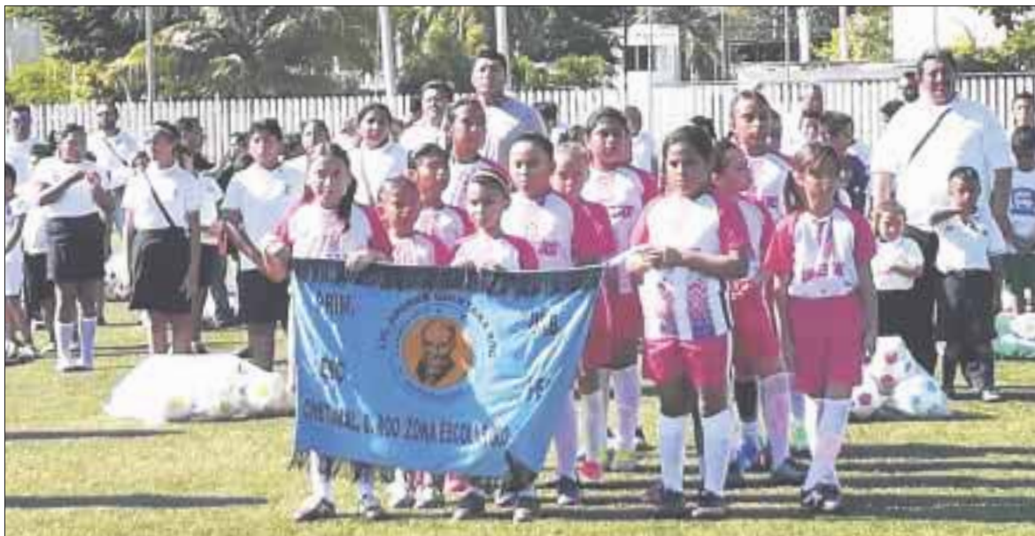
Por fin, este fin de semana habrá acciones del futbol femenino escolar en el empastado del Parque del Bosque.

Chetumal.- Después de dos meses de retraso, por fin este fin de semana habrá acciones en el empastado del Parque del Bosque del futbol femenino escolar en su décima sexta edición, donde debutará el equipo de la primaria Andrés Quintana Roo.