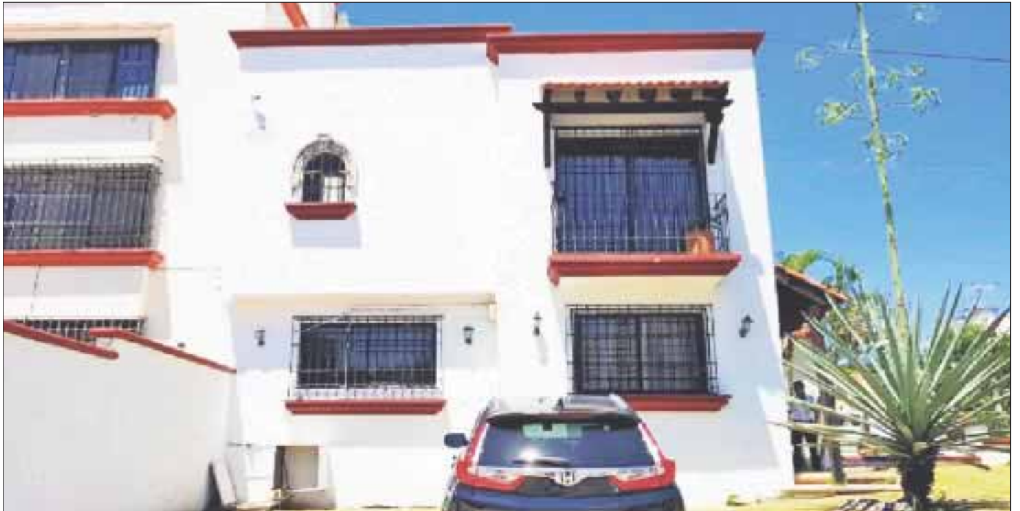
Las dos notarías fueron baleadas en la madrugada del jueves. Encontraron seis orificios producidos por proyectil de arma de fuego en las puertas del edificio de una de ellas.

La segunda notaría es la número 54, en la Supermanzanas 15, por la avenida Alcancheh, donde testigos vieron a un hombre en una motocicleta disparar en contra del cristal en repetidas ocasiones.