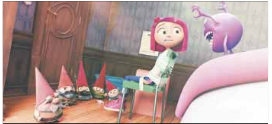
Chloe regresa en una nueva aventura, junto a los gnomos de su jardín.

Cuenta la historia de un grupo de nigromantes que habitan en algún lejano y pequeño pueblo, con vidas aparentemente cotidianas. Diferentes hechos van entrelazando sus caminos y sus más grandes secretos son expuestos ante los ojos del espectador, volviéndolo testigo de los inexplicables dotes de que el universo puede otorgar a tan enigmáticos seres. Tomando figuras emblemáticas como María Sabina, curandera y chamán de la etnia indígena mazateca del estado de Oaxaca, en México. Una mujer que trascendió gracias a sus conocimientos tradicionales sobre el uso ceremonial y curativo de los hongos. Elementos como éste, logran darle un giro a esta propuesta cultural, compartiendo parte de esta experiencia entre los asistentes.