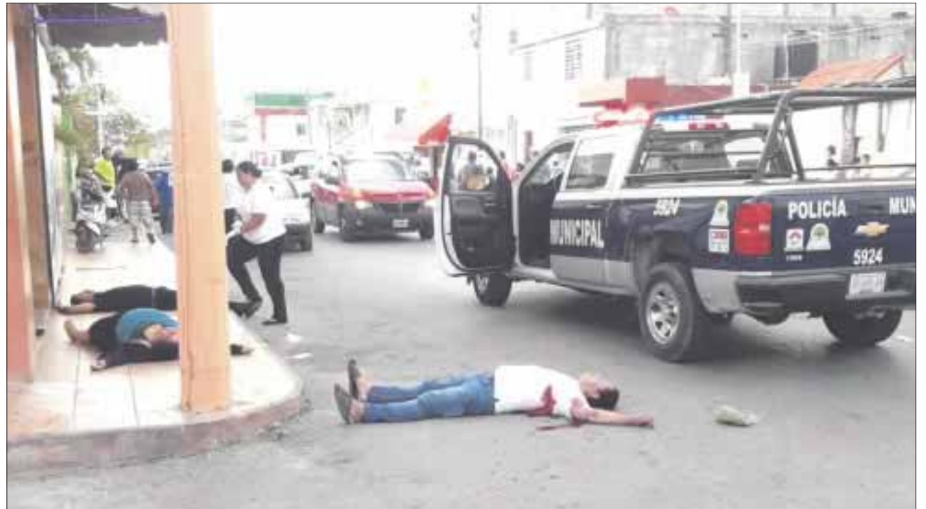
Los cuerpos de dos hombres y una mujer quedaron tendidos en la banqueta y en el arroyo vehicular.

Hasta el momento ya son 137 ejecutados en esta entidad quintanarroense.