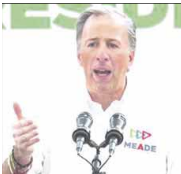
José Antonio Meade Kuribreña asistió al encuentro de la Concanaco-Servytur con candidatos a la Presidencia de la República.

José Antonio Meade Kuribreña, candidato de la coalición Todos por México, aseguró que este fin de semana comienza el último ciclo de debates en su vida y en la de Andrés Manuel López Obrador, toda vez que él ganará las elecciones y el tabasqueño volverá a perder.