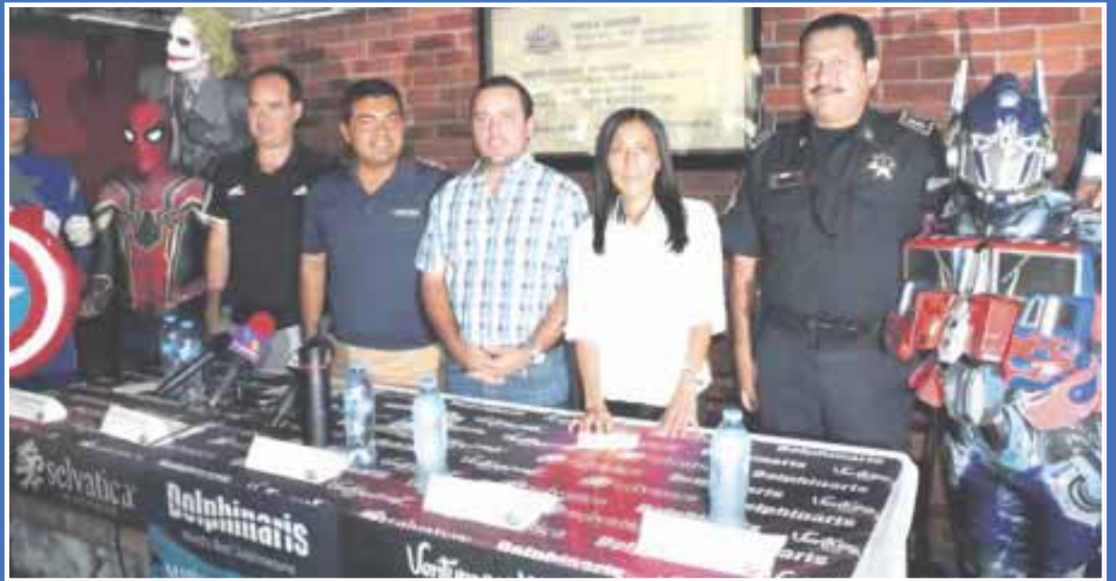
Un total de 800 participantes esperan en la "Carrera de los Superhéroes 2018", el próximo sábado 28 de abril.

En la carrera se espera un clima de competencia, pero también de diversión familiar al poder acudir con sus seres queridos para disfrutar de una disciplina deportiva en donde todos tienen cabida, sin importar edad.