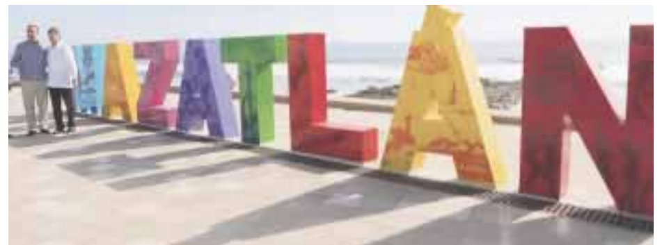
El gobernador de Sinaloa y el secretario de Turismo, en el recorrido por la remodelación del puerto.

(CROC), como generadores de demanda para aquellos que ya tienen producto armado.