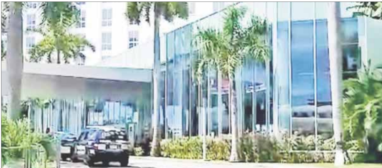
Los policías federales, estatales y municipales investigan los hechos para dar con la persona que disparó o accionó un arma de fuego en plena zona hotelera de Cancún.