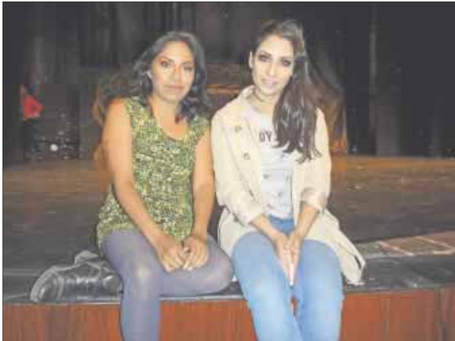
La obra cuenta con la dramaturgia de la Compañía Colibrí y Venado Arte Escénico, dirigida por Fernanda Ruiz y Noemí Contreras.

***La puesta en escena contó con 14 bailarines y 5 músicos en el Teatro San Jerónimo