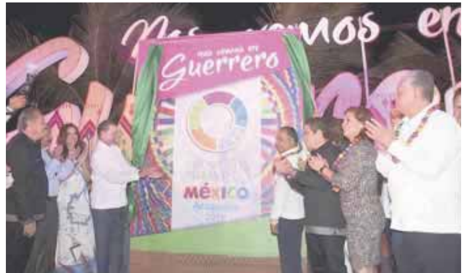
En el cambio de estafeta, los gobernadores de Sinaloa y Acapulco, acompañados de otros funcionarios.

El Sindicato Nacional de Trabajadores de la Educación y la Confederación Revolucionaria de Obreros y Campesinos