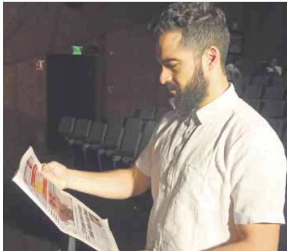
Alfonso Herrera, aquí leyendo DIARIOIMAGEN, da vida al profesor de literatura, llamado John Keating.