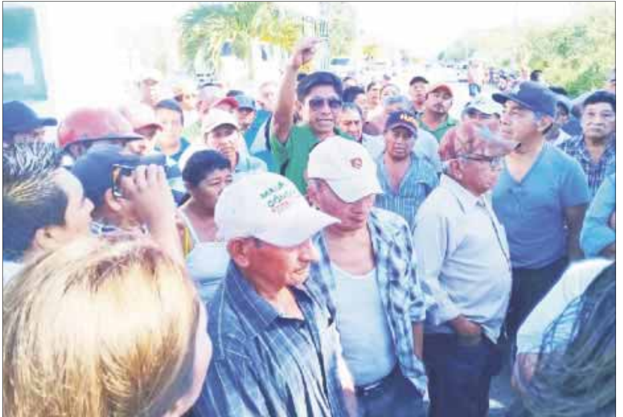
Ejidatarios de Kantunilkín, que reclaman un adeudo de 600 mil pesos, bloquearon la entrada a la cabecera municipal.

Manifestó que el gobierno del estado ya les pagó la mitad de los recursos y necesitan que los ejidatarios reconozcan este pago, para entregarles el restante.