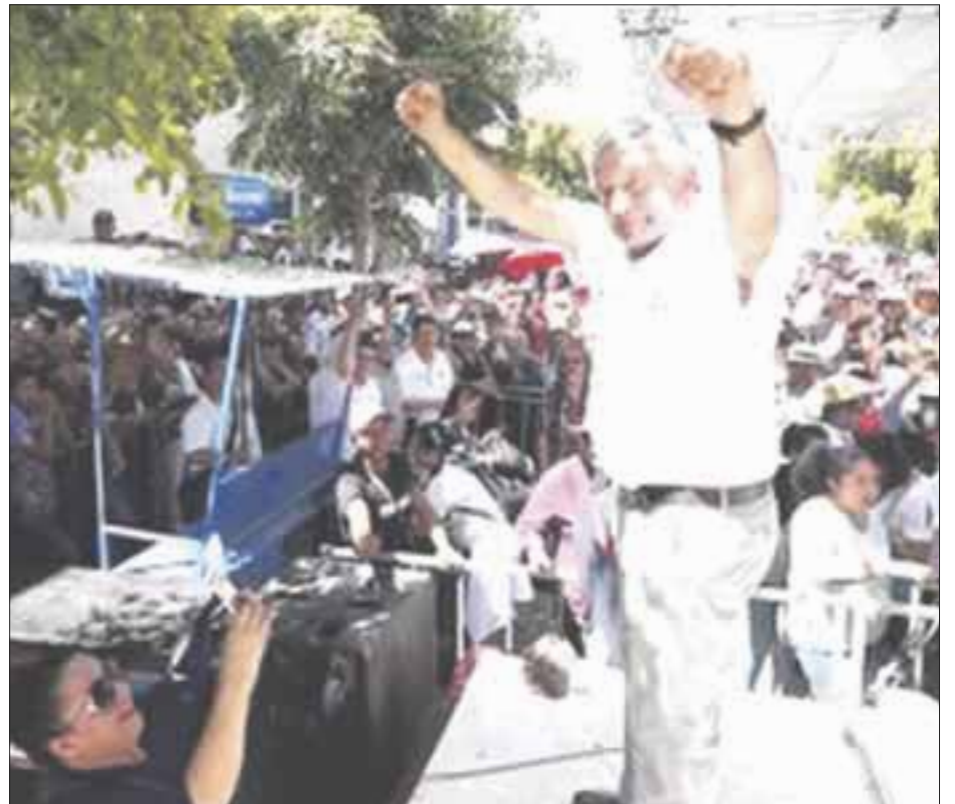
Andrés Manuel López Obrador descartó que el debate del próximo domingo vaya a modificar las preferencias electorales.

López Obrador consideró que por la ventaja que registra en las encuestas en tanto a la intención de voto se refiere, es muy poco probable que cambien las cifras después del encuentro