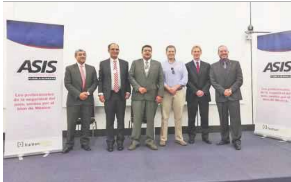
(AMESP) y ASIS impartieron un taller para mejorar la operación de las empresas de seguridad privada en México.