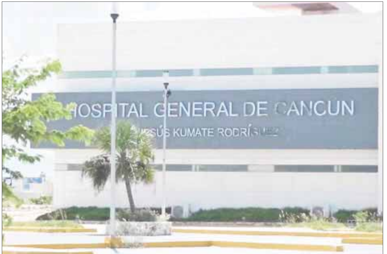
El Hospital General "Jesús Kumate Rodríguez" ya rebasó su capacidad instalada de atención, al pasar en un año de 180 camas a 250.

Se terminó con la disposición física para el servicio de quimioterapia ambulatoria, enfocada especialmente para los pacientes pediátricos.