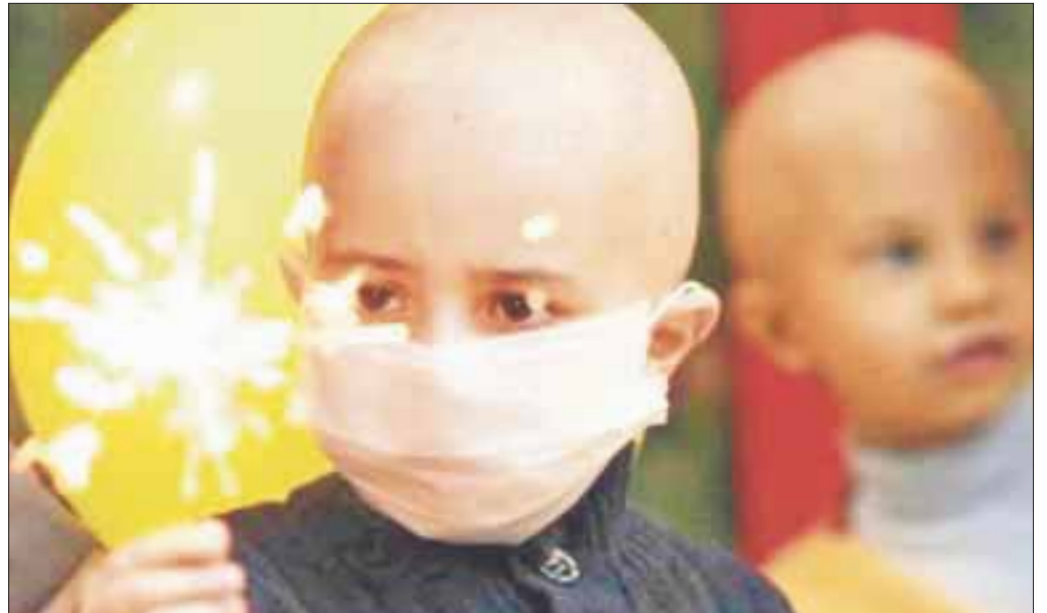
El sureste de México tiene la mayor incidencia de cáncer infantil.

En México tenemos el 50 por ciento de probabilidad de sobrevivencia después de un tratamiento con cáncer y en otros países del 70 por ciento.