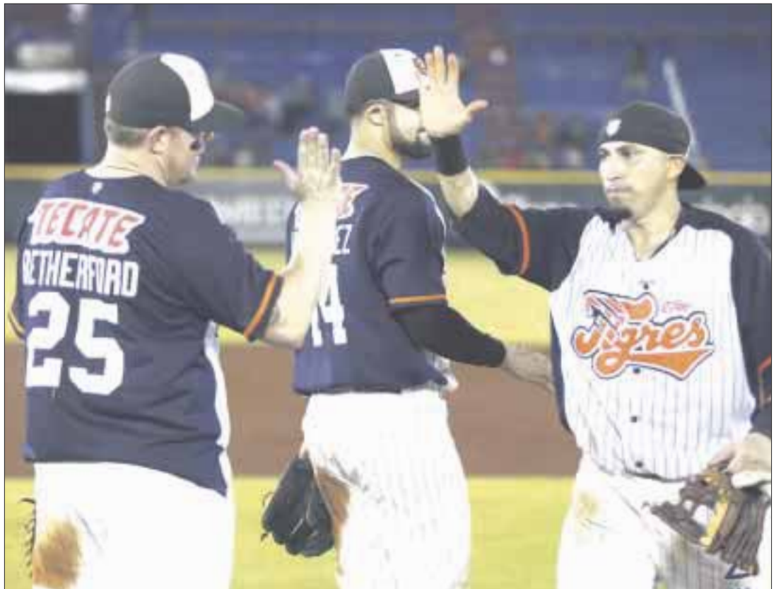
Tigres de Quintana Roo se enfrentan este viernes a Diablos Rojos del México en la capital del país, en el estadio Fray Nano.

En el estadio Fray Nano, la novena escarlata tiene registro de nueve triunfos a cambio de cinco derrotas; ante equipos sureños su marca es de 7-4; mientras que va parejo con 5-5 en las últimas 10 confrontaciones