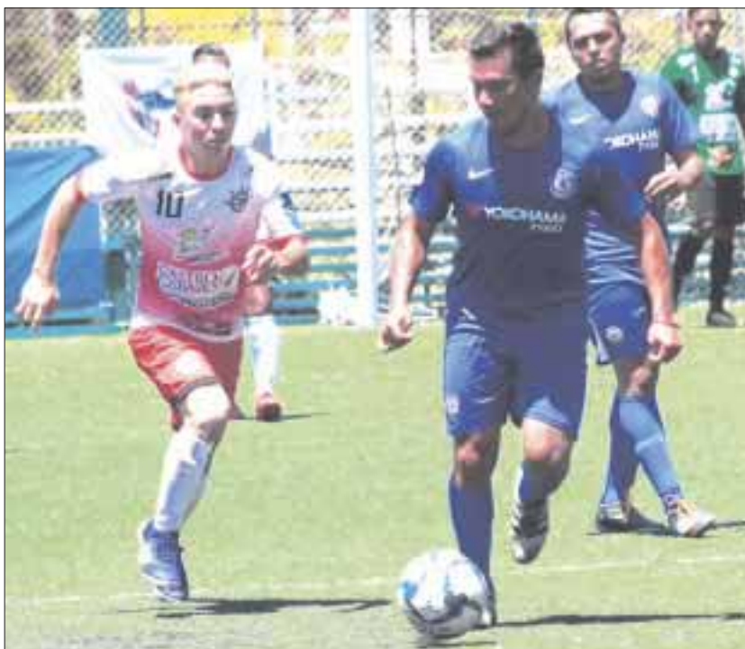
Instantes de tensión y emoción se vivieron en la segunda jornada del "Mundial de Clubes IFA 7 en Cancún 2018".

Los mexicanos vencen por goleada de 6-0 al Puntarenas de Costa Rica