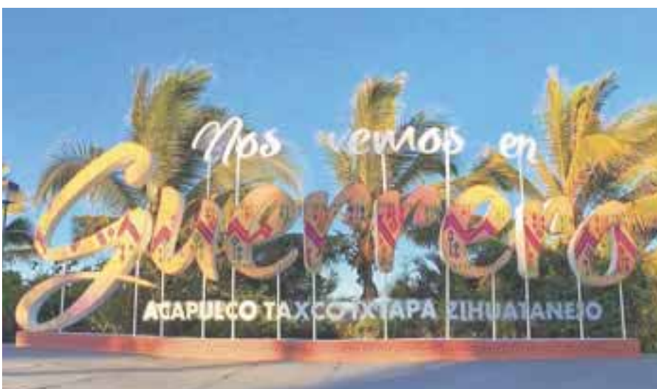
Guerrero, sede del Tianguis en 2019.

victoriagprado@gmail.com Twitter: @victoriagprado