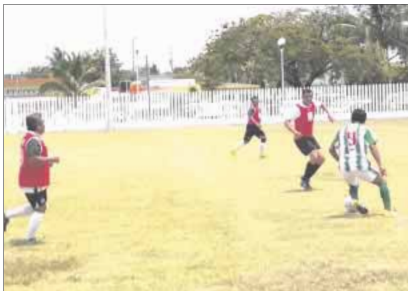
Capa y Seguridad Pública son líderes del Torneo de Copa Primavera, de la liga sabatina de futbol de veteranos.

Chetumal.- Los equipos Capa y Seguridad Pública son líderes del Torneo de Copa Primavera, al ligar su segundo triunfo, para lograr 6 puntos, que los colocan en la cima de la tabla de posiciones, luego de sus respectivas victorias obtenidas este fin de semana.