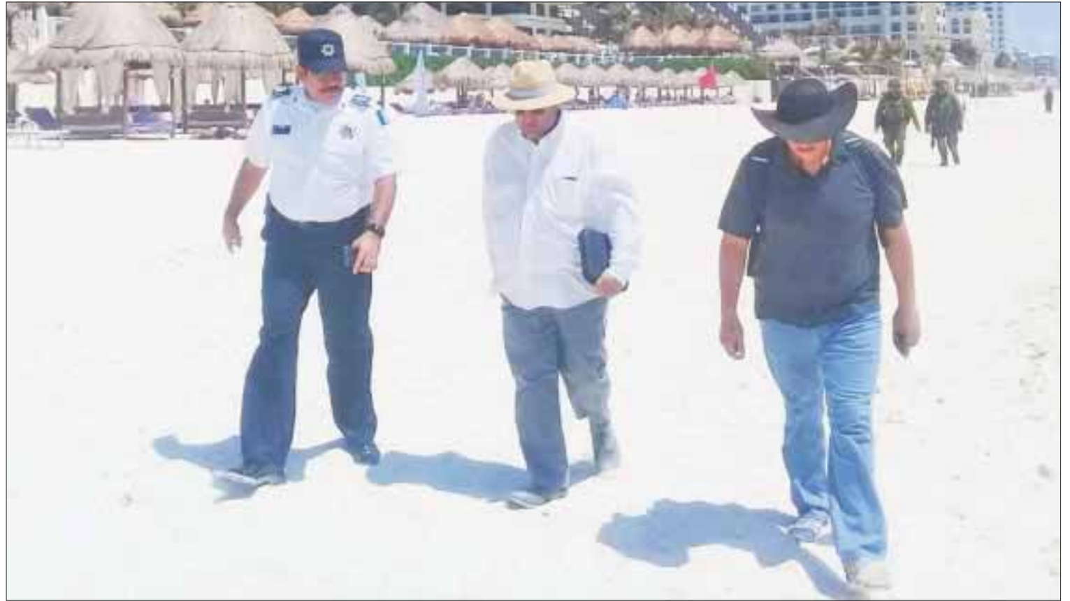
Diversas dependencias se unieron para lograr que los visitantes y trabajadores al servicio de la actividad turística se sintieran seguros.

En las playas también se realizaron operaciones de inspección y verificación a todas las unidades de transporte marítimo.