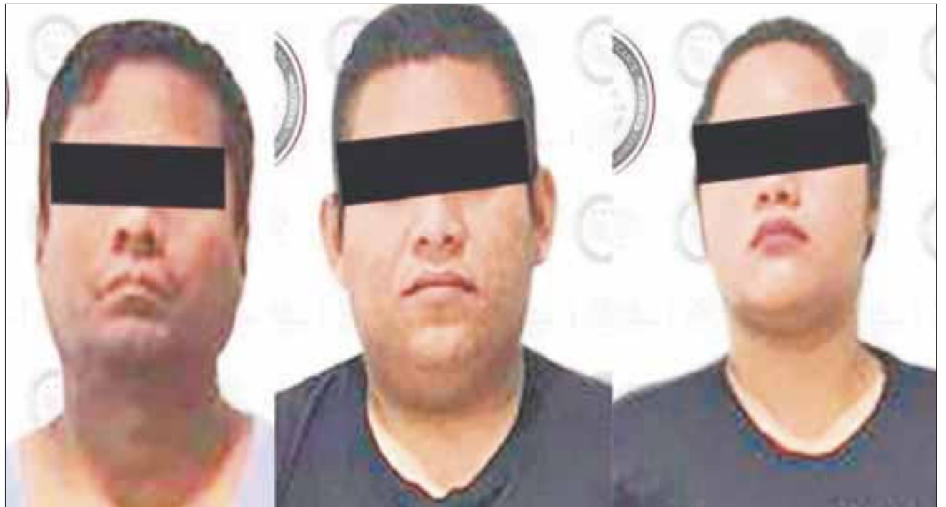
Ulises "N", Nabil Josué "N" y Saydi Oyuki "N" son los probables plagiarios de cuatro ciudadanos colombianos

Trascendió que tres de los secuestradores eran policías municipales.