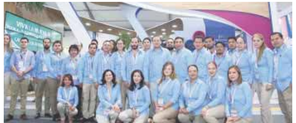
Los participantes del stand de Puebla, en el Tianguis Turístico Mazatlán.

Para atender al flujo de visitantes, la ciudad cuenta con una planta hotelera de 3 mil 500 habitaciones y una conectividad aérea de 36 vuelos diarios, tres de