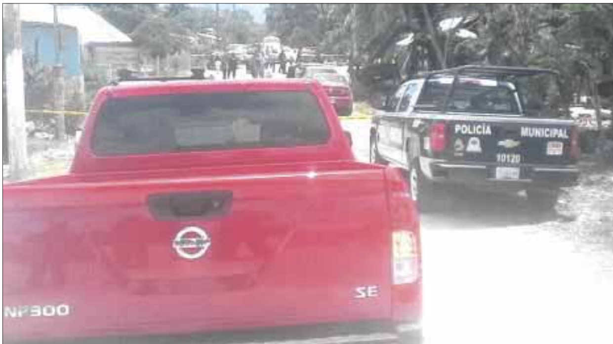
Fue acribillado el propietario de una tienda de abarrotes en el poblado de Pedro A. de los Santos, junto a un menor de 15 años, que resultó ser su sobrino.

La Policía Ministerial mantiene un operativo en la zona con la finalidad de dar con el paradero de los presuntos responsables, pero la unidad en la que huyeron no ha sido localizada.