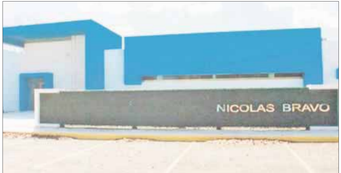
El Hospital General de Nicolás Bravo , cuya edificación se inició en 2012, sigue sin concluir, porque los presupuestos no alcanzan para equiparlo y dotarlo de personal médico.

Estrella Chan indicó que los reclamos son múltiples de la ciudadanía sobre el pésimo servicio de salud, tanto en la ciudad de Chetumal como en las comunidades rurales, ya que nunca hay medicamentos, las camas son insuficientes, las operaciones se postergan por falta de especialistas y material quirúrgico y sumado a ello, el trato inhumano hacia los enfermos.