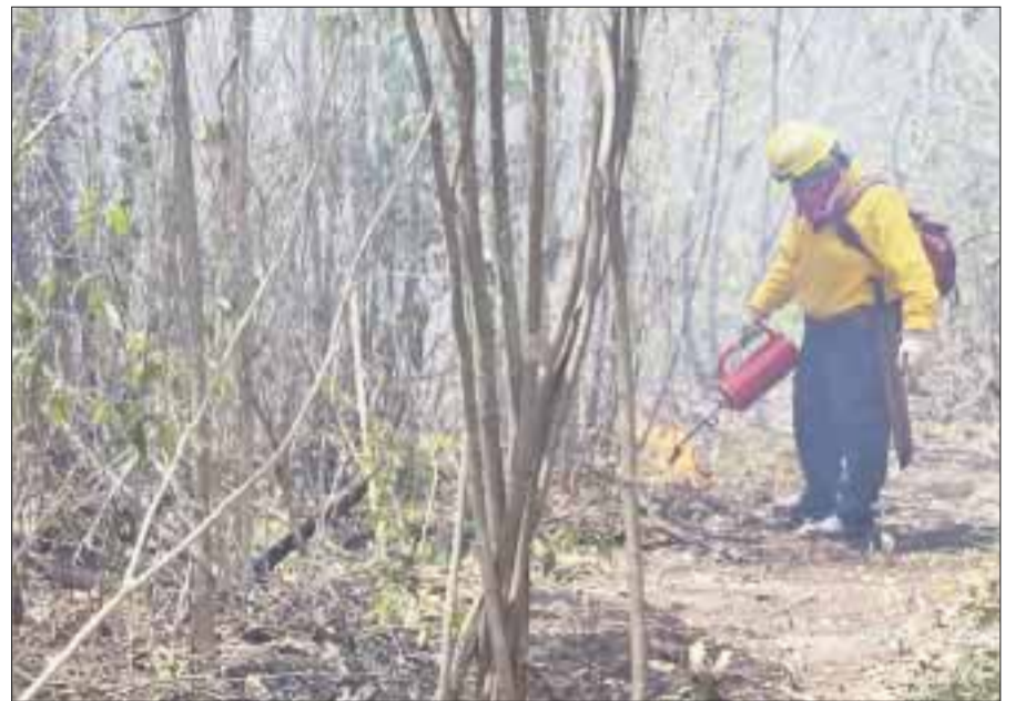
Los incendios forestales se intensificaron en el estado por tres factores: las altas temperaturas, las rachas de viento y la ausencia de lluvias abundantes.