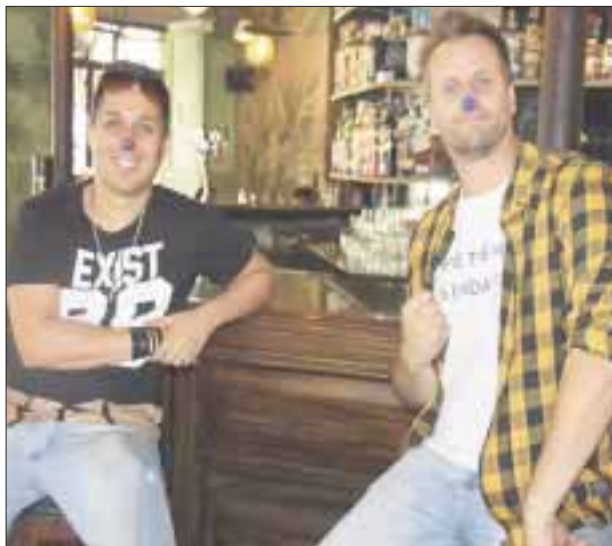
“El espíritu payaso” hará vibrar a miles de almas en el Auditorio Nacional, pues las primeras dos fechas ya son Sold Out .