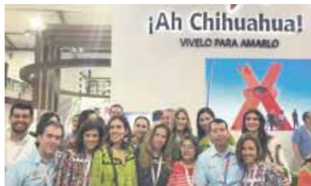
Chihuahua, presente, promoviendo sus atractivos.