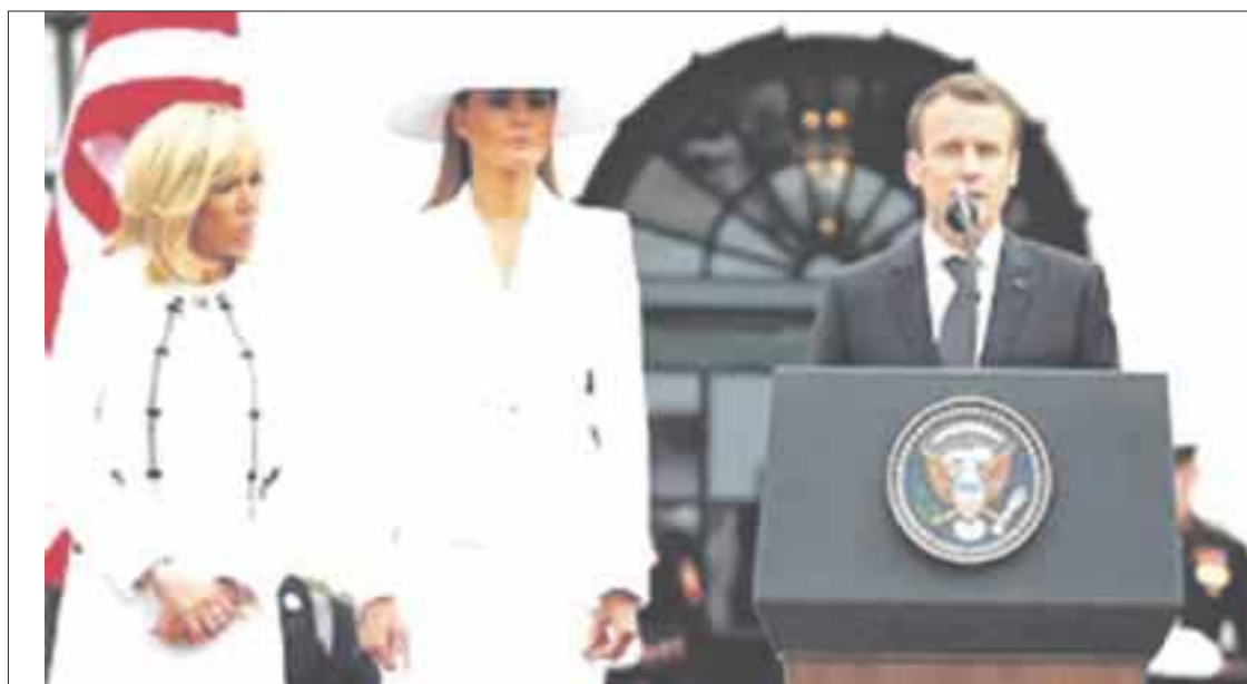
El presidente de Francia, Emmanuel Macron, expresó en Washington su disposición a trabajar “un nuevo acuerdo con Irán”.

El presidente de Francia, Emmanuel Macron, expresó en Washington su disposición a trabajar “un nuevo acuerdo con Irán”, que contenga algunas de las preocupaciones de su colega estadounidense, Donald Trump, sobre el pacto nuclear de 2015.