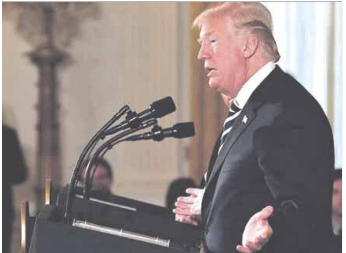
Donald Trump, presidente de Estados Unidos, dijo que “podría haber un tratado muy rápido”, aunque no está seguro de que sea lo mejor para su país.

Los ministros de Estados Unidos, Canadá y México presionan por un acuerdo rápido para evitar que choque con las elecciones del 1 de julio en México, lo que implicaría superar grandes diferencias respecto a varias demandas estadounidenses.