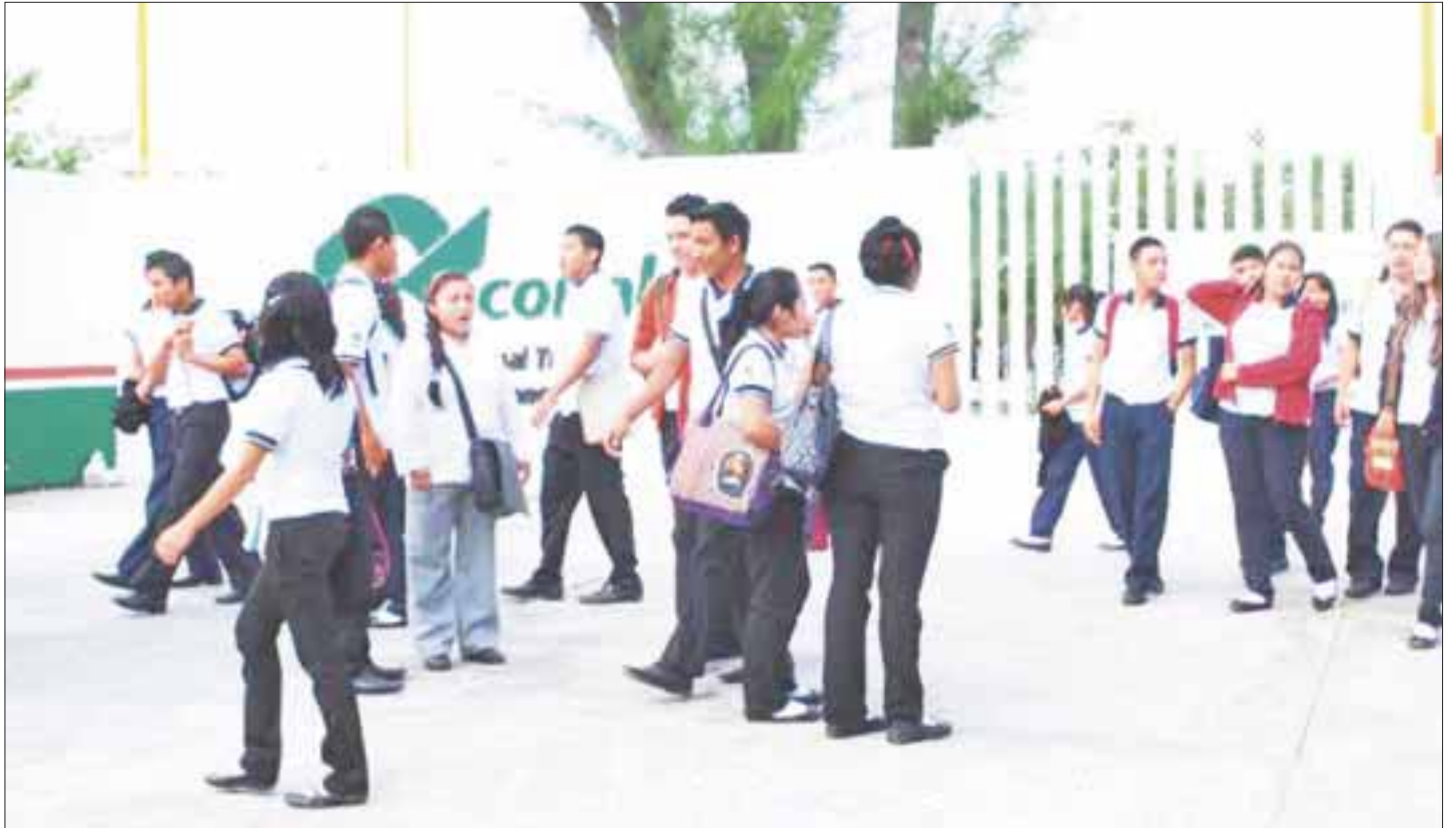
A un mes de iniciar el proceso de asignación de espacios en el nivel medio superior, está cubierta más de la mitad y se prevé que al cierre se tenga un déficit de 3 mil espacios.

El examen de ingreso se aplicará el 16 de junio y los resultados se publicarán un mes después en los planteles que los alumnos eligieron como primera opción dentro de sus 10 preferencias.