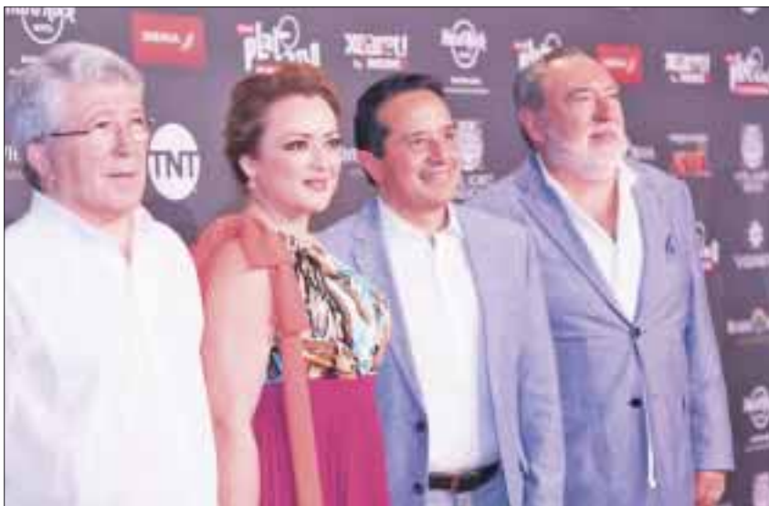
A la entrega de los Premios Platino, en el teatro Gran Tlachco, del parque Xcaret, asistieron invitados del arte cinematográfico, el ámbito cultural y el espectáculo.

Xcaret.- El gobernador, Carlos Joaquín, asistió como invitado de honor a la gala de la V Entrega de los Premios Platino del Cine Iberoamericano 2018, que tuvo como escenario la Riviera Maya, desde donde refrendó su liderazgo en materia turística y se mostraron al mundo sus bellezas naturales, el esplendor de su cultura maya y sobre todo la calidez y la hospitalidad de su gente.