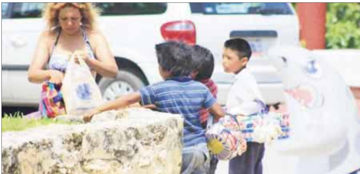
La explotación infantil es una realidad en cada temporada vacacional; los niños indígenas son explotados para exhibir artesanías tanto en la ciudad como en las playas.

Cancún.- La explotación infantil durante todo el año es una realidad que se incrementa 50 por ciento en cada temporada vacacional se “realizan” operativos para frenar que niños indígenas sean explotados mediante la exhibición de artesanías tanto en la ciudad como en las playas.