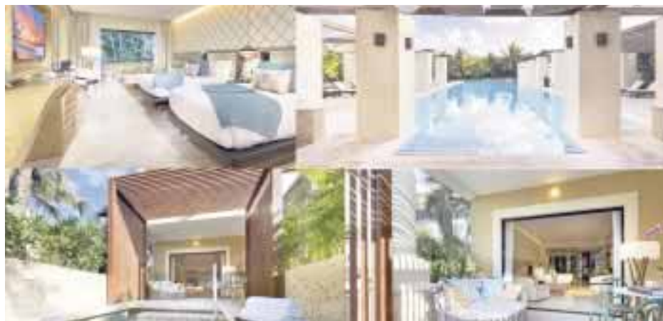
TRS y las suites que brinda.