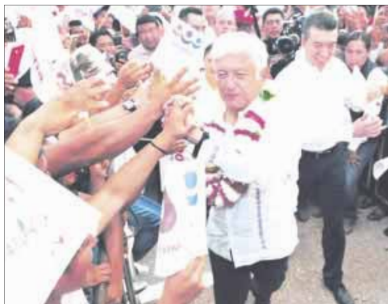
Andrés Manuel López Obrador anunció que en los próximos días se unirán a su movimiento liderazgos de otras fuerzas políticas.

Andrés Manuel López Obrador, abanderado a la Presidencia de la coalición Juntos Haremos Historia, aseguró que los partidos se están “desfondando” en la contienda presidencial.