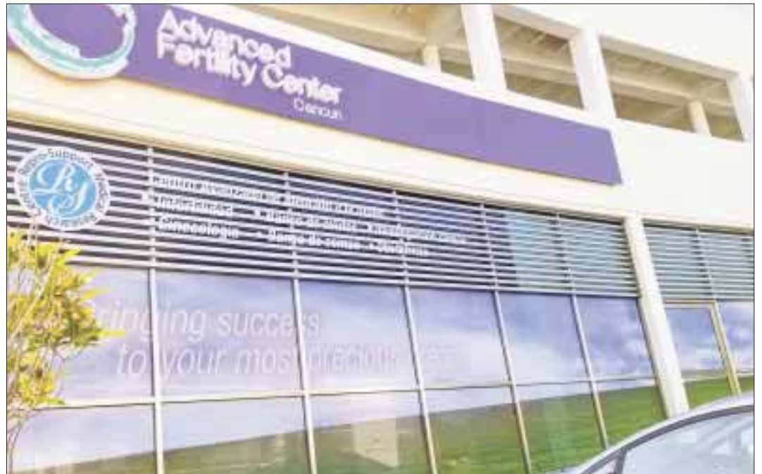
Más de 150 médicos especialistas participaron en el Simposium Conmemorativo Internacional "Posibilidades de Vitrificación en la reproducción humana."

En este marco, Advanced Fertility Center Cancún anunció a través de Masashige Kuwayama que darán servicios de crioconservación y mantenimiento de tejido ovárico por 5 años a todas las mujeres mexicanas con cáncer de forma gratuita