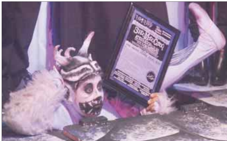
Un aterrorador demonio salió de las profundidades del escenario con la placa en su poder

“Sordo, mudo, ciego” se presenta todos los viernes a las 21:00 horas en el Centro Cultural Sylvia Pasquel, con una duración aproximada de 90 minutos y una clasificación para adolescentes y adultos.