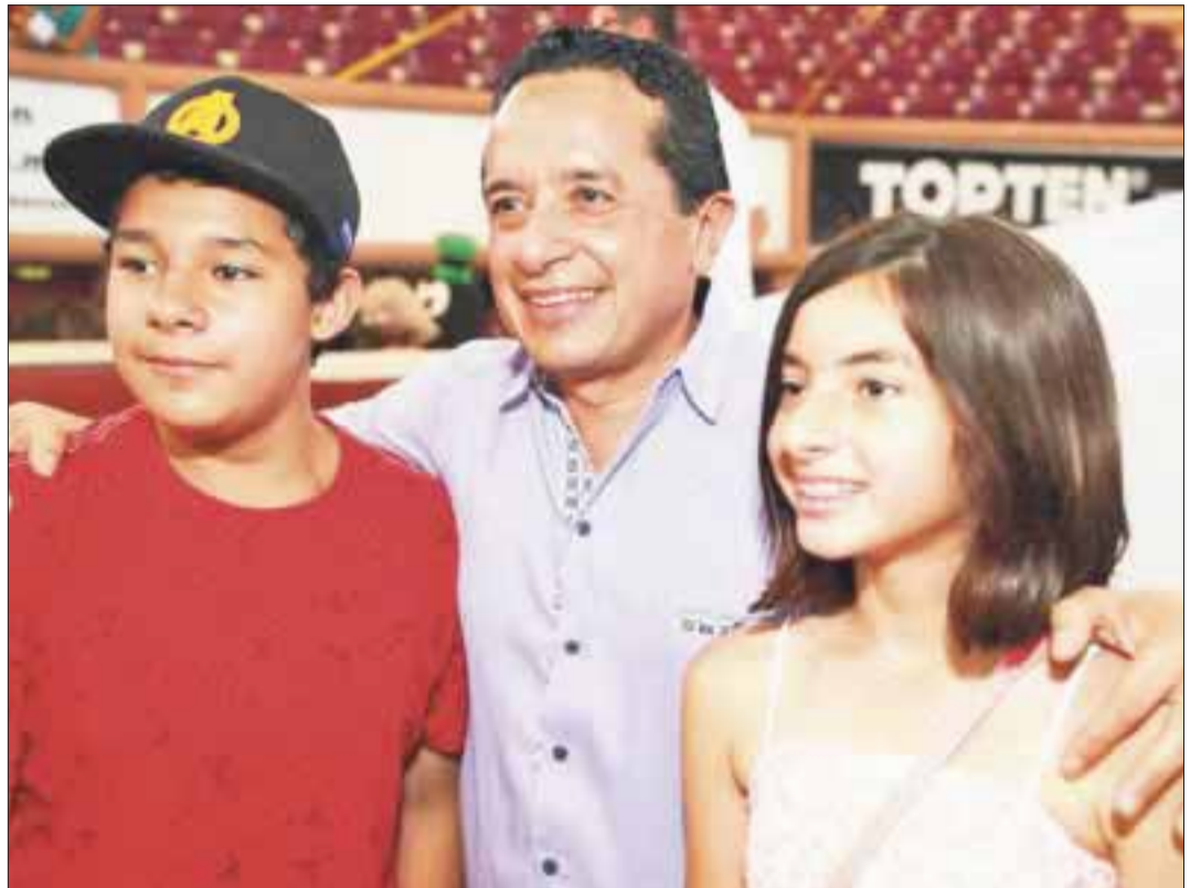
Los menores están expuestos a diversos riesgos cuando usan internet, por lo que desde el gobierno estatal se implementan programas para evitar que sean víctimas de un delito.

El gobierno del estado, a través de la Secretaría de Educación, impulsa actividades dirigidas a los estudiantes de primaria y secundaria, con la finalidad de que no sean víctimas de delitos que se cometen utilizando la tecnología que está al alcance de todas las personas.