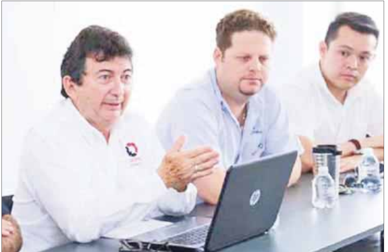
Un grupo de organizaciones gremiales y empresariales demandan al gobierno investigar el crimen del funcionario de Solidaridad.

Además del Colegio de Ingenieros Mecánicos, mecatrónicos, electricistas y electrónicos del Caribe Mexicano A.C, Eleonora Mendoza A.C., Fematurq-roo, MOCE Yax Cuxtal, Observatorio de la Gobernanza para la Cooperación y el Desarrollo A.C., Observatorio Legislativo de Quintana Roo, Orgullo Ciudadano A. C, Playa Inn, Riviera Maya Sostenible, Transformar Educando A.C y Trasgente.