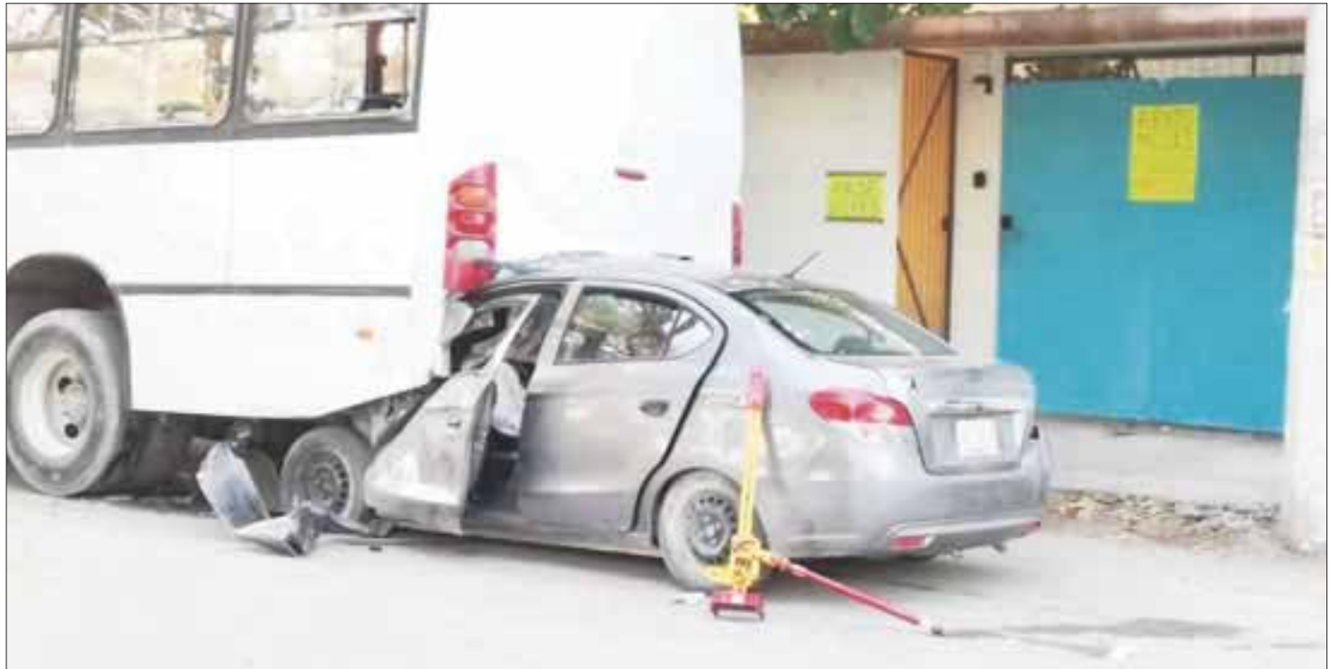
De acuerdo a los primeros reportes, el exceso de velocidad y el alcohol fue lo que provocó el trágico accidente.

El chofer del auto fue llevado al Hospital General de Cancún, mientras los dos heridos fueron trasladados al hospital del Instituto Mexicano del Seguro Social de la avenida Cobá esquina Tulum.