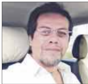
Por Mauricio Conde Olivares

Según el más grande sitio on line de viajes en la web, Trip Advisor, resulta que dos centros de hospedaje ubicados en Quintana Roo se ubicaron este año a la lista de los 25 mejores hoteles del mundo. Se trata del Hotel Rosewood Mayakoba de Playa del Carmen, que ocupó el lugar número 10 de las preferencias y el Hotel Grand Residences Riviera Cancún de Puerto Morelos, que logró situarse en el sitio 25.