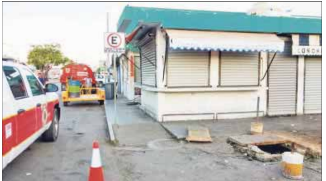
El mercado Lázaro Cárdenas volvió a colapsar, al quedar rebosadas sus fosas sépticas y la reaparición de la fauna nociva, por lo cual la clientela disminuyó.