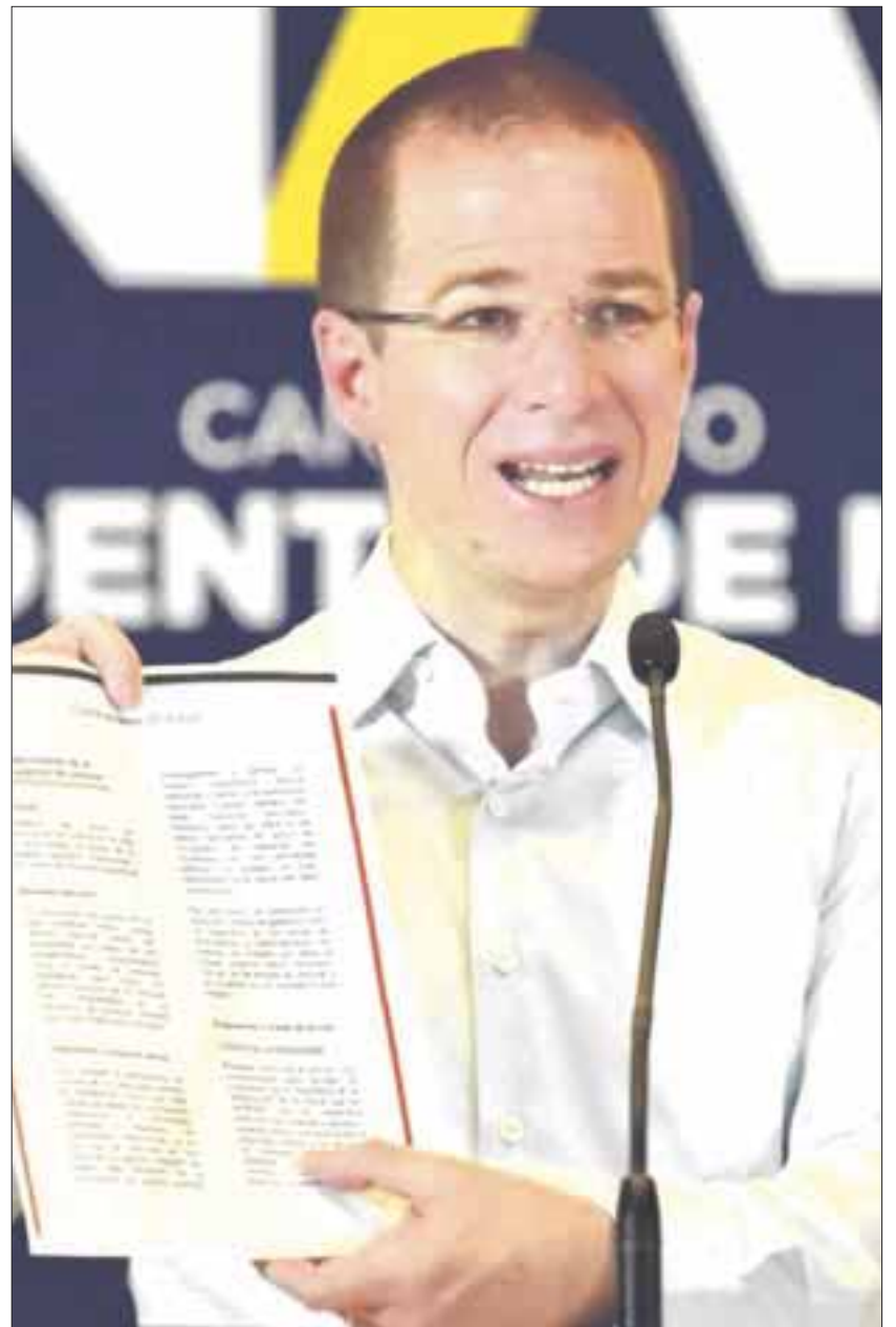
Ricardo Anaya Cortés llamó a militantes de todos los partidos a emitir un voto útil para frenar a Andrés Manuel López Obrador.