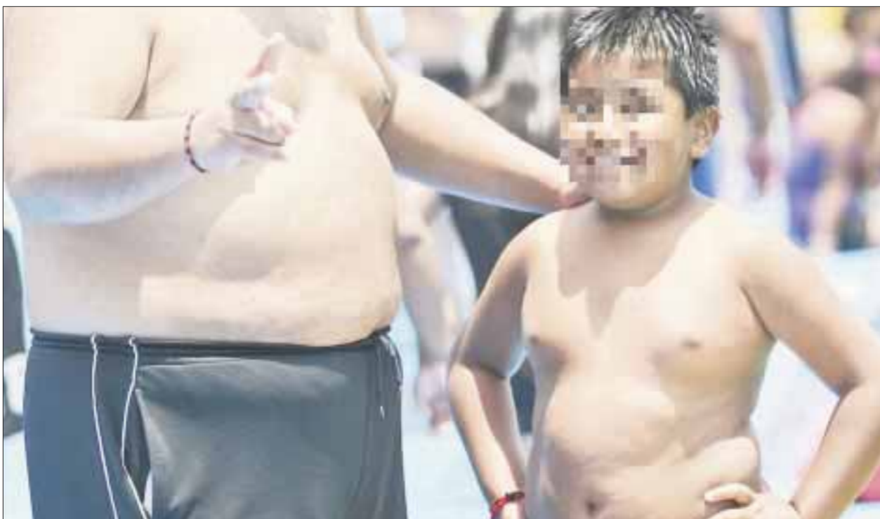
El 30 por ciento de la población que acude a los servicios públicos de salud padece algún problema cardíaco por los estilos de vida sedentaria y deficiente alimentación.

Cancún.- La lucha con el sobrepeso y obesidad se torna recurrente en los últimos años, en particular entre las nuevas generaciones que son víctimas de problemas de salud como la taquicardia, que se presenta con mayor frecuencia en la población adulta.