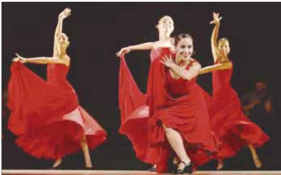
“Cuba Vibra” conjuga danza y música con el que la compañía Litz Alfonso Dance Cuba festejó 25 años en el Coloso de Reforma.

Un espectáculo que fusiona elementos del ballet clásico, contemporáneo, flamenco y ritmos afrocubanos.