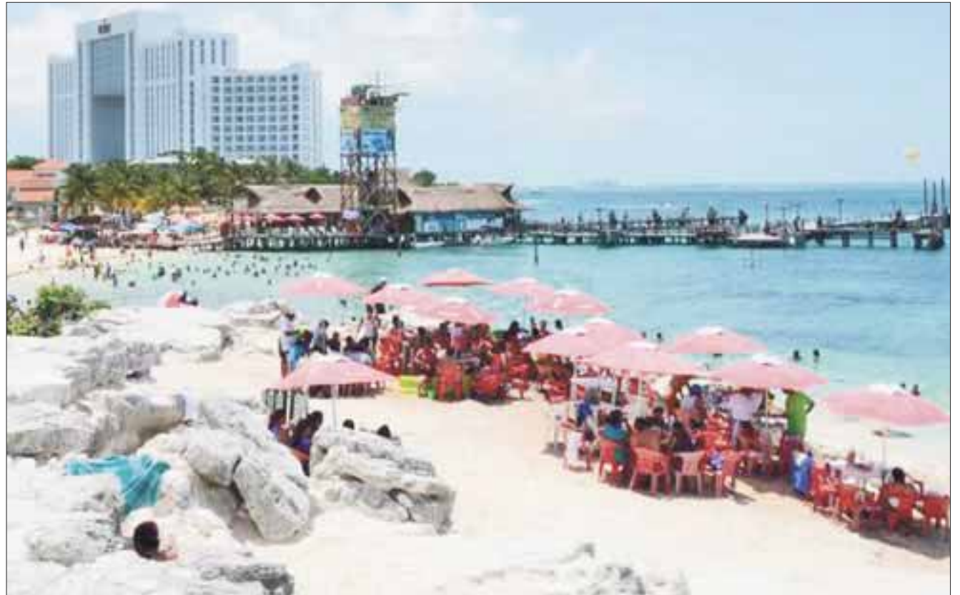
En las playas de Quintana Roo, el verano generó una derrama de mil 735.57 millones de dólares, al mantenerse el destino como el preferido.