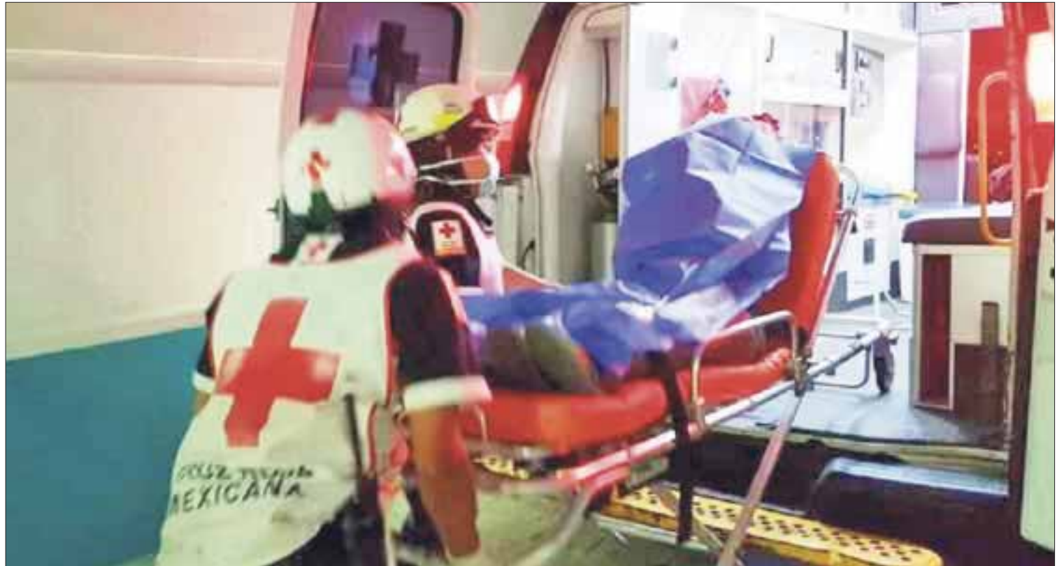
La pareja fue agredida en la Calle 19, falleciendo al instante el hombre, ya que recibió disparos en la cabeza y cuello.

La Fiscalía General del Estado informó que por la muerte del joven y las lesiones de la mujer se inició la carpeta de investigación 450/2018, por el delito de homicidio y lesiones en contra de quien resulte responsable.