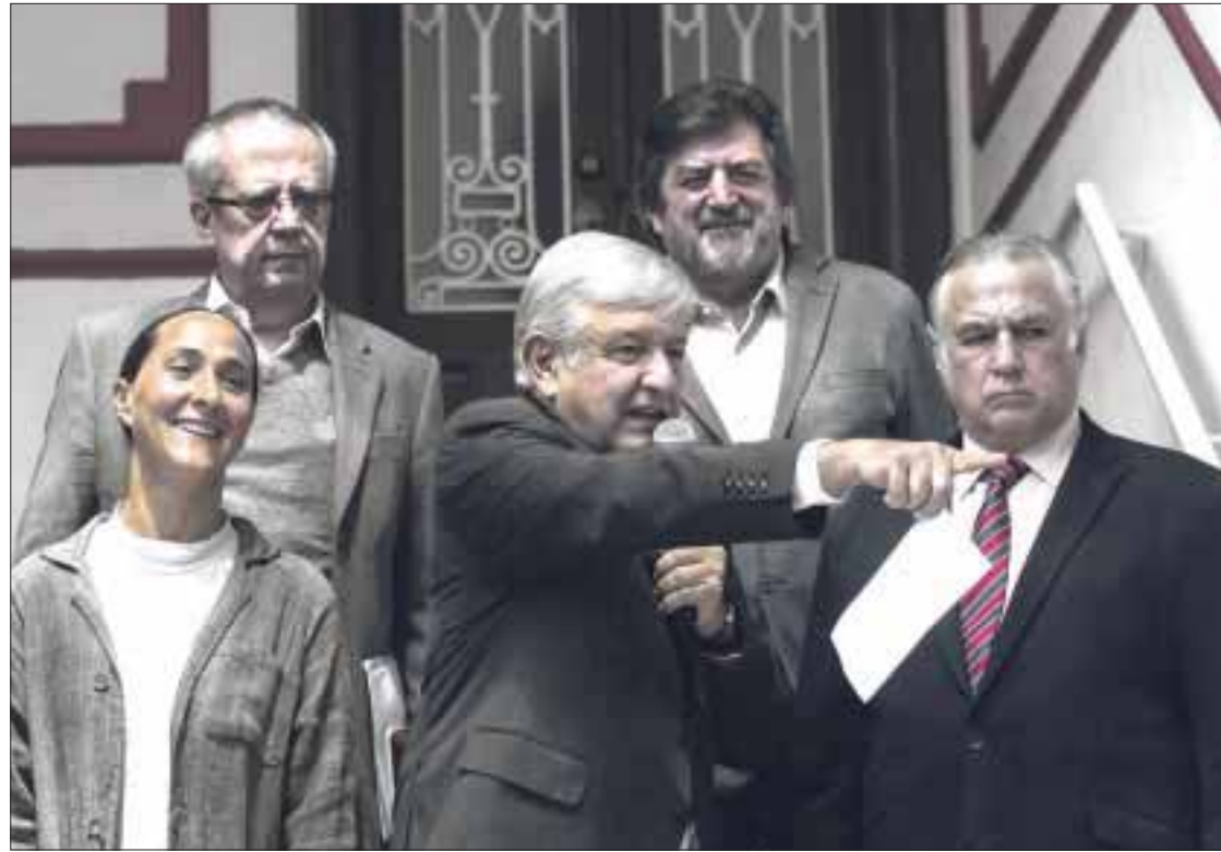
Andrés Manuel López Obrador revisó avances de cinco proyectos prioritarios, entre ellos la construcción del Nuevo Aeropuerto y el Tren Maya.

El Presidente electo agregó que esta obra permitirá comunicar una de las regiones de más importancia cultural a nivel mundial, la cual fomentará no sólo