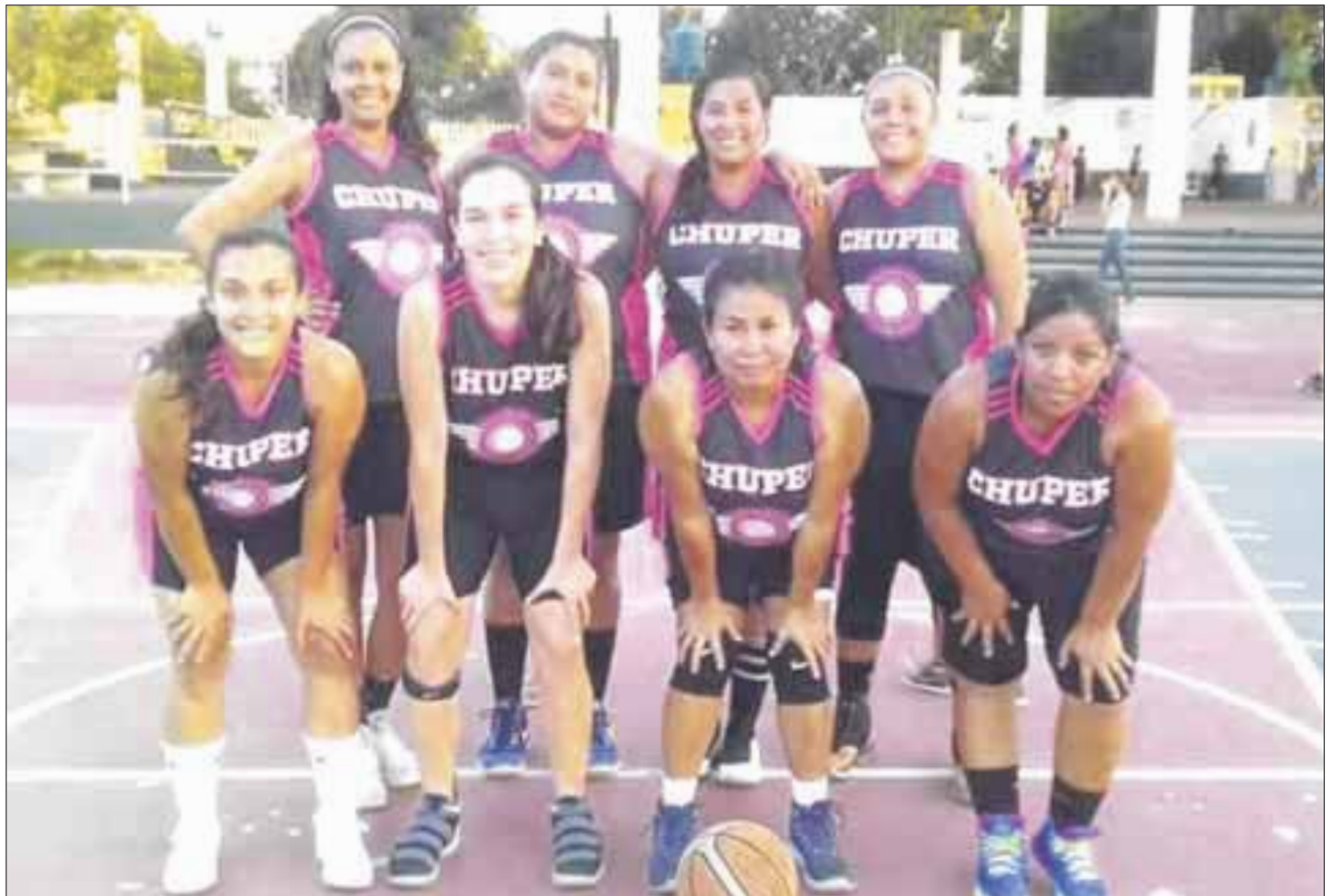
Chuper Amigas, rumbo al bicampeonato, se mantienen al frente de la liga femenil.