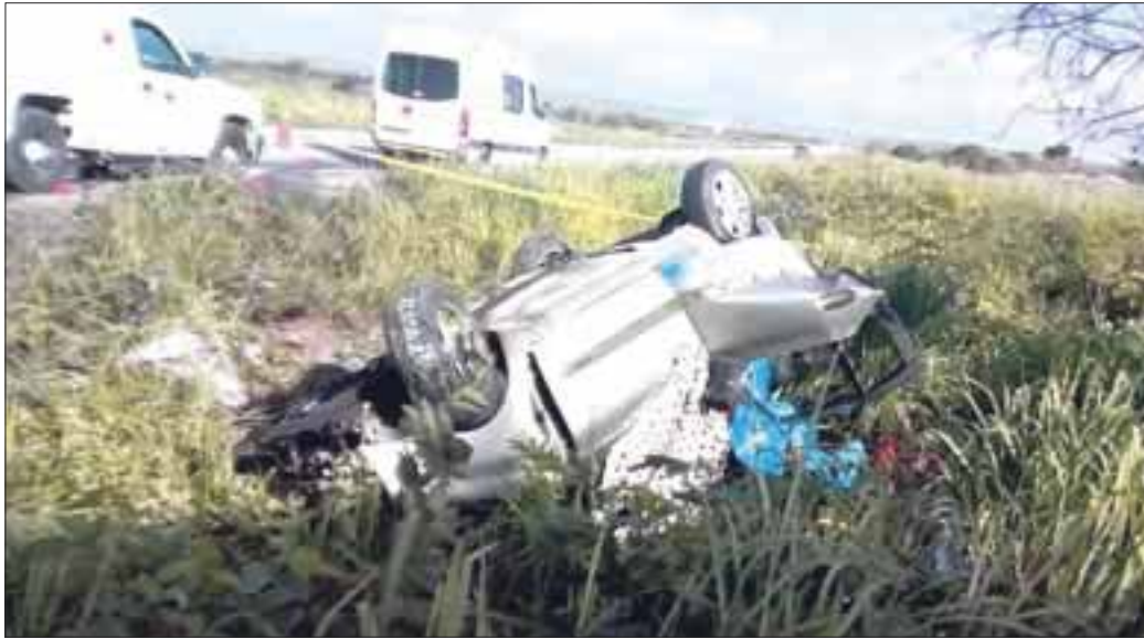
En el Nissan Platina, impactado por un tráiler, viajaba una familia que iba a Nuevo León, mientras que en un Dodge Atos iban maestros.

Impactados por tráiler que invadió el carril contrario