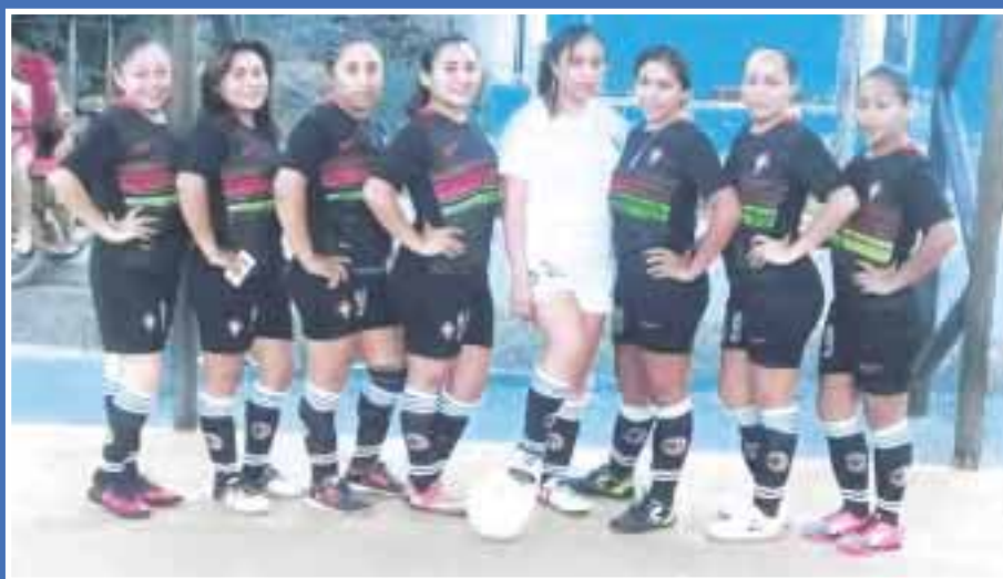
Este es el equipo femenino de futbol rápido Real Morelos, que disputará la final, quizá con Linceo o Club Inter.

José María Morelos- En un hecho sin precedentes, el equipo Real Morelos, que participa en el Torneo de Futbol Rápido Intercomunidades, pasó a la final, al dejar fuera de la jugada al Panthers, por la vía de la descalificación.