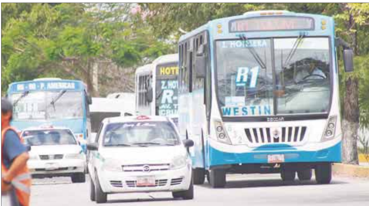
Cierran filas autoridades contra el transporte pirata , con operativos de revisión.

Cancún.- Cierran filas autoridades contra el transporte pirata, con operativos de revisión, como parte del proceso para iniciar con reordenar el transporte urbano estatal y municipal, además de la elaboración de un diagnóstico antes que concluya el mes.