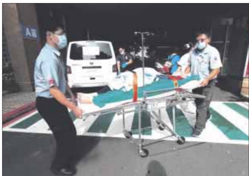
Un incendio en un hospital público de la ciudad de Nueva Taipei dejó un saldo de al menos 9 personas muertas y otras 16 heridas.

Al menos 9 personas murieron y otras 16 heridas, 11 de ellas de gravedad, a causa de un incendio en un hospital público de la ciudad de Nueva Taipei, en la costa norte de Taiwán, al parecer causado por un corto circuito.