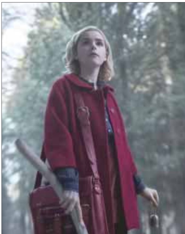
Descubre las primeras imágenes de El mundo oculto de Sabrina .

“Tantos (de ellos) nos han dado décadas de música eterna”, tuiteó la rapera.