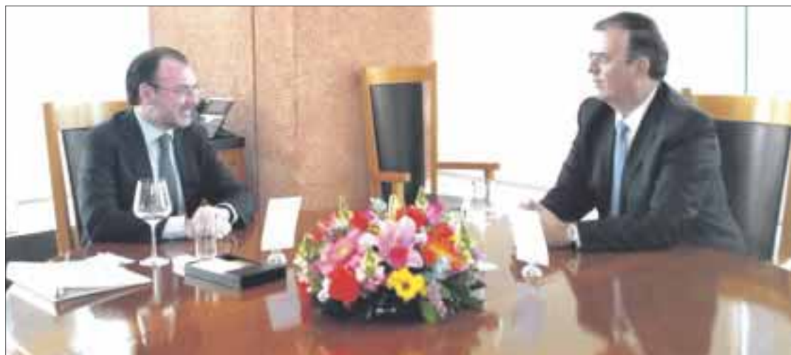
Marcelo Ebrard Casaubón se reunió con el secretario de Relaciones Exteriores, Luis Videgaray Caso.

En el tuit que difundió el titular de la Secretaría de Relaciones Exteriores (SRE) también se publica una fotografía de ambos.