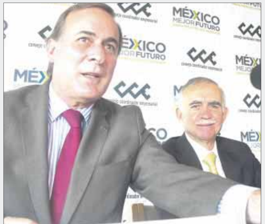
Integrantes del CCE se reunirán con Andrés Manuel López Obrador para evaluar el actual sistema de salud.

Estas prioridades y compromisos son compatibles con el Pacto de la Salud, firmado en el CCE con organismos de la sociedad civil, y agregó: “es nuestro compromiso contribuir a cerrar la brecha en el acceso a salud de calidad”.