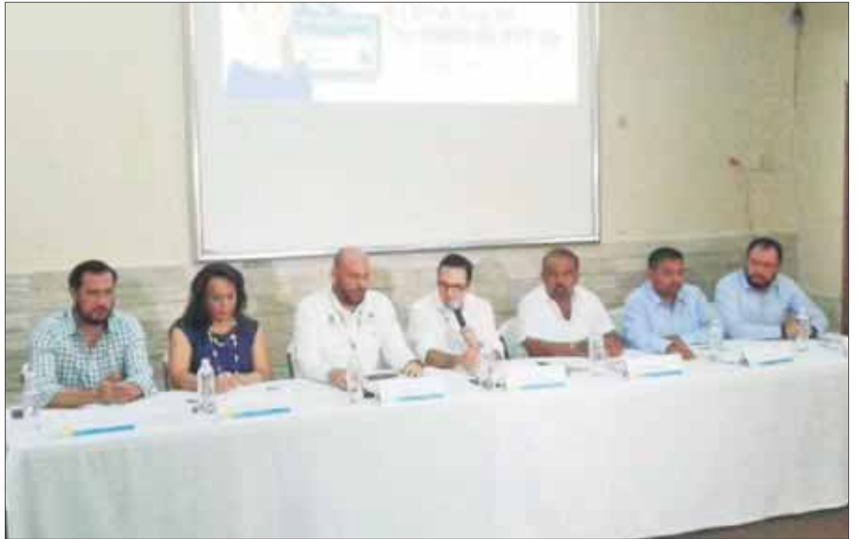
El combate a la corrupción se inició de manera frontal en la ciudad, con acciones de simplificación administrativa.

Dichas disposiciones se acordaron, una vez que el sector empresarial y la propia ciudadanía manifestaron su inquietud al daño a su patrimonio por la corrupción que impera en algunas dependencias donde realizan trámites imposterables y una de ellas es Sintra