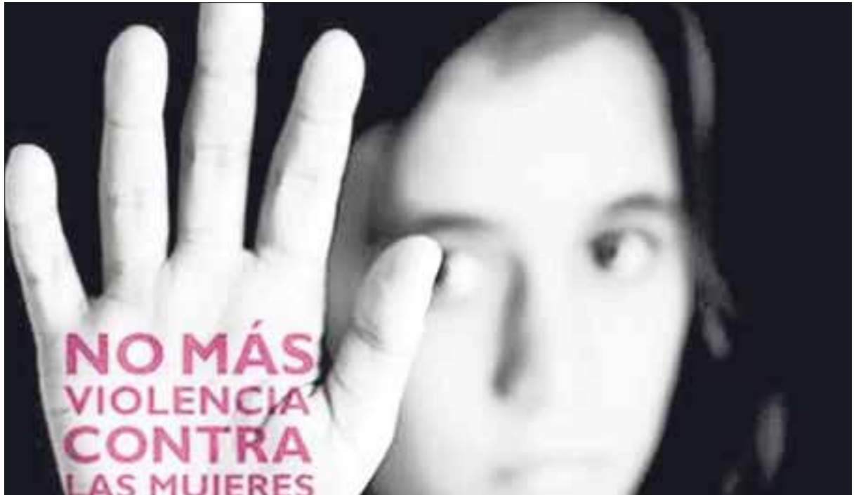
En Quintana Roo, la violencia hacia la mujer se mantiene, en particular en la zona maya, al tratarse de una situación cultural que lleva a las mujeres aceptar dicho maltrato psicológico y físico.

A un año de cumplirse el decreto de Violencia de Género para Cancún, Playa del Carmen y Cozumel, a pesar de dichos hechos en la zona maya, confió que no se emita una nueva alerta para ningún municipio más, ya que se trabaja para erradicar dicha situación