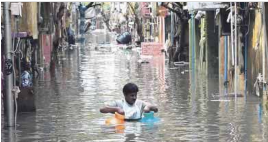
Lluvias monzónicas de este año en India han dejado hasta ahora al menos 774 muertos, unos 245 heridos y decenas de desaparecidos.

Las inundaciones y los deslizamientos de tierra provocados por las lluvias monzónicas de este año en India han dejado hasta ahora al menos 774 muertos, unos 245 heridos y decenas de desaparecidos, así como cuantiosos daños materiales, informó el Ministerio indio del Interior.