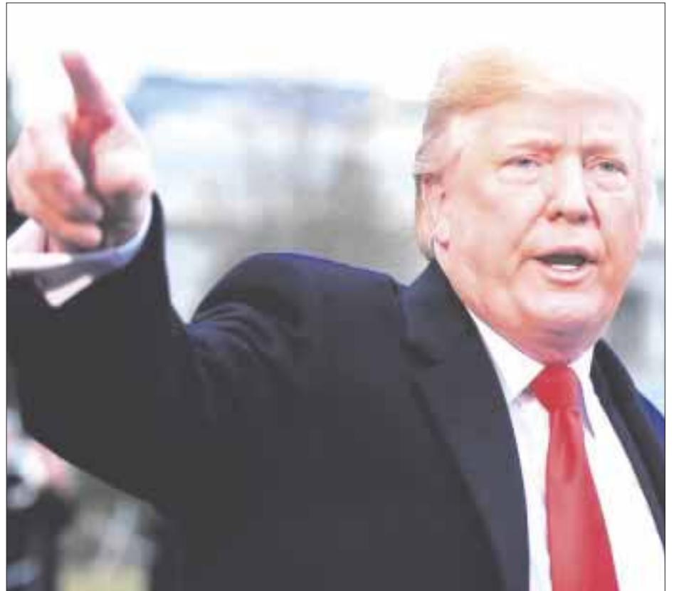
Medios informativos de Estados Unidos se han unido contra los ataques a los periodistas del presidente Donald Trump.

La iniciativa, liderada por el histórico diario The Boston Globe , ha reunido ya a grandes cabeceras nacionales, como The Houston Chronicle , el Minneapolis Star Tribune , Miami Herald o Denver Post , de acuerdo a información de medios locales