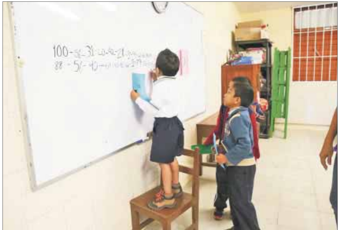
La Secretaría de Educación de Quintana Roo hizo un llamado a los padres de familia que no hayan inscrito a sus hijos para que lo hagan en los próximos días, pues hay cupo.

Del 18 de junio al 20 de julio y del 1 de agosto al inicio del ciclo escolar, el próximo 20 de agosto, se está dando continuidad al proceso de inscripciones en línea, que comenzó el mes de febrero, a través de la página de internet www.seq.gob.mx