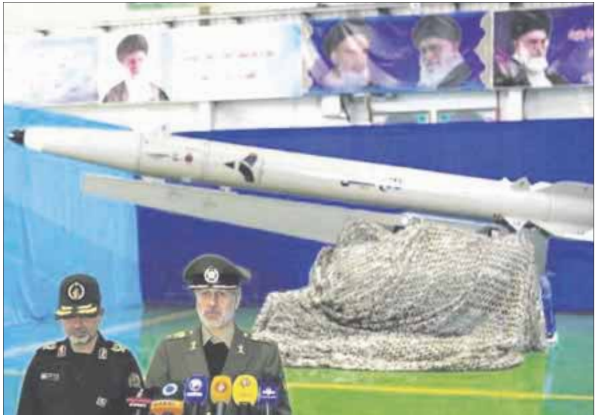
El gobierno de Irán presentó el nuevo “Fateh Mobin”, una nueva generación de misiles balísticos de precisión.

“Como fue prometido a nuestro querido pueblo, no escatimaremos ningún esfuerzo para aumentar las capacidades de los misiles balísticos del país”, afirmó el general Hatami, al presentar la última versión del “Fateh Mobin”