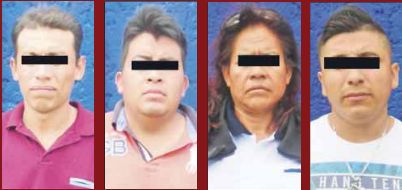
La policía aseguró a 4 personas por posesión de pirotecnia en avenida Rancho Viejo, en la Región 233.

Cancún.- Elementos de la Secretaría de Seguridad Pública aseguraron a cuatro personas por posesión de pirotecnia.