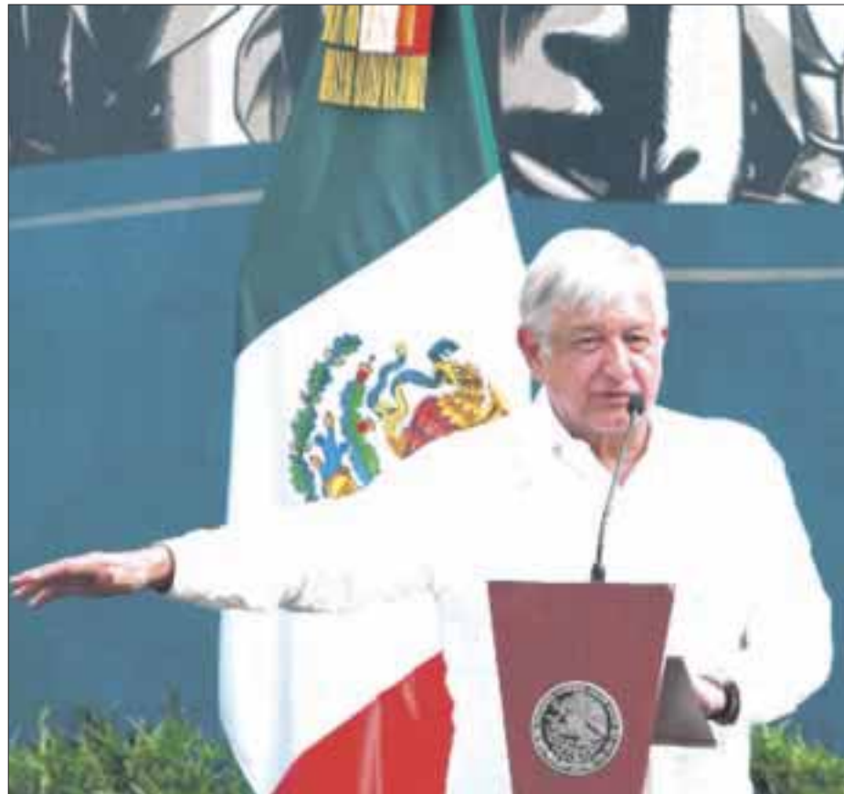
Andrés Manuel López Obrador reiteró que ningún funcionario público debe ganar más que el Presidente de la República.

Posteriormente, en Morelos, López Obrador descartó bajar las expectativas de su gobierno, y enfatizó que por el contrario aumentará el trabajo que se realiza en la Administración Pública Federal para cumplirlas.