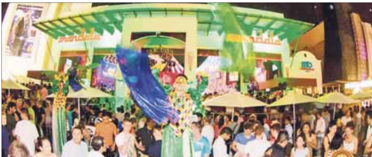
Multas de más de 150 mil pesos y la clausura del lugar se impondrá a quien permita el acceso a menores de edad.

Cancún.- Multas de más de 150 mil pesos y la clausura del lugar, se impondrá a quien permita el acceso y venta de alcohol a menores de edad, en discotecas, bares y antros de la ciudad, en el marco de las fiestas decembrinas en el que dichos negocios estarán en la mira de Fiscalización y Co-fepris.