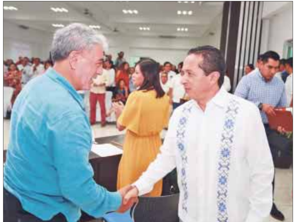
Carlos Joaquín asistió a la firma del Convenio Modificatorio de Adhesión del Tribunal de Justicia Administrativa al Pacto para introducir la Perspectiva de Género en los Órganos de Impartición de Justicia.