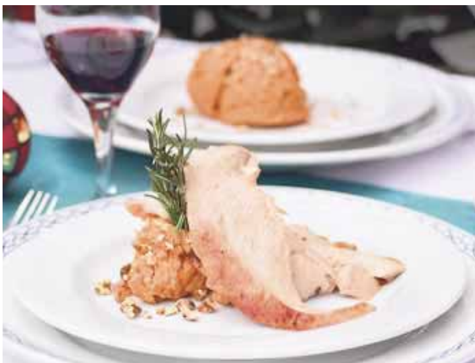
El delicioso pavo ahumado al vino con puré de camote.