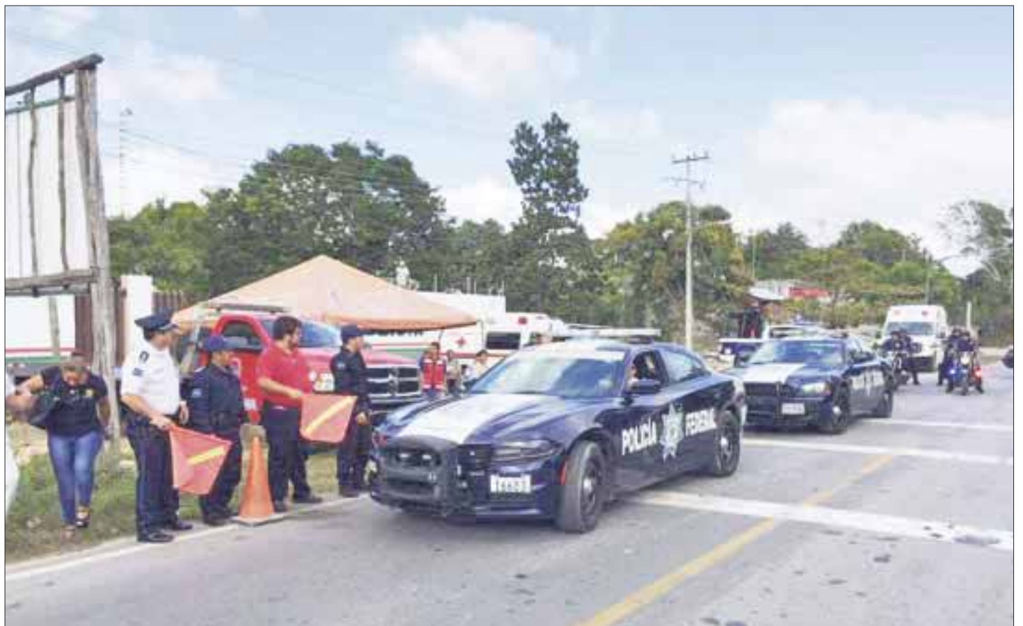
El operativo Guadalupe-Reyes arranca hoy miércoles en Cancún, con la participación de 401 elementos.

Dicho operativo se replicará el 31 de diciembre y madrugada del 1 de enero, en el que la familia suele salir a disfrutar de la fiesta en restaurantes o la playa para despedir el año y recibir los primeros rayos de sol del 2019.