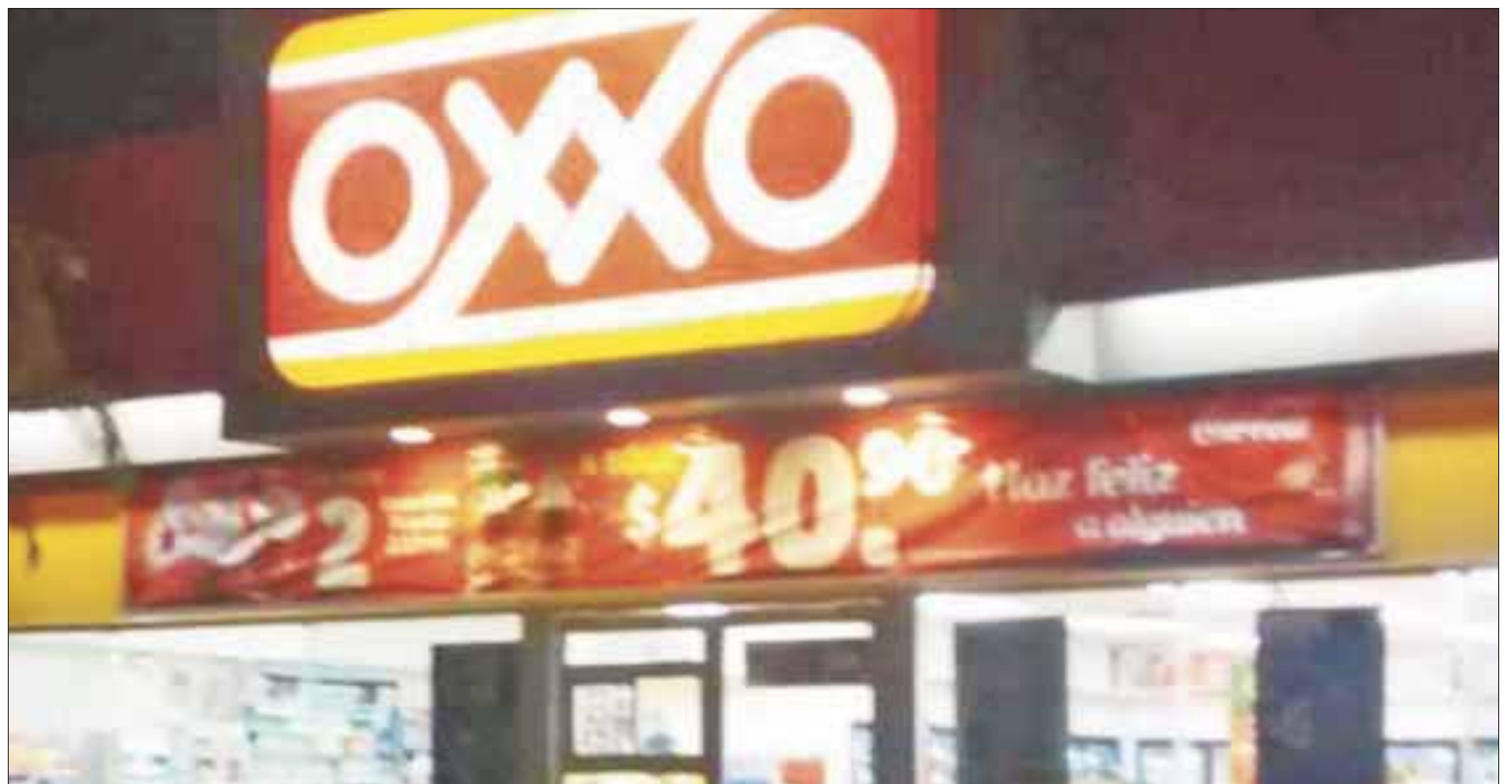
Simularon ser empleados mientras arrancaban el cajero.

El robo fue reportado hasta el momento que los empleados dejaron de escuchar ruidos en el área de ventas y salieron de la bodega, para darse cuenta de la ausencia del cajero automático y los daños provocados por los asaltantes.