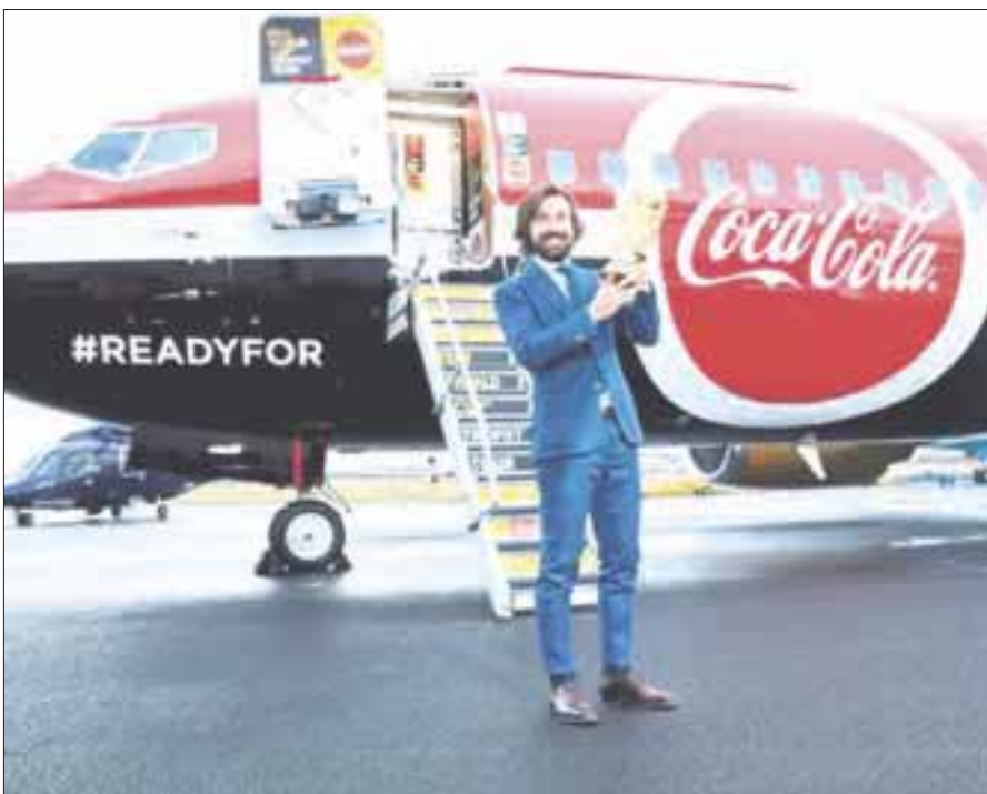
La Copa del Mundo inició su travesía a lo largo de 91 ciudades en 51 países; vendrá a México del 13 al 15 de abril,

La codiciada copa visitará 91 ciudades en 51 países