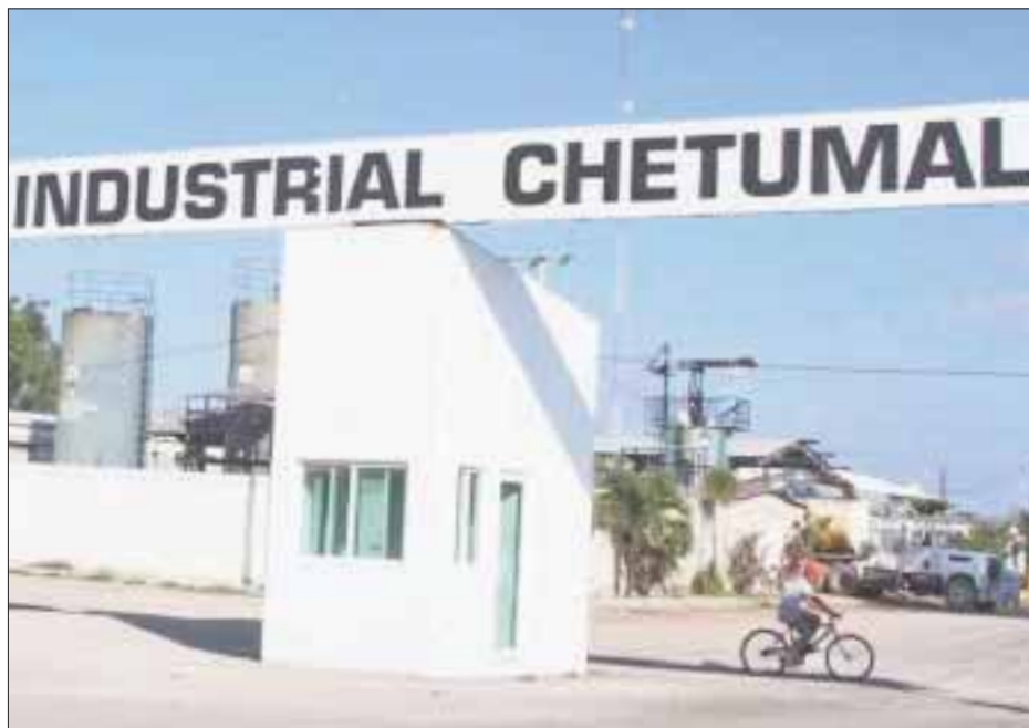
El parque industrial de la capital no tiene fondos para su primera etapa y ha sido aplazado varias veces; los empresarios se quejan.

Chetumal.- El nuevo recinto fiscalizador proyectado en la Zona Sur de Quintana Roo sigue sin ni convencer a los empresarios locales, ya que no hay información sobre el Plan Maestro y mucho menos los incentivos que puedan motivar a invertir en este proyecto gubernamental.