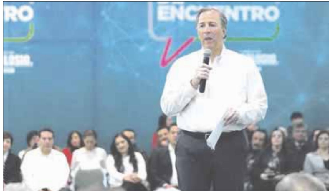
José Antonio Meade participó en el foro sobre Seguridad y Justicia, convocado por la Fundación Colosio.

También propone, igual castigo al que cometa el mismo delito, eso nos permite definirlos igual, investigarlos igual y generar un espacio de mejor efi-