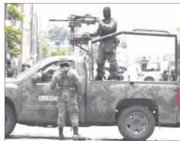
Se han presentado ante la SCJN siete impugnaciones contra la Ley de Seguridad Interior.

La Ley de Seguridad Interior fue promulgada el pasado 21 de diciembre, por lo que ayer lunes 22 de enero concluyó el término de 30 días naturales para presentar las acciones de inconstitucionalidad.