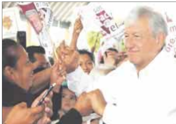
Andrés Manuel López Obrador afirmó que no odia a nadie, en referencia a añejas críticas de Gabriela Cuevas.

El precandidato presidencial de la coalición Juntos Haremos Historia, Andrés Manuel López Obrador, afirmó en su último día de gira por Veracruz, que habrá una candidatura para la senadora Gabriela Cuevas, que el PAN le negó.