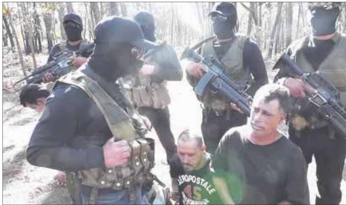
El Cártel Jalisco Nueva Generación (CJNG) expandió sus operaciones en todo el país, señala el diario estadounidense The Wall Street Journal .

Precisa que el Cártel de Jalisco ha estado fortaleciendo agresivamente su red de distribución de drogas ilegales, principalmente metanfetaminas. Su expansión a nuevos estados ha llevado a