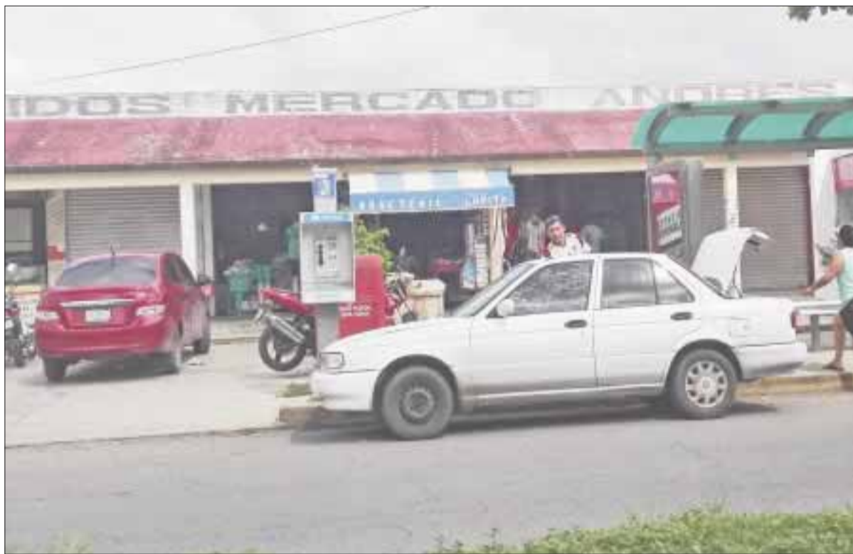
El mercado Andrés Quintana Roo, el más antiguo de la capital, tiende a desaparecer, pues sus iniciales propietarios han bajado sus cortinas, por la competencia desleal, propiciada por el ayuntamiento.

Los problemas de pestilencia continúan, ya que las trampas de grasa no sirven, el drenaje sanitario y el de desperdicios de res, puerco, pescado y pollo, no funcionan bien y esto provoca que se pudran y emanen fétidos olores.