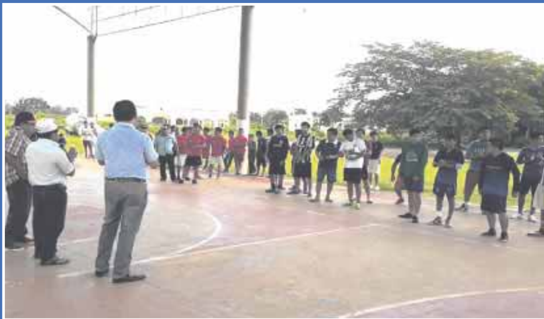
Concluyó el primer torneo de fútbol rápido, donde el equipo 5C se impuso 3-1 a T-Rex, llevándose el título.

De igual forma, se les invitó a seguir participando en la siguiente edición, donde se buscará incrementar el número de equipos y llegar a más comunidades.