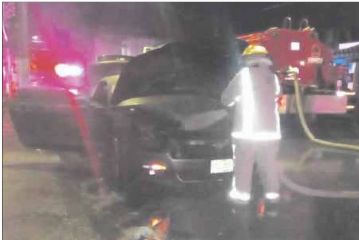
La policía aseguró que los incendios en Chetumal son provocados por un grupo delictivo centroamericano.

Precisó que tiene más de 10 años viviendo en la colonia ubicada a tras de la plaza Las Américas y nunca había sufrido ningún tipo de percance o desavenencia con algún vecino, por lo que pide investigar lo que se ha convertido en el incendio vehicular número 31 ocurrido en extrañas circunstancias y provocado con una bomba Molotov .