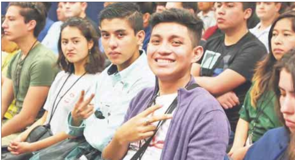
Con representantes de 29 estados del país, se inauguró la XXVII Edición de la Olimpiada Nacional de Biología 2018.

Chetumal.- Con representantes de 29 estados del país, se inauguró la XXVII Edición de la Olimpiada Nacional de Biología 2018, en donde participarán 180 estudiantes de educación media en las instalaciones del Instituto Tecnológico de Chetumal (ITCH) durante cuatro días consecutivos.