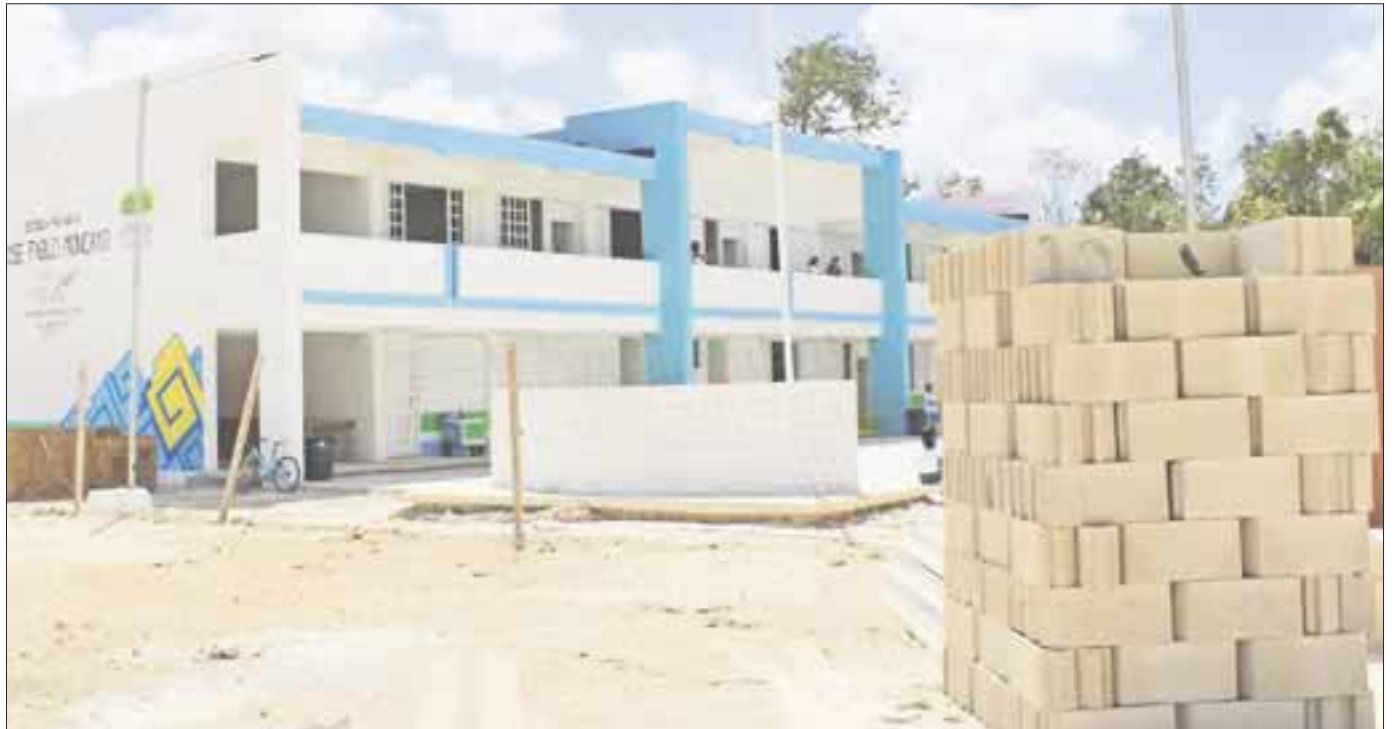
La Coordinación de Planeación y Evaluación de la Secretaría de Educación de Quintana Roo, proyecta para el curso escolar 2018-2019, cuatro nuevos planteles de nueva creación en el municipio de Benito Juárez.

En relación a la construcción de dos secundarias, en Paseos Kabah y la otra ubicada, entre los fraccionamientos Prado Norte y Las Palmas, respectivamente, precisó aún no hay nada definido, ya que está todavía bajo análisis.