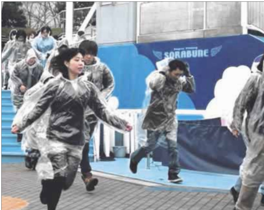
Unas 350 personas participaron en el ejercicio, en el que practicaron cómo evacuar espacios sobre una posible ofensiva.

El gobierno ha realizado simulacros en 25 municipios del país desde marzo de 2017, con el objetivo de garantizar rapidez a la hora de informar a la población y facilitar una evacuación veloz y segura ante los continuos ensayos balísticos de Corea del Norte