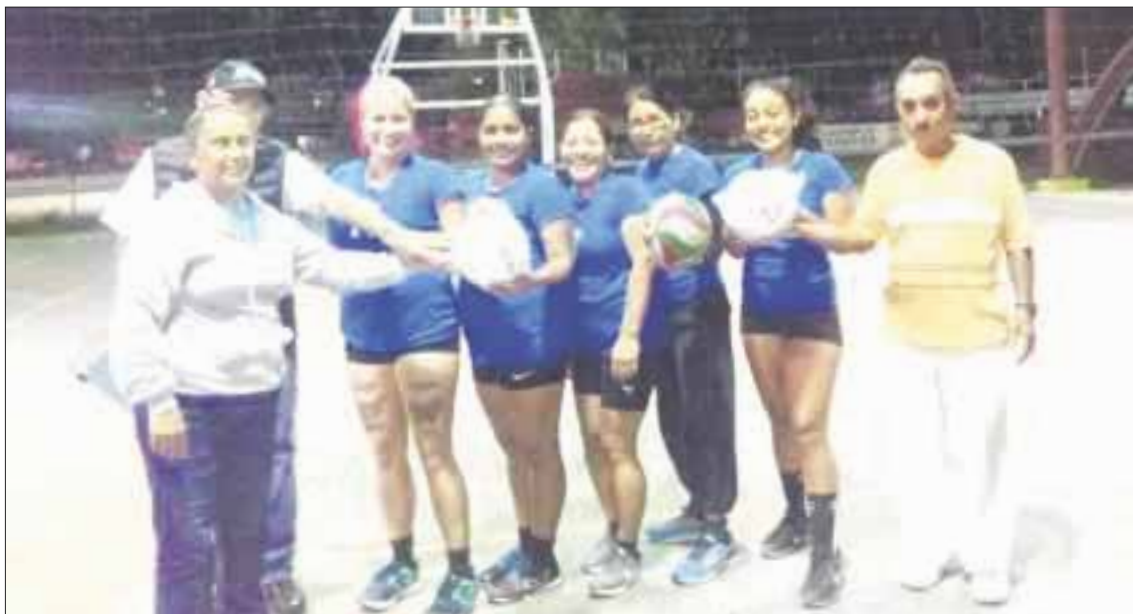
Troyanas se coronaron campeonas del Torneo Sabatino Femenil de Segunda Fuerza de la Región 94.

Cancún.- Luego de haber terminado en primer lugar de la tabla, Troyanas se coronó en el Torneo de Voleibol de Segunda Fuerza de la región 94, no sin antes haber disputado las semifinales y la final ante Sirenas, Venus y Sahoris, quienes fueron los que se clasificaron a las instancias de eliminatoria en el torneo que organiza Isabel Olavarría.