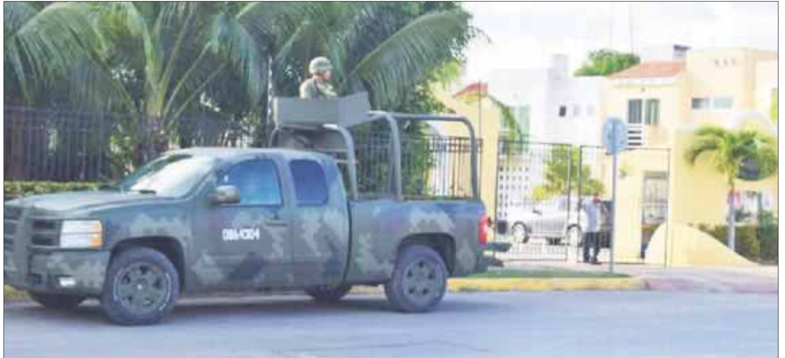
La víctima S.G.B., de 52 años, era originario de Janos, Chihuahua y estaba asignado a una obra cerca del Arco Vial.

Ya en la tarde, ella volvió al domicilio y al entrar encontró a su pareja colgada de la escalera, dando parte de inmediato a un teniente y luego a los paramédicos, que confirmaron la muerte del coronel.