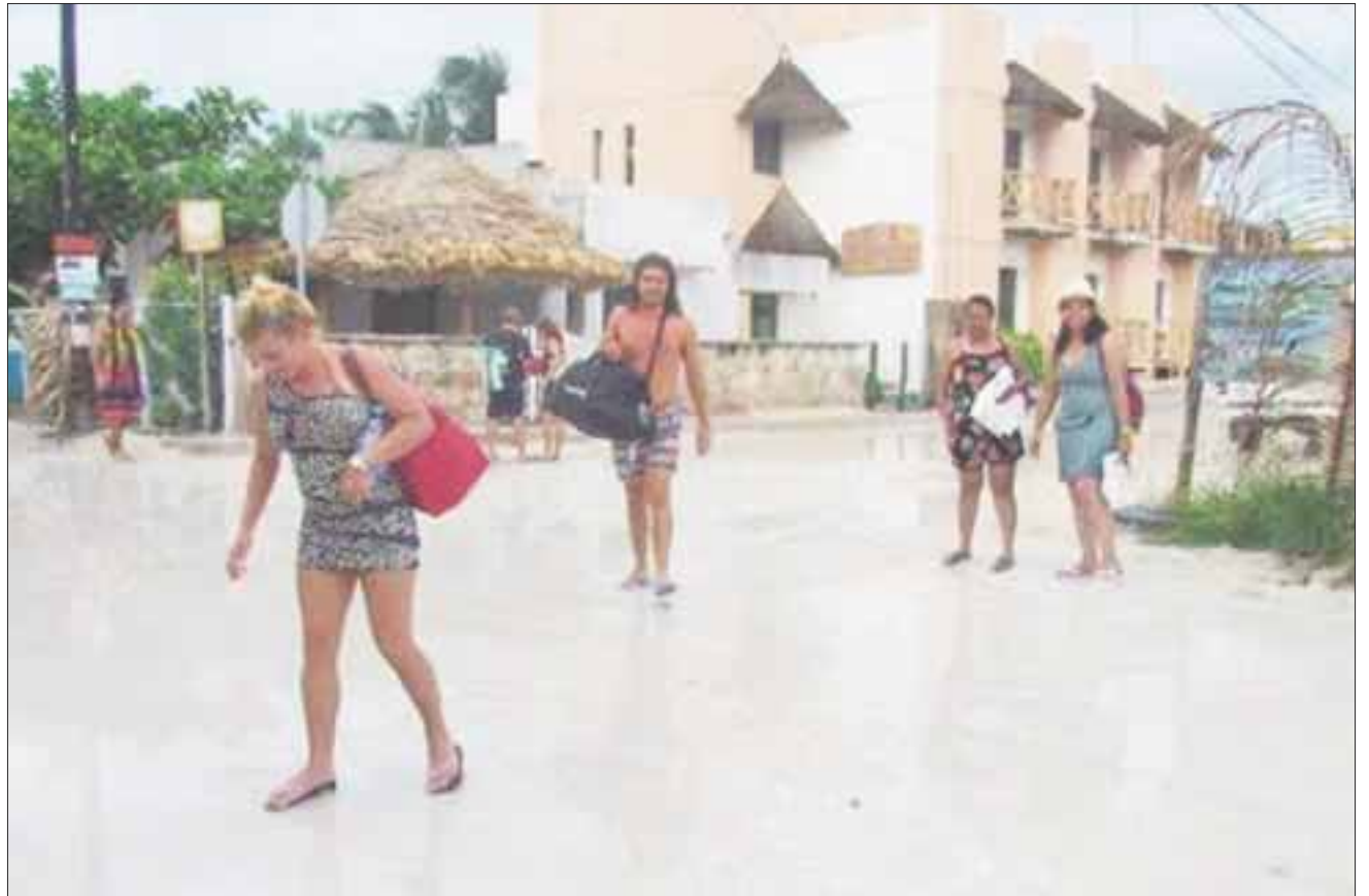
La Isla Holbox se ahoga por enésima vez entre aguas negras en plena celebración del Carnaval.