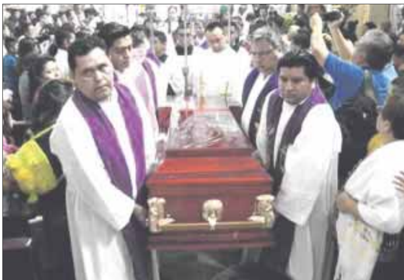
La Iglesia católica exige que las investigaciones del asesinato de los sacerdotes sean objetivas y apegadas conforme a derecho y a la verdad de los hechos.