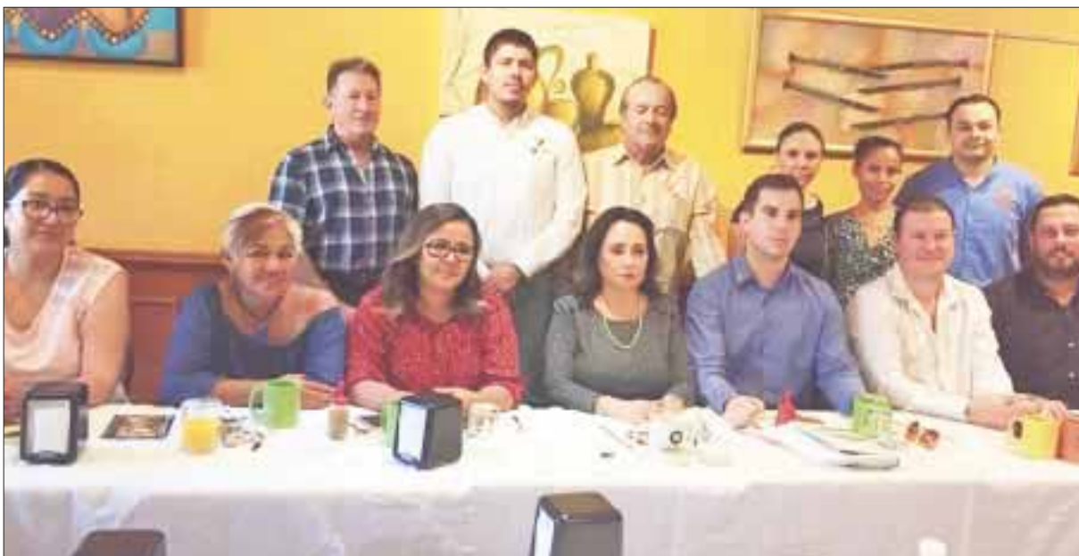
Las demandas laborales en Cancún llevaron a más de un restaurante a la quiebra.