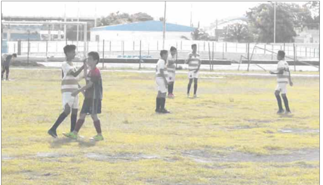
Los jovencitos de Jaguares aplastaron al Club Sesker, que patrocina la Iglesia de la Divina Providencia y ahora deberán enfrentarse a Lobos-Hidalgo de la Uqroo, para pasar a la final.

La otra semifinal la disputarán las escuadras de Tigres de Chetumal contra Leones de Chetumal este 8 de febrero en el campo La Charca a las 17:40 horas.