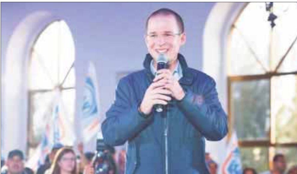
Ricardo Anaya destacó que el Ejército realiza una encomienda compleja.

A las fuerzas armadas le “debemos enorme gratitud” por responder a una tarea que no les corresponde como el combate a la violencia, aseguró el precandidato de la coalición Por México al Frente, Ricardo Anaya Cortés.