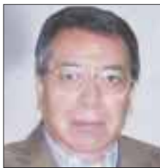
Por Roberto Vizcaino

Jorge Luis Preciado no esconde sus dudas: