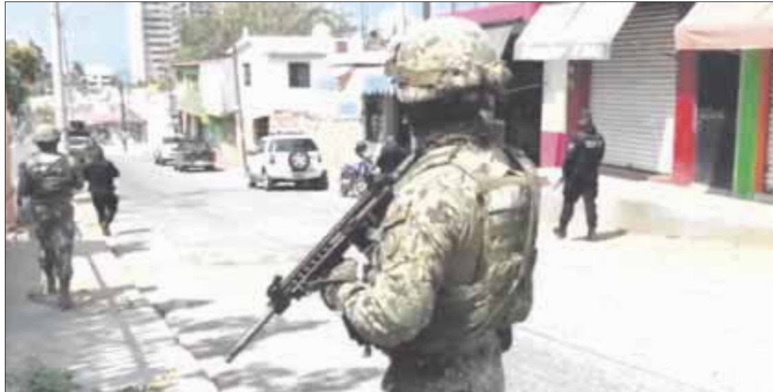
Tecomán, Colima, es el municipio más violento de México, de acuerdo con el estudio del Consejo Ciudadano para la Seguridad Pública y la Justicia Penal.

“El cambio hacia el Pacífico obedece a que fundamentalmente en esta zona se pelean la plaza el Cártel Jalisco Nueva Generación (CJNG) y el Cártel