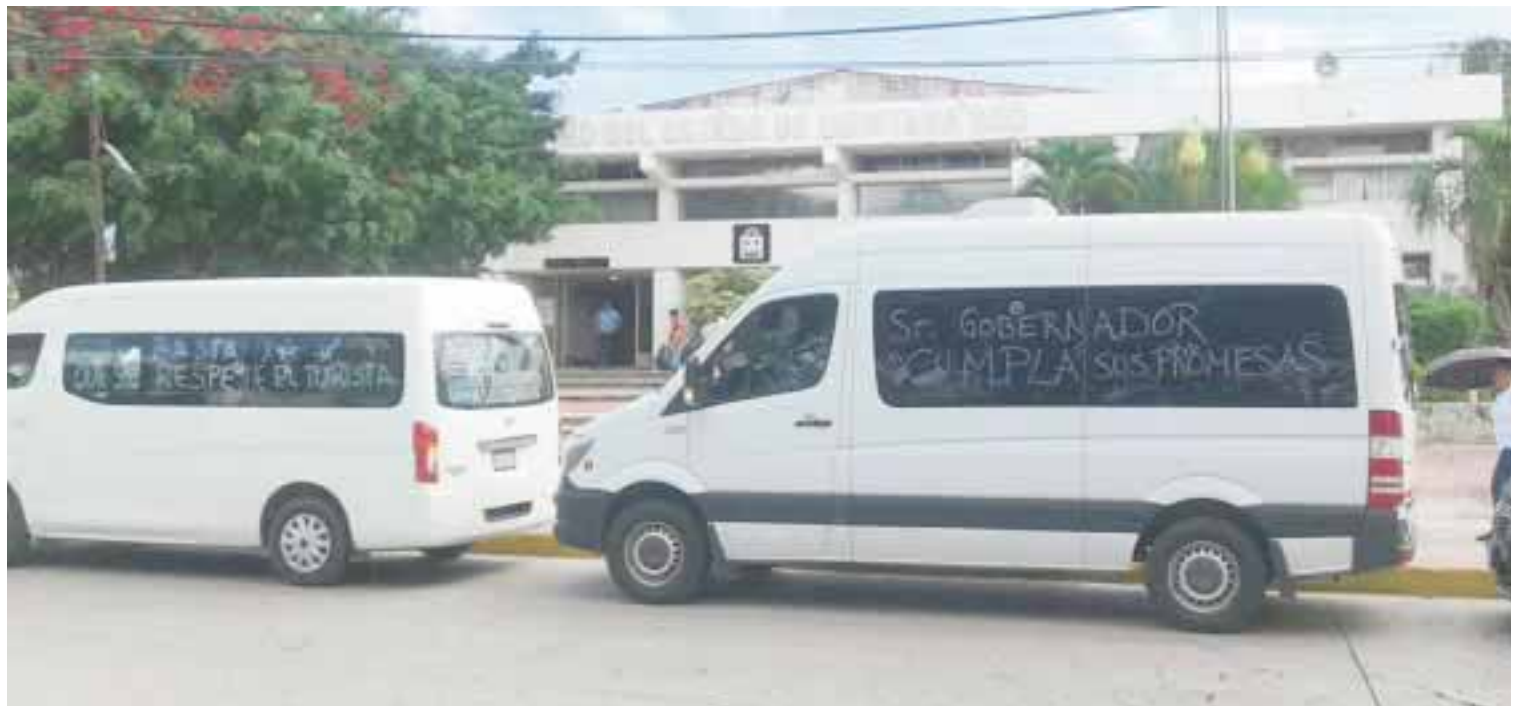
Transportadoras turísticas federales protestaron contra Sintra para exigir se frene la “cacería de brujas”.

Con el proyecto también se sentarán bases para tener una fiscalía con personal calificado, capacitado, con presupuestos suficientes, y con un marco legal que obligue a rendir cuentas