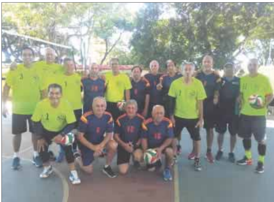
Esta es la suma de experiencia en todo tipo de canchas, del equipo representativo de Quintana Roo, que se alista para los nacionales.

Chetumal.- En los XXVII Juegos Nacionales Deportivos y Culturales que organiza el Instituto Nacional de Personas Adultas Mayores, ya se encuentra listo el selectivo de cachibol para participar del 19 al 23 de marzo en la Ciudad de México, donde esperan refrendar el triunfo obtenido en 2017.