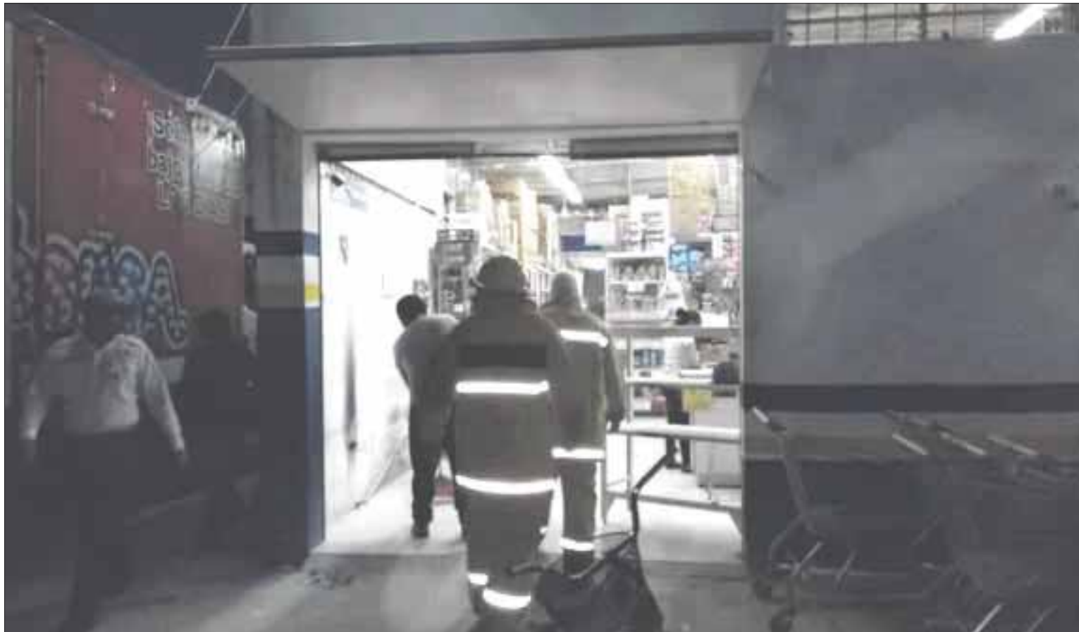
En la tienda Bodegas Baroudi de Mahahual se registró un incendio, al parecer ocasionado por un cortocircuito.

Por fortuna desde el pasado mes de abril de fue instalada la estación de bomberos, lo que permitió la rápida acción de los mismos por su cercanía al lugar de los hechos y se sofocó este incendio sin pérdidas humanas que lamentar.