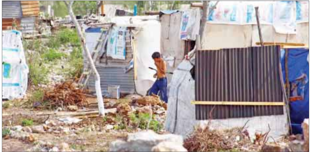
La venta irregular de terrenos para crear asentamientos humanos, se encuentra a la orden del día.

Insistió que la compra-venta continúa creando cinturones de miseria con carencia de todos los servicios públicos, escuelas y centros de salud, que la población sobre lleva ante su necesidad de vivienda, lo que ocasiona que algunos vivan en condiciones paupérrimas.