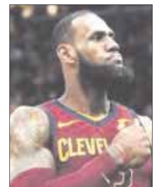
Lebron James gana 85.3 millones de dólares al año

Completan la lista de los cinco más valiosos Russell Westbrook, de Thunder de Oklahoma City, con 47.5 millones, y James Harden, de Rockets de Houston, con 48.3 millones.