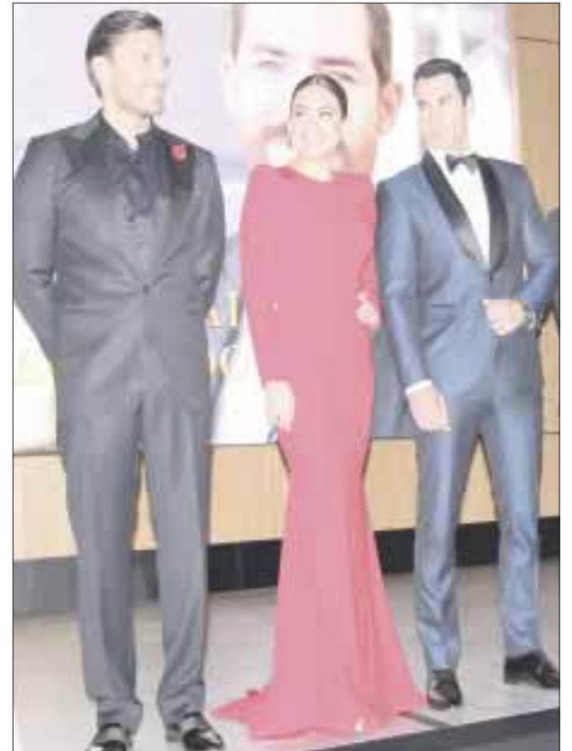
"Por amar sin ley" es el reflejo fiel y más reciente de esta nueva etapa, en la que Televisa y Univisión se presentan al mercado de forma conjunta.

"Amar sin ley" se estrena este lunes 12 de febrero a las 21:30 horas por las estrellas y por Blim , para después llegar a Univisión el 5 de marzo.