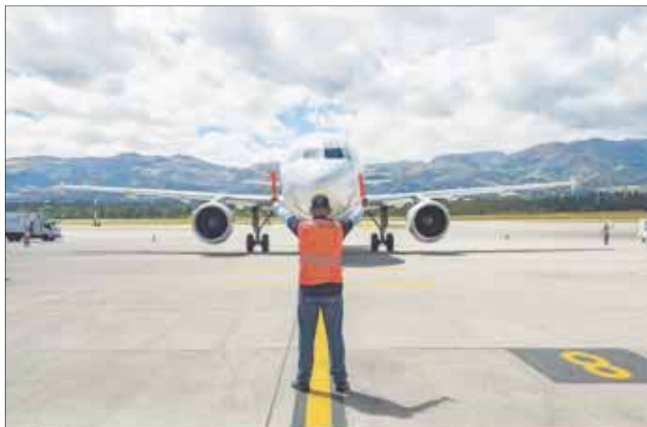
Ecuador ha definido el trabajo en el sector turístico como una política de Estado.