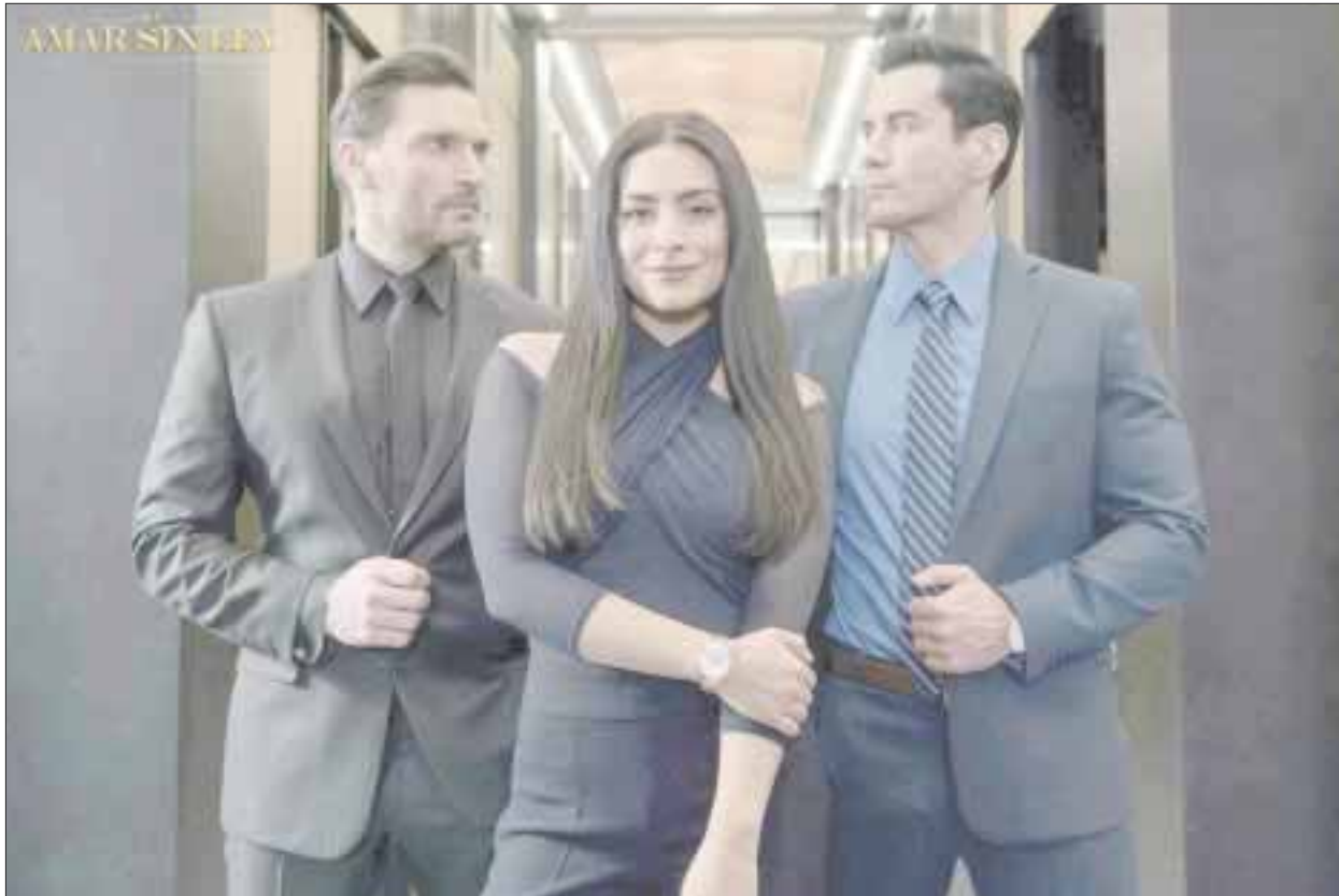
En "Por amar sin ley" también participan José María Torre, Sergio Basáñez, Altair Jarabo, Guillermo García Cantú, Pablo Valentín, Geraldine Bazán, Moisés Arizmendi y Víctor García, así como los primeros actores Azela Robinson, Roberto Ballesteros y Leticia Perdigón.