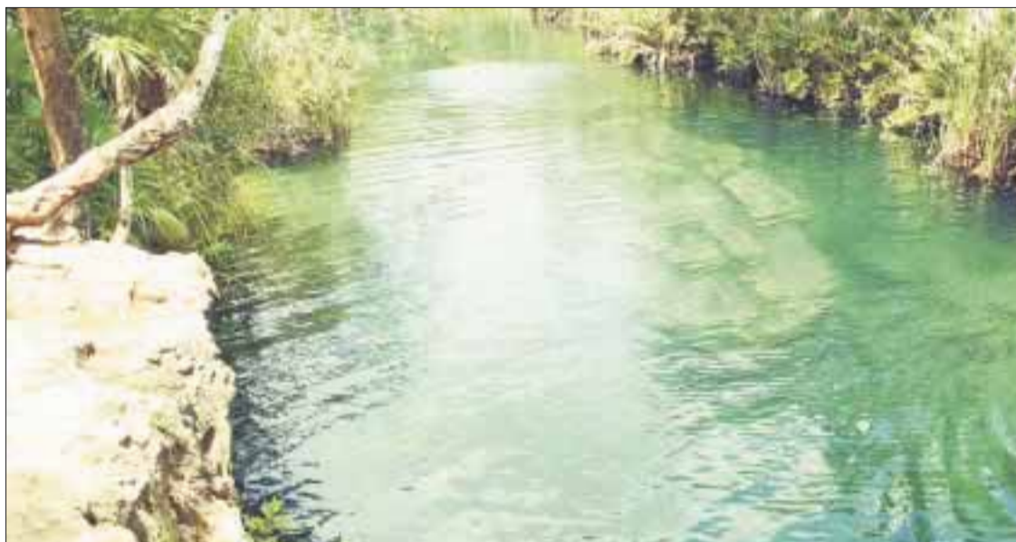
La contaminación de algunos cenotes es una realidad, como sucede con el ubicado debajo del basurero.

El artículo científico sobre la contaminación del agua, fue minimizado por las autoridades de los tres niveles de gobierno y no se han adoptado medidas precautorias para mitigar las causas de la contaminación en el acuífero