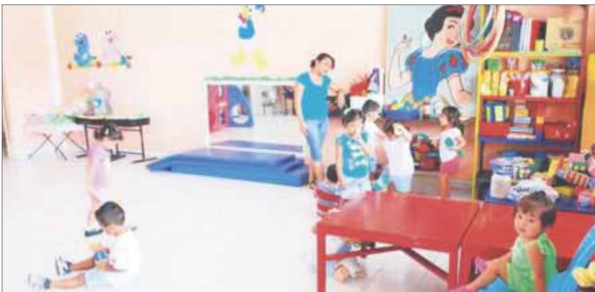
Los alumnos de secundaria de nuevo ingreso al Centro de Atención Múltiple (CAM) de la Región 92, tienen garantizado su ingreso.

Cancún.- Los alumnos de secundaria de nuevo ingreso al Centro de Atención Múltiple (CAM) de la Región 92, tienen garantizado su ingreso, al igual que los egresados de la primaria, los primeros deberán pasar por unos filtros para su inscripción en julio y agosto, según la SEQ.