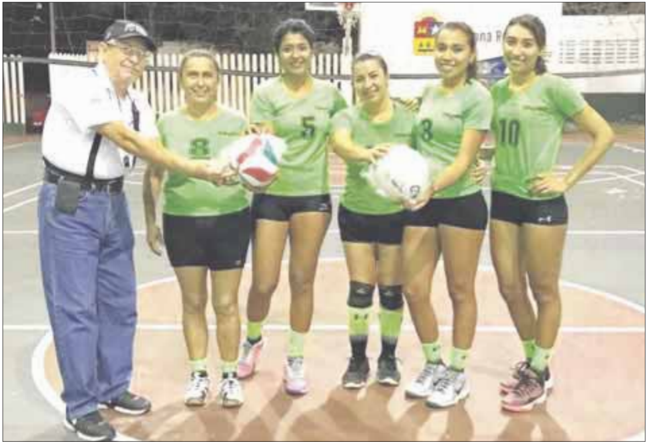
Ángeles fueron las mejores en todo el torneo regular y así lo demostraron en las finales, al llevarse el campeonato.