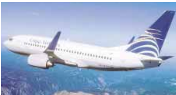
Copa Airlines y Grupo Lufthansa anunciaron un acuerdo para incrementar sus relaciones comerciales.