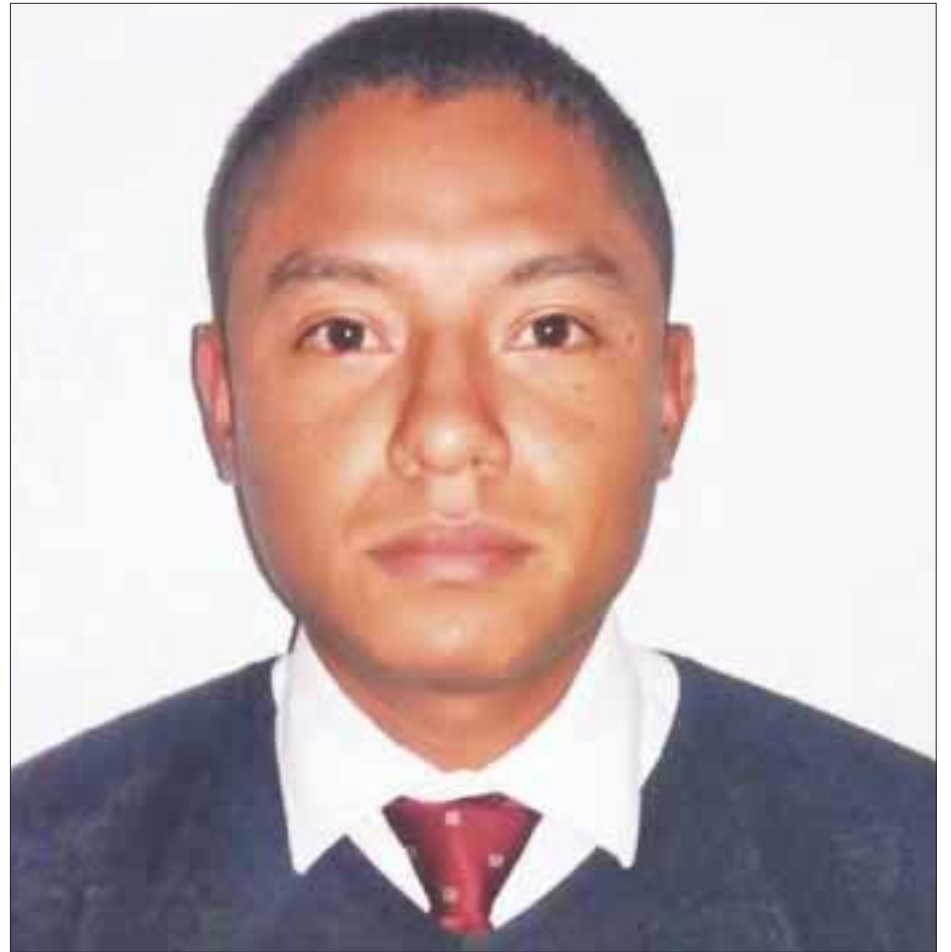
La Fiscalía General del Estado informó que continúa las investigaciones sobre esta ejecución por la que se inició la carpeta de investigación.

Se informó que desde la noche del jueves sus compañeros habían dejado de tener comunicación con el oficial caído