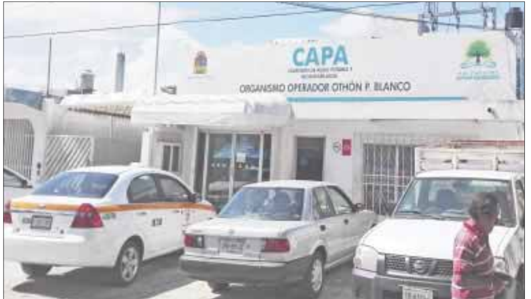
Las suspensiones inintermitentes del servicio de agua potable generaron el abasto irregular y en consecuencia protestas reiteradas de los afectados.

CAPA informó que se concluyeron los trabajos de pozos, tanques de almacenamiento, bombas y red de distribución del vital líquido, para que éste llegue a las casas de manera regular y apta para el consumo humano.