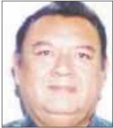
Por Augusto Corro

Terminó la precampaña electoral y tres precandidatos presidenciales independientes se encuentran en condiciones de aparecer en la boleta electoral. Sus posibilidades de ganar son nulas. Participarán en la contienda electoral con la idea de que fue un sueño el intento de alcanzar la victoria.