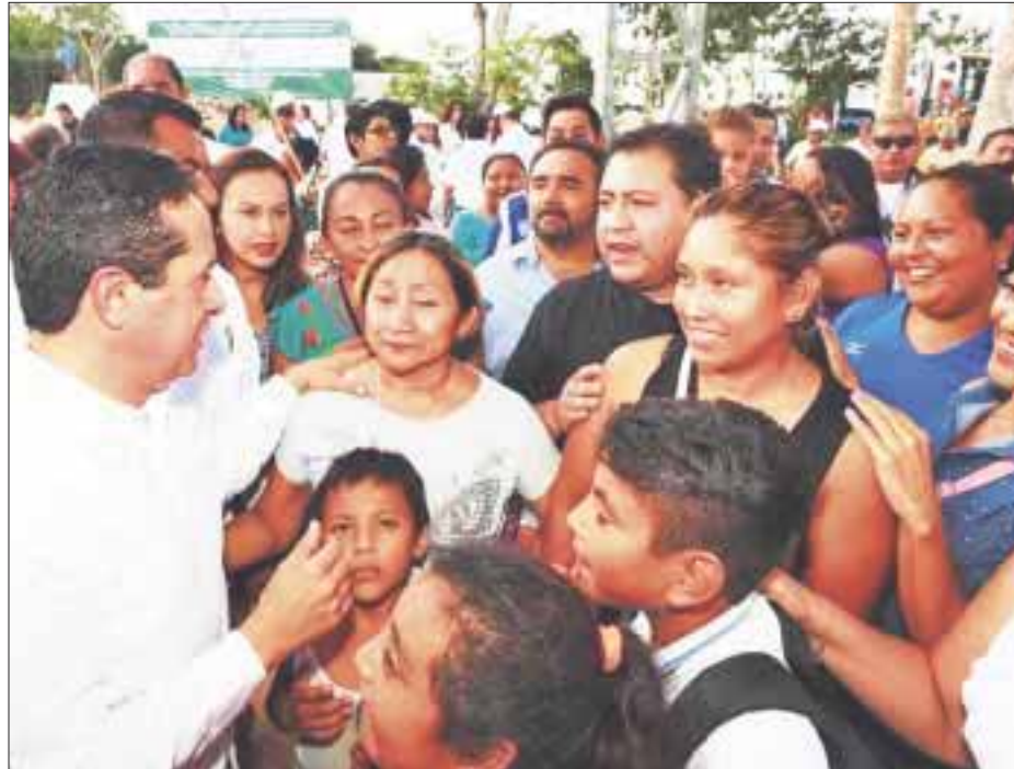
La administración de Carlos Joaquín puso en marcha una línea telefónica para denunciar la corrupción.