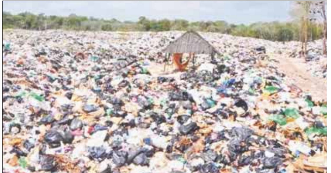
Los basureros son la fuente primaria de filtración de lixiviados, además del desembolso clandestino de aguas residuales.

Finalmente se construyó la planta de tratamiento de aguas residuales. Aparte