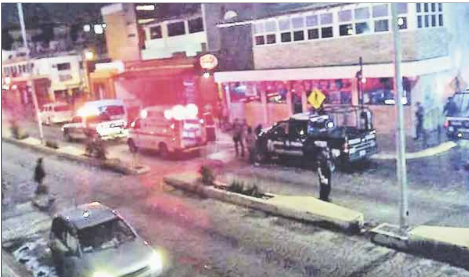
En el operativo participaron entre 10 y 12 patrullas de las fuerzas federales con 20 y 25 elementos, entre policías y peritos de la Unidad Antidrogas de la PF.

Cancún.- A más de 24 horas de que un agente de la Unidad Antidrogas de la Policía Federal fuera encontrado ejecutado en B.J., maniatado, encintado y con el tiro de gracia, sus compañeros realizaron un cateo en el bar "Canta Canta" de la popular Avenida Yaxchilán, en la supermanzana 24, durante la madrugada de este domingo sin que se haya informado el motivo, ni el resultado del operativo.