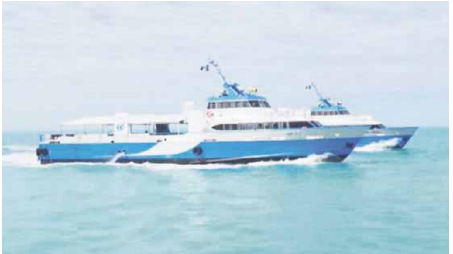
Transporte gratis durante dos días en la ruta Isla Mujeres y viceversa, ofreció la naviera Naveganto.

La naviera Naveganto puso en operación embarcaciones de 50 pies de eslora con una capacidad de hasta 220 personas, en donde ofrece servicio con aire acondicionado y también en la parte de arriba donde el turismo puede disfrutar de la brisa marina.