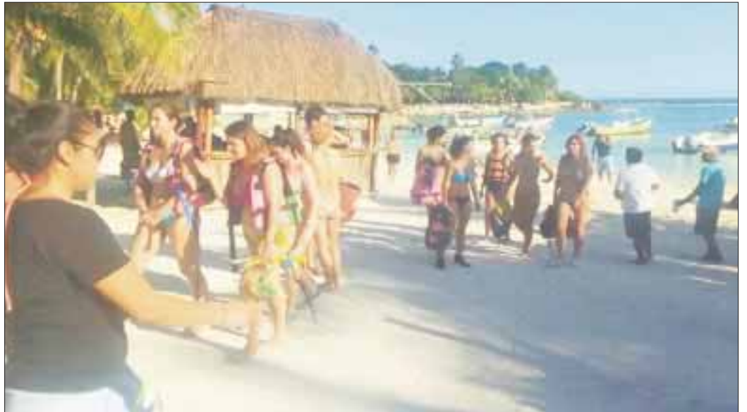
La Profepa retiró del Área Natural Protegida Bahía de Akumal, a más de 750 turistas de la zona de nado libre con tortugas.

De acuerdo con el reporte, durante los días lunes de cada mes, se prohíbe actividades de observación y nado con tortuga marina en la zona de Refugio de especies marinas Bahía de Akumal, conforme a las autorizaciones otorgadas a 30 permisionarios por la Dirección General de Vida Silvestre de la Secretaría del medio Ambiente y recursos Naturales (Semarnat). Se refiere que durante el periodo de inactividad de nado con Tortugas Marinas en la Bahía de Akumal, la Profepa refuerza la vigilancia que se realiza de manera permanente desde junio de 2016, en el Área de Refugio para las especies marinas denominada "Bahía Akumal".