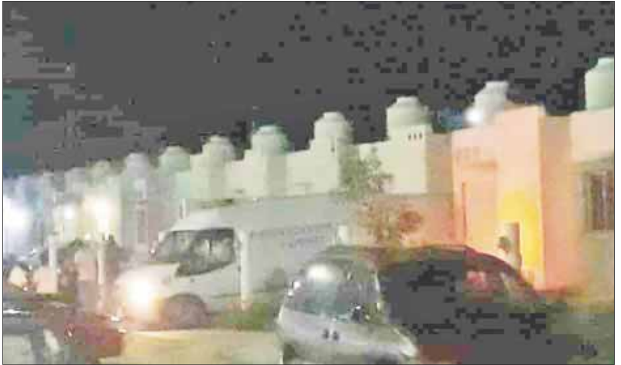
El cuerpo putrefacto de un hombre de 30 años fue hallado en el fraccionamiento Las Américas, en Chetumal.

Es el primer asesinato que se realiza en el 2018 en Chetumal, ciudad que se ha caracterizado por la no existencia de "ajustes de cuentas" entre narcotraficantes, ya que el cadáver hallado según la propia policía, tenía todos los indicios de haber sido torturado y ejecutado.