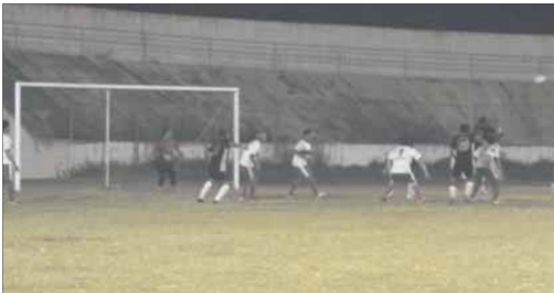
Destroyer se impone a Guerreros de Seguridad Pública, por un abultado marcador de 8-3, en el estadio José López Portillo.

Chetumal.- Intenso partido disputaron en el torneo de apertura Guerreros de Seguridad Pública contra Destroyer, cayendo por un abultado marcador de 8-3, en el estadio José López Portillo, en la liga de veteranos (mayores de 33 años).