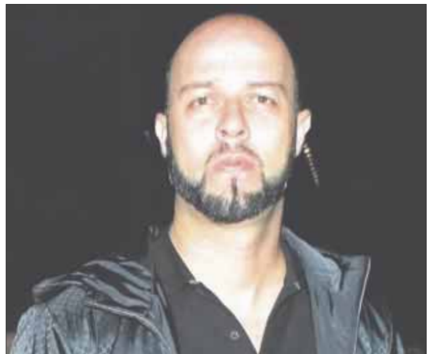
Esteban Loaiza comparecerá este miércoles ante una corte de San Diego, California, para conocer los cargos por posesión de cocaína.

El ex lanzador de las Grandes Ligas fue arrestado el viernes pasado alrededor de las seis de la tarde en un operativo de las autoridades en contra del tráfico de drogas