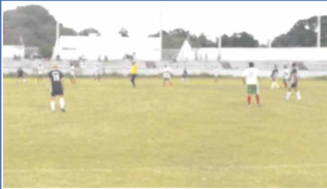
El deportivo Babilonia ganó por 12 goles a uno a Fines Club, en la liga de futbol amateurs Payo Obispo Segunda Fuerza A.

Chetumal.- El deportivo Babilonia sigue avasallador en la liga de futbol amateurs Payo Obispo Segunda Fuerza A y retoma el paso, luego de empatar y ganar el punto extra en la jornada tres, ahora goleó 12 goles por uno a Fines Club.