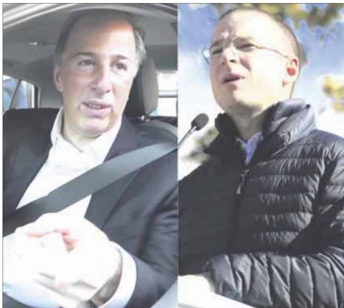
Ricardo Anaya Cortés y José Antonio Meade Kuribreña se encuentran trenzados en una constante refriega por mostrar la veracidad de ese nada honroso segundo lugar.

Aquella ocasión (2006), las protestas fueron muchas, pero a pesar de ello no ocurrió derramamiento de sangre, con todo y el bloqueo que hicieron los inconformes en Paseo de la Reforma, una de las avenidas más em-