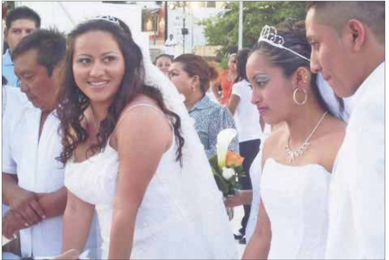
Todo listo para que 265 parejas contraigan matrimonio hoy en la boda colectiva.

En las pláticas prenupciales se incluyó un protocolo consistente en la traducción de una maestra de lenguaje de señas en apoyo a la pareja sordomuda que tomará parte en el acto, lo cual les permitirá formalizar su unión y tener certeza jurídica, fomentando la inclusión y la unión familiar.