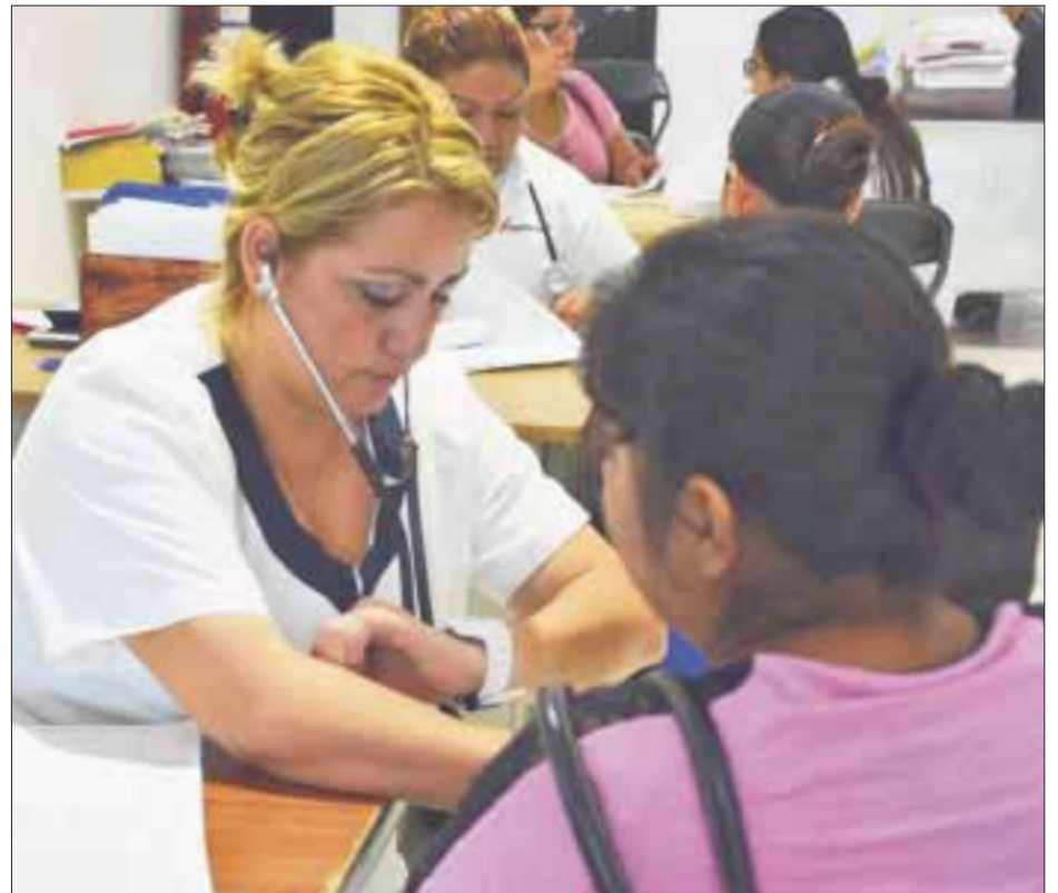
El personal sanitario deberá someterse a las recomendaciones que formule la Comisión de Arbitraje Médico.

Se espera que haya interesados dentro de los profesionales de la salud para cumplir con este ordenamiento legal, ya que es del interés ciudadano contar con dicho organismo