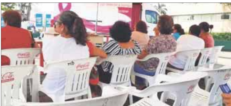
La atención que recibieron alrededor de 60 mujeres, mayores de 40 años, fue "excelente", sobre todo el trato del personal de enfermería.

Chetumal.- Como "excelente" calificaron el servicio de mastografía que otorga el Instituto Mexicano del Seguro Social (IMSS) las pacientes que están dentro del programa preventivo de cáncer de mama y que recibieron atención médica durante esta semana.