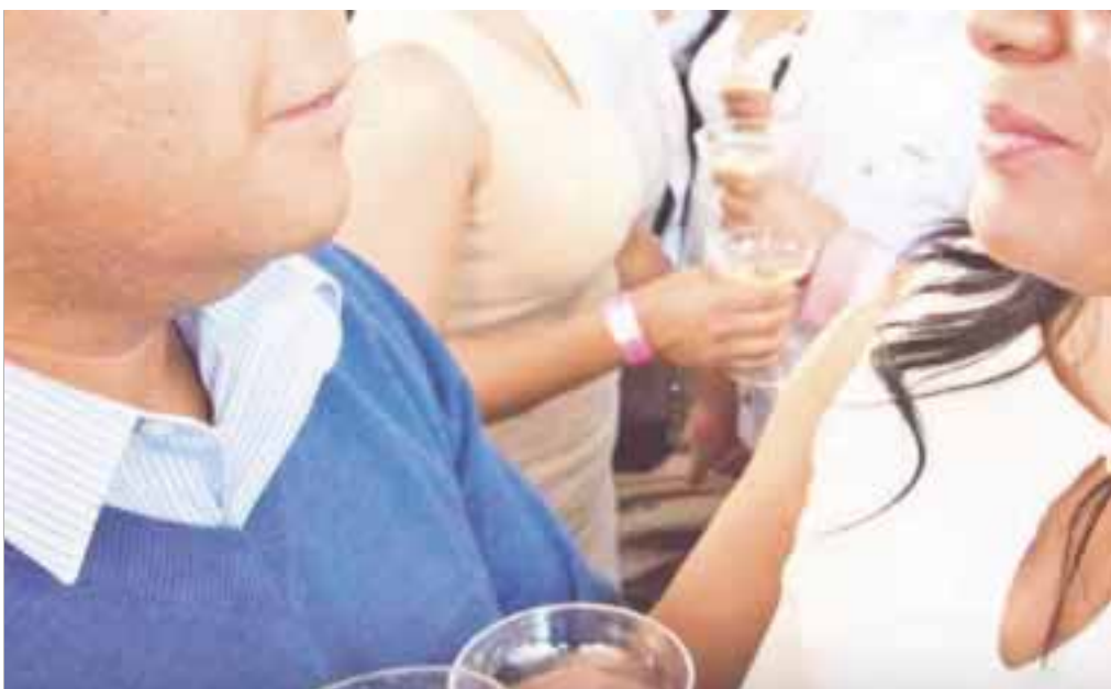
En los tres municipios del sur de Q. Roo habrá nupcias colectivas hoy.

Chetumal.- Aun sin realizarse bodas entre personas del mismo sexo en el sur de la entidad, empero, continuarán los enlaces colectivos entre heterosexuales, organizados por las direcciones del Registro Civil en Otón P. Blanco, Bacalar, José María Morelos y Felipe Carrillo Puerto.