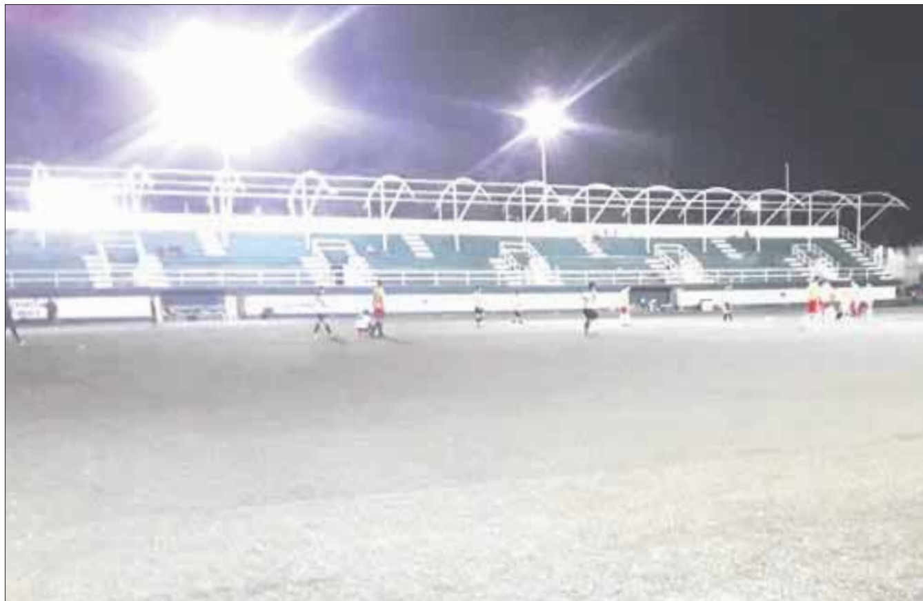
La Unidad Deportiva Bicentenario fue el escenario del triunfo de Caribeños 5-2 sobre San Francisco.