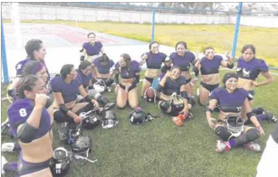
En un partido no apto para cardíacos, Nereidas de Cozumel vencieron en patio ajeno a Beats de la CDMX 45-44.

Las ofensivas marcaron el paso del partido y dieron el triunfo a las isleñas