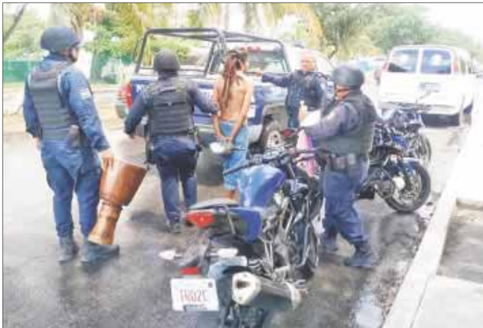
Un acróbata que se gana la vida en los cruceros mostrando rutinas, fue detenido y esposado por la policía, para impedirle su actividad.

Chetumal.- Nuevamente la prepotencia de la policía se hizo evidente al detener a un extranjero que realizaba malabares en el cruce de las avenidas Constituyentes con Insurgentes, para ganarse la vida.