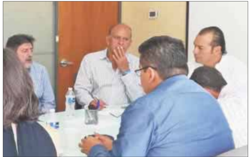
Arrancaron trabajos de coordinación entre la Agepro y el equipo de Andrés Manuel López Obrador para el proyecto Tren Maya.

Este proyecto forma parte del esfuerzo para reorientar nuestras políticas públicas para que sigan llegando inversiones y Quintana Roo se consolide como una de las 5 economías más importantes del país