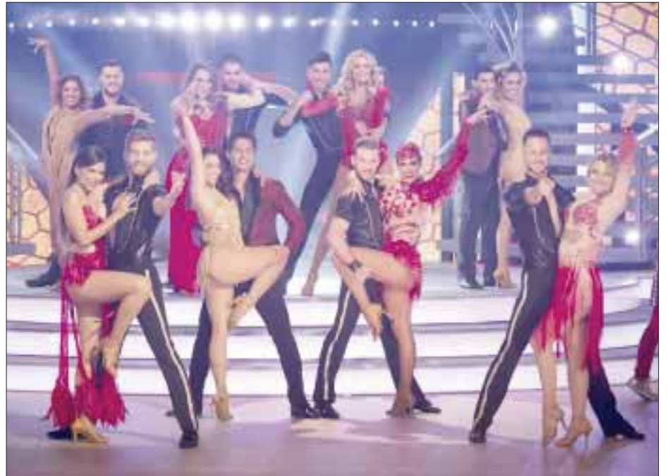
La primera gala de "Mira quién baila", transmitida el domingo 29 de julio por "las estrellas" y otros canales locales de Televisa.

Con $2 millones en premios, refiere que "yo soy de la idea de que las puertas no hay que esperar a que se abran sino ir y hacer algo para abrirlas. De modo que ya estoy buscando oportunidades, y este es el mejor momento, aprovechando este premio invertiré en proyectos que tengo a los que les he estado dando vueltas. Pueden desde pantalla de televisión, cine y hasta en redes. Invertiría en entretenimiento, estoy proponiendo cosas, no me he dado descanso desde que terminó el programa. El premio lo está administrando mi mujer (risas). La idea es invertir en mi carrera, como cineasta, productor y director. Tengo un par de propuestas que estoy analizando", concluyó.