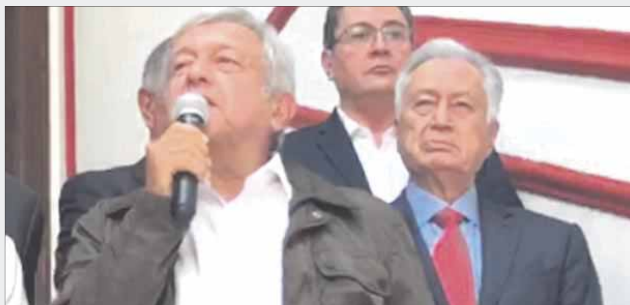
Andrés Manuel López Obrador defendió la propuesta de Manuel Bartlett como director general de la CFE.

Según López Obrador, desde hace algún tiempo existe la intención de dismantelar a la Comisión Federal de Electricidad (CFE). “Hace 20 años éramos autosuficientes en generación de energía eléctrica, la CFE generaba toda la energía que consumíamos; ahora compra la mitad de energía que consumimos y se paga muy caro”.