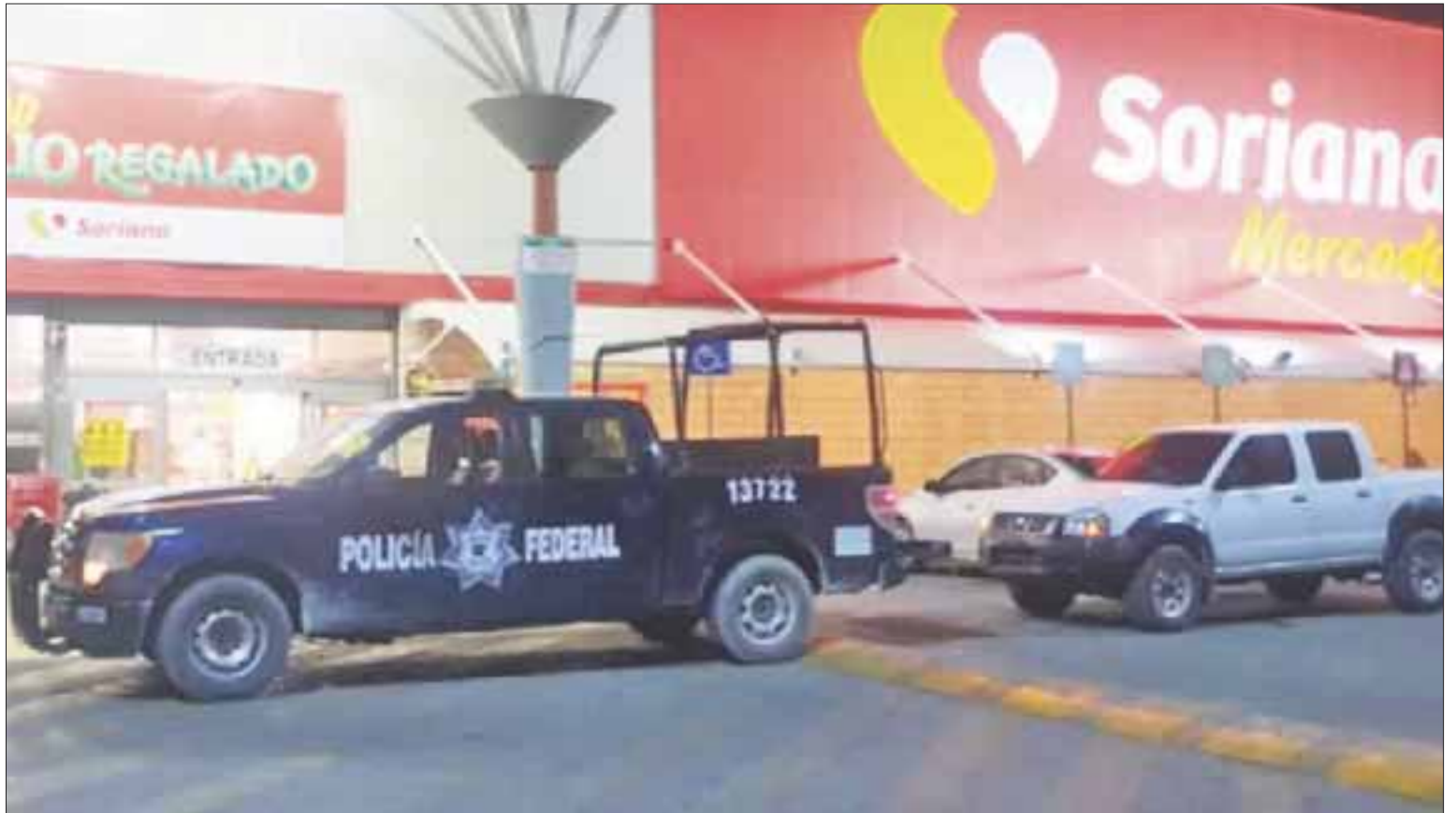
Tres sujetos armados asaltaron el súper Soriana, ubicado en la avenida Talleres de la Región 209.

Los apoderados legales del súper Soriana no habían interpuesto ninguna denuncia por el robo que sufrieron, ni tampoco dieron a conocer el monto de lo sustraídos por los presuntos delincuentes.