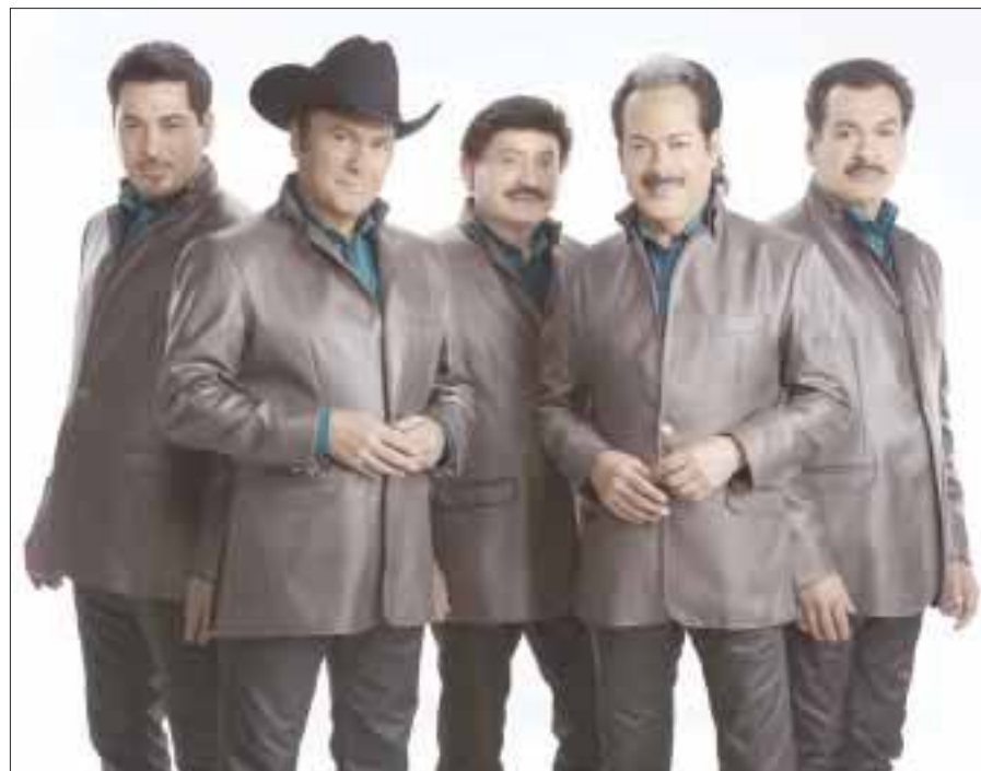
Los Tigres del Norte se presentarán en el palenque de la Feria Nacional Potosina.