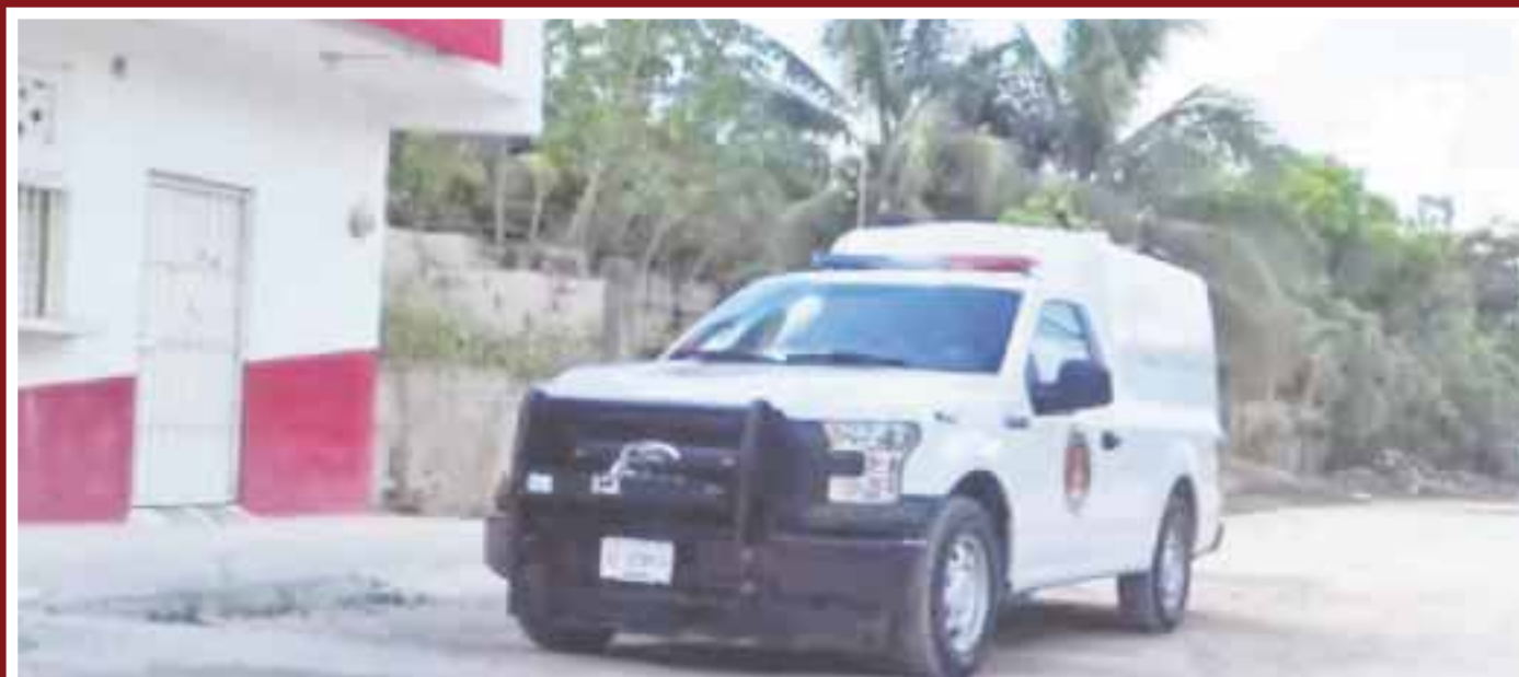
El cuerpo del sujeto no ha sido identificado aún y fue trasladado a las instalaciones del Servicio Médico Forense (Semefo) para la necropsia de ley.