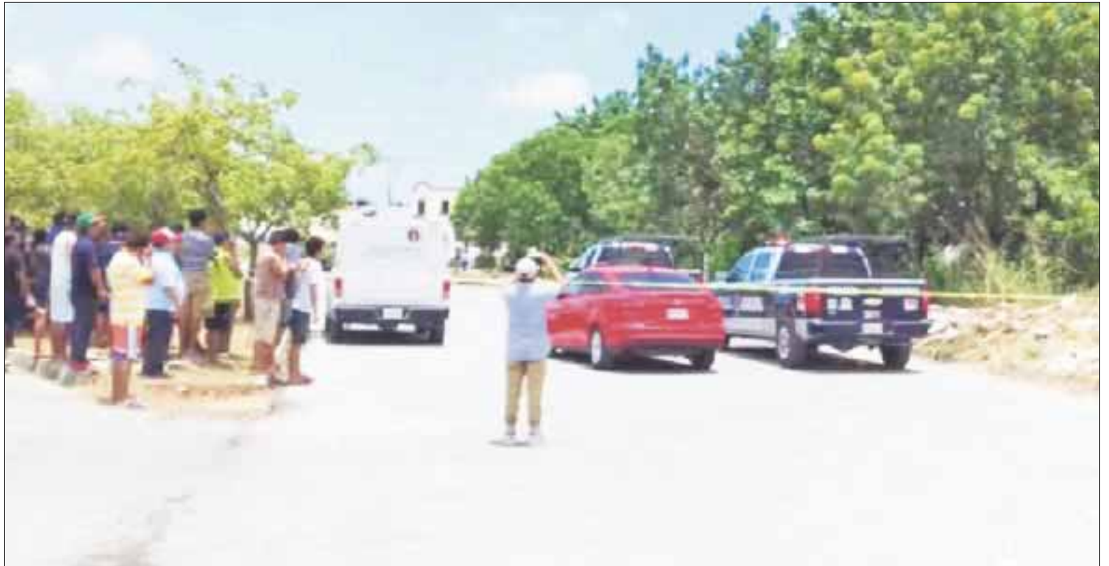
De manera preliminar se informó que el cadáver tenía varios orificios provocados por disparos de arma de fuego.

El ahora occiso, quien no ha sido identificado, vestía una playera sin mangas, de color rojo y un pantalón de vestir, de color café, así como botas negras.