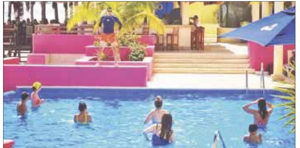
Los tiempos compartidos en Quintana Roo cerraron filas para evitar ser utilizados por defraudadores.

En espectaculares, campañas en la red se pedirá al turista verificar el logo antes de comprar para evitar ser defraudados, en particular se alertará al segmento de adultos mayores o jubilados que son a los que más timan al venderles tiempos compartidos que no lo son.