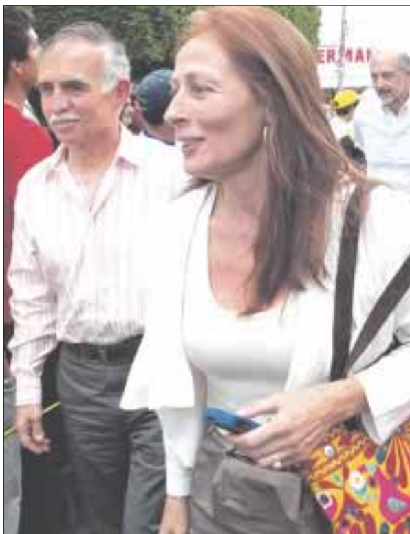
Tatiana Clouthier reconoció que “había mejores opciones” que Manuel Bartlett Díaz para la dirección de la CFE.

“No se acaba el país con el hecho de que una persona no sea bien recibida”