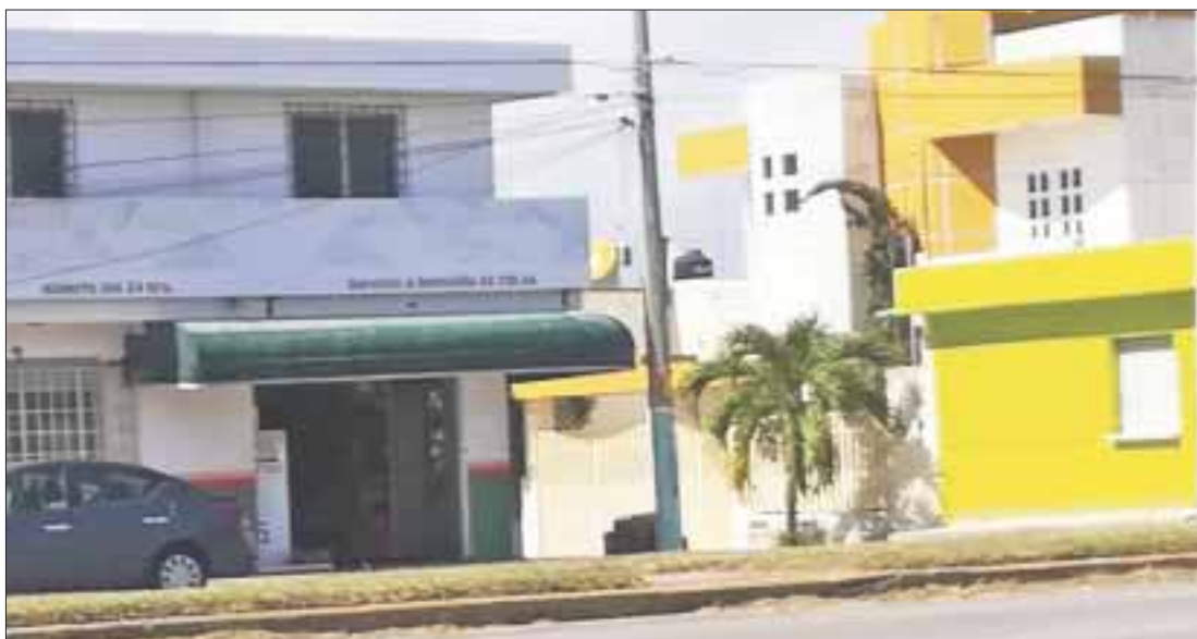
Un solitario ladrón amenazó al encargado del Cervefast en la colonia Del Bosque, con quitarle la vida si no obedecía.

Chetumal.- Un solitario hampón amenazó con un arma de fuego al encargado del Cervefast, ubicado en la calzada Centenario esquina con Pucté de la colonia Del Bosque, para robarle dinero en efectivo, botellas de licor y posteriormente huir a bordo de una motocicleta.