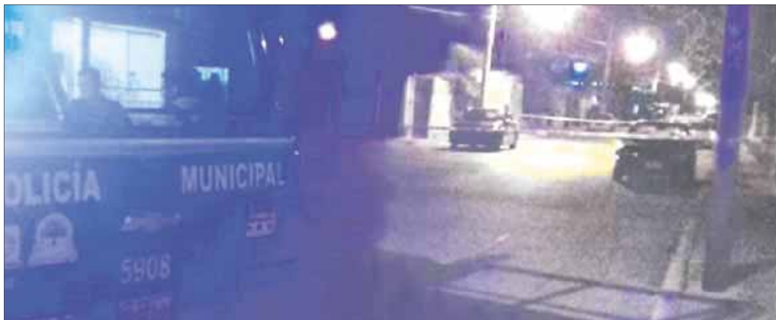
Los agentes ministeriales de la FGE no pudieron hablar con los lesionados, mientras los vecinos del lugar dijeron no haber visto a los agresores.