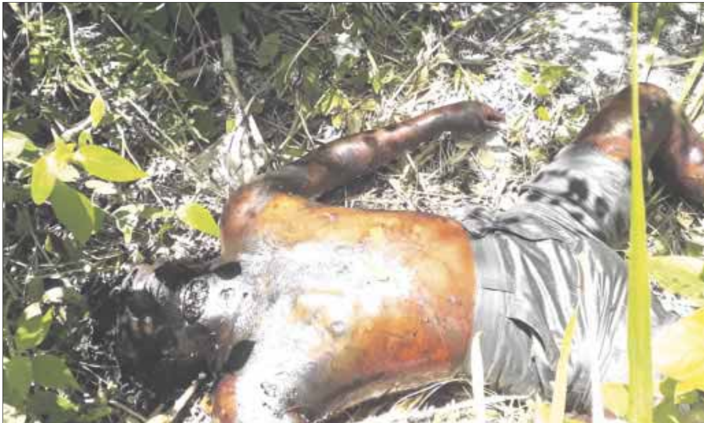
Hallan cadáver de una persona cerca de la zona arqueológica Ixcabaal, en el municipio de Bacalar.

Se calcula que tiene unos 8 días de fallecido