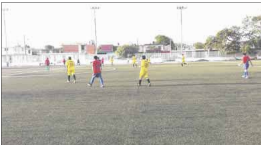
Los jugadores veteranos han lucido su inspiración para jugar al futbol y las nuevas generaciones ahora no quieren perderse ni un partido de estas figuras.

Chetumal.- Lugo de tres jornadas disputadas, el Club Osos Grises lidera la competencia del Torneo de Futbol Soccer de Apertura 2018-2019, al lograr 6 puntos, con dos triunfos y una derrota, anota 16 goles y sólo recibe 3.