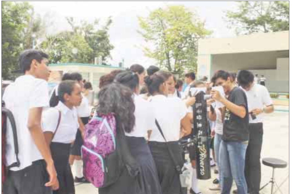
En lucrativo negocio se ha convertido el ingreso a la educación media superior, en donde se escoge con anticipación a los rechazados para estafarlos con un curso de regularización.

“Estamos hablando que de acuerdo a la ética profesional y por cuestiones didácticas, cuando reprobaban más del 50% de un grupo, ¿quién está mal?, los alumnos o el maestro”, sostuvo una madre de familia