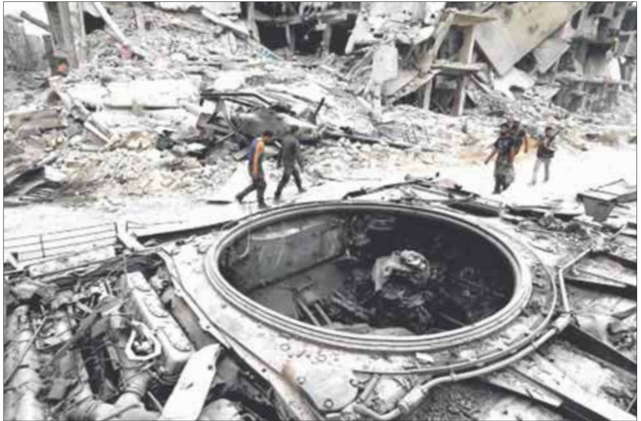
La ONU teme que la reciente ofensiva del régimen sirio en la provincia de Idlib derive en un agravamiento de la guerra.

Con ese aumento, con esta deterioración, unas dos y medio millones de personas podrían ser desplazadas hacia la frontera con Turquía si esto continúa”.