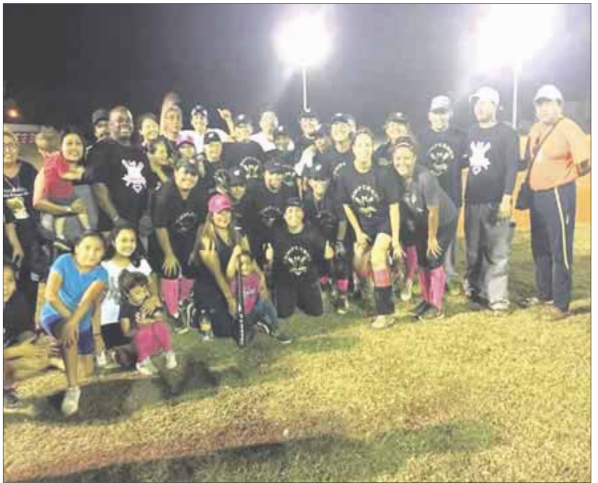
Caribeñas de Chetumal se proclamaron bicampeonas de la Liga Intermunicipal de Softbol Femenil, luego de vencer a Las Fantasmas de Felipe Carrillo Puerto por 10-9.

Con este triunfo, las Caribeñas refrendan su corona y ahora se convierten en las primeras bicampeonas de este torneo.