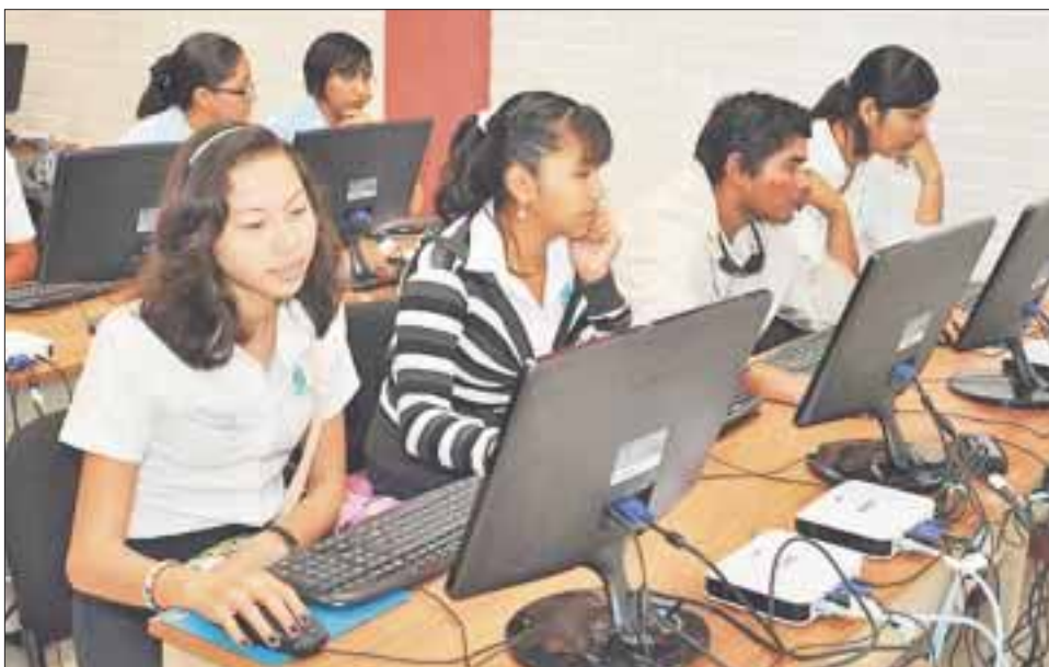
El objetivo de estas acciones es la consolidación del nuevo modelo educativo.

Ciudad de México.- El gobierno del estado, a través de la Secretaría de Educación de Quintana Roo, participa e impulsa activamente las estrategias que desde la Secretaría de Educación Pública, se promueven para fortalecer al nivel medio superior, con la finalidad de que, en su tránsito al nivel superior, los estudiantes cuenten con una educación de calidad para una mejor preparación profesional que les sirva toda la vida.