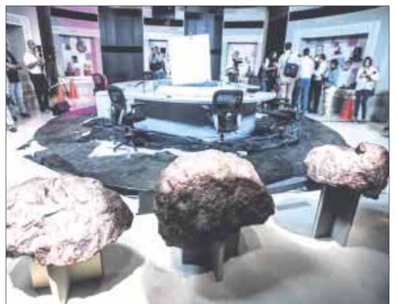
Se tienen acreditados a 146 medios de comunicación nacionales y extranjeros, encargados de cubrir el tercer y último debate.

Benito Nacif explicó que los moderadores podrán hacer las preguntas con entera libertad; los dos criterios fundamentales, claves para la formulación de las preguntas, es que sean relevantes para la audiencia, provoquen una discusión entre los candidatos y sean atractivas para los ciudadanos que escuchen el debate en vivo, por televisión, radio o YouTube.