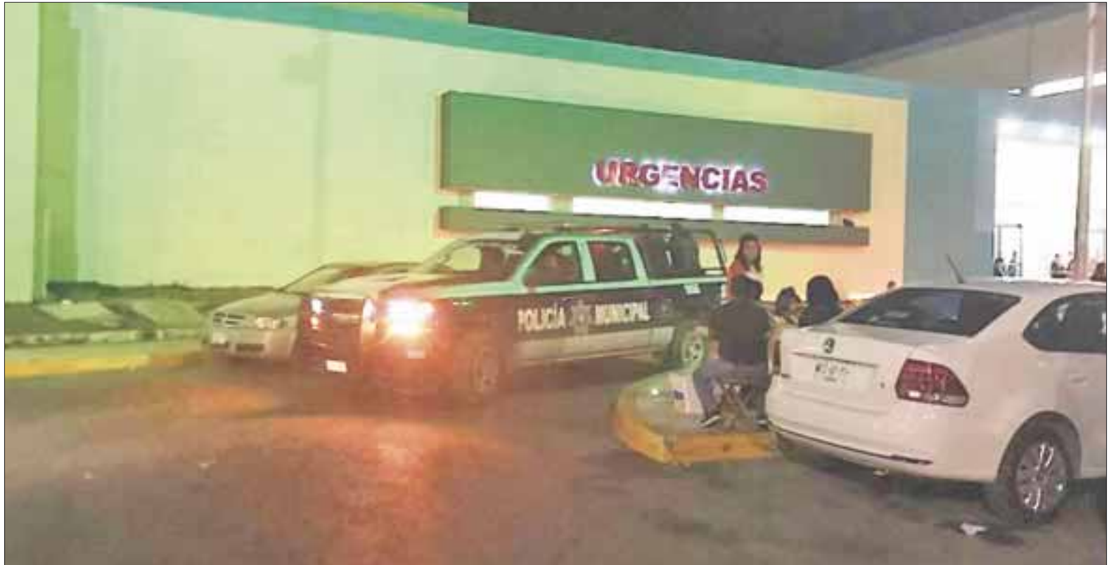
Padre e hijo fueron atacados a balazos por sujetos que se desplazaban a bordo de una motocicleta en la Región 247.

Las autoridades acordonaron la zona y peritos de la Fiscalía General del Estado realizaron las diligencias de ley.