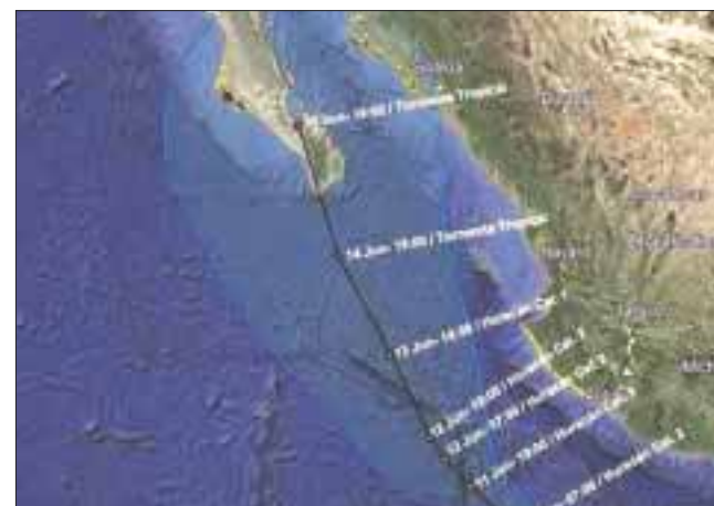
El huracán “Bud” continuará intensificándose y desplazándose hacia el oeste-noroeste, paralelo a la costa mexicana.

Las autoridades navales hacen un llamado a la comunidad marítima portuaria a evitar hacerse a la mar e informaron que el puerto de Lázaro Cárdenas, Michoacán, se encuentra cerrado a la navegación para embarcaciones mayores y menores. Los puertos de San Carlos, Baja California Sur; Manzanillo, Colima; Acapulco, Zihuatanejo y Puerto Marqués, Guerrero, están cerrados para la navegación de embarcaciones menores.