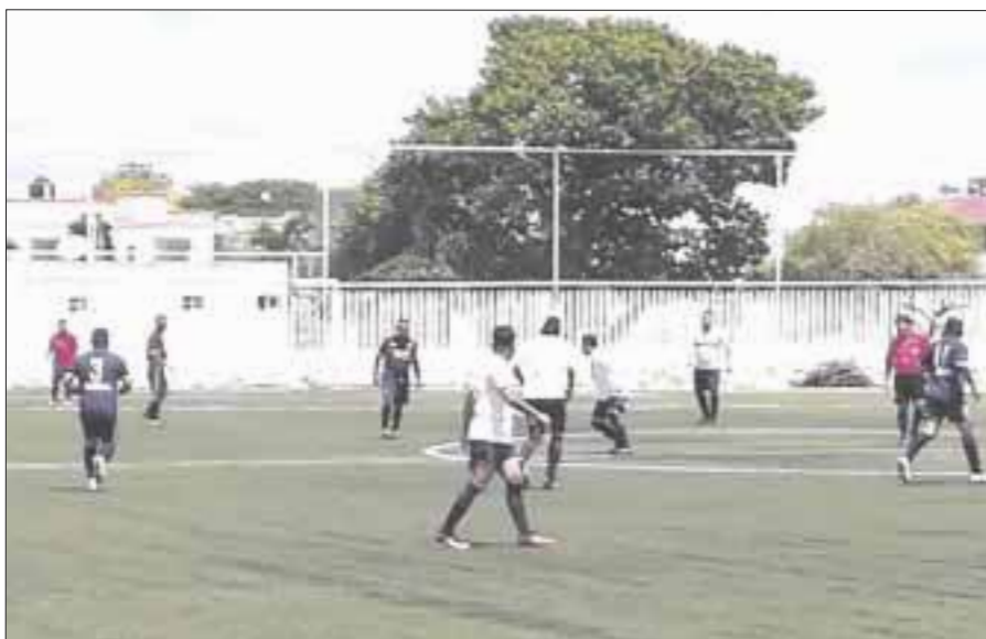
Deportivo Capa se afianza como líder con 17 puntos, producto de cinco victorias y dos derrotas, seguido del campeón Real Fovissste con 17 unidades.

Chetumal.- Luego de siete partidos disputados, con dos pendientes por jugar, en el cierre de la jornada nueve de la Liga Sabatina de Futbol de Veteranos de OPB, el Deportivo Capa se afianza como líder con 17 puntos, producto de cinco victorias y dos derrotas, seguido del campeón Real Fovissste con 17 unidades.