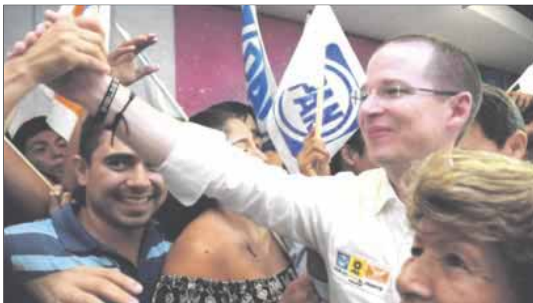
Ricardo Anaya Cortés calificó a José Antonio Meade Kuribreña como “cínico, corrupto y mosca muerta”.

Ricardo Anaya Cortés, candidato presidencial de la coalición “Por México al Frente”, calificó a José Antonio Meade Kuribreña como cínico, corrupto y mosca muerta, tras ser calificado de “vulgar ladrón”.