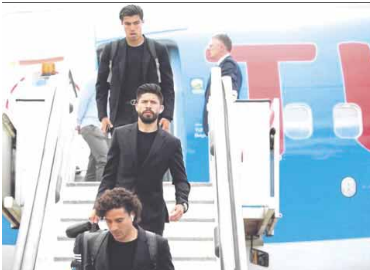
La Selección Mexicana aterrizó en la ciudad de Moscú, donde el domingo jugará ante Alemania el primer partido del Mundial de Rusia 2018.

Debuta en el Mundial 2018 ante Alemania, este domingo