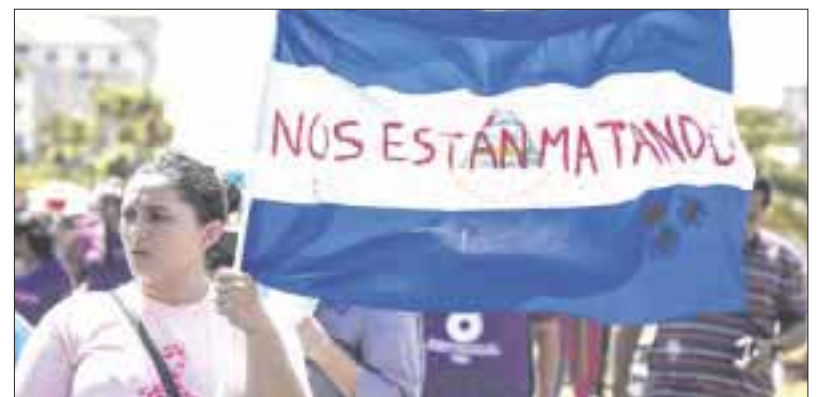
American Airlines canceló ayer lunes sus vuelos a Nicaragua por ‘disturbios civiles’.

Las protestas contra Ortega y su esposa, la vicepresidenta Rosario Murillo, comenzaron el 18 de abril pasado por unas fallidas reformas a la seguridad social y se convirtieron en una exigencia de renuncia, después de once años en el poder, con acusaciones de abuso y corrupción.