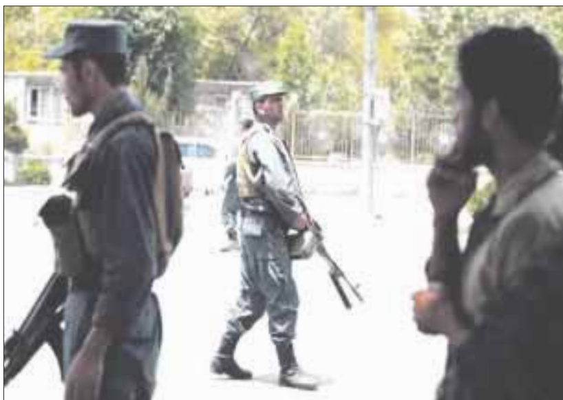
Un atacante suicida hizo estallar su chaleco explosivo en la puerta del Ministerio de Rehabilitación y Desarrollo Rural en Kabul.

Al menos 12 personas murieron y otras 31 resultaron heridas ayer lunes durante un atentado suicida en la entrada del edificio del Ministerio de Rehabilitación y Desarrollo Rural en Kabul, un día antes de la entrada en vigor de un cese al fuego de una semana con motivo del fin del Ramadán.