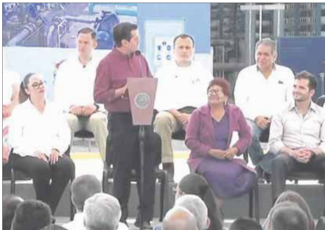
Enrique Peña Nieto entregó la planta desaladora de agua en Ensenada, que constituye el compromiso de gobierno 127.

De igual manera, destacó que se alcanzó una cobertura de 63 por ciento en el tratamiento de aguas residuales, y que en fecha reciente, se decretaron 13 reservas de agua, lo que garantiza a largo plazo un equilibrio entre explotación y conservación de recursos naturales.