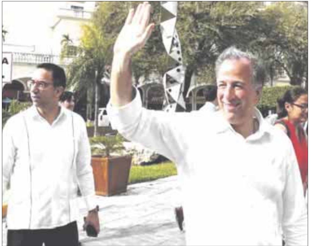
José Antonio Meade asistió al Gran Museo del Mundo Maya, al ensayo del tercer y último debate presidencial.

Micro, pequeños, medianos y grandes empresarios de distintos rubros expresaron su apoyo al candidato del PRI, por su experiencia preparación y honestidad.