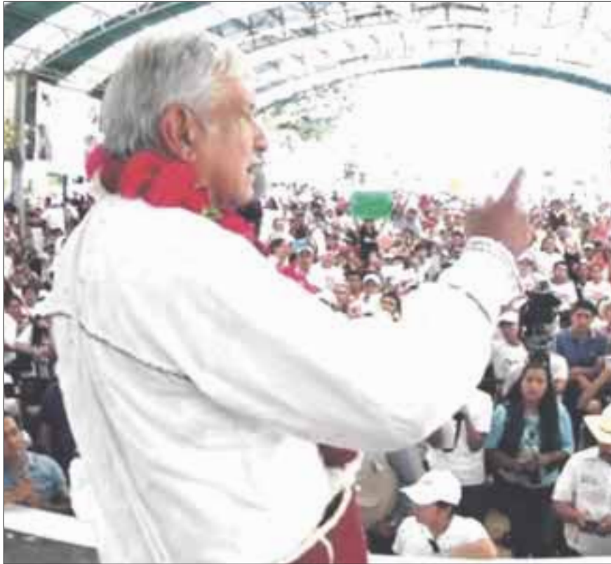
Andrés Manuel López Obrador consideró como normal los apasionamientos entre contendientes en el último tramo de la campaña.

Afirma que ya no se puede seguir engañando a la gente