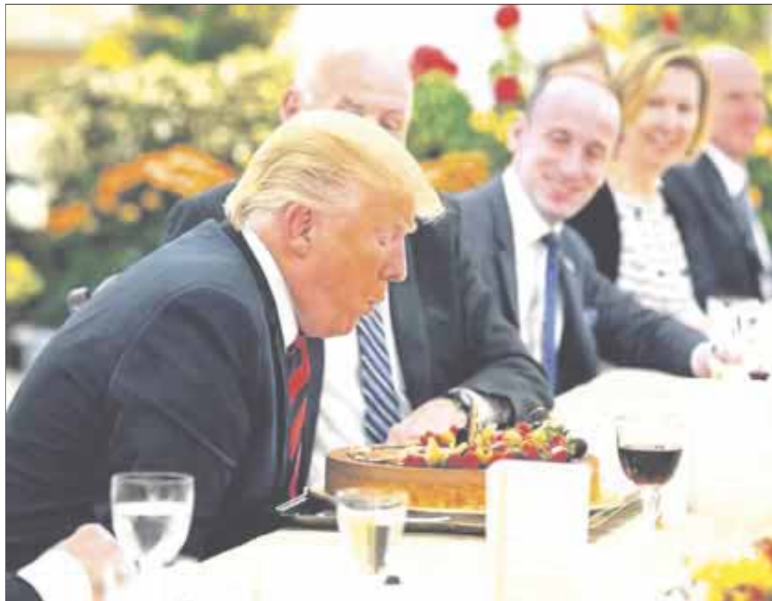
Donald Trump expresó su ira en tuits contra algunos de los aliados más cercanos de Washington en la OTAN, luego de una áspera reunión del G7.

bueno) con grandes pérdidas financieras, y luego somos golpeados injustamente en el comercio. ¡Se acerca un cambio!”.