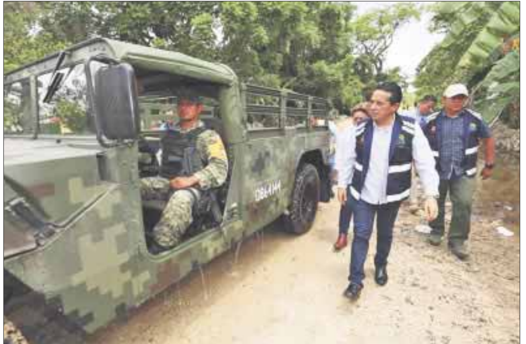
Los daños a las pertenencias de los habitantes de las zonas rurales fueron totales, por lo que el Ejército inició el Plan DN-III.

La Secretaría de Salud, mediante la Jurisdicción sanitaria número 3, por parte de Vigilancia Epidemiológica cuenta con personal médico, de enfermería, psicólogo y promotor de la salud, así como material y equipo suficiente para atender la emergencia.