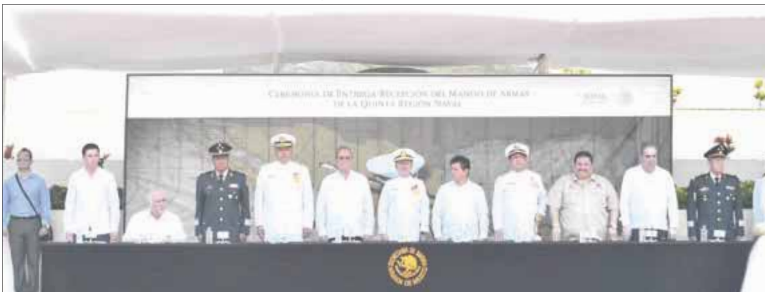
El vicealmirante Francisco Limas López asumió el mando de la Quinta Región Naval, que entregó Jesús Herminio Pacheco Durán, ante la presencia de autoridades navales y de gobierno.

Cancún.- El vicealmirante Francisco Limas López asumió el mando de la Quinta Región Naval, que entregó el vicealmirante Jesús Herminio Pacheco Durán, ante la presencia de autoridades navales y de gobierno.