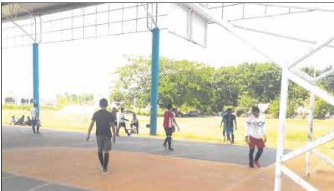
Halcones se consolidó como líder del Torneo de Futbol Rápido, al llegar a ocho unidades.

José María Morelos.- El equipo Halcones se consolidó como líder del Torneo de Futbol Rápido, al llegar a ocho unidades, producto de dos triunfos y un empate, así como ganar un punto extra por la vía de los penales, siendo el equipo con mayor número de anotaciones, con 21 goles.