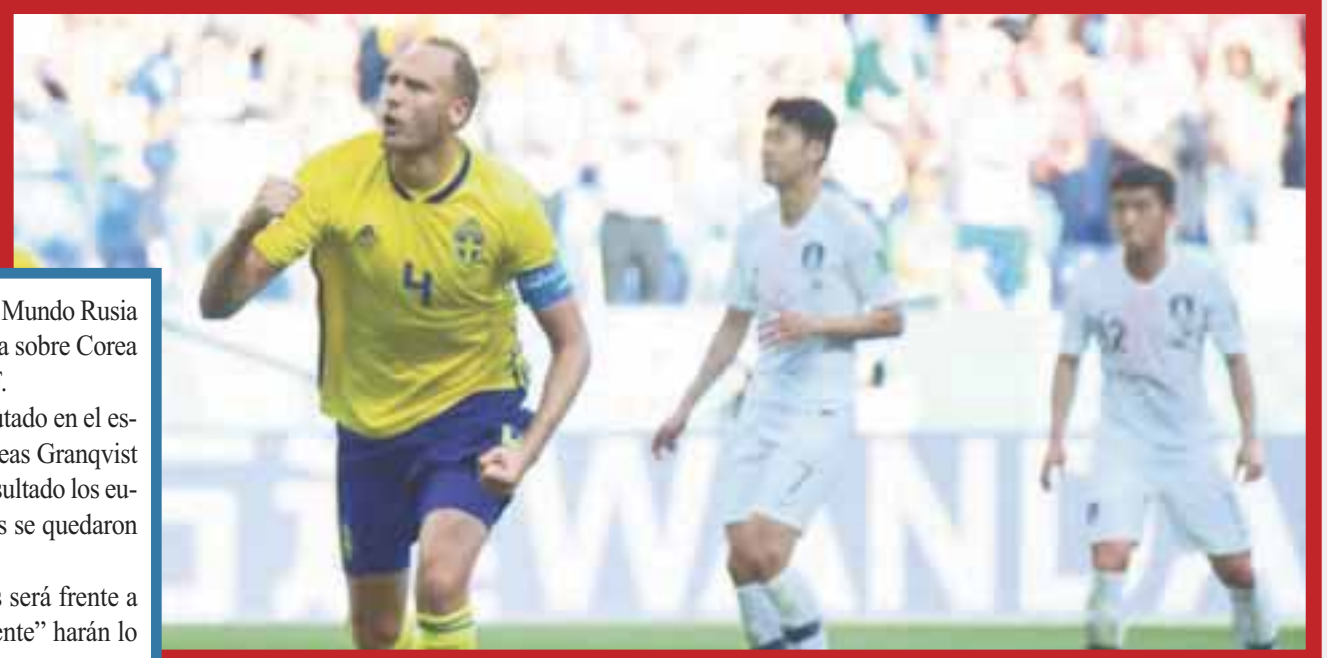
Suecia debutó con el pie derecho con un triunfo por la mínima diferencia sobre Corea del Sur.

El siguiente partido de los escandinavos será frente a Alemania, mientras que los "Tigres de Oriente" harán lo propio con el representativo de México.