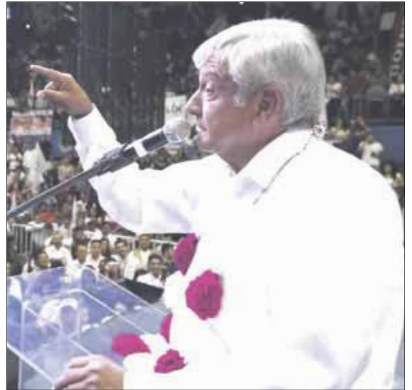
Andrés Manuel López Obrador arremetió en contra del gobierno de Miguel Ángel Mancera en la Ciudad de México y lamentó el incremento en los niveles de inseguridad en la capital.

Informó que otro compromiso, de ganar las elecciones del 1 de julio, es que se homologuen los precios de la energía eléctrica, es decir, lo que cueste la luz del otro lado de la frontera es lo que costaría en Mexicali