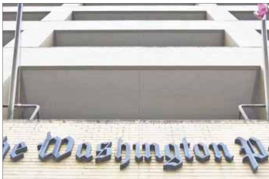
Andrés Manuel López Obrador tiene mucho parecido con Donald Trump, señala The Washington Post .

The Washington Post sostuvo que Andrés Manuel López Obrador tiene mucho parecido con Donald Trump y que su eventual triunfo en las elecciones presidenciales del 1 de julio significará “más problemas en ambos lados de la frontera”.