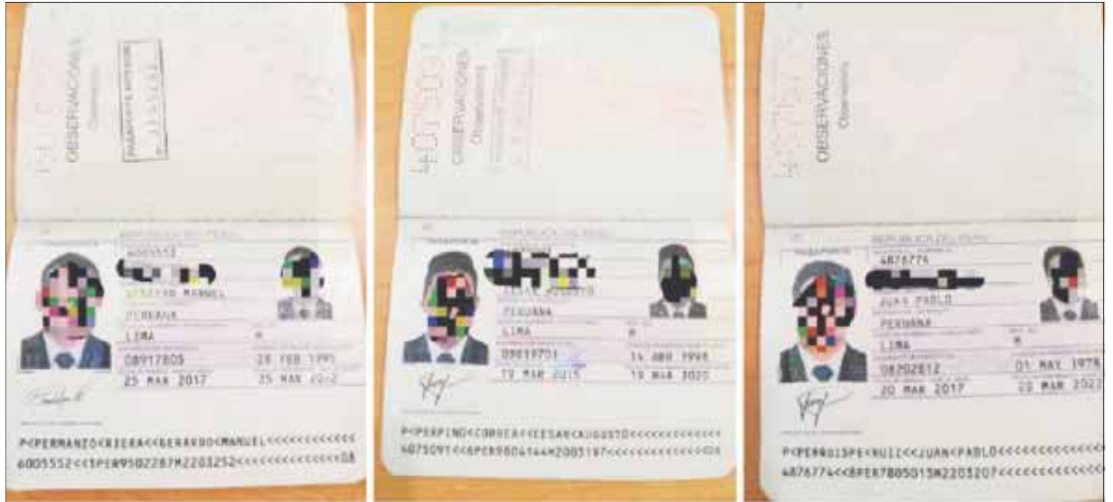
Los viajeros fueron entrevistados, luego de que se alertó sobre un equipamiento extraño no especificado.

La policía federal con sede el Aeropuerto Internacional de Cancún, mediante entrevistas se percató que los ecuatorianos en realidad eran ciudadanos peruanos por lo que procedieron a detenerlos y ponerlos a disposición de la autoridad correspondiente.