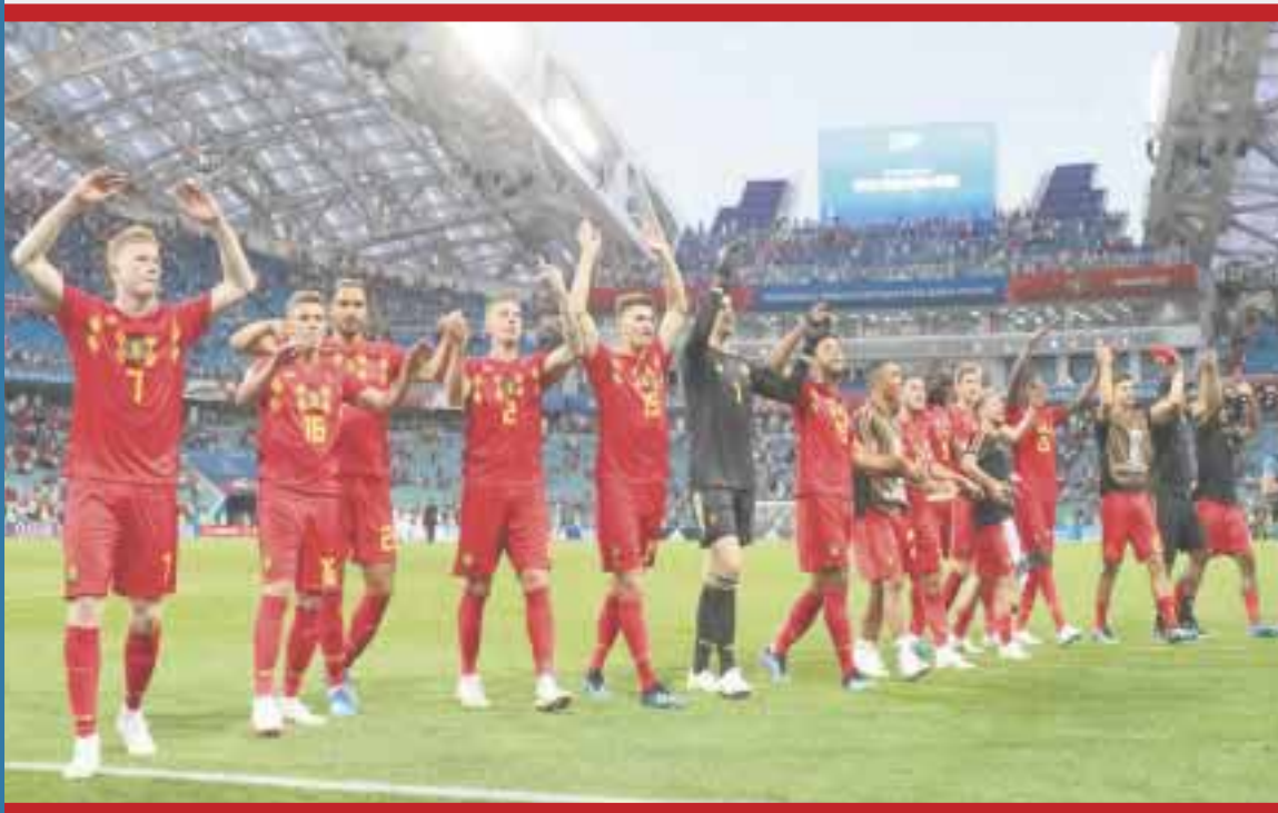
Bélgica se impuso 3-0 sobre su similar de Panamá, que hizo su debut en una Copa del Mundo.

Con Panamá totalmente volcado al frente, el belga Lukaku firmó por encima de Penedo su doblete y el 3-0.