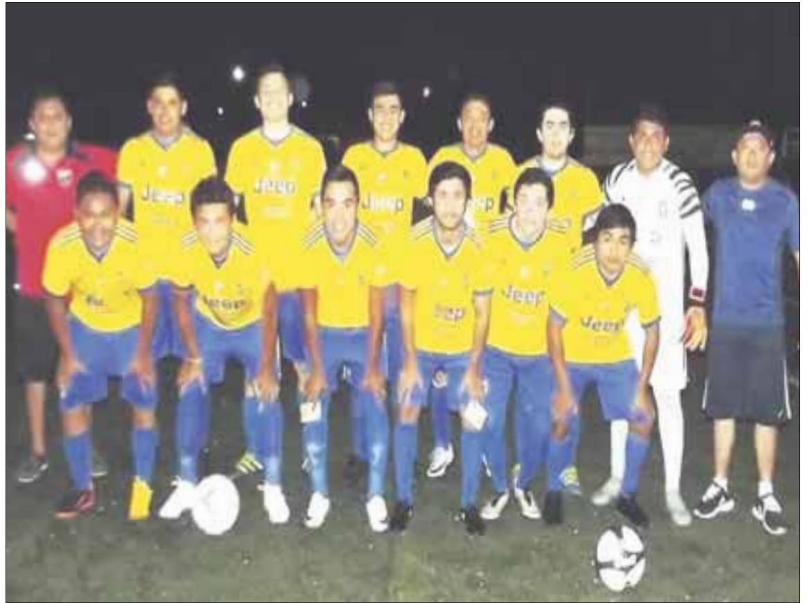
Caribeños de Cozumel goleó por marcador de 8 a 0 al Staff de Cozumel.

El silbante del encuentro sacó 4 tarjetas amarillas a la escuadra de Staff y 2 a Caribeños; cabe destacar que no hubo ningún expulsado en el encuentro que se celebró en la Unidad Deportiva Bicentenario