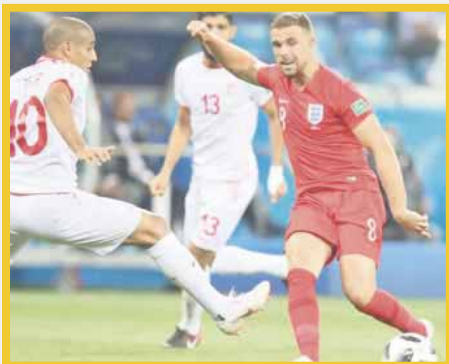
La selección de Inglaterra venció 2-1 al combinado de Túnez, en el debut de ambas escuadras del Mundial 2018.