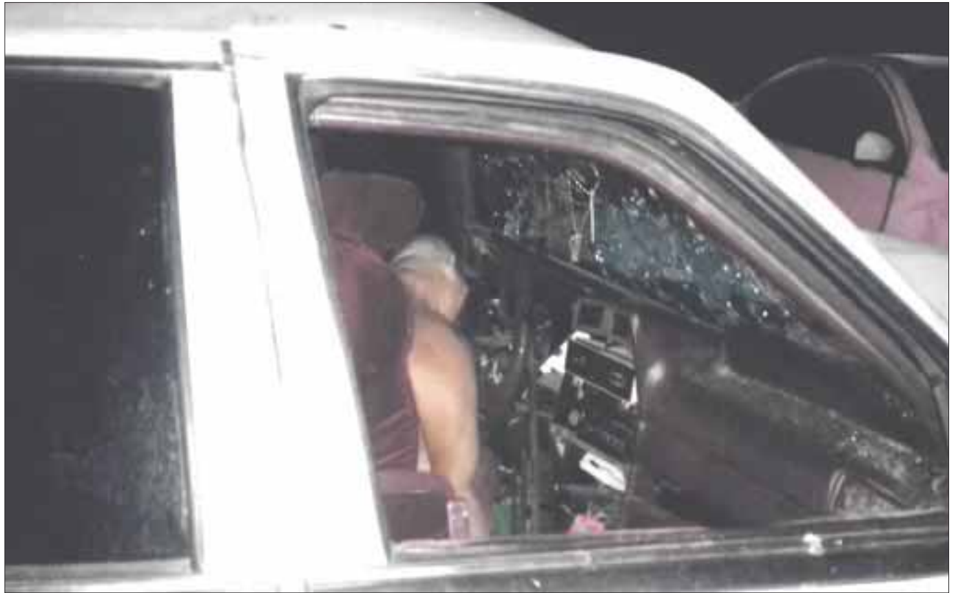
Un vehículo Spirit invadió el carril contrario, provocando que se impactara de frente contra un Nissan.

Elementos de la Fiscalía General del estado acudieron al lugar para realizar el levantamiento de los cuerpos cuando los bomberos y personal de la Policía lograban rescatar los cadáveres, para ser trasladados a la morgue en espera de la llegada de familiares para su identificación.