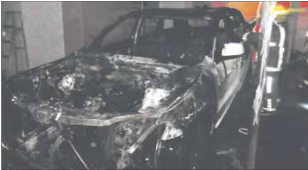
Una camioneta tipo Grand Cherokee , color blanco, con placas de circulación UUM580E, fue atacada con tres bombas Molotov .

Lanzan bombas Molotov a una camioneta Grand Cherokee