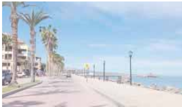
El malecón, en Loreto.