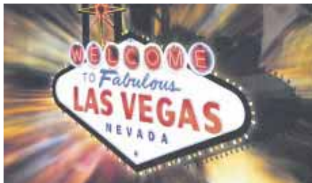
Habrará un nuevo hotel en Las Vegas.

anunció un nuevo servicio para su clase económica en vuelos intercontinentales, propuesta que incluirá una botella de agua, una toalla refrescante y auriculares como bienvenida. A la hora de la comida principal se ofrecerá un renovado menú de platos calientes, y el servicio de snacks sumará helados y dulces.