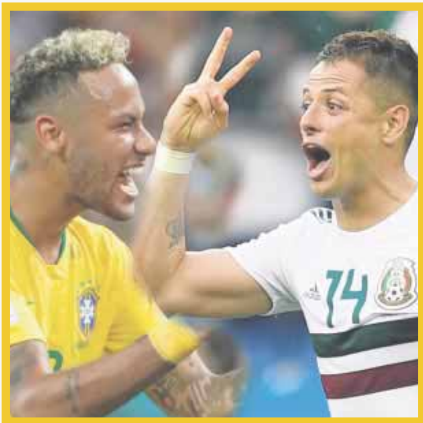
Los delanteros Neymar y Chicharito Hernández.