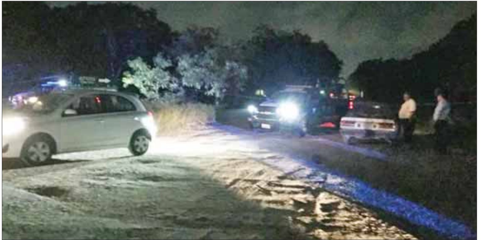
La Policía Ministerial se trasladó al lugar de los hechos, para realizar el peritaje y determinar las causas y motivos de ambas agresiones a los choferes en Playa del Carmen.

A la misma hora, otro conductor de taxi fue asaltado y recibió varias puñaladas al llegar a la glorieta donde antes se encontraba la Moneda, al sur del Playa del Carmen, antes de la entrada del fraccionamiento La Joya; perdió la vida tras ser ingresado al Hospital General.