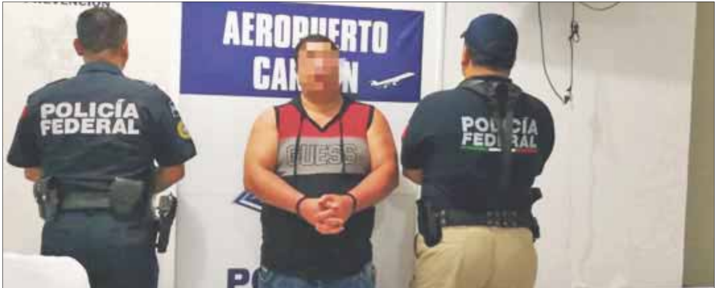
Los cubanos fueron entregados a la oficina de United Marshalls de Estados Unidos, para que sean juzgados por los delitos que les imputan

En Cancún, la pareja fue ubicada en el restaurante Latino Cubano, en la avenida Uxmal esquina con Pulticup, en la supermanzana 23 de esta ciudad.