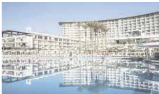
Este hotel ya forma parte de Interval.

Los interiores, creados por la firma diseñadora Francois Frossard , de Miami, tienen una sofisticada estética contemporánea con un gran estilo que compite con los mejores hoteles en todo el mundo.