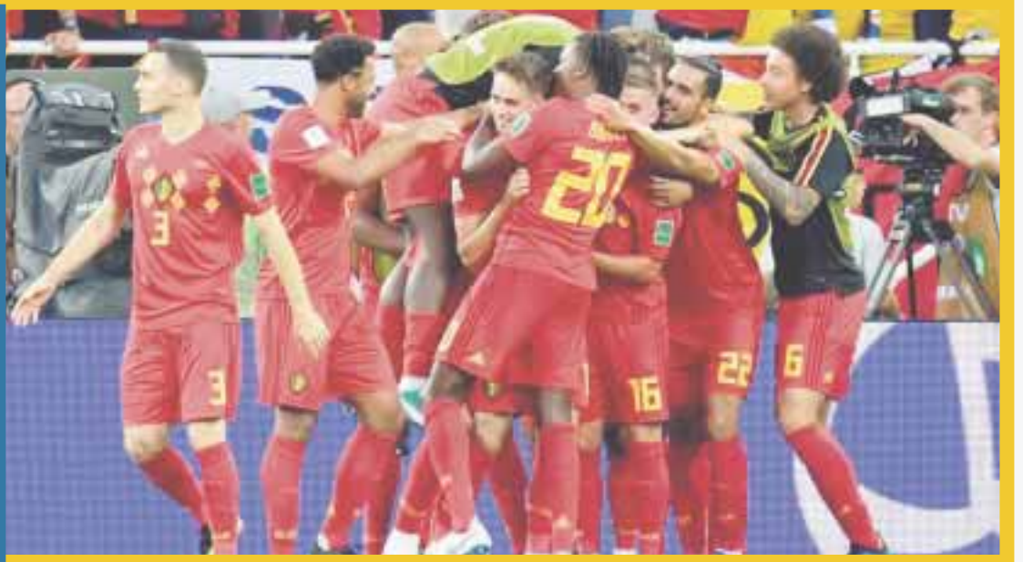
Bélgica se impuso sobre Inglaterra por 1-0 en el cierre del Grupo G, por lo que los Diablos Rojos jugarán en octavos de final con Japón.

La selección centroamericana llegó a soñar con celebrar su primer triunfo mundialista al cobrar ventaja gracias a un gol en contra de Yassine Meriah a los 33 minutos, pero Túnez, que también estaba eliminada, remontó con tantos de Fakhredine Ben Youssef y Wahbi Khazri a los 51 y 66, respectivamente, para cerrar su participación con tres puntos en el Grupo G.