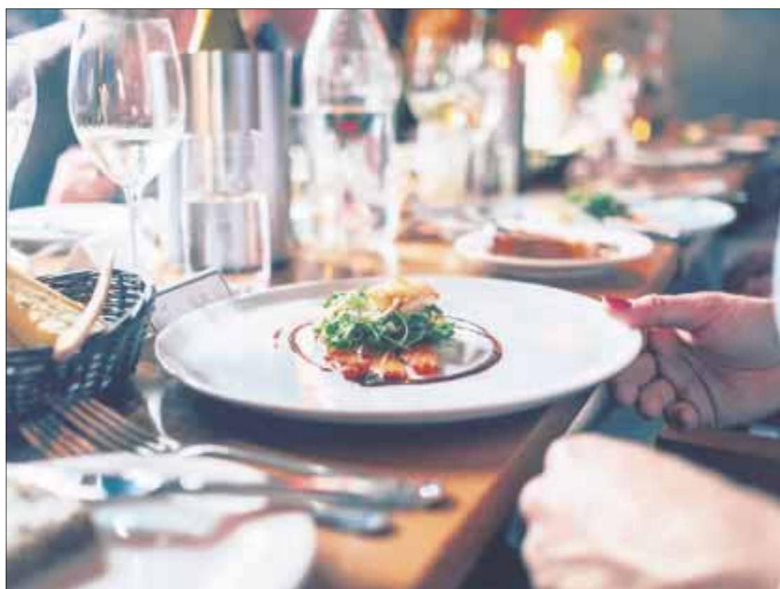
Empresarios piden a la Cámara de Diputados de Q. Roo reducir un día la Ley Seca.

La Canirac pidió la intervención del Congreso local para frenar la exten-