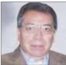
Por Roberto Vizcaino