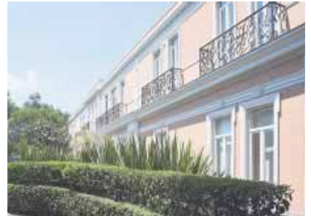
El hotel en Ciudad de México, que se incorpora a SLH.