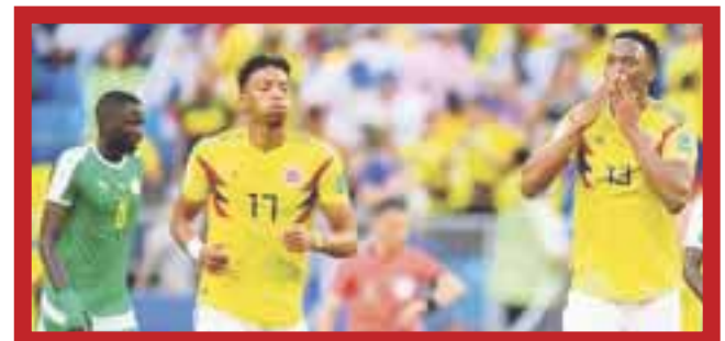
Colombia logró el triunfo ante su similar de Senegal, con lo que firmó su pase a los octavos de final.

La ausencia de James Rodríguez, que fue sustituido a los 30 por Luis Muriel, hizo que el conjunto de José Pékerman perdiera parte de la posesión y con el correr de los minutos del primer tiempo Colombia fue cediendo espacios.