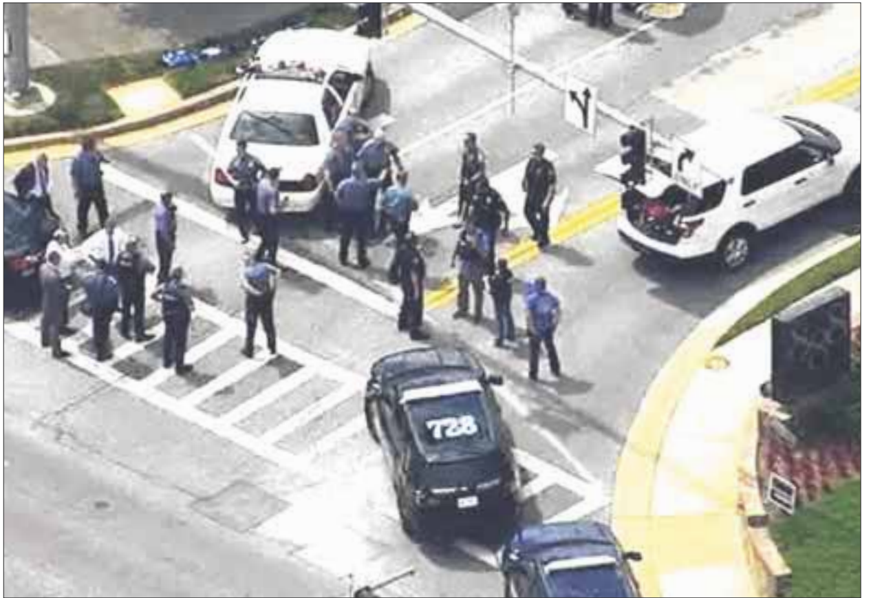
La Policía local confirmó la detención de un joven de 20 años sospechoso del tiroteo en un diario de Maryland.

“Antes de partir a Wisconsin, me informaron sobre el tiroteo en The Capital Gazette , en Annapolis, Maryland. Mis pensamientos y oraciones están con las víctimas y sus familias. Gracias a todos los socorristas que se encuentran en el lugar”, aseguró Trump a través de su cuenta de Twitter.