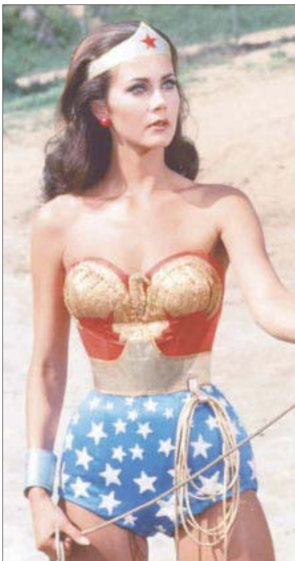
La actriz, de 66 años, reveló al medio estadounidense “The Daily Beast”, que sufrió acoso sexual durante el rodaje de “Wonder Woman”.

A la par, trabaja en los temas de lo que será su nuevo disco como solista, en el que podría haber una colaboración de los integrantes de Reik.