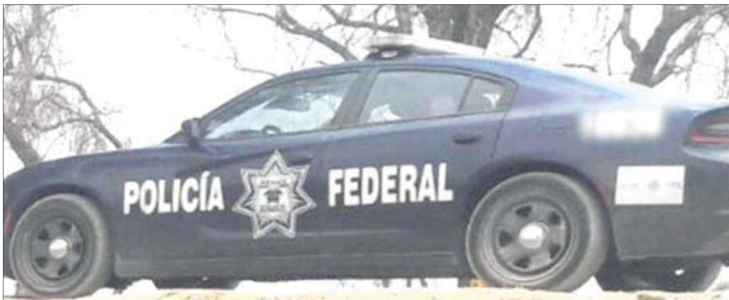
La Procuraduría de Justicia de Guanajuato ordenó desalojar todas sus oficinas y suspender labores.

Un ataque armado en la Subprocuraduría de Atención Integral Especializada para Menores, en el municipio de Irapuato, Guanajuato, dejó el saldo de un muerto y dos lesionados, entre ellos un menor de edad.