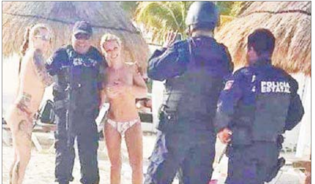
Los policías fueron captados el domingo en playa Marlin, en la Zona Hotelera de Cancún.

Pero, momentos después, la publicación fue eliminada de la mencionada página. Posteriormente el administrador publicó que fue amenazado por mensajes privados momentos antes de que la publicación fuera borrada.