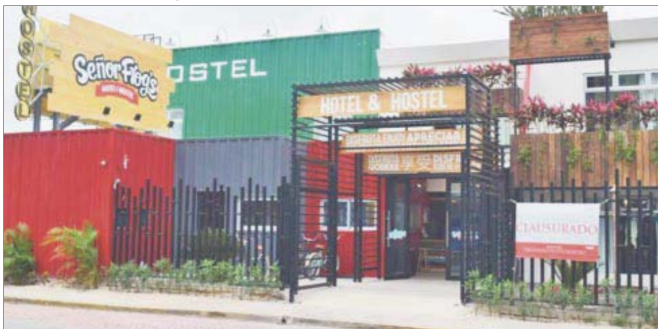
"Sr Frogs Hotel and Hostel" vierte aguas negras en la Laguna Nichupté de la zona hotelera.

Cancún.- Denunciaron ruptura de tuberías de aguas negras en "Sr Frogs del Hotel and Hostel" que vierte su contenido en la Laguna Nichupté de la zona hotelera, en donde la Procuraduría Federal de Protección al Ambiente (Profepa) clausuró de forma total las obras desde el viernes pasado por carecer de permisos.