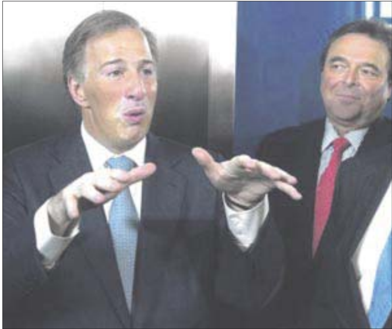
José Antonio Meade fue entrevistado al término de su encuentro con ejecutivos de BBVA Bancomer.

Es el reflejo de una incapacidad de construir un consenso, afirma