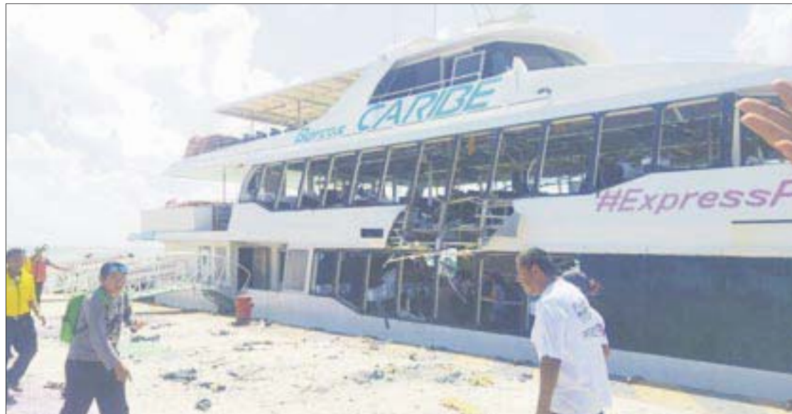
Blindan terminales marítimas de Quintana Roo. Destina la Secretaría de Hacienda una partida especial por 40 millones de pesos.

Departamento de Relaciones Internacionales y Ciencia Política de la UDLAP, señaló que la impunidad es un fenómeno que requiere ser estudiado por sí mismo, no sólo acompañado de seguridad, justicia, violencia y corrupción porque retroalimenta y multiplica los efectos de estos problemas, aumenta el nivel de las víctimas y agudiza problemas como la corrupción e incluso la violación a los derechos humanos.