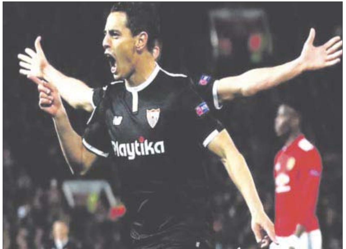
El Sevilla se quedó con el triunfo en el Old Trafford, en el partido de vuelta de los octavos de final de la Champions y eliminó al Manchester United.

Tras igualar sin goles en el estadio Ramón Sánchez-Pizjuán, los nervionenses salieron con una ligera ventaja para enfrentar la vuelta, pues cualquier triunfo o empate con anotaciones les daba el pase a la siguiente ronda de la competencia