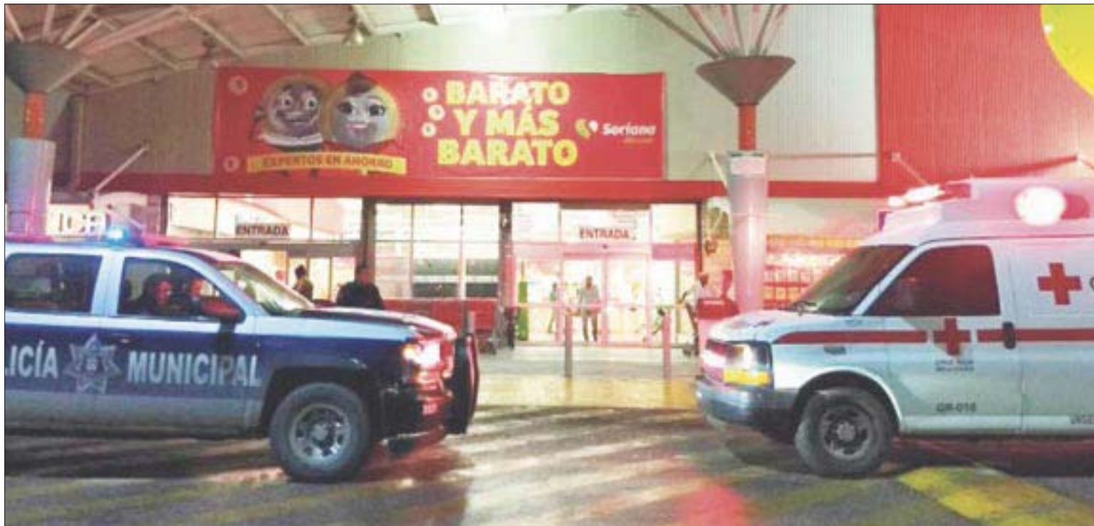
Ante la nula presencia policiaca en la zona, los asaltantes entraron y salieron como Pedro por su casa .

De nueva cuenta en el mismo día, los agentes ministeriales no hicieron acto de presencia, ni se acondicionó el área para los procedimientos de ley, ya que la tienda siguió operando de manera normal, sin ningún contratiempo, como si nada hubiera pasado.