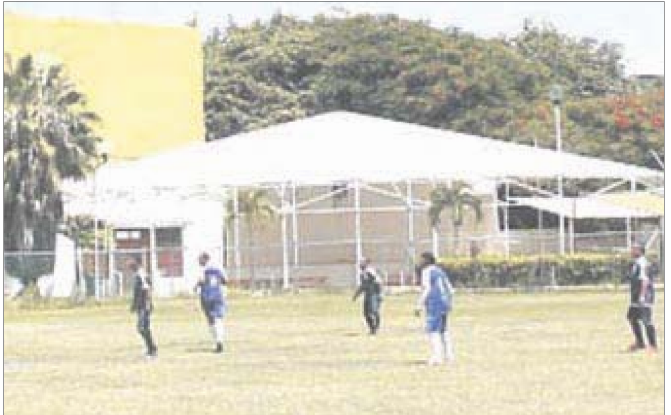
La gran final del torneo Liga Dorada de 55 años entre Guerra de Castas y Barrio Viejo, se efectuará este viernes en la cancha La Charca.

Antes de la gran final de la Liga Dorada, se celebrará a las 17:00 horas el partido que definirá al tercer y cuarto lugar entre los equipos Deportivo Chactemal y Club Chetumal.