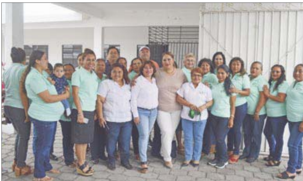
Inauguran el Centro Integral para la Familia Taxista, en donde se realizará la certificación de operadores.

Cancún.- Inauguran el “Centro Integral para la Familia Taxista” en donde se realizará la certificación de operadores como prestadores de servicios con talleres y cursos enfocados a la atención al cliente y calidad en el servicio, con validez oficial a través del Centro de Capacitación para el Trabajo Industrial (CECATI) No. 119.