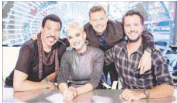
Lionel Richie, Katy Perry y Luke Bryan conforman el panel de jueces en esta nueva temporada del reality.

Carter apareció por última vez en la televisión en un papel en “Supergirl”. Por otra parte actuó como narradora de la serie de historia Epic Warrior Women del canal Smithsonian, misma que comenzará a transmitirse el 19 de marzo próximo.