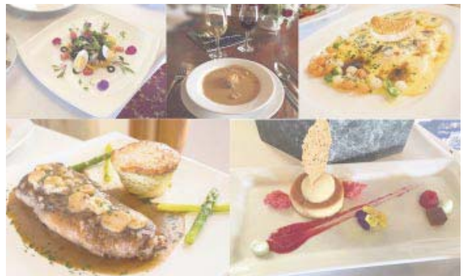
Las delicias de la cocina francesa.

Le sigue la entrée o hors d'oeuvre , ensaladas, sopas, verduras crudas y patés. Continúa con el plat principal que incluye carne o pescado y también arroz, pasta o legumbres. Entre el plato principal y el postre se sirve el