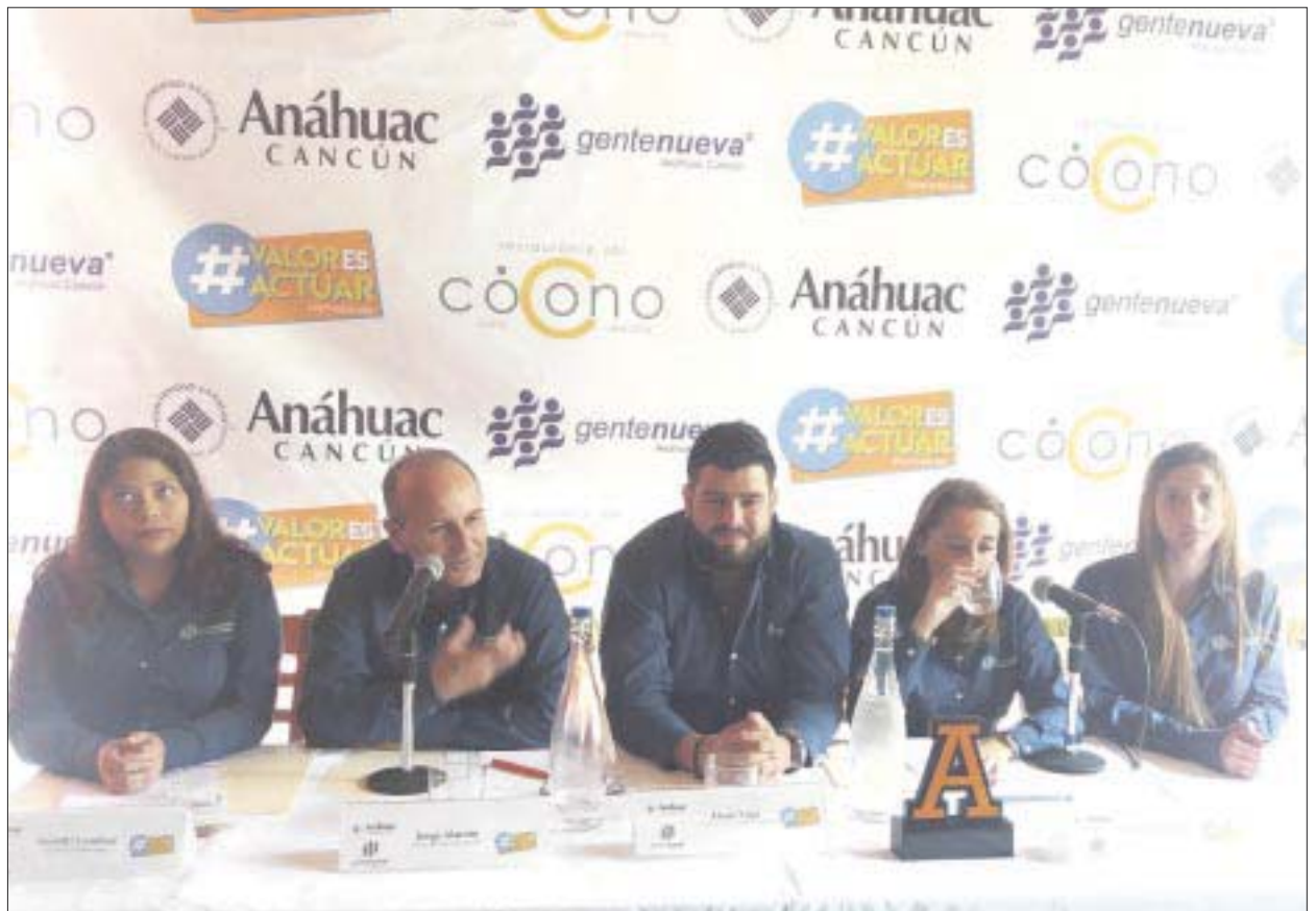
Será en este año cuando operaría el nuevo penal para mujeres, el cual se ubicaría a un lado del actual Cereso de Chetumal.

El secretario de Seguridad Pública, indicó que se han designado a nuevos funcionarios en el sistema penal, para dirigir adecuadamente el Cereso, incluyendo una encargada del área de reclusión femenil, con el fin de evitar el abuso y vejaciones denunciado por las internas