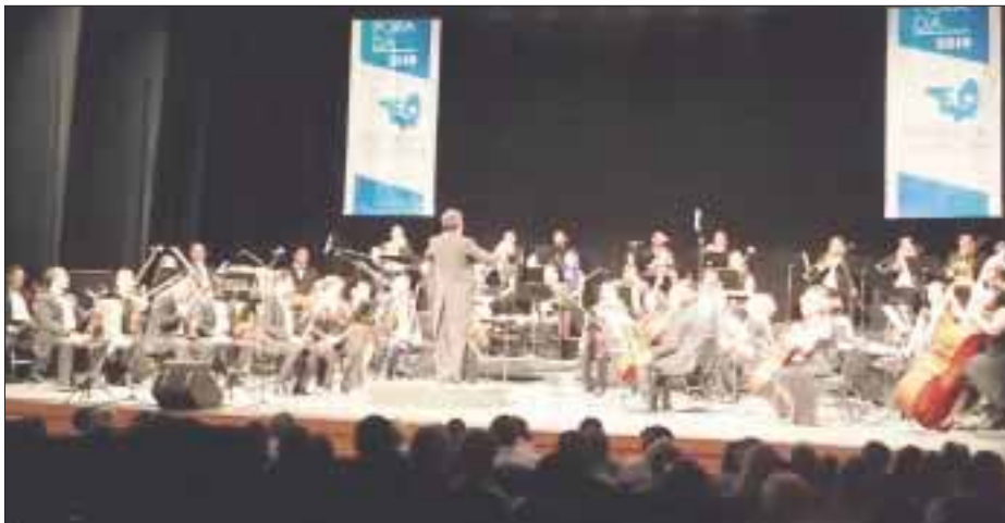
Durante el segundo concierto de la temporada 2018 de la Sinfónica de Cancún con "Los Grandes Tenores".