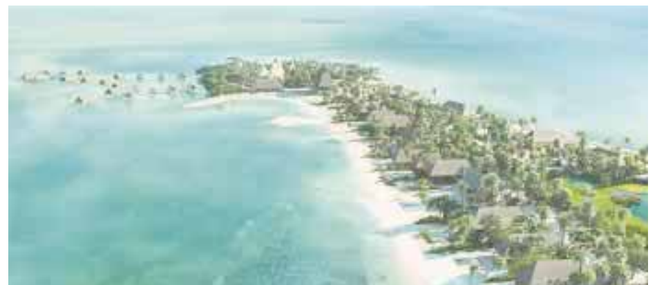
Vista aérea de Cayo Chapel en Belice.

150 pasajeros, 70 se quedaron en la escala que se hace en Tijuana y el resto llegó al destino final, Ciudad de México. Los viajeros serán transportados en aviones Boeing 787 Dreamliner , con capacidad para 204 pasajeros, 170 en Turista y 34 en Business .