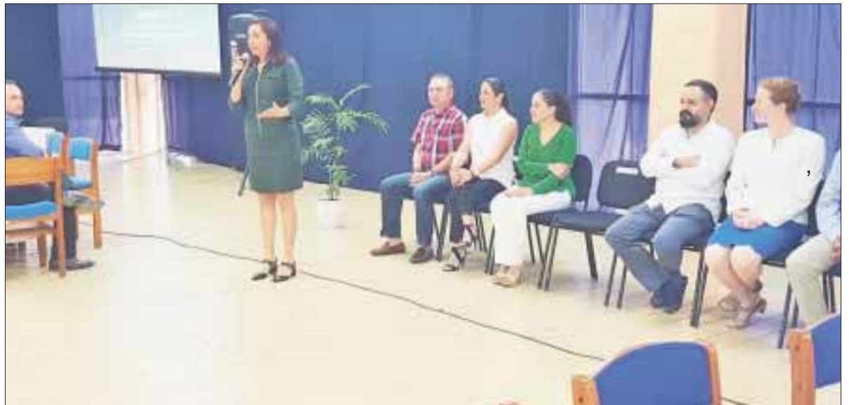
El Foro de Pertinencia de Educación Superior otorgó las herramientas a los egresados para encontrar trabajo de acuerdo a su vocación.

Con el foro se tendrá un alcance le dará sentido a la educación superior, al tener la certeza que tendrán con habilidades y actitudes que además, impulsarán el desarrollo económico, político y social de Quintana Roo.