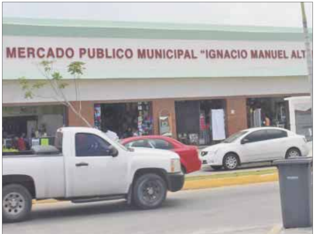
Cientos de microempresas no lograron migrar a la nueva facturación, que en este 2018 está requiriendo el SAT.

Ante tal situación de evidente atraso, el dirigente de la Canaco señaló que han solicitado una prórroga y capacitación para los agremiados por parte del SAT, a fin de cumplir con esta nueva disposición hacendaria