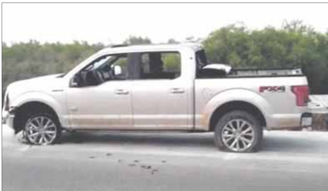
Los enfrentamientos empezaron a la 1:00 horas del domingo y se prolongaron hasta al amanecer.

Se registraron nuevamente balaceras y persecuciones en Nuevo Laredo, Tamaulipas, cuyo saldo fue un marino muerto, 13 elementos más heridos y cuatro presuntos sicarios ultimados, informó la Marina.