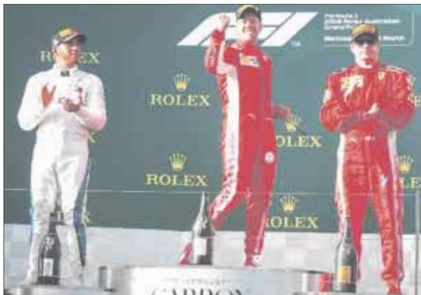
El piloto alemán Sebastian Vettel ganó el Gran Premio de Australia, en el arranque de la temporada de la Fórmula Uno.

El piloto de Ferrari Sebastian Vettel ganó su tercer Gran Premio de Australia este domingo al contener el embate de su rival de Mercedes, Lewis Hamilton, en el dramático inicio de la temporada de la Fórmula Uno.