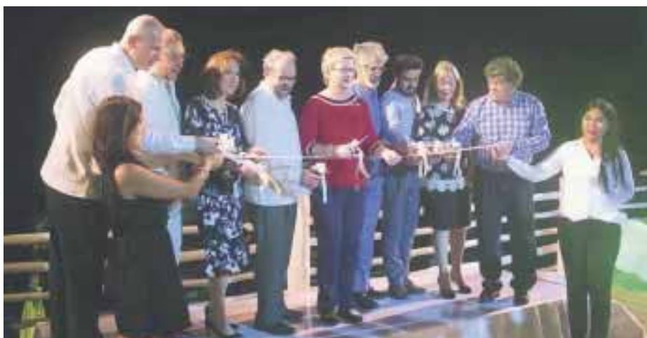
En la apertura del nuevo hotel en Cancún.