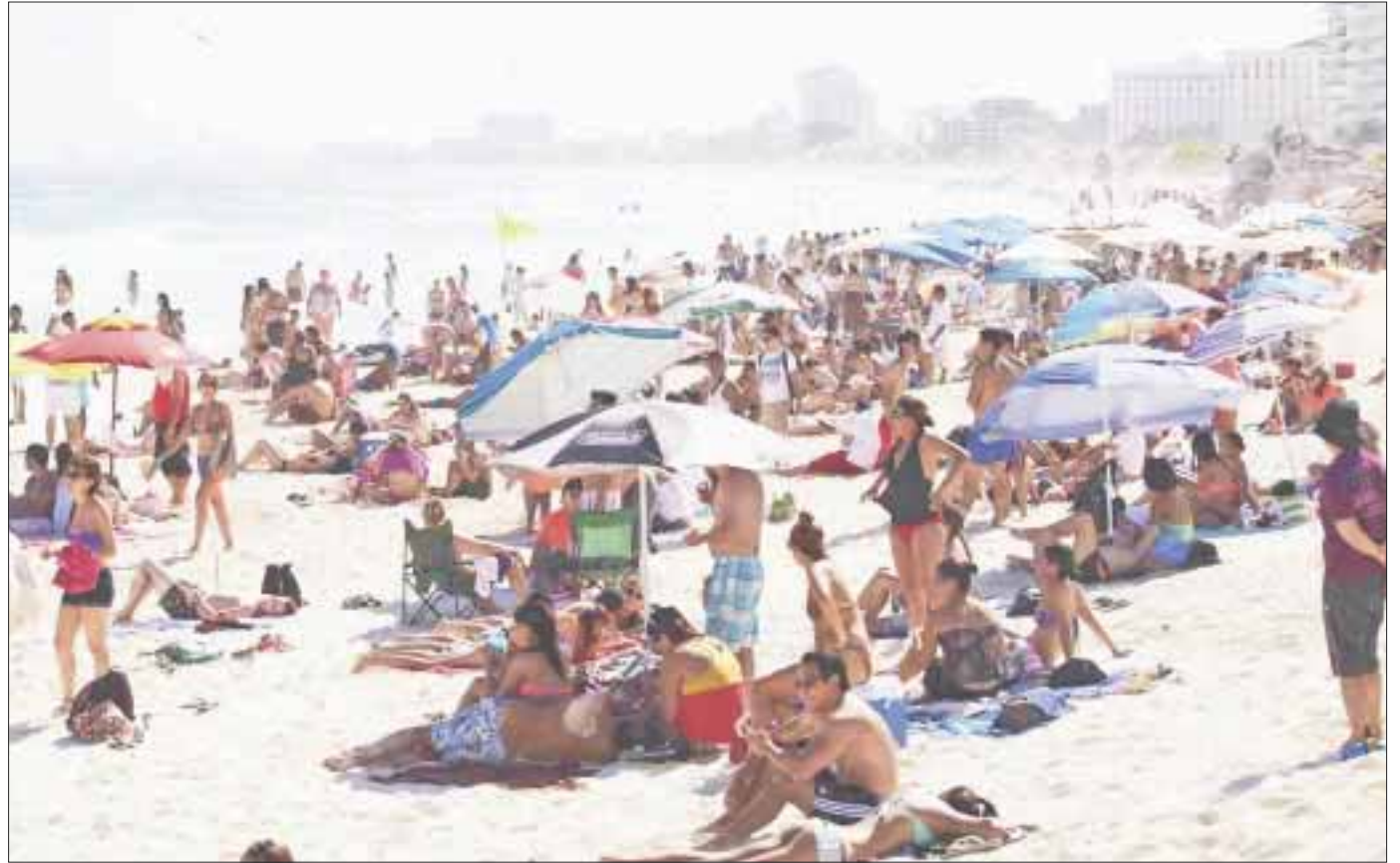
La Riviera Maya, Cancún, Cozumel y Holbox serán los destinos con mayor arribo de turismo en esta temporada.

El conteo de los springbreakers que este año se calcula cerrará la temporada oscila en unos 25 mil vacacionistas, que dejarán de llegar hasta la primera semana de abril, al ofrecer el Caribe mexicano tarifas accesibles y playas con mucha diversión.