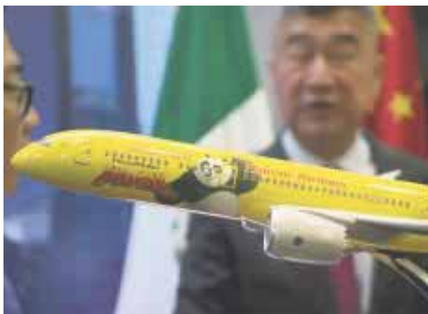
Nueva ruta Ciudad de México-Beijing.

A Houston, habrá un vuelo diario que saldrá a las 18:40 horas,