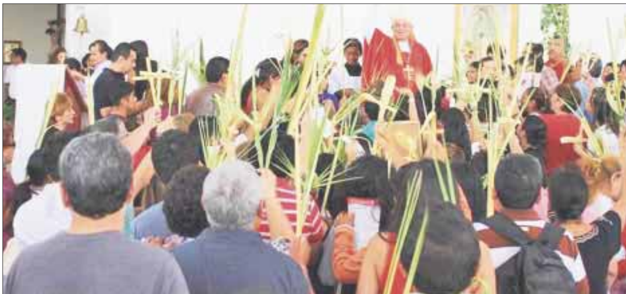
Una multitud abarrotó las capillas y 25 iglesias católicas en el Domingo de Ramos, como parte del inicio de la celebración de la Semana Santa.

Cancún.- Una multitud abarrotó las capillas y 25 iglesias católicas en el Domingo de Ramos, como parte del inicio de la celebración de la Semana Santa en la ciudad, en donde propios y extraños están unidos en la misma fe.