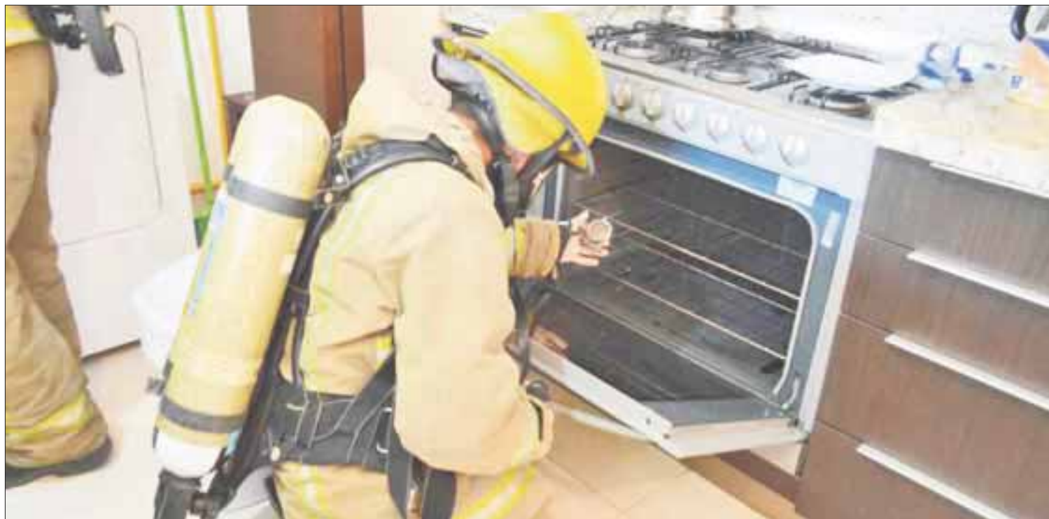
Peritos de la Dirección de Servicios Periciales realizaron una inspección a la instalación de gas de la habitación, en Tulum.

Se mencionó que durante la inspección y análisis periciales en el área del hallazgo, los cuerpos localizados en el departamento PH1, no presen-