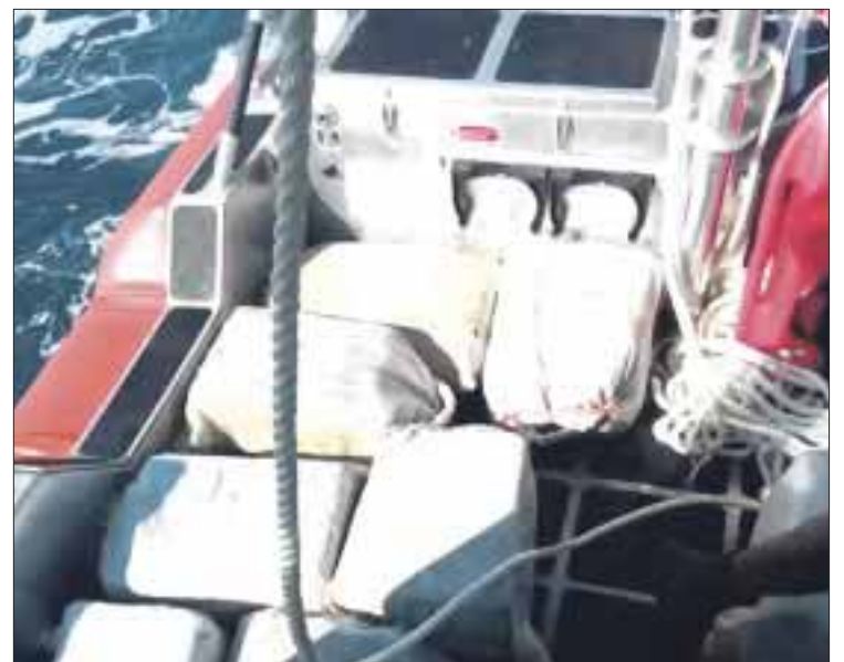
La droga asegurada fue puesta a disposición de la PGR para realizar las pruebas correspondientes.

La carga asegurada fue puesta a disposición de la Procuraduría General de la República (PGR) para la determinación del peso ministerial, realizar las pruebas correspondientes e integrar la carpeta de investigación.