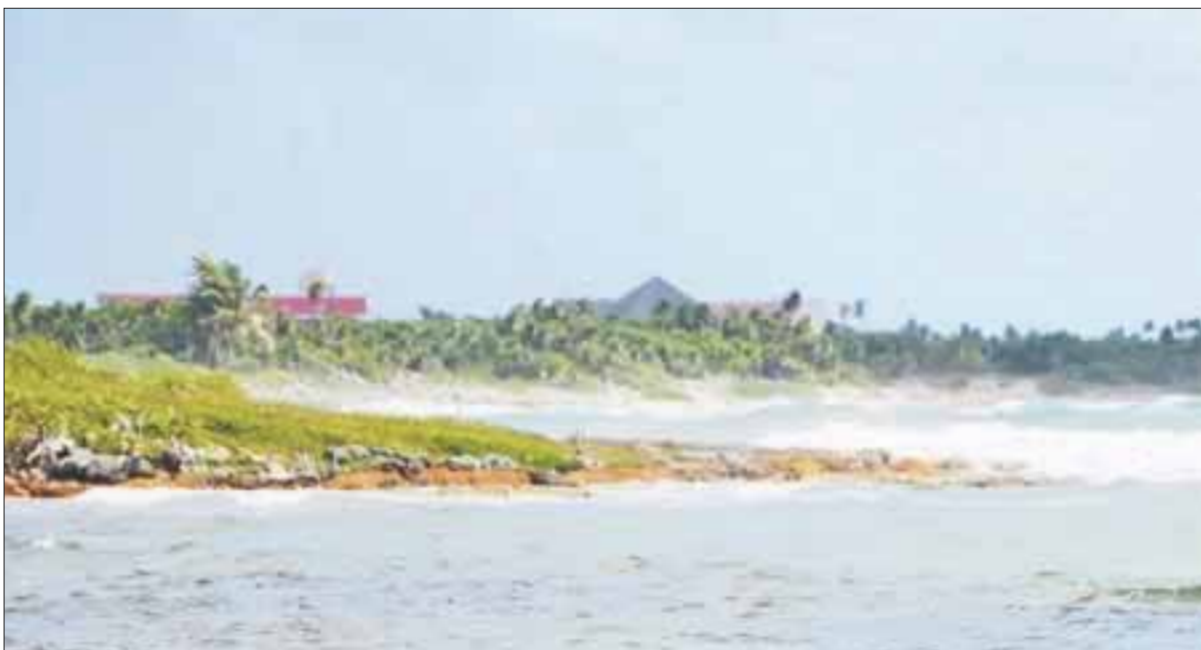
Los estudios bacteriológicos se realizaron en 33 zonas de playa dentro del estado.

Chetumal. – De acuerdo al monitoreo que lleva a cabo la Dirección de Protección Contra Riesgos Sanitarios para valorar las condiciones del agua de mar, las playas están al ciento por ciento aptas para su uso recreativo, informó la Secretaría de Salud.