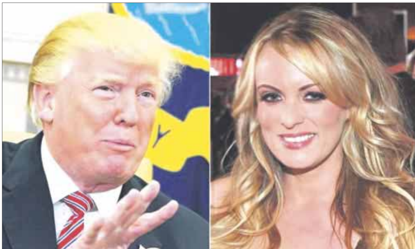
Stormy Daniel denunció haber sido víctima de una amenaza directa después de hablar sobre su relación con Donald Trump.

Expertos coinciden que si el pago fue hecho para proteger a Trump o a su campaña presidencial, y no fue reportado a la Comisión Federal Electoral (FEC), representa una violación de las leyes de financiamiento electoral.