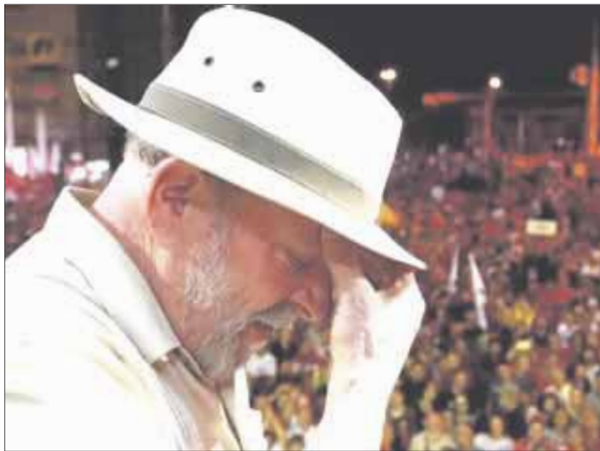
El ex presidente Luiz Inacio Lula da Silva enfrenta una condena de 12 años y un mes de cárcel por corrupción.

Su reclusión depende de un recurso en la Corte Suprema de Brasil