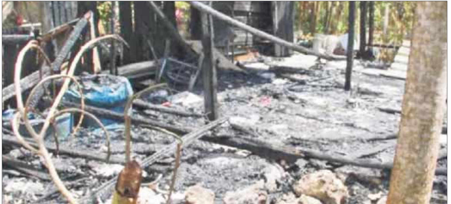
Los peritos de la Fiscalía General del Estado iniciaron las investigaciones, incluida la causa del fuego en la palapa.

El cuerpo estaba acostado, pero totalmente irreconocible por estar completamente carbonizado.