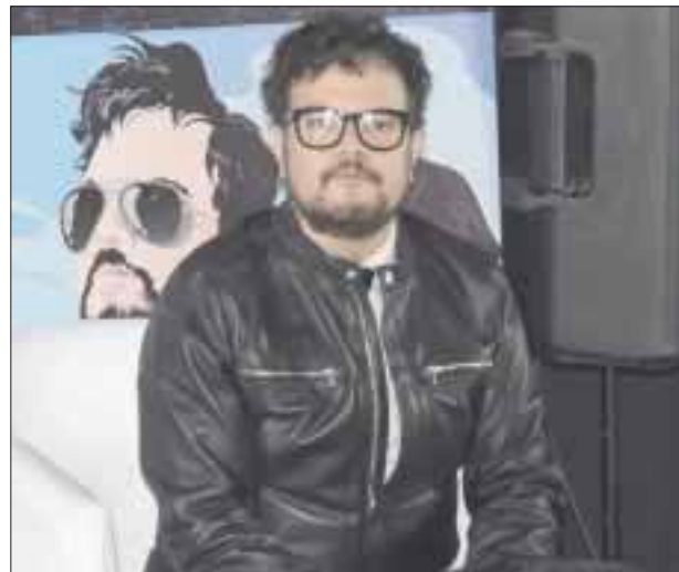
También Aleks Syntek anunció que Devlyn lanzará una línea de amazonas diseñados por él, con cuyas ventas se ayudará a niños de bajos recursos.

Estoy combinando mis hits con los temas de 'Trasatlántico', es un ir y venir de canciones famosas, desde mis inicios, los de esta gira serán conciertos energéticos, me doy cuenta de que la gente se prende desde la primera canción, hasta la última.