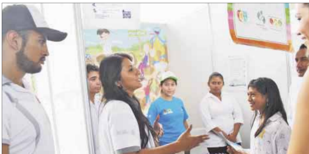
Un total de 4 mil 500 adolescentes y jóvenes se beneficiarán con orientación sexual, información concreta y objetiva dirigida a menores de 10 a 19 años de edad.

Cancún.- Un total de 4 mil 500 adolescentes y jóvenes se beneficiarán con orientación sexual, capacitación, información concreta y objetiva dirigida a menores de 10 a 19 años de edad, como parte de la integración de grupos promotores de servicios amigables.