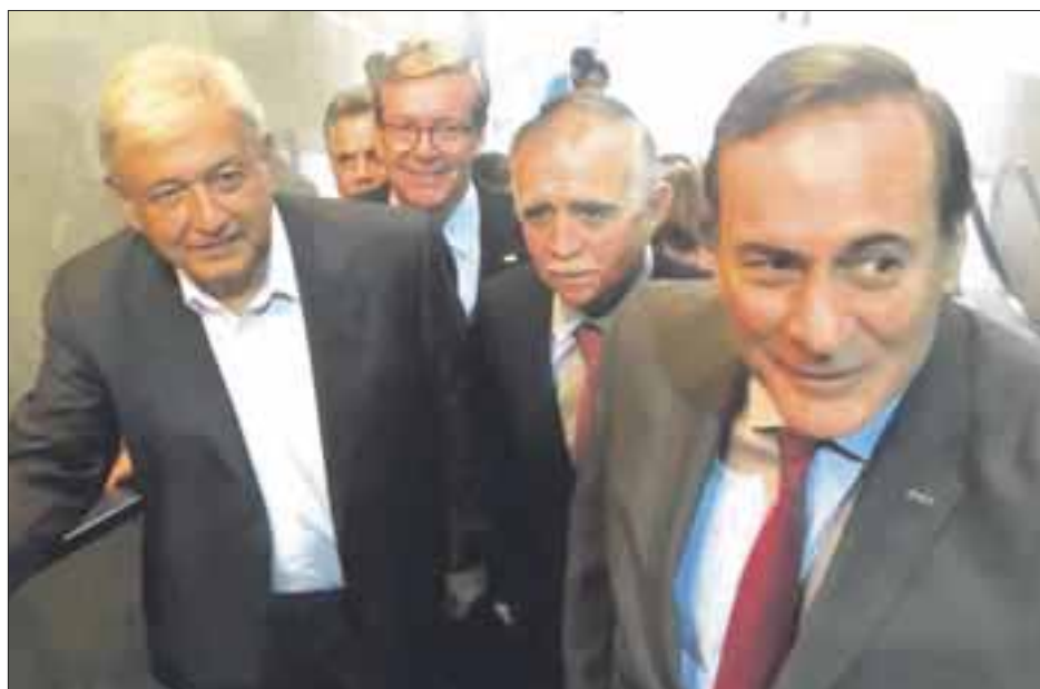
Andrés López Obrador advirtió que su exigencia de transparencia en las contrataciones del NAICM no pretende generar incertidumbre.