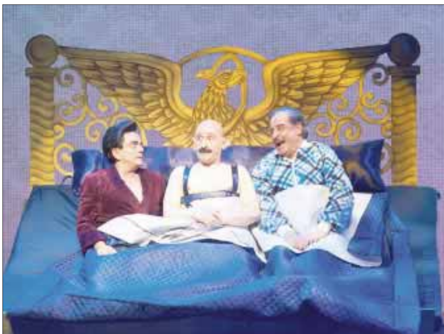
El privilegio de mandar , serie producida por Reynaldo López, presentó en su versión teatral la adaptación de Claudio Herrera.

En entrevista con DIARIOIMAGEN, la deportista habló al respecto. “Fue una experiencia muy padre haber sido parte de este reto, desde que me seleccionaron. Es una competencia dura, lo que vemos en tele no es lo que vivimos realmente, tuve un equipo con una boxeadora y dos compañeros en los que falló la comunicación, no coordinamos, faltó sinergia, jalar pa-rejo. Sin embargo, como deportista, hay que saber perder, aunque hay muchos factores que