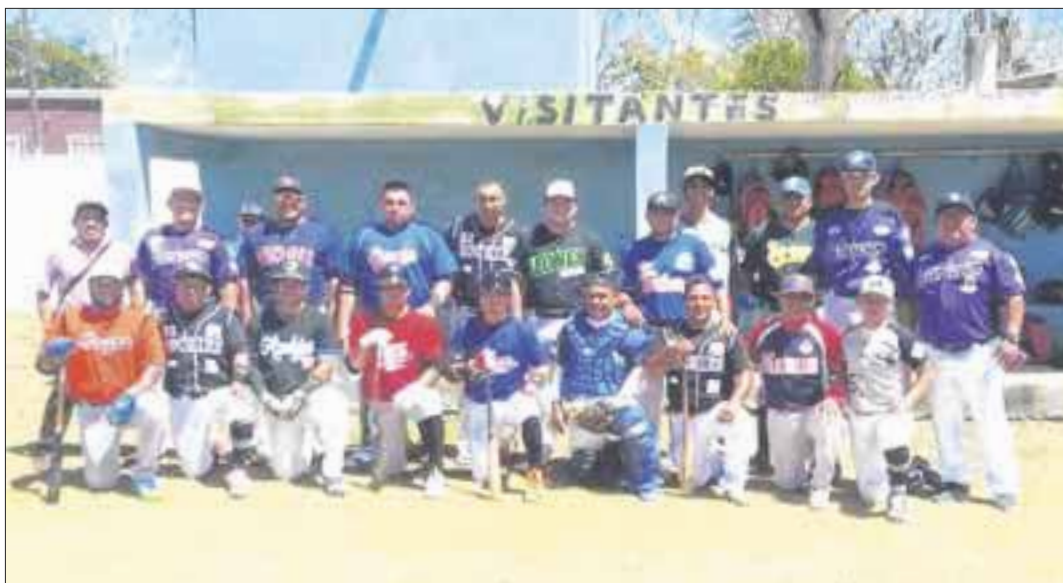
Rockies de Cancún inician con el pie izquierdo la Liga Estatal Quintanarroense en su décima edición.