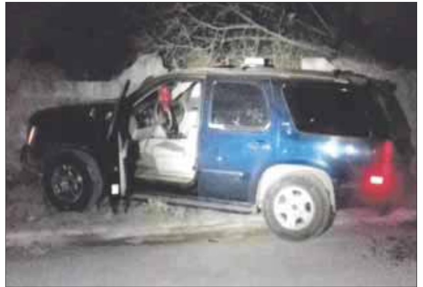
Las víctimas viajaban en compañía de un hombre en una camioneta que pasó por el lugar donde había un enfrentamiento.

“En los acontecimientos suscitados en inmediaciones de Nuevo Laredo, Tamaulipas, bajo ninguna circunstancia fue excedido el uso de la fuerza por parte del personal de esta Institución”, aseveró la Marina