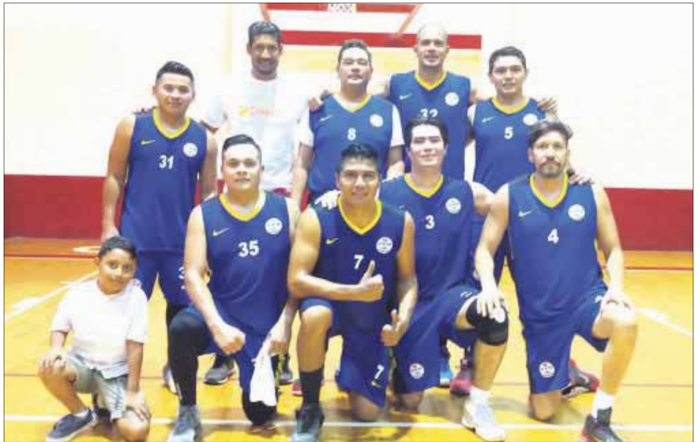
El equipo 2 PM toma ventaja en la serie final de la categoría intermedia, tras vencer a Huracanes 64-50.