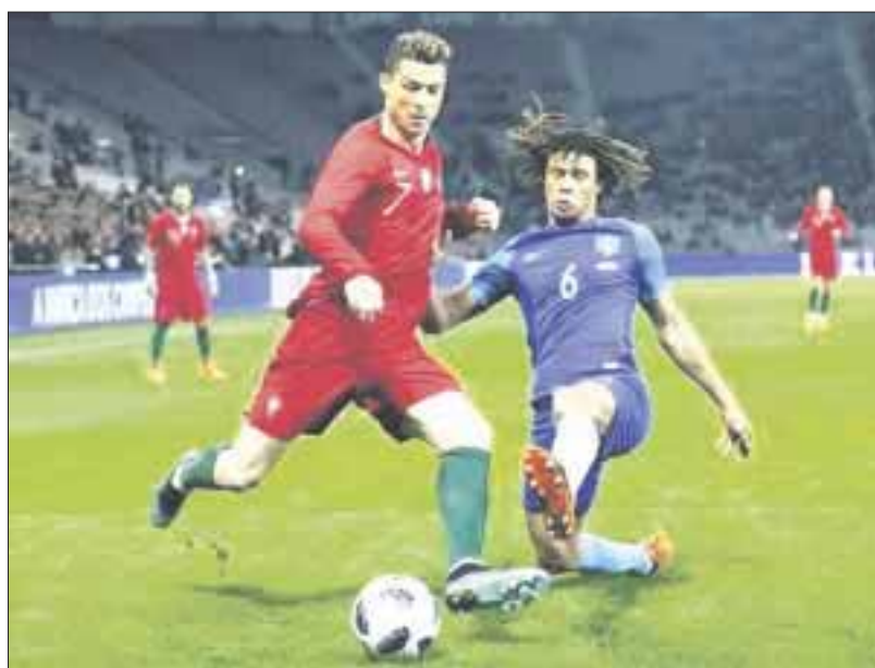
Ni siquiera Cristiano Ronaldo pudo evitar la goleada de Holanda a la selección de Portugal.

Holanda venció con facilidad a Portugal con tres goles en la primera parte, en un partido en el que ni siquiera Cristiano Ronaldo pudo evitar la goleada.