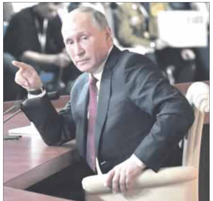
El gobierno de Vladimir Putin calificó como un “paso inamistoso” la expulsión de diplomáticos rusos.

“Ahora comenzará el ‘desfile de las soberanías’, el leal servicio de apoyo político de los países de la UE a Londres”, escribió Zakharova en su página oficial de Facebook.