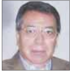
Por Roberto Vizcaino