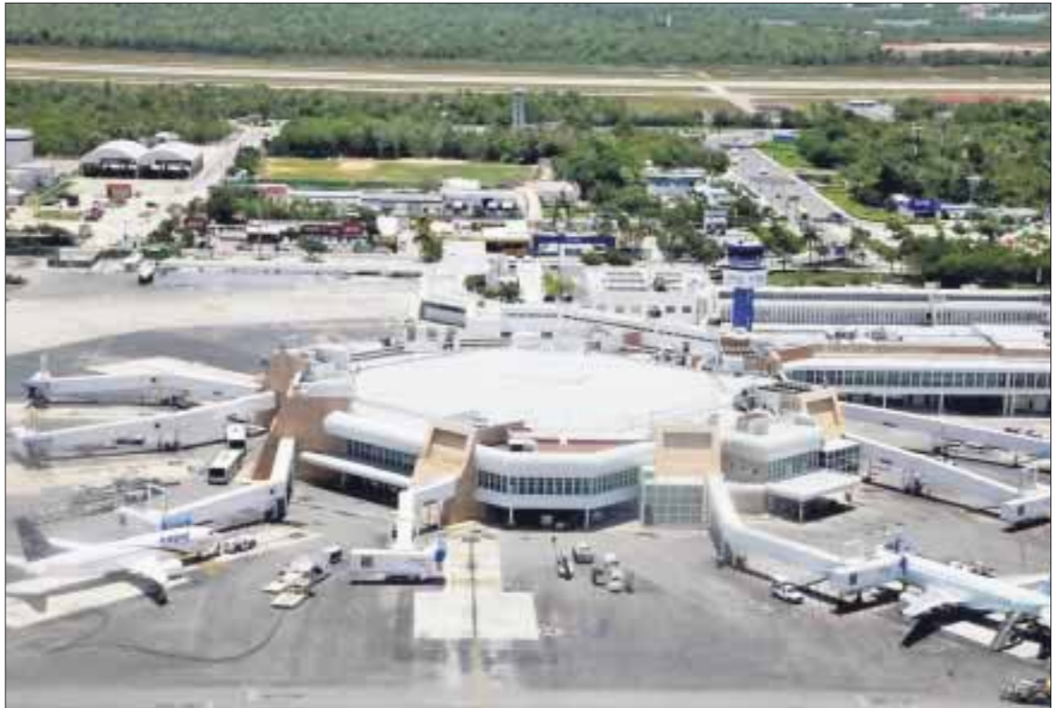
La bonanza llegó a Quintana Roo, con el arribo de 5 millones 434 mil 621 viajeros en lo que va del 2018.

De acuerdo a la información en la terminal aérea, en el 2016 cerró operaciones con una cifra de 28 millones 400 siete mil 51 pasajeros, mientras que en el 2015 fueron 26 millones, 154 mil 986 visitantes; en el 2015 se registró 23 millones 153 mil 560 pasajeros, lo que generó un crecimiento del 2016 al 2017 por casi cinco millones de viajeros.