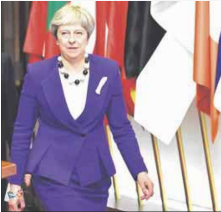
La primera ministra, Theresa May, destaca la mayor expulsión colectiva de agentes de inteligencia rusos en la historia.

Theresa May agradece el “esfuerzo colectivo” contra Rusia