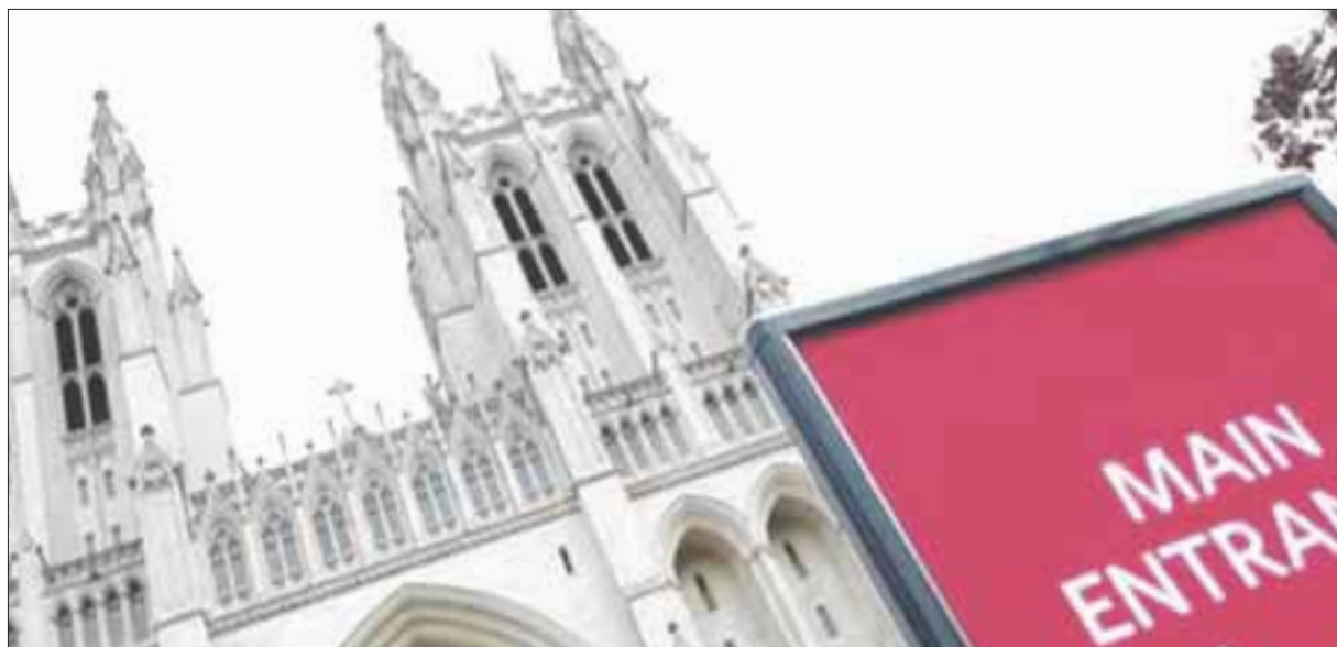
La Arquidiócesis de Washington DC publicó una lista con los nombres de 28 sacerdotes que son acusados de abuso desde 1948.

Fue publicada una lista con 28 nombres de antiguos sacerdotes que supuestamente cometieron abusos sexuales de menores.