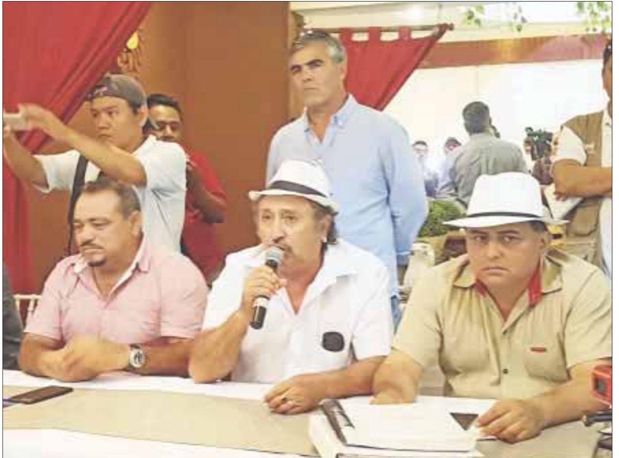
Más de 300 amparos interpondrán ejidatarios, pobladores, empresarios del sector pesquero e inmobiliarios de la reserva de Yum Balam.

El marco legal publicado con el aval de la Secretaría del Medio Ambiente y Recursos Naturales (Semarnat) contiene los mismos parámetros que la propuesta presentada en 2016 y que fue rechazada por todos los sectores.