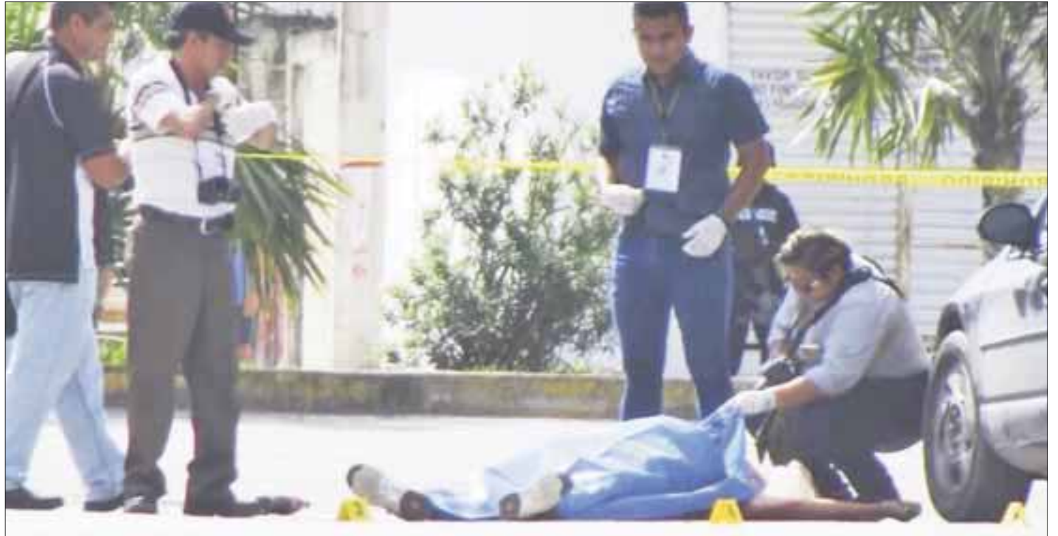
Los disparos provocaron la muerte en ese lugar de una persona de sexo masculino, quien caminaba en la vía pública, después de haber comprado algunos productos en una tienda.

Más tarde, un segundo caso de ataque a balazos se registró cerca de ahí, en la avenida Leona Vicario, en la Región 229, con la misma forma de atacar a sus víctimas, por lo que se infiere que fueron los mismos sicarios de la moto.