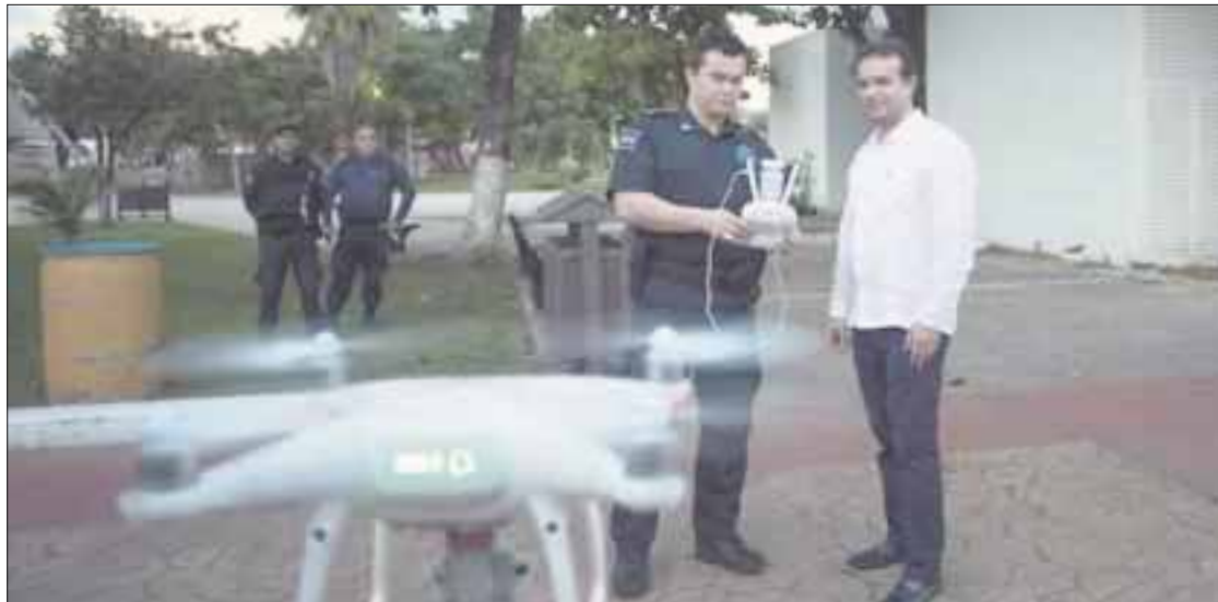
Pedro Joaquín Delbouis , presidente municipal de Cozumel, refrendó su compromiso de continuar con el combate a la delincuencia, ahora con el apoyo de drones de vigilancia.

garon como parte de las nuevas estrategias para volver a tener un Cozumel seguro, y las autoridades trabajarán de manera coordinada con la federación y con el estado.