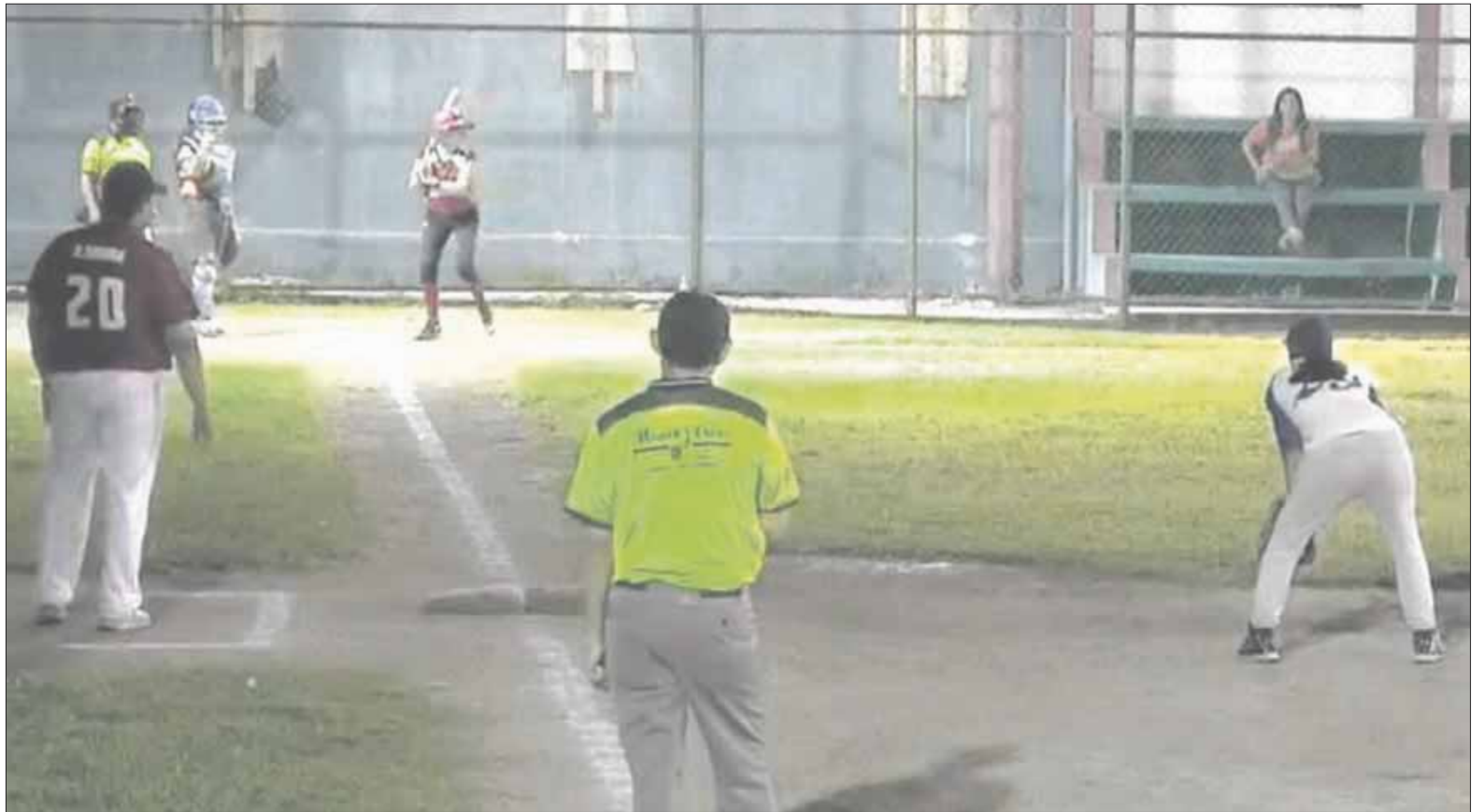
Las escuadras Marlins y Centauros dieron un gran espectáculo deportivo en la Isla de las Golondrinas.

Con una sorprendente actuación del conjunto de las Marlins que se fueron al frente en 4 ocasiones más, para dejar el marcador definitivo por 10-2 y así conseguir su segunda victoria consecutiva.