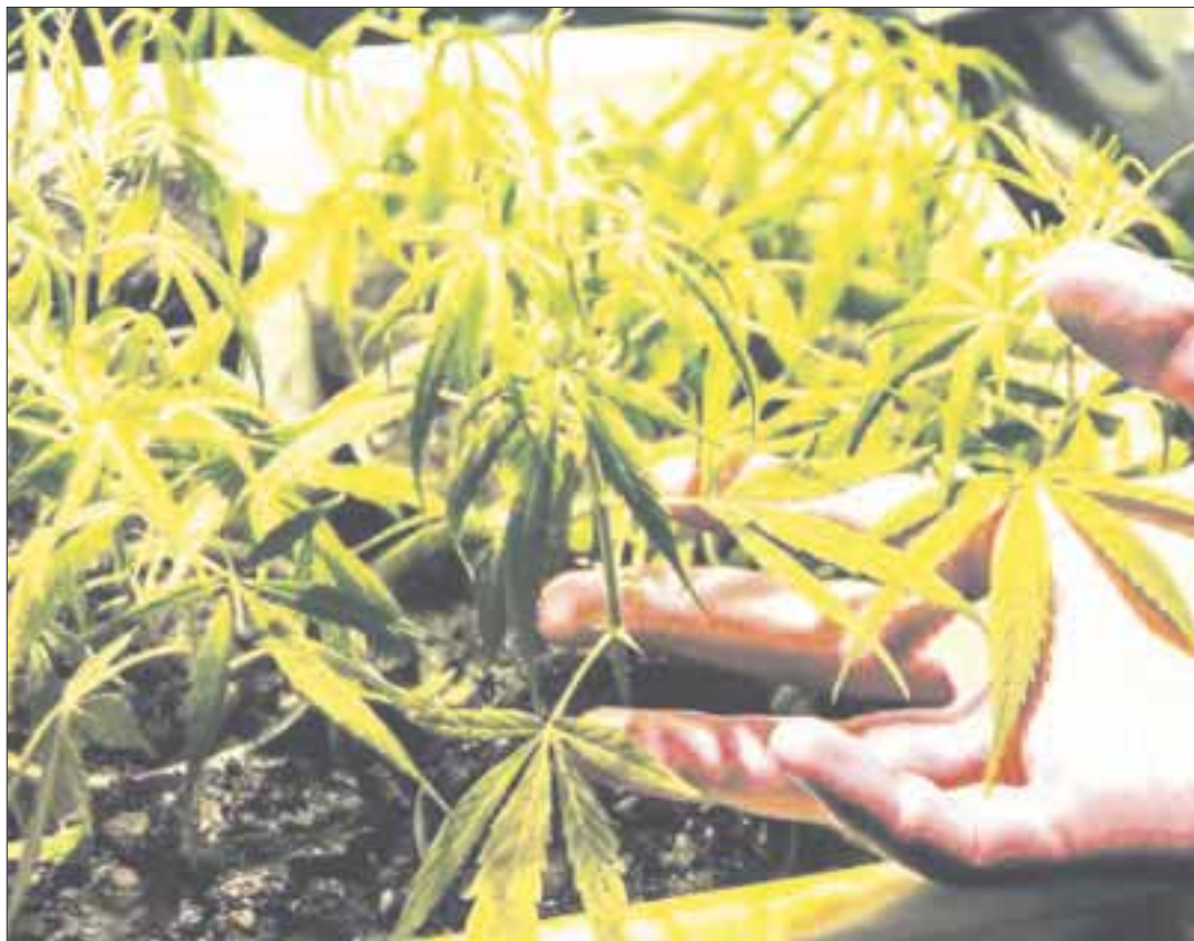
Jóvenes estudian en una facultad en Canadá para convertirse en los primeros del país en obtener credenciales académicas formales para cultivar marihuana.

Health Canada, el ministerio de Salud del país, estima que la legalización causará problemas a uno de cada tres adultos y adicción a 10% de los usuarios, con mayores riesgos en los jóvenes. Los esfuerzos para comercializar el producto, sugirió, podrían alentar a los usuarios actuales a usar más marihuana.