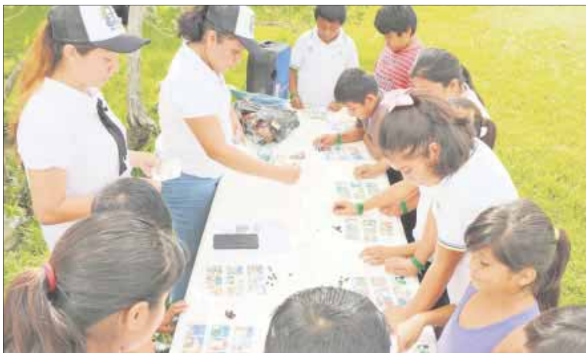
En la celebración estuvo el personal del área de Michou y Mau y de Participación Infantil.

Chetumal.- Con motivo de la celebración del "Día Internacional de la Niña", el Sistema DIF Quintana Roo en coordinación con el DIF de Bacalar, realizaron un rally recreativo en el balneario El Aserradero, en donde participaron niñas y niños de la primaria Tenochtitlán.