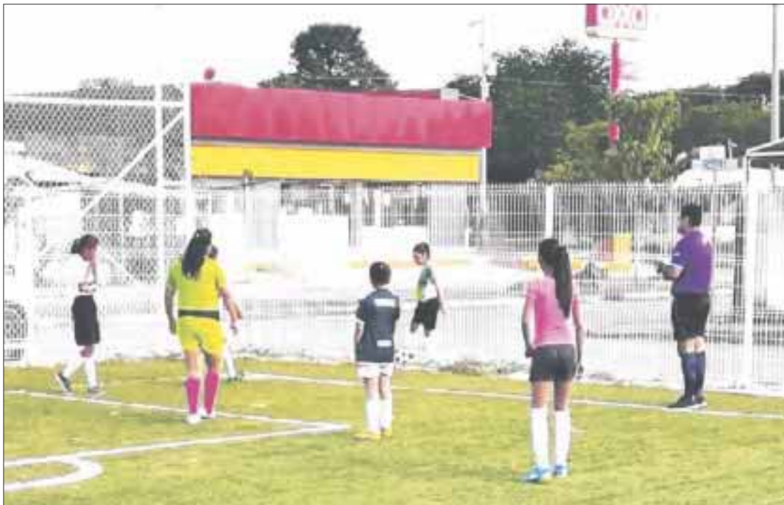
La Liga Femenil de Fut 6 en Chetumal comenzó a atraer a los aficionados por la intensidad que las féminas le ponen a su accionar en la cancha.

Goles espectaculares de Monserrat en la Liga Femenil de Fut 6