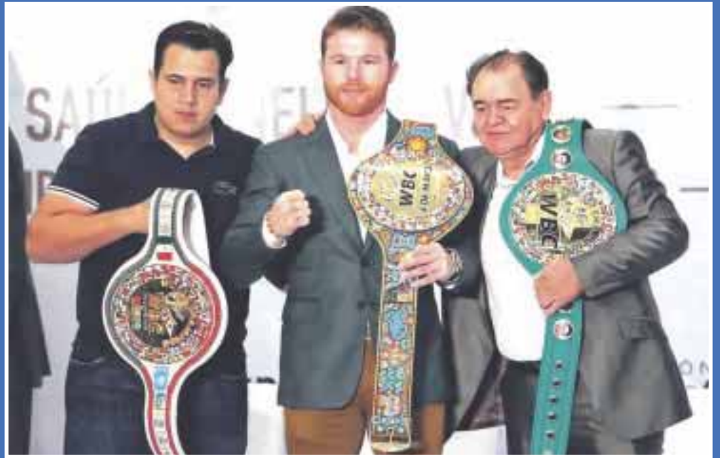
El boxeador Saúl “Canelo” Álvarez recibió el cinturón del título de peso medio del CMB y el cinturón decorado con arte huichol.

Además de la entrega del título peso medio del CMB, también se le otorgó el cinturón decorado con arte huichol.