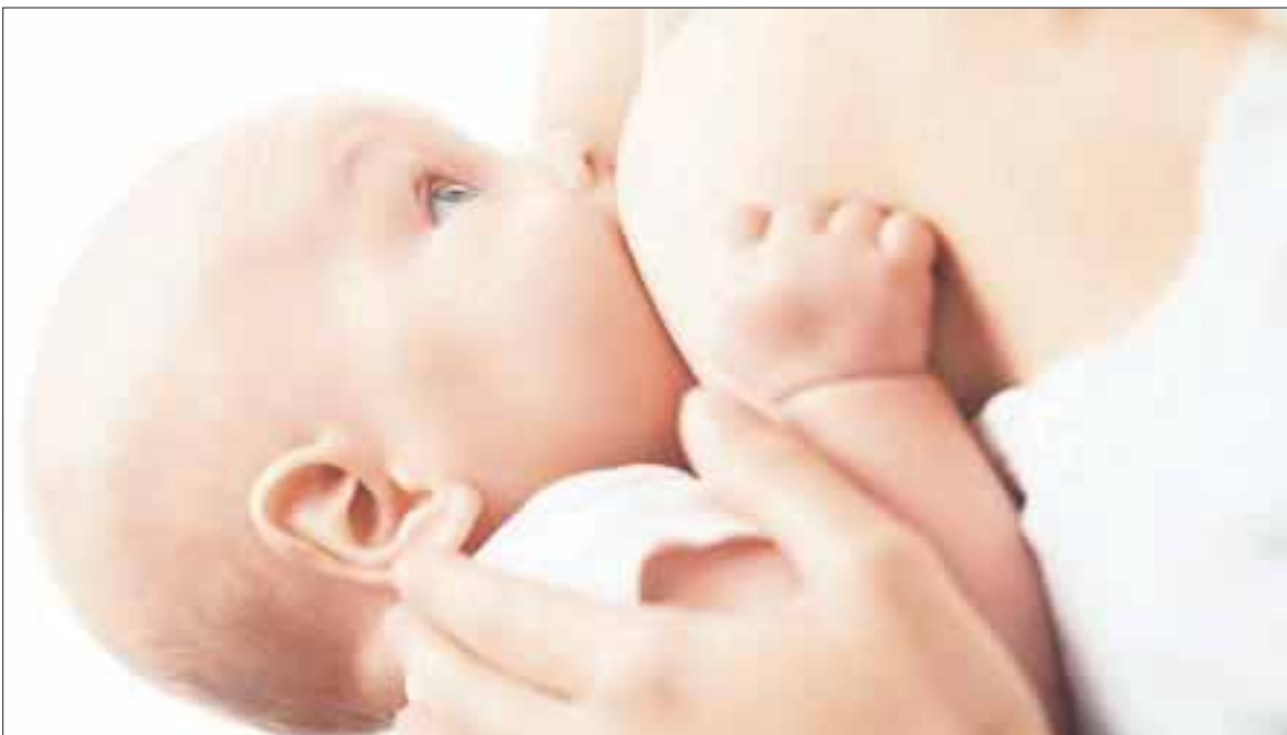
El Hospital General de Cancún recibió un equipo para sala de lactancia materna.

Cancún.- El Hospital General Jesús Kumate Rodríguez recibió un donativo de equipo para su sala de lactancia materna, equipo que vendrá a satisfacer la necesidad de extraer leche materna, vital para los recién nacidos durante los primeros seis meses de su vida.