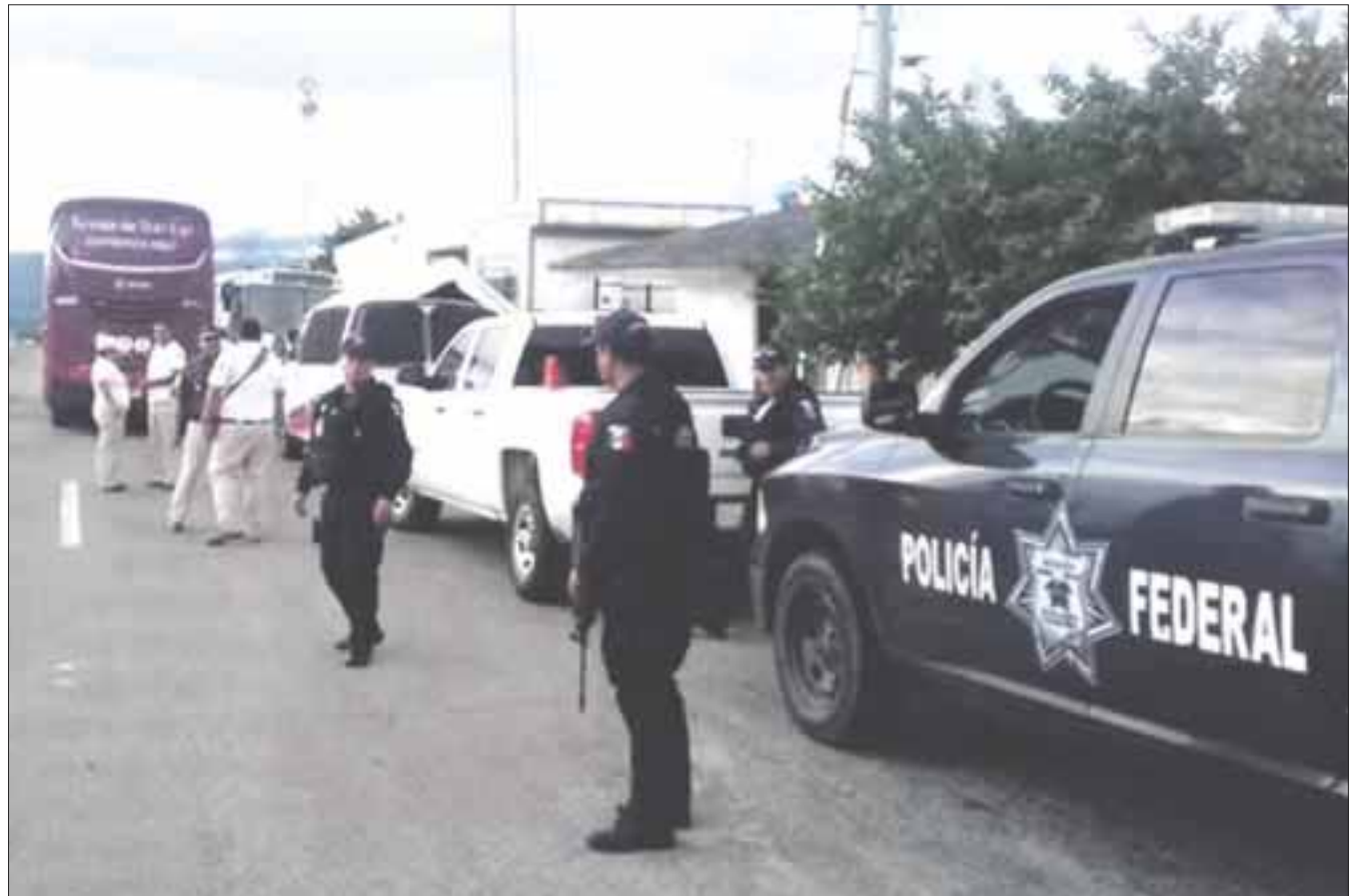
El comisionado general de la Policía Federal, Manelich Castilla Craviotto, se trasladó Chiapas para apoyar a las autoridades de Migración.

Asimismo, el artículo 37 de la Ley de Migración mexicana no contempla la emisión de ningún documento que conceda la internación a México sin cubrir los requisitos, por tal motivo, no se permitirá el ingreso a quienes incumplan lo marcado en la ley.