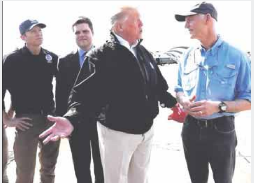
Donald Trump recorrió algunas de las zonas más dañadas por el paso del huracán "Michael", en Florida y Georgia.

Los esfuerzos de rescate se han visto obstaculizados por carreteras bloqueadas y enormes pilas de escombros.