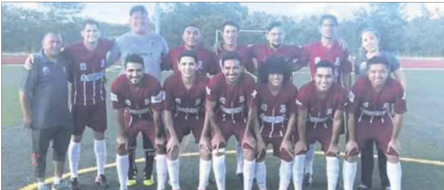
El equipo Enterradores le ganó al de Isla Mujeres en la jornada 10 de la liga Carlos Joaquín.

Cozumel.- La escuadra Enterradores gana de visita a Isla Mujeres en la jornada 10 de la superliga Carlos Joaquín y se perfila como uno de los favoritos a llevarse el torneo de futbol soccer.