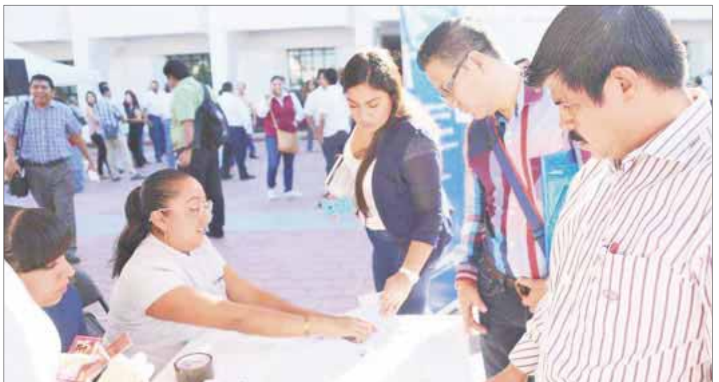
Mil vacantes de 30 empresas participantes se ofrecerán en Cancún con el inicio del programa Empléate .

Si bien de inicio participarán 30 empresas de diferentes giros y servicios, se pretende que dicho número se incremente para que las opciones laborales sean múltiples, y los trabajadores puedan mejorar su calidad de vida, con un empleo formal y un salario justo.