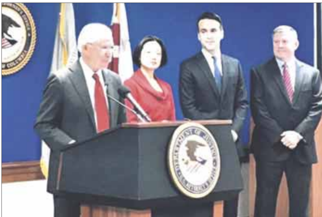
Jeff Sessions informó que serán objetivo el Cártel de Sinaloa y el Cártel Jalisco Nueva Generación.

El equipo de fiscales contra el tráfico internacional de narcóticos, terrorismo, crimen organizado y lavado de dinero investigará a los individuos y redes que prestan apoyo al grupo chií libanés, dijo Sessions