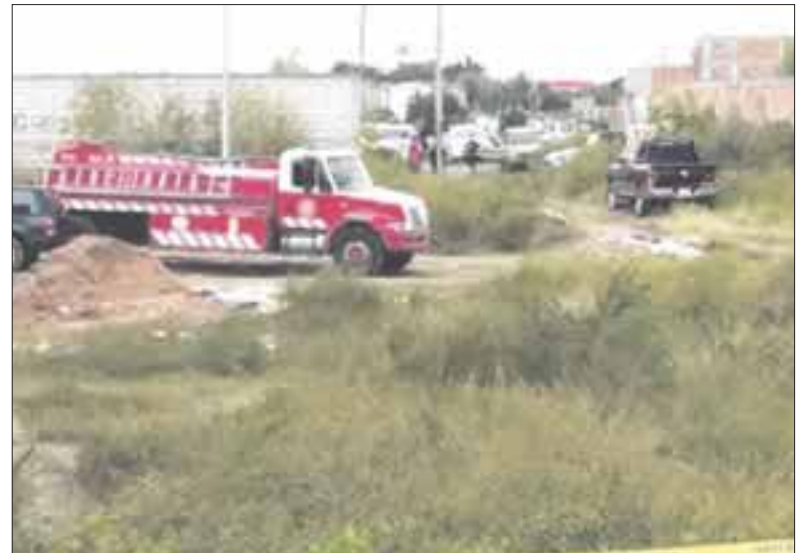
Autoridades estatales trabajan en un lote bardeado en la colonia Agua Escondida, en Tonalá, Jalisco.

De acuerdo con fuentes extraoficiales, se trata de personal del área de Desaparecidos de la Fiscalía estatal, que solicitó el apoyo de bomberos del municipio para hacer excavaciones.