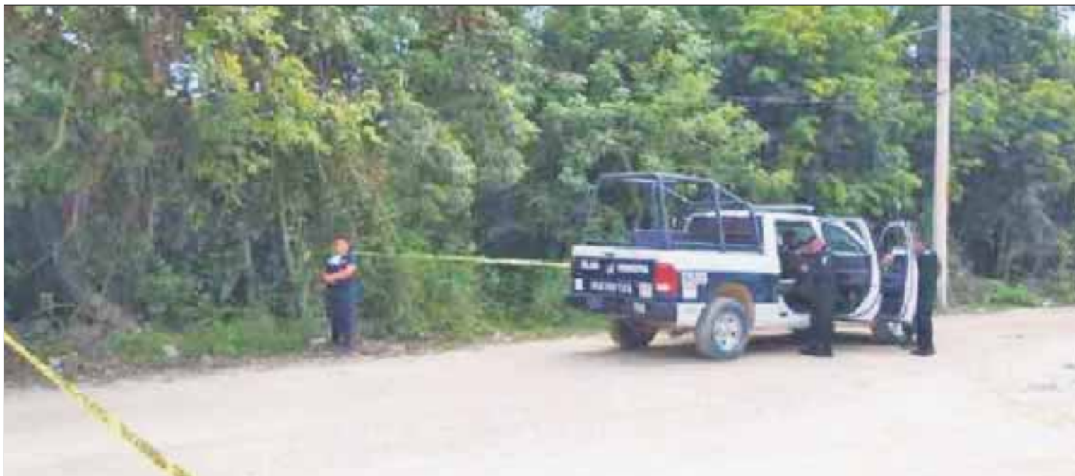
El cadáver fue levantado por elementos del Semefo para la realización de la autopsia de ley y determinar las causas de su muerte.