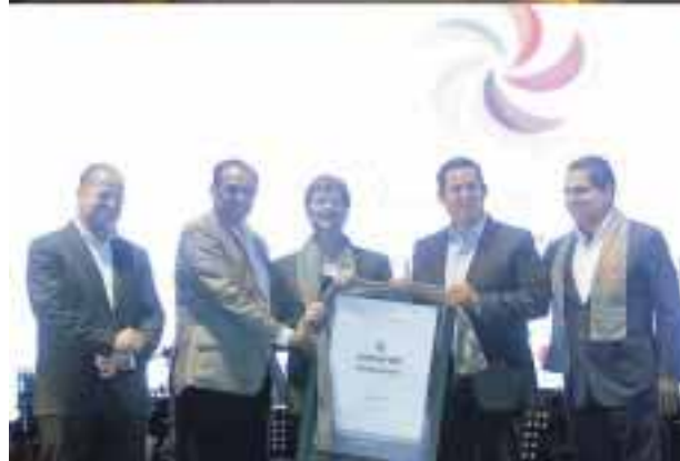
El nuevo Pueblo Mágico de Comonfort, Guanajuato.