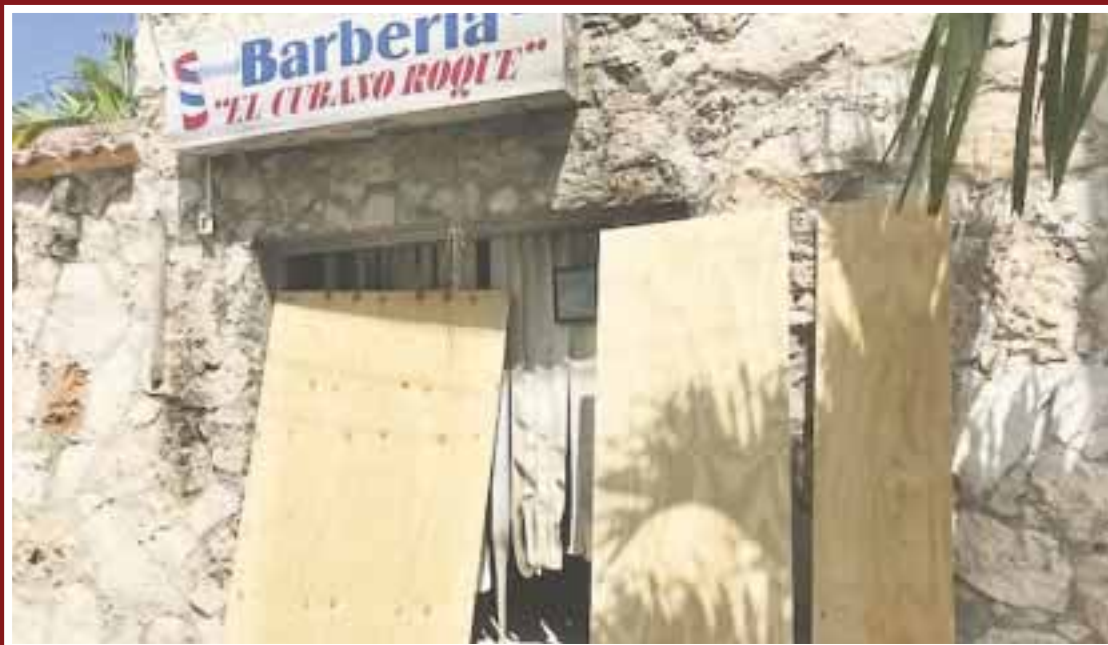
La barbería "El Cubano Roque" es una de las más antiguas en la ciudad.

Cancún.- El crimen organizado de nueva cuenta arremetió contra una barbería que fue no sólo rafagueada, sino quemada durante la madrugada en la Supermanzana 44 de la ciudad, luego de que hace unos días secuestraran a un dueño de varios negocios de este giro y fuera dejado en libertad, tras un pago millonario como rescate.