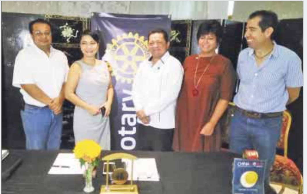
Se anunció que el nuevo club, cuyo nombre se definirá en la primera sesión oficial, de manera específica, trabajará en el programa "Conoce a tu Policía".