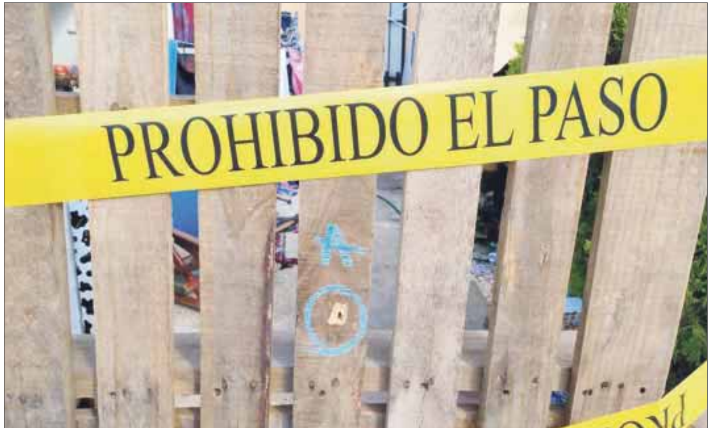
En plena balacera un hombre perdió la vida, en tanto que otros dos sujetos y una mujer terminan detenidos.

Dentro de la vivienda fueron encontradas dos armas largas, tipo fúsil, calibre .223, múltiples cartuchos, una bolsa con cocaína, otra con marihuana, una báscula gramera, 13 bolsitas con marihuana (listas para vender al menudeo) y 12 dosis de crack, así como tres motocicletas.