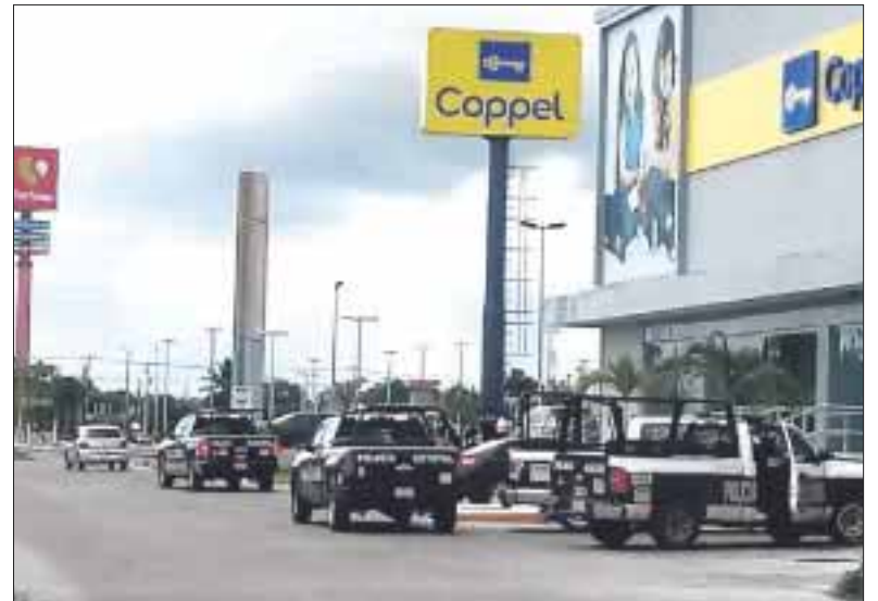
En 24 horas ocurrieron tres asaltos diferentes a comercios, uno, a una anciana y cuatro robos, a casa habitación.

El tercer asalto a otro comercio, el minisuper Yalcab, fue perpetrado a punta de pistola y se ubica en las avenidas Primitivo Alonso Alcocer con Santiago de Chile de la colonia Américas 3