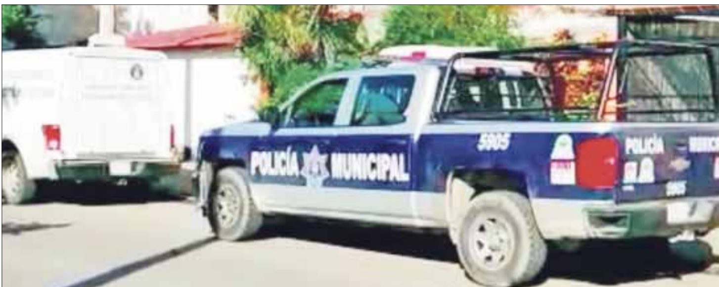
El cadáver aún permanece en calidad de desconocido, hasta que sus familiares lo reclamen, fue levantado por elementos del Semefo para la autopsia de ley.

Cancún.- Una persona de la tercera edad fue encontrada sin vida, con signos de violencia y varias heridas con arma punzocortante, de acuerdo con un reporte preliminar de la Policía Municipal de Benito Juárez.