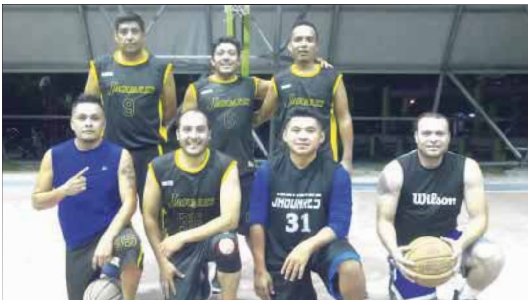
Jaguares va por la revancha en este nuevo torneo sabatino de tercera fuerza del domo de la región 103.

Cancún.- El equipo Jaguares que se quedó en la orilla, en el torneo anterior sabatino de tercera fuerza del domo de la 103, perdiendo la final ante Novaniuts, empezó a tambor batiente el nuevo torneo que está iniciando, tras superar por paliza de 20 puntos de diferencia a la quinteta de Gladiadores.