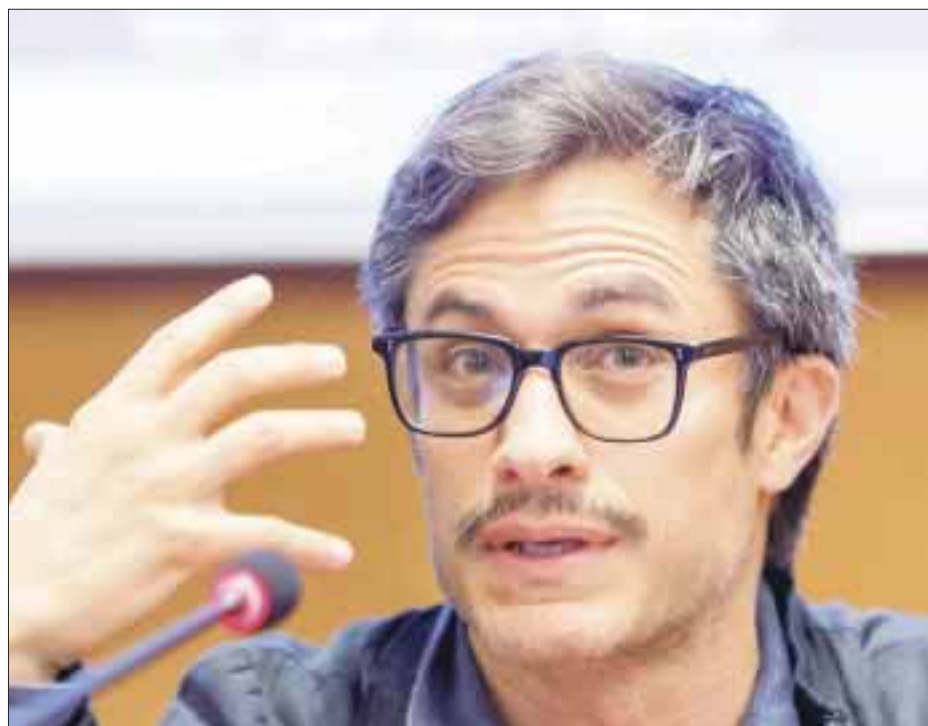
Actualmente Gael promociona su más reciente película "Museo", que se estrenará el 26 de octubre en salas de cine.

desde que cruza la frontera de Guatemala con dirección a Estados Unidos, a la par el actor recordó el momento en el que decidió cruzar la frontera sur de México sin documentos, "crucé una vez a otro país sin visa, caminando por el río Suchiate, quien conoce la frontera sabe que el problema no es el filtro, la frontera es muy permeable, se puede caminar, el problema es lo que hay después y cómo se ha criminalizado a las personas que solo buscan una vida mejor". "Museo", es el más reciente filme de García Bernal, se encuentra en la competencia del Festival Internacional de Cine de Morelia y se estrena el próximo 26 de octubre en cines, trata sobre el robo que sufrió el Museo Nacional de Antropología e Historia, en la