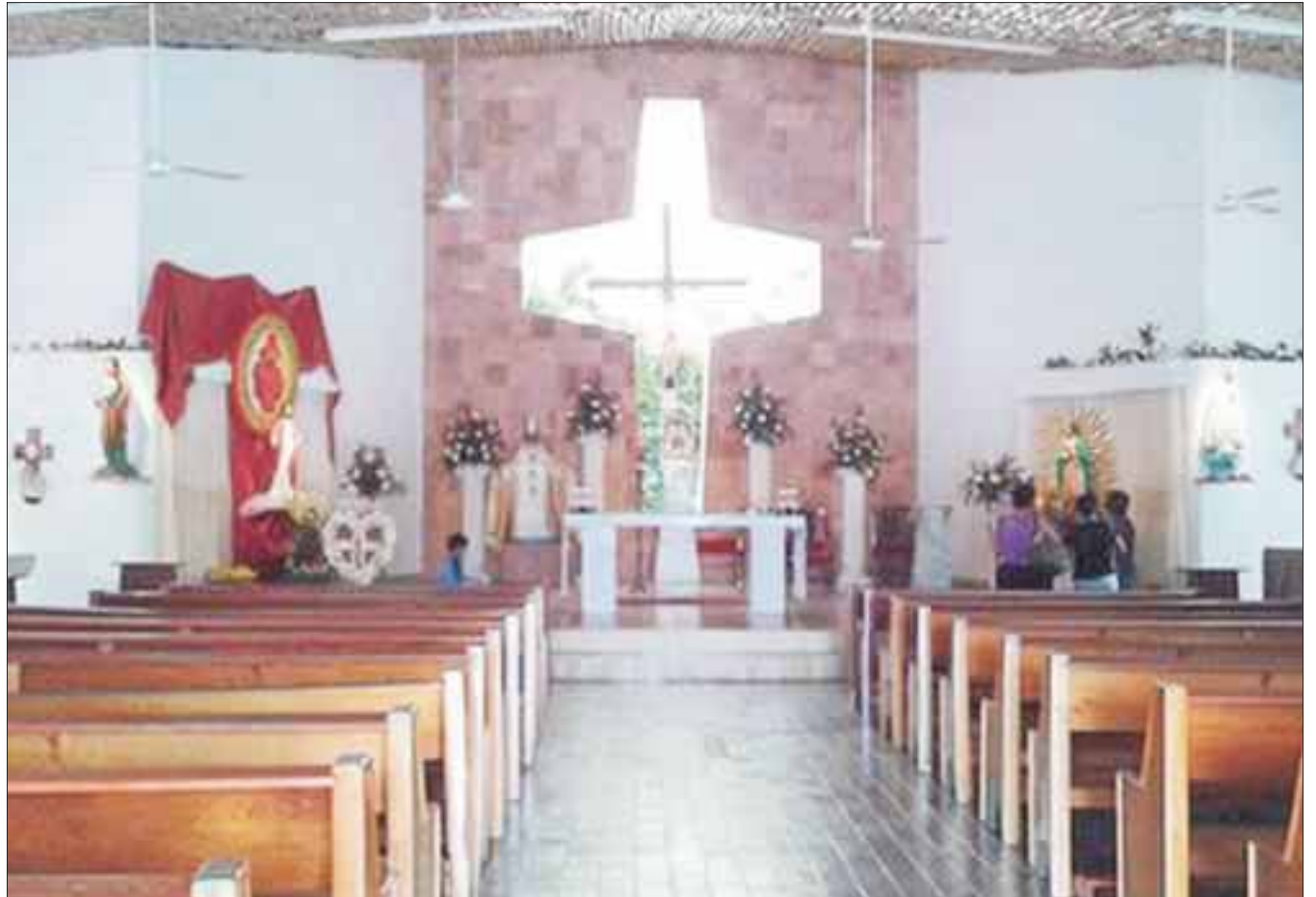
La Iglesia católica es víctima de extorsión entre algunos de sus sacerdotes.

Figurar en en inseguridad es vergonzoso por lo que agregó, “Es un cuestionamiento muy fuerte para nosotros, porque un lugar paradisíaco y tan hermoso, a donde vienen miles de personas a disfrutar, se tiene que encontrar con esta otra cara de la moneda, que es como un desdecir la belleza física contra el destroz del corazón humano”.