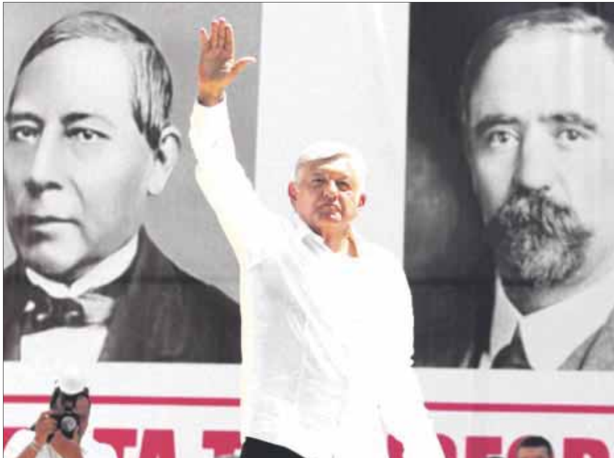
El Presidente electo, Andrés Manuel López Obrador , refrendó su apoyo a los migrantes centroamericanos indocumentados, a quienes ofreció visas de trabajo.

El spot agradece a López Obrador por “defender que el