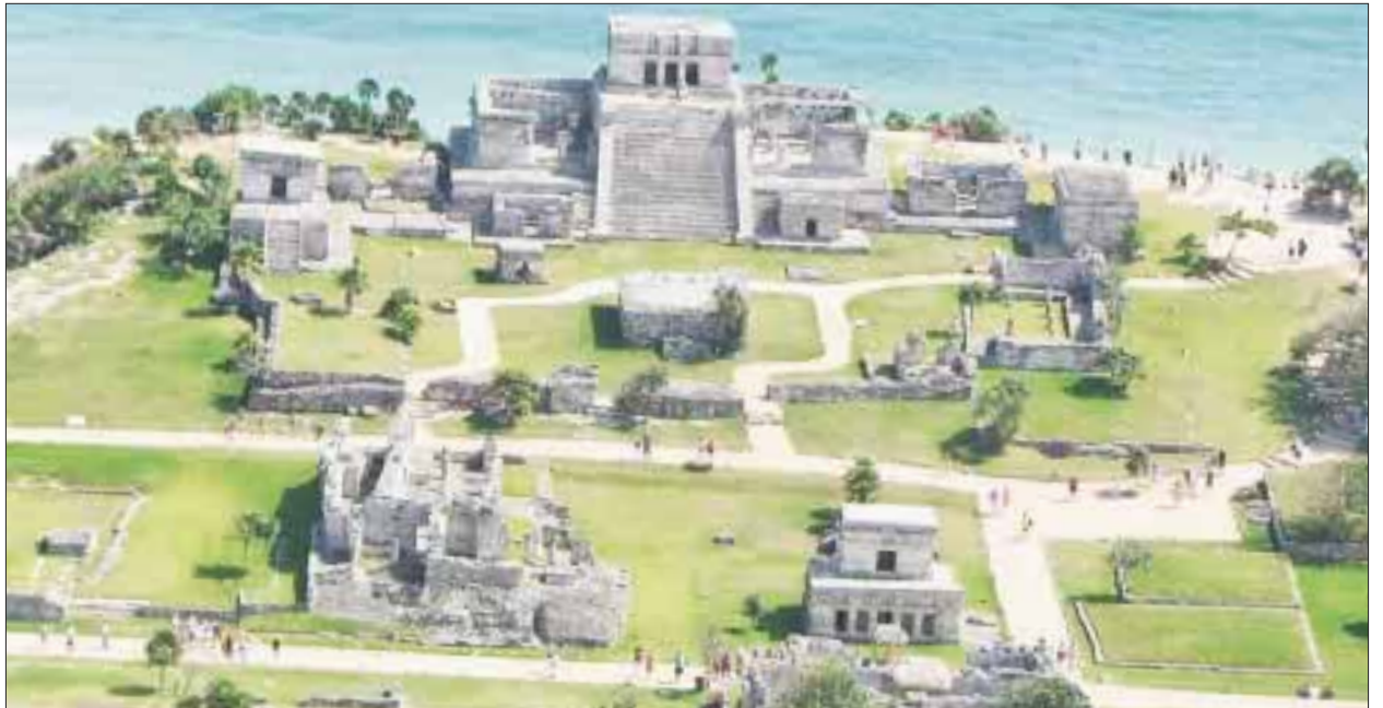
Este destino es proveedor de visitantes nacionales e internacionales que acuden a sitios arqueológicos como Chichén Itzá, lo que llevó a las autoridades a diversificar Cancún.

A fin de lograr las metas de diversificación del destino, se establecerán estrategias de promoción en coordinación con los tres niveles de gobierno para que los resultados permeen en todos los sectores vinculados con la industria sin chimeas de Cancún.