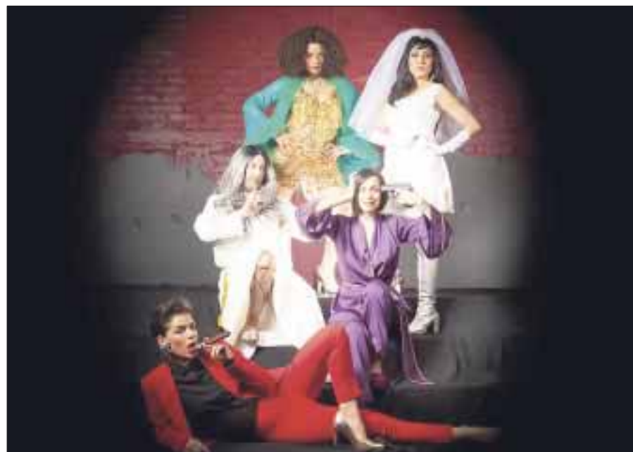
“Consígueme una vida” narra una historia trágica a partir del humor.