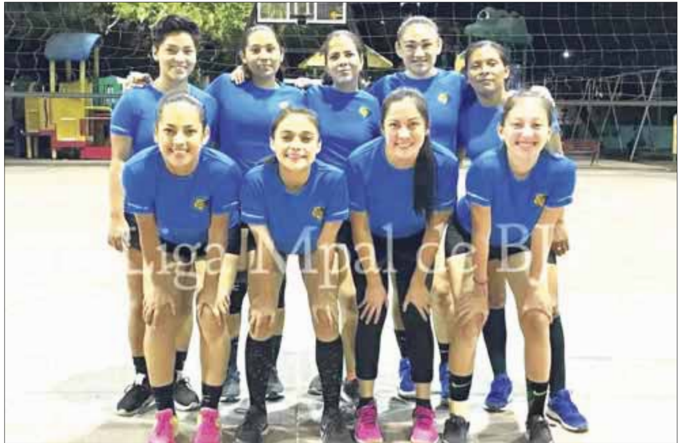
Cobras se mantiene de sublíder en el voleibol de segunda fuerza de la región 94, con una sola derrota.

En tercer lugar se ubica Troyanas, quien en cinco partidos jugados llevan números de 3-2, para una diferencia de 17 y 6 puntos totales, le sigue muy de cerca empatadas en la cuarta posición Tesoros, Avengers y Pink Magic con el mismo récord de 2-2 para 4 puntos cada una de ellas, pero mejor posicionadas por las diferencias de unidades Tesoros con 29, Avengers con -7 y abajo Pink Magic con 4. Ya más debajo de la tabla nos topamos con Sirenas con marca negativa de 2-3, con 13 unidades a favor para 4 puntos totales, pero con un partido más jugado que los equipos anteriormente mencionados, ya en el fondo de standing, sin conocer aún el triunfo se encuentran Merluzas con 0-4 y Ladies 0-5, prácticamente ya fuera de las posiciones para las eliminatorias. Cabe mencionar que dicho evento está afiliado a la Liga Municipal de Voleibol de Benito Juárez.