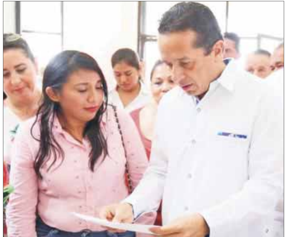
Las estrategias de seguridad del gobernador Carlos Joaquín privilegian la protección a la mujer.

Los GEAVIG fueron creados en el gobierno de Carlos Joaquín, para atender de manera inmediata aquellos casos de violencia familiar y de género, salvaguardando la integridad física de los ciudadanos,