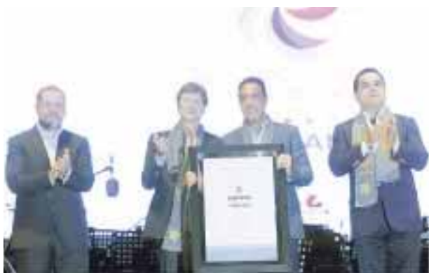
Zimapán, Hidalgo, reconocimiento que entregó Enrique de la Madrid.