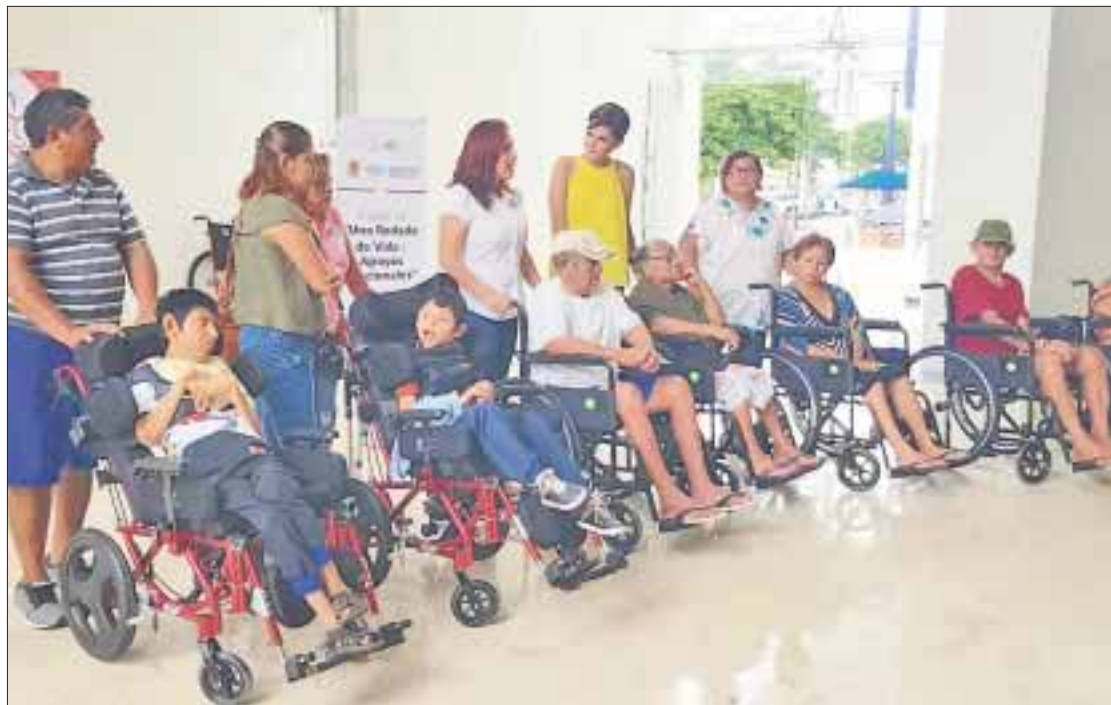
Bastones, andaderas y sillas de ruedas ayudarán a sus nuevos propietarios a mejorar su calidad de vida.