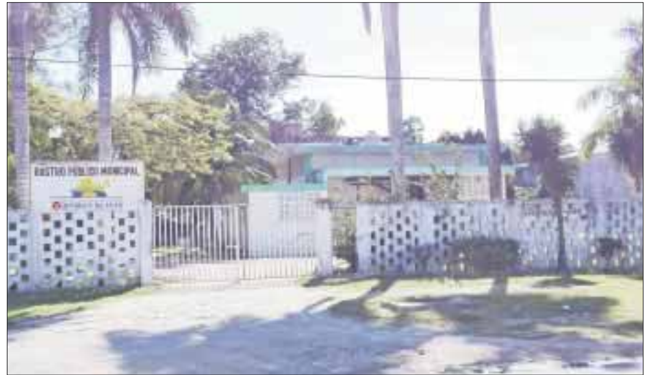
La inauguración del rastro municipal deberá esperar quizá meses o años, pues las obras no van ni a la mitad, por falta de presupuesto.

En esta primera parte se invirtieron más de 15 millones de pesos, provenientes del Fondo de Fortalecimiento Municipal.