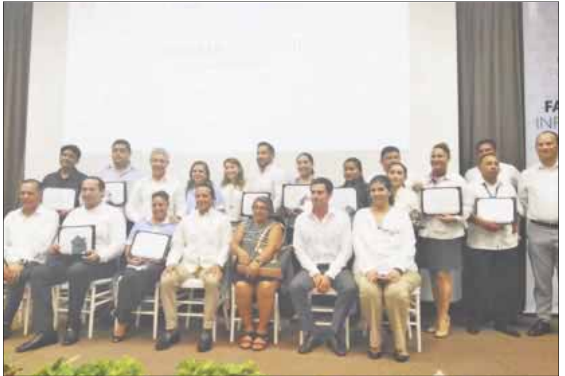
El gobernador Carlos Joaquín hizo una recapitulación de logros del Infonavit en el estado.

En este acontecimiento realizado en el Planetario Ka' Yok', asistieron los directivos de las 20 empresas constructoras de vivienda de interés social, que trabajan con el Infonavit y pertenecen a la CANADEVI.