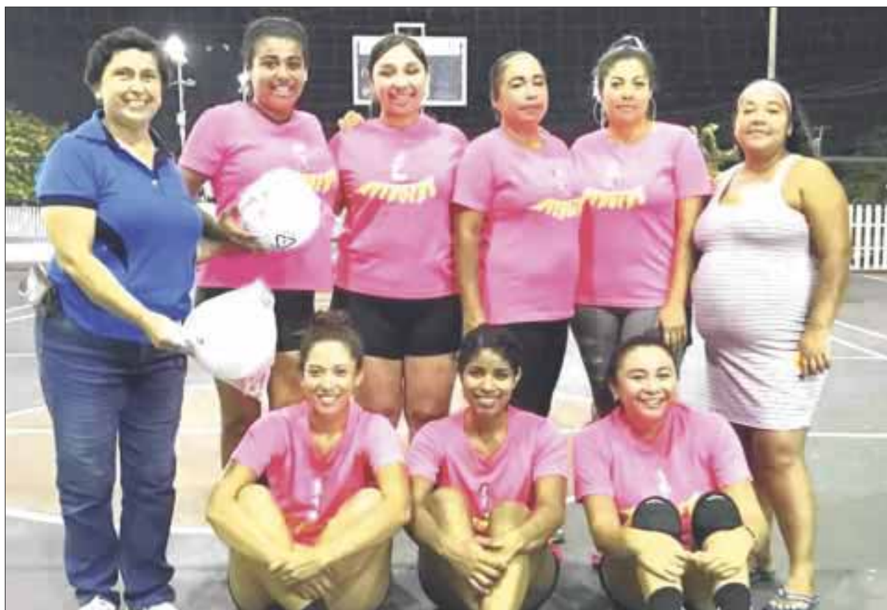
Avengers superó en dos sets a su similar de Sahoris en voleibol en Benito Juárez, para ser las nuevas monarcas.

En otro juego pendiente por el tercer lugar en la categoría intermedia, Niupi superó a Chikys, viniendo de atrás en tres sets, el primero lo ganaría Chikys 25-16 y en un muy apretado segundo set, Niupi lo ganaría para empatar los cartones a un periodo por bando, decidiéndose en un tercer y decisivo set el tercer lugar de esta categoría, siendo éste para Niupi 15-3.