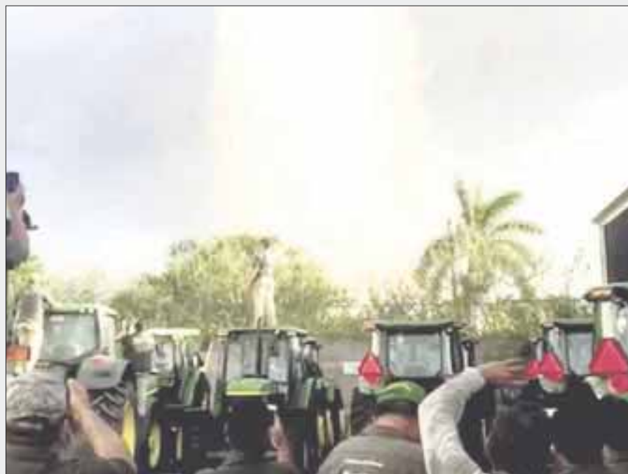
El fenómeno natural llamó mucho al atención, por ser un un hecho atípico, por su fuerza, y es causado probablemente por el cambio climático.

En 2012 y 2017 se registraron fenómenos similares en Navolato y en 2012 en Guasave.