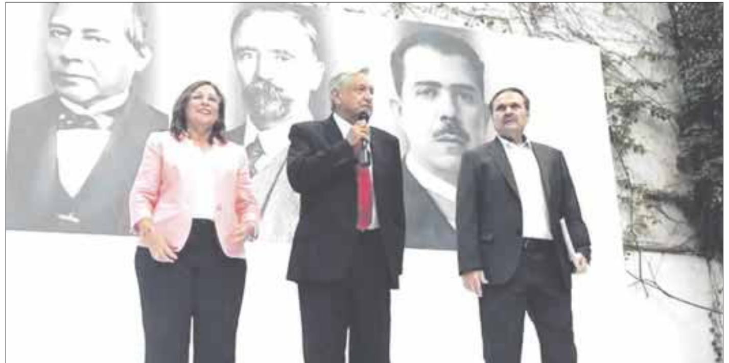
Andrés Manuel López Obrador se pronunció por ver hacia adelante y rescatar y fortalecer las industrias petrolera y eléctrica.

Recordó que “cuando se iba a aprobar la reforma energética se dijo, y está en los considerandos de la ley, que para este año se iban a estar produciendo tres millones de barriles diarios y ese pronóstico falló porque se están extrayendo un