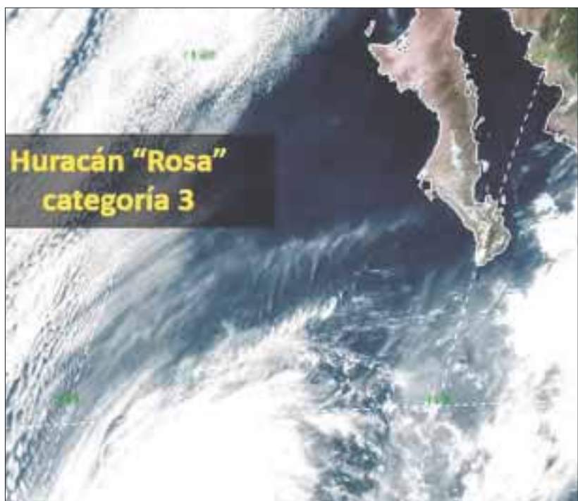
"Rosa" se desarrolló a categoría 3, el cual se localizó a 915 kilómetros de Cabo San Lucas, Baja California Sur.

Mazatlán fue cerrado a la navegación de embarcaciones menores