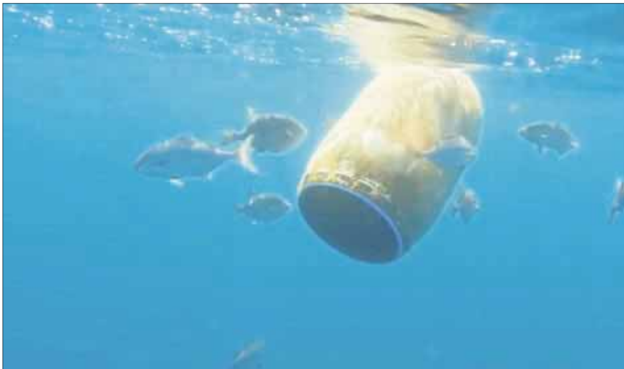
Con la campaña “Desplastifícate”, se hace conciencia del daño irreversible que se provoca a la flora y fauna marina con el consumo de plástico.

Ante dicho panorama, no descartó que en breve, Quintana Roo logre sacar adelante una nueva normatividad en el uso, manejo y destino del plástico, que algunas empresas de manera responsable están tratando de sacar del consumo de sus clientes, como es el caso de los popotes.