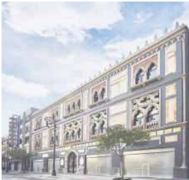
El nuevo hotel en el centro de la Ciudad de México.

victoriagprado@gmail.com Twitter: @victoriagprado