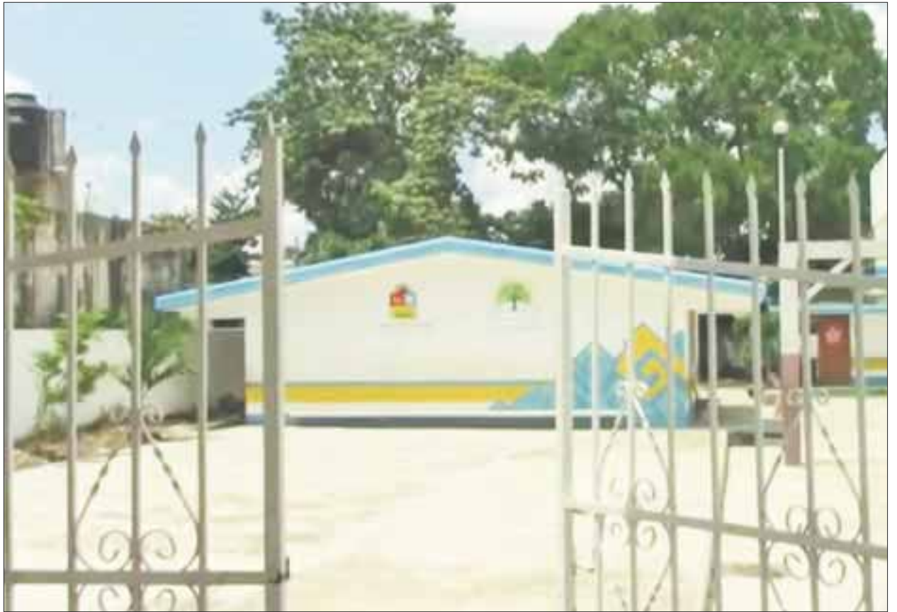
Los padres de familia exigen justicia para el menor violado de 7 años en la escuela primaria Simón Bolívar.

La denuncia ya se interpuso por los agraviados, pero el respaldo de las autoridades va más allá de realizar de forma correcta su función, al intentar confundir al agraviado a la hora de relatar los hechos e interponer su denuncia aprovechándose de su posición vulnerable para que caiga en contradicciones.