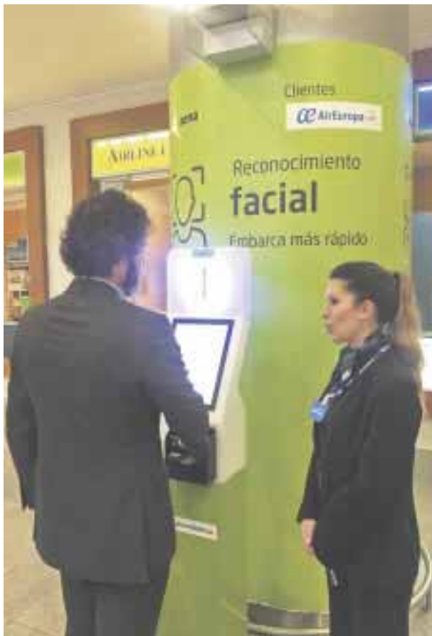
Reconocimiento facial para abordar, está a prueba.

La implantación del embarque biométrico facial ha sido posible gracias a la participación conjunta de Aena y las dos empresas del grupo Globalia, Air