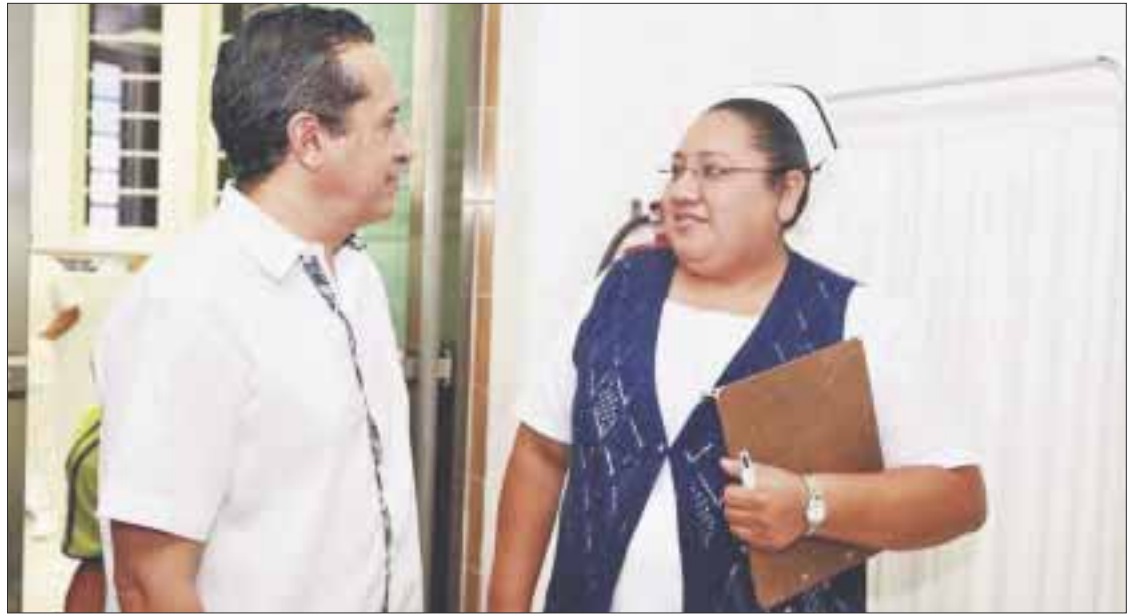
Las mejoras fueron en la Unidad de Cuidados Intensivos Neonatales y en el área de Rayos X.

Actualmente, en esta área se tienen cuatro cunas de terapia intensiva y dos aislados, dos cunas de terapia inter-