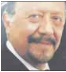
Por Sócrates A. Campos Lemus

Los aztecas decían que el oro era la mierda de los dioses y, del oro nacieron las grandes potencias en Europa y, en México, todo estaba centrado en la explotación de la plata y el oro y en eso se fueron dando cuenta de que al final de todo, solamente el trabajo y los medios de producción generaban la riqueza y aparecieron las estancias y la explotación y los hacendados y caciques y toda clase de cucarachas y basura política que nos mantiene en la sumisión