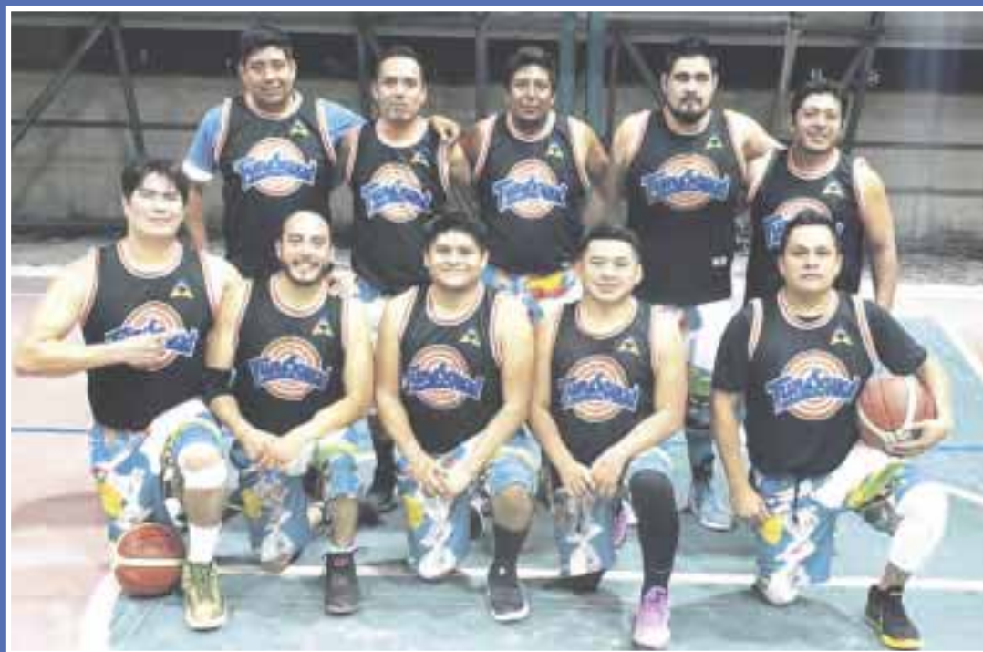
Jaguares llegan invictos a la final de segunda fuerza del domo de la 103 contra Mulatos.

Cancún.- Siendo contundente en sus respectivos juegos, Mulatos y Jaguares dejan en el camino a Sixers y Mayas en el basquetbol de segunda fuerza del domo de la 103, para así disputar la final el próximo sábado a las 20:30 horas, mientras que el tercer lugar lo jugarán a las 19:30.