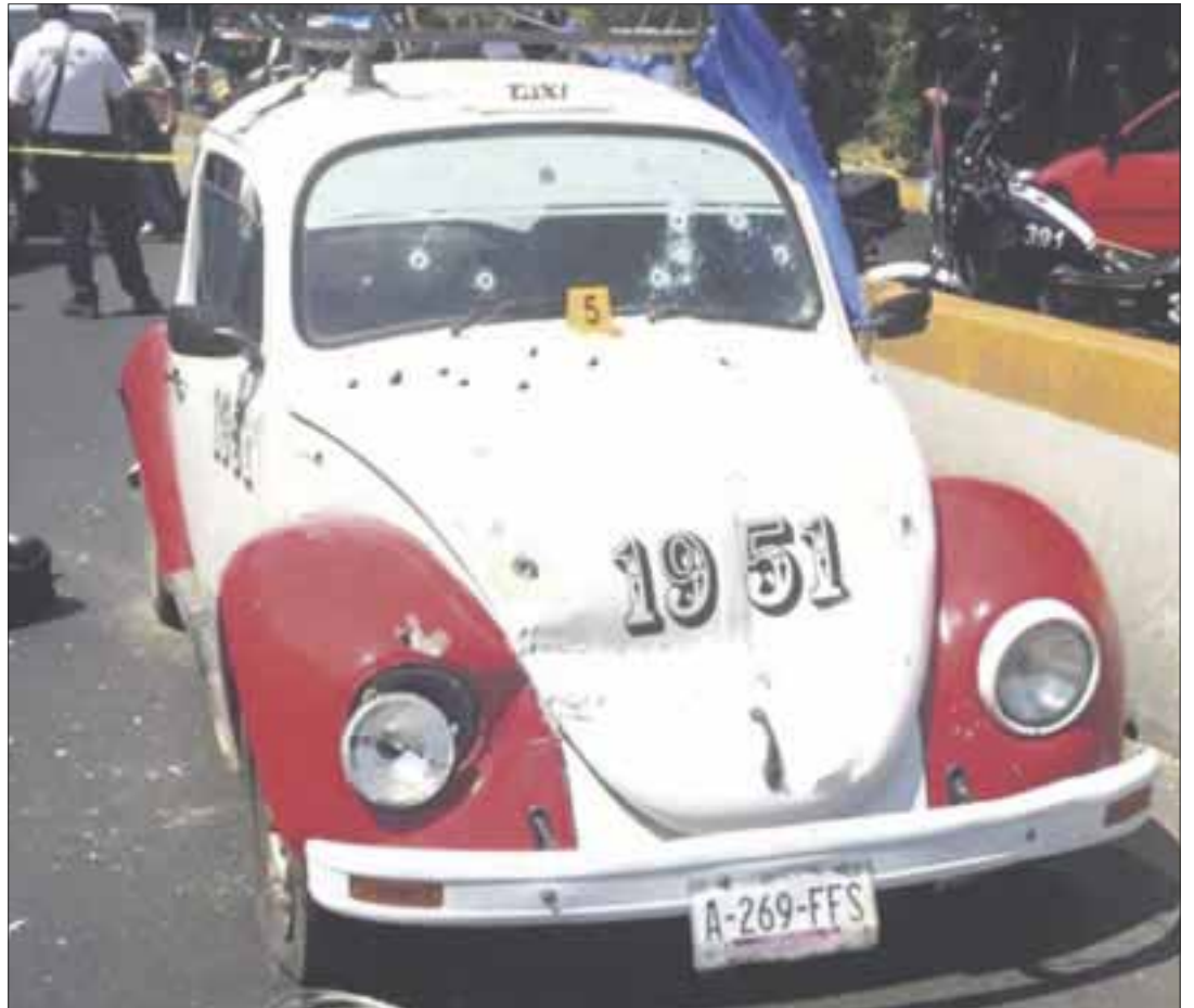
Los cuatro extorsionadores fueron abatidos dentro de un taxi por los ministeriales.

Inmediatamente, se aseguró el lugar de los hechos y procedió a desarrollar las diligencias de ley, asegurándose la unidad en que se transportaban las 4 personas, las armas de fuego que usaron en contra de los elementos oficiales y el dinero producto de la extorsión que minutos antes habían recogido.