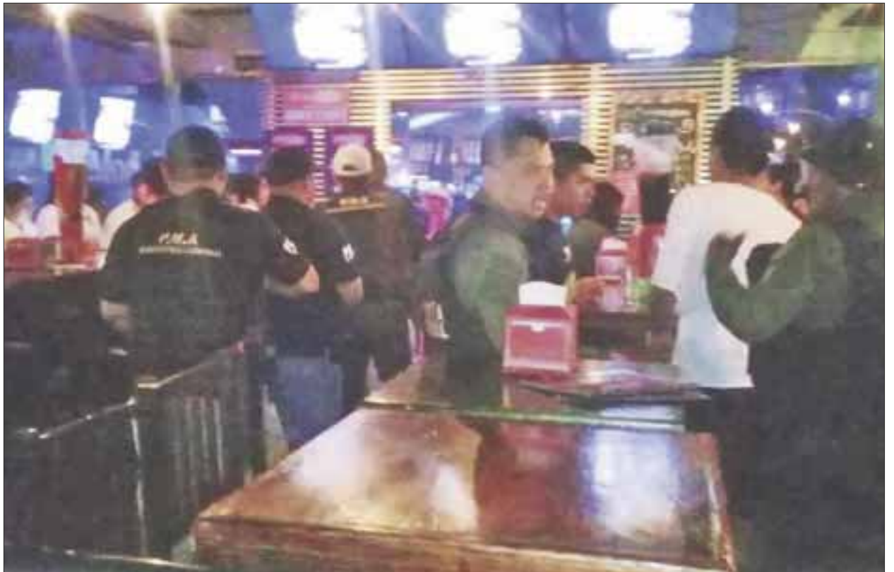
En el operativo, tres personas no quisieron colaborar, se pusieron violentos y además insultaron a la autoridad.

Además se detuvo a otra persona por portación y comercialización de polvo blanco, en el bar Teresita de la Región 100, avenida 127 con avenida López Portillo, quien fue puesto a disposición de la autoridad.