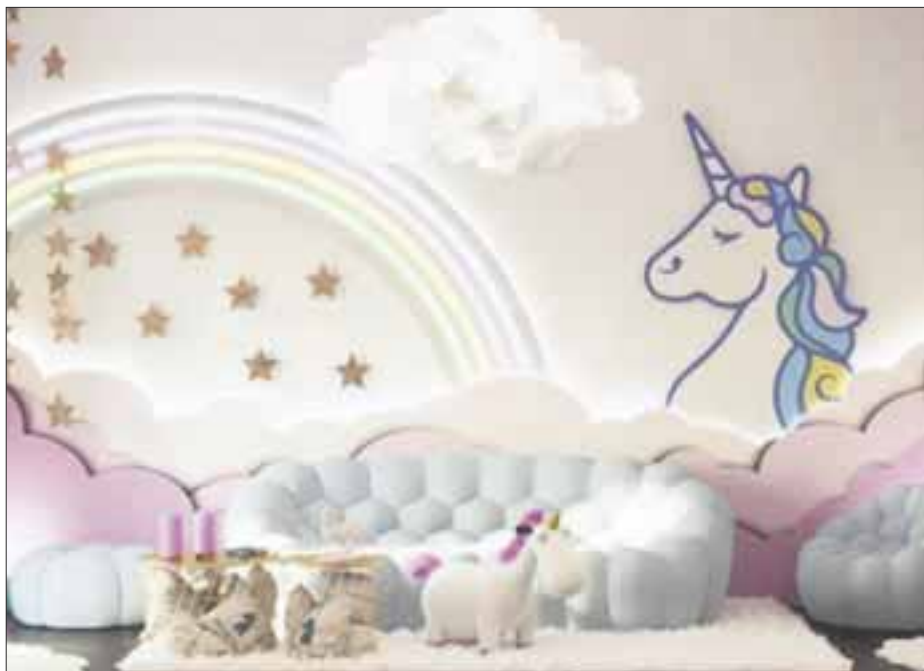
A celebrar el Día Internacional del Unicornio.