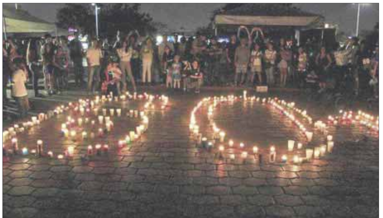
Una hora en penumbras se mantuvo la ciudad, como parte de la celebración del Día del Planeta.

Se trató de un apagón eléctrico, en el que millones de hogares y empresas en el mundo apagan las luces y otros aparatos eléctricos de manera voluntaria durante una hora con el fin de recordar a la población que reducir el consumo de luz es necesario para enfrentar el cambio climático y también la contaminación lumínica.