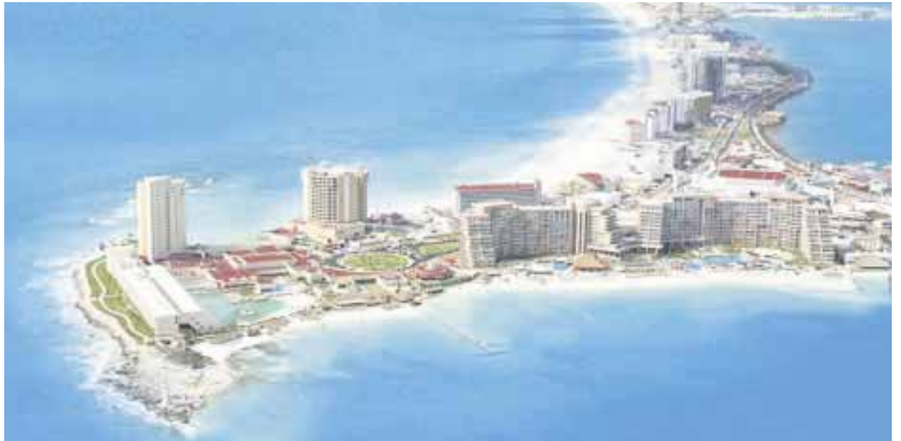
El Caribe mexicano tendrá excelente ocupación en Semana Santa.

A esto se suman tres aeropuertos internacionales, disponibilidad de asientos de avión de más de 6 millones sólo de Nor-