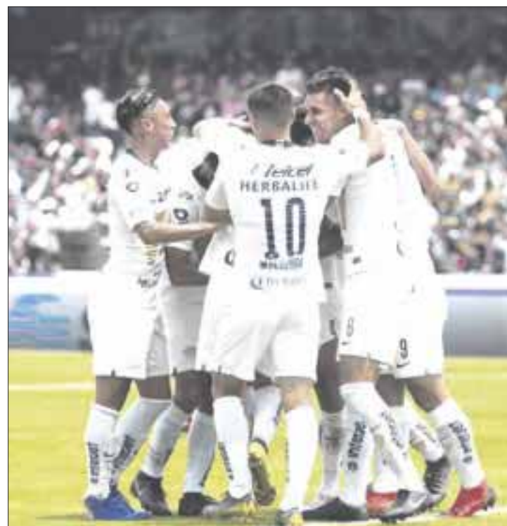
Pumas se impone 2-1 a Chivas, que está sumergido en una crisis de resultados con cinco duelos de liga sin ganar.

Con este resultado, los dos clubes siguieron fuera de zona de Liguilla, pero Pumas cortó una racha de cuatro sin ganar para llegar a 13 unidades, mientras que Guadalajara se quedó con 15 y con cinco duelos sin victoria