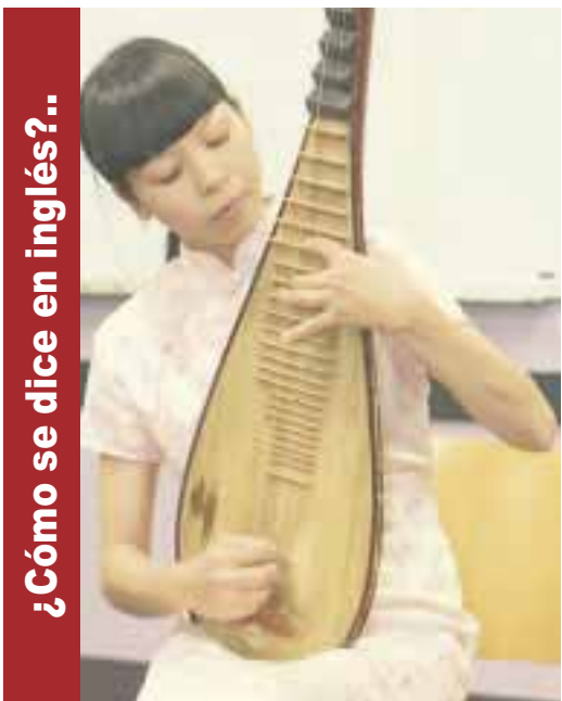
¿Cómo se dice en inglés?..