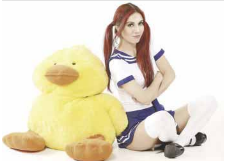
El video muestra simultáneamente a tres "Sherys" diferentes.