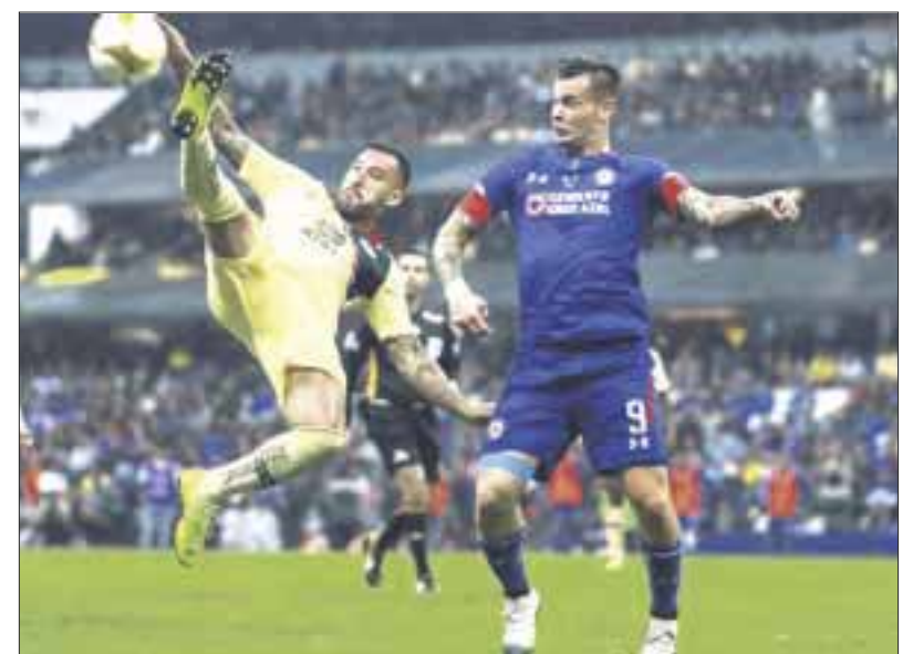
Cambian de horario el clásico joven entre América y Cruz Azul. El duelo estaba anunciado a las 18:30 horas, ahora será a las 18:00.

de Óscar Mejía, en el Jalisco y culminará el domingo a las 20:30 con el Monterrey-Santos, a cargo de Luis Enrique Santander.