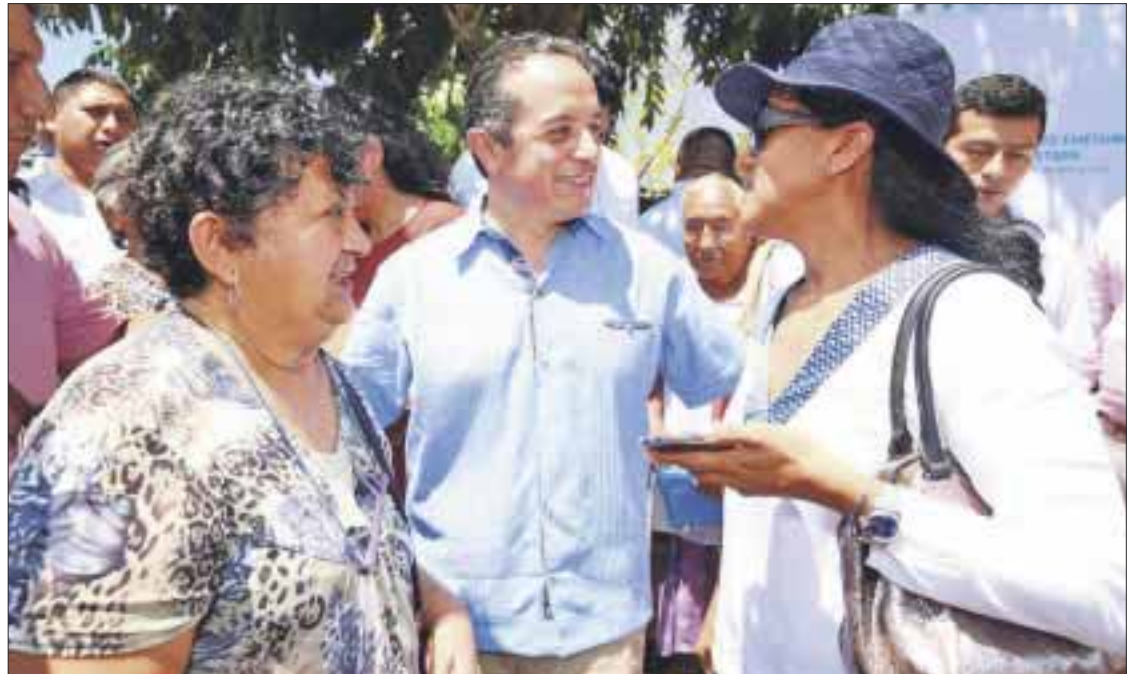
El gobierno de Carlos Joaquín destina más de 300 millones de pesos en obras de rehabilitación.

“Pueden decir lo que quieran, yo prefiero dar resultados, entregando campos deportivos nuevos, rescatando más de 50 parques que estuvieron abandonados para ponerlos al servicio de la gente. Todavía falta mucho por hacer y por eso seguiremos trabajando, con resultados. Puedo decirles se trata de me-