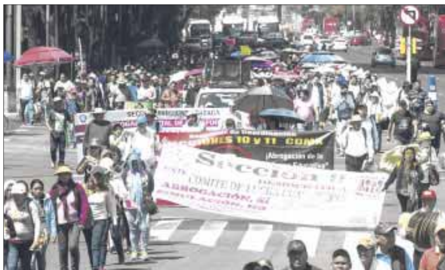
Luego de bloquear vialidades primarias de la Ciudad de México, los maestros de Oaxaca rechazaron diálogo con autoridades educativas. Con AMLO o nada.

La Coordinadora Nacional de Trabajadores de la Educación (CNTE) advirtió que no aceptará los supuestos condicionamientos por parte del presidente Andrés Manuel López Obrador para establecer un diálogo directo sobre el tema de la reforma educativa.