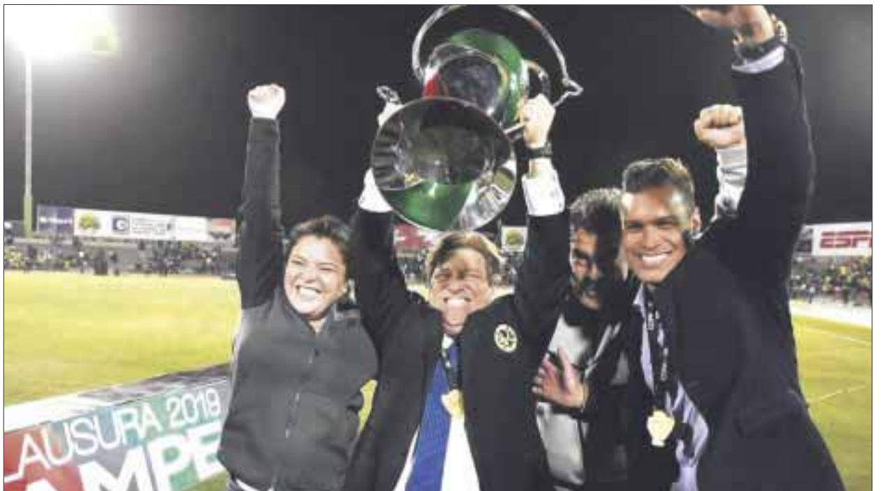
Con el campeonato de la Copa MX, Miguel “Piojo” Herrera alcanzó su tercer triunfo en su trayectoria como entrenador.

Raúl Cárdenas obtuvo sus campeonatos en 1975-76 en Liga y en el Campeón de Campeones, en 1977 la Concachampions y la Interamericana en 1978.