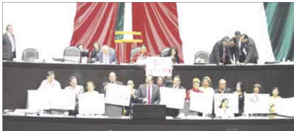
Con protestas, fue aprobada en lo general en la Cámara de Diputados la reforma laboral, que entierra el “charrismo” sindical.

“A pesar de las actitudes antidemocráticas del proceso en la Comisión de Trabajo que asumieron el presidente de la Comisión de Trabajo en esta legislatura, del atropello a los derechos de los diputados de esta comisión, votaremos a favor de esta iniciativa con responsabilidad hacia México”.