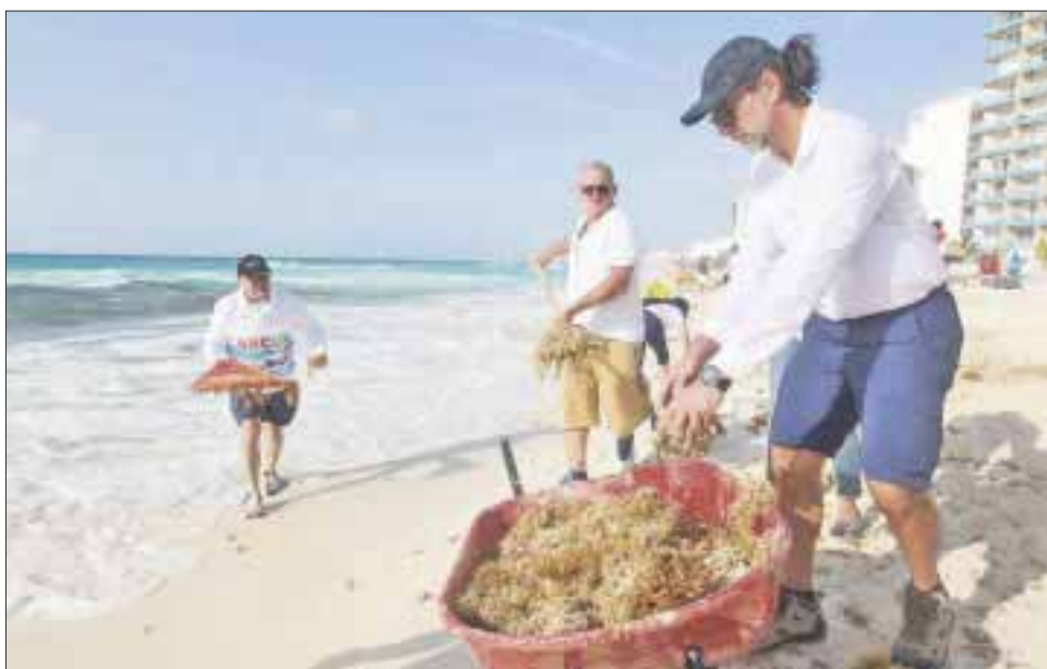
Científicos del Instituto de Limnología y Ciencias del Mar de la UNAM en Puerto Morelos, llevan investigando el fenómeno cuatro años.

Cancún.- Según estudios realizados por investigadores de la Universidad Nacional Autónoma de México, la presencia masiva de sargazo en las costas del Caribe mexicano sí tiene efectos negativos en los pastos marinos, la composición de la arena, los arrecifes de coral e incluso en la fauna marina. Lo anterior, difiriendo de lo que recientemente arrojaron resultados de la Secretaría de Marina, que dio a conocer que, de acuerdo con una investigación realizada por la dependencia en conjunto con la Universidad Autónoma de Baja California (UABC) se dictaminó que el sargazo no representa un factor de contaminación.