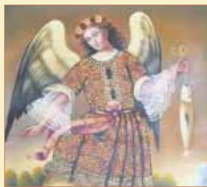
IMAGEN DEL ARCÁNGEL SAN RAFAEL. Este arcángel ayuda y procura de tu salud y también la de algún pariente o de tu familia en general, dependiendo por quien le pidas en tus oraciones.