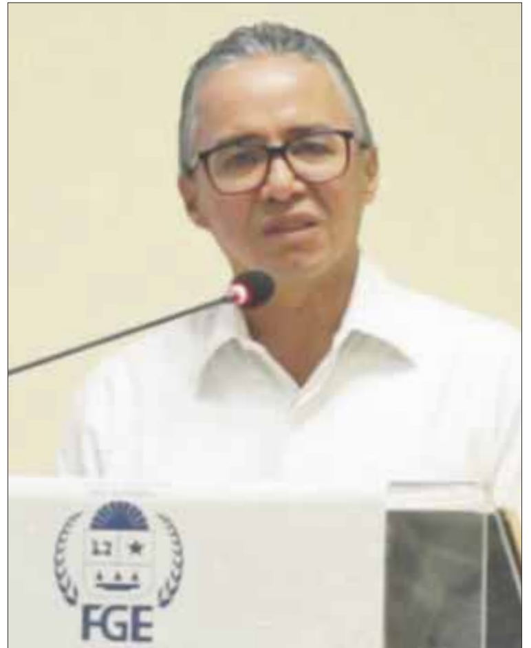
Óscar Montes de Oca, fiscal general de Quintana Roo, se comprometió a indagar a fondo cada una de las desapariciones en la entidad.

Posteriormente, el 4 de agosto desaparecieron dos ciclistas en Villas Otoch Paraíso, luego de haberse adentrado en la selva para realizar un recorrido en rutas trazadas y frecuentadas por el Club de Ciclistas, pero ninguno de los dos fue visto, ni volvió.