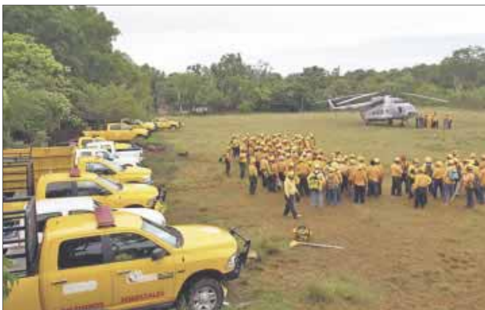
Brigadistas se mantienen en vigilancia para detectar nuevas conflagraciones en las zonas ya controladas.

Felipe Carrillo Puerto.- El incendio en la Reserva de la Biosfera Sian Ka'an denominado "Uaimil", en el municipio de Felipe Carrillo Puerto, cuenta con un avance del 70% de control y 40% de liquidación en una superficie estimada de mil 100 hectáreas, de acuerdo al informe del Equipo Estatal de Manejo de Incidentes.