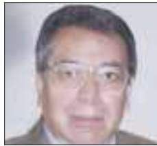
Por Roberto Vizcaino

La información fue incluso de primeras planas el lunes, al menos Reforma lo reportó así y Forbes la hizo llegar al resto del mundo financiero en todo el orbe: la incertidumbre que provoca el gobierno de México ha provocado una corrida de al menos 8.5 mil millones de dólares entre enero y julio de este año.