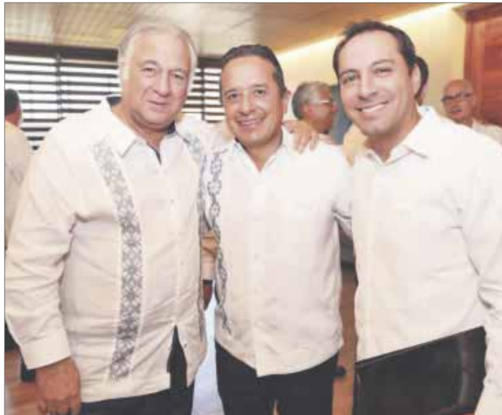
El gobernador Carlos Joaquín se reunió con el secretario de Turismo, Miguel Torruco, en el marco de la presentación de la Agenda Estratégica para el Desarrollo del Sur-Sureste.

El Presidente subrayó que el Tren Maya es el proyecto que detonará la región con una inversión de 120 a 150 mil millones de pesos, equiparable a la inversión pública que se generó para la construcción de Cancún, a finales de los años sesenta, un proyecto de mil 500 kilómetros que aprovechará la afluencia turística para promover visitas a los centros arqueológicos de Tulum, Calakmul, Palenque, Chichén Itzá, entre otros.