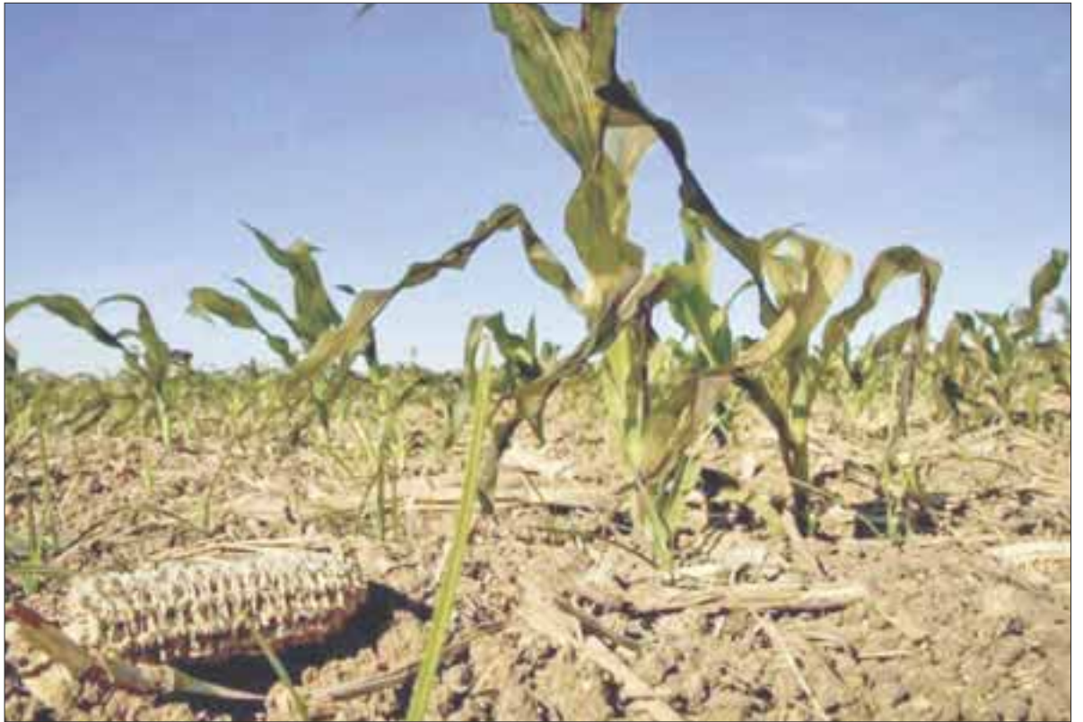
El Servicio Meteorológico Nacional declaró sequía moderada en la mayor parte de Quintana Roo y severa en la zona centro-sur.

Generalmente, la principal fuente de precipitaciones para el estado de Quintana Roo son las celdas de tormenta o chubascos que se forman sobre el Mar Caribe frente a la costa, así como la fuerte convección que origina la llegada de ondas tropicales activas o incluso ciclones. Empero, esta temporada ha sido muy floja, dado que las ondas tropicales están llegando muy debilitadas y no se ha tenido actividad ciclónica.