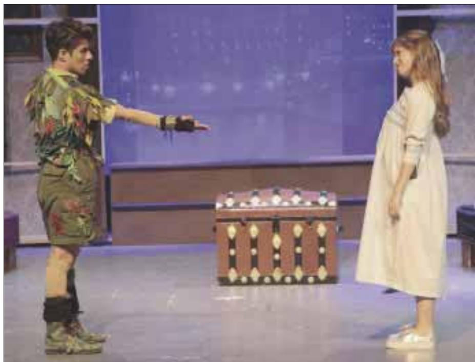
“La tierra de nunca jamás” enamora con las aventuras de Peter Pan , El Capitán Garfio y Campanita , quienes deslumbran a los pequeños en el Nuevo Teatro Silvia Pinal.

“La tierra de nunca jamás” continuará ofreciendo funciones en el Nuevo Teatro Silvia Pinal, todos los domingos a las 11:30 horas y 13:30 horas.