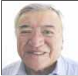
Por Miguel Ángel Rivera

“La Comisión Permanente del Honorable Congreso de la Unión exhorta respetuosamente al Congreso del estado de Baja California, a que lleve a cabo las acciones tendientes a dar certeza jurídica respecto de la reforma aprobada en fecha posterior a la elección, mediante la cual se amplía de dos a cinco años el periodo de gobierno y que la sociedad conozca si se corregirá lo aprobado o no y, en su caso, pueda ejercer las acciones que en Derecho corresponda”.